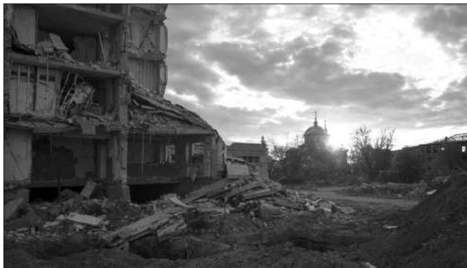
▲ La Fuerza Aérea ucraniana anunció que derribó 18 de los 20 drones rusos lanzados el martes por la noche. También se informó que los bombardeos nocturnos dejaron un saldo de tres muertos.

"En las últimas 24 horas, el enemigo bombardeó 118 localidades en 10 regiones", declaró en un mensaje publicado en redes sociales el ministro ucranio del Interior, Igor Klimenko. "Se trata del mayor número de ciudades y pueblos en su-