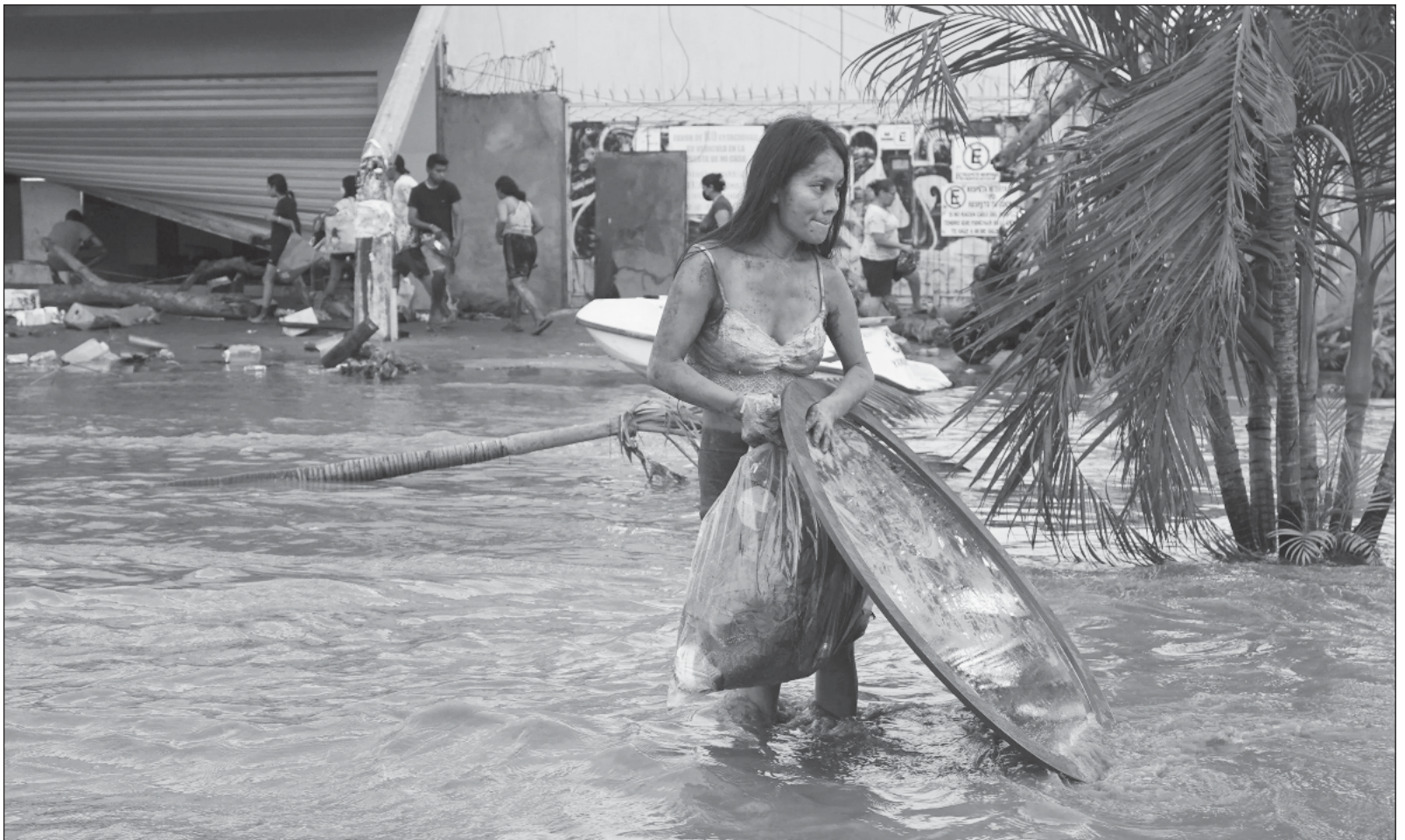
▲ "Se requiere carecer de vergüenza para sacar provecho electoral de la tragedia, del dolor de quienes sufren las secuelas del paso del huracán".