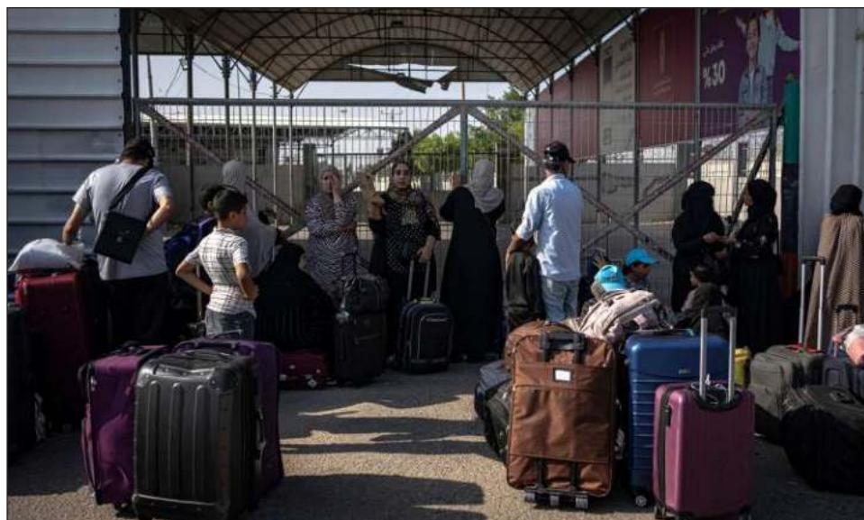
▲ Según las autoridades, la apertura excepcional permitiría la salida de casi 90 heridos y unos 545 extranjeros por el único puesto que no está controlado por Israel.

bitantes de la Franja de Gaza tienen que sobrevivir bajo las bombas sin agua ni electricidad y prácticamente sin alimentos, debido al asedio total impuesto por Israel el 9 de octubre.