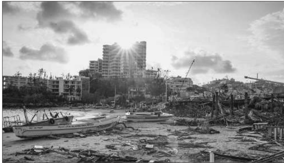
▲ El presidente Andrés Manuel López Obrador destacó que las labores en Acapulco y Coyuca de Benítez serán coordinadas por la Secretaría de Gobernación.

“Miren la actitud de la presidenta de la Suprema Corte, muy bien su respuesta. Claro que tenemos diferencias, pero por encima de las diferencias debe prevalecer siempre el interés general, el interés del pueblo. Celebro lo que decidieron, que los 15 mil millones de pesos de los fideicomisos del Poder Judicial se destinen para