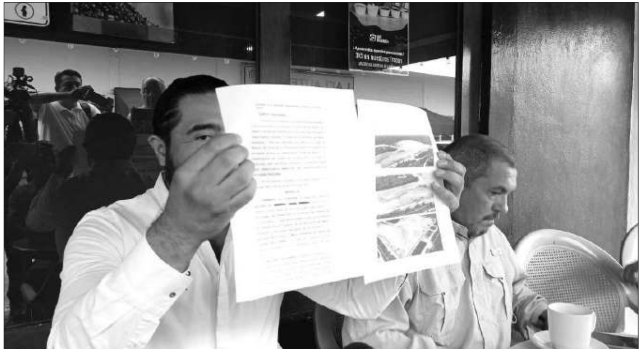
▲ Esta solicitud de amparo, recordó Leobardo Rojas del Partido de la Revolución Democrática, se interpuso a favor de la protección al medio ambiente y el derecho que tienen los benitojuarenses en el tema de un ambiente sano y libre de contaminantes.

Esta solicitud de amparo, recordó, se interpuso