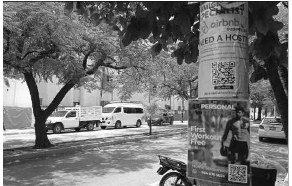
▲ El director del evento declaró que aún no hay propuestas o contrapropuestas, sino que están trabajando en conjunto para tener un marco regulatorio que sea atractivo para todos.

“Invitamos a todos aquellos que están operando en este mercado a que simplemente hagan sus trámites para poder operar. No hay manera que nosotros podamos determinar cuánta gente no cumple con todo. Los permisos varían en cada estado, en Quintana Roo es un permiso en el SATQ, posteriormente un registro turístico, y ya dependiendo del municipio pueden ha-