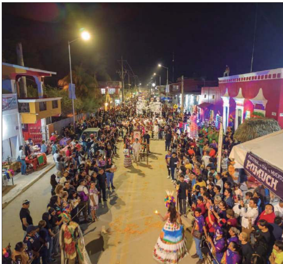
La entrada de pixanes fue acompañada por la banda de música estatal.

Pelota P'oktap'ok sorprendió a los asistentes, quienes con una pelota envuelta en fuego dieron muestra de esta ancestral actividad.