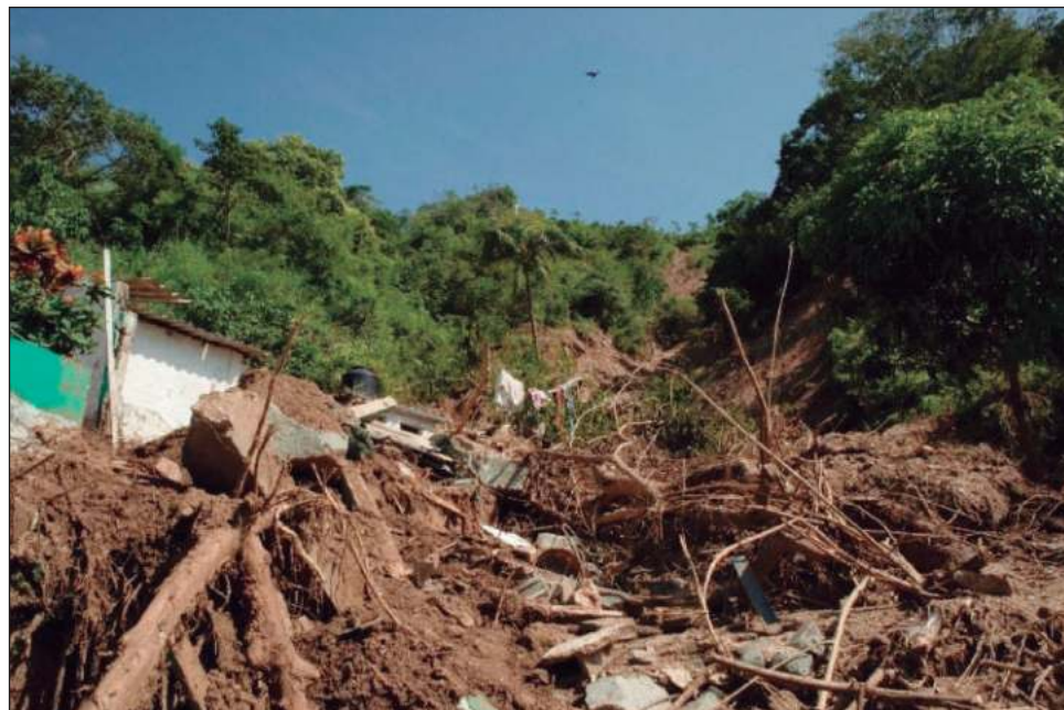
▲ El plan incluye apoyos directos a las familias damnificadas con la entrega de enseres, alimentos y dinero para la reparación de viviendas.

“Contamos con presupuesto para financiar todas estas necesidades, estos progra-