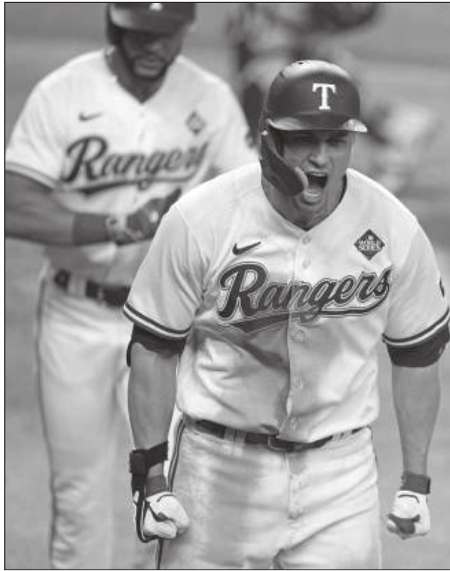
▲ Corey Seager es el primer pelotero en la historia en ganar el premio al Jugador Más Valioso de la Serie Mundial en ambas ligas.

Una noche después de que tomaron ventaja de 10-0 en apenas tres actos, los "Rangers" de Bruce Bochy finiquitaron la serie en un duelo de pitcheo que se sostuvo durante ocho episodios. En el noveno, los Vigilantes anotaron cuatro veces para dejar todo resuelto; en ese ataque, Marcus Semien bateó jonrón de dos