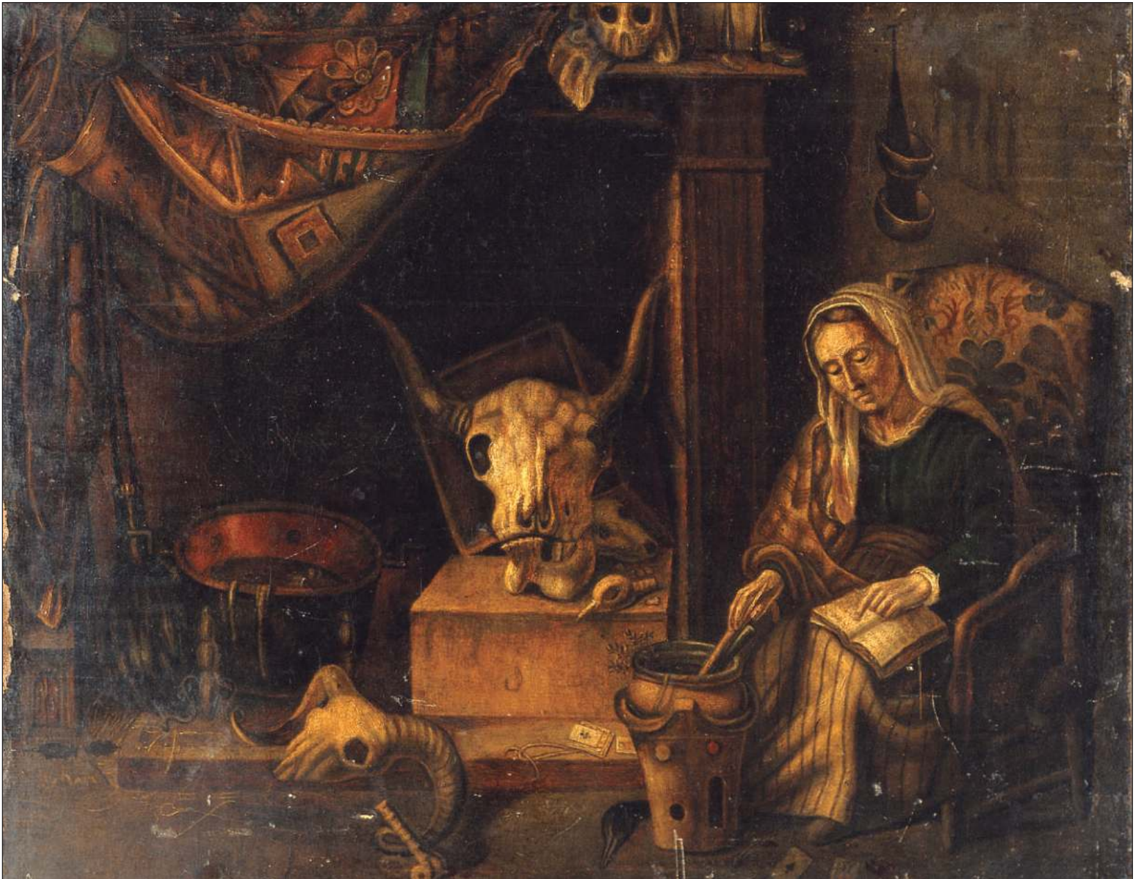
▲ Boonil k'aaba'inta'an Una bruja .