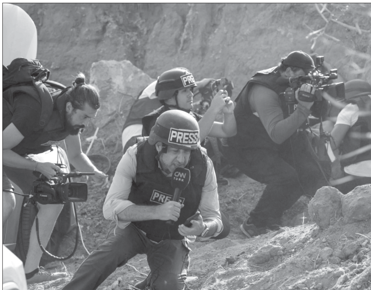
▲ “Today we all have the tools to do good and fight evil and know the satisfaction of triumphing over those who would destroy us morally or physically. Let's be strategic in our employment of social media and use it wisely”.

TODAY, GAY PRIDE parades are commonplace and governments that discriminate against the