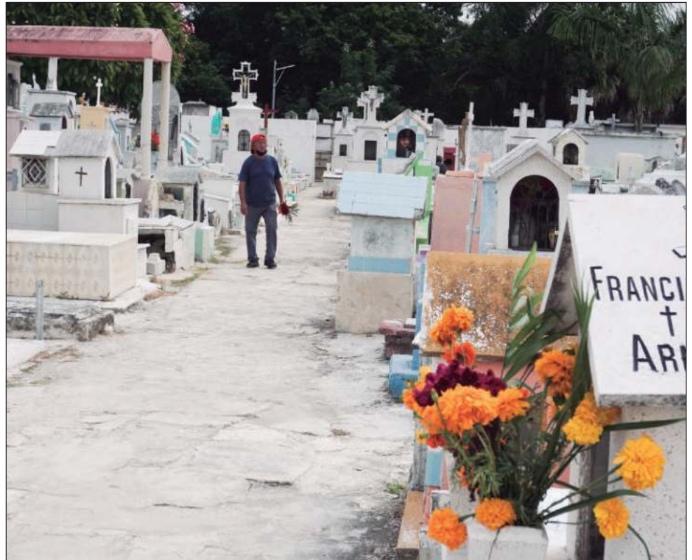
Los cinco cementerios de la ciudad a cargo de la alcaldía lucieron adecuadamente limpios, con evidencia de mantenimiento, pero el tema de las tumbas es de los familiares de los difuntos.

Contrario a esto, este miércoles fue el tradicional día en que las familias se levantaron temprano para preparar los pibipollos, platillo que básicamente es un pastel de masa revuelta con Xpelón, crocante horneado, y relleno de pollo, gallina o puerco, o todo junto, col preparada con la grasa de las proteínas animales, y en-