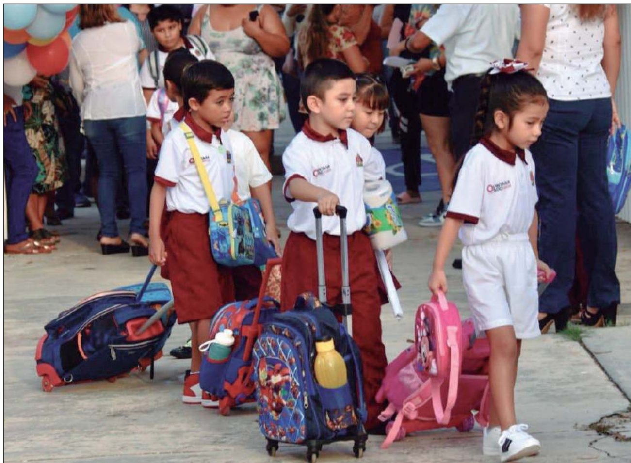
Para el ciclo escolar 2022-2023 se tiene registrado un total de 474 mil 244 estudiantes de todos los niveles.

El gobierno de Q. Roo hace énfasis en el fortalecimiento de nuestra identidad cultural