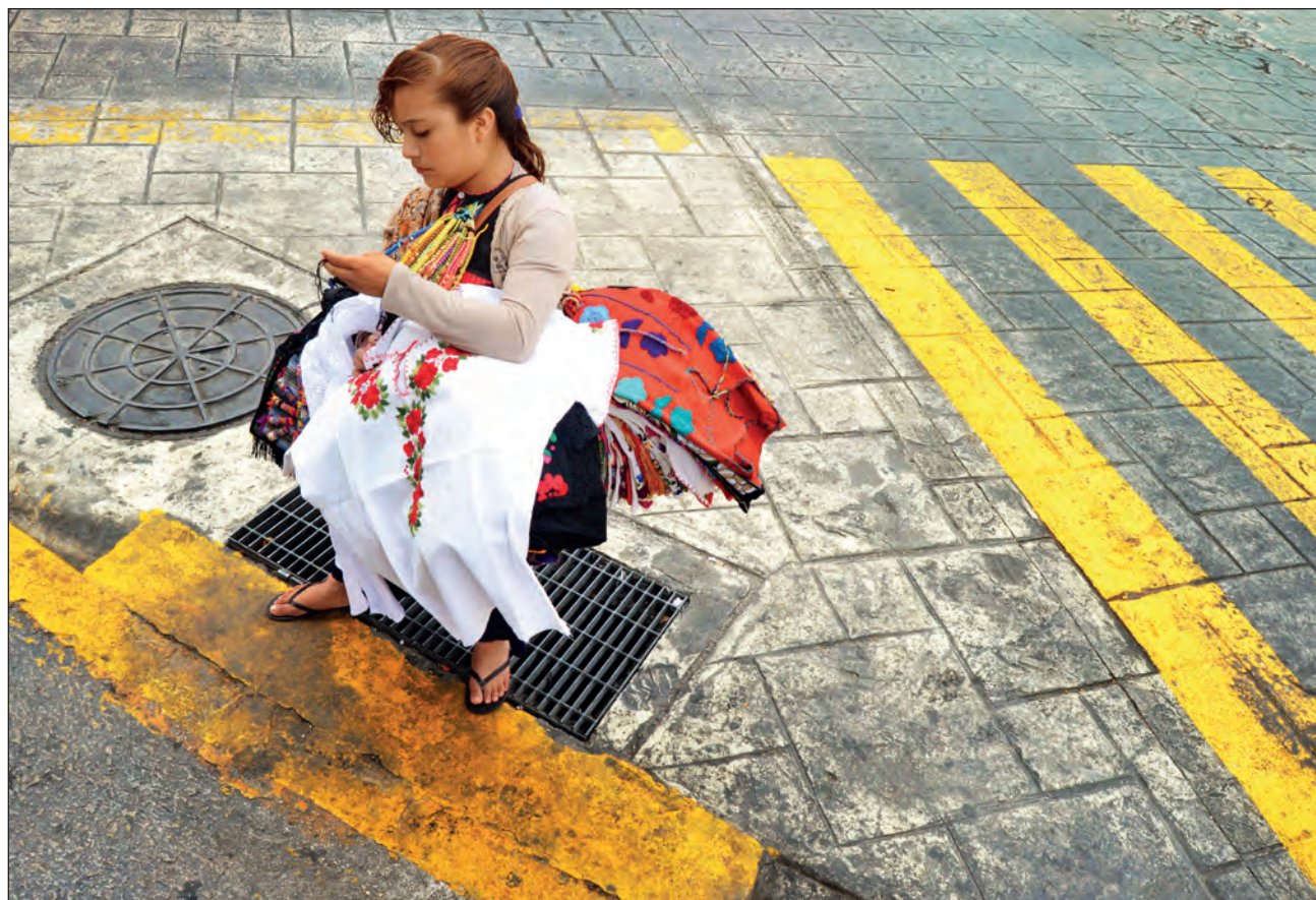
▲ La falta de conectividad en comunidades indígenas agudiza problemas como el abandono escolar, que los niños tengan que trabajar desde temprana edad o las niñas se casen muy jóvenes.

El acceso limitado a los servicios de salud y a las plataformas digitales y tecnología para continuar con sus estudios podría reflejarse en problemas de rezago educativo, embarazos y matrimonios a temprana edad o trabajo infantil, entre otros.