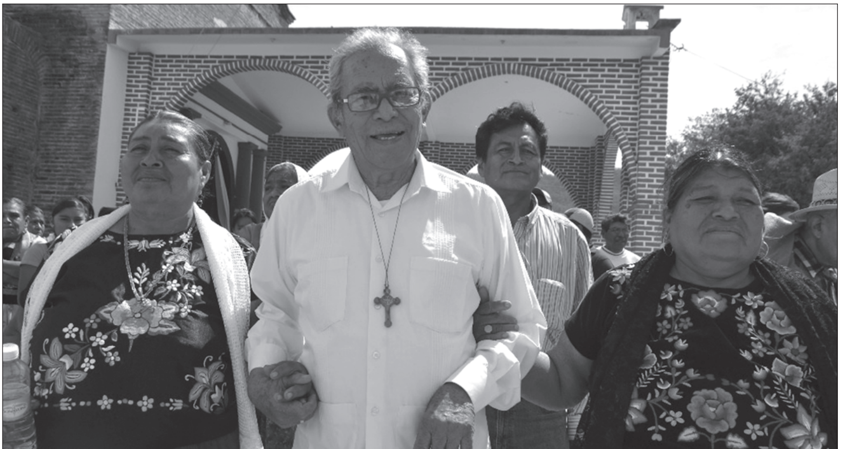
▲ La lucha de Lona fue la prédica con el ejemplo: creó dos cooperativas de producción en las que todos los empleados reciben utilidades en partes iguales.

(Con información de Jorge A. Pérez, corresponsal, y Fernando Camacho, reportero)