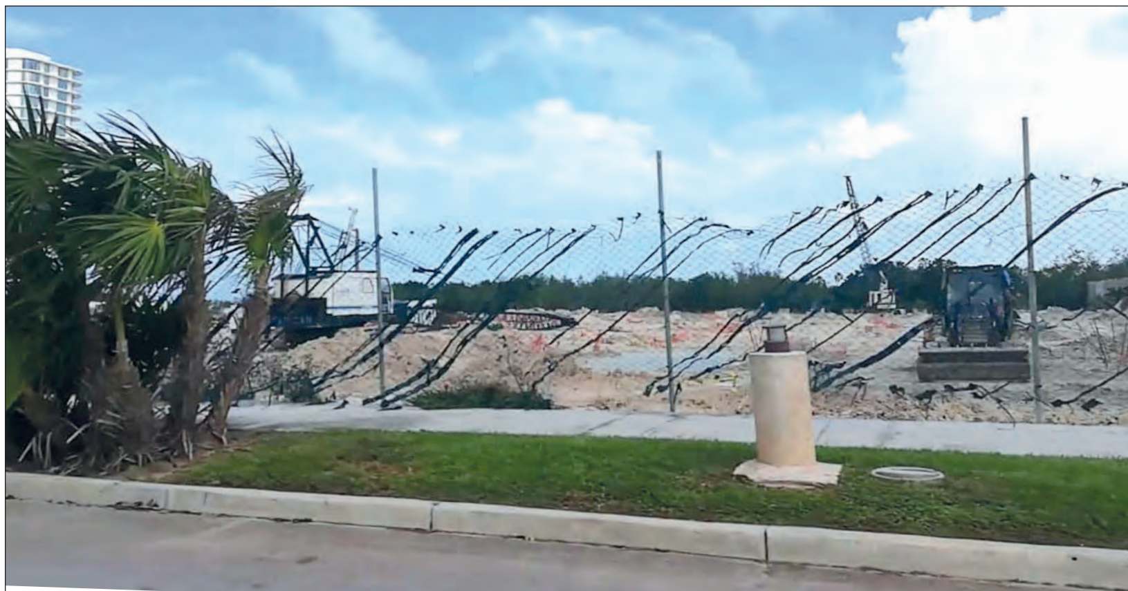
▲ Desde la creación de Cancún, residenciales, marinas y hoteles redujeron la posibilidad de ingresar a las playas.

A Tortugas le siguen: Caracol, Gaviota Azul, Chac Mool, Marlin, Ballenas, Delfines y Coral Negro, casi todos con las mismas problemáticas, pocos espacios de estacionamiento (si es que los tienen), sin baños públicos o cobros por el ingreso y prácticamente todas muy alejadas de la ciudad, por lo que es imposible como local no gastar una buena parte de la quincena si se quiere pasar un día en la playa.