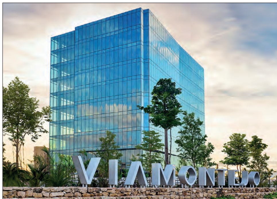
▲ El complejo de edificios del Consulado de Estados Unidos representará la fuerte y duradera amistad entre ese país y México, expresó la cónsul Courtney Beale.

El complejo de edificios estará ubicado en el desarrollo Vía Montejo y proporcionará una plataforma