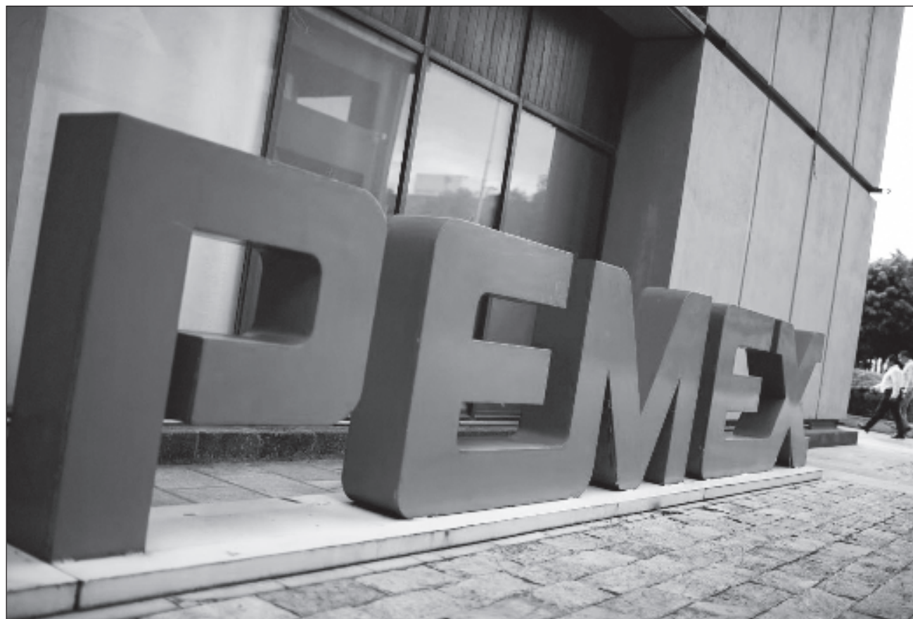
▲ No se descartó que algunas empresas recurran a la vía legal para reclamar a Pemex el pago de intereses moratorios.

Recordó que muchas de las medianas y pequeñas empresas al no poder trabajar directamente con Pemex algunos contratos, lo hacen con las grandes compañías como Baker, Schlumberger, Halliburton, ENI, entre otras, a las que les brindan suministros y servicios. "Sin embargo, al frenarse el pago de Pemex a estos grandes proveedores como se ha