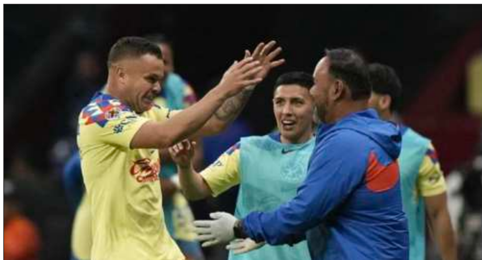
▲ El América mantuvo su gran paso y alcanzó la cima de la Liga Mx.

El complemento inició con el mismo ritmo y Jardine mandó al campo a Rodríguez en relevo del yucateco Martín. Su decisión fue recompensada porque el delantero uruguayo