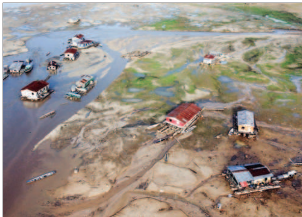
▲ La Cemaden prevé que algunos ríos tendrán este año un flujo inferior al del promedio histórico, entre los cuales el propio Amazonas y otros estratégicos para la región.

Pese a que la temporada de sequía en la región recién comienza, la caída del nivel de los ríos amazónicos a niveles mínimos ya perjudica la navegación, la pesca, la agricultura, el equilibrio ambiental y el abastecimiento de agua,