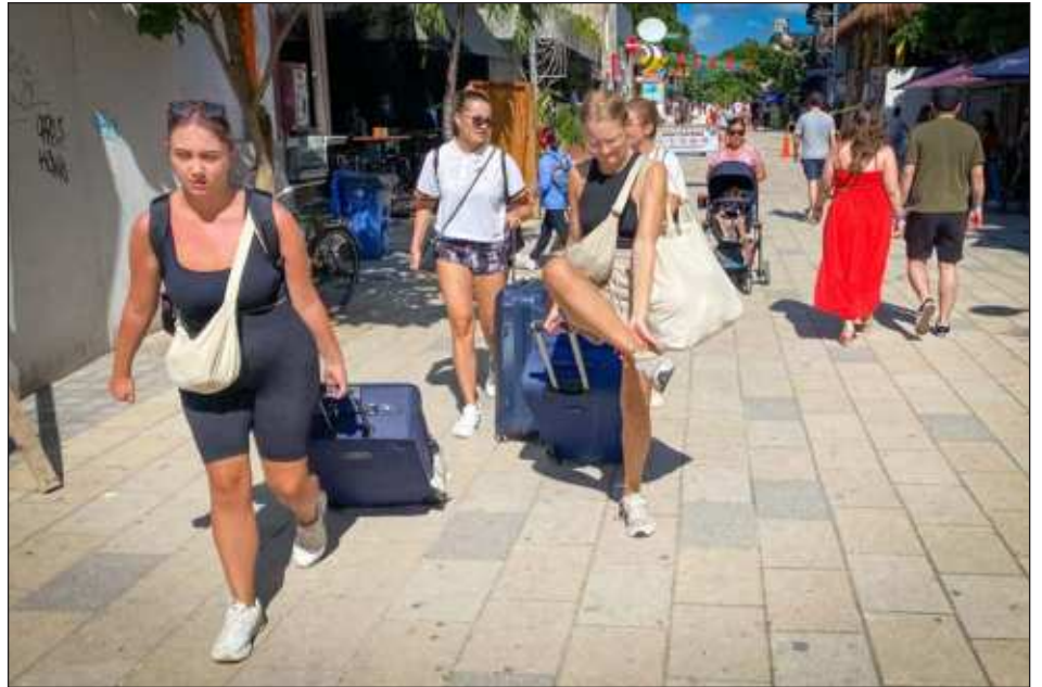
▲ El pago de 224 pesos, mismo que los hoteleros han pedido que se elimine, se ha solicitado a los turistas extranjeros desde 2020.

Es un tema que los empresarios han externado, que ya se puso sobre la mesa de Sefiplan y del SATQ para