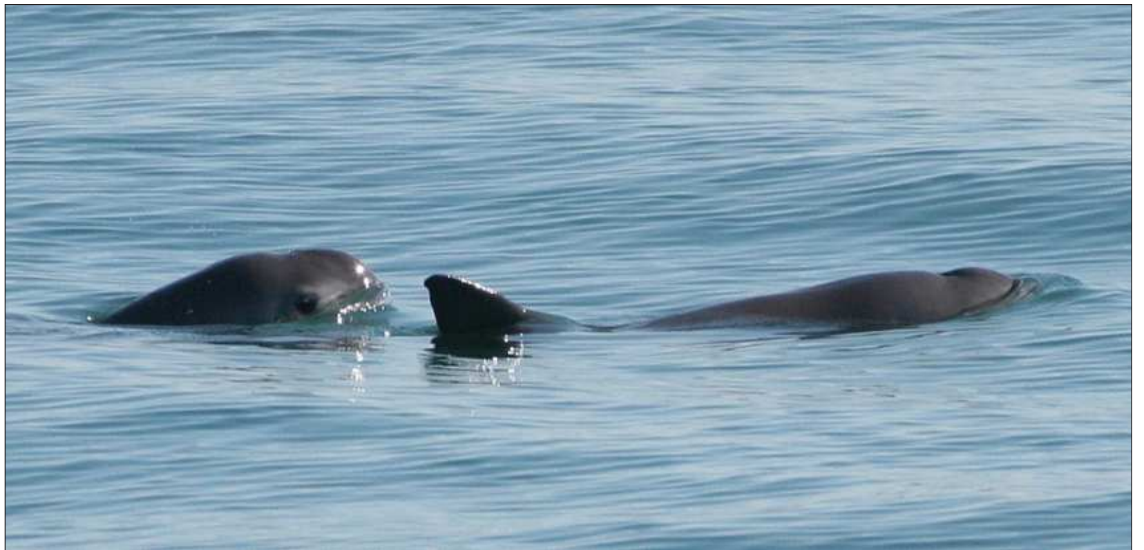
▲ Tukulta'an u yantal múul meyaj yéetel Unesco ti'al u péektsilta'al ba'alo'ob yaan u yil yéetel ba'alche' sajbe'entsil yanik u ch'éejel.

2) Seguridad yéetel u chíimpolita'al a'almajt'aan; 3) U próoduktibidadil chuk kay meyaj. Ba'ale', beyxan ku ch'a'anukta'al bix yaanik le kaajo'obo', yéetel k'a'abéet u mu'uk'ankúunsa'al meyaj ichil noj lu'umo'ob, yéetel u táakbesa'al kaajo'ob ti'al u béeytal u je'ets'el ba'alob te'e baantao'", jts'a'ab k'ajóoltbil.