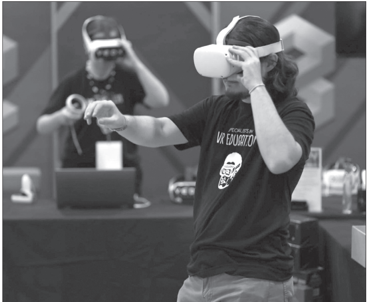
▲ "La IA encarna de manera muy precisa el llamado 'poder tecnocientífico', expresado en sistemas de control y de producción de regímenes específicos de verdad, que se imponen con fines de dominación". Foto Facebook Yucatán i6

LOS ARGUMENTOS QUE acompañan esas iniciativas enfatizan, quizá con demasiado optimismo, en los beneficios y ventajas de las llamadas tecnociencias, relegando a un segundo plano planteamientos y reflexiones de carácter ético y político que también deberían estar presentes, sobre todo en las generaciones jóvenes. Desde una mirada más amplia, es necesario que las nuevas tecnociencias sean comprendidas no solo por