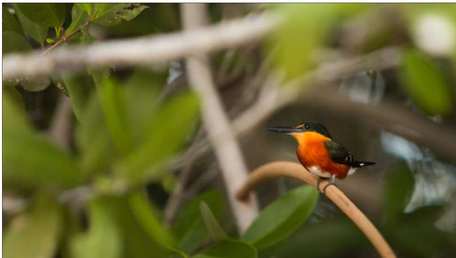
▲ "Prefiero recurrir a la tradicional asociación inmediata propia del psicoanálisis y comunicar que durante la gozosa audición percibí, entre otras cosas, el ay, ay, ay, ay, ay que va con el Cucurrucucú , unos cláxones y otros ruidos automotrices, micromambos deconstruidos y otras fantasmagorías".