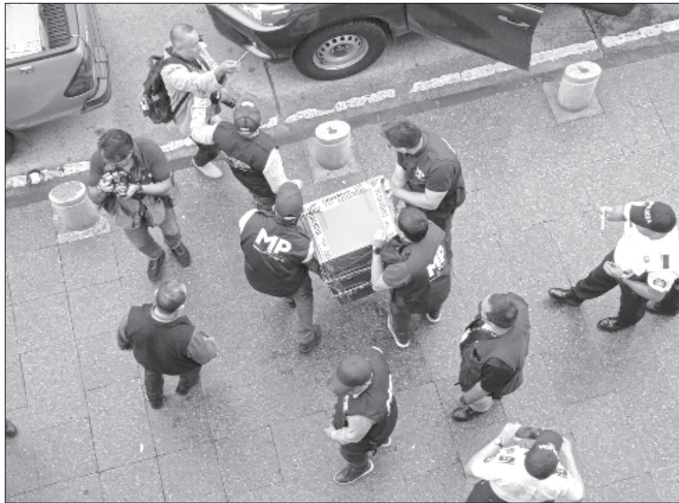
▲ En una escena caótica, policías y representantes de la fiscalía forcejearon con magistrados del TSE mientras confiscaban cajas que contenían actas de votación.

Tras las elecciones, los observadores locales e in-