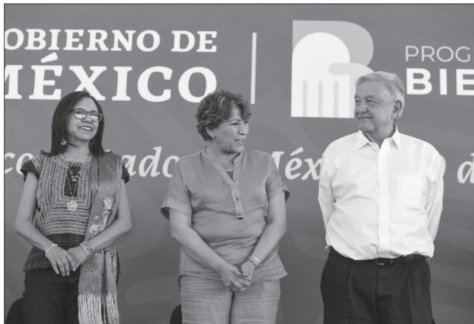
▲ Acompañado de la mandataria Delfina Gómez y de la alcaldesa Sandra Luz Falcón, el jefe del Ejecutivo aseveró que los gobiernos de las minorías y los ricos se acabaron, pues “ahora es auténtica democracia, del pueblo, para el pueblo y con el pueblo”.

“Quiero decirles que vamos a seguir trabajando