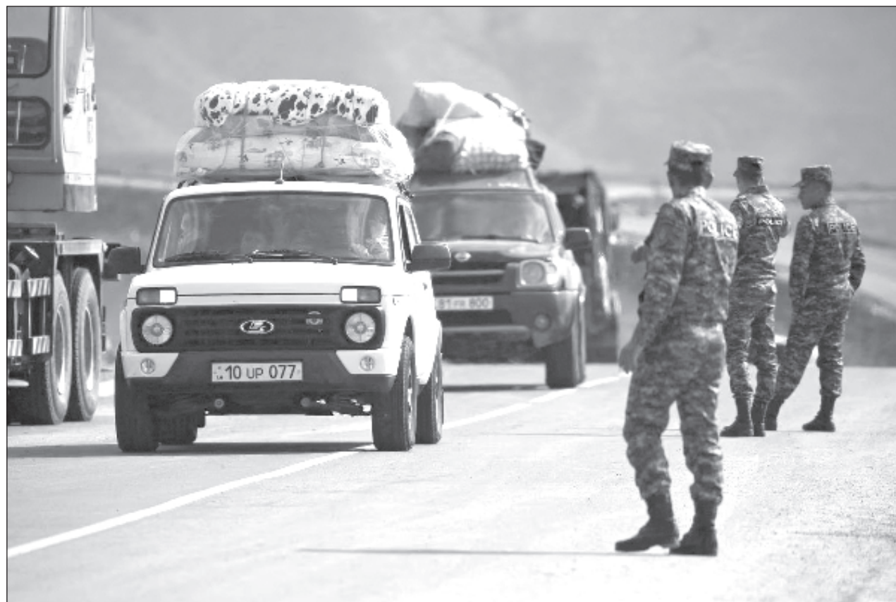
▲ El organismo internacional llegó al territorio principalmente para evaluar las necesidades humanitarias, después de que casi la totalidad de la población armenia del enclave huyera tras la victoriosa ofensiva relámpago de Azerbaiyán.

El presidente de Azerbaiyán y el primer ministro armenio se reunirán a su vez el jueves en la ciudad española de Granada.