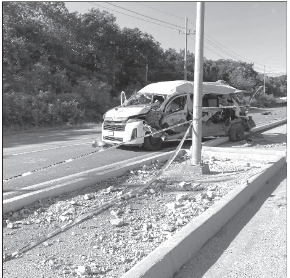
▲ En un comunicado realizado por el Sindicato Lázaro Cárdenas del Río, se señaló que es el accidente más trágico en 50 años de su historia como organización.

En un comunicado el Sindicato Lázaro Cárdenas señaló que es el accidente más trágico en 50 años de su historia.