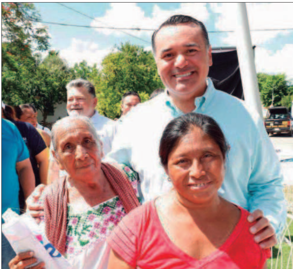
▲ La Dirección de Salud y Bienestar Social ofrece servicios integrales de salud para la mujer, como consulta y ultrasonido ginecológico, odontología, psicología y nutrición.

La lista de módulos médicos, sus direcciones, servicios y días de labores, pueden ser consultados en la página: www.merida.gob.mx/salud