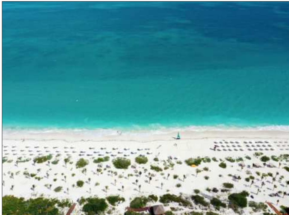
▲ El destino es líder en ocupación por su ubicación, su infraestructura hotelera, y que cuenta con una variedad de espectáculos y actividades.

Grupo Palladium, RIU, Grupo H10 y Catalonia son las empresas que están por iniciar nuevas construcciones o crecimientos en este