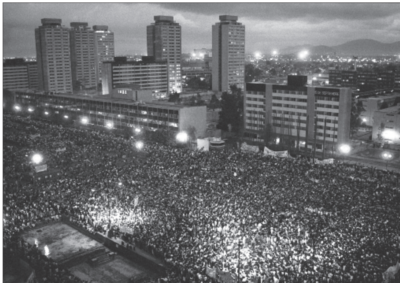
▲ En la Plaza de las Tres Culturas miles de personas asistían a un mitin convocado por el Consejo Nacional de Huelga, pero minutos después de las 6 de la tarde comenzó a orquestarse el plan ideado por el gobierno para acabar con el movimiento.

Los disparos fueron ensordecedores. Los soldados entraron a la plaza tratando de ubicar de dónde procedían las ráfagas y la posición de los francotiradores, pero algunos abrieron fuego con-