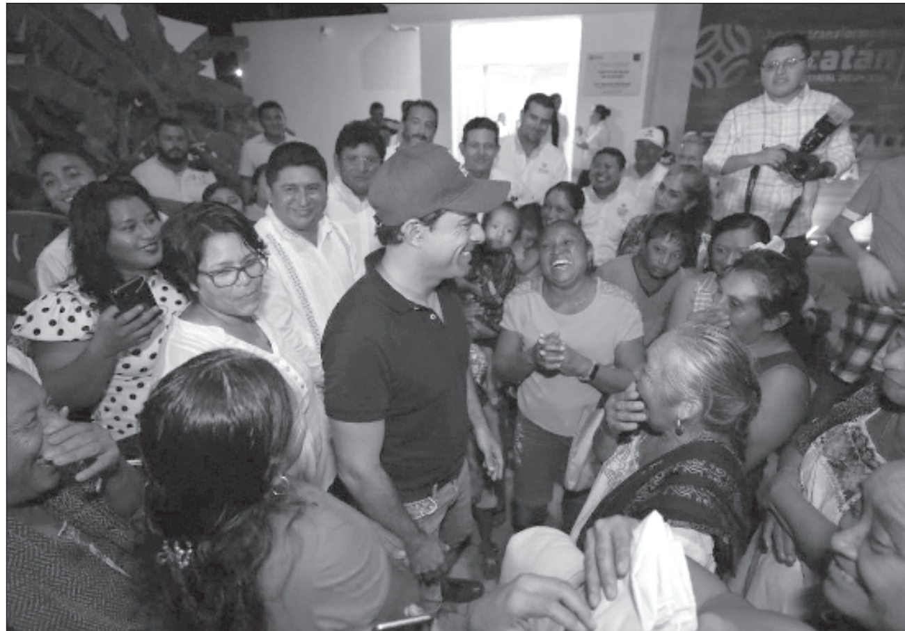
▲ El pasado mes de junio, arrancó la obra del nuevo Hospital General Dr. Agustín O'Horán en el sur de Mérida, considerado uno de los nosocomios más grandes que se construirá en todo el país en este sexenio

El Hospital General de la zona de Ticul contará con 70 camas, de las cuales 30 serán para hospitalización por enfermedades generales y 40 para traumatología, ampliando la capacidad hospitalaria; además, podrá ofrecer servicios en 15 especialidades, como terapia respiratoria, inhaloterapia, ginecología y obstetricia, telemedicina, medicina interna, física y rehabilitación, tococirugía, nutrición, imagenología y anatomía patológica, entre otras.