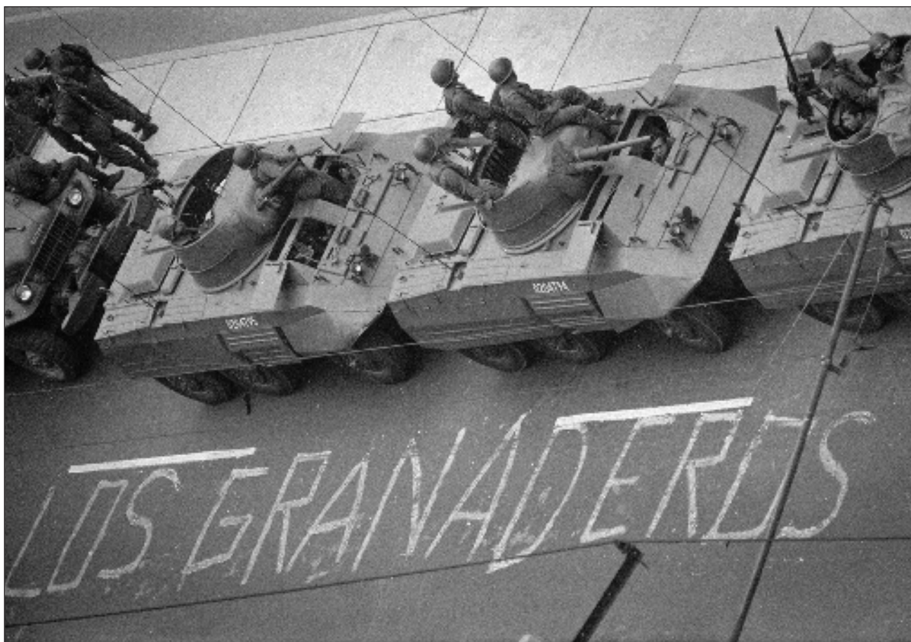
▲ Las crónicas periodísticas refieren que con la balacera vino la confusión. Nadie observó de dónde salieron los primeros disparos (...) Las ráfagas de las ametralladoras y fusiles de alto poder zumbaban en todas las direcciones.

persuadirlos para que el acto político se realizara en Ciudad Universitaria y no en Tlatelolco, al que consideraba un espacio público propicio para la represión. “En la medida en que se acentuaba la represión –contó años después Barros Sierra al periodista Gastón García Cantú–, ellos se arriesgaban. El pueblo acudía en número cada vez mayor; el peligro que esto significaba en cuanto a la posibilidad de provocaciones era enorme. La historia infortunadamente así lo registra. Ellos cometieron el gravísimo error de efectuar el mitin del 2 de octubre en la Plaza de las Tres Culturas”.