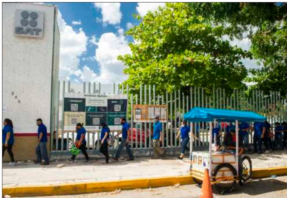
▲ Los ingresos tributarios recaudados en el transcurso del actual gobierno representan un monto que equivale a poco más de la mitad —53%—, del tamaño de la economía en 2023, la cual, según la Secretaría de Hacienda, estará en torno de 31.4 billones de pesos.

Entre 2019, primer año del actual gobierno, y agosto pasado, los ingresos tributarios —los derivados del cobro de impuestos a empresas y personas por sus actividades económicas, así como a combustibles— sumaron 16.9 billones de pesos. Se trata de una cantidad que para efectos comparativos superó en 16 por ciento en términos reales, ya descontado el efecto de la inflación, a la recaudada