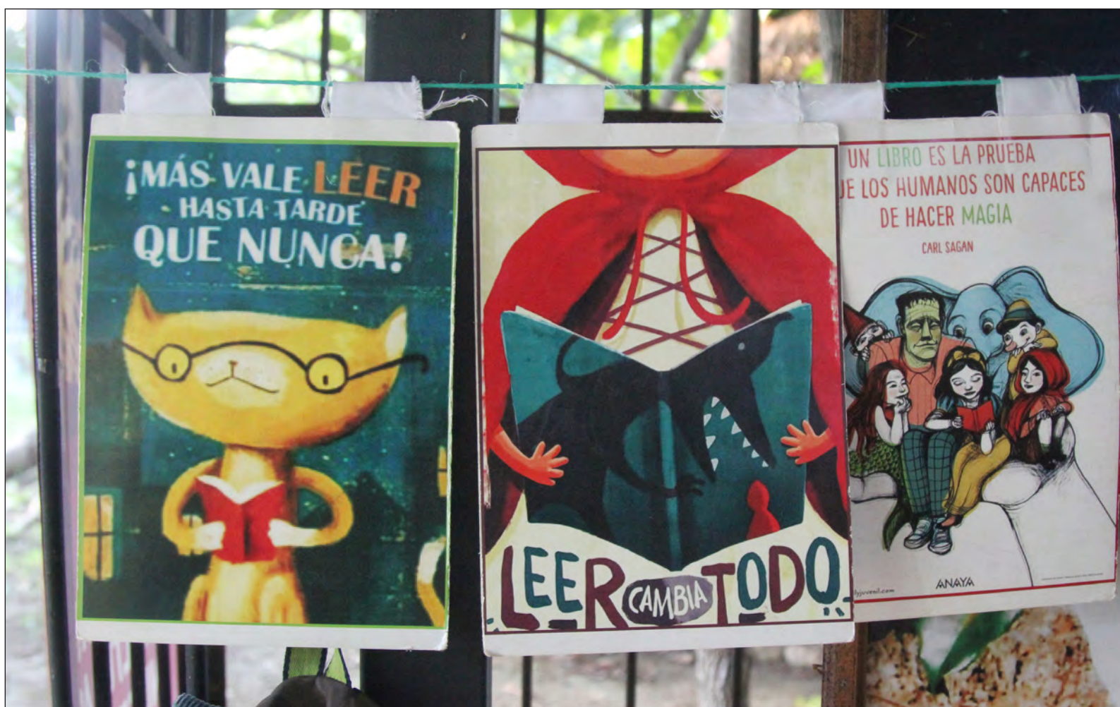
▲ Los textos literarios pueden provocar estados de ánimo y el lector podría transferir tales vivencias a la esfera de su conciencia. Entonces, el individuo ampliaría sus posibilidades afectivas y desarrollaría una especie de cultura sentimental que le permitirá reconocer sentimientos indiferenciados.