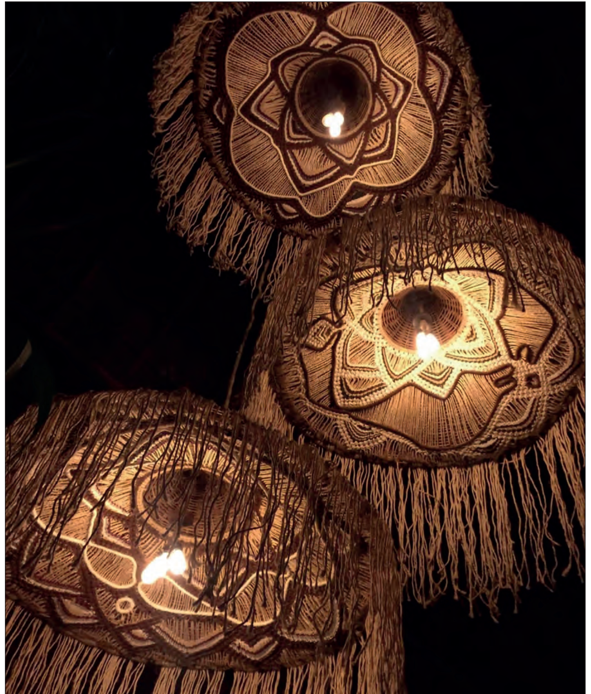
▲ Entre trama y urdimbre, nudo a nudo, puntada a puntada, tejido a tejido, telar a telar, la humanidad también avanza de acuerdo a las tendencias de cada época.

En la zona fronteriza norte de México se elaboraban miles de maceteros artísticos de henequén. Los mayoristas de USA inundaron su país con esos hermosos tejidos; literal cada casa tenía mínimo un macetero tejido adornando su por-