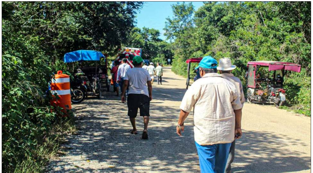
▲ Un grupo de pobladores de Cacalchén bloquearon un tramo de los trabajos del Tren Maya en dicha comunidad este lunes.

"No puede ser posible que nos estén dando 15 pesos por metro cuadrado (...) que nos las paguen en 80 (pesos)"