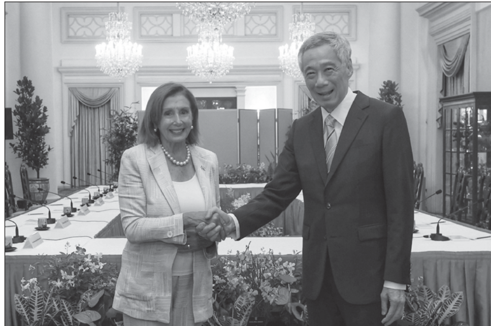
▲ Pelosi inició este lunes su gira por Asia en Singapur, donde estará también el martes, para viajar después a Malasia, Corea del Sur y Japón, según ha informado la Casa Blanca.

Entre ellos, "las relaciones a través del estrecho (de Formosa)", es decir, entre la República Popular China y Taiwán, la isla autogobernada democrática que Pekín considera parte de su territorio y que no descarta