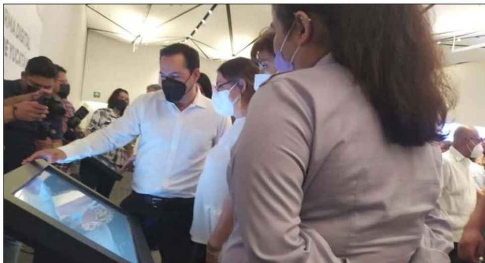
▲ El gobernador Mauricio Vila Dosal acudió a la presentación de la Red de Agentes Culturales de Yucatán, junto con otras personalidades del ámbito académico y empresarial.

En la Red, los artistas, agentes culturales y creativos de los 106 municipios de Yucatán tendrán la oportunidad de acceder a información actualizada y vigente sobre convocatorias locales, nacionales e internacionales, así como