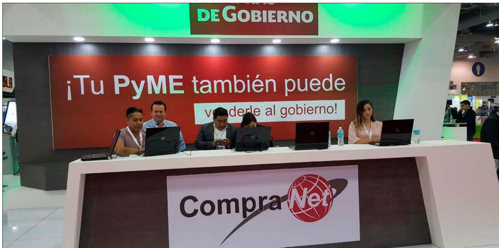
▲ Personal de la Oficialía Mayor de Hacienda monitorea de manera permanente que la plataforma continúe operando en óptimas condiciones.