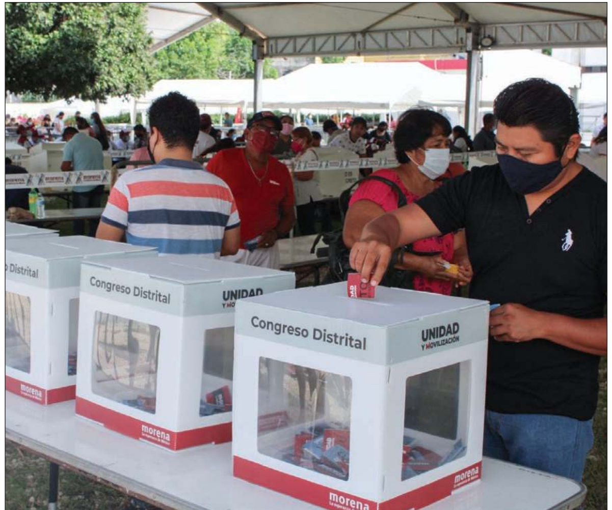
▲ "Los distritos electorales son el primer escalón de la nueva conformación directiva morenista, que pesará, con todos sus compromisos e intereses, a la hora de postular a aspirantes a cargos de elección".

LO SUCEDIDO NO es un accidente ni debe ser adjudicado a la siempre oportuna retórica de los infiltrados o los provocadores, que seguramente hubo pero no de manera determinante ni impropia, pues estas "convenciones" distritales fueron predeterminadas por la voluntaria apertura de puertas a quien quisiera, con sólo expresar a último minuto el deseo de asumirse como morenista (un regalo a caciques y manipuladores, para ejercer acarreo, compra de voto, pase de lista, tacos de boletas y demás tecnología aplicable); sin propósito deliberativo ni analítico, mero ejercicio descarado del voto instantáneo (eso sí: no todo clientelar); sin padrón oficial ni medidas básicas de seguridad electoral y con la previamente muy denunciada recurrencia a los vicios clásicos del priismo reinjertado, el perredismo subsistente (Barbosa, en Puebla, un ejemplo sin perder) y el Verde osmótico (en San Luis Potosí, se metamorfoseó y engulló a Morena).