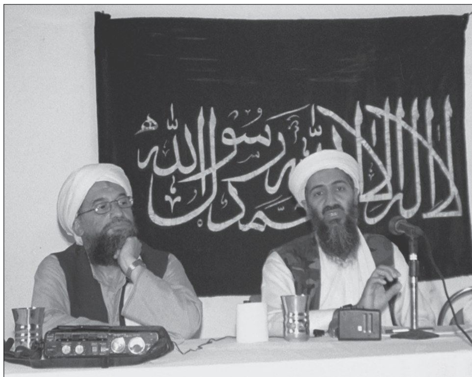
▲ Funcionarios de inteligencia estadounidenses rastrearon a al-Zawahri hasta una casa.

“Este líder terrorista ya no existe”, dijo Biden en un discurso vespertino desde la Casa Blanca.