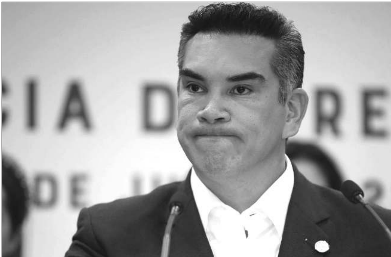
▲ La decisión de revocar la suspensión de plano con que contaba el líder nacional del PRI se debió a que el Juez Primero de Distrito en Materia Penal en Nuevo León carecía de competencia legal para emitir dicho fallo.

Señaló que los seis consejeros decidieron abandonar dicha sesión y retirarse del organismo, y un par de horas más tarde encontraron pegadas las notificaciones de medidas de protección precautorias a favor de Góngora Ramírez.