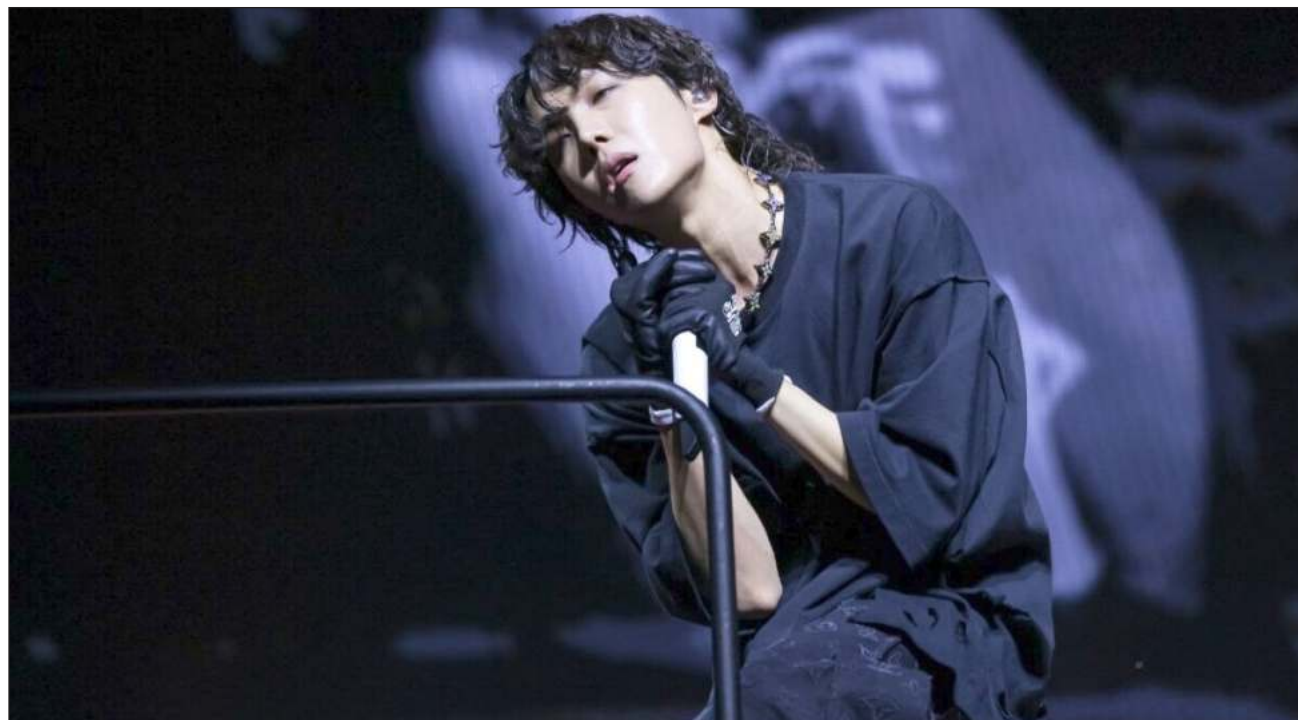
▲ j-hope fue el primer artista surcoreano en encabezar un gran festival de música en Estados Unidos.

Esta edición de Lollapalooza también presenció el debut de Tomorrow X Together, otro grupo surcoreano que está bajo el mismo sello que BTS.