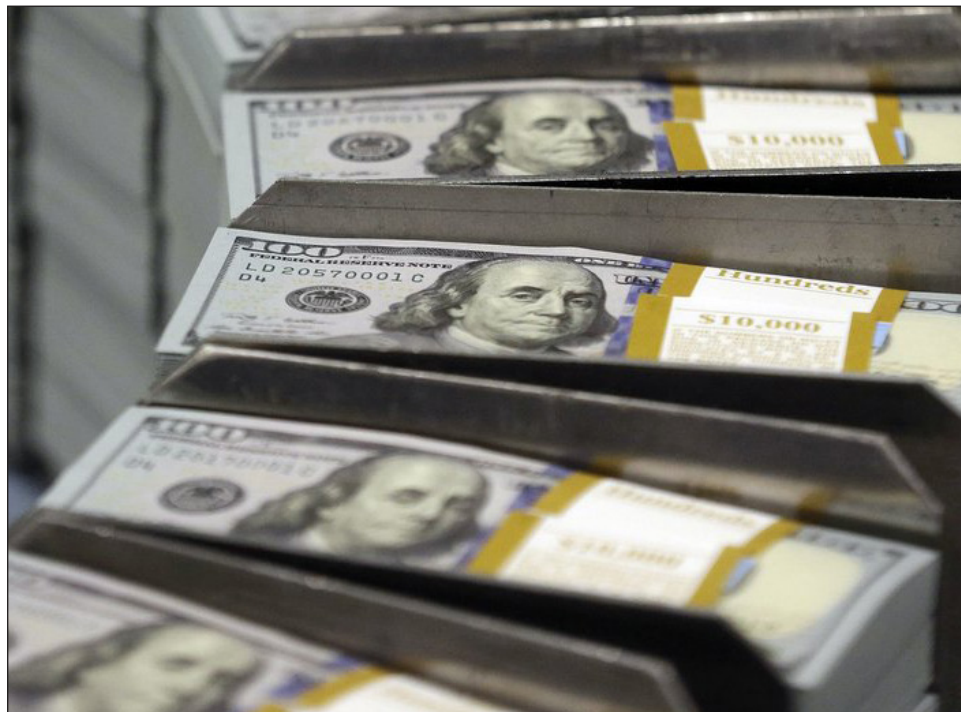
▲ En junio pasado, los envíos de dinero de mexicanos que viven en otras naciones nuevamente superaron la barrera de los 5 mil millones de dólares.

Por su parte, las remesas efectuadas en efectivo y especie y las money orders representaron el 0.9 y 0.3 por ciento del monto total, respectivamente, al situarse en 240 y 85 millones de dólares, en el mismo orden.