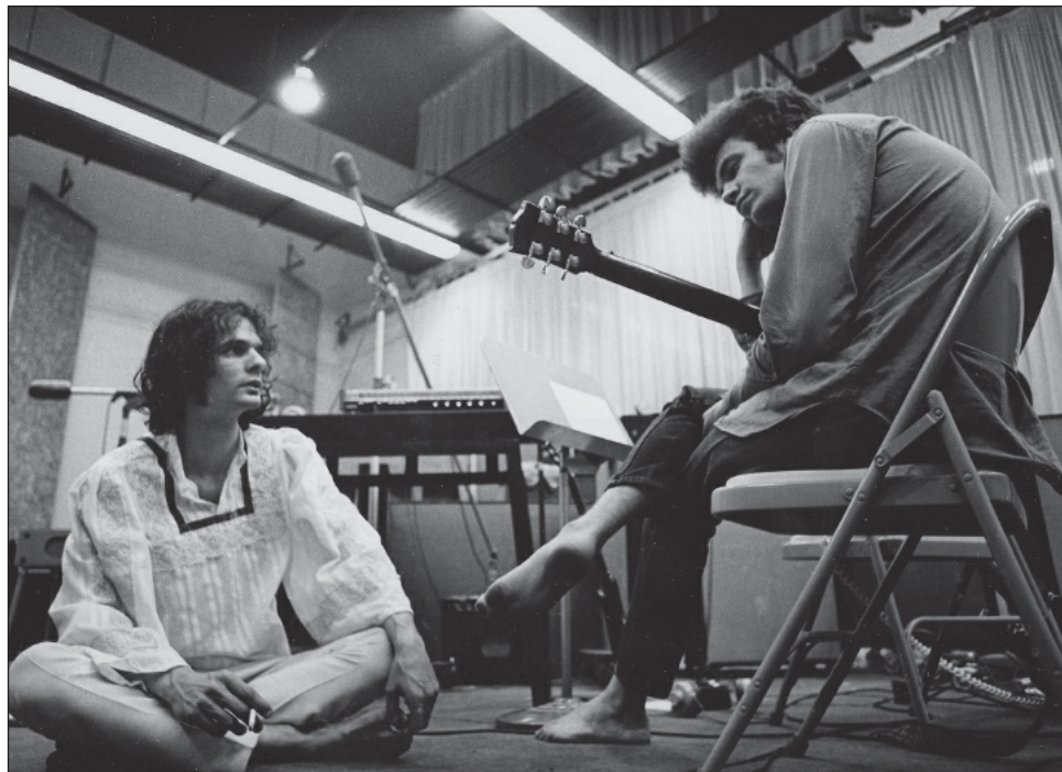
▲ Al Kooper, precursor del blues de los años 60, es el artífice de este tomo de la enciclopedia de los melómanos del rock, la cual solamente incluye nueve canciones.

Capturó el sonido de dos de los mejores guitarristas en la historia: Michael Bloomfield y Stephen Stills, y la charla entre sus instrumentos, las Les Paul. Aunque hay que decirlo, nunca grabaron juntos, ya que Bloomfield, talentoso outsider del blues rock de Chicago, estuvo el primer día de grabación, pero al se-