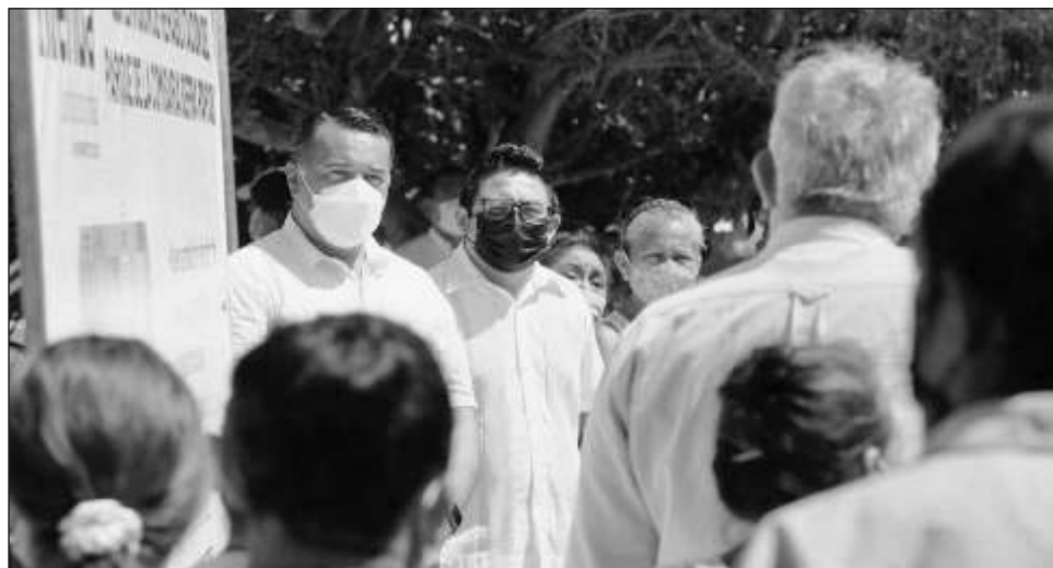
▲ En la rehabilitación del parque de Sierra Papacal se invierte un millón 686 mil 785 pesos, provenientes de recursos de infraestructura, indicó el alcalde meridano.

“Los recursos que las y los meridianos nos confían