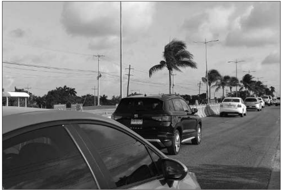
▲ Se espera que conforme avance la semana, los trabajos de la rehabilitación vayan incrementando, por lo que la carga vehicular también aumentará.

El recorte de carriles que va desde la universidad hasta plaza Luxury se hizo desde la medianoche, dejando dos carriles abiertos hacia la carretera, lo que alentó la circulación de quienes se dirigen hacia la Riviera Maya, sin embargo, el carril habilitado para quienes se dirigen al centro todavía no es utilizado y los vehículos siguieron circulando por los carriles habituales.