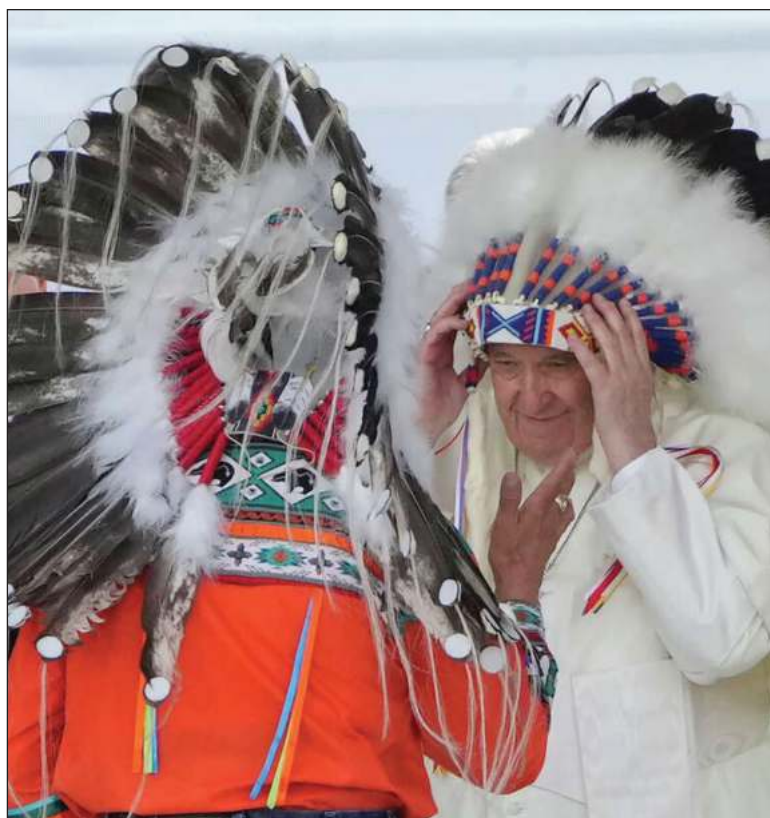
▲ "Some indigenous leaders are asking if this apology was from the Church as an institution or if it was simply the Pope speaking for himself".

THE TREATY OF Tordesillas that divided Latin America between Spain and Portugal was signed in