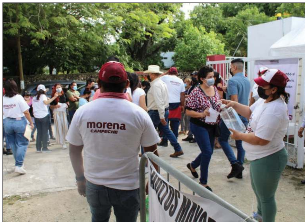
▲ El esfuerzo para organizar 300 asambleas en otros tantos distritos electorales habla de una progresiva consolidación institucional del partido en el gobierno.