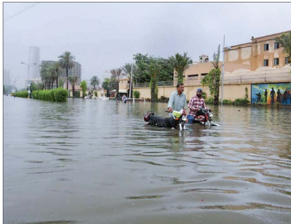
▲ Las inundaciones en Pakistán han destruido más de 7 mil viviendas.

Según el Departamento Meteorológico de Pakistán,