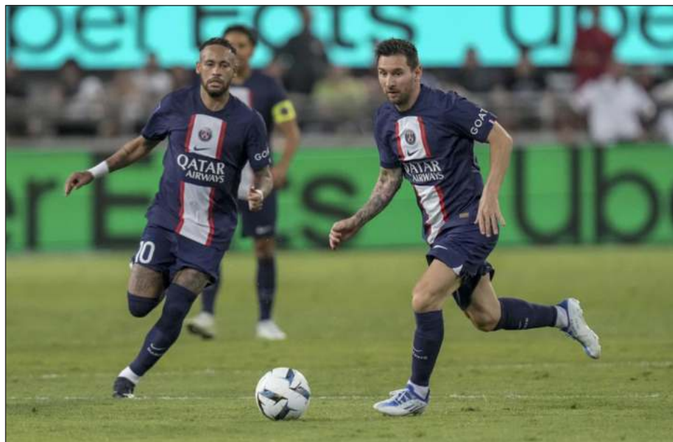
▲ Messi controla el balón frente a Neymar durante la Supercopa de Francia, en Tel Aviv.

Transcurrida una década, su floja producción goleadora en el PSG suscita dudas sobre si puede aco-