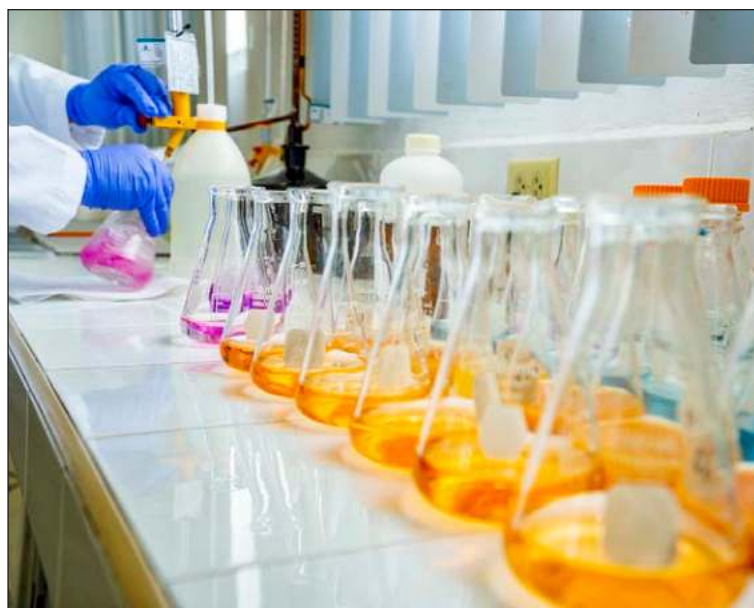
▲ Aguakan lleva a cabo de manera mensual 9 mil análisis y pruebas de agua potable tomadas en distintas zonas de la ciudad.

Para garantizar que el agua se encuentre dentro de los estándares óptimos de calidad para uso de los clientes y en cumplimiento de la NOM 127 y 179 que establece la Secretaría de Salud, Aguakan lleva a cabo de manera men-