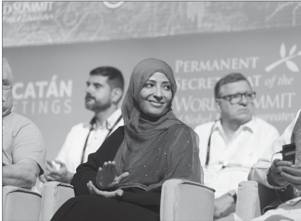
▲ Para esta séptima edición, el Hay Festival contará con personalidades como Wole Soyinka, Horacio Castellanos y la Premio Nobel Tawakkol Karman (en la imagen).