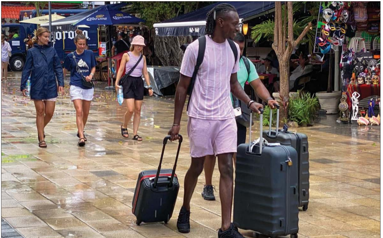
▲ "Quintana Roo es mucho más que las diferencias entre partidos o intereses personales. Tenemos fortalezas, pero están dispersas".