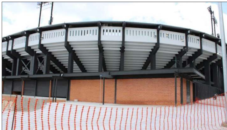
▲ Otras obras, como el estadio de los Piratas de Campeche, se han retrasado.

“Imagínense, hay contratos para la construcción de unas escaleras eléctricas y un elevador, estamos esperando documentación de la Dirección de Desarrollo Urbano para poder hacerles pruebas, pues así como están las cosas en dicha obra, no hemos podido hacer estas pruebas necesarias para saber qué podemos esperar de la calidad, además que estos contratos es la segunda revisión que les