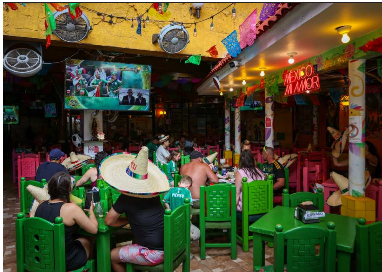
▲ Si bien el inicio fue lento, el consumo se ha acelerado notablemente, impulsado por el aumento en la ocupación hotelera, el gasto en restaurantes, hoteles, comercio, en particular en productos relacionados con los festejos.

El presidente de la Concanaco destacó y agradeció a los mexicanos por su comportamiento festivo y solidario, que ha transformado la percepción de los visitantes extranjeros sobre México.