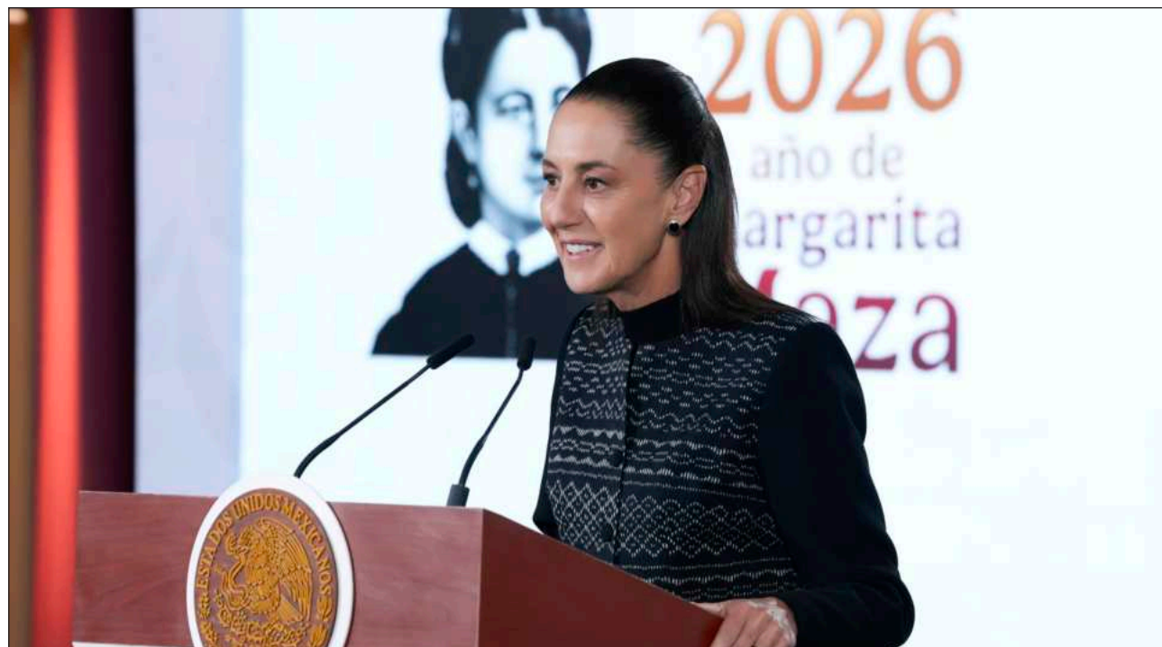
▲ La presidenta Claudia Sheinbaum Pardo subrayó que “cuando hemos solicitado, por ejemplo, en el caso de extradición, ellos nos piden pruebas. O sea, es una práctica común que se pidan pruebas de uno y de otro lado”.

En la mañana , reprochó que de nueva cuenta, Estados Unidos diga que “ocurre algo sin ninguna prueba. Así pasó con las tres instituciones financieras (sobre las) que de manera unilateral el Departamento del Tesoro tomó una medida. Cuando nosotros le pedimos que dieran las pruebas para que pudiéramos acompañarlos en ese proceso, sólo se enviaron dos páginas sin pruebas”.