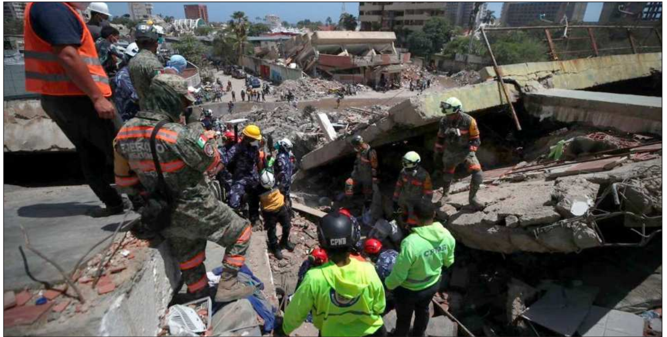
▲ Las personas heridas por los sismos ascienden a 11 mil 267 y los rescatados llegan a 6 mil 461.

La presidenta encargada de Venezuela, Delcy Rodríguez, decretó este miércoles siete días de duelo nacional