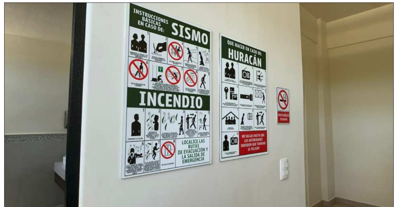
▲ De acuerdo con la Coeproc, históricamente el estado ha registrado dos sismos relevantes: uno en Felipe Carrillo Puerto, en 2002, y otro en Playa del Carmen, en 2015, sin que se reportaran afectaciones de consideración.

Indicó que actualmente la prioridad operativa sigue