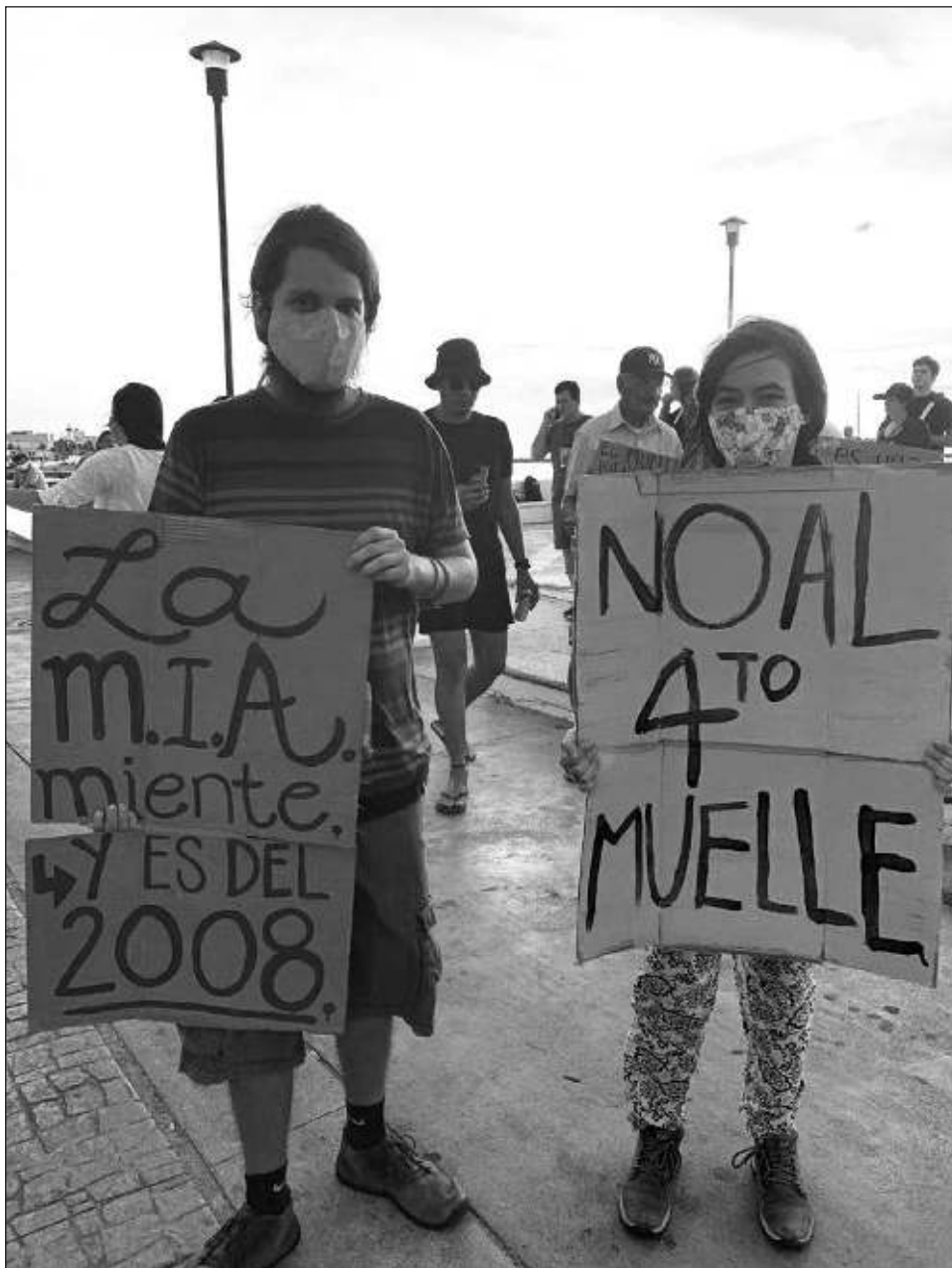
▲ El Colectivo Ciudadano Isla Cozumel anunció que esperará a que se concrete la audiencia constitucional para dar a conocer su postura al respecto.

Dicho amparo se presentó luego de que el 7 de diciembre del 2021 la empresa Muelles del Caribe recibiera la autorización federal en materia ambiental por parte de la Semarnat, así como el título de concesión de la Zona Federal Marítimo Terrestre, publicado en el Diario Oficial de la Federación el pasado 5 de enero del presente año.