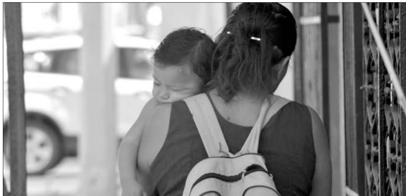
▲ Muchos padres no pagan pensión porque evaden su responsabilidad o no cuentan con el recurso para ofrecer una cantidad digna; incluso algunos prefieren ir a la cárcel, pero el castigo no soluciona la situación de sus hijos.

La especialista indicó que muchos padres no pagan la pensión porque evaden su responsabilidad, otros no cuentan con el recurso para ofrecer una pensión digna, o prefieren ir a la cárcel para evitar este pago. Las mujeres están merced de lo que los hombres les quieran dar, si es que les dan algo.