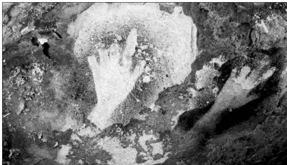
▲ Las paredes adornadas de la gruta testimonian la variedad de animales presentes en el lugar; también han sido catalogadas 69 pinturas de manos rojas y negras y huellas involuntarias de manos.

En el corazón de Marsella, técnicos y artistas terminan la construcción de una réplica, que abrirá al público el 4 de junio.