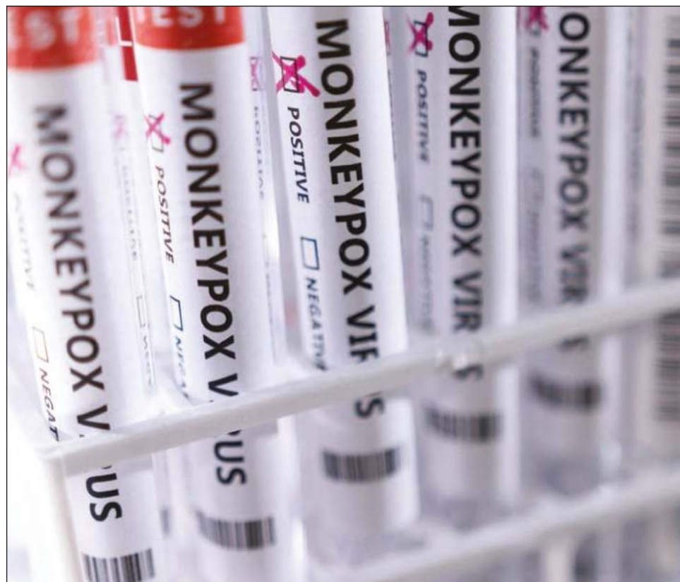
▲ En el continente africano se han registrado el triple de casos este año.

Las autoridades de numerosos países europeos y de Estados Unidos se están ofreciendo a inmunizar a la gente y están considerando