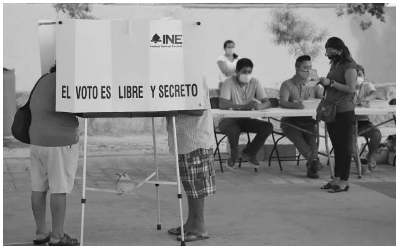
▲ En la jornada electoral del domingo se define al próximo gobernador o gobernadora, así como las diputaciones locales.

Lucio Hernández mencionó que cada una de las estrategias que fueron definidas para este proceso, se han ido implementando