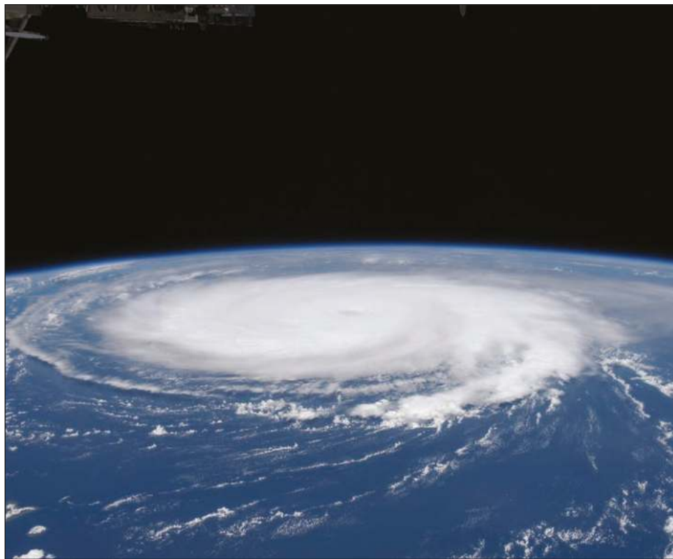
▲ Los expertos de NHC prevén que el remanente de Agatha se fortalecerá de nuevo en aguas del Golfo y se dirigirá al oeste de Cuba para después pasar por Florida.

"Las temperaturas de las aguas del Golfo de México son cruciales en términos de huracanes y tormentas, ya que obtienen el combustible que necesitan, vapor de agua cálido, de la superficie del océano", ha advertido a Efe Anthony Reynes, meteorólogo del Centro Nacional de Huracanes (NHC), con sede en Miami, Estados Unidos.