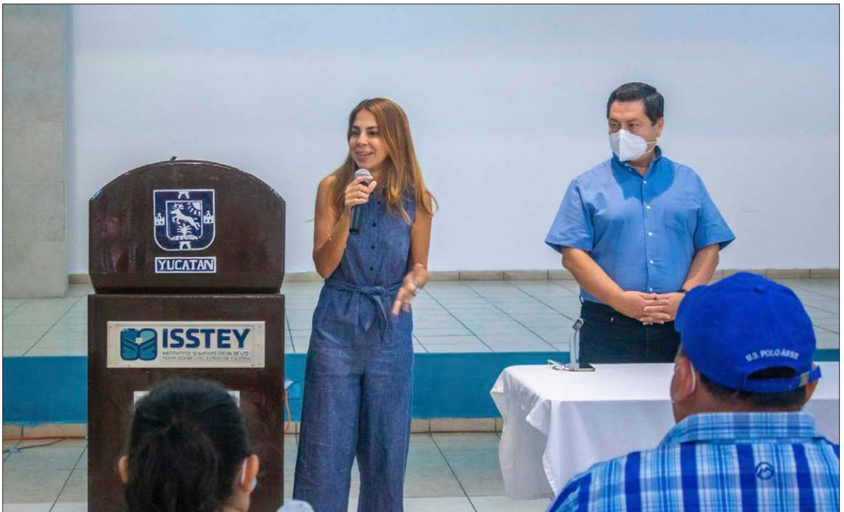
▲ Proponen reunión para viernes 3 de junio a las 11 horas en el recinto del Poder Legislativo, donde cada involucrado expondrá lo que considere pertinente.