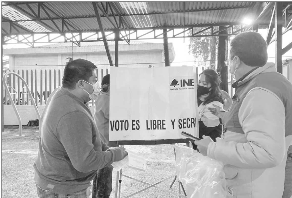
▲ “En la elección federal de 2024 se elegirá al Presidente y serán renovados el Senado y la Cámara de Diputados”.

EL AÑO PASADO predijo que no representaría un problema de largo plazo. “No entendí completamente” las circunstancias, y hubo choques imprevistos que luego empeoraron la situación,