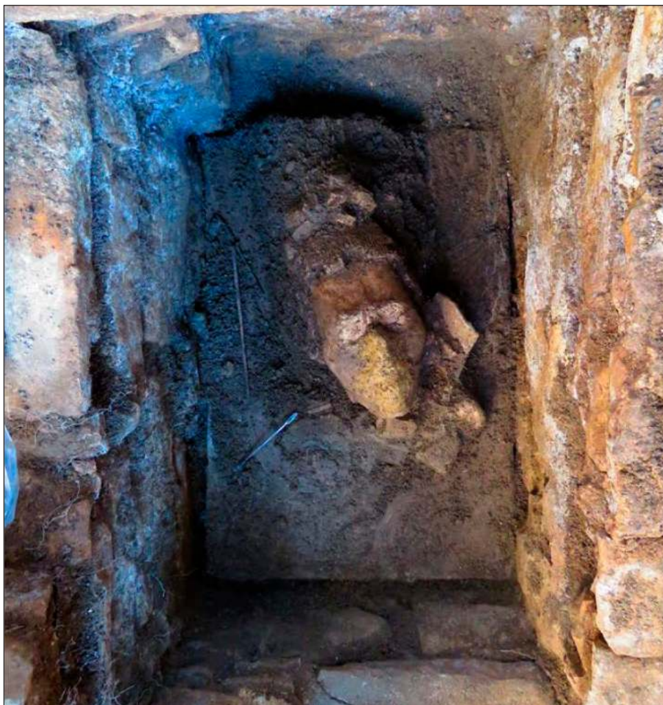
▲ Se trata de un objeto único, debido a que la figura del dios del maíz sólo se había encontrado en escenas pintadas en vasos y platos cerámicos o esgrafiada en este tipo de objetos.

"Debido a que la pieza se halló en un contexto de humedad, actualmente se encuentra en un proceso de secado paulatino para posteriormente dar paso a su restauración, a cargo de especialistas de la Coordinación Nacional de Conservación del Patrimonio Cultural", señalaron las autoridades culturales de México.