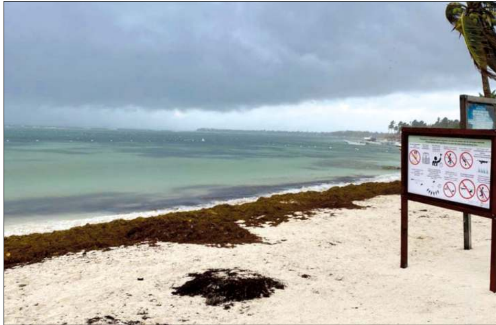
▲ Las lluvias y huracanes ayudan bastante a que el sargazo se mantenga alejado de las costas, pero esta vez no ocurrió así, informó la Red estatal de Monitoreo.

de mayor recale son Puerto Morelos, Punta Esperanza y Playacar, en Solidaridad; Akumal y Xcacel-Xcacelito, en Tulum; así como la costa este de la isla de Cozumel.