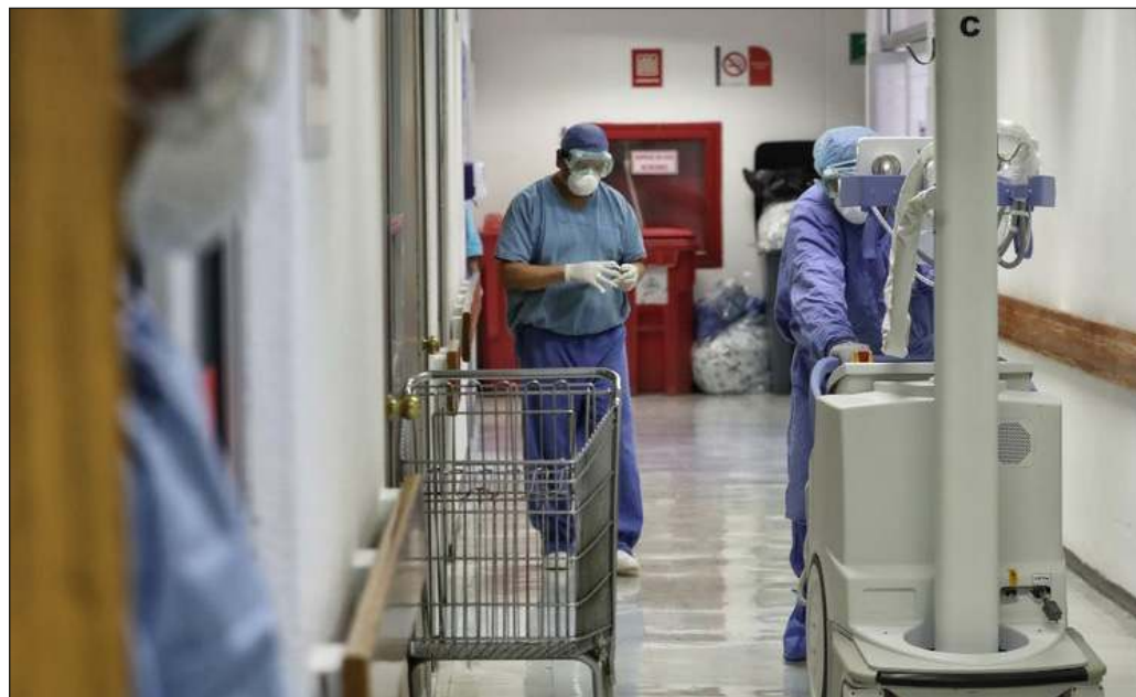
▲ "Es clara la urgencia de replantear la formación profesional de la medicina a partir de criterios éticos y humanos alejados de la deriva neoliberal que ha corrompido a éste y otros gremios".

En suma, es clara la urgencia de replantear la formación profesional de la medicina a partir de criterios éticos y humanos radicalmente alejados de la deriva neoliberal que ha corrompido a éste y otros gremios, así como, en lo inmediato, permitir la llegada de los especialistas dispuestos a cubrir las vacantes desdeñadas por los médicos nacionales.