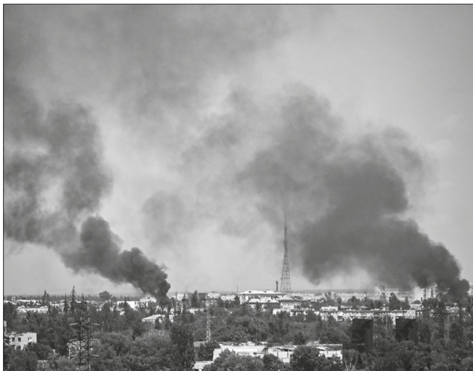
▲ De acuerdo con el gobernador de la región de Lugansk, las tropas rusas controlan 70% de Severodonetsk, ciudad que consideró destruida al 90%.

La ONU ya había denunciado “probables crímenes de guerra y crímenes contra la humanidad” en Birmania.