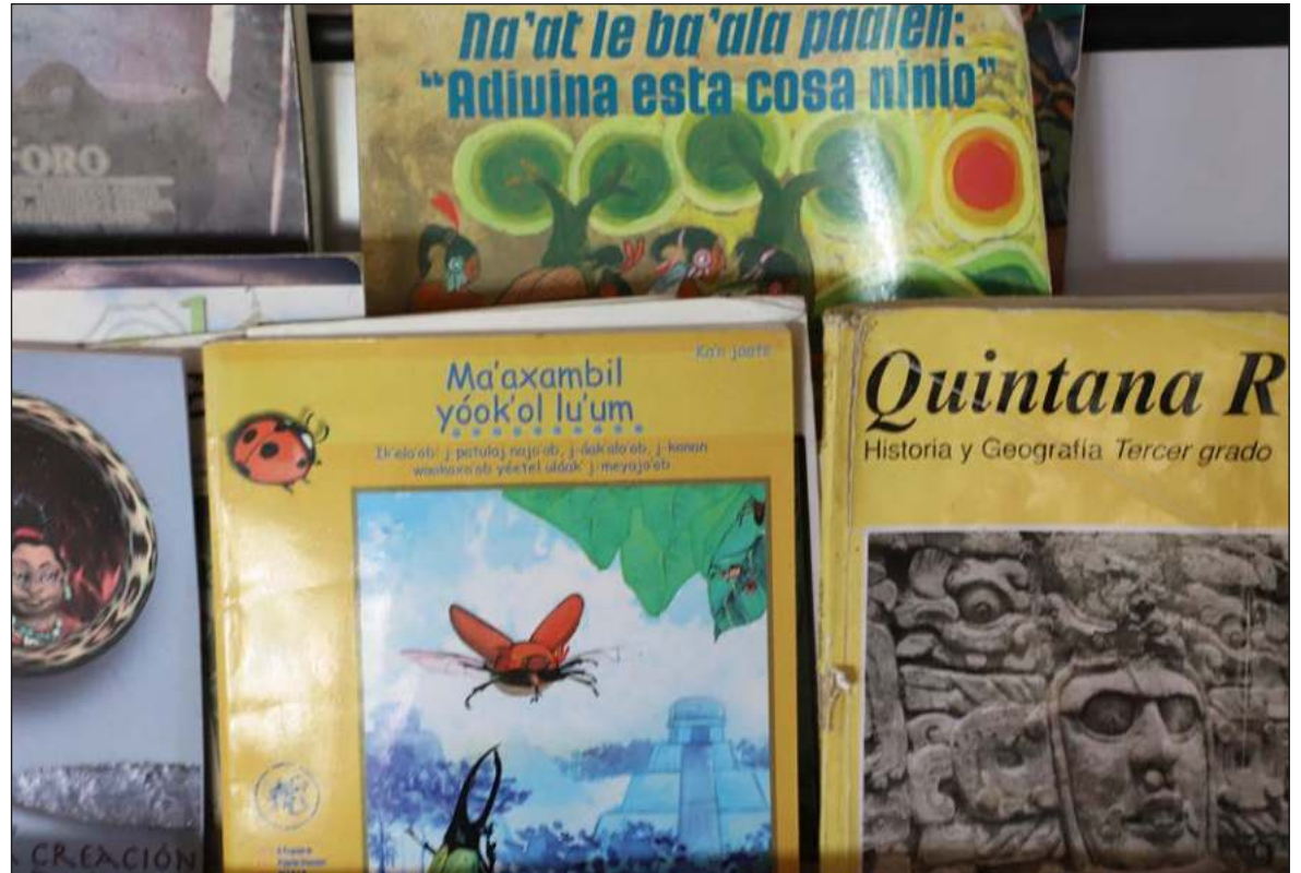
▲ “Se buscaba que la educación estuviera al servicio de los intereses mercantiles: ‘Una buena educación básica genera niveles más altos de empleo bien remunerado, mayor productividad’”.

En paralelo a la modernización curricular se creaban programas emergentes para las materias de español y matemáticas, siendo matemáticas una de las asignaturas con cambios más bruscos: “En la enseñanza de la materia se desechará el enfoque de la lógica