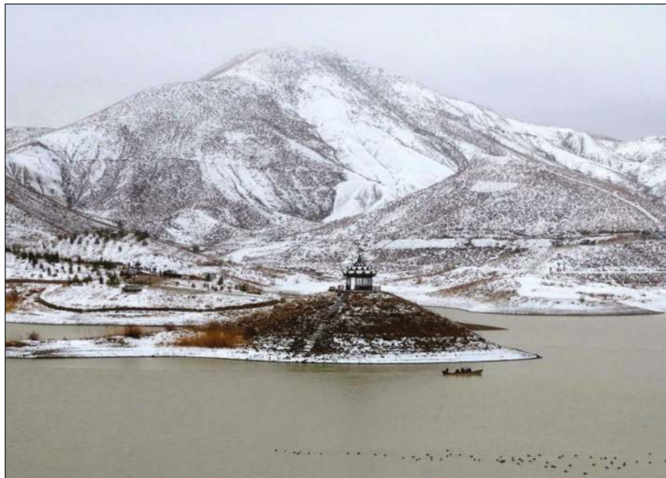
▲ Pakistán alberga 7 mil glaciares. La ministra de Cambio Climático, Sherry Rehman, indicó que su derretimiento es una catástrofe climática a la que ahora se enfrenta el país.

Pero el rápido aumento de las temperaturas propiciado por el calentamiento global no hace más que reducir su tamaño, derretiendo los glaciares, y formando nuevos lagos glaciares que en un futuro podrían desbordarse.