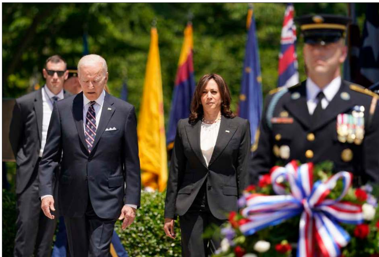
▲ Kamala Harris dijo que asegurarse de que todos los países tengan agua suficiente evitará conflictos.

La Casa Blanca dijo que usaría recursos existentes para implementar el plan, pero no dio muchos detalles sobre plazos y objetivos. También dio a conocer el reporte de un año sobre sus labores en el combate a la sequía, un problema persistente y de gran magnitud que impacta a buena parte del oeste de Estados Unidos.