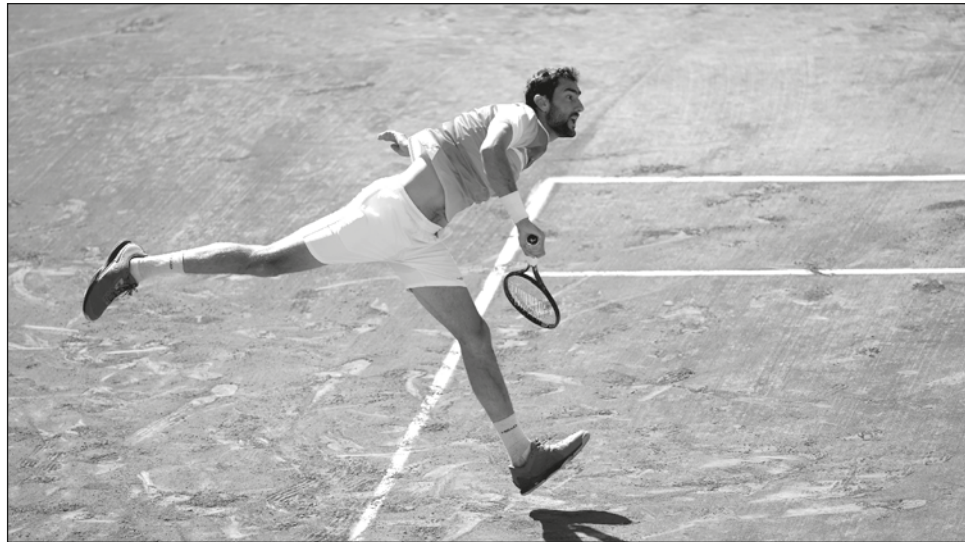
▲ Marin Cilic (foto) dejó fuera al ruso Andrey Rublev en una tremenda batalla de cinco sets.

Cilic, de 33 años, se medirá a Casper Ruud, quien se convirtió en el primer noruego en llegar a semifinales en un torneo grande. Venció 6-1, 4-6, 7-6 (2), 6-3 al danés Holger Rune, de 19 años. El otro partido de semifinales tendrá a Rafael Nadal contra Alexander Zverev.