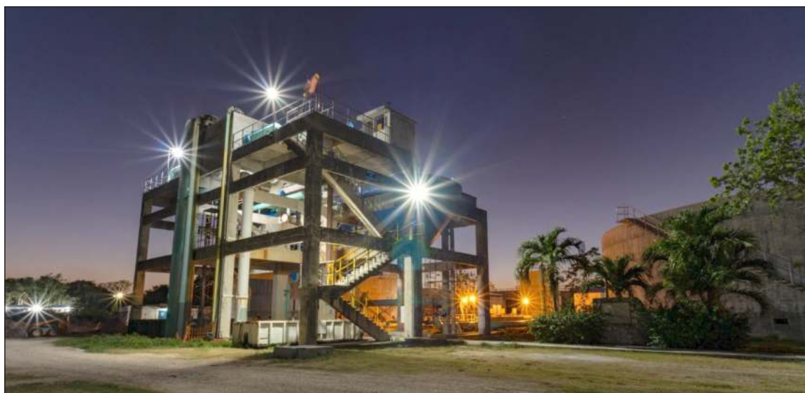
▲ La planta absorberá el incremento de la población hasta llegar a tratar más de 600 litros por segundo.

La planta de tratamiento norponiente actualmente cuenta con una capacidad de tratamiento de 200 litros por segundo, gracias a esta moderniza-