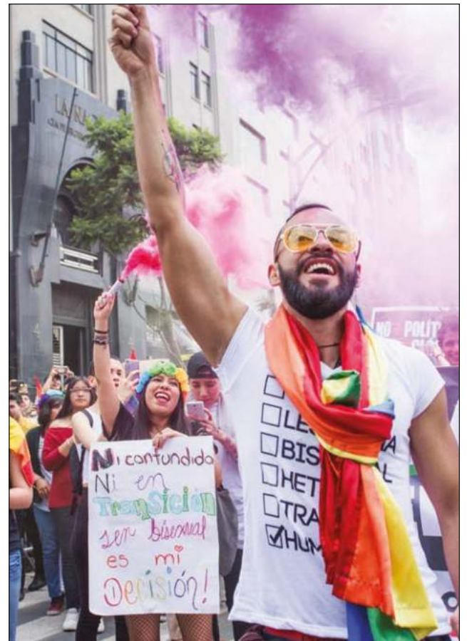
▲ La marcha del Orgullo, para el 25 de junio, se prevé multitudinaria, ya que será presencial.

Ante este complejo escenario debido a la coyuntura pospandemia, la comunidad ha aumentado su presencia política, en los congresos y en las instituciones, y se ha dado cuenta de que dicha participación puede desembocar en legislación que proteja sus derechos humanos.