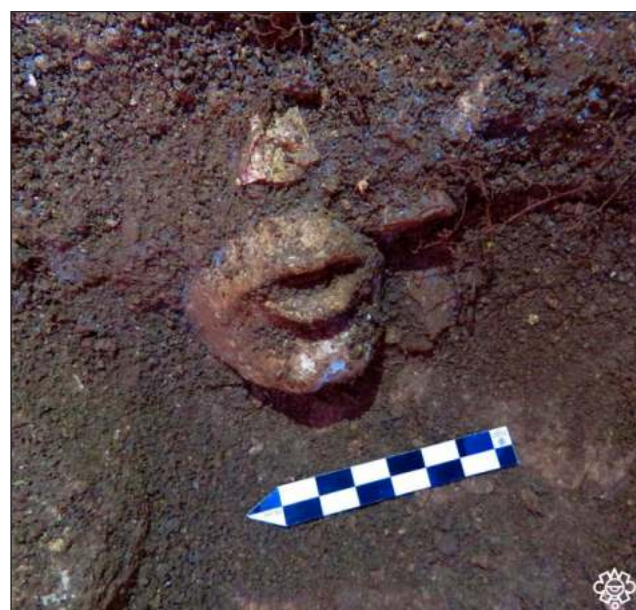
▲ La escultura es el eje de una ofrenda que se dispuso sobre un estanque de piso y paredes estucadas, emulando el ingreso de este dios al inframundo en un entorno acuático.