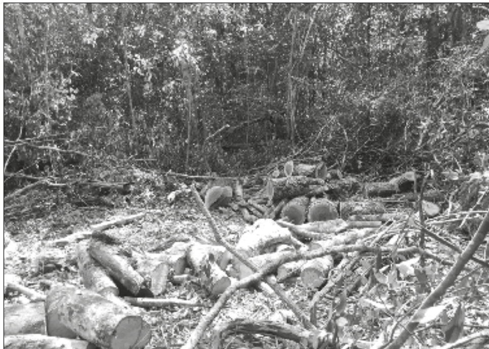
▲ Ejidatarios señalan que llevan más de un año denunciando la tala ilegal; indicaron que el problema ya tiene mucho tiempo y van al menos 8 mil hectáreas deforestadas.

El encargado de la vinculación ese lunes fue el subsecretario de Gobernación, Hugo Mauricio Calderón, a quien