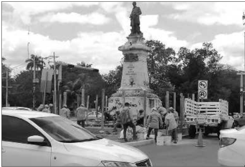
▲ Las esculturas están consideradas como Monumentos Históricos por el INAH, hoy fueron aseguradas para evitar que sean intervenidas por las manifestantes.

Con palos de madera fueron cubiertos ambos mo-