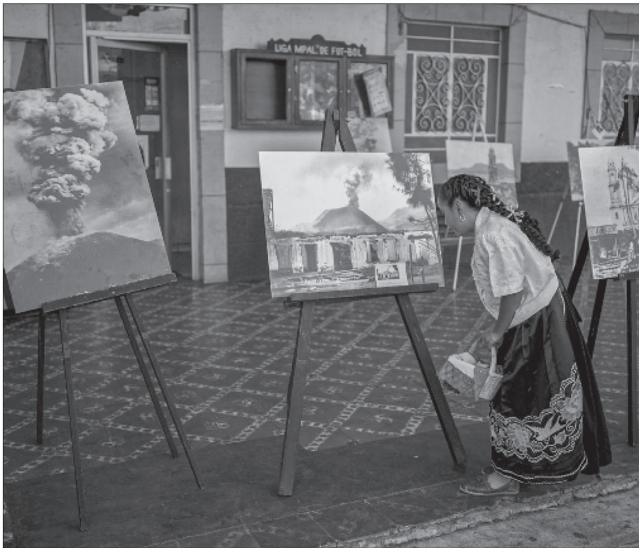
▲ Una chica mira una exhibición sobre fotos históricas del volcán Parícutín, la cual se montó en conmemoración de la erupción inicial que duró cerca de nueve años, en San Juan Nuevo Parangaricutiro, México.

En el pequeño mar de lava que se iba formando, y sobre el que ahora pasean los turistas o científicos buscando más respuestas, sólo había desolación y miedo hasta que llegaron los geólogos.