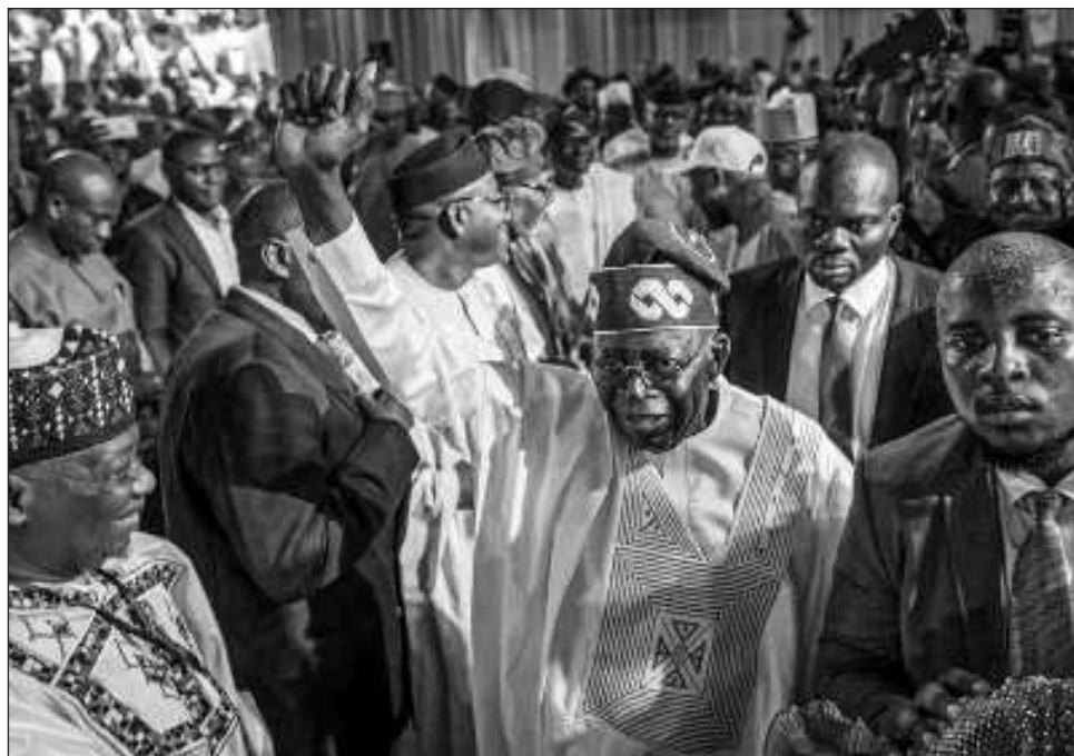
▲ Las elecciones presidenciales de Nigeria fueron observadas de cerca, ya que el país es la economía más grande, así como uno de los principales productores de petróleo del continente.

Tinubu recibió 37 por ciento de los votos, o casi 8.8 millones, mientras que el principal candidato de la oposición, Abubakar, obtuvo 29 por ciento con casi