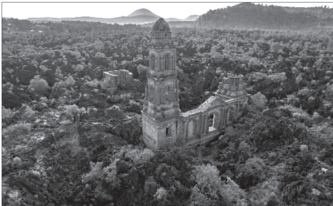
▲ La iglesia enterrada de San Juan Parangaricutiro, en la que hay que trepar por las angulosas y cortantes piedras si uno quiere llegar a lo que queda de altar, recuerda de qué es capaz la naturaleza y la necesidad de seguir estudiándola.

Su crecimiento —es decir, la erupción— duró nueve