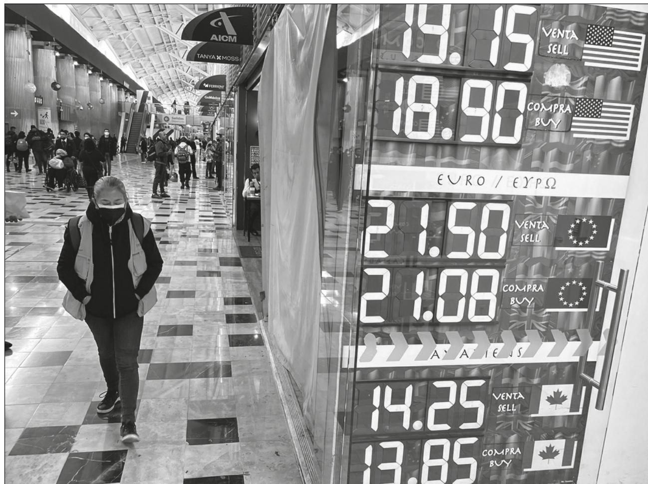
▲ En la apertura de mercados americanos, la moneda nacional alcanzó un nuevo mejor nivel desde 2018.

"Este escenario estará muy dependiente de las próximas cifras y citas relevantes en EU que se irán conociendo durante el mes: empleo (10 de marzo); inflación (14) y reunión de política monetaria de la Reserva Federal (22)", precisaron los especialistas.