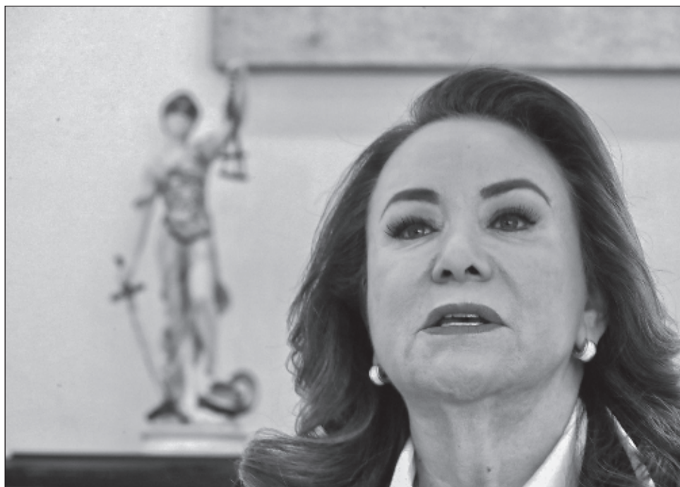
▲ Si se llegara a emitir el dictamen, podría generar afectación de muy difícil o imposible reparación para Esquivel Mossa, señaló el magistrado ponente.

La Jornada publicó que por unanimidad, el órgano jurisdiccional determinó modificar la medida cautelar para que el Comité Universitario de Ética pronuncie detalles del caso que sean de "interés público", pero deberá hacerlo sin calificativos. Tampoco podrá divulgar el estado de las investigaciones para no violar la presunción de inocencia de Esquivel.