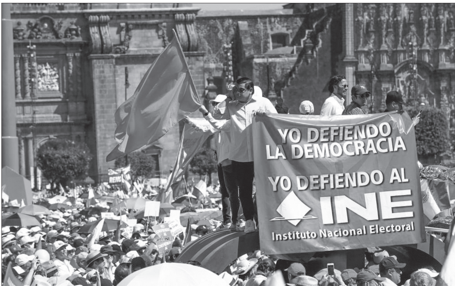
▲ Opositores de AMLO “patentizaron una vez más su odio, pero sin articular propuestas viables para el beneficio colectivo del país”.