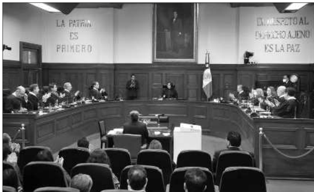
▲ ¿Cómo operaba la SCJN bajo la presidencia de Arturo Zaldívar que el Ejecutivo manifiesta ahora que había mayor vigilancia? ¿Significa que López Obrador percibía una mejor impartición de justicia?.

Un verdadero régimen republicano implica que el Ejecutivo, el Legislativo y el Judicial se vigilen uno al otro, y no que dos de estos poderes se encuentren sometidos a uno de ellos.