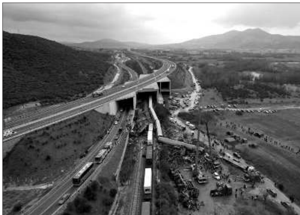
▲ Algunos sobrevivientes lucharon por liberarse después de que el tren de pasajeros se saliera de la vía y se estrellara en un campo cerca de un acantilado al norte de Atenas.

Los rescatistas buscaban sobrevivientes entre los restos retorcidos y humeantes antes del amanecer del miércoles. Lo que parecía ser el tercer vagón del tren de pasajeros se