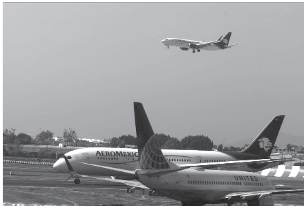
▲ La Sedena coordinará la participación de las autoridades correspondientes, para realizar “acciones operativas y evitar actos contra la seguridad del territorio nacional”.

La entidad castrense dará seguimiento a aeronaves que violen las normas relacionadas con el uso del espacio aéreo nacional y cuando se detecte este tipo de actividades establecerá contacto “continuo visual, electro-óptico o por medio de radar de