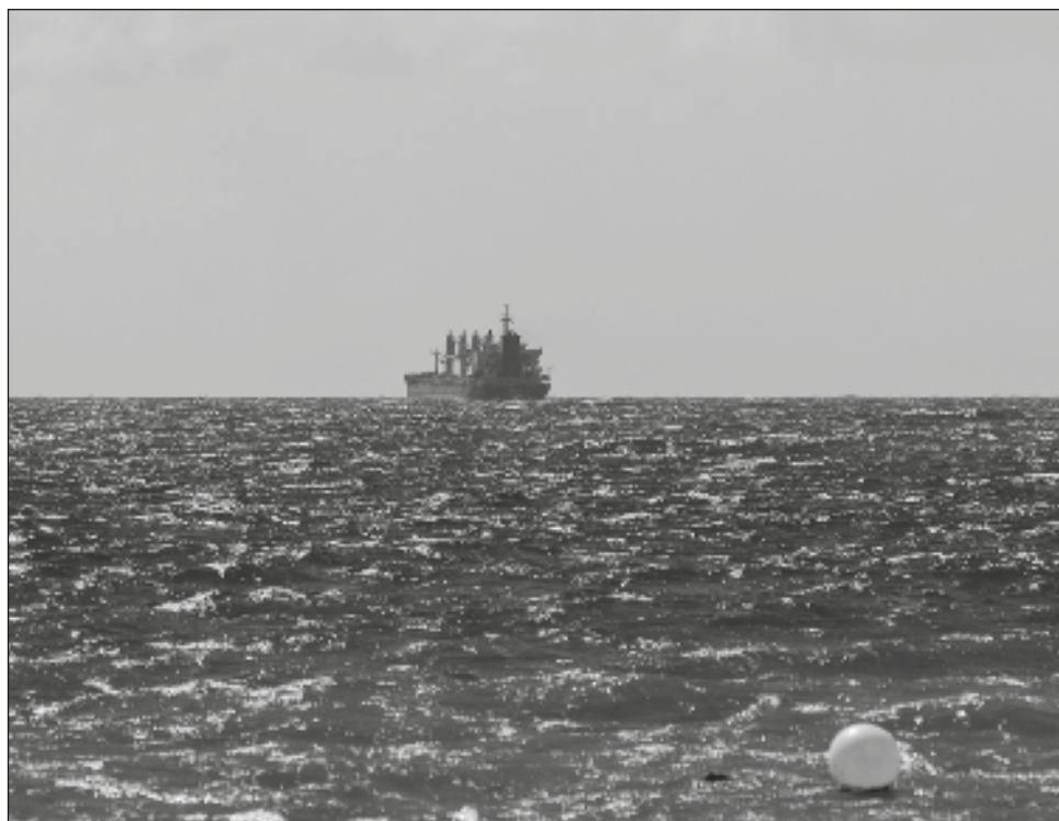
▲ Debido a que el calado de la zona es insuficiente, Melody no puede desembarcar directamente en el muelle por lo que diversas barcazas recolectarán el material y lo llevarán a la costa; ahí, volquetes trasladarán la piedra hasta Leona Vicario.

El buque se encuentra fondeado frente a la zona del Hotel Cid Marina y aún no se tiene conocimiento de qué día comenzará a ser trasladado por tierra, pero se prevé que pudiera ser para el fin de semana o principios de la siguiente.