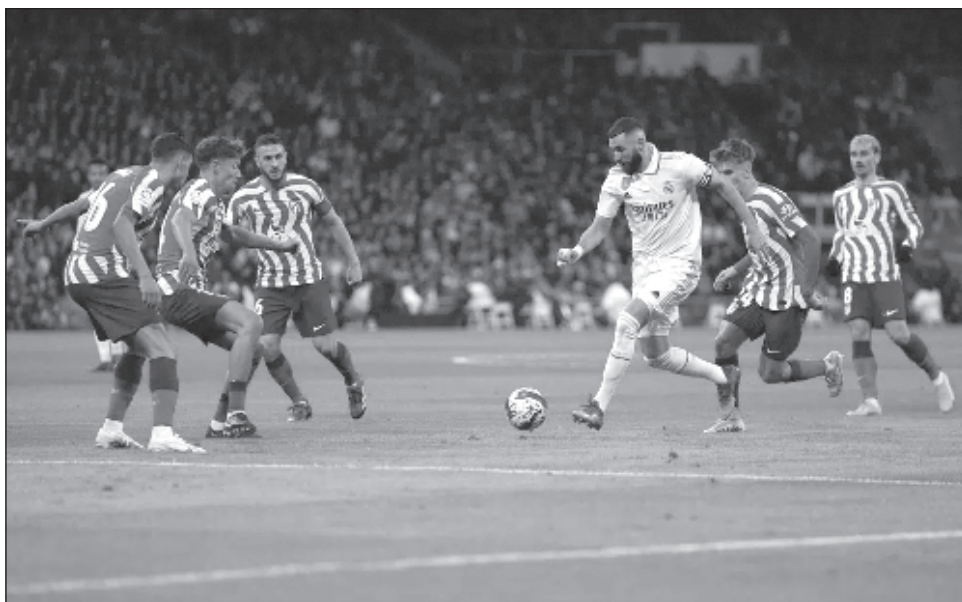
▲ Karim Benzema y el Real Madrid tratarán de dar hoy un paso importante en su búsqueda de alcanzar la final de la Copa del Rey.

Lewandowski fue el último en lesionarse, descartado por una sobrecarga muscular sufrida el domingo en la derrota 1-0 en Almería. Fue el primer partido en que el Barcelona se fue sin marcar gol desde octubre. Pedri y Dembélé también arrastran dolencias musculares.