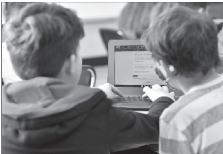
▲ "I realized that each generation seems to come with an innate understanding of the technological world into which they are born".