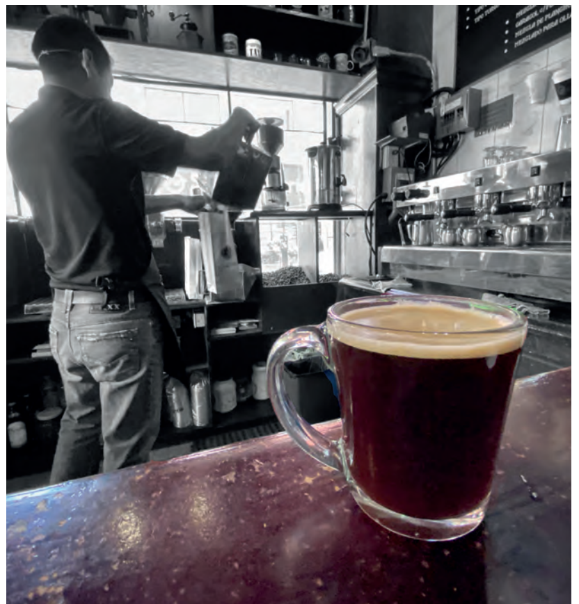
▲ Pese al mal momento que atraviesan varios negocios por la pandemia, las cafeterías meridianas se recuperan rápidamente.

Muchos se quedaron en casa y se volvieron adictos al café, asegura barista