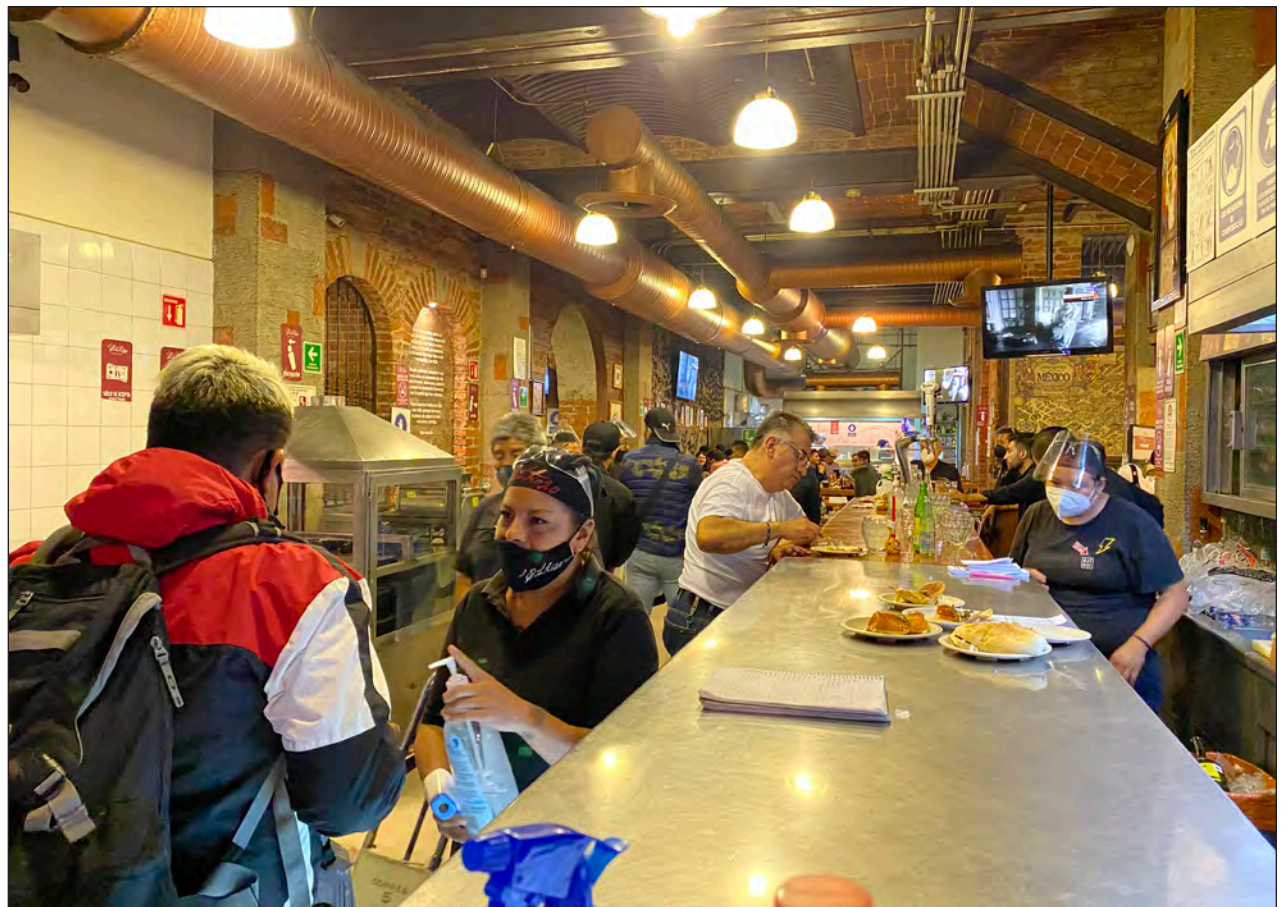
▲ A pesar de la ampliación de aforo, los restaurantes continuarán funcionando con las demás restricciones de horario y días de apertura.

Como hasta el momento, no tienen permitido vender bebidas alcohólicas a domicilio o para llevar.