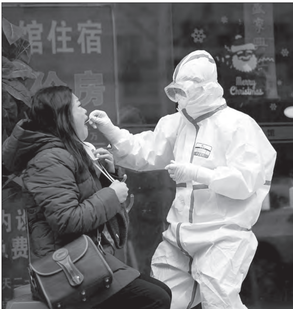
▲ Una prueba de cinco dólares que puede diagnosticar COVID-19 en 15 minutos expandirá significativamente la capacidad de detección de casos en los países menos ricos.

Alex Gorsky, CEO de Johnson & Johnson que integra la Fundación Gates, dijo que para mediados de 2021 su grupo empresarial planea despachar 500 millones de dosis de vacuna los países de menores ingresos.