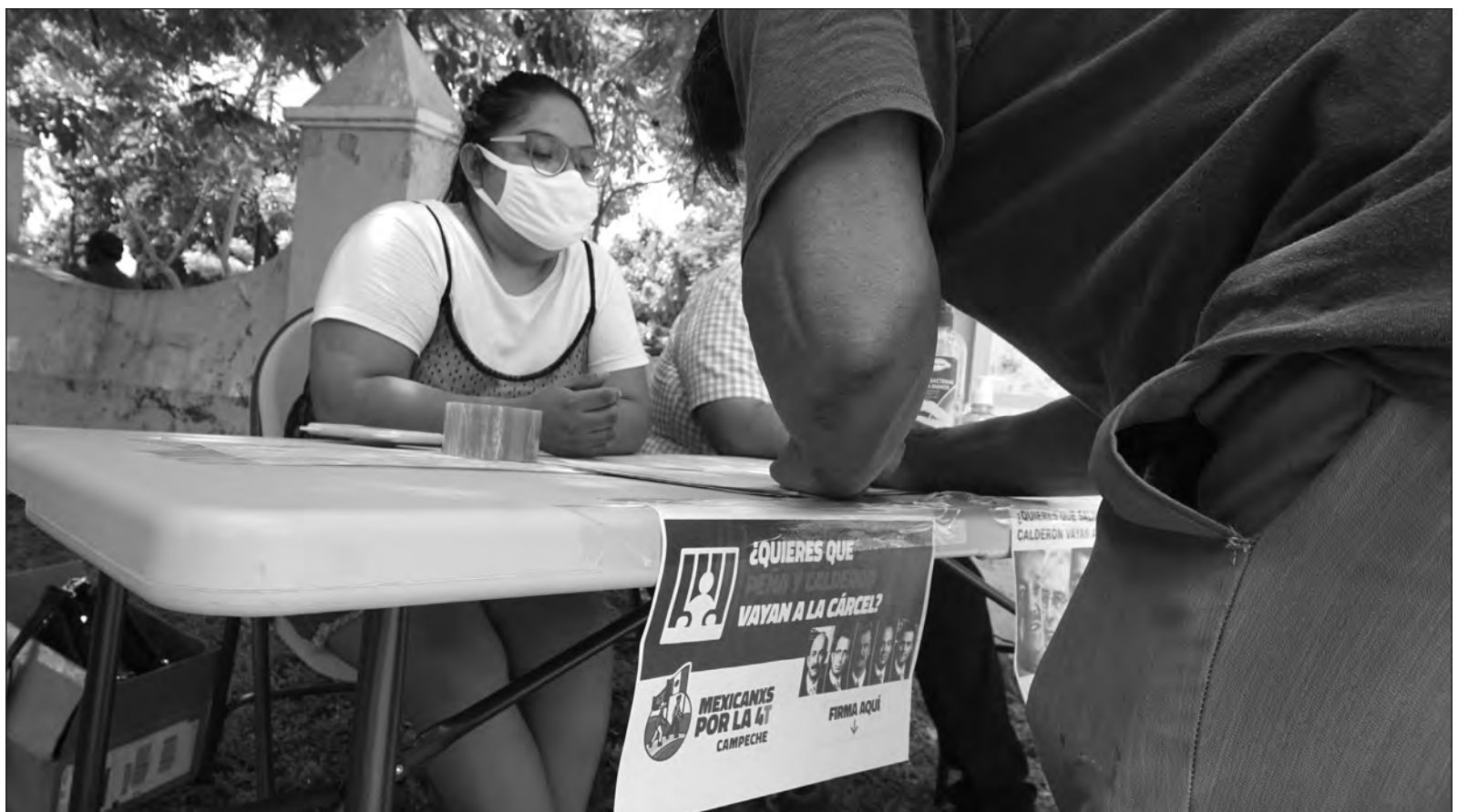
▲ En 15 días, ciudadanos organizados recabaron más de dos millones y medio de firmas para solicitar una consulta popular de juicio a los ex presidentes del PRIAN.