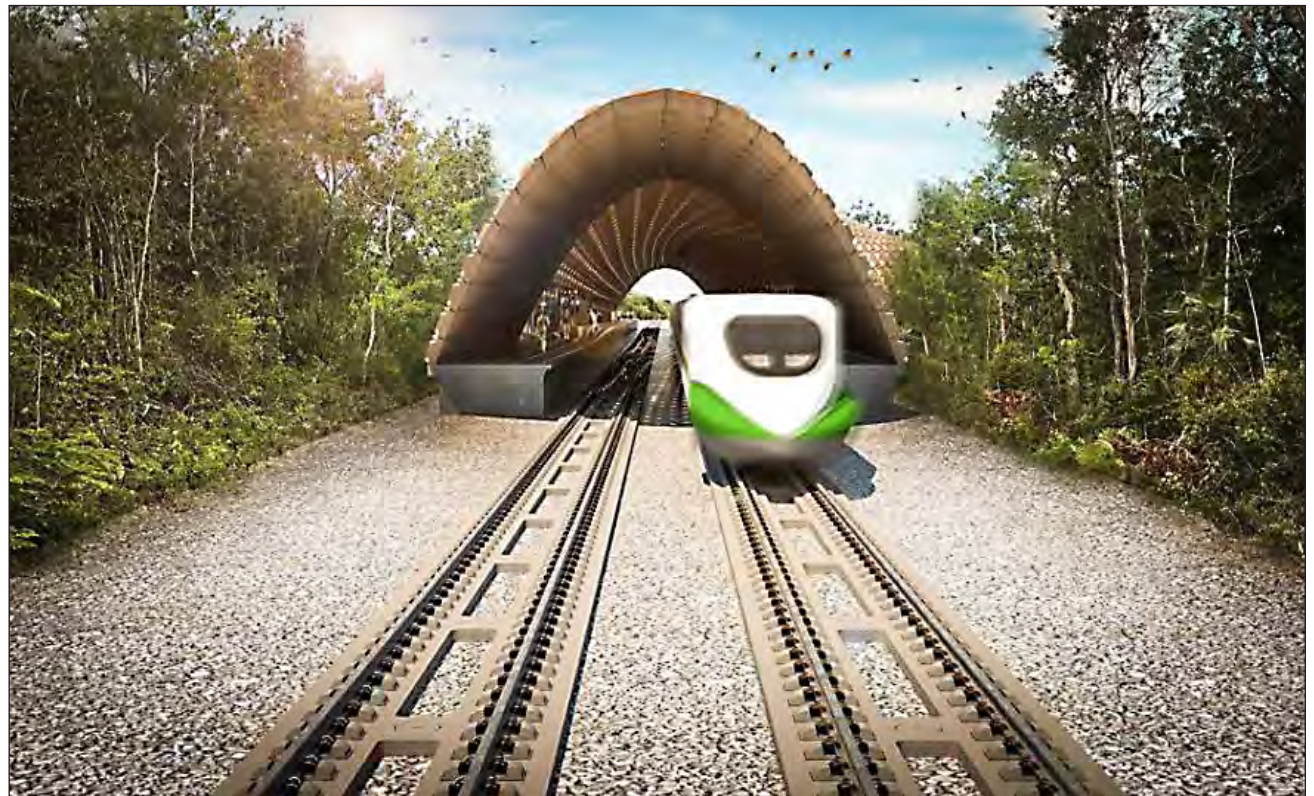
▲ Los tramos correspondientes a la ruta Mérida-Cancún-Chetumal serán electrificados. Render Ayuntamiento de Benito Juárez

La CFE proporcionará su experiencia y capacidad técnica para realizar los trabajos previos de ingeniería, supervisión y construcción de