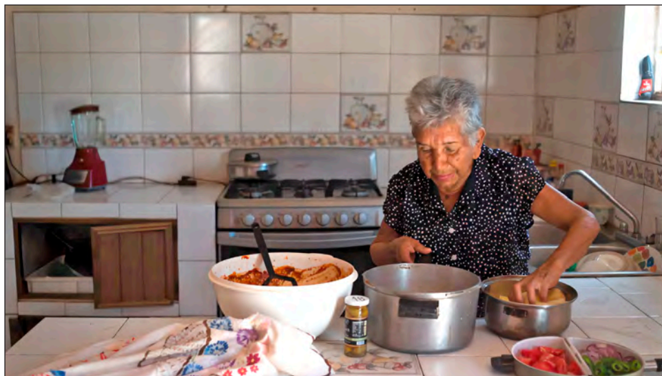
▲ La muestra está integrada por una selección de imágenes de la vida doméstica de algunas de esas madres y familiares de desaparecidos.

Está integrada por una selección de imágenes de la vida doméstica de algunas de esas madres y familiares de desaparecidos, recetas culinarias y textos alusivos al tema de especialistas