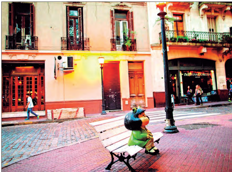
▲ La estatua de la niña contestataria sentada en un banquito de plaza se ha convertido en un lugar de peregrinación, donde se forman largas filas para tomarse la foto.

Los personajes que la rodean, el materialista Manolito con sus sueños de llegar a ser “Roque Féler”, Susanita que sólo piensa en casarse con un hombre rico y ser madre (“¿Futuro perfecto de amar? ¡Hijitos!”), el apocado Felipe (“¿Justo a mí me tenía que tocar ser como yo?”), el filosófico Miguelito (“Trabajar para ganarse la vida está bien, pero por qué esa vida que uno se gana trabajando tiene que desperdiciarla trabajando para ga-