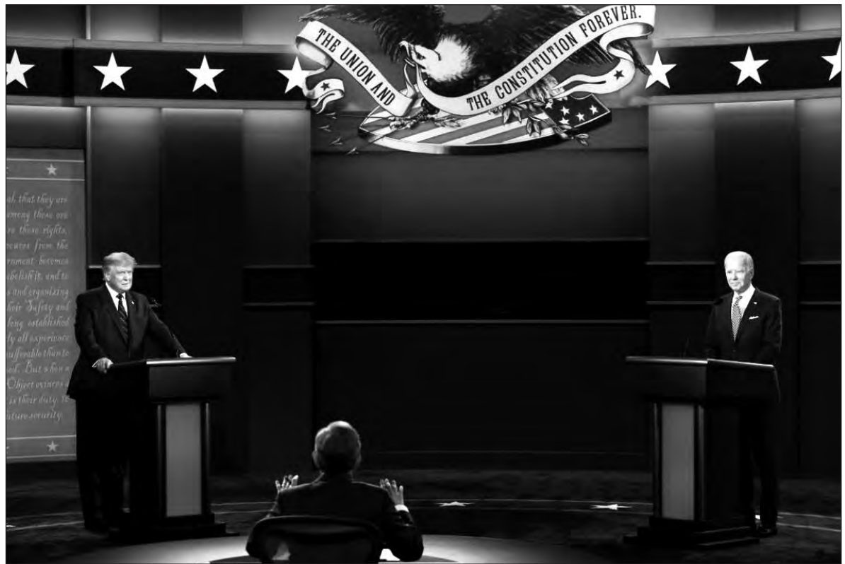
▲ Joe Biden and the moderator had few tools to manage a U.S. president who completely disregarded the rules of civil debate.

WHILE DEMOCRAT JOE Biden had some effective moments, speaking directly to camera, calling Trump the worst U.S. president ever and telling the presi-