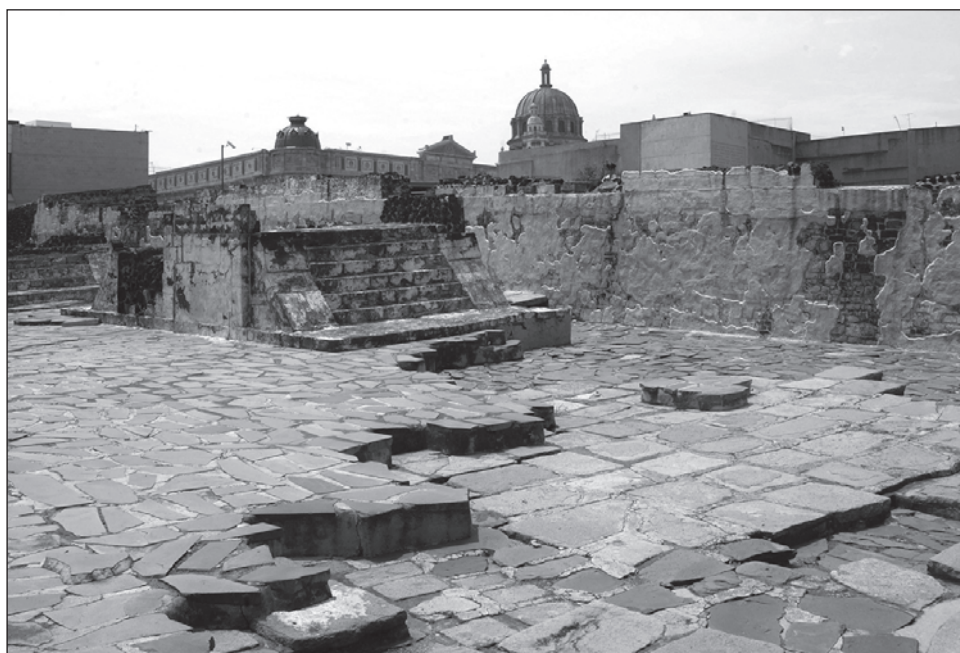
▲ El Presidente retomó su petición de que tanto el gobierno español como el Papa Francisco ofrezcan disculpas por los excesos y atrocidades cometidas durante la conquista.

Mas adelante López Obrador consideró que "el perdón ayuda a la reconciliación. Cuando hicimos este planteamiento se malinterpretó. Algunos dijeron, eso ya está olvidado, eso pasó hace mucho tiempo. Recientemente en Estados Unidos echaron abajo estatuas de colonizadores, y no se trata de estar de acuerdo en desacuerdos. Se