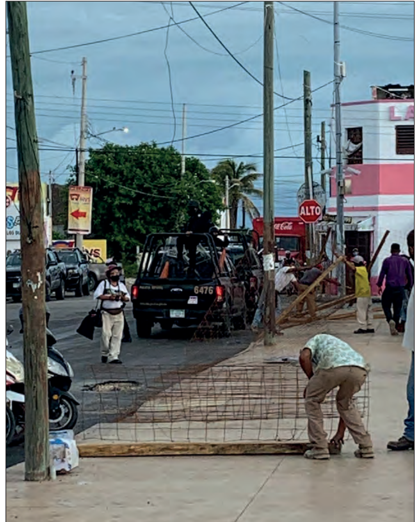
▲ El Grupo Constructor Posadas y Constructora Peninsular Cugra deben entregar las obras el 17 de diciembre; las obras comprenden el mejoramiento de la plaza principal y la construcción del mercado.