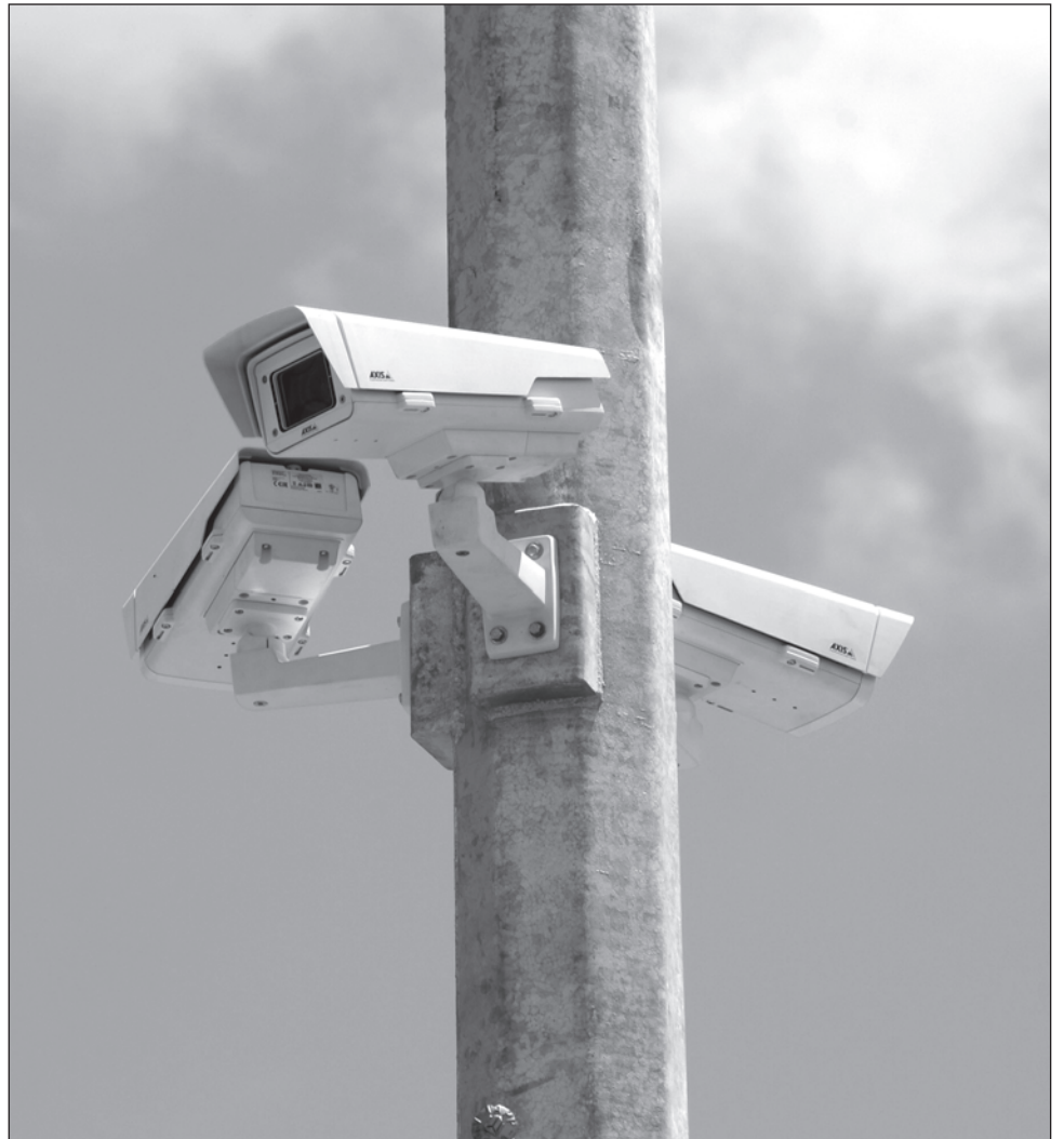
▲ El programa Yucatán Seguro contempla la instalación del sistema integral de videovigilancia para el refuerzo tecnológico de seguridad y monitoreo.

Como parte del sistema integral de videovigilancia para el fortalecimiento tecnológico de seguridad y monitoreo, se refuerza la tranquilidad de los ciudadanos en las calles, colonias y casas en el estado, con la ampliación y modernización de equipo tecnológico