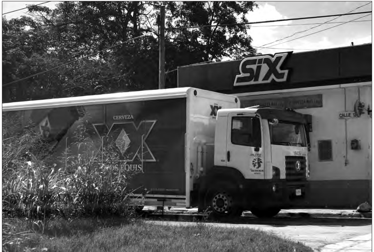
▲ Camiones de marcas cerveceras ya comienzan a surtir los expendios de la entidad.

Desde el pasado 1º de septiembre, sólo se permitía la venta de este tipo de bebidas a domicilio, tras la derogación de la Ley Seca