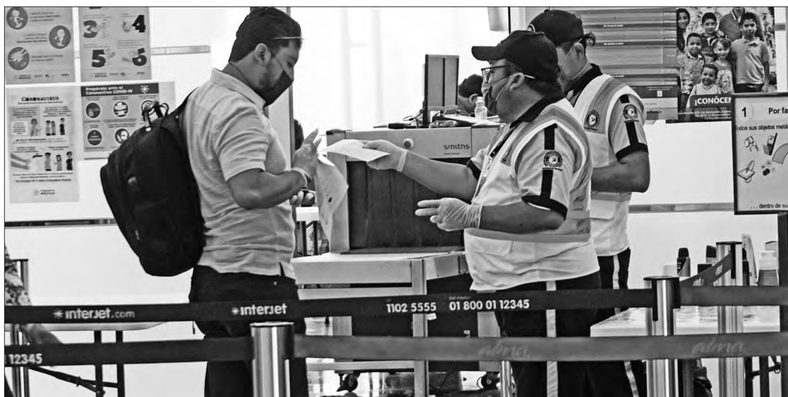
▲ Aunque el aeropuerto de la CDMX empezó con buenas ideas para cumplir algunas normas, el borreguismo y el hartazgo colectivo van ganando la batalla. Susana Distancia fue desterrada.