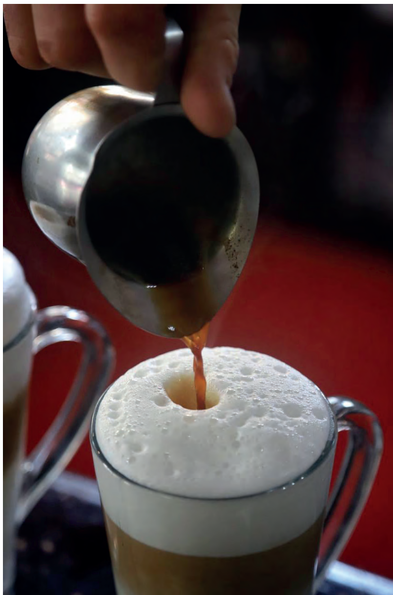
▲ Un barista se encarga de servir las bebidas de manera correcta, siempre en busca de que el cliente se sienta encantado con cada sorbo.

Reconoció que la profesionalización de los baristas en el estado es algo relativamente nuevo, actualmente existen cerca de 15 profesionales certificados. En México, son dos las entidades que otorgan estos documentos: la Spe-