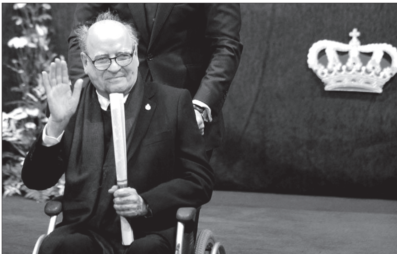
▲ Al cumplir 50 años de la creación de Mafalda , el dibujante recibió en 2014 el Premio Príncipe de Asturias de Comunicación y Humanidades, uno de muchos reconocimientos en su carrera.

Ese año, varias exposiciones recordaron al entrañable personaje en varias partes del mundo.