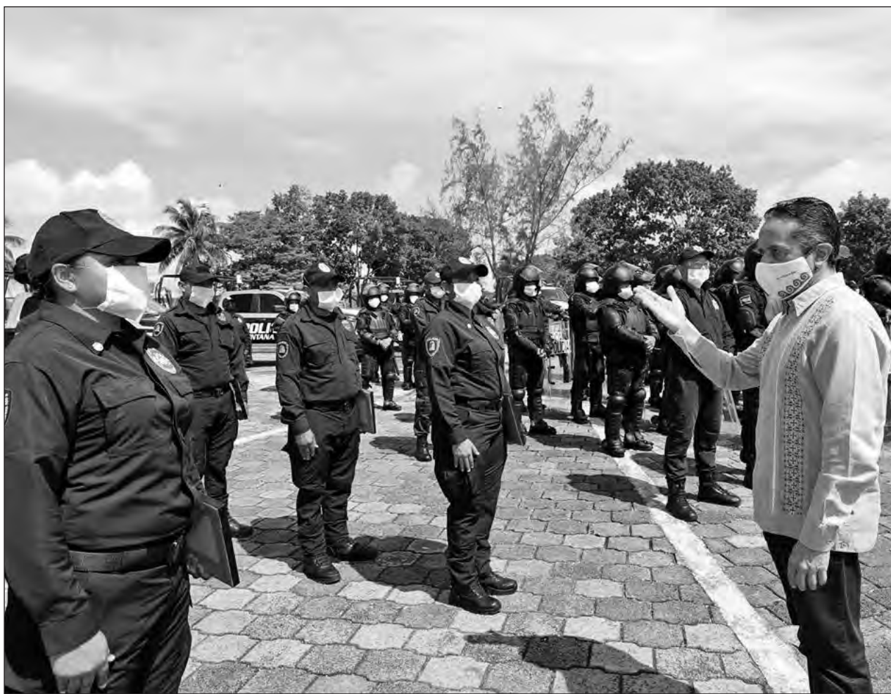
▲ La capacitación es fundamental para seguir fortaleciendo las instituciones de seguridad, señaló el gobernador Carlos Joaquín.