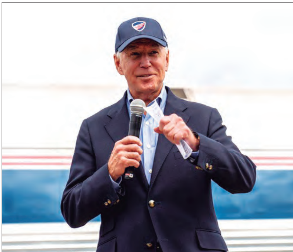
▲ El demócrata Joe Biden participó en un acto de campaña en Ohio, un estado clave para llegar a la Casa Blanca.

El demócrata respondió llamando a estos grupos a “desistir” de actuar. “Eso no es lo que somos. Como estadounidenses eso no es lo que somos”, indicó.