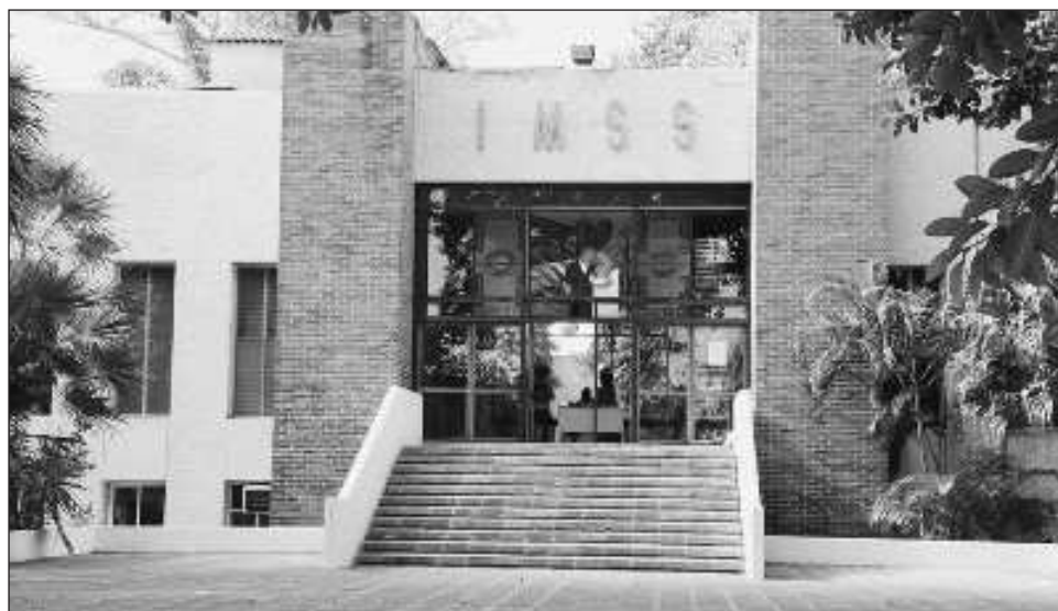
▲ A través de la Subdelegación Mérida Norte, que fue acreedora al Premio IMSS a la Competitividad, contará con recursos adicionales para la adecuación de esta Unidad Administrativa.

De la misma forma, los tres Hospitales de sub zona, ubicados en los municipios de Motul, Umán y Tizimin