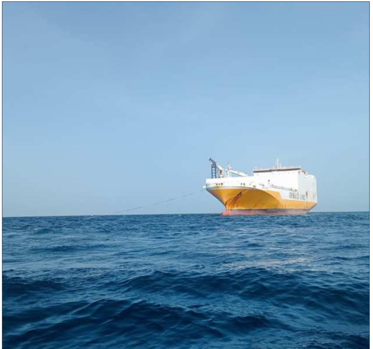
▲ Leti'e' nuxi' ba'al pech kuxtal yaan te'e ich ja'o'.

U cheemil Grande Senegal, ti'alinta'an tumen italianail mola'ay Grimaldi Lines, táan u meyaj ti'al u béeytal u tse'lel te'e tu'ux yano'. Tak walkila' ma' káajak u wéekel kóombustiiblee mix xan teejel u kaaskoil.