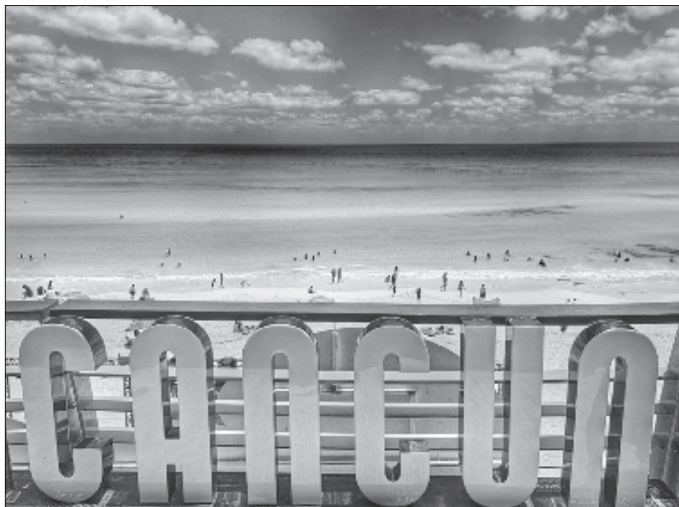
▲ Esta semana la joya del Caribe Mexicano tuvo una ocupación de 84%.

"Ya en general el estado está rozando 82 por ciento de ocupación, se prevé que esta semana siga aumentando, tuvimos la presencia de más de 500 mil turistas esta semana y en general son muy buenos números: Isla Mujeres, 80.5 por ciento de ocupación, Costa Mujeres, 86 por ciento, Cancún 84 por ciento, Puerto Mo-