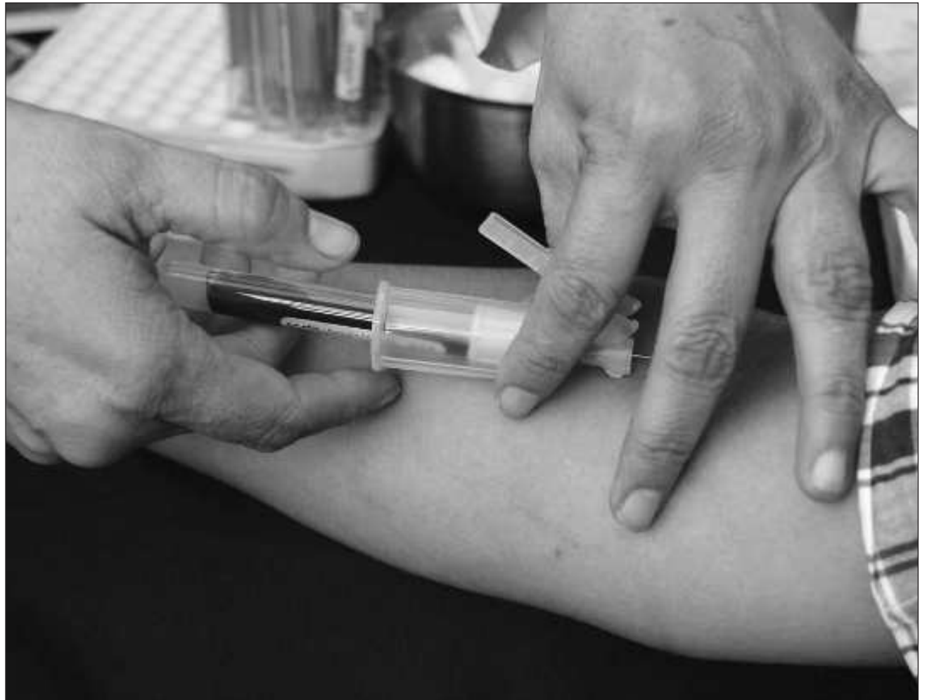
▲ Se colocarán stands del 31 de julio al 4 de agosto en la UNEME CAPASITS Carmen; en Escárcega el 1 de agosto en el Mercado José del Carmen González; el 2 en Bodega Aurrera; el 3 en el Parque Principal Miguel Hidalgo y el 4 de agosto en Coppel.

“Impulsamos la detección oportuna, estamos llevando a cabo la Jornada de Detección con stands informativos y pruebas rápidas