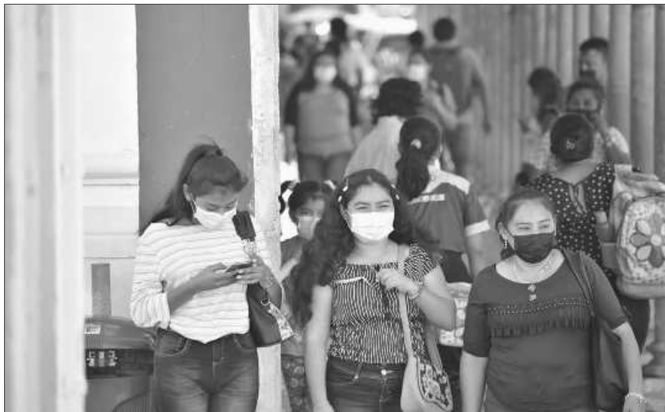
▲ La universidad llamó a la comunidad a mantener medidas generales sanitarias, como el uso de cubrebocas en lugares cerrados con poca o nula ventilación cuando se conviva con otras personas por más de 30 minutos.

No obstante que resaltó que “la situación se encuentra en relativa calma y condiciones generales favorables, se recomienda, en esta época del año y ante inicio de las actividades de la Universidad, continuar con las medidas generales de prevención de contagios y complicaciones por