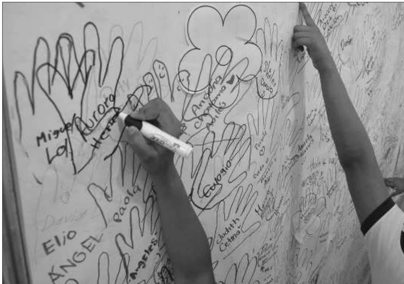
▲ Se informó que analizarán la propuesta de ley y se realizará un foro en el que participarán diferentes actores del ámbito educativo, así como organizaciones civiles, para que próximamente entonces ésta sea votada.

Sobre la creación de la ley de educación superior de Yucatán, suscrita por el presidente de la comisión, continuará el análisis, pues habrá un foro en el que participarán diferentes actores del ámbito educativo, como organizaciones civiles, para que próximamente la ley sea votada.