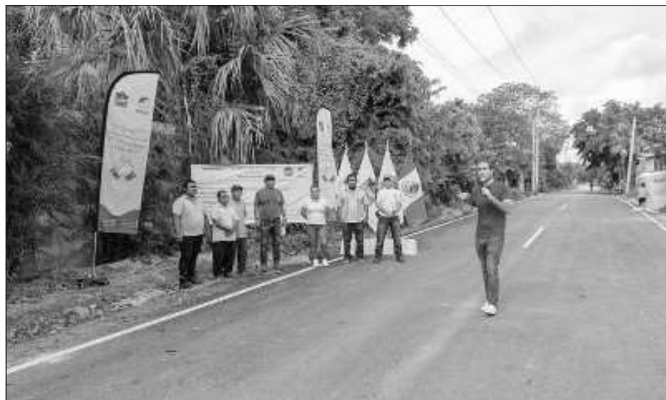
▲ El edil recalcó que en su gobierno hay unidad para lograr transparencia, siendo Francisco Uh May una de las comunidades más importantes, "que sepan que vamos a escucharles".