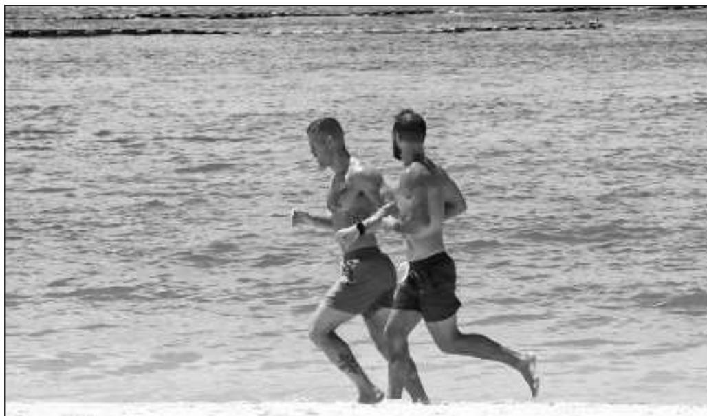
▲ Los Estados Unidos siguen siendo el principal mercado a atraer, dada la cercanía, pero después del encierro es notable que los destinos más atractivos son los de placer, sol y playa.

La vocación turística del Tren Maya deberá reflejarse en la cantidad de visitantes, tanto nacionales como extranjeros, en las zonas arqueológicas de la península, al igual que en los destinos de playa y de turismo cultural, no sólo para asegurar su operatividad, sino también para acercar a los prestadores de servicios y productores locales a un mercado más amplio; ese será su éxito.