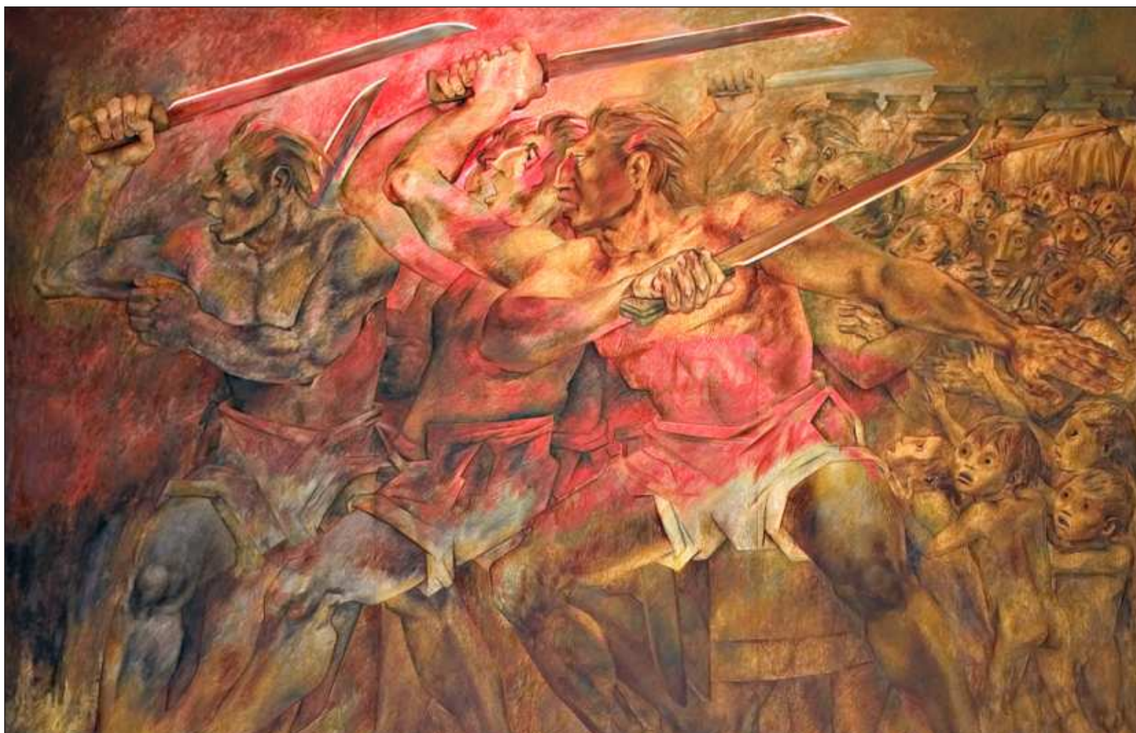
▲ "La gran cultura Maya, a la que hoy se cuelgan programas de desarrollo económico y político, ha sido reconocida en todo el planeta, por extraños".