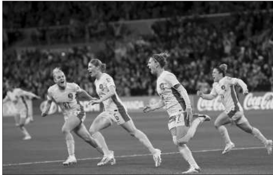
▲ Las australianas golearon a las campeonas olímpicas para sellar su boleto a octavos de final.