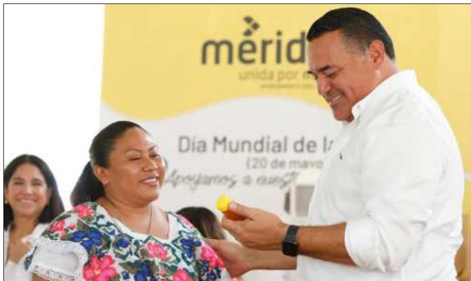
▲ “En la ciudad crecemos parejo, porque nuestras políticas públicas están enfocadas en sumar a más familias que desean y quieren mejorar sus condiciones de vida”: Renán Barrera.

Finalmente, dijo que el ayuntamiento promueve el consumo de la producción local con la apertura de espacios donde las y los integrantes del programa Círculo 47 exhiban sus productos tanto a la población en general como para las y los visitantes que acuden a estas actividades.