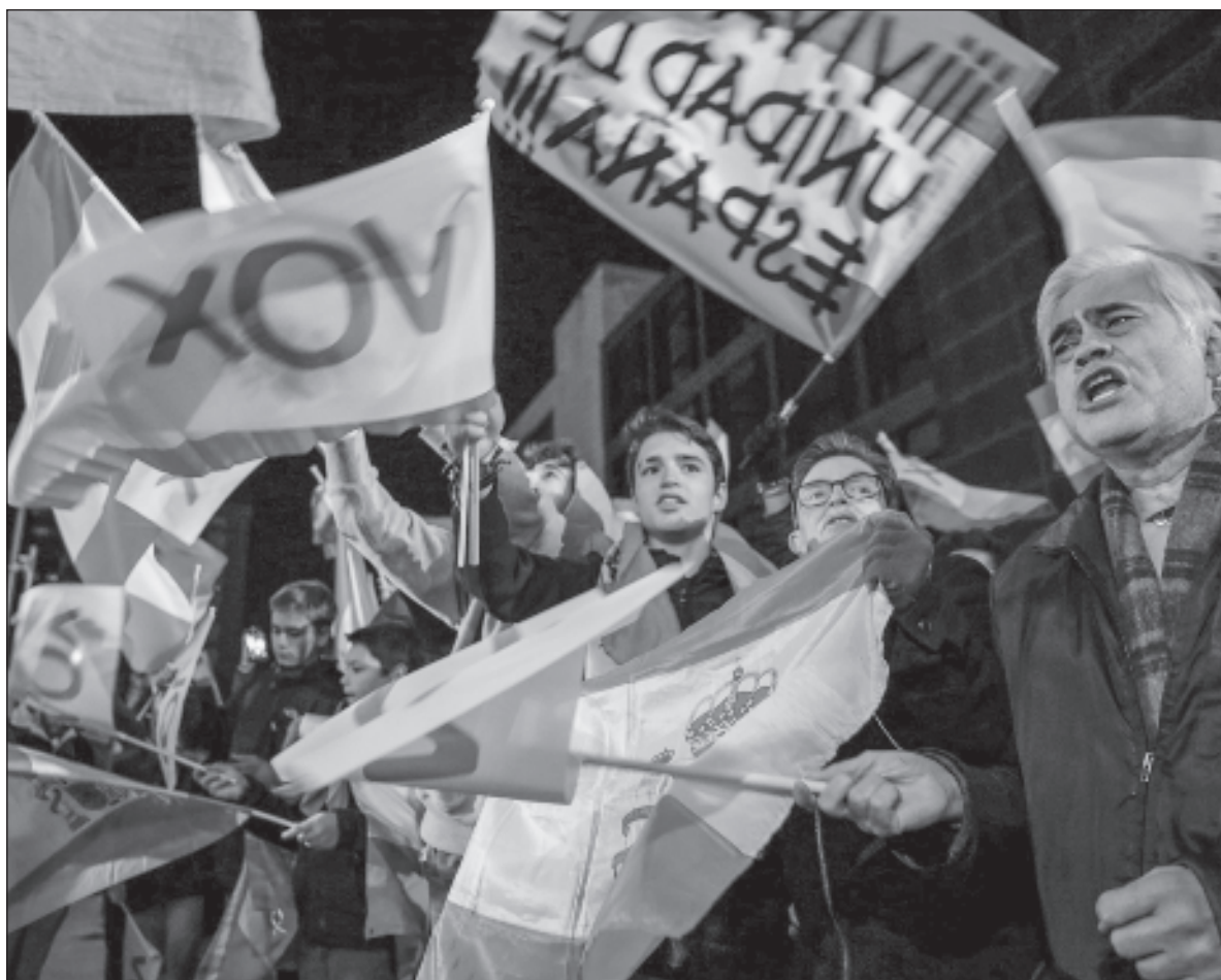
▲ "VOX's platform includes an end to LGBTQ rights, to assisted dying, women's rights, and other equality policies. It is rooted in the ideology of former dictator Francisco Franco's Spain (1939-75) and uses many of the Francoist symbols and fascist slogans".

SANCHEZ' CURRENT COALITION includes Basque and Catalan separatist parties - a factor