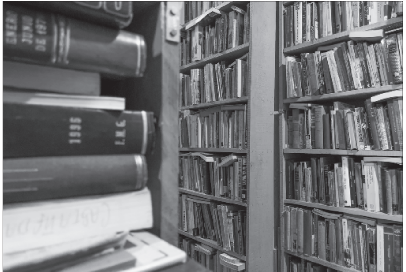
▲ Las librerías de viejo se encuentran en la calle Donceles, en el Centro Histórico de la CDMX, entre la antigua sede de la Cámara de Diputados y el cruce con República de Brasil, y pertenecen a una sola familia, los López Casillas.

Sin embargo, adquirir un incunable es complicado, pues “no son aptos para el bolsillo de cualquiera”. Son libros difíciles de conseguir y de mantener en oferta, sobre todo porque no cualquier persona entra a buscarlos directamente. Los principales consumidores son