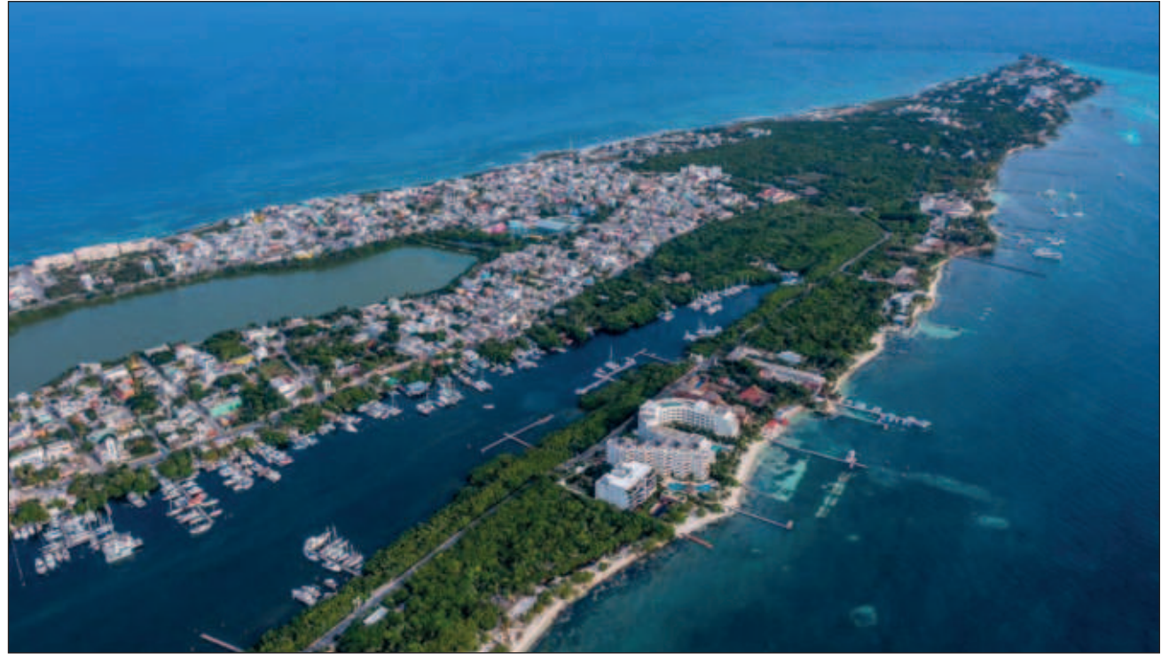
▲ La herramienta, publicada en el Periódico Oficial del Estado, permitirá que todas las acciones y programas contemplados para las islas tengan como eje central mejorar la calidad de vida de las personas.