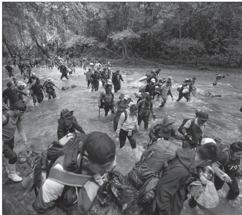
▲ De acuerdo con el informe del Ministerio de Seguridad Pública de Panamá, la mayoría de los viajeros irregulares que cruzaron la selva del Darién son venezolanos.

Además, añadió, "de ese grupo, 21 por ciento son niños, niñas y adolescentes; y de ellos, aproximadamente 51 por ciento son infantes de cinco años o menos".