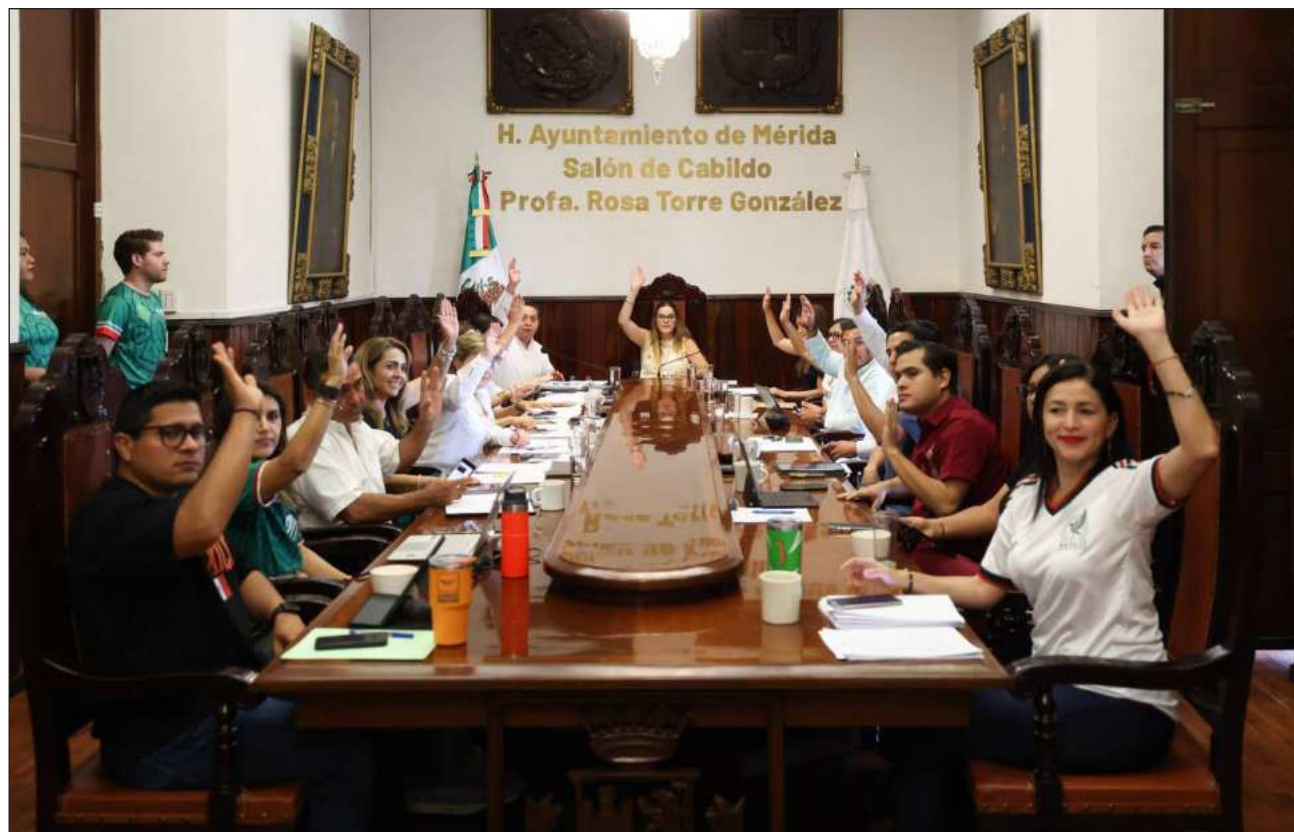
▲ Dentro de la misma aprobación de licitaciones se contemplan los parques de Las Américas Internet, Lindavista II y Juan Pablo II, así como la rehabilitación y construcción de calles, drenajes pluviales y acciones de vivienda.

“Se aprobaron convocatorias con 27 licitaciones públicas para la mejora de infraestructura de parques y espacios públicos en diversas colonias, concretamente a la intervención de áreas infantiles”, puntualizó la municipal.