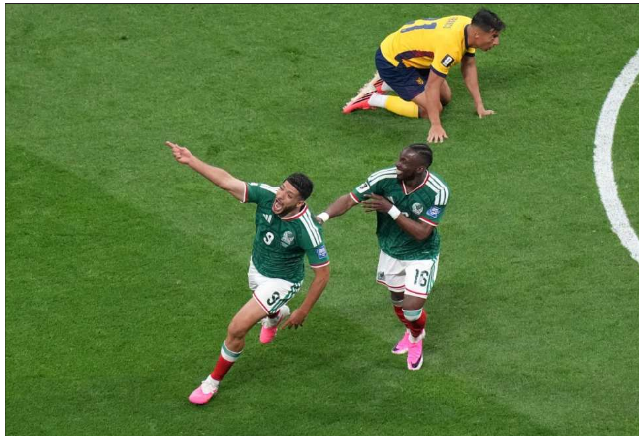
▲ En la segunda mitad, los mexicanos lograron controlar el resultado hasta el silbatazo final y administrar la tensión.

México se enfrentará en los octavos de final al ganador del cruce entre Inglaterra y Congo, que se medirán el miércoles en Atlanta.