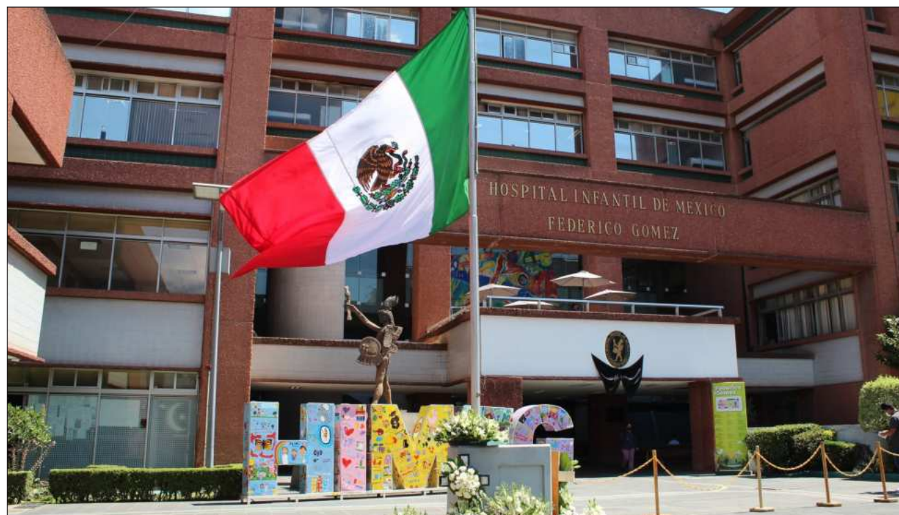
▲ Kershenobich precisó que los productos vencidos fueron identificados durante revisiones realizadas entre 2023 y 2024, aunque correspondían a distintos años, por lo que se busca reconstruir cómo se acumularon.

Cómo publicó La Jornada la semana pasada, entre 2020 y 2024 caducaron 18.4 millones de piezas de medi-