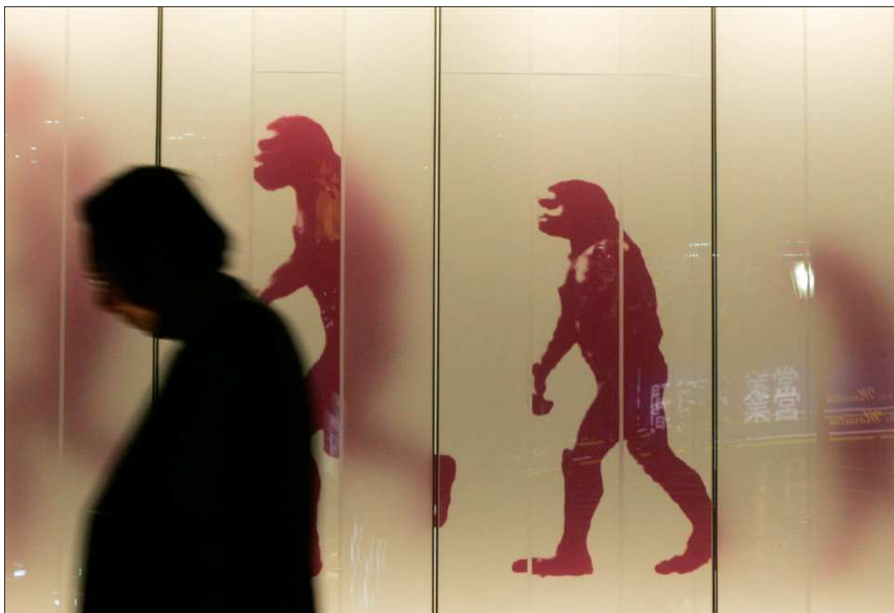
▲ La titular de la Secretaría de Ciencia, Humanidades, Tecnología e Innovación señala que México debe impulsar que en las escuelas “se enseñe no nada más que hay evolución y no creación de la vida en el planeta, sino cómo ocurre”.

Y hoy, a 165 años de su publicación, la teoría de la evolución es clave para entender el mundo que nos rodea, y de ahí la importancia, afirma Rosaura Ruiz Gutiérrez, de que niñas, niños y adolescentes la conozcan y entiendan el proceso de cómo se construye una de las teorías, “no sólo más importante de la biología, sino de toda la ciencia, porque nos explica de dónde venimos y cómo evolucionamos en el planeta”.