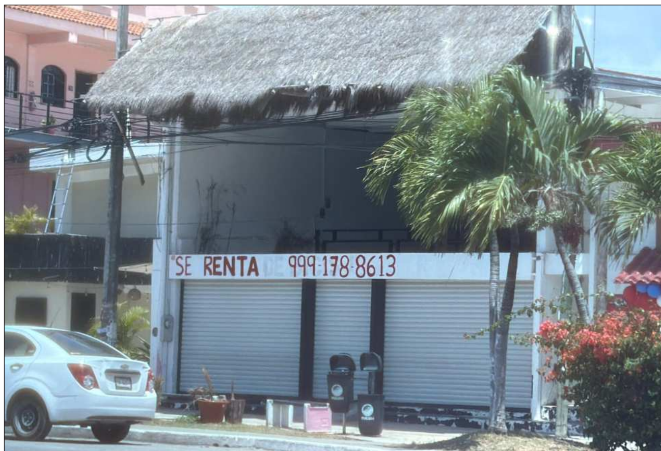
▲ La marcada desaceleración en proyectos y obras afecta notoriamente a tiendas de abarrotes, las cuales dependen en gran medida del consumo diario de trabajadores del ramo constructor, asegura la Canaco delegación Tulum.

El impacto ya alcanzó también al sector de la construcción, donde actualmente se percibe una marcada desaceleración en proyectos y