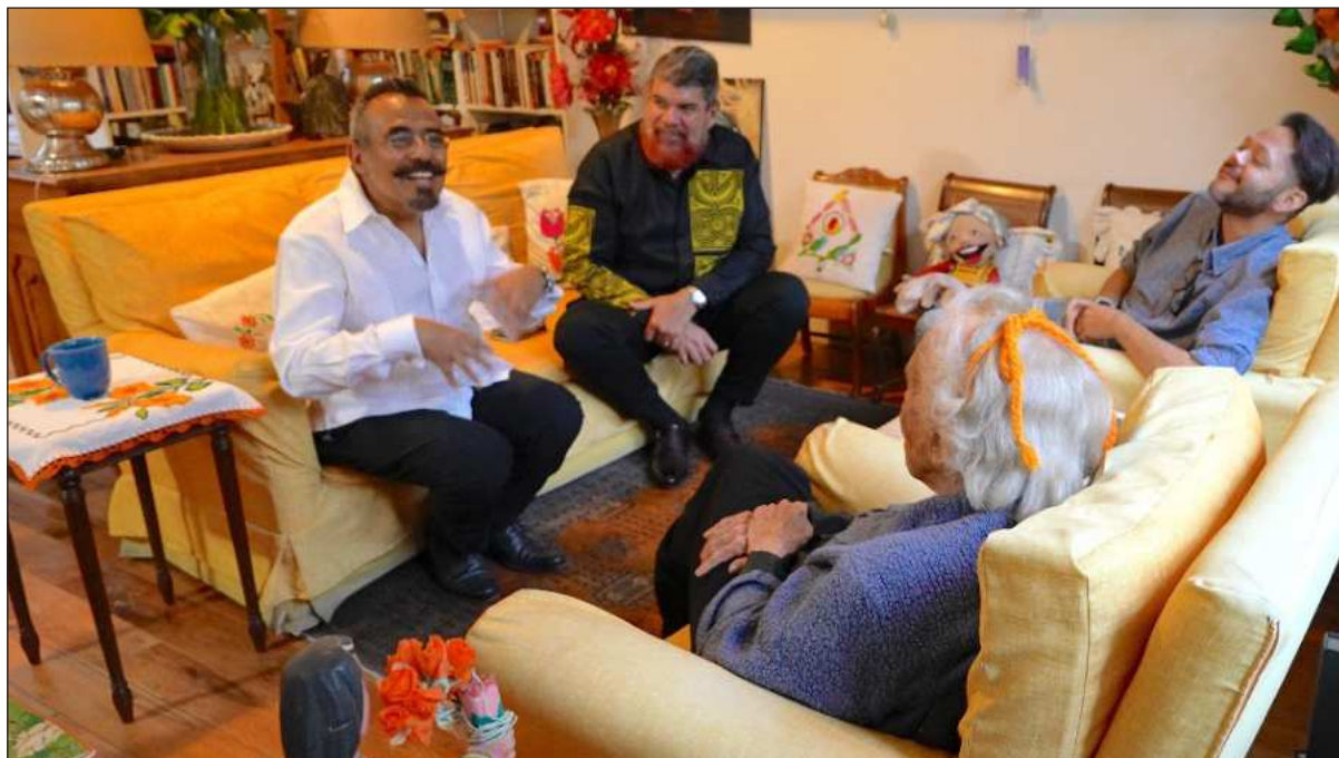
▲ "Queremos que la gente aprenda a narrar ante un público mediante nuestro foro internacional".

-Los cuentos de los argentinos Abelardo Castillo y Silvina Ocampo me encantan, porque