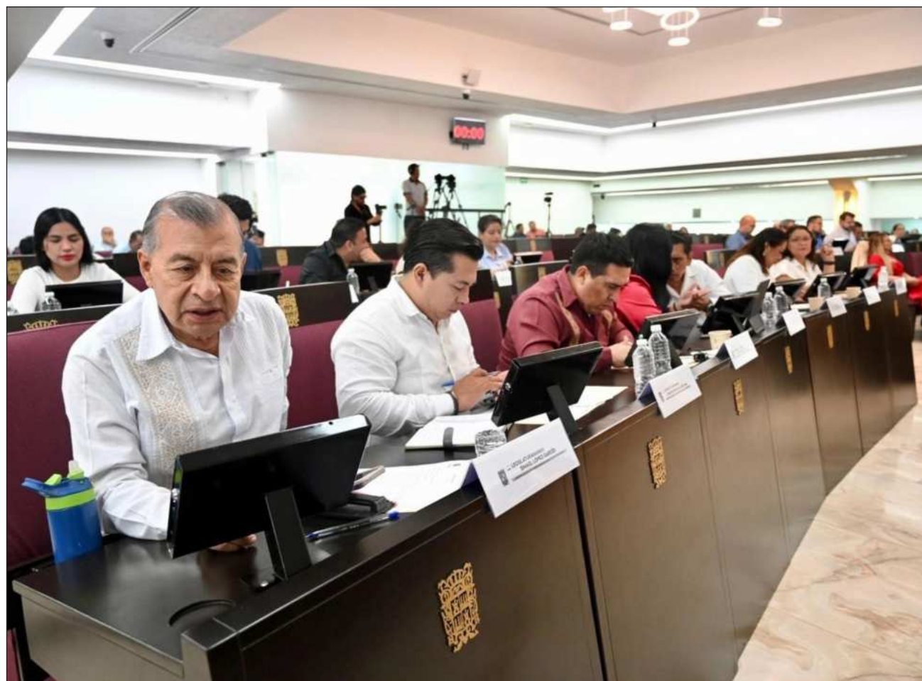
▲ Aún con el debate, la reforma tuvo mayoría relativa y se aprobó sin mayores inconvenientes.

Con estas modificaciones se busca que la ciudadanía cuente con mayores elementos para participar en la elección de quienes impartirán justicia y que el desempeño de dichos cargos esté sujeto a procesos continuos de evaluación y mejora institucional.