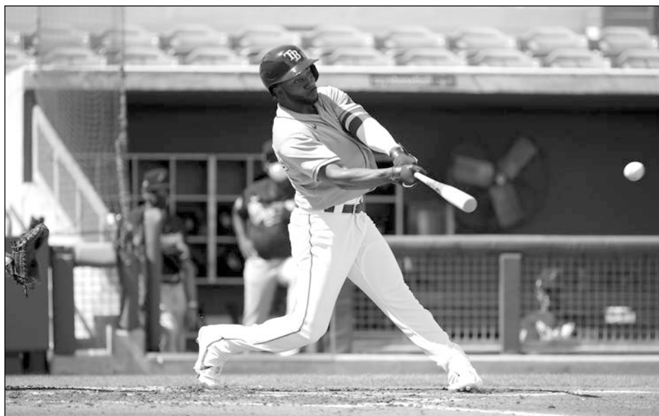
▲ Randy Arozarena conecta un sencillo, ayer en Port Charlotte, Florida.

Escuchar a las Mantarrayas hablar de lo que puede lograr Arozarena hace que pareciera como si los sistemas de proyecciones subestimaran sus habilidades – y los cambios físicos