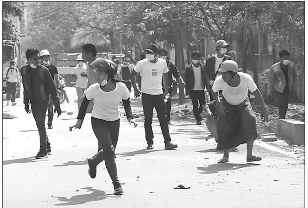
▲ La Oficina del Alto Comisionado de la ONU pidió a las fuerzas militares cesar la violencia en contra de los manifestantes birmanos.

Aún así, la AFP no pudo confirmar el balance de la ONU con una fuente independiente.