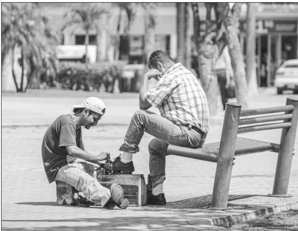
▲ La caída en el movimiento económico también llega a los boleadores, que solían tener clientela entre docentes y obreros de Pemex.