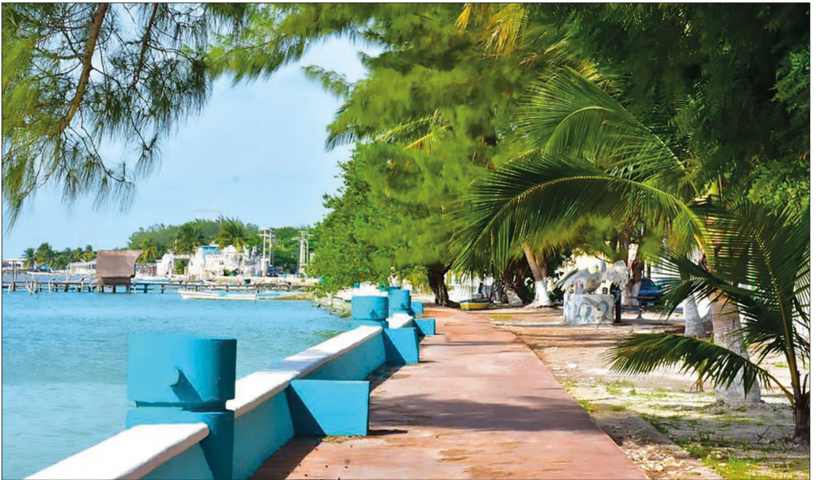
▲ Isla Aguada se convierte en uno más de los destinos que ofrece Campeche para disfrute de los turistas.