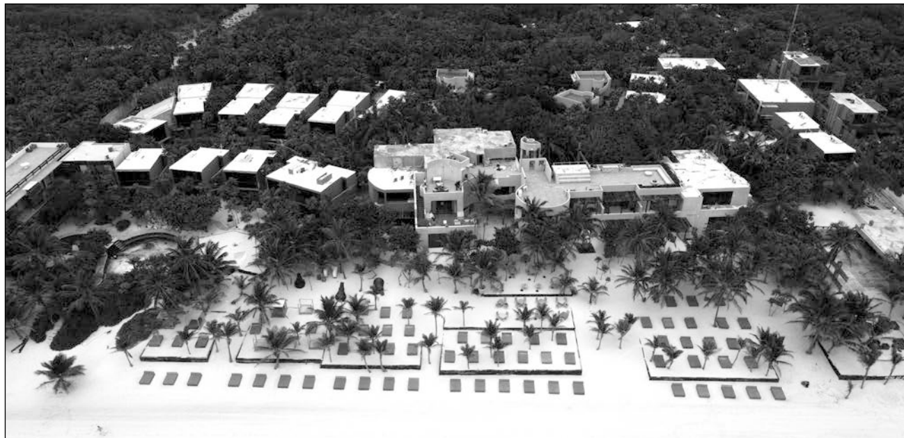
▲ Para Fonatur, es necesario que el éxito de Tulum se refleje en la calidad de vida de los trabajadores.

En el caso de Tulum, dijo, debe integrarse a un esquema de formulación de alternativas de crecimiento acelerado, partiendo del hecho de que es un lugar ya impactado: “Debemos generar nuevos territorios cer-