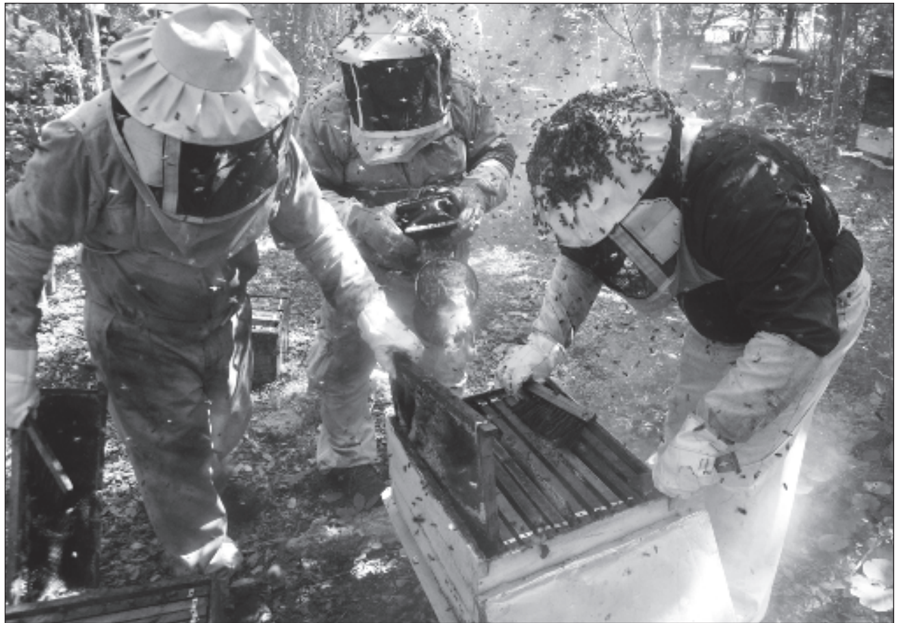
▲ La vinculación de la muerte masiva de las abejas con fumigaciones agrícolas de todo tipo en la región maya de Los Chenes se suma a la larga lista documentada por apicultores en años anteriores y en este 2024.

El comunicado establece que 56 por ciento de los sitios cerca de las colmenas conte-