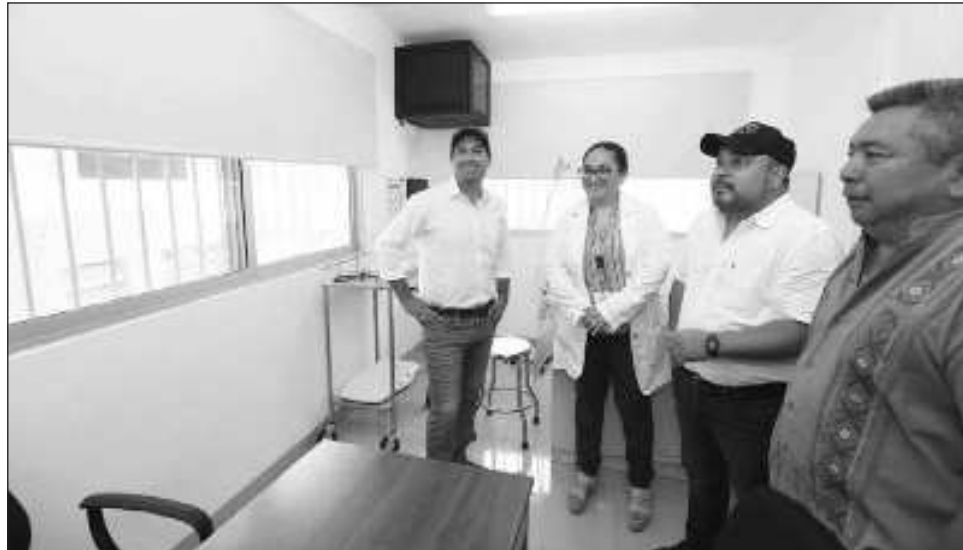
▲ El gobernador Mauricio Vila Dosal sostuvo que "seguiremos mejorando la salud y la calidad de vida de las familias hasta el último día".

"Estaremos haciendo una gira de aquí hasta que terminemos la administración por los 140 Centros de salud, despidiéndonos y agradeciendo a las y los yucatecos por la confianza entregada,