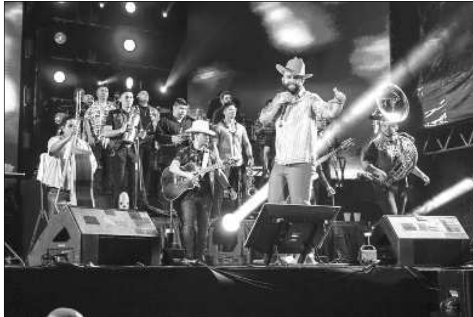
▲ El artista y compositor sonorenses cantó la noche del lunes sus mayores éxitos ante más de 25 mil personas reunidas en la plaza 28 de Julio.