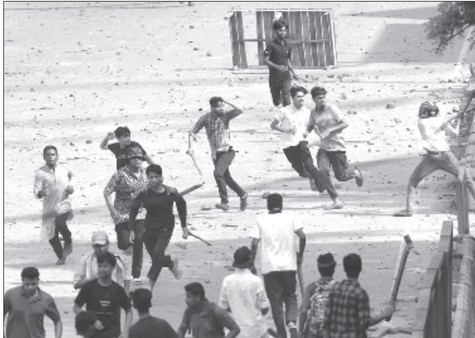
▲ De acuerdo con los reportes de la prensa local, los enfrentamientos dejaron un saldo de tres muertos, dos eran estudiantes y el tercero un transeúnte.

Los manifestantes alegan que esas cuotas son discriminatorias y que la selección debe basarse en méritos. Algunos incluso señalan que el sistema actual beneficia a grupos que apoyan a la primera