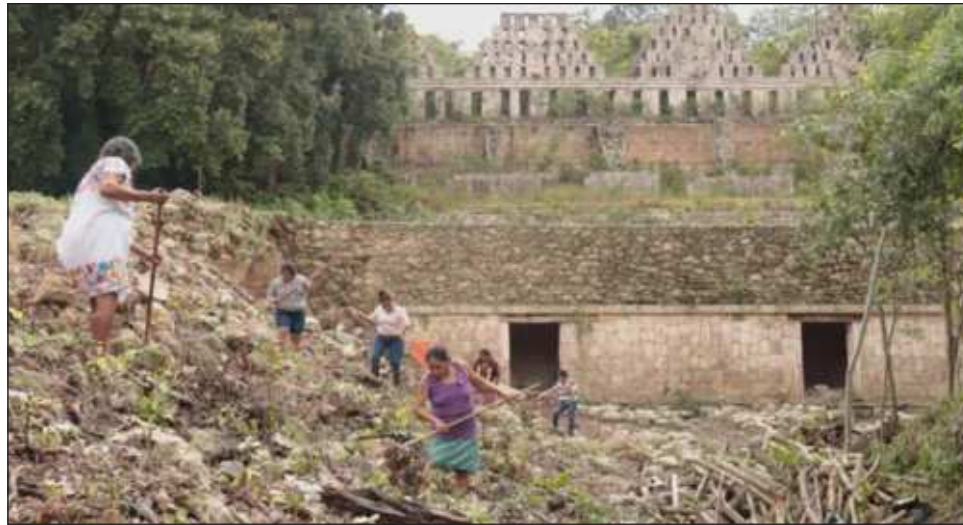
▲ Las mujeres cuentan a sus familias, en particular a sus hijos, que esa esplendorosa zona fue edificada por sus antepasados. Es lo que hicieron nuestros abuelos, nuestros ancestros, afirman.

Ella y otras mujeres de su poblado se han sumado a un proyecto en el que son partícipes de trabajos arqueológicos de ese antiguo sitio maya, ubicado en la región conocida como el Pucc, la cual floreció en el periodo