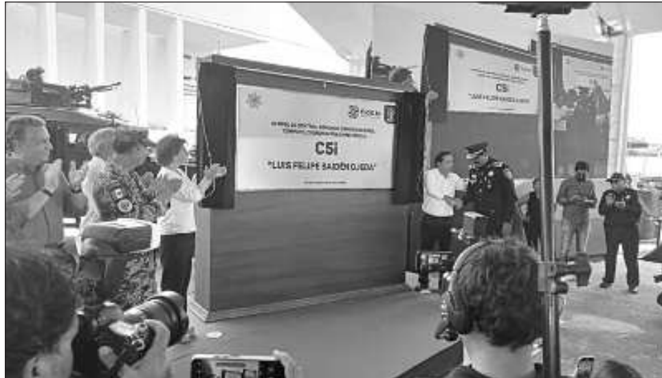
▲ En reconocimiento a la labor del titular de la SSP, Luis Felipe Saidén Ojeda, el gobernador Mauricio Vila Dosal dio al C5i el nombre del funcionario.

Tras develar la placa conmemorativa, el mandatario