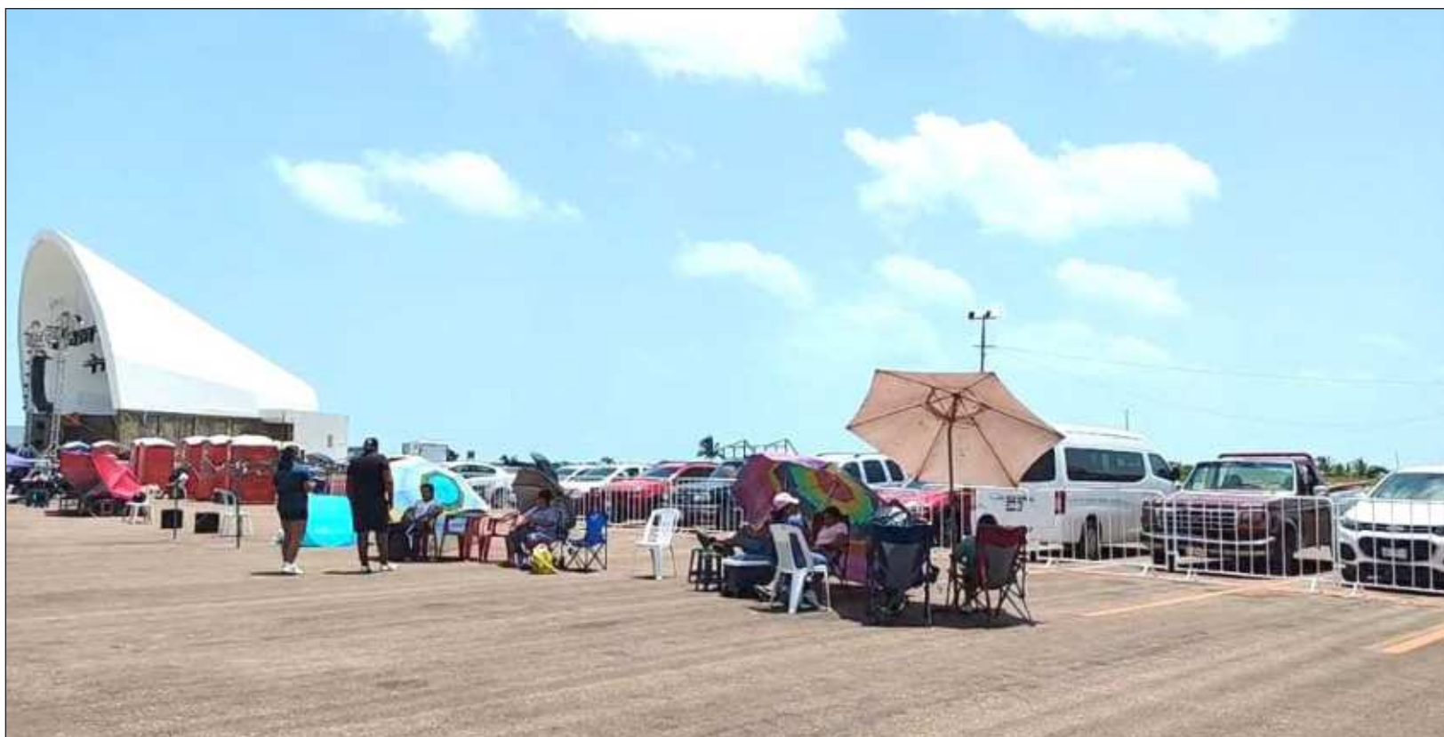
▲ Aun cuando las autoridades informaron que el área de sillas será abierta, cerca de las 19 horas del miércoles, los fans ya se habían apostado para ser los primeros en ingresar.