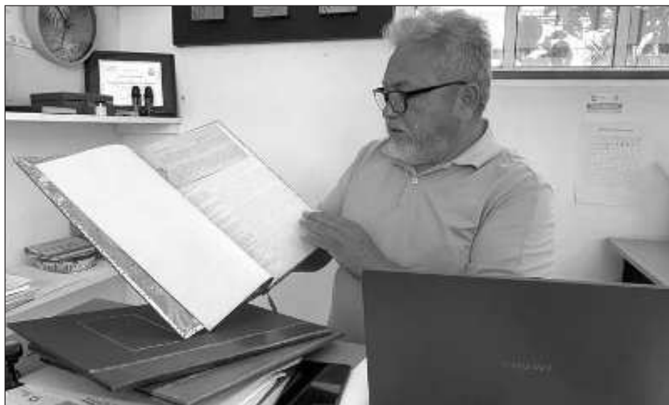
▲ El recinto, que se inaugurará dentro de la Casa de la Cultura de Tulum en octubre próximo, tendrá información acerca de la historia del noveno municipio y del estado.