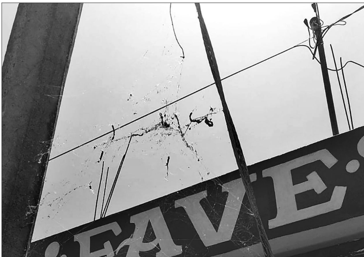
▲ Las telarañas de la especie tetragnatha superaron la vegetación costera y ahora pueden ser observadas en colonias del centro de la capital quintanarroense.

Al no existir más la Comisión de Límites de las Entidades Federativas del Senado, se realizó el resguardo de los expedientes formados con los documentos referentes a los casos de conflicto sobre límites territoriales considerándose como asuntos concluidos, entre los que se encuentran los referidos expedientes de las controversias constitucionales 9/97 y 13/97.