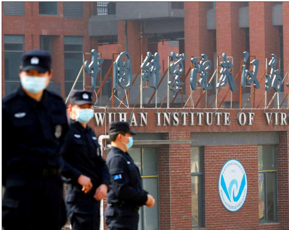
▲ El virus habría escapado accidentalmente del Instituto de Virología de Wuhan .

El equipo llegó el 14 de enero a la ciudad de Wuhan, considerada como la ciudad epicentro de la pandemia, y, tras dos semanas de cuarentena, visitó lugares como el mercado mayorista de mariscos de Huanan, donde se produjo el primer grupo de infecciones conocido, así como el Instituto de Virología de Wuhan.