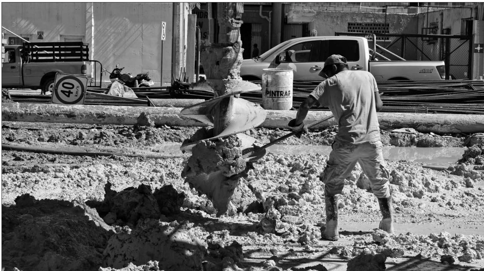
▲ La falta de capital foráneo en las entidades que componen el sur-sureste es una de las razones que explican el rezago económico que arrastra la región.