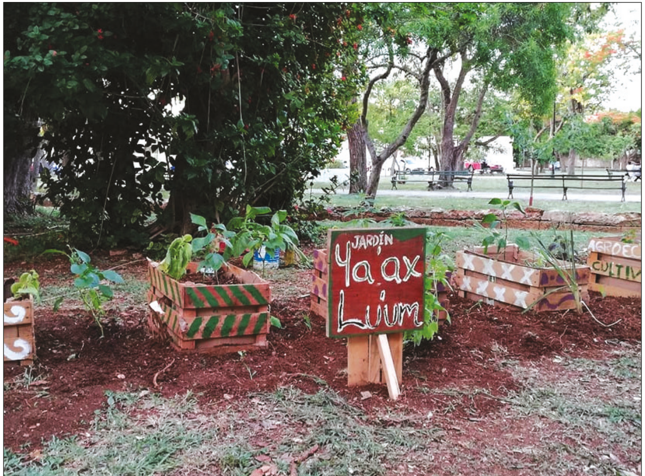
▲ El objetivo de la manifestación fue exponer un agrosistema alimentario y medicinal, asociado con especies de uso tradicional, para que la sociedad conozca la planta de cannabis.

El fin fue exponer un agrosistema alimentario y medicinal, asociado con especies de uso tradicional, que se pueda replicar en los jardines públicos de los diferentes parques de la ciudad de Mérida y de los municipios en el estado de Yucatán, para que la sociedad conozca e identifique la planta de cannabis en un sistema de huerto comunal, tradicional o urbano.