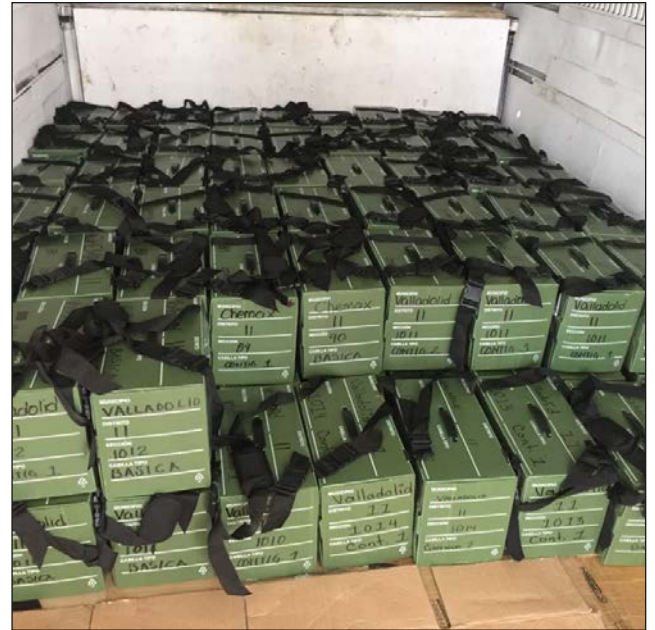
▲ Desde hoy, los paquetes electorales estarán en manos de los presidentes de casilla.

El silencio electoral incluye la actividad en redes sociales, por lo cual los partidos o candidatos deberán suspender cualquier tipo de acto proselitista que tuviera como fin promover su candidatura durante ese periodo previo a la jornada electoral.