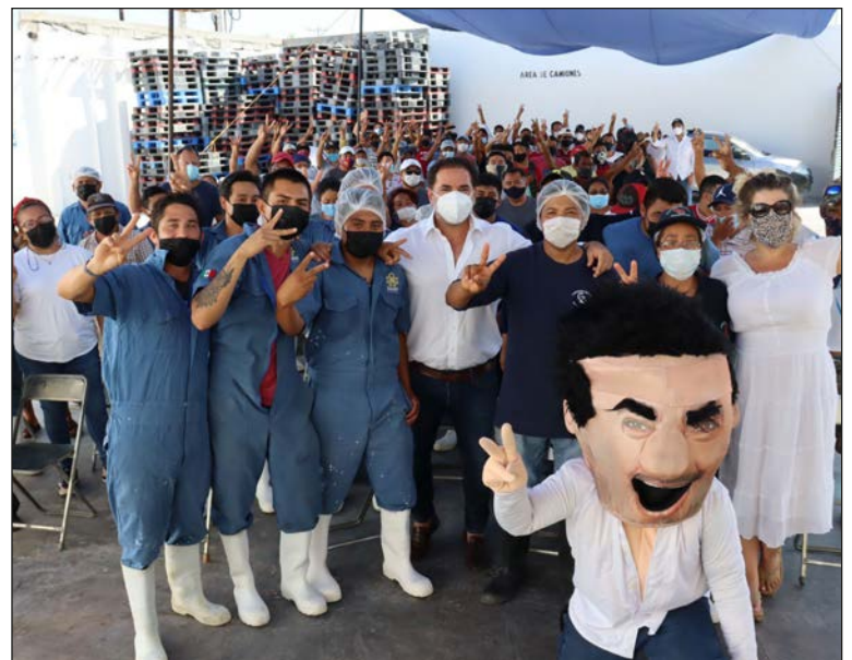
▲ A los trabajadores del mar se les ofreció un esquema de empleo temporal en época de veda.