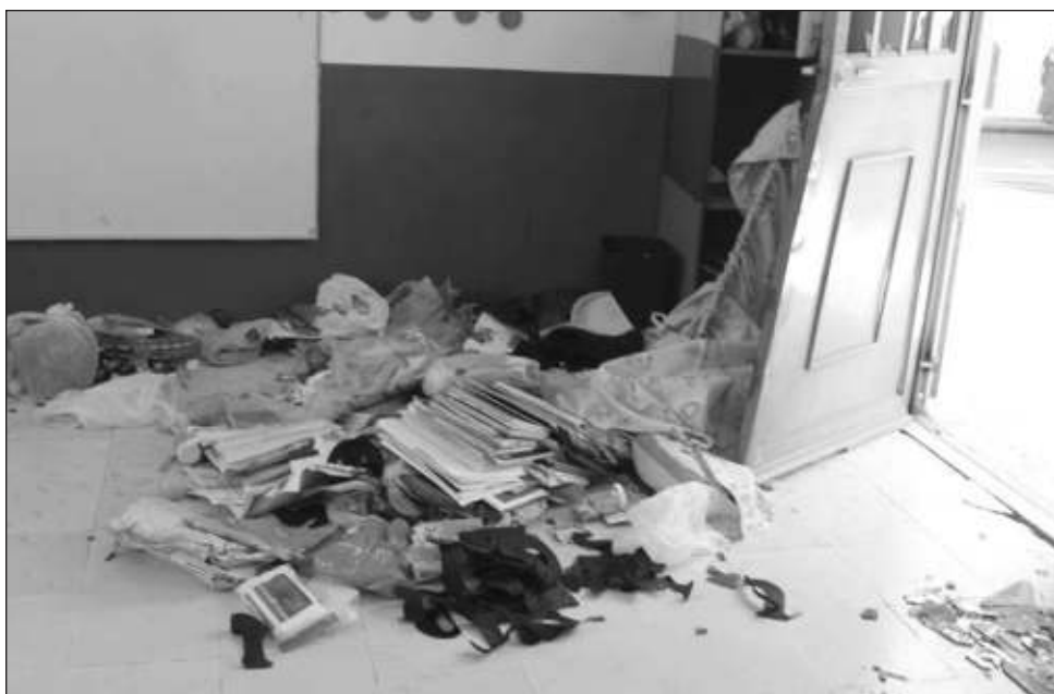
▲ Durante el confinamiento, alrededor de 200 escuelas fueron vandalizadas; la mayoría de ellas se encuentra en el municipio de Carmen .