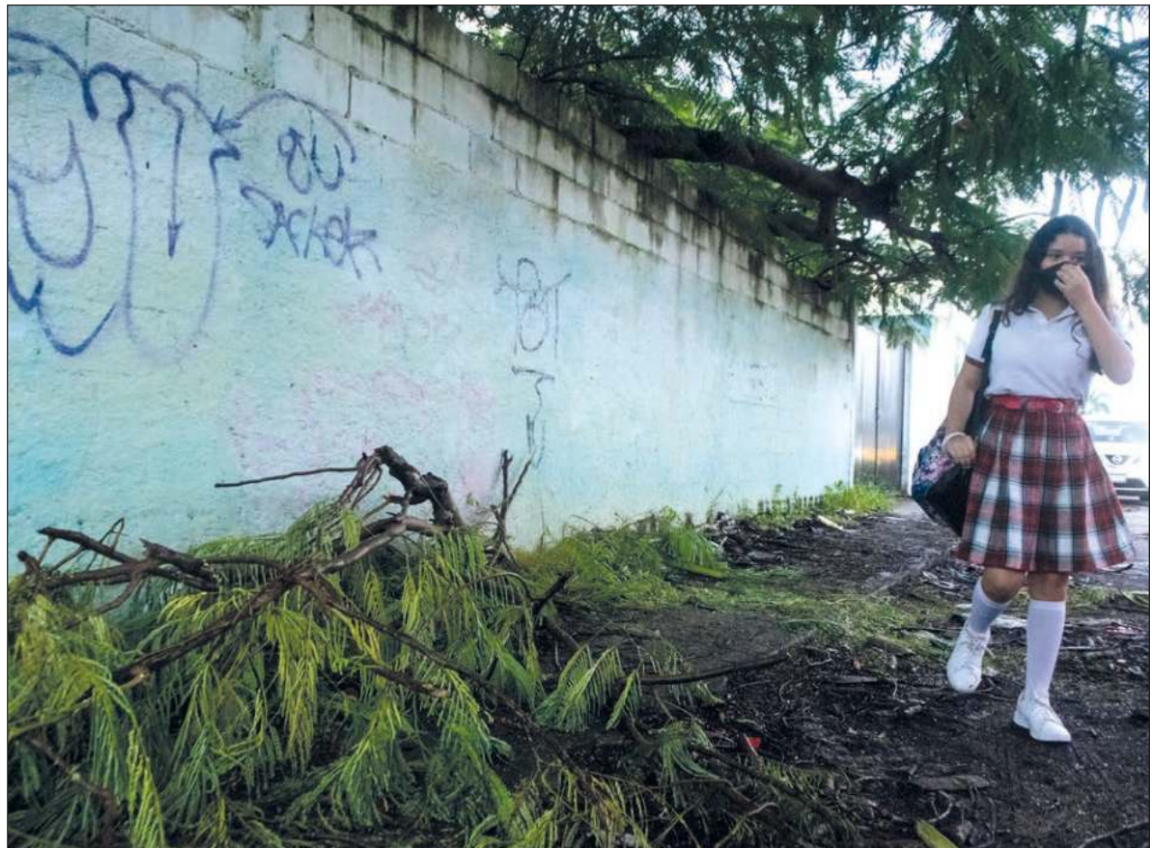
▲ Buscan generar mecanismos que contribuyan a la erradicación de la violencia contra las mujeres en el ámbito educativo.

A pesar de las cifras, dijo, las mujeres no denuncian por miedo a represalias o a poner en duda su palabra, además de la falta de atención adecuada y con perspectiva de género; es entonces que “surge la necesidad de implementar mecanismos de atención para los delitos cometidos contra mujeres y que son de suma importancia para crear espacios más seguros para que las alumnas, docentes, investigadoras y trabajadoras puedan desarrollarse libremente”.