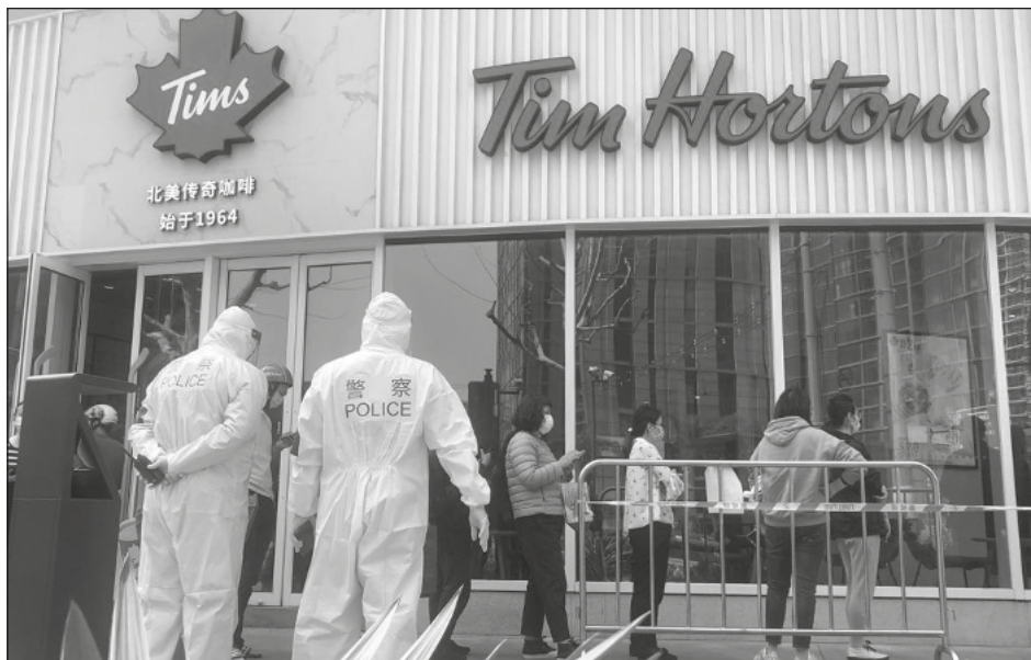
▲ El total de contagios globales desde el inicio de la pandemia hace más de dos años supera los 480 millones.

En una reserva indígena en un bosque del norte de Minnesota, cerca de la frontera con Canadá, Kautz tuvo que acostarse boca abajo en la nieve y arrastrarse por la