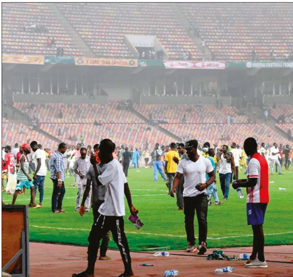
▲ Los fanáticos lanzaron objetos tanto a la pequeña porra del equipo visitante, Ghana, como a los propios jugadores.

William Troost-Ekong empató desde el punto de penalti, pero los locales salieron cojeando de la contienda con una tibia segunda parte en la que rara vez amenazaron la portería visitante.