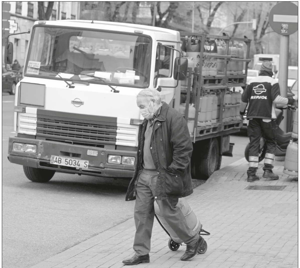
▲ El conflicto armado entre Rusia y Ucrania ha desnudado la falta de control de los gobiernos sobre el mercado de los energéticos.

LAS PROTESTAS EN las calles de las principales ciudades de Europa por el encarecimiento del gas y la energía eléctrica son cada vez más frecuentes y duras. España, Italia, Portugal y Grecia formaron un frente común para exigirle a la Unión Europea medidas urgentes