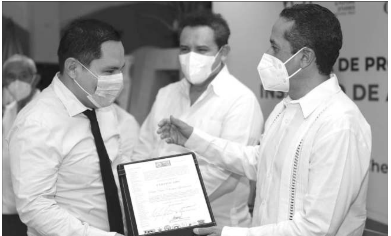
▲ En el evento se entregaron reconocimientos a funcionarios que cursaron el posdoctorado de la Academia Internacional de Ciencias Político-Administrativas y Estudios de Futuro.

El BIPE evalúa la calidad y el cumplimiento en el desglose de información presupuestal, tomando en consideración que la información esté disponible de forma pública, que se garantice el acceso a esta información por medios electrónicos, que se publiquen de forma oportuna y en formatos de datos abiertos, así como que se certifique que la información sea legible y desglosada en apego a la normatividad aplicable.