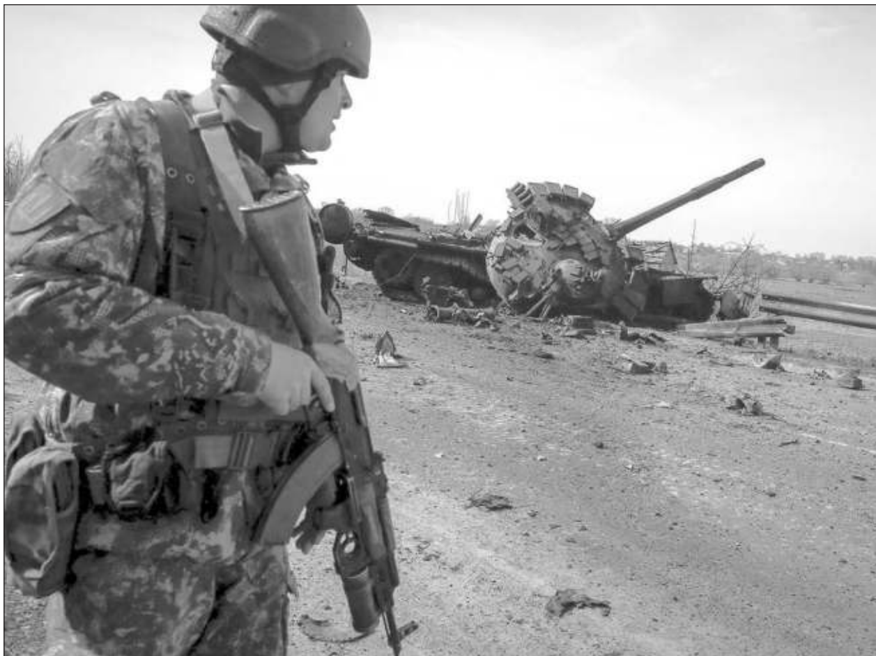
▲ En las negociaciones que tuvieron lugar en Estambul para un alto el fuego, Rusia se comprometió a reducir significativamente sus actividades en Kiev y la ciudad de Chernihiv, aunque la noche del martes se registraron ataques en ambos lugares.

En total, más de 10 millones de ucranianos, una cuarta parte de su población, han dejado sus casas.