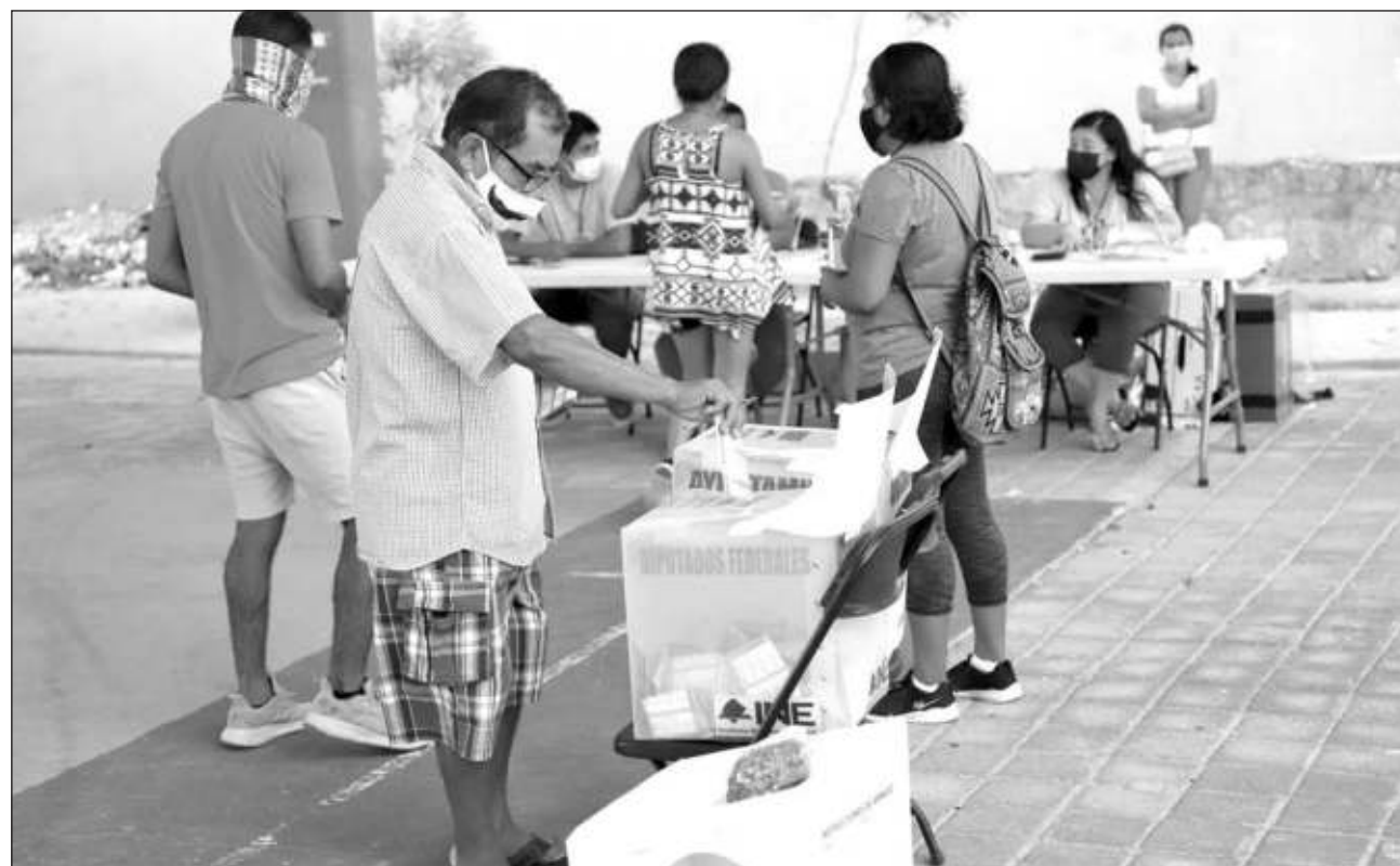
▲ El objetivo de www.quintanarooovota.com es generar cultura cívica y compromiso de la emisión del voto en cualquier elección.

Buscan difundir en medios digitales la página web www.quintanarooovota.com para conocimiento de todos los habitantes de Quintana Roo, la cual tendrá la información relevante de los candidatos, links oficiales sobre la elección a gobernador y diputaciones locales del 5 de junio 2022, los compromisos de