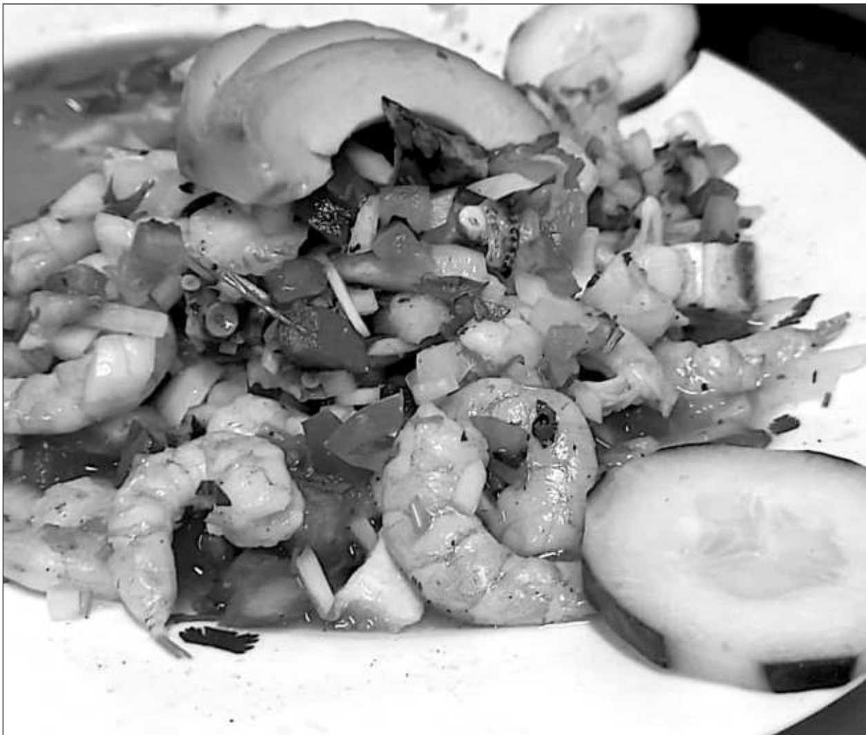
▲ Algunos negocios han optado por sustitutos artificiales del limón, mientras que otros reducen las porciones del fruto en los platillos.