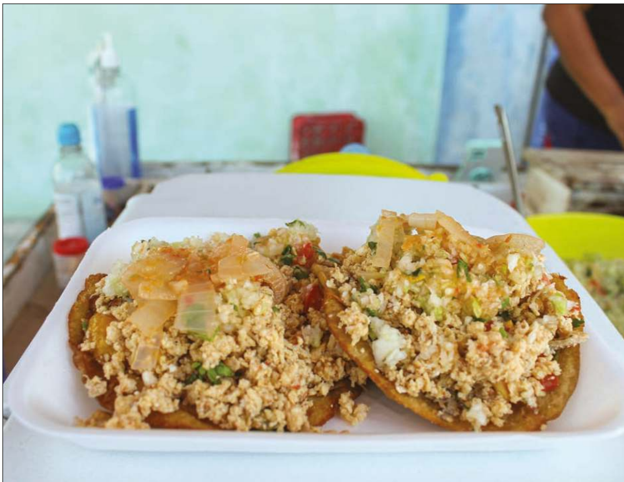
El taconucho se prepara con un panucho en lugar de tortilla, al que se le agrega cualquiera de los platillos mencionados para los tacos.