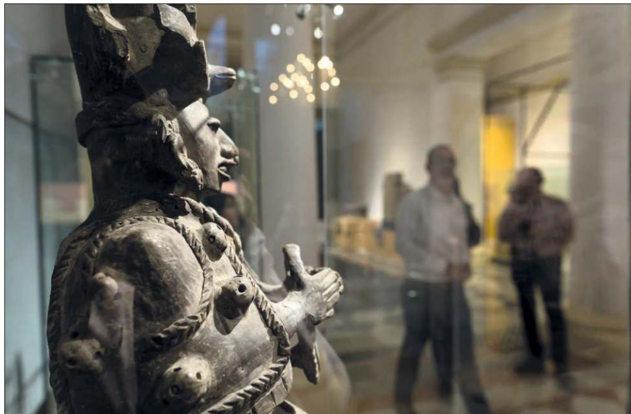
▲ El director de Cultura hizo extensiva la invitación para que los espacios culturales enclavados en el centro histórico, como teatros y galerías, puedan sumarse con propuestas diferentes a La Noche Blanca .

El cuidado de la salud es otro de los aspectos obligatorios que se tomará en cuenta en la programación de las actividades. "Aún no tenemos certeza cómo vamos a