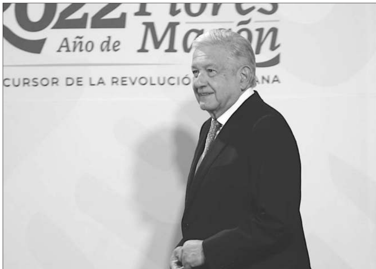
▲ Andrés Manuel López Obrador adujo que la propuesta de reforma electoral se centrará en federalizar la organización de todos los procesos electorales.

Todas las actividades que se realicen ambos días de festejo son de entrada gratuita.