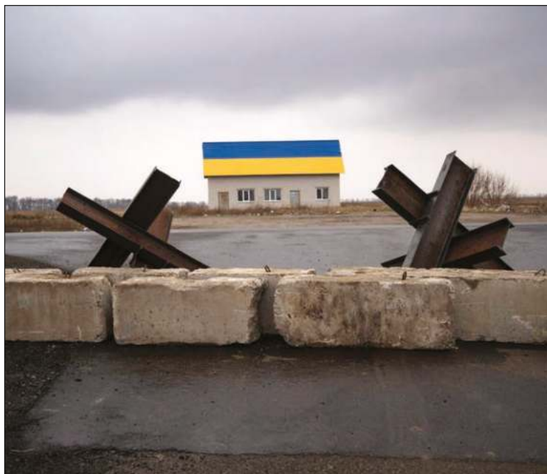
▲ La guerra en Ucrania ha generado que el sector militar y sus empresas tengan un boom en las bolsas. En la imagen, barricada antitanque en el pueblo de Malaya Alexandrovka, cerca de Kiev.

Por lo pronto, la mayoría de los países de la Unión Europea anuncian la ampliación de sus presupuestos militares.