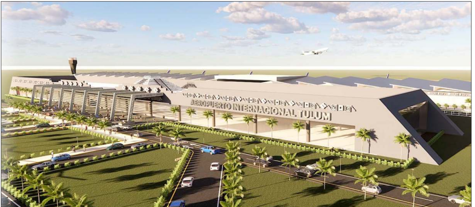
▲ El aeródromo va a construirse muy cerca de Tulum aunque el terreno está en el municipio de Felipe Carrillo Puerto.