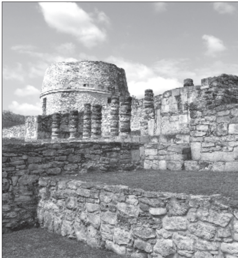
▲ "Habitantes y ejidatarios tomaron la decisión de tomar el camino de entrada a Mayapán y cerrar el acceso hace casi un mes".

re electrónico, así como el nombre de un presunto antropólogo y guía de turistas.