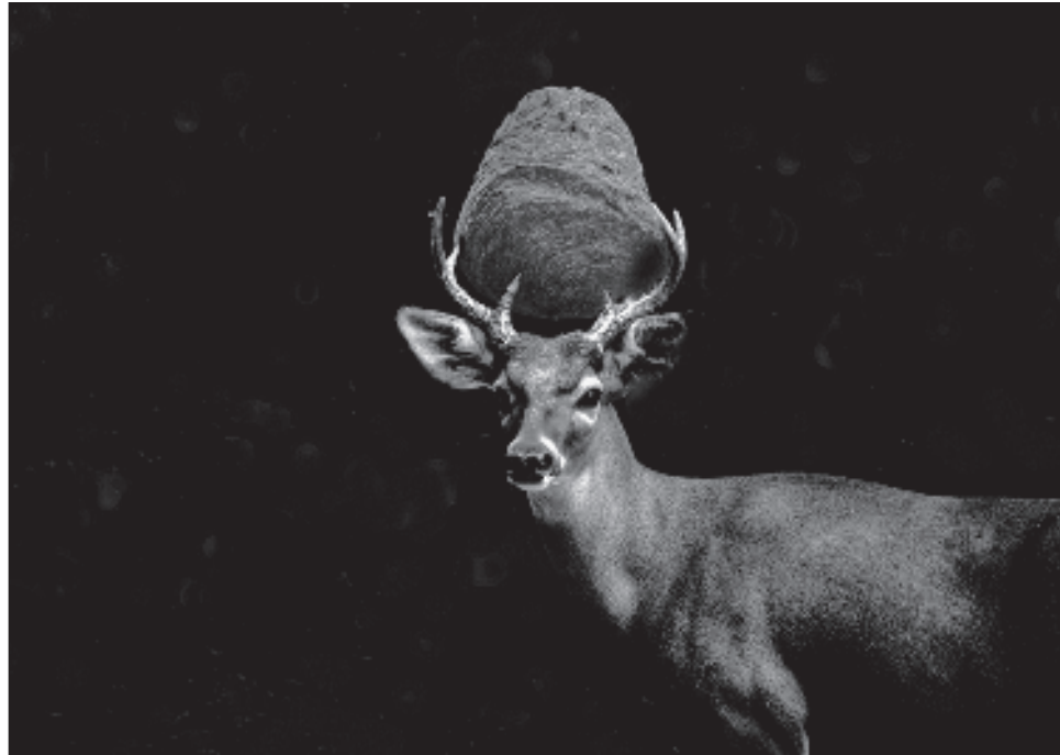
▲ Mediante 20 fotografías en blanco y negro, Yeeb Sáastun trata de poner sobre la mesa "qué pasará con el mundo maya si vendemos el territorio en el cual habitamos".

Cuando el sáastun está opaco -señaló- significa que hay una persona enferma o hay algún mal presagio, refiriéndose al cre-