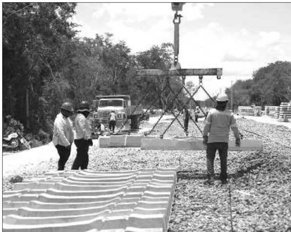
▲ El jefe del Ejecutivo remarcó que los tramos 5 a 7 fueron complicados, sobre todo por el cuidado de los cenotes, ríos y cavernas, además de la cascada de amparos contra el proyecto.

"Esto fue lo que más nos costó trabajo, porque se conservaron cenotes, ríos subterráneos, lo que no se hizo antes, que se daban permisos