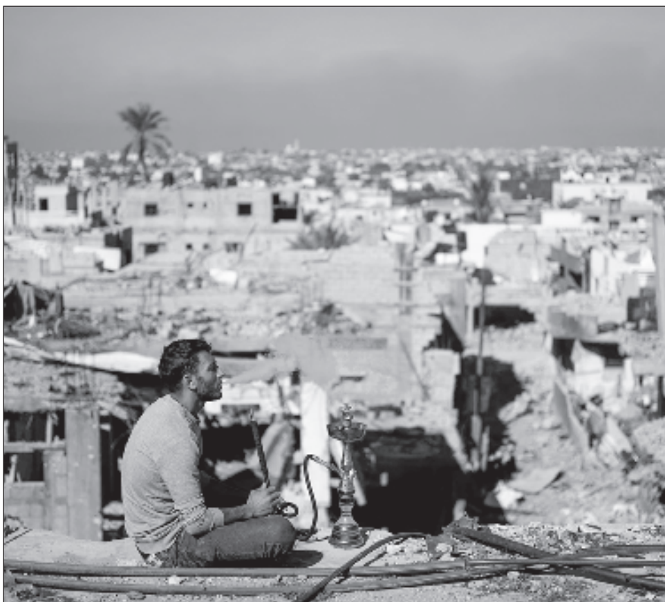
▲ Los ataques iniciaron el 7 de octubre, con una incursión de milicianos islamistas que mataron a mil 200 personas en Israel, en gran mayoría civiles, y secuestraron a otras 240.

Los ataques iniciaron el 7 de octubre, con una incursión de milicianos islamistas que mataron a mil 200 personas en Israel, en gran mayoría civiles, y secuestraron a otras 240, de acuerdo el balance israelí.