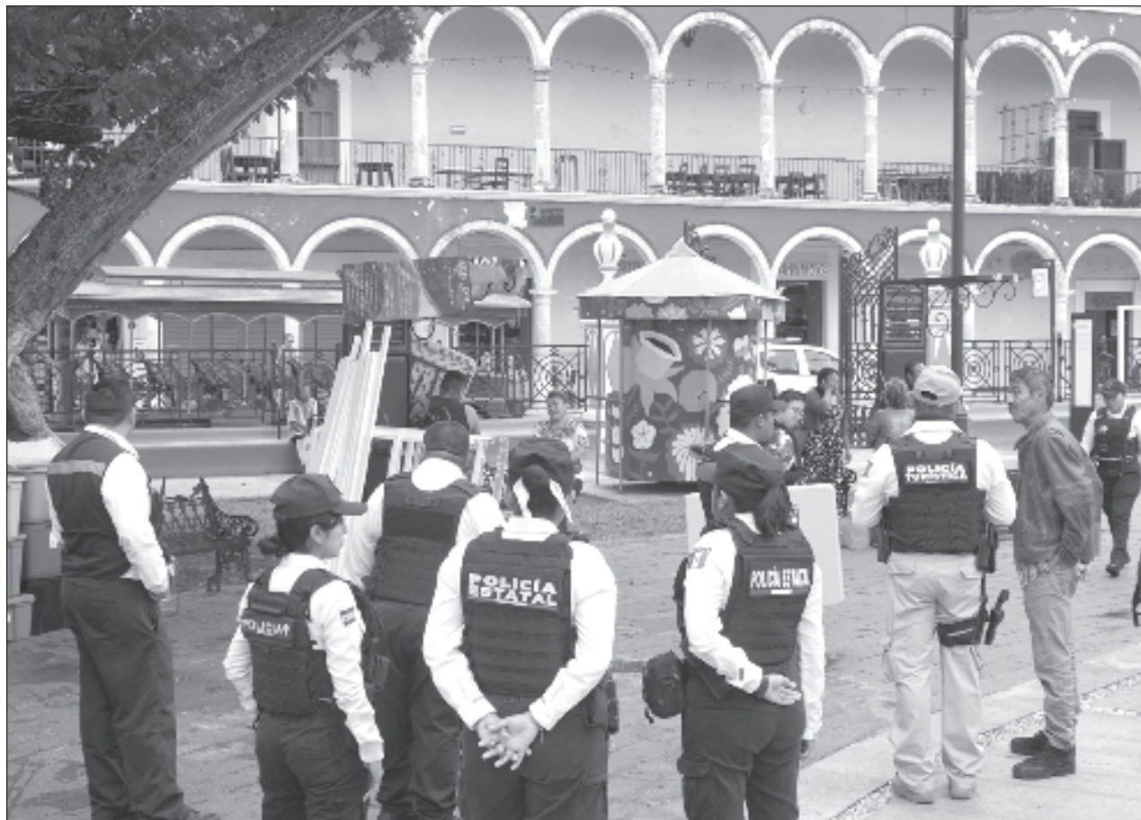
▲ La Secretaría de Protección y Seguridad Ciudadana del estado desalojó a comerciantes bajo el argumento de que necesitan otro tipo de permiso, y advirtieron que será hasta enero cuando puedan atender este incidente con las artesanas.

Díaz May dijo que a lo largo de los años de presencia de Pemex en la zona, son múltiples los derrames, más aquellos que se han logrado ocultar y los que se minimizan al argumentar que son chapopoterías naturales. "Pemex cuenta con los recursos para financiar los supuestos estudios que realizan para demostrar su inocencia, pero es evidente que existe un daño".