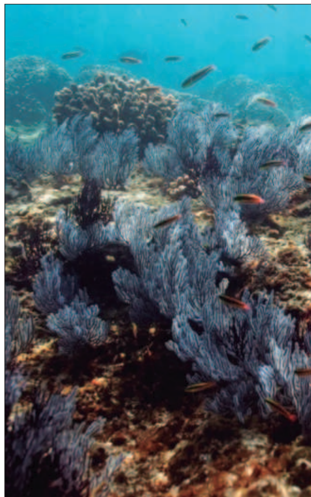
▲ Desde mediados de junio se vio el blanqueamiento en los arrecifes coralinos de Huatulco, donde está 100% afectado.

De proseguir esta tendencia, destacó, estamos ante la posibilidad de que este fenómeno sea uno de los más intensos que ha habido y esto se manifiesta con las corrientes de chorro, los nortes y las tormentas fuertes en elevadas latitudes.