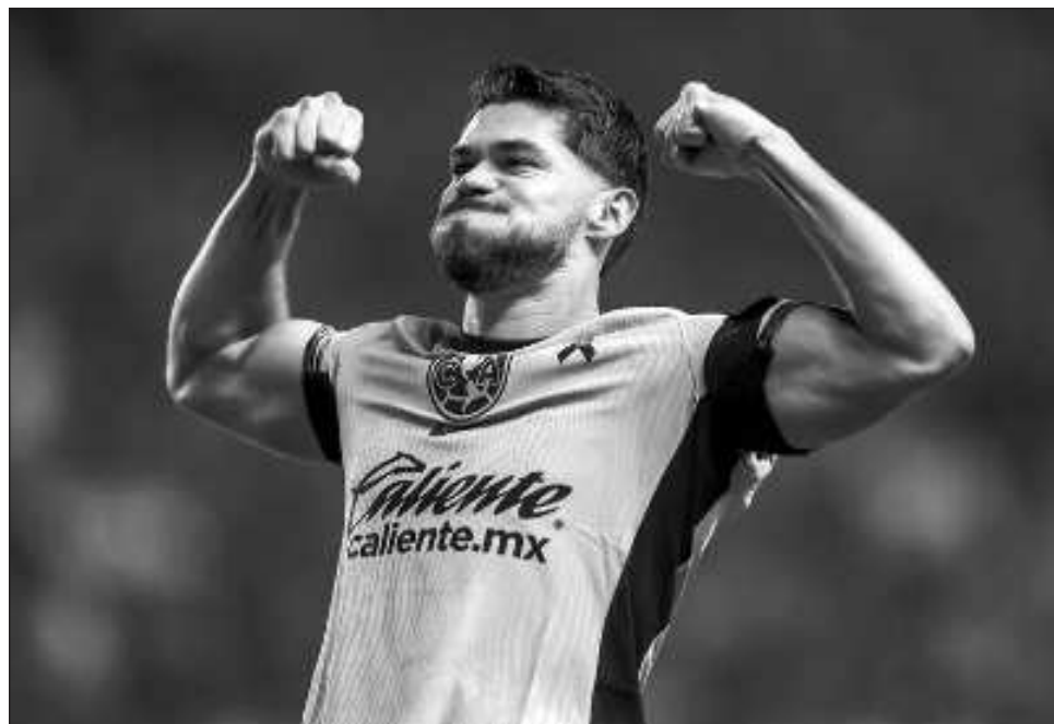
▲ Con dos goles de Henry Martín, las Águilas obtuvieron un valioso empate en la carretera.