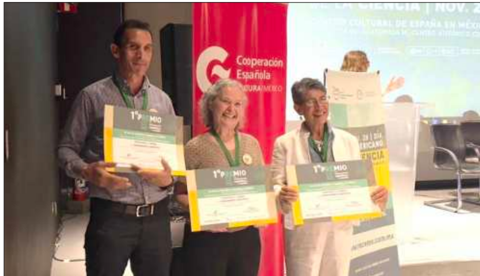
▲ El Pasaporte al camino del conocimiento científico busca la divulgación a nivel nacional, sobre todo en zonas rurales de México. Actualmente atiende a cerca de 7 mil niños, niñas y adolescentes.

Desde el Centro Cultural de España, en la Ciudad de México, la investigadora del Cinvestav Mérida destacó