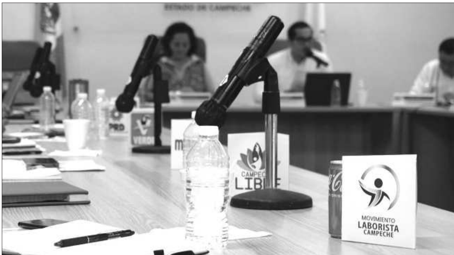
▲ "El chapulineo confunde a los votantes, atropella la meritocracia partidista, es una clara muestra del maquiavelismo imperante —el fin justifica los medios— y denigra la política al evidenciar que no existen ideales ni valores".