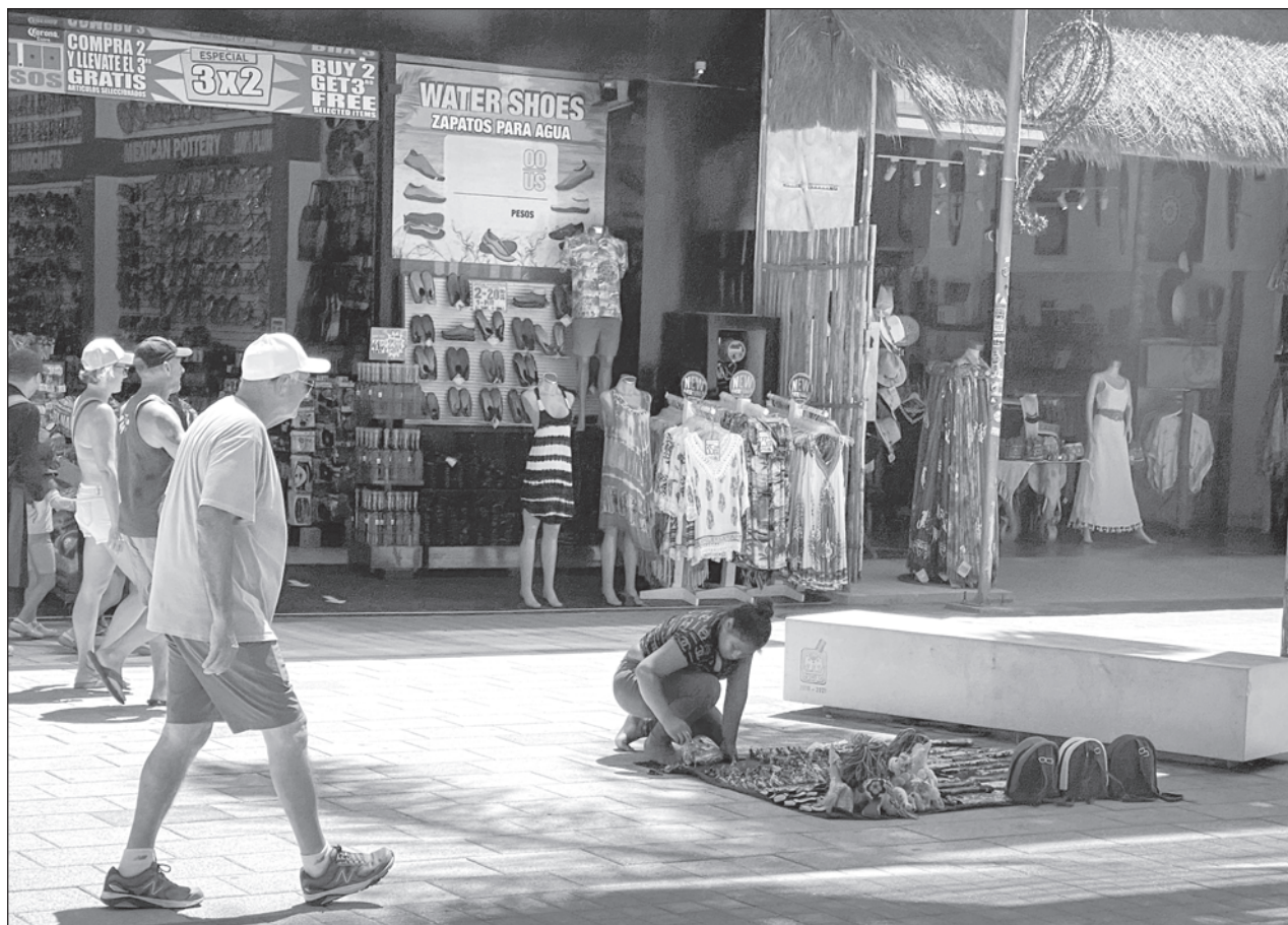
▲ Representantes de proyecto AccioNNAr dieron a conocer que Quintana Roo bajó algunos lugares a nivel nacional, ubicándose con 6.95%, contra 10.2% el año pasado, muy debajo de la media nacional, que es 13.1%.

La vigencia del título de asignación será por tiempo indefinido, y sólo concluirá cuando se acredite fehacientemente que ya no existe causa de utilidad pública, interés público, interés general, interés social que salvaguardar, o por razones de seguridad nacional que la justifiquen.