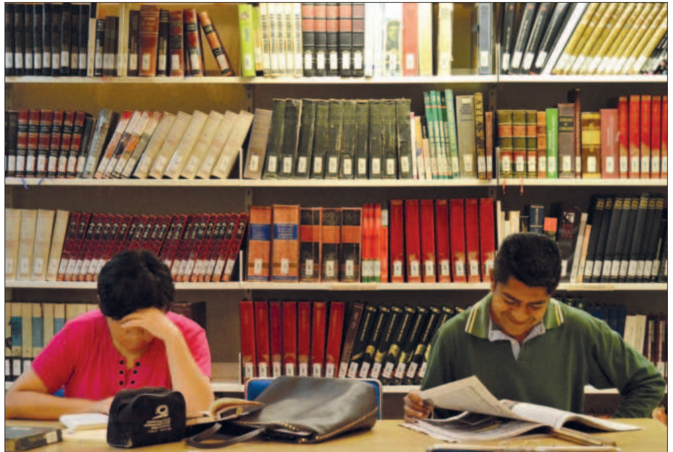
▲ Te'e xookilo'oba' táaka'an xan ti'al u ka'anal maayat'aan..

Tu tsikbaltaje', yáax ba'ax k'a'abéet u beeta'ale', leti' u ts'íibtik u k'aaba' mák ti' Internet, ts'o'oke' je'eb tu k'iinil 13 ti' noviembre, yéetel yaan u k'a'alal tak 2 ti' enero ti' u ja'abil 2024; beyxan, tu saasilkuunsaje', k'a'abéet kex ts'oka'an u xookil séekundaryáa ti'al