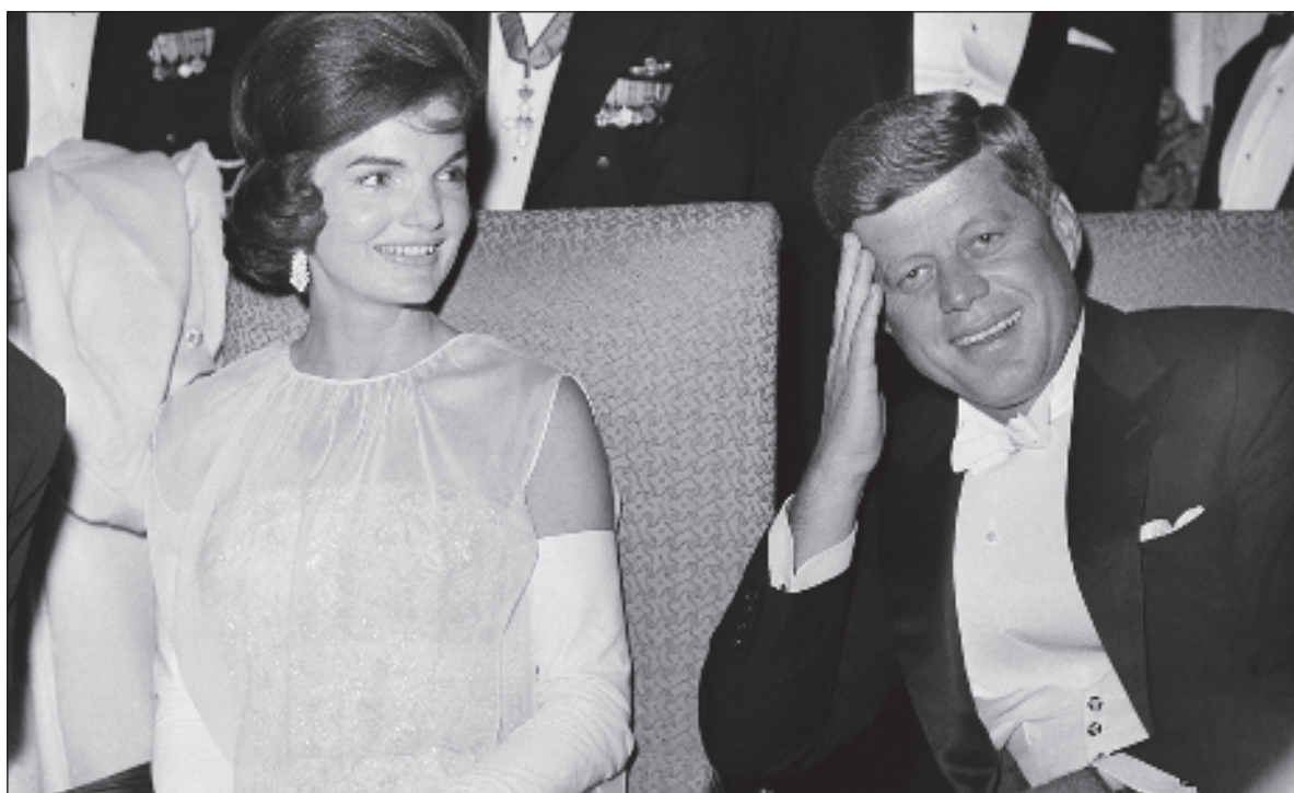
▲ "Kennedy's dream of a shining city on a hill continues to move many of us of the 60's generation who view this vision as an ideal to be sought in a world fraught with violence and injustice".

ANOTHER POSITIVE PERCEPTION of the times were JFK's words in favor of racial and social justice at a time when segregation reigned in the South and severe racial tensions existed in major American cities.