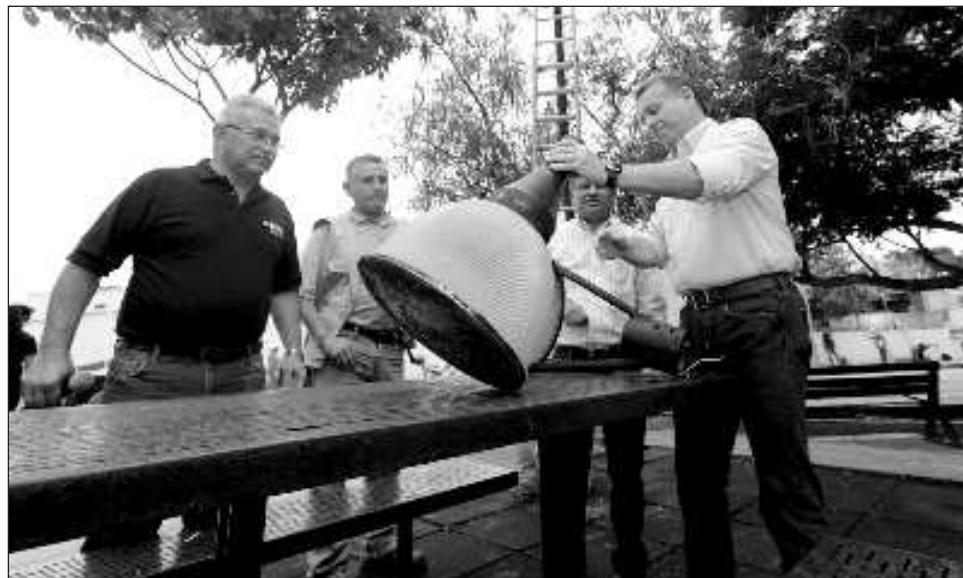
▲ Con la supervisión integral en Los Reyes el ayuntamiento inicia el cambio a luminarias de tipo led en 70 parques, campos deportivos y unidades deportivas del municipio.

“Hay que recordar que el cambio de lámparas de alumbrado público convencionales a led inició al principio de la actual administración municipal, co-