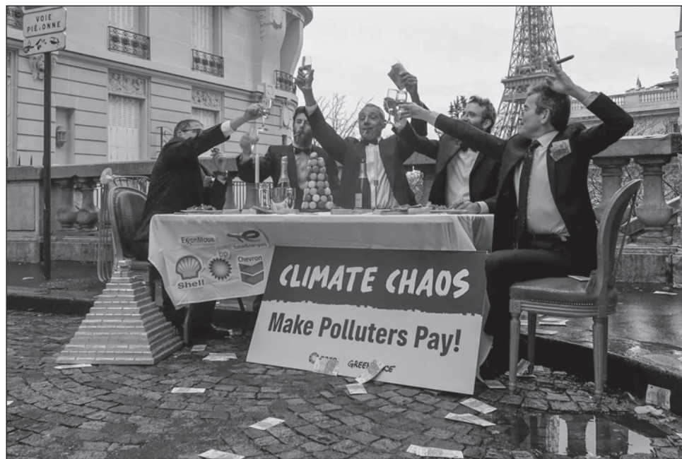
▲ Los numerosos documentos revelados por Centre for Climate Reporting y la BBC contenían menciones de las dos compañías que dirige Sultan Ahmed Al Jaber, Adnoc y la empresa de energías renovables Masdar, las cuales se usaron en reuniones con casi 30 países.

Pero los numerosos documentos revelados el lunes por el grupo de investigación Centre for Climate Reporting y la BBC lo ponen en duda. Los archivos, transmitidos por un "denunciante", son informes destinados a Al Jaber donde aparecían