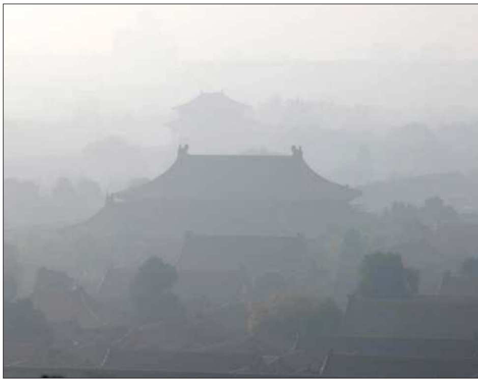
▲ El carbón genera la mitad de la dispersión de CO 2 en el país asiático.

El carbón genera la mitad de emisiones de CO 2 de