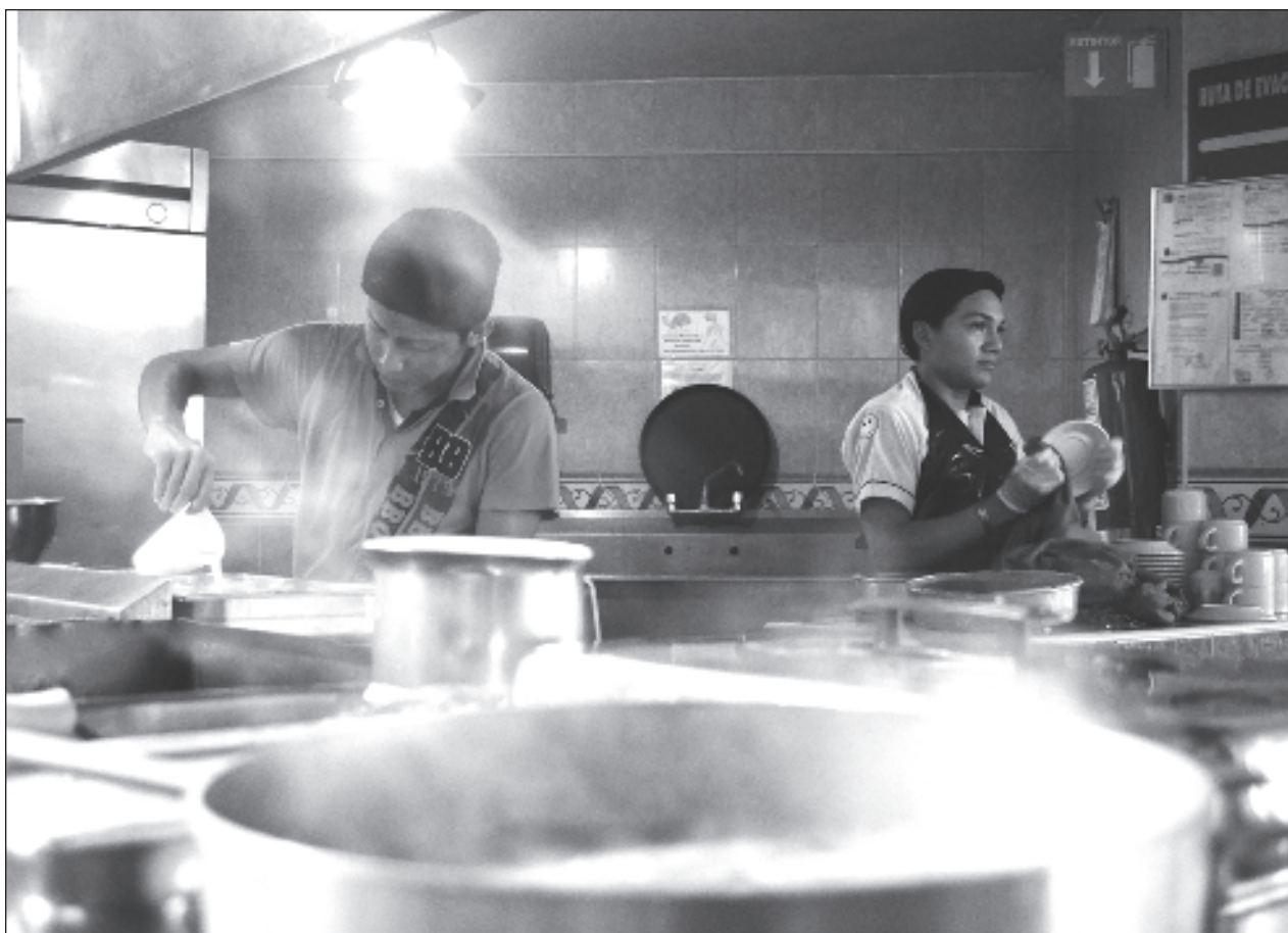
▲ El Instituto Mexicano para la Competitividad también advierte que en todas las ciudades examinadas, al menos 60 por ciento de la población adulta percibe que en su gobierno hay prácticas de corrupción frecuentes.