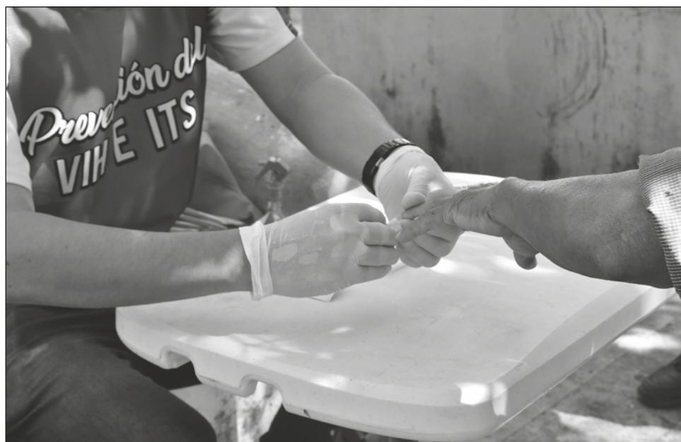
▲ Tener pruebas y medicamentos que controlan al VIH ha sido resultado de cuarenta años de lucha e investigación.

A 40 años de la aparición de los primeros casos de la enfermedad y con motivo del Día Mundial de Lucha contra el Sida, que se conmemora el 1° de diciembre, ambos recuerdan lo vivido. Desde las trincheras que