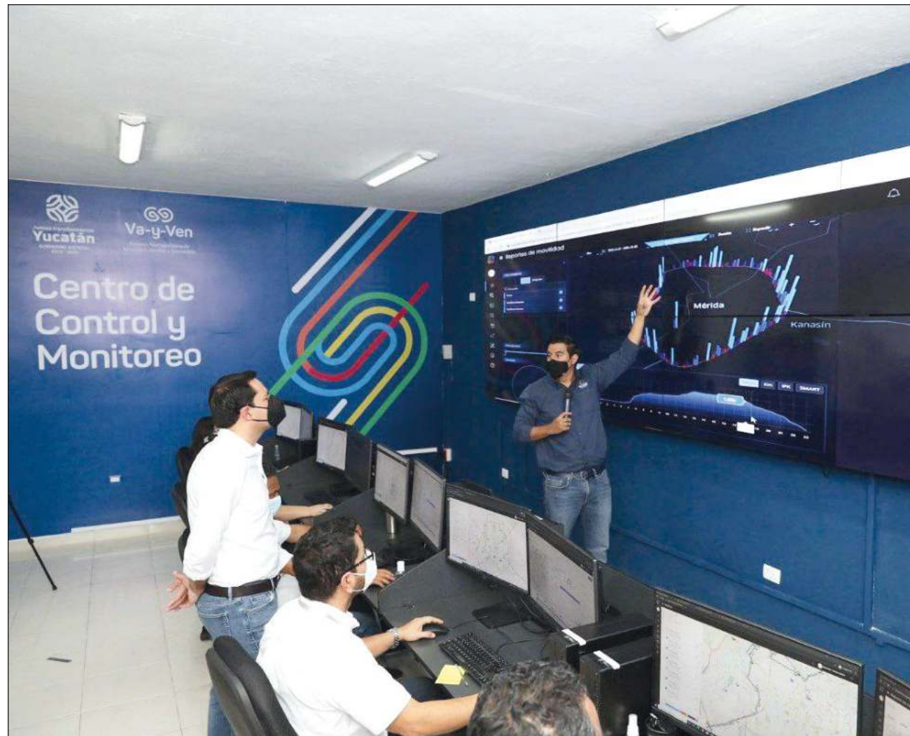
▲ Como resultado del área de monitoreo, han definido que por las mañanas haya 20 camiones en circulación, mientras que por la tarde solamente 14.

Por las mañanas hay 20 camiones en circulación, mientras que por la tarde solamente 14, pero este sábado al darse cuenta de que la afluencia de pasaje continuaba incluso en la tarde, decidieron regresar todas las unidades a las labores.