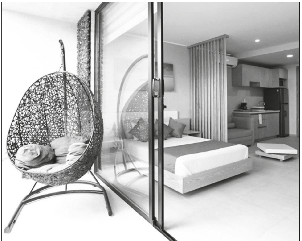
▲ A través de la plataforma Monific es posible invertir en inmuebles desde mil pesos.

“Los destinos del norte de Quintana Roo son lugares donde la tendencia sigue siendo al crecimiento, en Tulum en especial ahora hay mucha expectativa, 80 por ciento de los huéspedes son extranjeros y eso ha sido gracias a la promoción de boca en boca. Ahora con temas como el aeropuerto y el Tren Maya siguen siendo muy atractivos para la inversión y se ve la tendencia al alza”, recalcó Agmon.