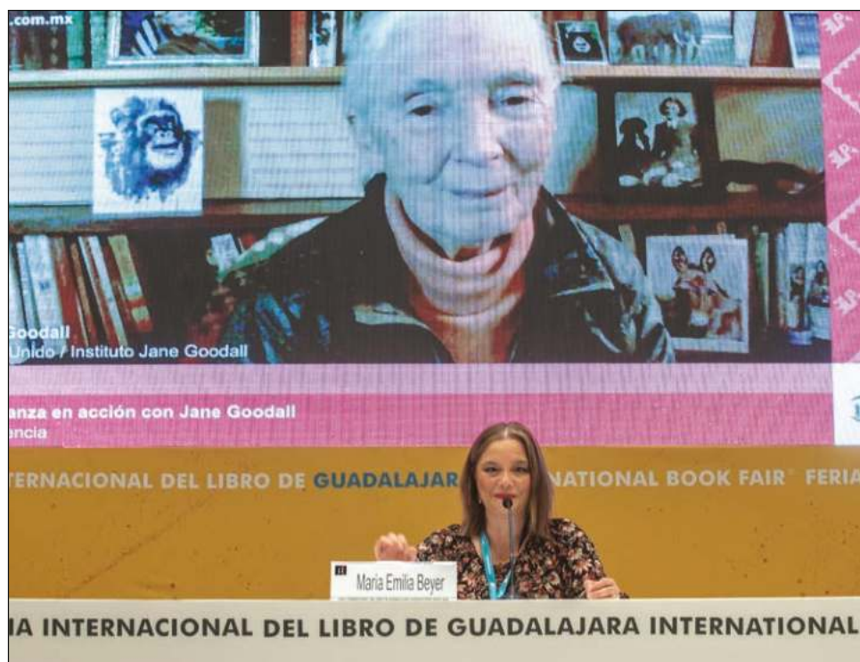
▲ La inglesa Jane Goodall, reconocida por su trabajo con chimpancés en Tanzania, participó vía remota en la Feria Internacional del Libro de Guadalajara.

Como parte del programa FIL Ciencia, la etóloga conversó vía remota con jóvenes, quienes la cuestionaron acerca del