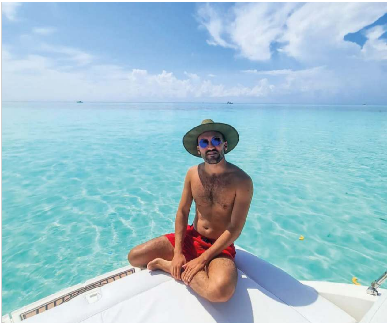
▲ Tenemos una gran responsabilidad como promotores y debemos educar a nuestro público de qué forma podemos gozar de un destino, indica @sebitastrip.

Y aunque es un apasionado de viajar por todas las playas de México principalmente, reconoce que el Caribe mexicano tiene un turismo bien desarrollado y adaptado, que facilita a todos los viajeros su experiencia, a lo que ayuda mucho la cantidad de demanda que tiene en comparación con otros destinos: “viajar por el Caribe mexicano es muy cómodo y fácil”.