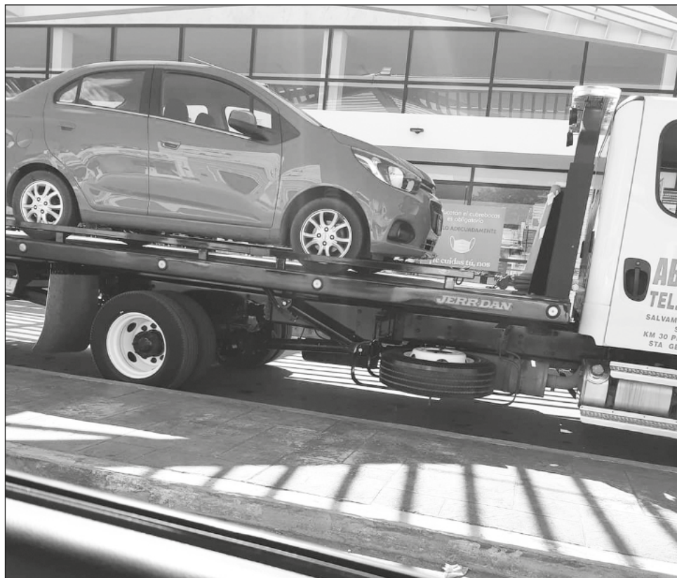
▲ En la central de autobuses ADO es frecuente la detención y decomiso de vehículos de plataformas. Diariamente se llevan entre cinco y seis autos.

“Nos explicó cómo viene la regularización y vemos que hay varios puntos que proba-