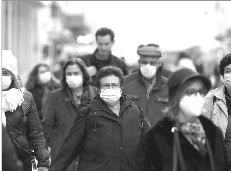
▲ Sigue sin estar claro qué significa para la pandemia la aparición de ómicron.

Japón anunció que suspenderá la entrada de todos los extranjeros, pese a que los nuevos casos de la variante identificada hace días por investigadores en Sudáfrica parecían estar tan distantes como Hong Kong, Australia y Portugal. Las autoridades portuguesas investigan si algunas de las infecciones detectadas en el país podrían ser de los primeros casos reportados de la transmisión