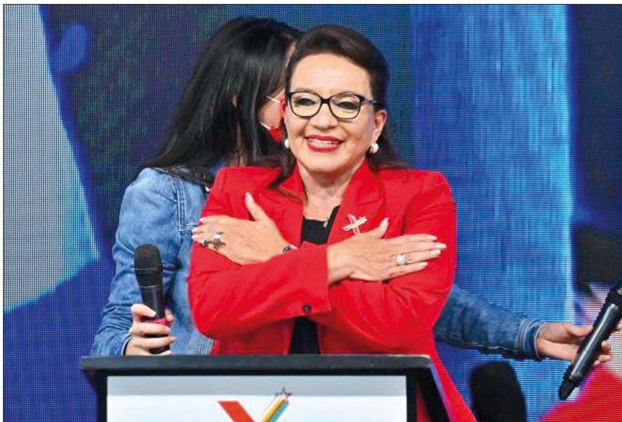
▲ La candidata del Partido Libertad y Refundación logró recabar 53,61 por ciento de los sufragios.

“Felicidades a la presidenta electa. América Latina y el Caribe también celebran con Honduras”, ha indicado en un mensaje compartido en su cuenta de Twitter. También se ha sumado a las felicitaciones el presidente venezolano, Nicolás Maduro.