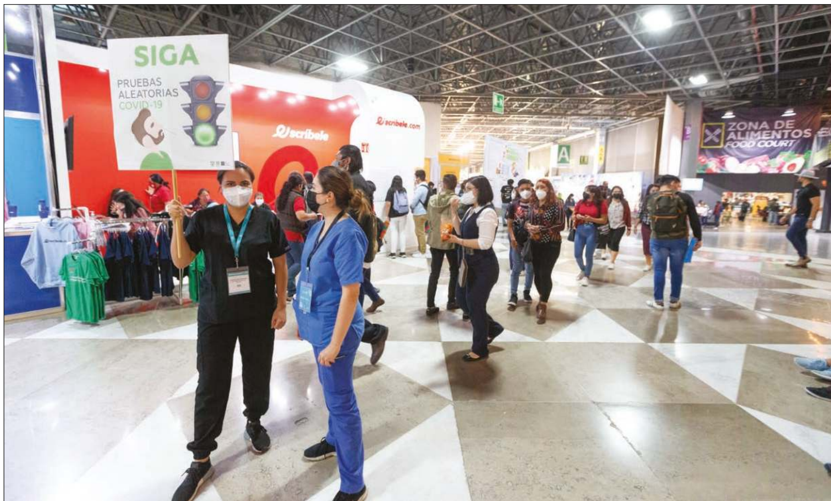
▲ Aplicación aleatoria de pruebas de Covid 19 dentro de la 35 Feria Internacional del Libro en Guadalajara.