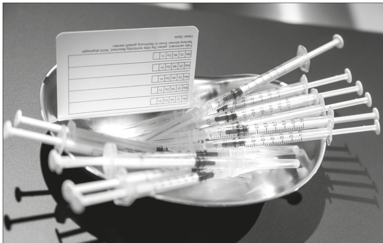
▲ Hasta ahora no hay un pronóstico del desarrollo de la variante.

Señaló que hasta ahora no hay un pronóstico del desarrollo de la variante y “hemos avanzado mucho en la vacunación y vamos a in-