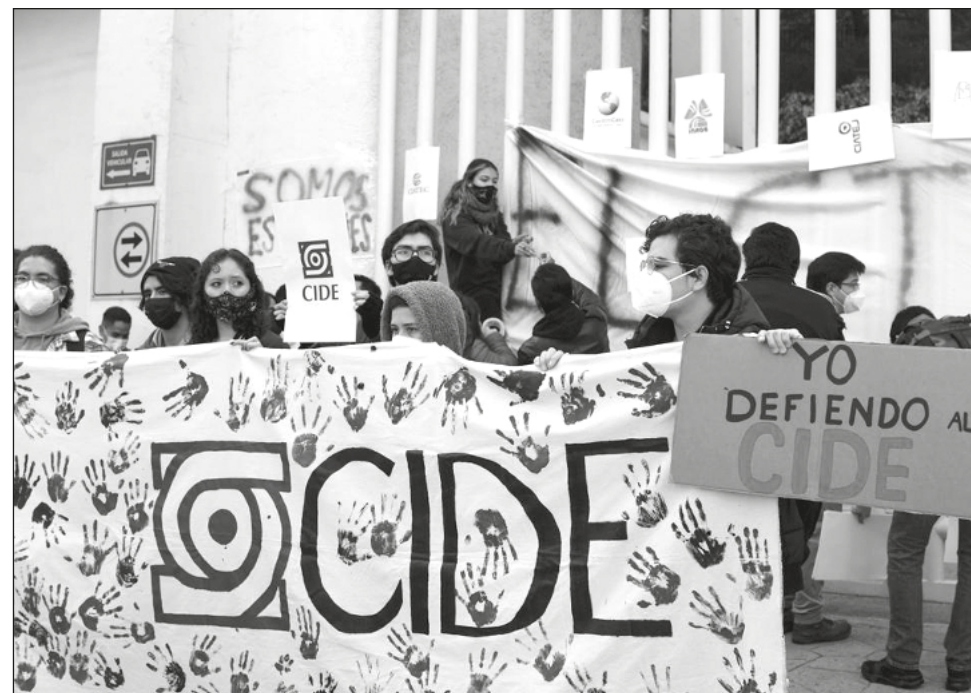
▲ La decisión se dio en medio de protestas de diversos sectores del Centro y otras instituciones académicas.

“Es miembro del Sistema Nacional de Investigadores (SNI) nivel III y goza de prestigio incuestionable nacional e internacional y una trayectoria intachable desde el punto de vista