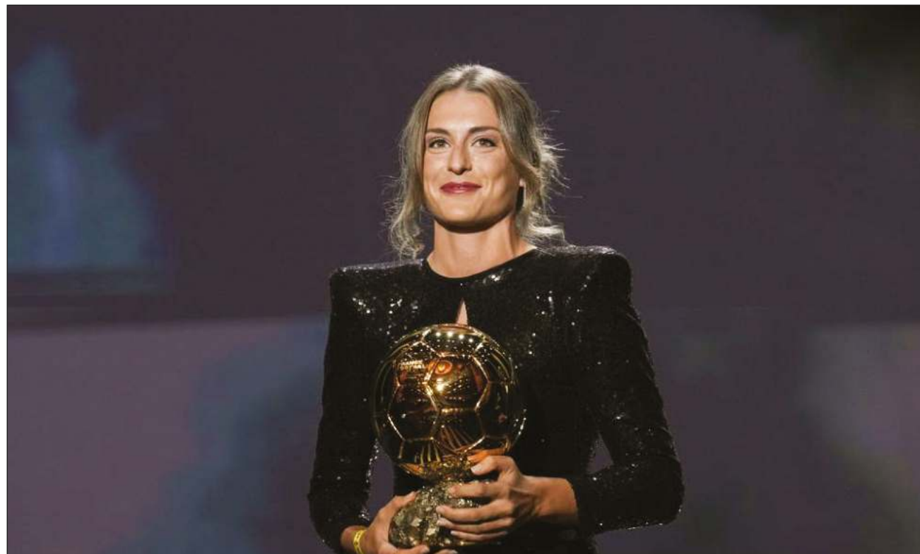
▲ Es la primera vez que la jugadora española Alexia Putellas obtiene el Balón de Oro, después de una temporada destacada con Barcelona y España.

Además, agradeció el galardón a sus "compañeros del Barcelona y del Paris", y, "especialmente", al cuerpo