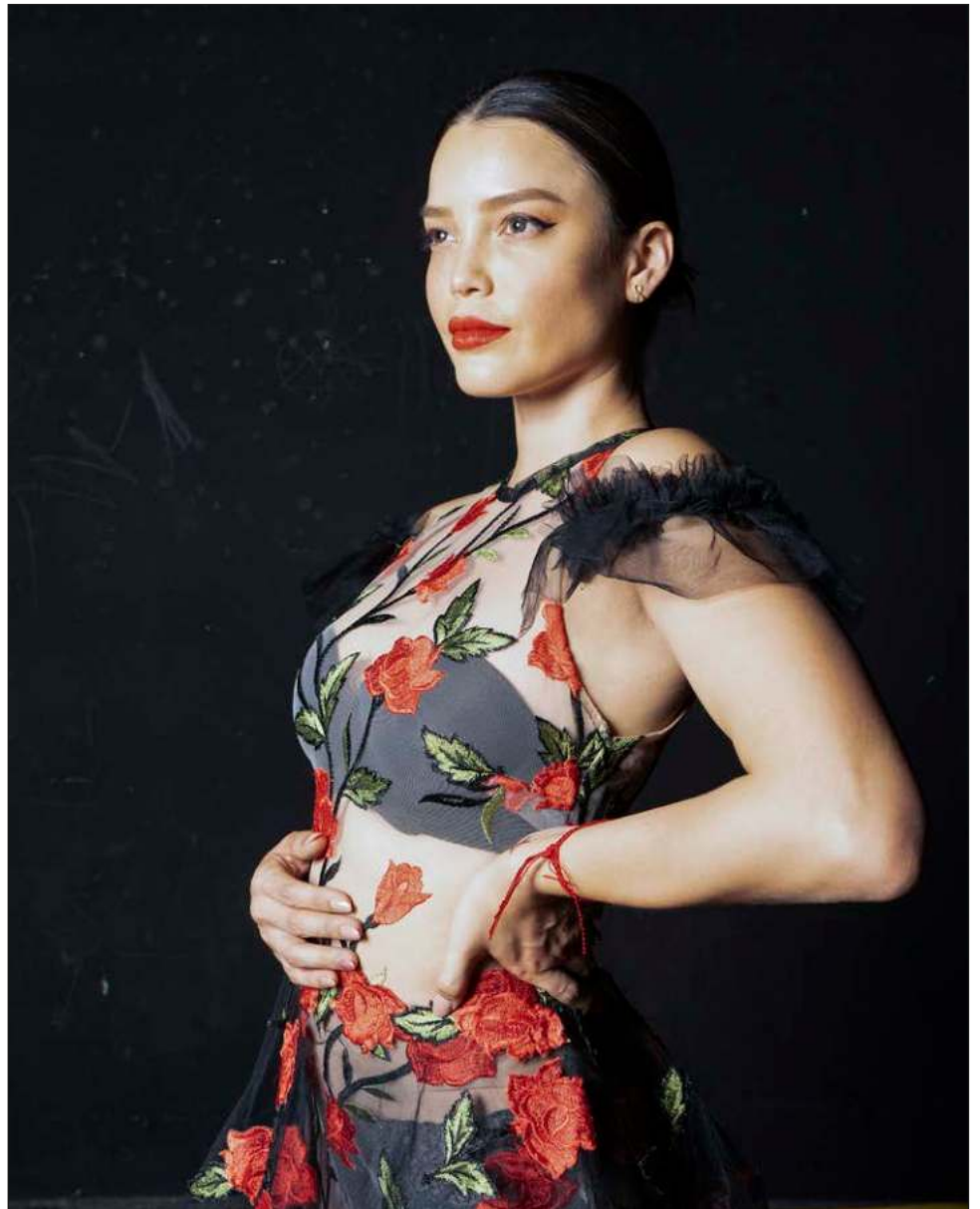
▲ "En la contienda electoral fui blanco de una cantidad de odio que nunca me pude haber imaginado y yo no me estaba lanzando para ningún cargo".

Actualmente, trabaja desde diferentes plataformas, como Pinterest, Instagram, Facebook y TikTok; en el caso de Pinterest recibe hasta 5 millones de visitas mensualmente.