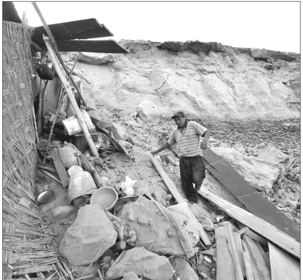
▲ La gran profundidad del sismo provocó que la onda expansiva fuera mayor y afectara a casi la mitad del país.

Perú es sacudido cada año por al menos 400 sismos perceptibles, pues está ubicado en el denominado Cinturón de Fuego del Pacífico, una zona de amplia actividad telúrica.