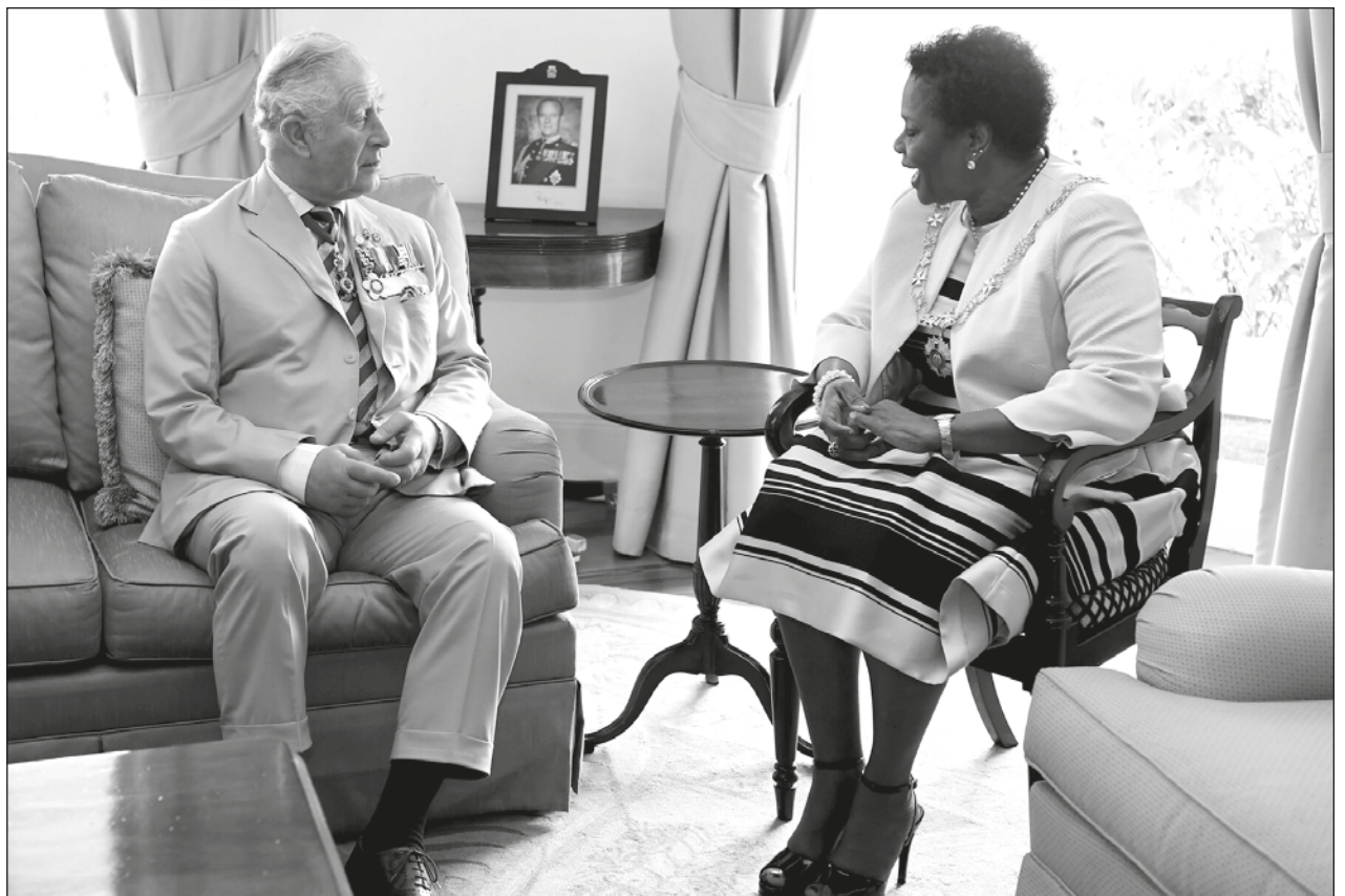
▲ Pese al cambio gubernamental, Reino Unido planea mantener fuertes relaciones con la nueva administración de la isla, informó el príncipe Carlos, invitado de honor a la toma de protesta de Sandra Mason.

El desempleo se sitúa en casi el 16%, frente al 9% de los últimos años, a pesar del fuerte aumento de los préstamos del gobierno para financiar proyectos del sector público y crear puestos de trabajo.