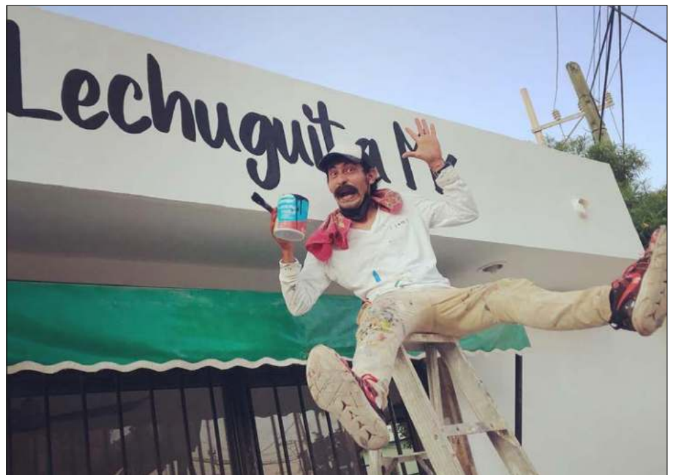
▲ El personaje de CareXulo es un señor adulto que critica las nuevas formas de los jóvenes, pero que intenta mimetizarse con todo lo nuevo.

CareXulo le ha permitido promocionar desde frituras, hasta comida de restaurantes, e incluso, recientemente fue contratado para promover a Campeche mediante una agencia de viajes en el