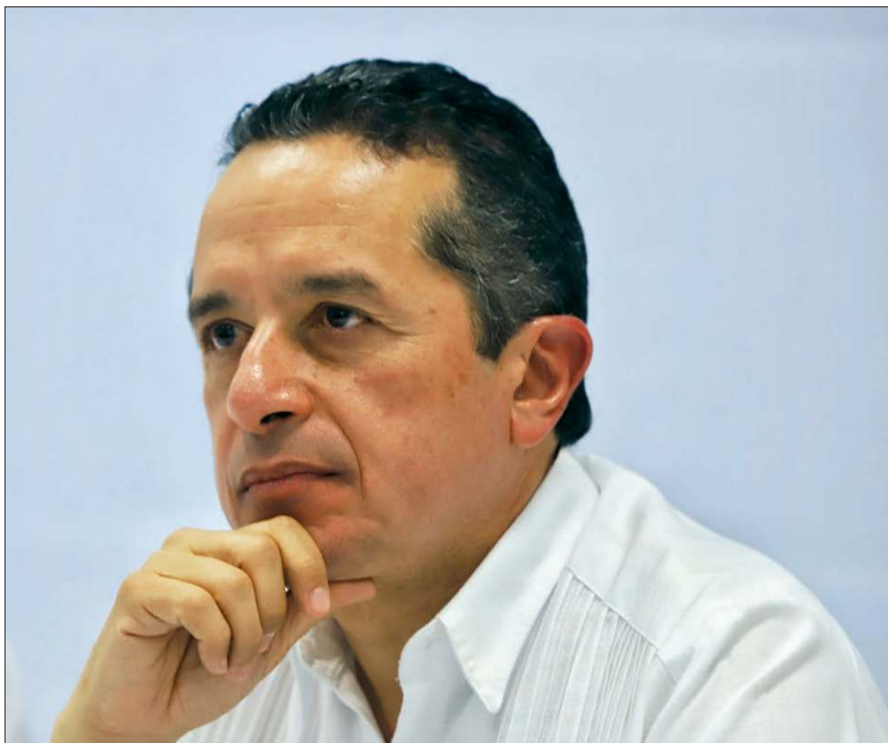
▲ El gobernador Carlos Joaquín señaló que el trabajo será coordinado entre los tres niveles de gobierno.