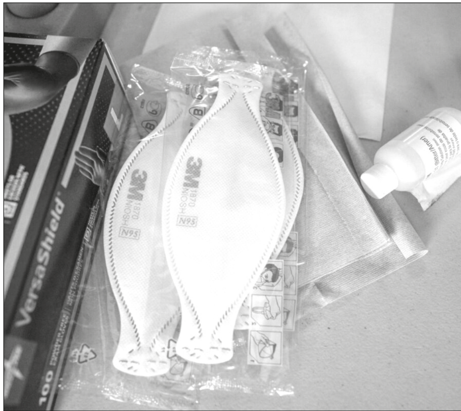
▲ El acuerdo entre el Insabi y la UNOPS estará vigente hasta 2024.