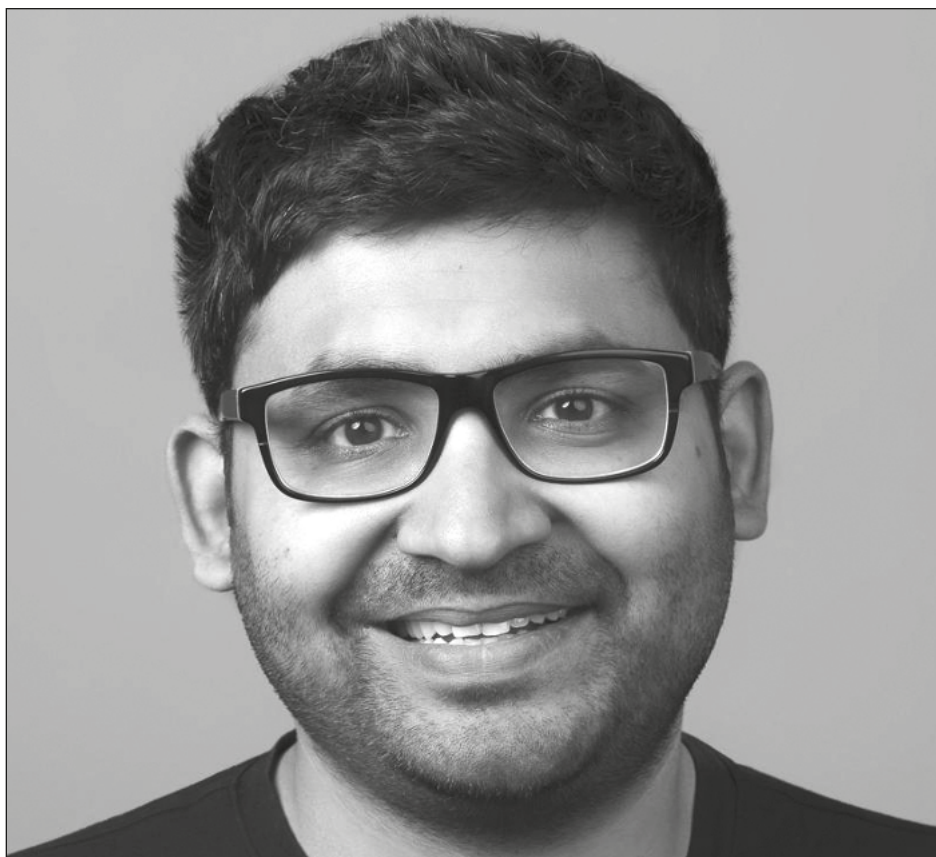
▲ Parag Agrawal, en la imagen, se hará cargo de la dirección general de Twitter.

La edad de los jornaleros que laboran en esa zona ronda entre los 19 y 49 años; en su mayoría se trata de inmigrantes permanentes, es decir, personas nacidas en otras regiones del país, pero que optaron por quedarse a vivir en Baja California por las condiciones laborales.