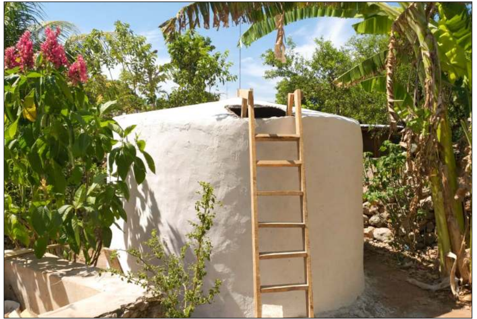
▲ A la población se le enseña el correcto manejo del agua y su almacenamiento, a fin de evitar la proliferación de enfermedades gastrointestinales y transmitidas por vectores.

“En cuanto agua suficiente la hay, pero agua limpia y en mejores condiciones, ese el problema”, indicó.