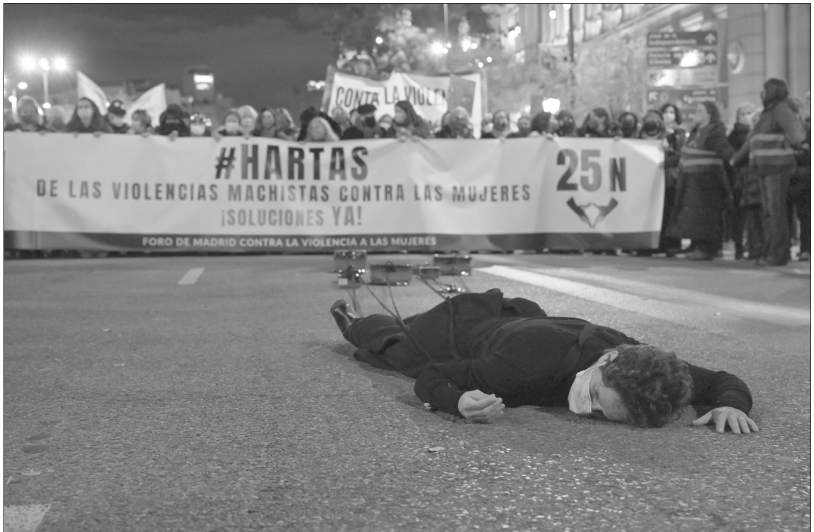
▲ La verdadera protección a la mujer no debe permitir impunidad, ni encubrimiento a victimarios.