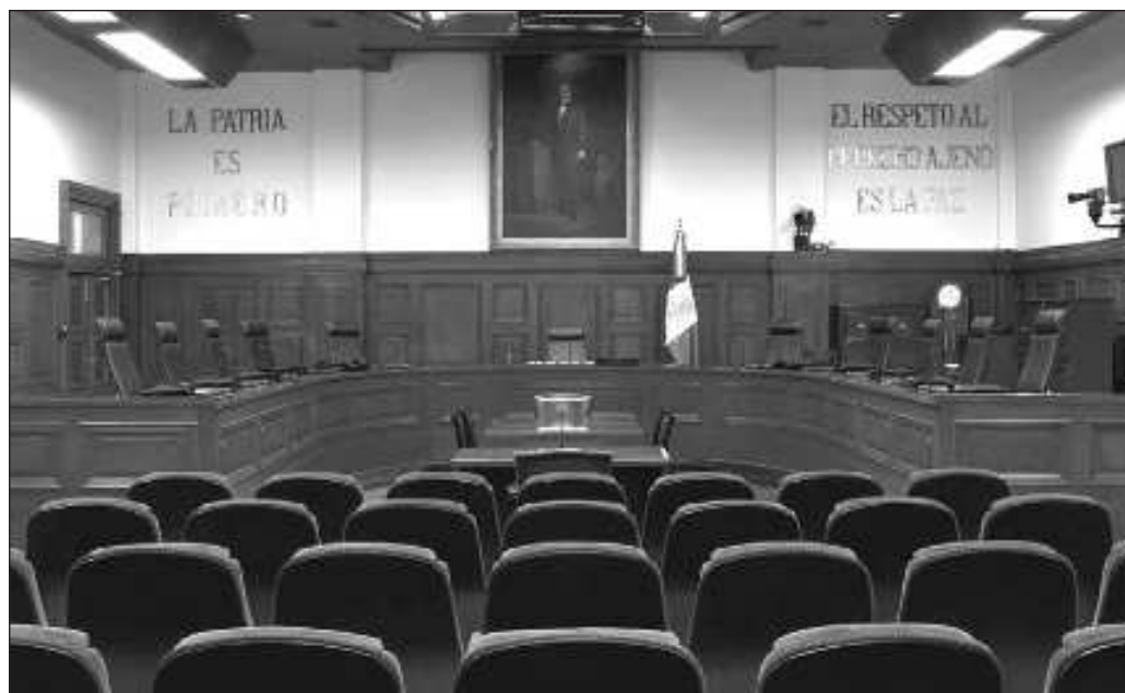
▲ Por ahora, ocho ministros han anunciado que renunciarán y esto les asegurará gozar de su haber de retiro; una suma de pesos nada despreciable para cada uno.

Y por ahora, ocho ministros han anunciado que renunciarán y esto les asegurará gozar de su haber de retiro; una suma de pesos nada despreciable para cada uno, pero independientemente de cuánto se llevarán, este puede ser el único costo de una nueva república, lo que resultaría sumamente barato si se compara con las transformaciones previas, que costaron millones de vidas humanas.