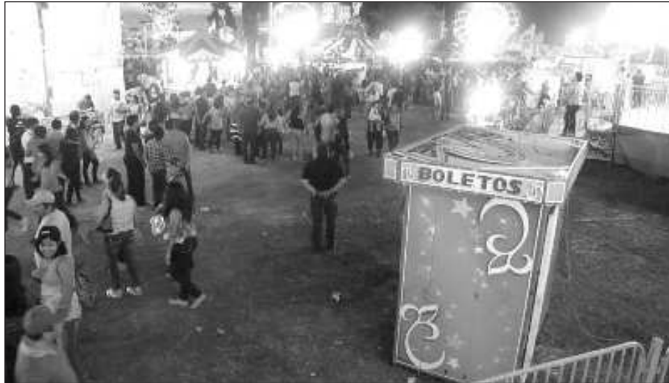
▲ Ofrecerán una amplia oferta ganadera, artesanal, gastronómica y cultural, con más de mil expositores, donde el invitado de honor de esta edición será el estado de Chiapas.

“Esta feria es símbolo de nuestra cultura, diversidad y calidez, que define a nuestro querido estado de Yucatán. Este año, la feria regresa más grande y mejor que nunca, con una expectativa de recibir a casi 3 millones de visitantes que vendrán a disfrutar de todo lo que nuestra tierra tiene para ofrecer: campeonatos ganaderos, producción agrícola