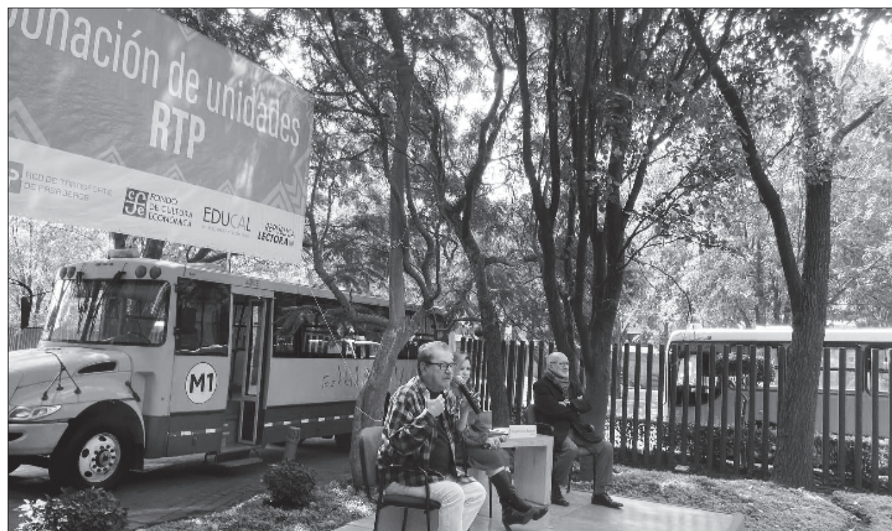
▲ A lo largo de los años, el FCE había “vitalizado la relación con las comunidades y pueblos, y se empezaron a hacer giras por el país”, pero en cierto momento, “no pudimos responder a la demanda social que habíamos creado por medio de las campañas lanzadas en los estados”.

En vista de que un librobús es una librería móvil, el siguiente paso consiste en adecuar las unidades; es decir, diseñar el mobiliario, ver dónde será la entrada, decidir a qué nivel se colocarán los libros para niños y también la decoración. “Un librobús tiene que ser muy festivo; entonces, vamos a incorporar a los grafistas que hacen Vientos de Pueblo para que se animen a hacerlo. También tenemos que crear un nuevo