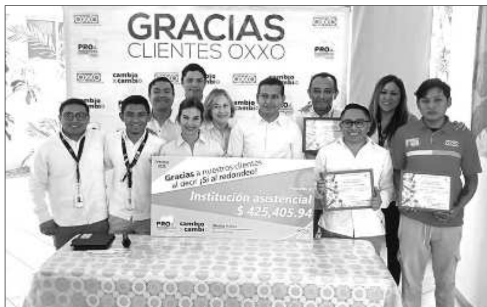
▲ Los 425 mil 405 pesos recaudados durante julio-septiembre serán utilizados para el mantenimiento de las áreas como los techos y para su funcionalidad general.

En este redondeo participaron aproximadamente 250 tiendas Oxxo en todo el estado de Yucatán. El cheque del monto fue en-