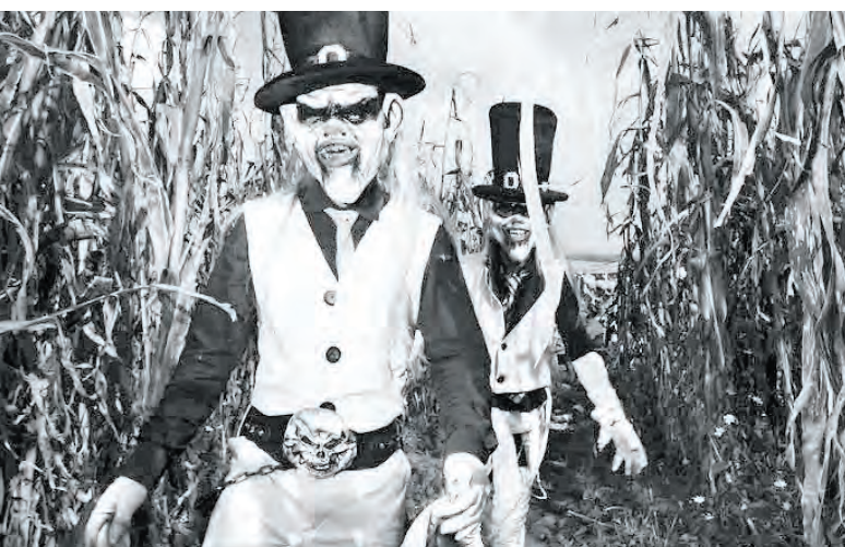
Fotograma de Barroco , 1989.

Paul Leduc Rosenzweig (1942-2020) vivió y murió sabiendo que la lucha era una de las Bellas Artes. Como cineasta encarnó paradojas imposibles: un formalista que no renunciaba al compromiso; poeta que no se apartó de la teoría; muralista social cuyo centro estaba en la vida íntima de personajes extraordinarios. A veces, éstos eran tan conocidos como Frida Kahlo o John Reed; otras, héroes diminutos y anónimos, como una bailarina en Panamá, una fotógrafa argentina, una viuda salvadoreña. Su compromiso doble con lo real y lo imaginario podrían resumirse en una terca lealtad a la vida, hasta el último instante.