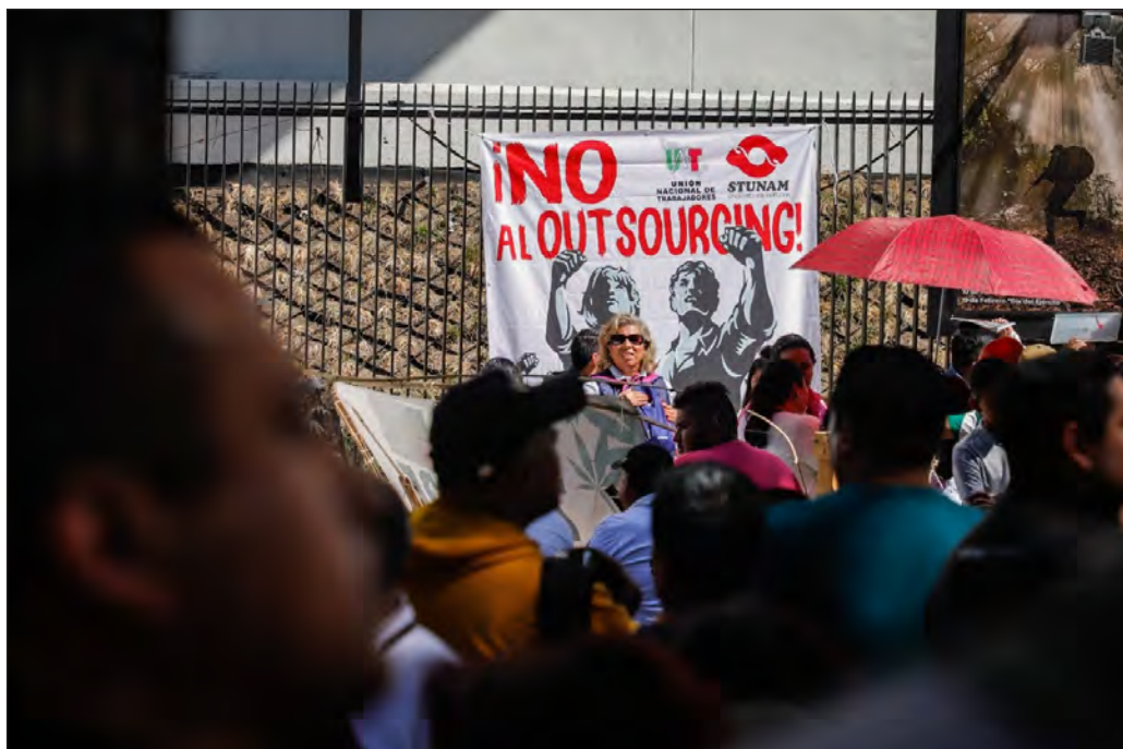
▲ El 96 por ciento de las empresas dedicadas al manejo de recursos humanos no pagaba impuestos en 2018, según ManPowerGroup.

El presidente Andrés Manuel López Obrador anunció que su gobierno presentará una iniciativa para acabar con los abusos laborales y fiscales cometidos a través de la figura del outsourcing , ya sea mediante su regulación o desapareciéndola. Para ejemplificar la conducta de las empresas dedicadas a manejar las nóminas de terceros, el mandatario señaló que a finales de año cientos de miles de trabajadores son dados de baja del Instituto Mexicano del Seguro Social (IMSS) y que estos puestos laborales se recuperan en enero o febrero, maniobra mediante la cual sus empleadores les niegan el pago del aguinaldo y les impiden acumular antigüedad. De acuerdo con López Obrador, la situación actual es producto de la reforma laboral aprobada en las postrimerías del sexenio de Felipe Calderón, cuyo sentido fue dar facilidades para violar los derechos de los trabajadores.