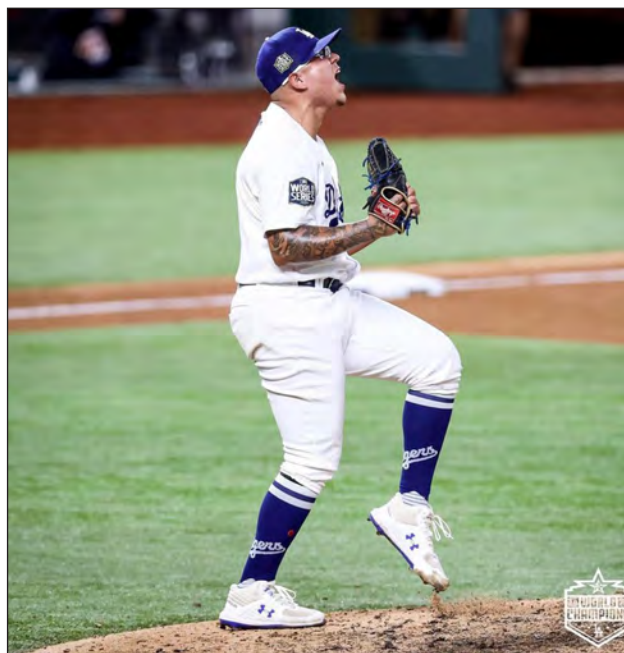
▲ Julio Urías fue un cerrador intratable al asegurar los cetros de la Liga Nacional y Serie Mundial para Los Ángeles.

Seager se convirtió en el torpedero con más cua-