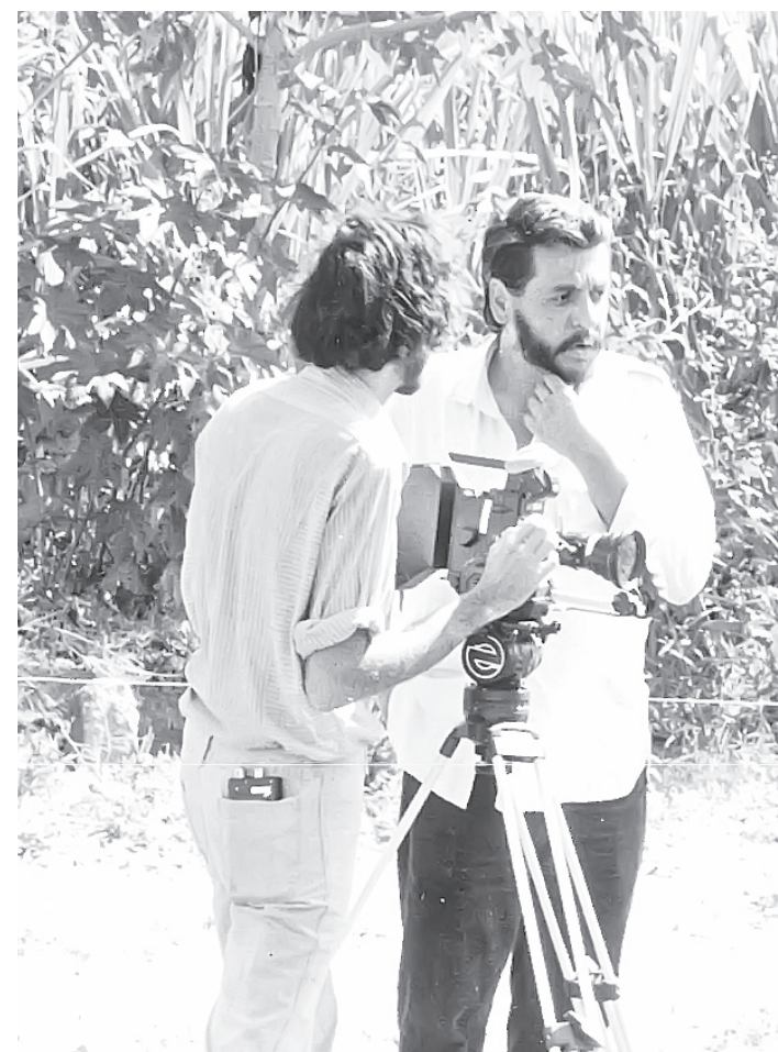
Paul Leduc (1942-2020) durante el rodaje de Historias prohibidas de pulgarcito .

AQUEL PUDO SER un camino alternativo para la vida creativa de Paul Leduc: el periodismo militante, una vocación que retomaría en sus últimos años. Esa parte de su obra, dedicada a capturar retazos de realidad, tiene su cima en Etnocidio: notas sobre el mezquital (1977) una ambiciosa coproducción canadiense que traza un retrato vibrante y sangrante de una comunidad otomí en Hidalgo. Filmada ya a la sombra de López Portillo, Etnocidio alcanza y, a ratos, rebasa a ficciones que le fueron contemporáneas y que quebraron la frontera entre relato y testimonio, como Canoa (1976) o Cascabel (1977). Con ella, Leduc elevó el documental por encargo a las alturas de Jean Rouch.