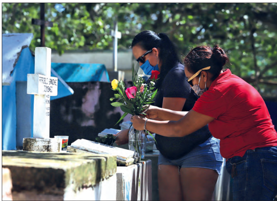
Durante el 2019 las enfermedades del corazón, diabetes y tumores malignos fueron las tres principales causas de muerte en la entidad.

Las tres principales causas de muerte en 2019, tanto para hombres como para mujeres, fueron las enfermedades del corazón, diabetes y los tumores malignos. Los homicidios representaron la cuarta causa de muerte en hombres.