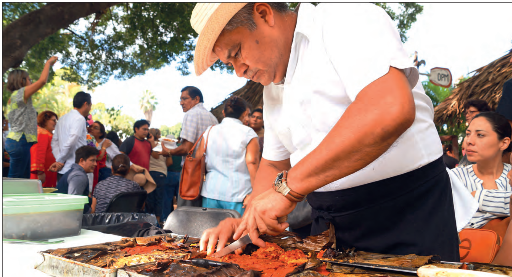
Haber institucionalizado el 2 de noviembre para comer el pib es “un error tremendo”, ya que es un guiso que suele prepararse en cualquier ocasión.

Para estos intelectuales mayas, el Janal Pixán se está debilitando a gran velocidad ante la llegada de brujas y fantasmas, que lamentablemente ya son una realidad en las comunidades yucatecas. De ahí la importancia de representar una práctica lejana a concursos y espectáculos y colocar de nueva cuenta las velas que alumbran los senderos, para que estos vuelvan a ser vistos como los caminos que dan la bienvenida a los pixanes.