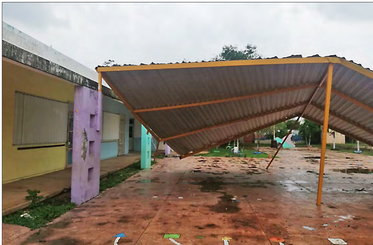
▲ El Instituto de Infraestructura Física Educativa de Quintana Roo realizó la inspección y evaluación de daños, que para presentar los expedientes al gobierno federal.

El gobernador Carlos Joaquín realizó recorridos de supervisión en los que observó muchas escuelas con bardas caídas, árboles sobre aulas y otros daños en infraestructura, por lo que pidió al Instituto de Infraestructura Física Educativa de Quintana Roo (Ifeqroo) la inspección y la evaluación de daños para presentarlos ante la federación a fin de poder acceder a los apoyos del Fondo de Desastres Naturales (Fonden).