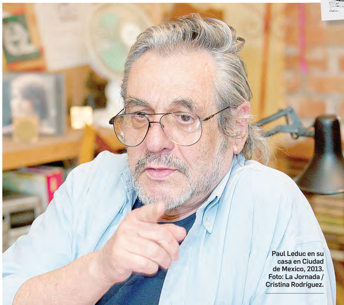
Paul Leduc en su casa en Ciudad de México, 2013.

El asombro fue mayúsculo y Cobrador rebasó todas las expectativas posibles. Sin duda era un filme polémico, dispuesto a sacudir al espectador, realizado con una maestría y una solvencia técnica deslumbrante. Lo más sorprendente es que se trataba del regreso de un cineasta, inactivo