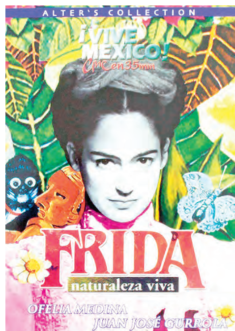
Cartel de Reed. México insurgente, 1970-1971 y Frida: naturaleza viva, 1984.

personalidad y psicología de sus protagonistas. En ellas no existe el arco tradicional de una biografía, sino cuadros breves que avanzan a través de los sentidos y rara vez llegan al puerto esperado: ni en Reed vemos batallas ni en Frida a una pintora frente al lienzo; conocemos en cambio a dos seres retirados en la intimidad, cuyo destino se decide en esos tiempos muertos en los que no hay descargas de balas ni de pinceles.