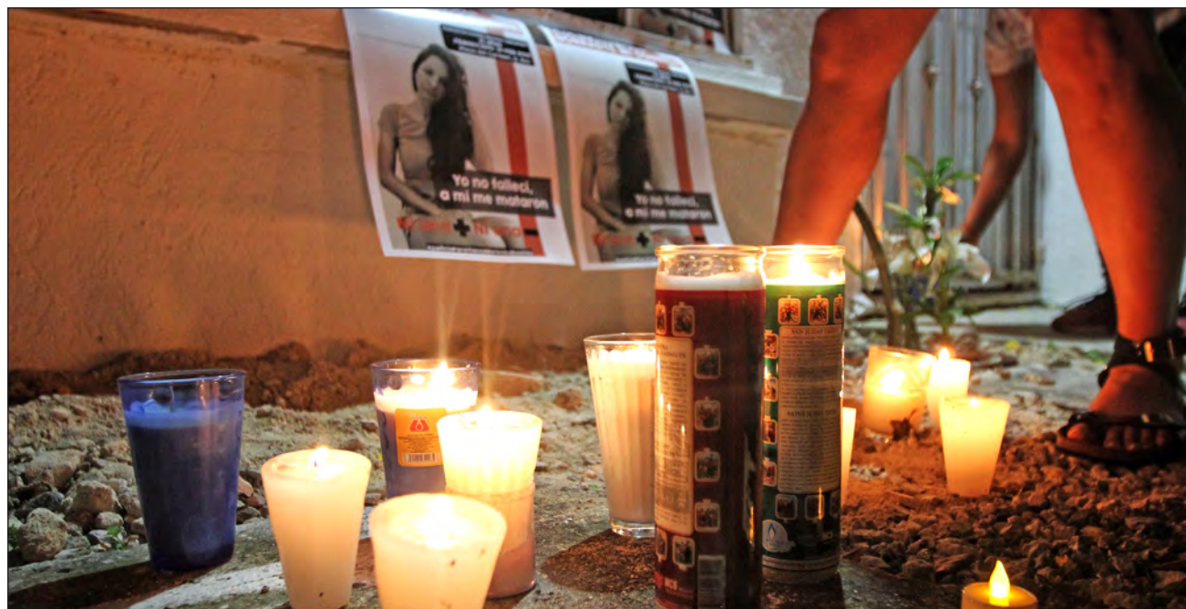
De enero a septiembre de este año, se han registrado nueve feminicidios y 123 víctimas de homicidio doloso en Quintana Roo.

Datos del Secretariado Ejecutivo del Sistema Nacional de Seguridad Pública señalan que, de enero a septiembre, se han acumulado nueve feminicidios en Quintana Roo (seis de ellos en Benito Juárez); el estado ocupa el lugar 24 en todo el país, pero también hay 123 presuntas víctimas de homicidio doloso.