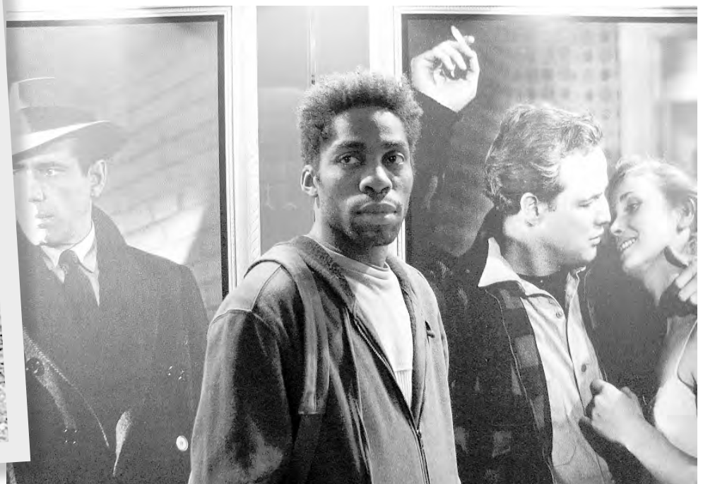
Derecha: Fotograma de Reed. México insurgente, 1970-1971. Izquierda: Fotograma de Cobrador, 2006.