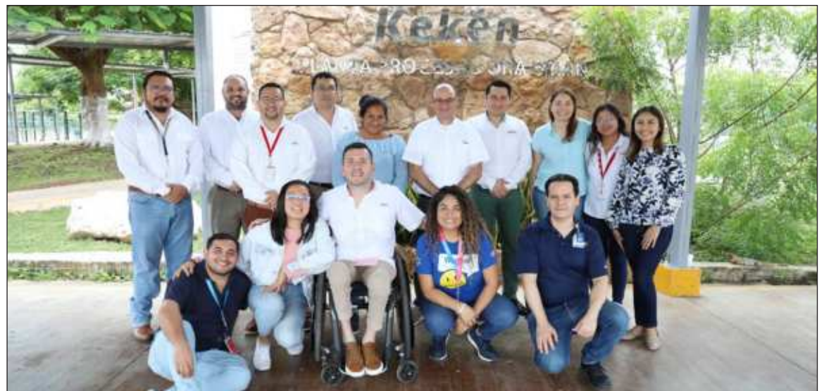
▲ La directora en Walmart Supply Chain, dijo que gracias al programa “se puede ver que disfrutan su trabajo, tienen autonomía y un desempeño exitoso que aporta a la empresa. Por eso Kekén debe sentirse orgulloso de lo que están haciendo”.

Los representantes de Walmart destacaron que la Compañía productora de proteína ha generado una cultura de inclusión laboral, por lo que brindan