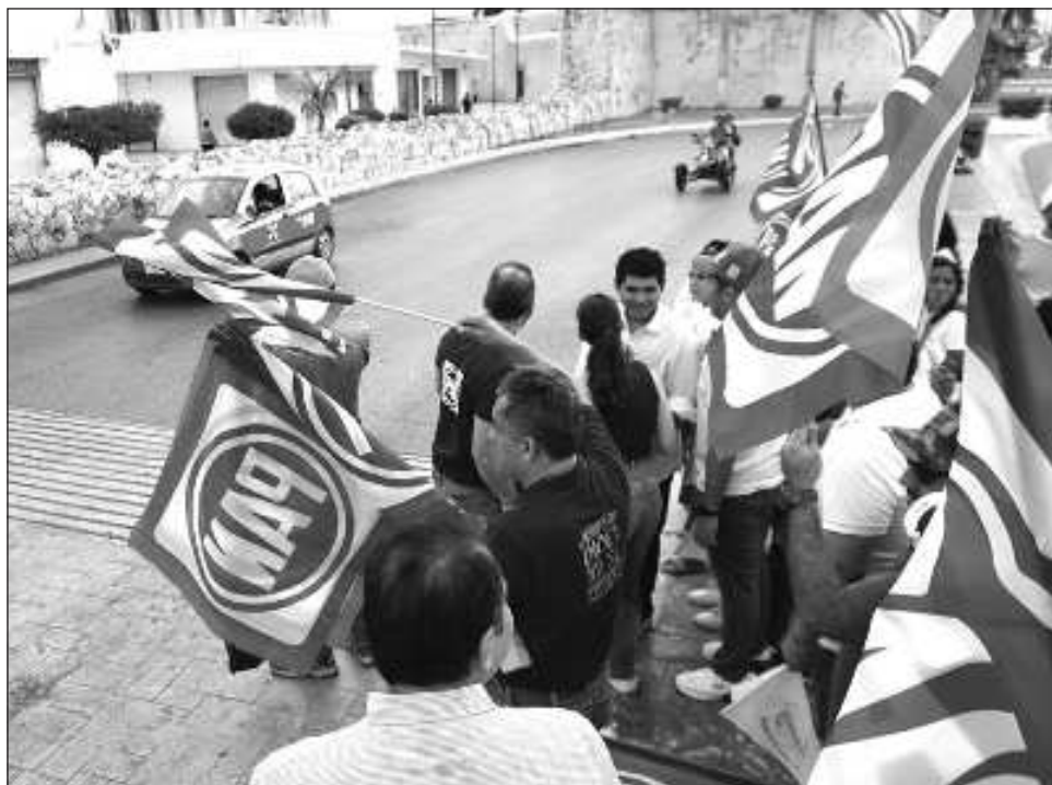
▲ Aunque el PAN casi no obtuvo funcionarios esta elección, al menos su votación aumentó comparado con 2021, cuando incluso obtuvieron dos alcaldías y una diputada electas.

Destacó que en esta elección aunque casi no obtuvieron funcionarios, al menos su votación au-