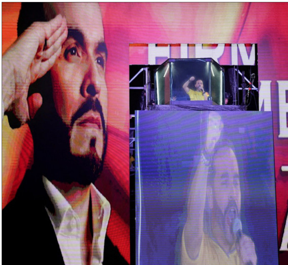
▲ "Las sociedades en las que tendremos elecciones en años venideros debemos aprender de los cambios en otros países".