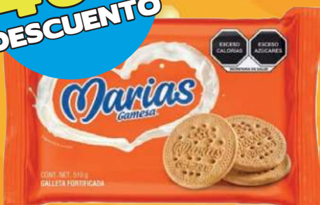
Galletas marías GAMESA paquete de 510 gr (Las primeras 3 piezas)