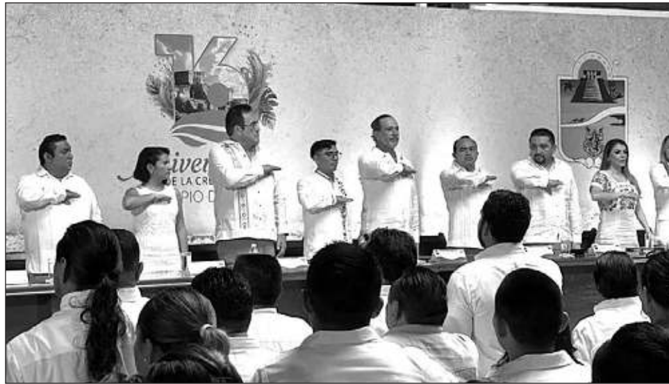
▲ Tulum, con su rica historia desde 1860, tuvo en la Guerra de Castas el liderazgo de María Petronila Uicab, cuyo nombre se encuentra escrito en letras doradas en el Congreso del Estado.

Recordó que Tulum llevó antiguamente el nombre de