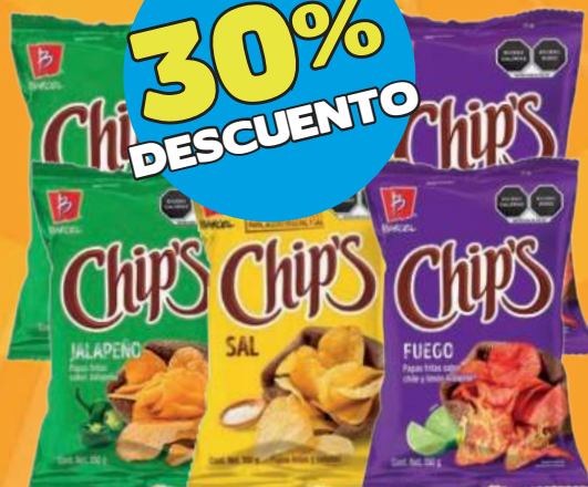
Papas CHIPS de 170 gr ó 150 gr: Fuego, jalapeño y sal