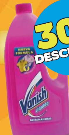
Removedor de manchas de ropa VANISH de 925 ml

VIGENCIA ÚNICAMENTE EL 30 DE MAYO DEL 2024.