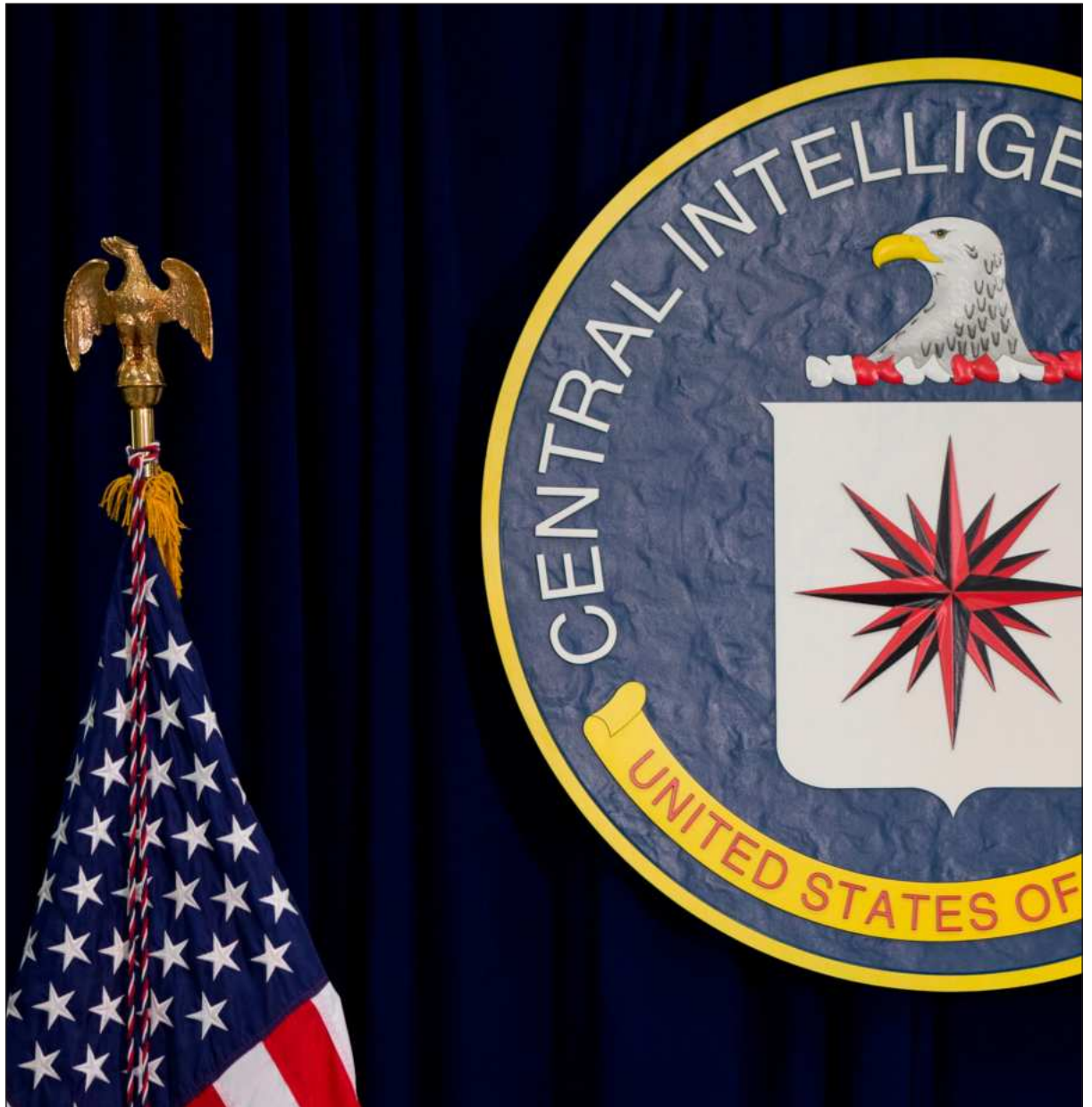
▲ “No era ni es un secreto, la vocación entreguista del Partido Acción Nacional hacia los Estados Unidos, de sus gobiernos y sus cúpulas actuales y las del pasado, por ejemplo: los ex presidentes Vicente Fox y Felipe Calderón, su dirigente actual Jorge Romero y su ex dirigente Marko Cortés, etcétera”.