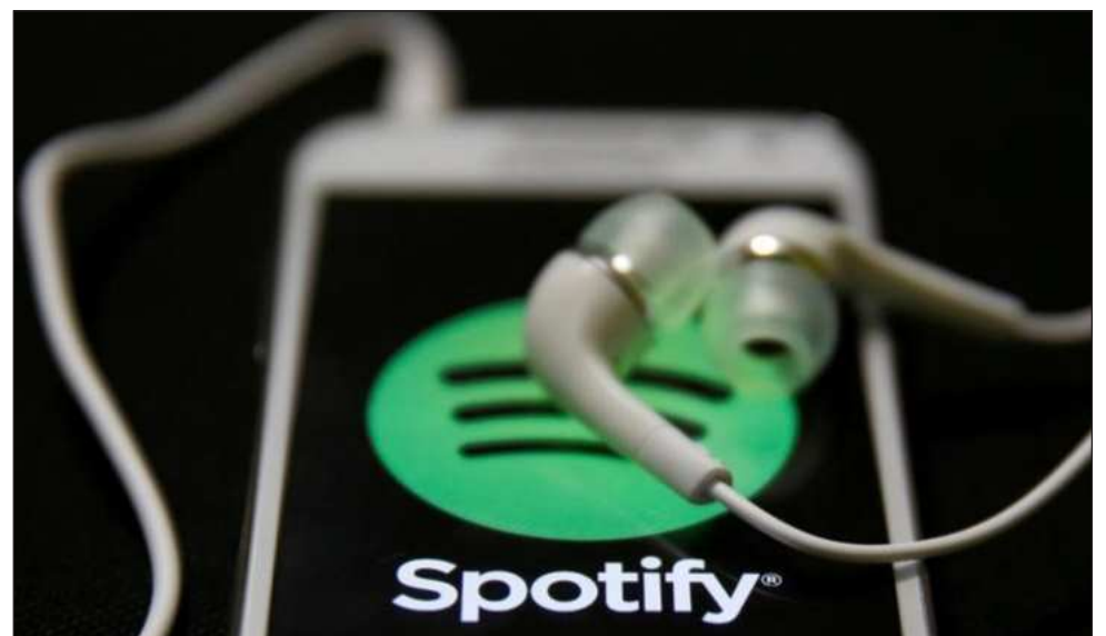
▲ Spotify considera que sus acciones están infravaloradas en relación con su rendimiento.

El beneficio ajustado antes de intereses, impuestos, depreciación y amortización (EBITDA) cayó 3.8 por