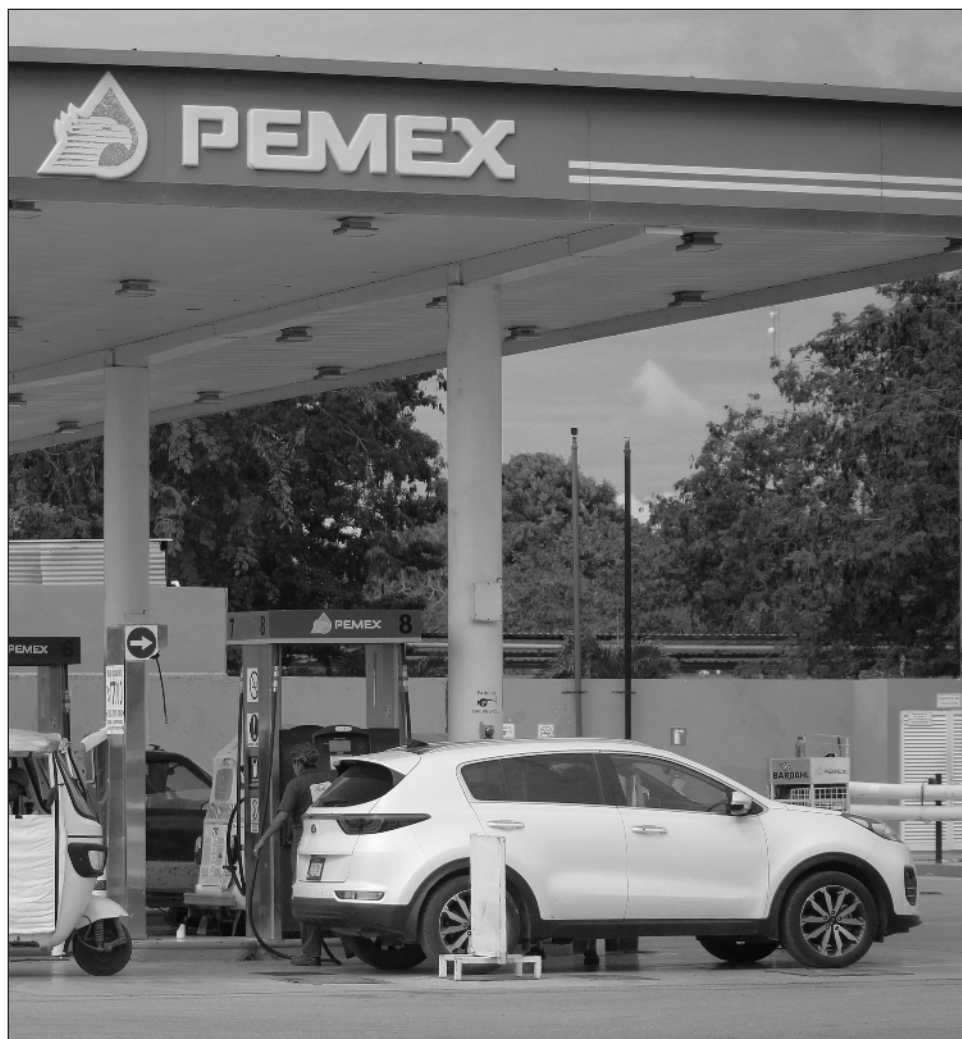
▲ En un destino como Quintana Roo, el costo del combustible no es un dato técnico, sino un factor directo en logística, transporte y movilidad laboral.

Dio a conocer que el sector empresarial ha tenido que reducir diversos gastos operativos para solventar el alza constante en los costos de operatividad. Las empresas de transporte, aunque beneficiadas momentáneamente por una aparente es-