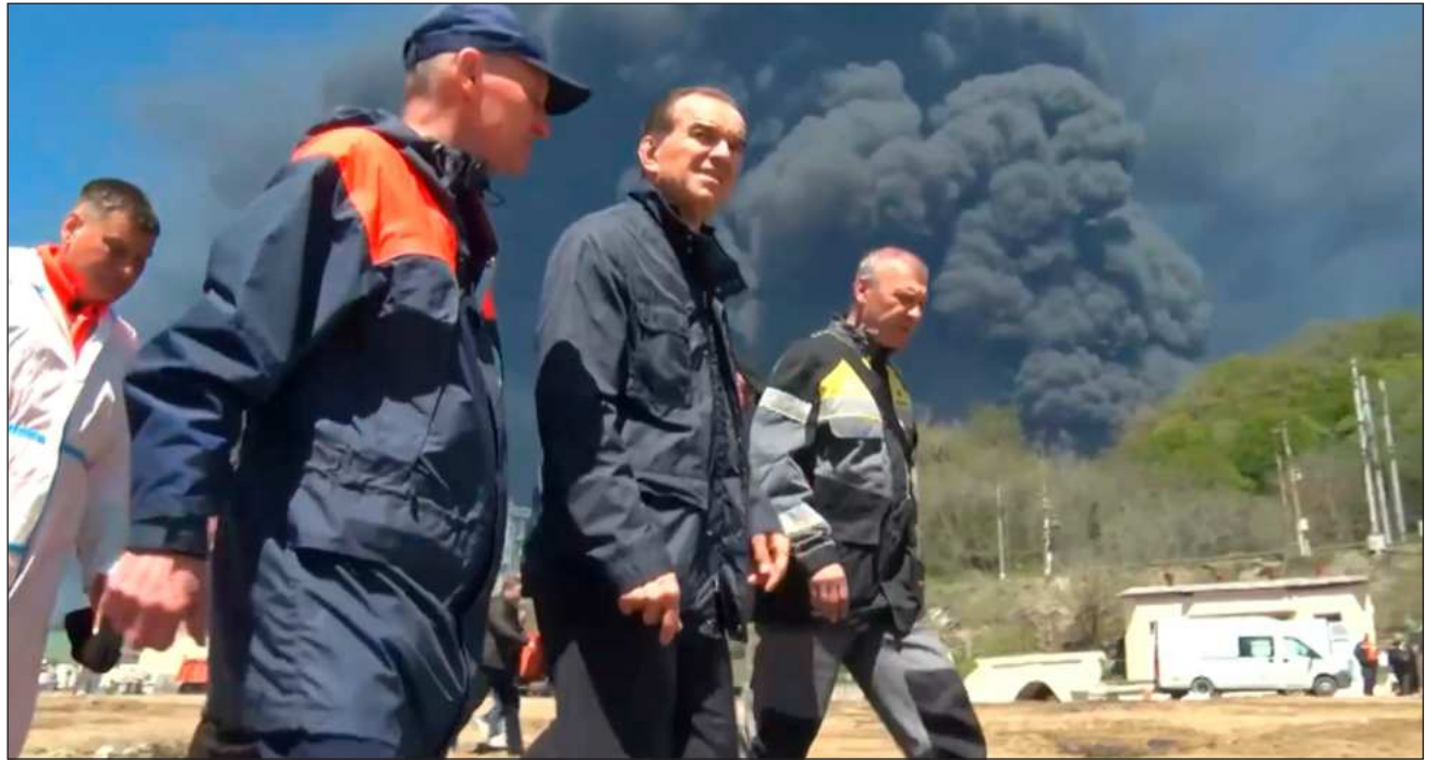
▲ El Servicio de Seguridad de Ucrania reportó un ataque a una estación rusa de bombeo de petróleo cerca de la ciudad de Perm.

El Servicio de Seguridad de Ucrania, conocido como SBU, reportó un ataque a una estación rusa de bombeo de petróleo cerca de la ciudad de