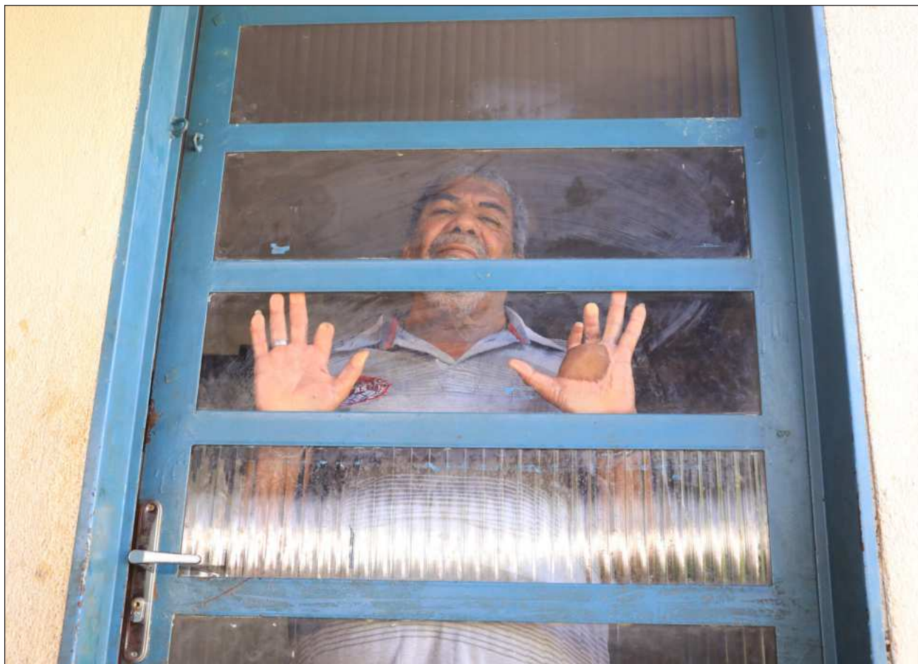
▲ Casi 40 años después de uno de los más graves casos de contaminación radiológica, la sociedad sabe poco sobre el accidente.

"Deberían mostrar la realidad para que los prejuicios disminuyan y nadie huya de nadie en la calle, porque al final también somos seres humanos", zanja.