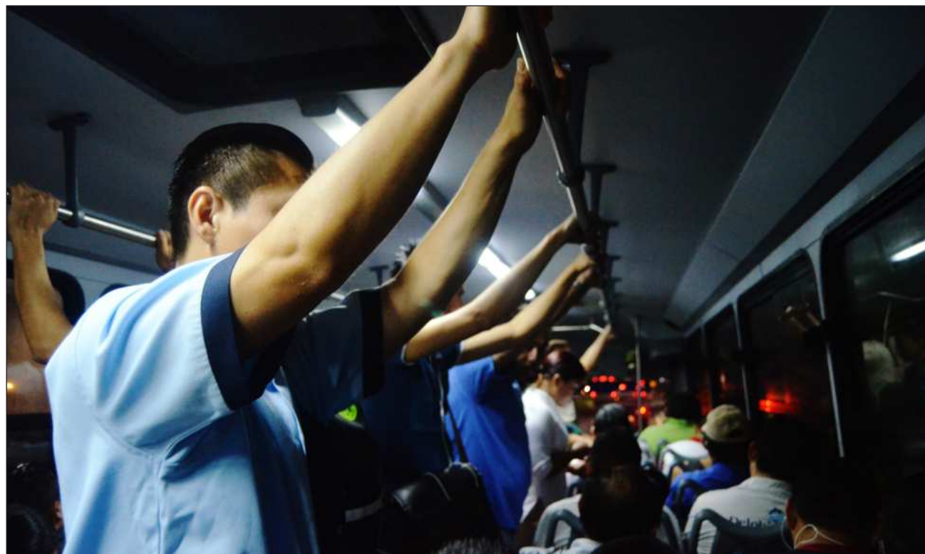
▲ Los cambios en las políticas fronterizas de EU provocaron un aumento de deportados que llegan sin recursos.

En todo 2025, la asociación que dirige atendió a 672 mexicanos deportados