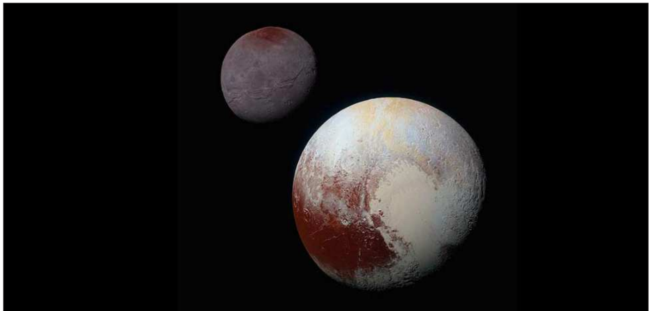
▲ Plutón tiene unos 2 mil 250 kilómetro de diámetro, unos mil 200 menos que la Luna, y se encuentra a unos 5 mil 800 millones de kilómetros del Sol. La temperatura media en su superficie es de -232 grados centígrados.

“Estoy totalmente a favor de que Plutón vuelva a ser considerado un planeta”, ha respondido Isaacman a un comité del Senado de EU que revisó el martes la solicitud de pre-