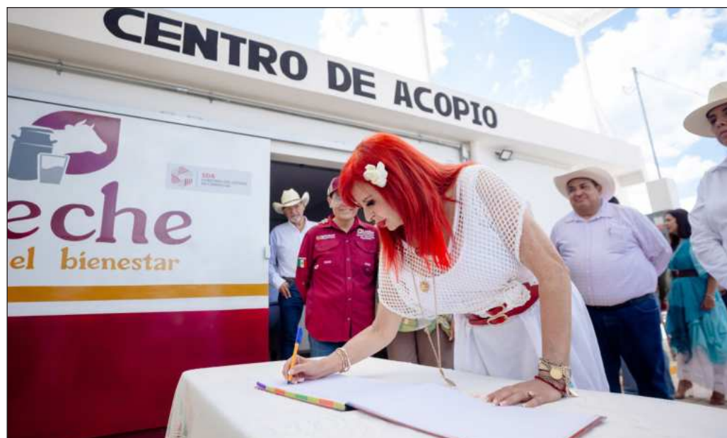
▲ La revelación de la gobernadora, y su advertencia de que no pedirá prestado, ni prórroga para realizar el pago, ameritarían una intervención por parte de la Auditoría Superior.

Cuando estamos a poco más de un año de que se celebren las elecciones de las cuales saldrá quien releve a Layda Sansores, queda preguntarse qué ha pasado en Campeche para que el estado tenga un problema tan grave de liquidez y si la solución tendrá que esperar a la apertura de las casillas.