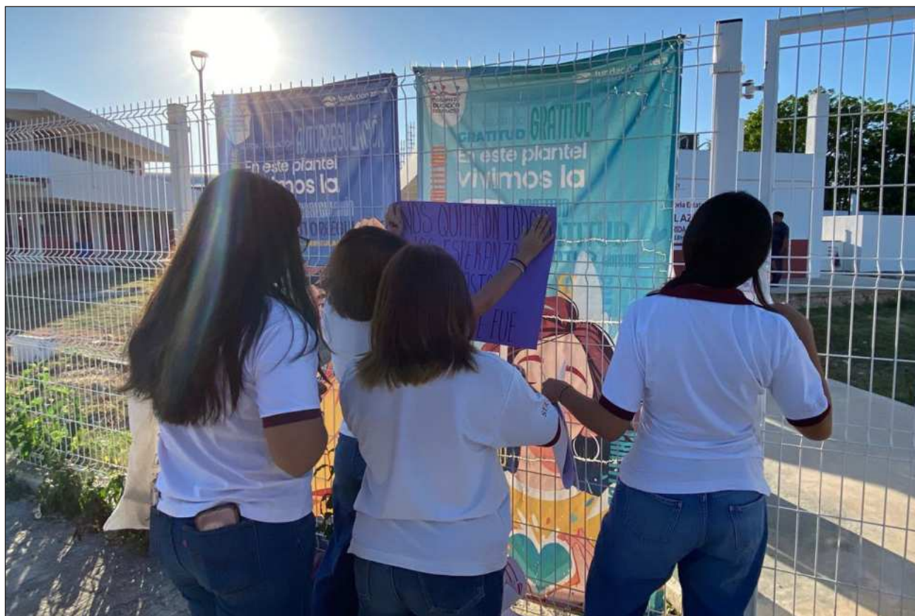
▲ Las estudiantes señalaron que las autoridades del plantel no han tomado cartas en el asunto.

Son cinco alumnas que asentaron su testimonio ante la FGE, pero se estima que sean al menos 15 afectadas con los hechos que comenzaron desde marzo.