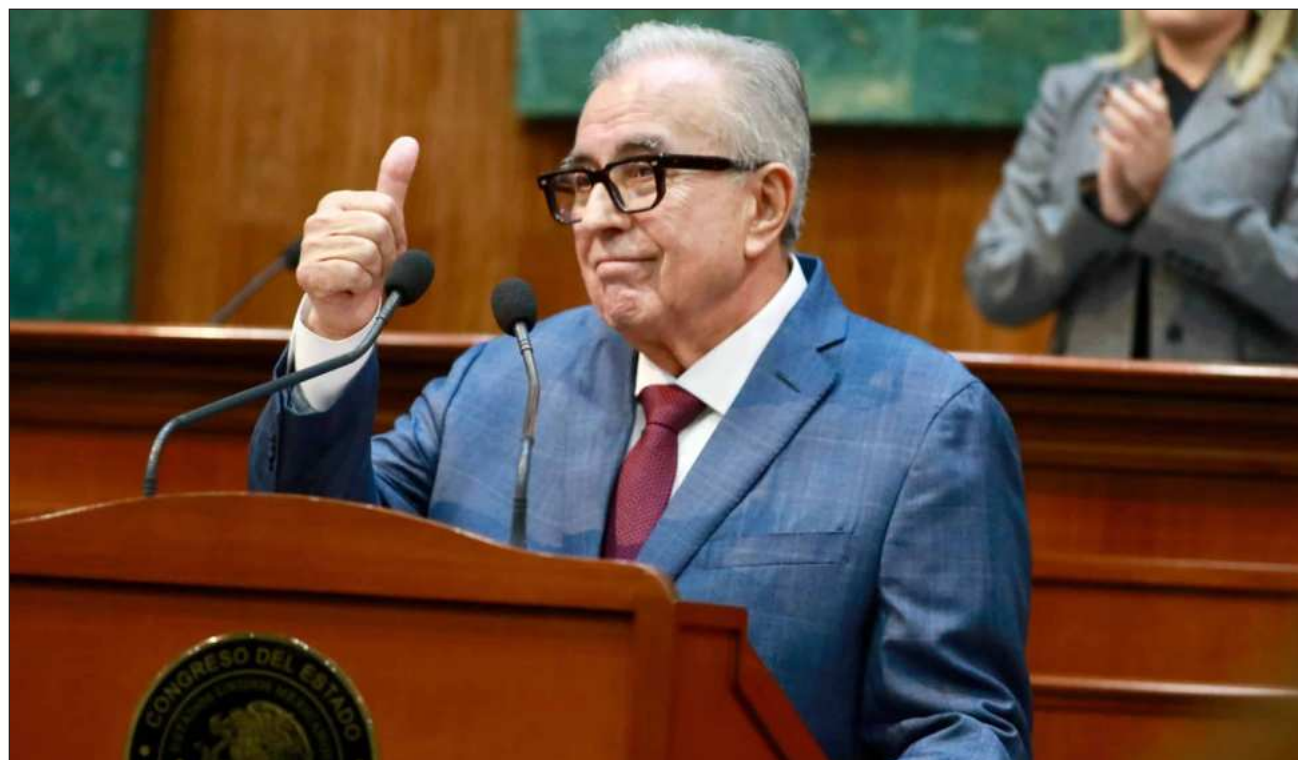
▲ Junto a Rocha Moya fueron imputados nueve perfiles que han trabajado para dependencias de Sinaloa.