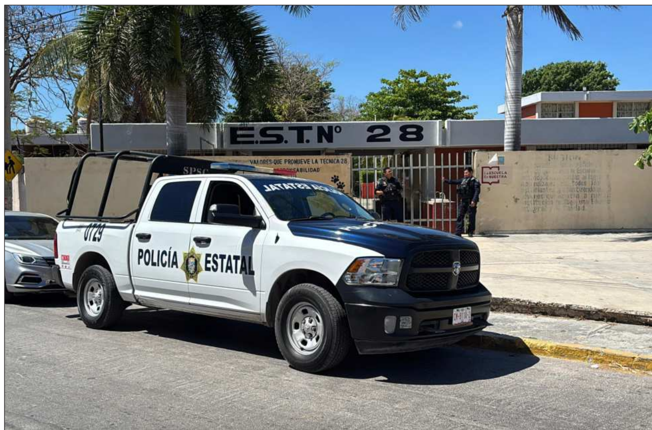
▲ En redes sociales, de manera anónima, señalaron que las escuelas son objetivo de células criminales locales.

En la secundaria general 7, una de las que reportaron amenazas, fue solicitada el ingreso de los elementos policiales, pues se percataron de la presencia de un objeto extraño.