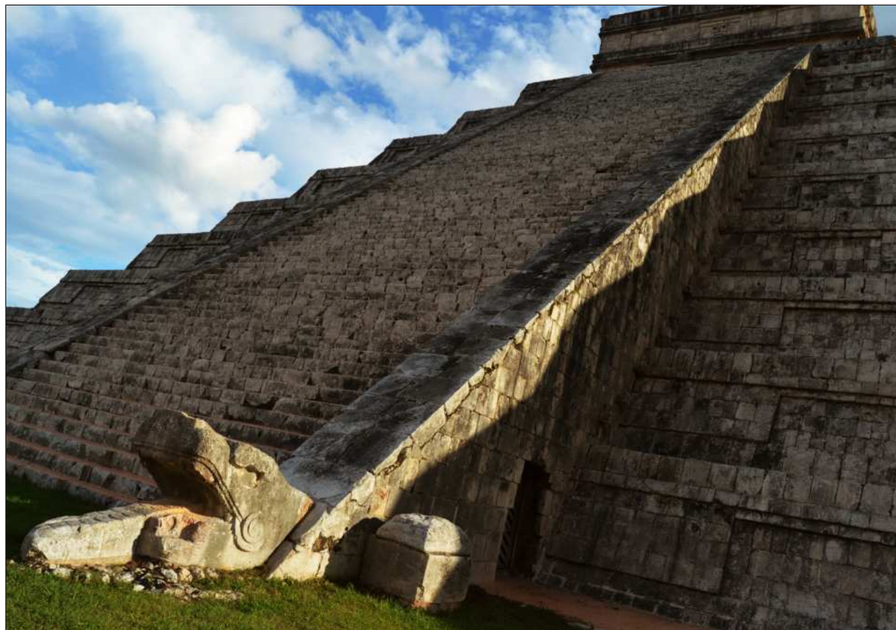
▲ De acuerdo con el artículo publicado en la revista Arqueología Mexicana , la iluminación de El Castillo tiene que ver con la importancia que tuvo la medición del tiempo en el sistema calendárico mesoamericano.

LA GUITARRA SE adapta al cuerpo, es liviana, rica en sonoridad y de fácil transportación y se diría que es un instrumento para los dioses y de los dioses.