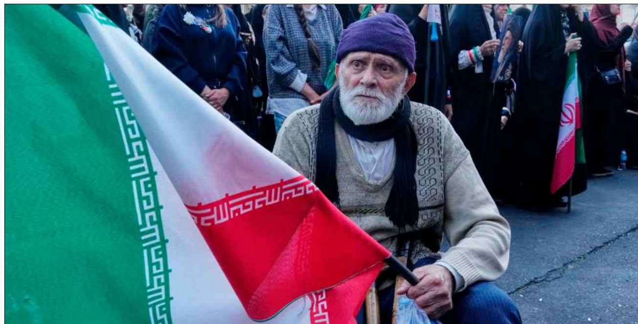
▲ Estados Unidos comenzó a atacar Irán el 28 de febrero de este año; actualmente mantienen actualmente un frágil alto el fuego.