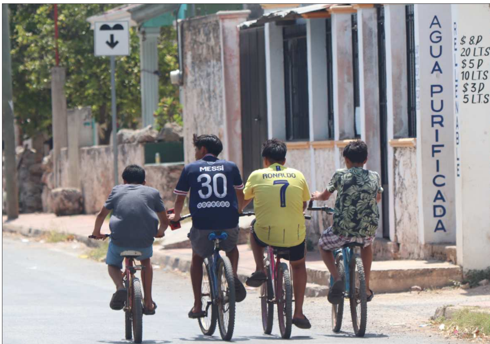
▲ “No se trata de compartir para recibir más. En cuanto aparece esa intención, el gesto se reduce (...) La vida responde”.

*También puedes leer el contenido de Lourdes Álvarez en Substack.