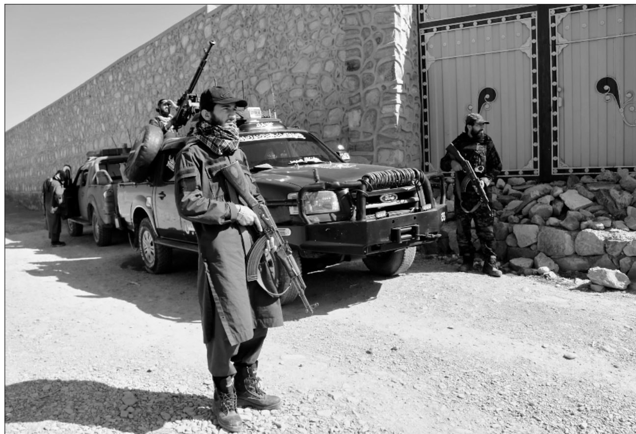
▲ Las hostilidades entre Afganistán y Pakistán han continuado en las últimas semanas con menor intensidad tras las negociaciones, de acuerdo con el informe de la Organización de las Naciones Unidas.

Los acontecimientos se produjeron dos días después de que funcionarios afganos dijeran que morteros y misiles disparados desde Pakistán alcanzaron una universidad y viviendas en