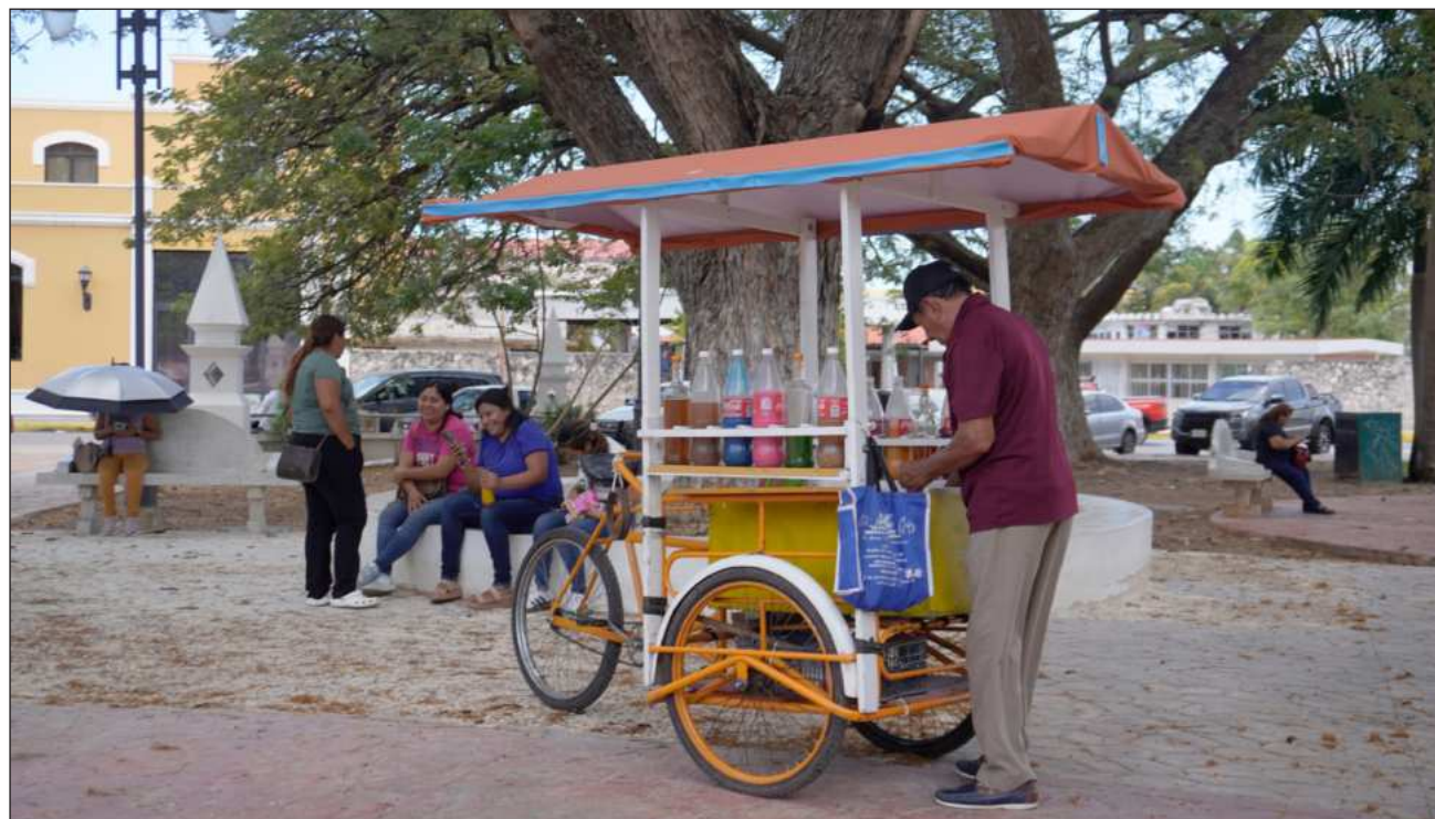
▲ El Indicador Trimestral de la Actividad Económica Estatal, elaborado por el Inegi, incorpora información preliminar de distintas actividades económicas, como las agropecuarias, industriales, comerciales y de servicios.

Campeche cayó 10.6% y Q. Roo 6.1% en tanto que Yucatán tuvo un alza de 2%