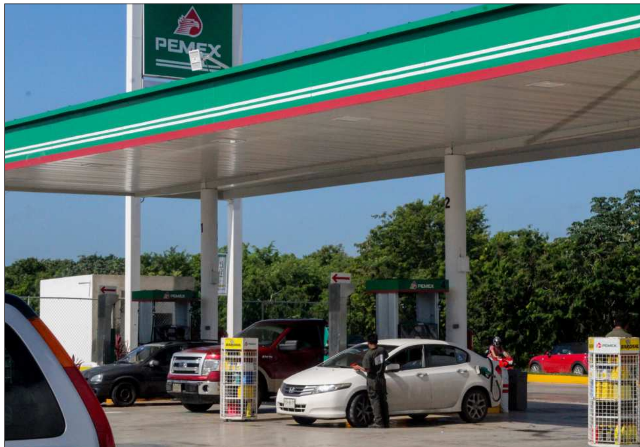
▲ Durante su conferencia de prensa matutina, aclaró que se trata de una acción temporal, definida ante los efectos de la guerra en Irán y el cierre del estrecho de Ormuz que ha generado una escalada en los costos del petróleo.

El S&P 500 terminó la jornada con una baja de 0.04 por ciento, hasta los 7 mil 136.13 puntos. Mientras que el Nasdaq avanza 0.04 por ciento, a 24 mil 673.24 unidades. El mercado registró un cierre en terreno negativo, con acciones y bonos presionados.