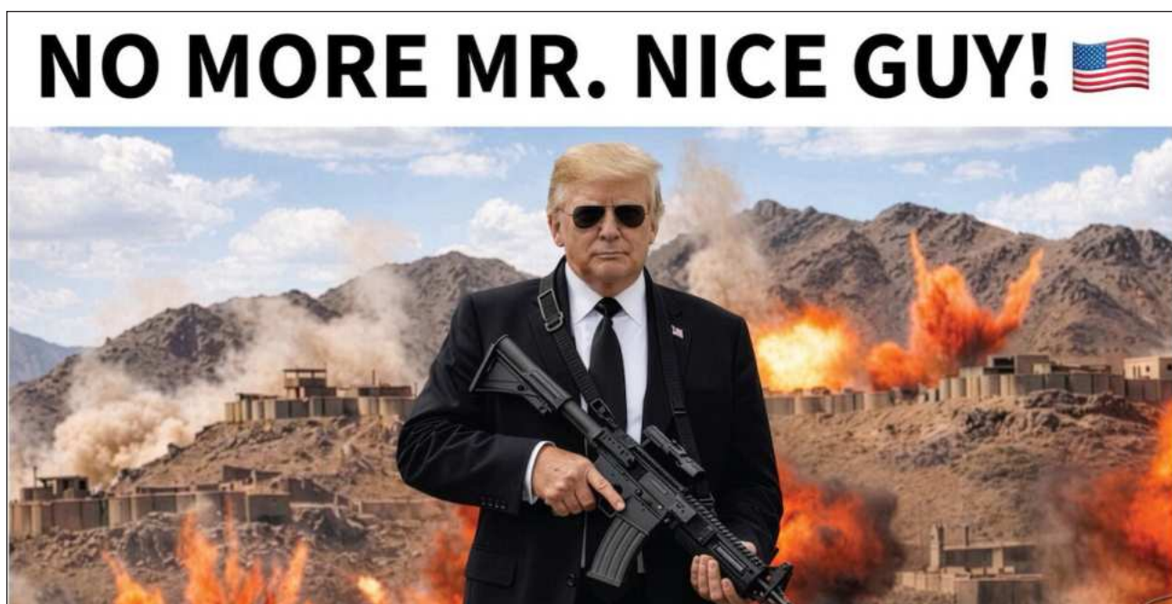
▲ El presente Donald Trump, quien ha dicho que Irán puede llamar si quiere hablar, señaló que la república islámica “no se ponía de acuerdo” en una publicación en la red social Truth Social.

El presidente republicano debatió con las principales firmas del sector en su país