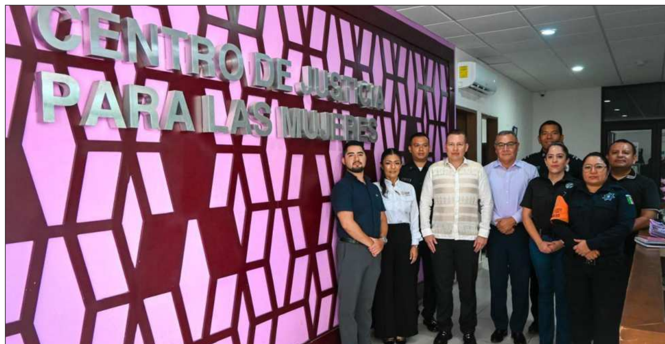
▲ La reunión fue encabezada por la Fiscalía General del Estado y se llevó a cabo en el Centro de Justicia para las Mujeres, con la participación de representantes de diversas dependencias municipales.

Durante el encuentro se abordaron líneas de acción orientadas a reforzar la prevención desde