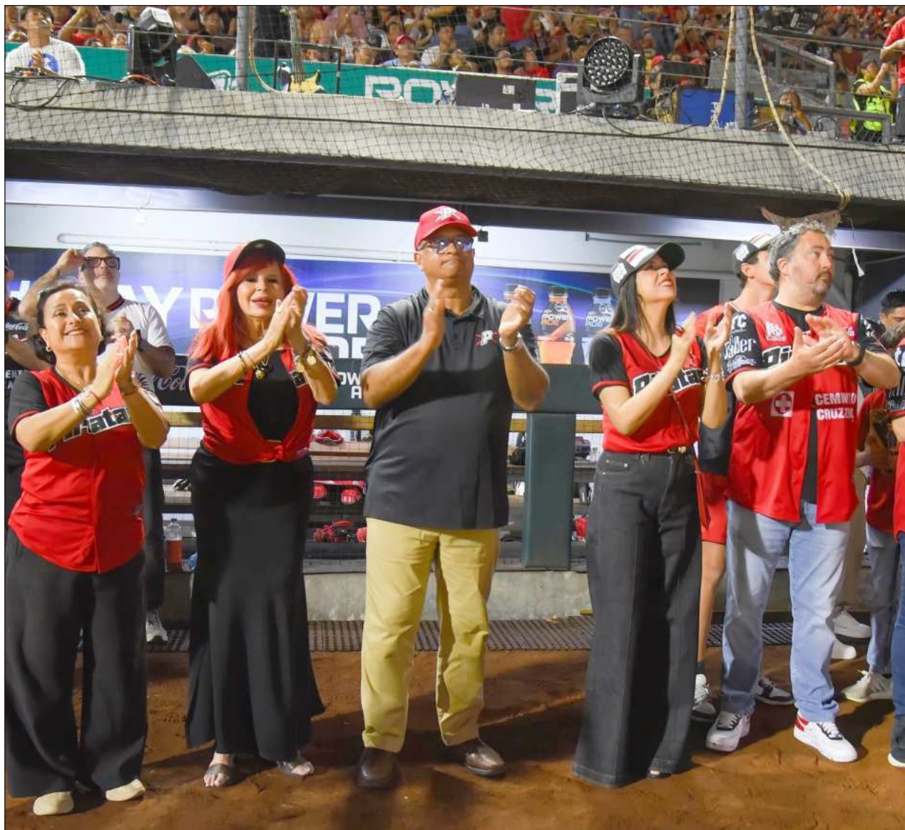
▲ El dirigente estatal de MC calificó las acusaciones de la gobernadora de Campeche como graves e injustificadas.

Mencionaron que no hay medicamentos, sólo se tienen básicos, para tratar enfermedades ambulatorias, pero para temas específicos y controlados, nunca hay.