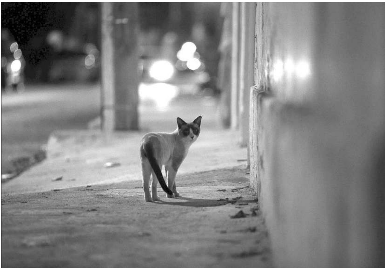
▲ "Atraído por la felicidad que se colaba por debajo de las puertas, Pacheco hizo lo que nunca antes había hecho: se presentó ante desconocidos".