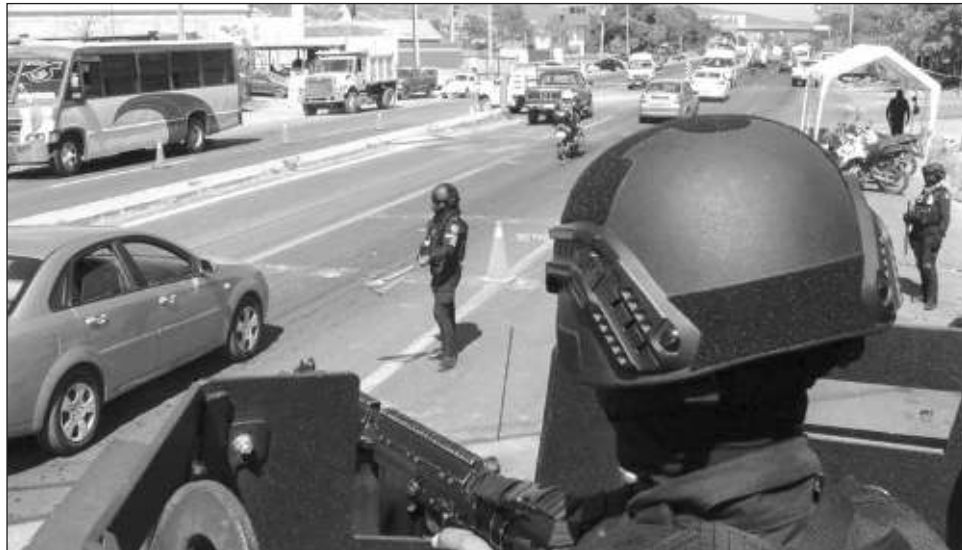
▲ El Presidente subrayó que “nosotros cuidamos a todos, a todos los seres humanos, tenemos la obligación de hacerlo, de evitar la violencia y lo hacemos, y vamos avanzando”.

Interrogado sobre el crecimiento de la violencia en Cozumel, Quintana Roo, y el trasiego de droga a esa isla, el mandatario reconoció que hay puntos del país donde ha crecido la presencia del crimen organizado.