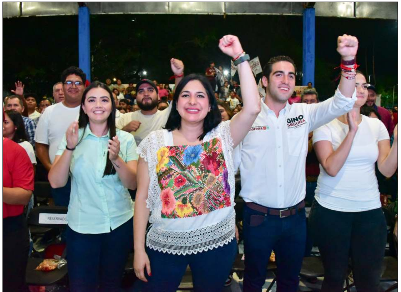
▲ En el domo de la colonia Nichte Há, la candidata de la coalición Sigamos Haciendo Historia en Quintana Roo estuvo acompañada por simpatizantes, militantes y referentes de Morena.

La candidata de Sigamos Haciendo Historia en Quintana Roo apuntó que, desde Solidaridad, “seremos parte de la historia de nuestro país, historia que sólo es posible gracias a las condiciones que ha creado la 4T. Hoy lo vimos en el debate, ya ganamos porque, como dice la doctora Claudia Sheinbaum, es el tiempo de las mujeres de la 4T.”