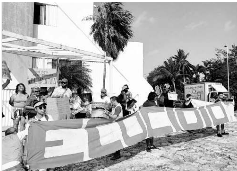
▲ Los activistas acudieron a las oficinas de la Semarnat en Cancún para acusar que la dependencia ha sido cómplice y omisa ante "el inmenso ecocidio" que han dejado proyectos como el Tren Maya, el puente vehicular Nichupté o el recién inaugurado hotel Grand Island.

"Basta con esta explicación de reactivación económica. Cuando se cambió el uso de suelo de Solaris eso decía el acta de Cabildo: hay