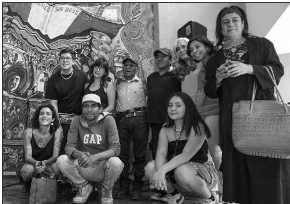
▲ La obra Un mural zapatista para Tlatelolco incluye figuras como Emiliano Zapata, un machete y símbolos indígenas de América.

La obra incluye motivos de lucha social, con figuras como Emiliano Zapata, un machete y una multitud de personas, así como símbolos indígenas de América. Consigna la leyenda: “Nunca más un México sin nosotros”.