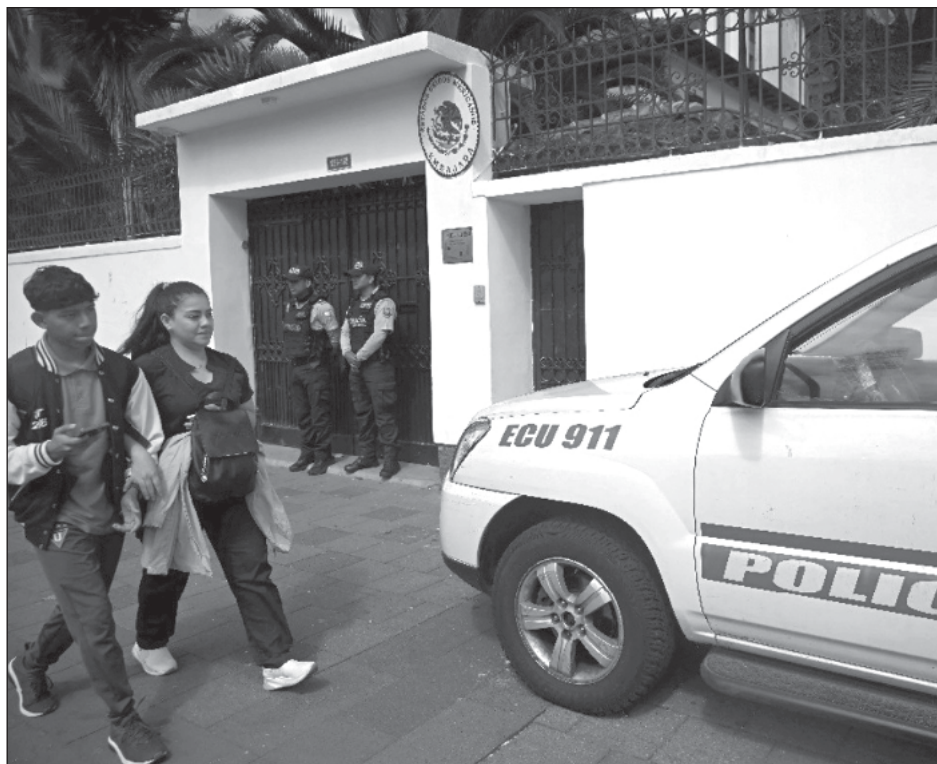
▲ El asalto a la embajada de México por parte de elementos de un cuerpo de élite de la Policía Nacional de Ecuador, la noche del 5 de abril para detener a Glas, desató una crisis política entre ambos países que escaló hasta la ruptura de relaciones diplomáticas.

Glas, de 54 años, ocupó la vicepresidencia entre 2013 y 2017 durante el gobierno del expresidente Rafael Correa, tras lo cual fue procesado por la justicia y recibió dos sentencias por corrup-