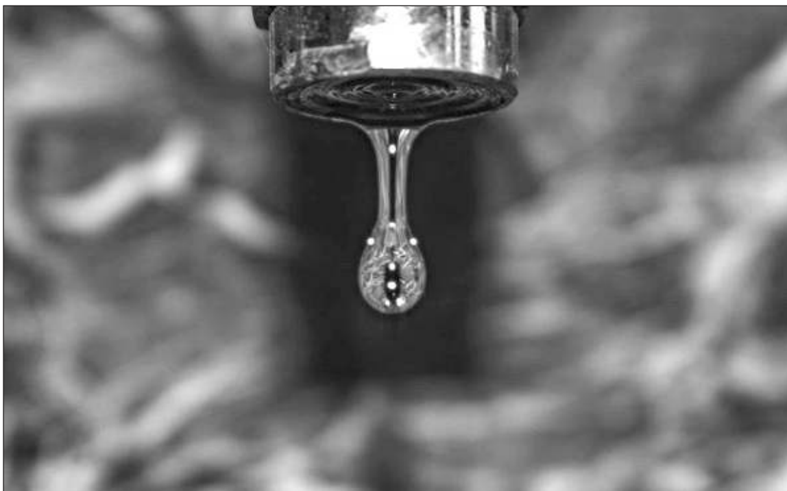
▲ Aguakan se posiciona como el proveedor más importante del agua en la región, por lo que se ha habilitado una línea telefónica para atender los reportes de forma oportuna. Cuidar el agua es una responsabilidad compartida.

Después de que compartas la información, nos encargaremos de atender de forma oportuna el reporte a fin de que el problema pueda ser solucionado a la brevedad.