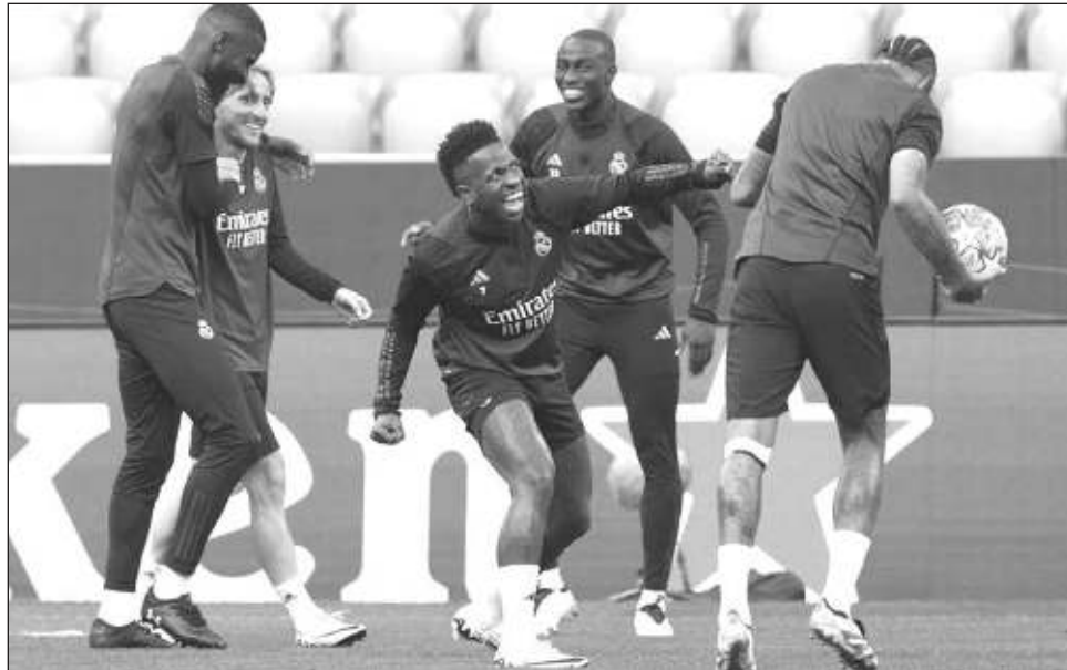
▲ El brasileño Vinicius Júnior (centro), del Real Madrid, bromea con algunos de sus compañeros durante un entrenamiento en Múnich previo al duelo de este martes en la Liga de Campeones de Europa.

Tuchel, quien se marchará del Bayern al final