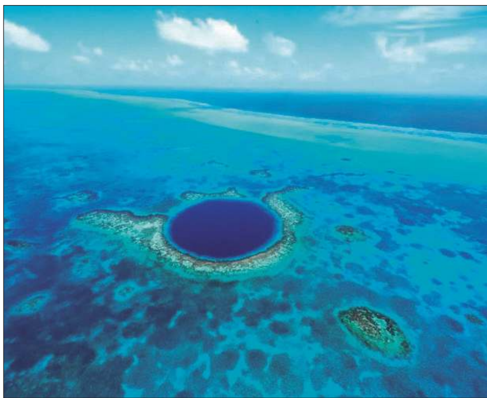
▲ Este agujero azul posee morfología similar a la de un cenote, pero se diferencia por la dominancia de agua con características salobres o marinas.

Las características del agua en las profundidades del agujero azul se asemejaron a las que han sido reportadas en el mar Caribe a profundidades de 0-150 m, lo que sugiere la probable existencia de conexiones subterráneas.