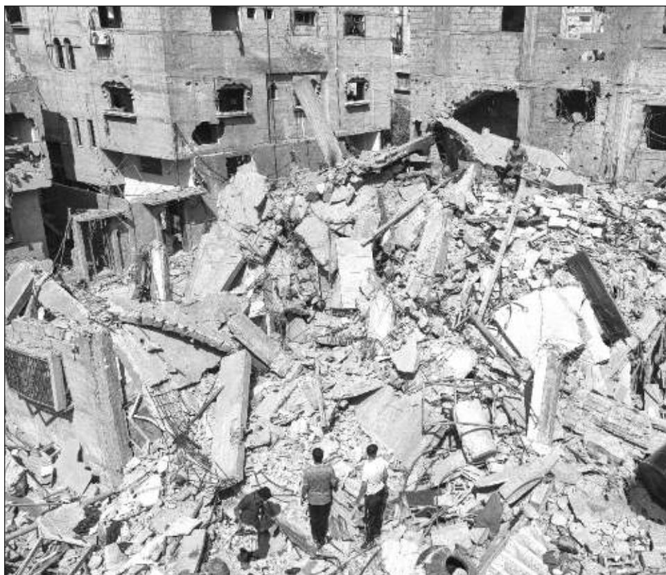
▲ "Espero que Hamas acepte este acuerdo y, francamente, toda la presión del mundo y todos los ojos del mundo deberían estar puestos hoy en ellos para decirles que acepten ese acuerdo": David Cameron.

"Hay que considerar un futuro político para el pueblo palestino, pero también hay que considerar la seguridad para Israel y esas dos cosas tienen que ir juntas", añadió.