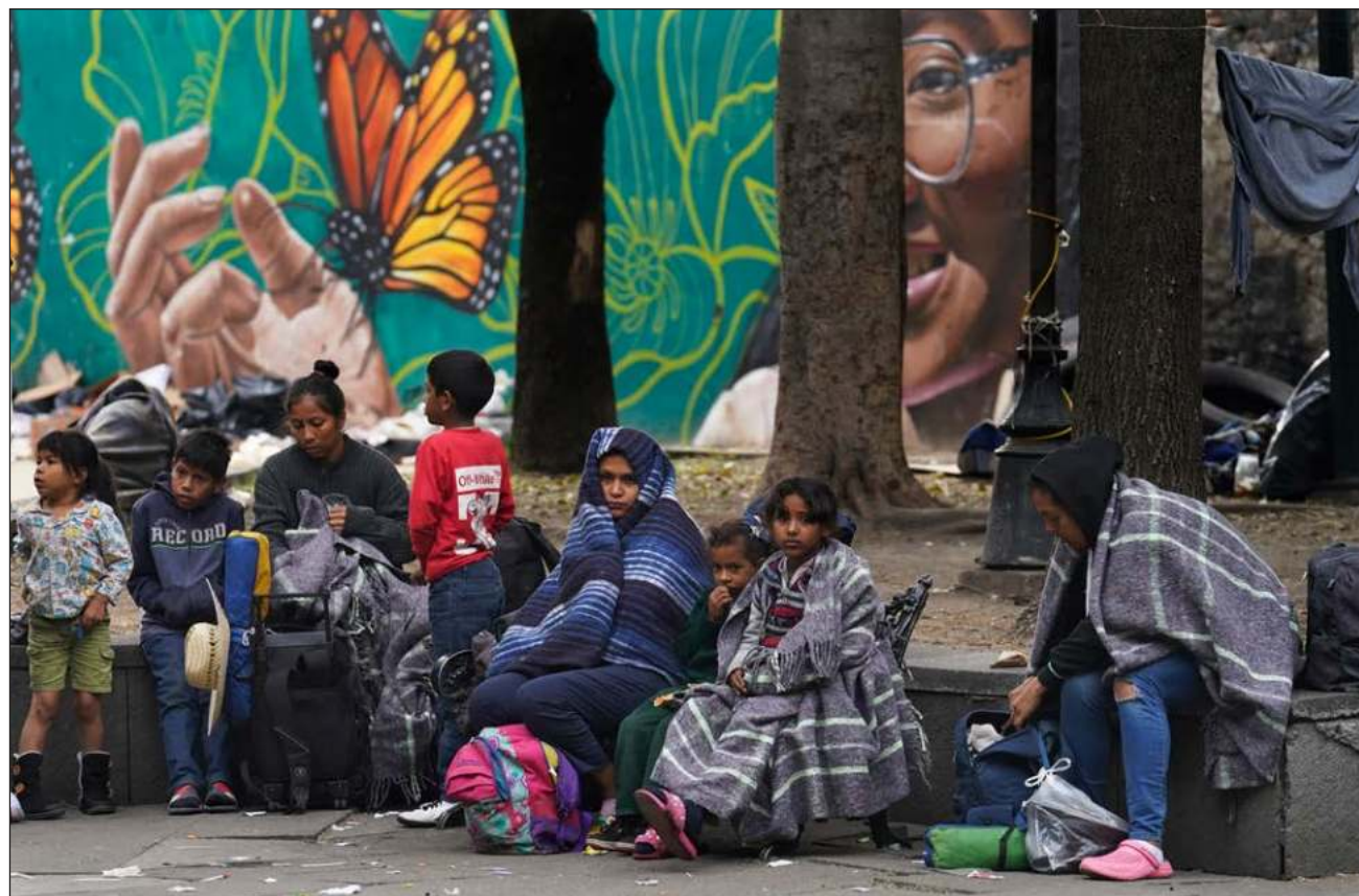
▲ Las violaciones de derechos humanos, que incluyen torturas, uso excesivo de la fuerza y deportaciones ilegales, se han denunciado en centros operados por agentes del Instituto Nacional de Migración y miembros de la Guardia Nacional.

El informe denuncia por otro lado la proliferación de mensajes de discriminación y odio racial contra indíge-