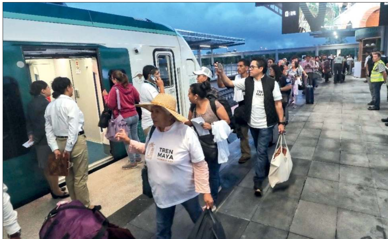
▲ Quintana Roo, con un avance de 144.9 por ciento, sobresale en actividades secundarias por el proyecto del Tren Maya, mientras que el sector terciario estuvo apoyada por Oaxaca, Yucatán y Campeche.

Con cifras originales, sin ningún proceso estadístico, Quintana Roo mantiene el liderazgo en el crecimiento de la actividad económica a nivel nacional, con un avance