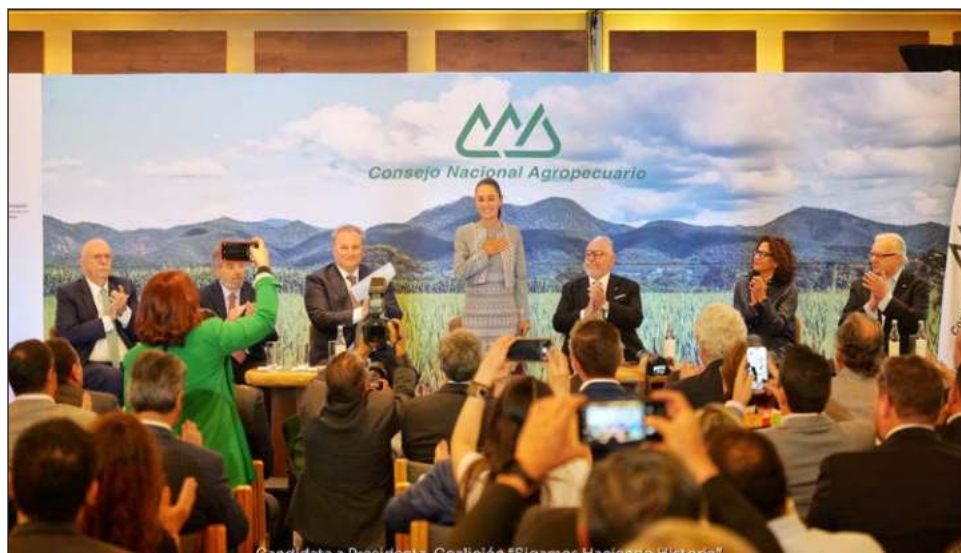
▲ Frente al sector agrícola que ocupa 75 por ciento del agua en el país, la morenista llamó a revisar las concesiones y permisos del vital líquido, y distribuirlo de mejor manera.

Agregó que la tecnificación del campo mexicano pasa por revisar las concesiones y permisos de agua, y distribuirla de mejor manera. "Hay una sequía que no sabemos cuándo va a ter-