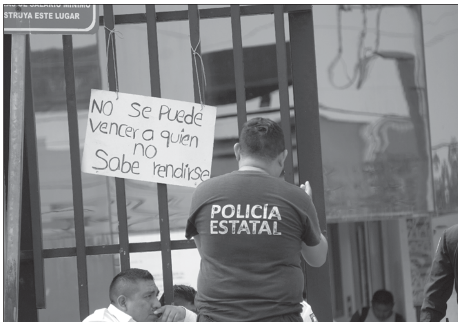
▲ El secretario de Gobierno dijo que la protesta sólo afecta a la ciudadanía.