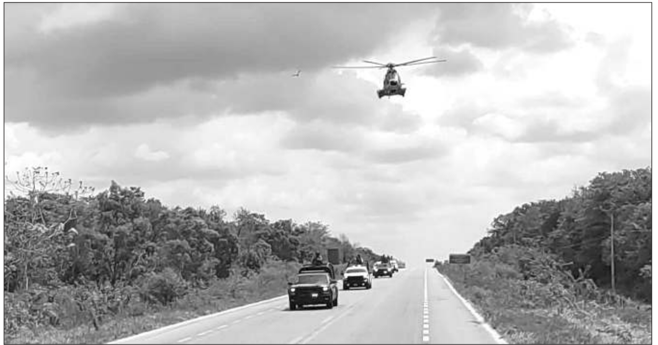
▲ La llegada del personal castrense responde a que en los últimos días la delincuencia organizada llevó a cabo diversos hechos criminales en Chetumal y comunidades aledañas, como el asesinato de un elemento de la SSC. Foto 34 Zona Militar

La estrategia de combate a la delincuencia se centrará en comunidades como Luis Echeverría, Calderitas, Morocoy, El Cedral y El Gallito, entre otras, a fin de colaborar con las autoridades locales de los tres órdenes de gobierno, para revertir los índices delictivos de privaciones ilegales de la