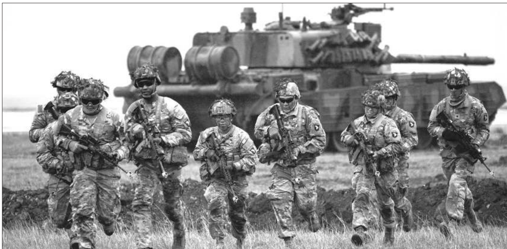
▲ Más de 18 mil soldados han dejado voluntariamente sus unidades; los tribunales militares rusos condenaron este mes de marzo a 64 personas por deserción.

El número total de condenas desde la movilización parcial decretada por el Kremlin en septiembre de 2022 se eleva a 7 mil 400, según la fuente, que aludía también al número "récord" rusos que eluden el servicio militar que están pidiendo asilo en países de Occidente.