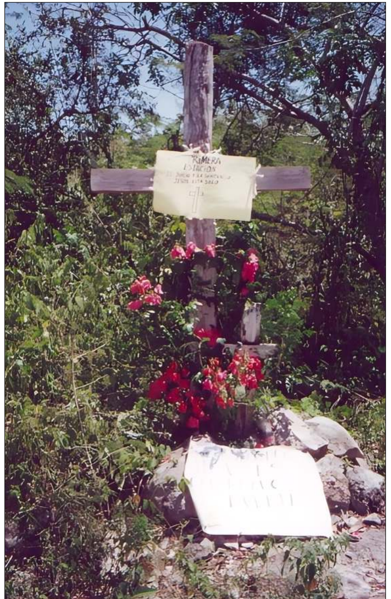
▲ Cruz de báalam , Dzitnup, Valladolid, Yucatán.

con el exterior, ya sean estos caminos que conducen hacia la cabecera municipal ( nojoch bejo'ob ), carreteras o "caminos reales", hacia otras comunidades cercanas ( uchben bejo'ob o caminos antiguos), hacia los campos de cultivo, ranchos o colmenares ( t'ul bejo'ob o caminos angostos), entre otros. Finalmente, es importante mencionar que la modernización de las carreteras en el estado ha resultado en la remoción de antiguas cruces de báalamo'ob , las cuales en ocasiones no son reinstaladas siguiendo el procedimiento ritual adecuado. Ante esta situación y en línea con la misma cosmovisión, los residentes locales consideran que la falta de estas cruces protectoras en las