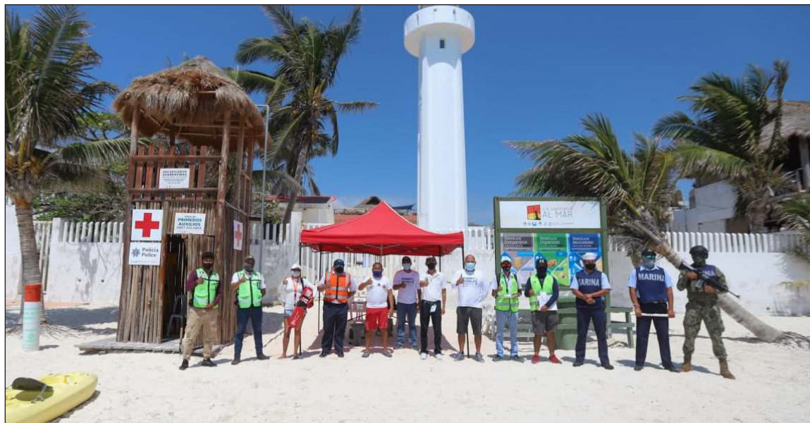
▲ El ayuntamiento intensificó la campaña de prevención contra el coronavirus.

"El objetivo trazado es que tengamos un periodo vacacional exitoso en todos los sentidos. Queremos que la recuperación económica y turística siga avanzando a paso firme, y que tengamos saldo blanco, sin incidentes que lamentar y, por su puesto, procu-