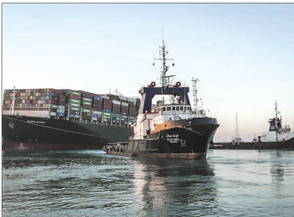
▲ La importante arteria marítima estuvo bloqueada por casi una semana.

Las principales causas de reclamación en la Institución Financiera fueron consumos vía internet no reconocidos con el 33 por ciento o dos millones 85 mil 62 reclamaciones; consumos no reconocidos con 22 por ciento o un millón 387 mil 498 y que el cajero automático no entrega la cantidad solicitada con seis por ciento o 364 mil 640 reclamaciones.