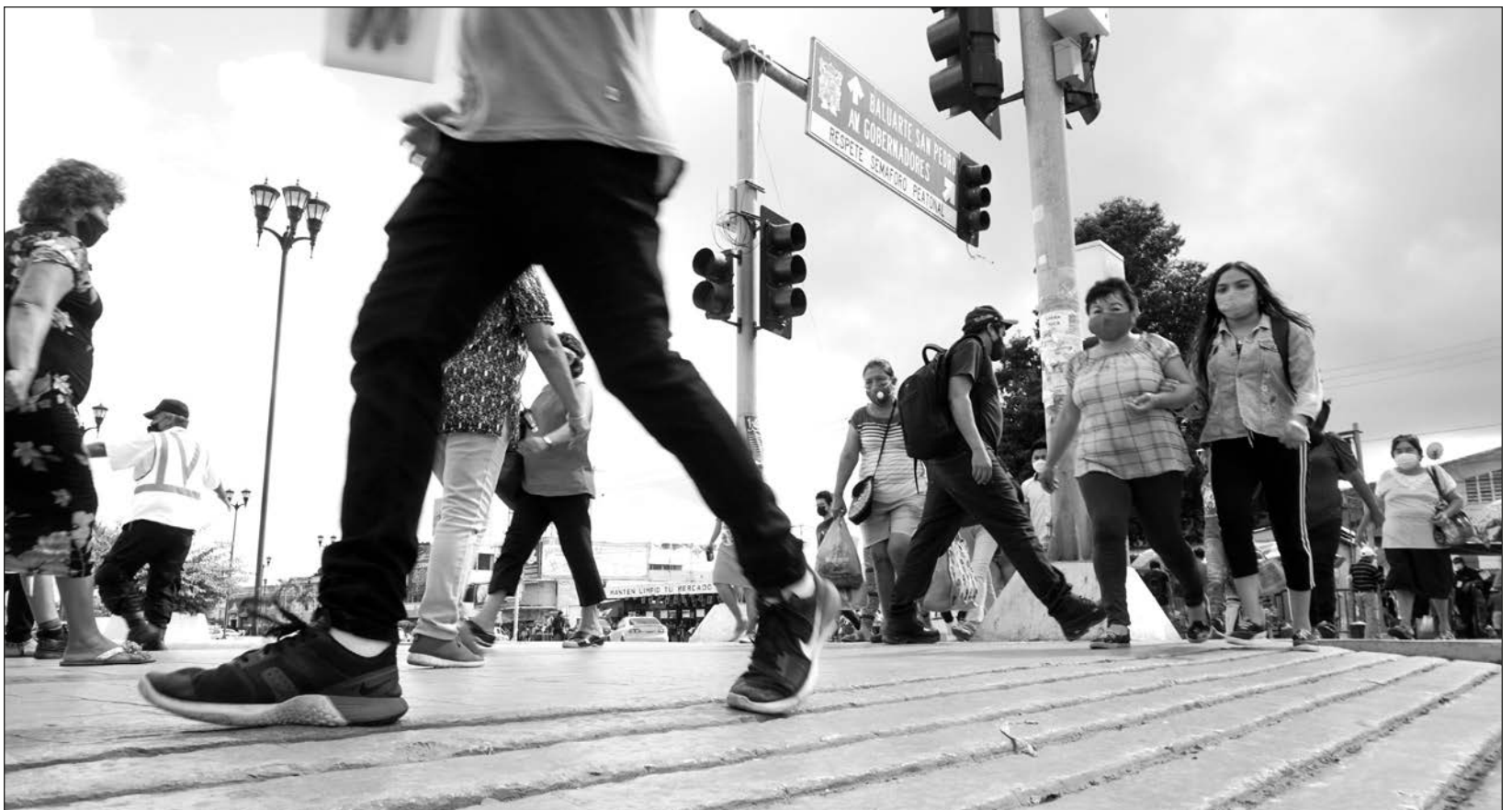
▲ En México, el 3 por ciento de la población padece trastorno bipolar tipo 1, el más fuerte, con episodios de manía y depresión.

El reto para la medicina entonces, dijo, es mejorar los tiempos de diagnóstico. En esa materia, lamentó que en México estos procesos puedan retrasarse hasta 10 años, pues las personas suelen “brincar” de un especialista a otro o se complica con otras situaciones como consumo de drogas y alcohol.