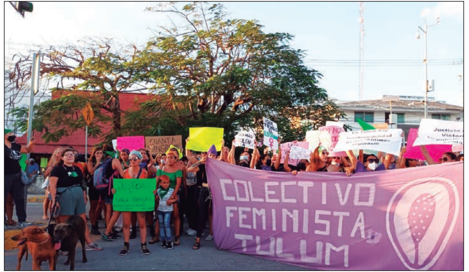
▲ Úuchik u kíinsa'al ko'olelo'ob tu lu'umil Quintana Roo te'e k'iino'oba', yanchaj ya'abach múuch'kabilo'ob tu much'ajubáajo'ob ti'al u líik'sik u t'aano'ob, yéetel ti'al u k'aatiko'ob ka xu'ulsa'ak loobilajil yaan.

Ko'olelo'ob ti' QRooe' tu líik'saj u t'aano'ob úuchik u kíinsa'al ko'olelo'ob te'e k'iino'oba'