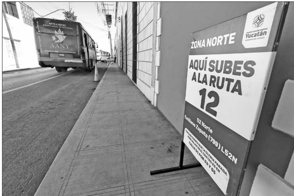
▲ Las reubicaciones forman parte del Plan de Mejora a la Movilidad Urbana.

Entre las mejoras que se realizarán conforme al plan acordado con la Canaco Servytur Mérida, también destacan modificaciones en las áreas de carga y descarga y en los horarios para realizar estas tareas en este punto de la ciudad, entre otros acuerdos.