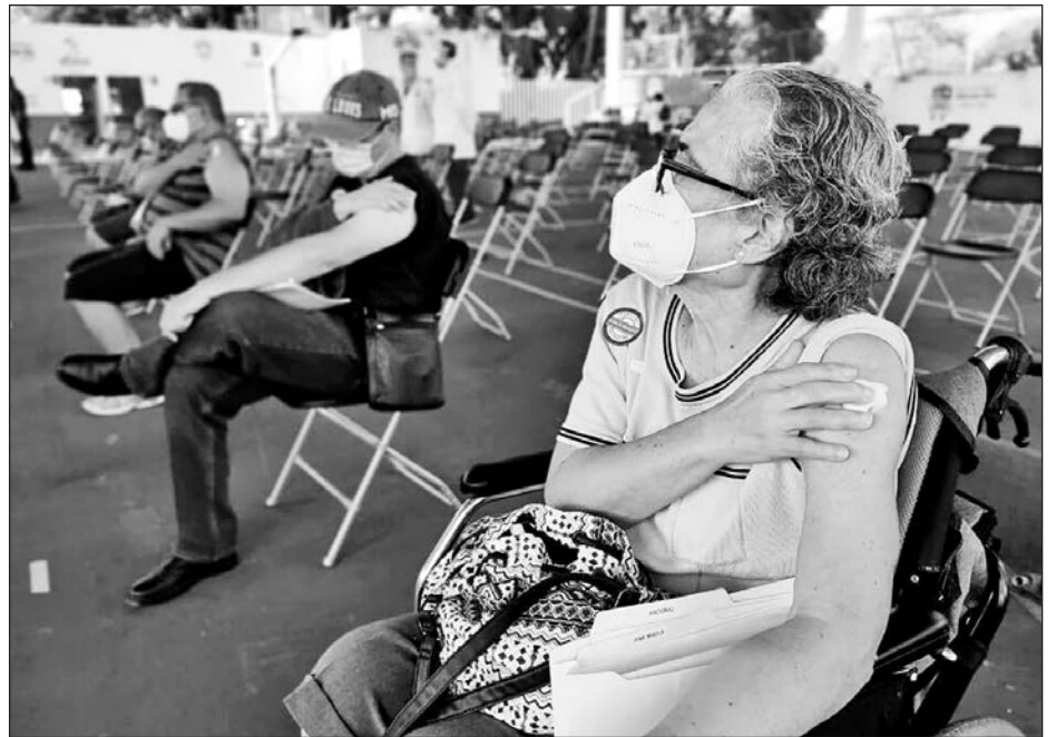
▲ En total se aplicarán 6 mil dosis del biológico Sinovac.

El primero de los convenios estuvo a cargo de AN-TAD y tiene como objetivo fomentar acciones para el desarrollo, el fomento y la modernización de las micro, medianas y pequeñas empresas; en el segundo, con Concamin, se establecen acciones relacionadas con la difusión, la promoción y el intercambio de experiencias que coadyuvan con el desarrollo del sector industrial, y en el tercero, con Prodecon, se permite establecer las bases generales para el intercambio de información y actividades conjuntas con el gobierno del estado.