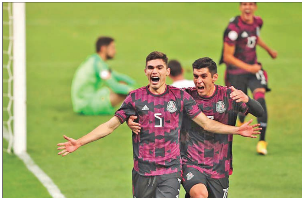
▲ El Tricolor obtuvo sin problemas su boleto a los Juegos de Tokio.

Johan Vásquez amplió la ventaja ocho minutos después, al encontrarse el rechace a un cabezazo propio que se estrelló en el poste y que, con un poco de fortuna, le quedó cómodo para remecer las redes.