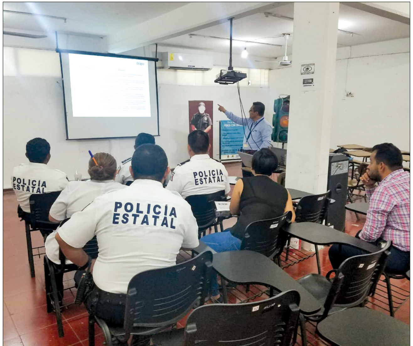
▲ En 2020, la detención arbitraria por parte de elementos de las corporaciones municipales fue el rubro que registró mayor número de quejas por violación a derechos humanos.

En su opinión, los elementos de tránsito no debían acudir a una intervención de este tipo, máximo cuando no se encuentran capacitados para hacerlo; sin embargo, advierte que la falta de personal, obliga a los directivos a colocar a policías en áreas en las que no están debidamente