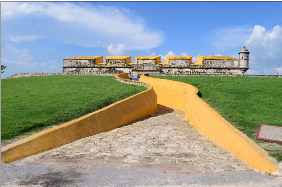
▲ Uno de los museos que vuelve a su horario es el Fuerte de San Miguel.