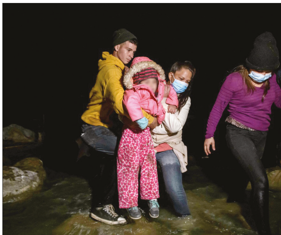
▲ Inmigrantes de Honduras y Guatemala llegan desde México en un bote inflable al lado estadounidense del río Bravo, el 29 de marzo de 2021.

El Acuerdo Marco de Comercio e Inversión de 2013, que establecía formas de impulsar los negocios pero no era un acuerdo en toda regla, se mantendrá suspendido hasta que se restablezca la democracia, aseguró el gobierno del presidente Joe Biden.