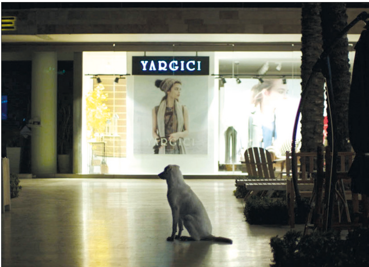
▲ El filme busca obligar a las personas a reconsiderar sus relaciones con otras especies animales. Fotograma de la cinta

También acoge la chaqueta original de Chaplin al encarnar a Hynkel y explica aspectos de las filmaciones como el uso de miniaturas para los tanques con heno del final de la película o las grabaciones de algunas escenas iniciales en avioneta.