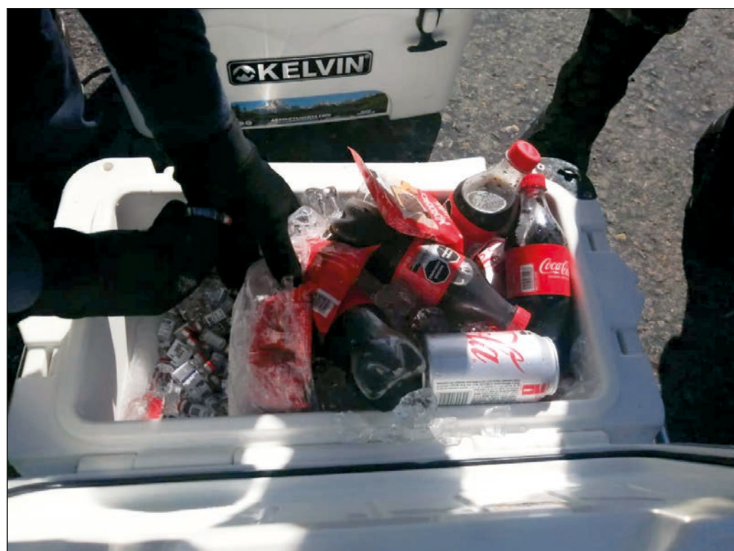
▲ En un escenario de escasez, es inevitable que grupos de interés tan delictivos como inescrupulosos hagan fortunas traficando con vacunas verdaderas o falsas.

Más allá de los esfuerzos que las autoridades aduanales, sanitarias y policiales están obligadas a desplegar para contrarrestar estos trasiegos criminales, es de fundamental importancia que la población se abstenga de acudir a estafadores privados para hacerse vacunar y que se atenga a los tiempos establecidos en el plan oficial de aplicación, para que pueda tener la certeza de una inoculación efectiva. También, es importante difundir elementos de juicio que permitan a los consumidores conocer la calidad y la autenticidad de los productos de protección y diagnóstico que se ofrecen en el mercado.