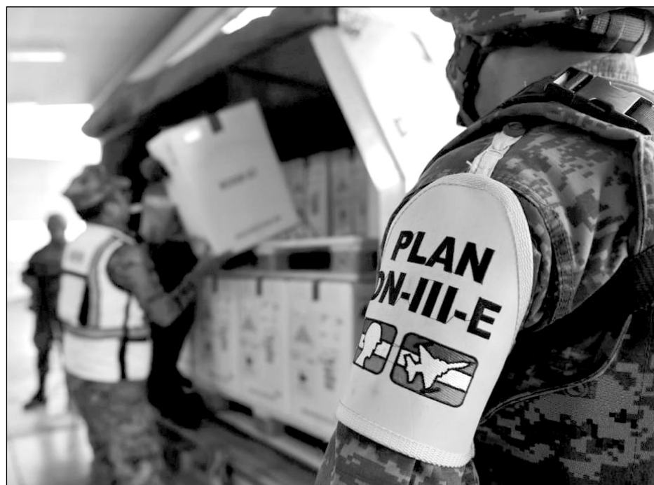
▲ El pasado domingo llegó a México el lote más grande del antígeno recibido en un solo día, con 1.5 millones de dosis.

Gracias a los acuerdos con el gobierno de Joe Biden, México fue al primer país al que Estados Unido