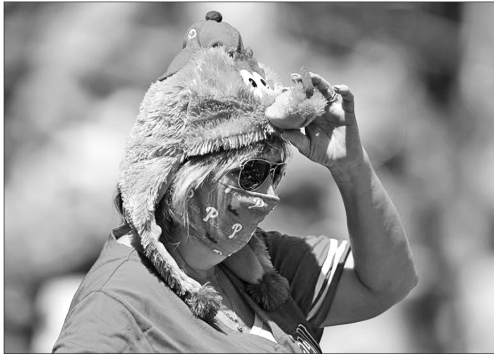
▲ Una aficionada de los Filis se ajusta su sombrero del “Philly Phanatic” durante un encuentro de pretemporada entre Filadelfia y los Yanquis, en Clearwater, Florida.

“A los efectos del presente memorando, los individuos se consideran ‘to-