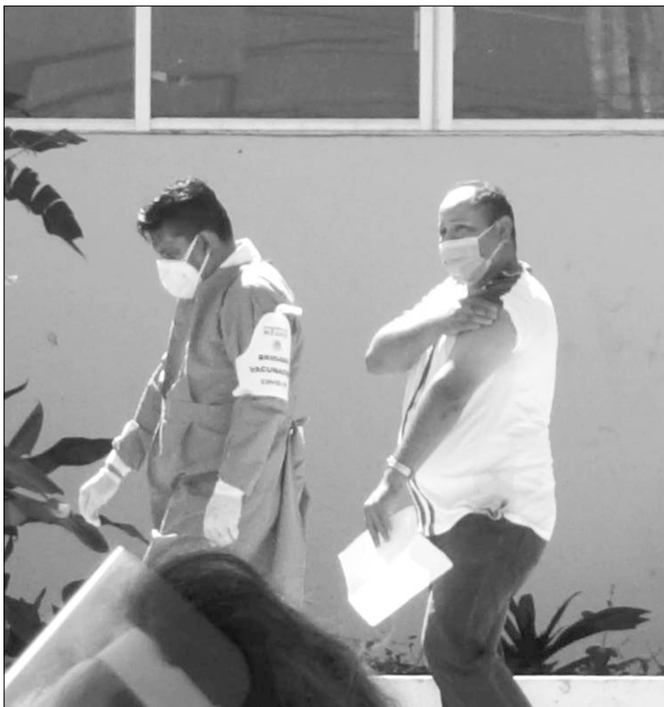
▲ El personal de primera línea ya recibió las dos dosis de la vacuna.

Guerrero del Rivero manifestó que en el caso de los adultos mayores, la fase de aplicación concluyó de manera satisfactoria; en Carmen se vacunó a 23 mil de las 83 mil personas beneficiadas con la inmunización. Comentó que de la misma manera aplicarán 5 mil dosis de la vacuna a maestros de la entidad, de los cuales, 2 mil se encuentran en este municipio.