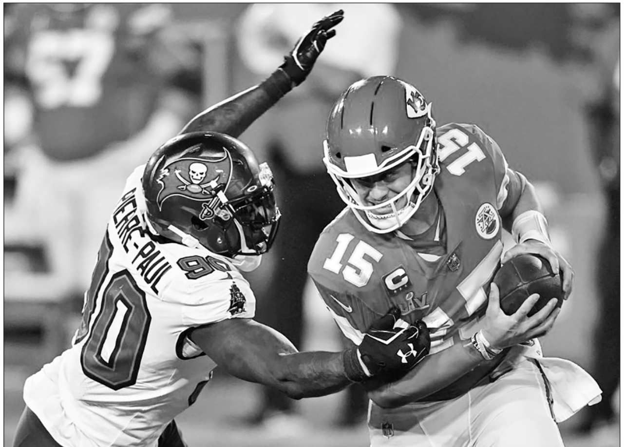
▲ La NFL tendrá una jornada más de fase regular a partir de la próxima temporada.