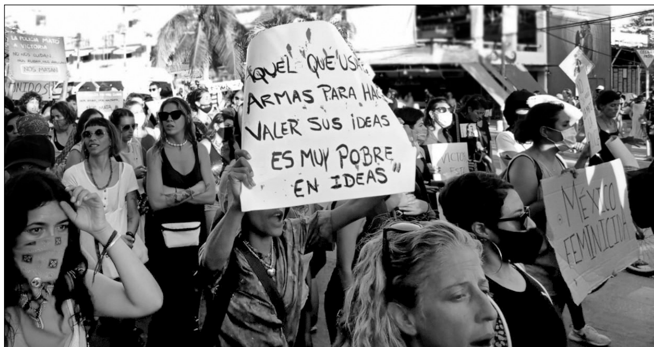
▲ Los habitantes de Tulum salieron a las calles este lunes para protestar por el homicidio de la migrante salvadoreña, así como para exigir un alto a la brutalidad policiaca.

"Policía feminicida", "No murió, la mataron", "Victoria, escucha, esta es tu lu-