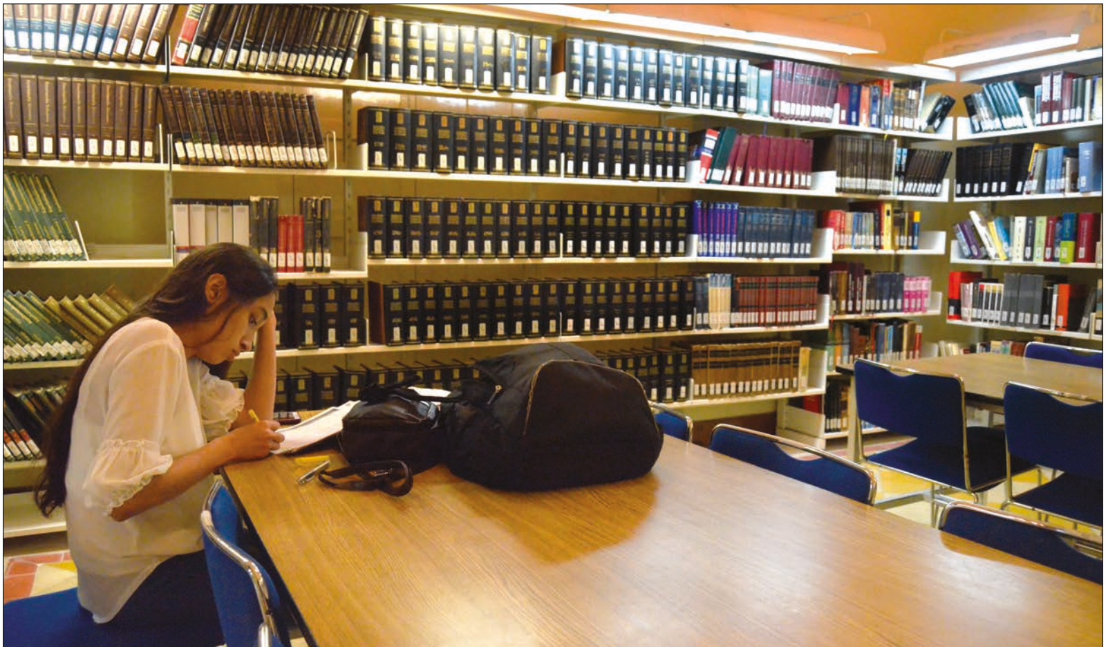
▲ Estudiar no es consumir ideas, sino crearlas y recrearlas.