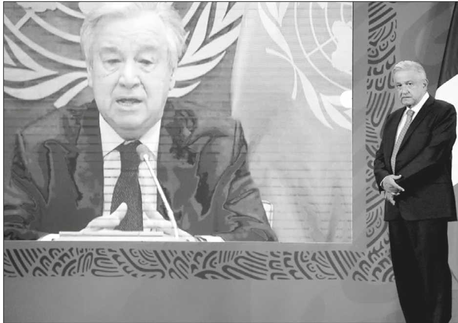
▲ En el foro participó António Guterres, secretario general de la ONU.

“Estamos en esta concepción de transformar e ir a fondo, estamos combatiendo el clasismo, discriminación y racismos como nunca. No hay tolerancia para el machismo, ni hay tampoco impunidad; se castigan crímenes de odio y feminicidios. Las mujeres