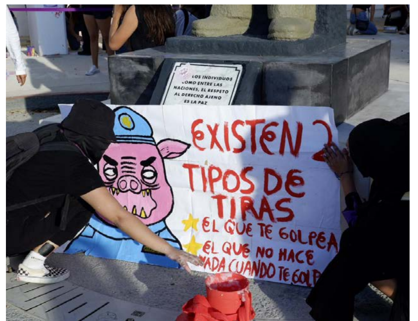
▲ Las activistas exigen detener las simulaciones sobre la atención a la alerta por violencia de género en el estado.