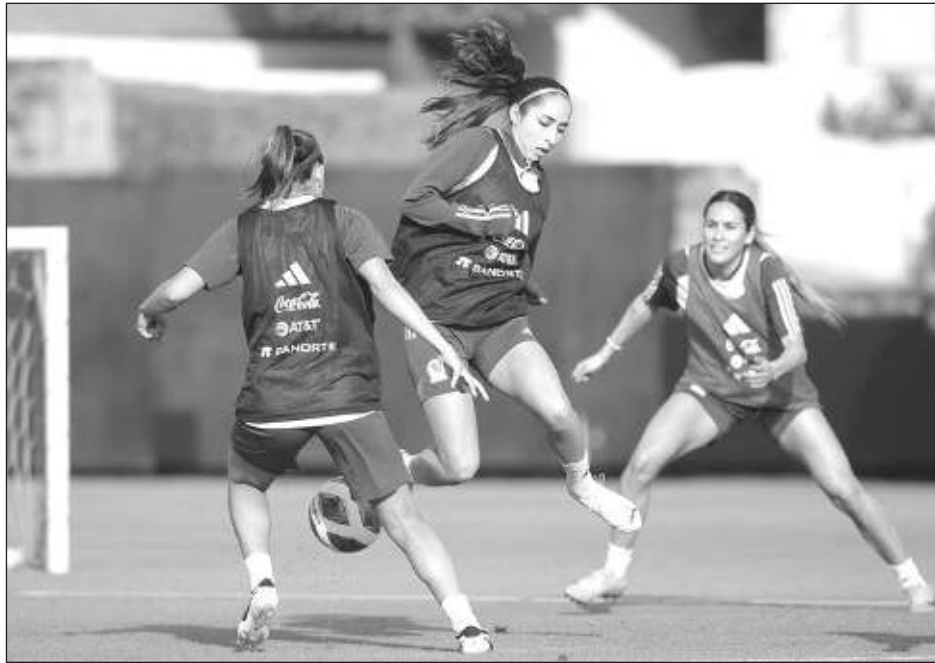
▲ La selección mexicana de fútbol femenino se prepara para la Copa Oro.

No lo asumen como un ajuste de cuentas, pero sí como la oportunidad de probarle a las demás naciones que el Tricolor es capaz de ser protagonista.