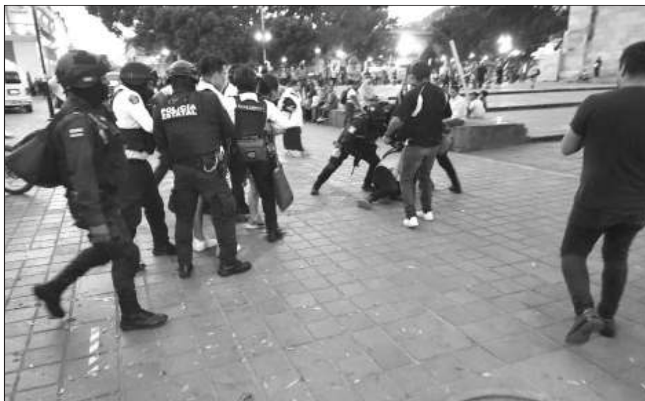
▲ Reprochan las acciones del gobernador Salomón Jara en el manejo del caso.

En un documento, los inconformes reprocharon de clara hipocresía del gobernador Salomón Jara, quien dice que defenderá los derechos de las mujeres y detiene a dos periodistas,