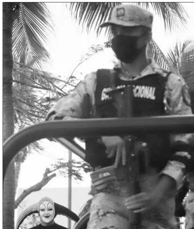
▲ La solución a la violencia pasa entonces por el funcionamiento correcto de varias estructuras y no solamente por los cuerpos de seguridad o el ejercicio de la fuerza.

En tanto, debe admitirse también que hacer realidad la atención a las causas de la violencia más que la aplicación de medidas coercitivas, brindando a los jóvenes acceso a educación, salud, oportunidades, así como garantizar el derecho al