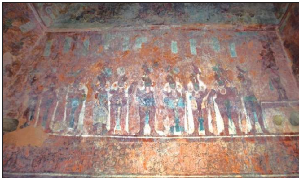
▲ Luego de recordar que para visitar Yaxchilán es necesario llegar a Frontera Corozal y cruzar el río Usumacinta, Esquivel Cruz expresó que el cierre de la comunidad es “porque el gobierno no nos ha respondido como debería de ser para garantizar la seguridad”.

Prestadores de servicios turísticos han denunciado recientemente que indígenas lacandonas armados de Lacanjá Chansayab cobran derecho de piso para permitir visitar la zona arqueológica de Bonampak, situada en esa zona, por lo que algunas