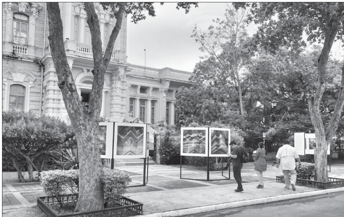
▲ "El Museo Regional de Antropología, Palacio Cantón, no sólo conmemora 65 años de historia, sino que celebra una vitalidad renovada, impulsando la democratización del acceso a la cultura y el patrimonio".

FORMAR PARTE DEL Instituto Nacional de Antropología e His-