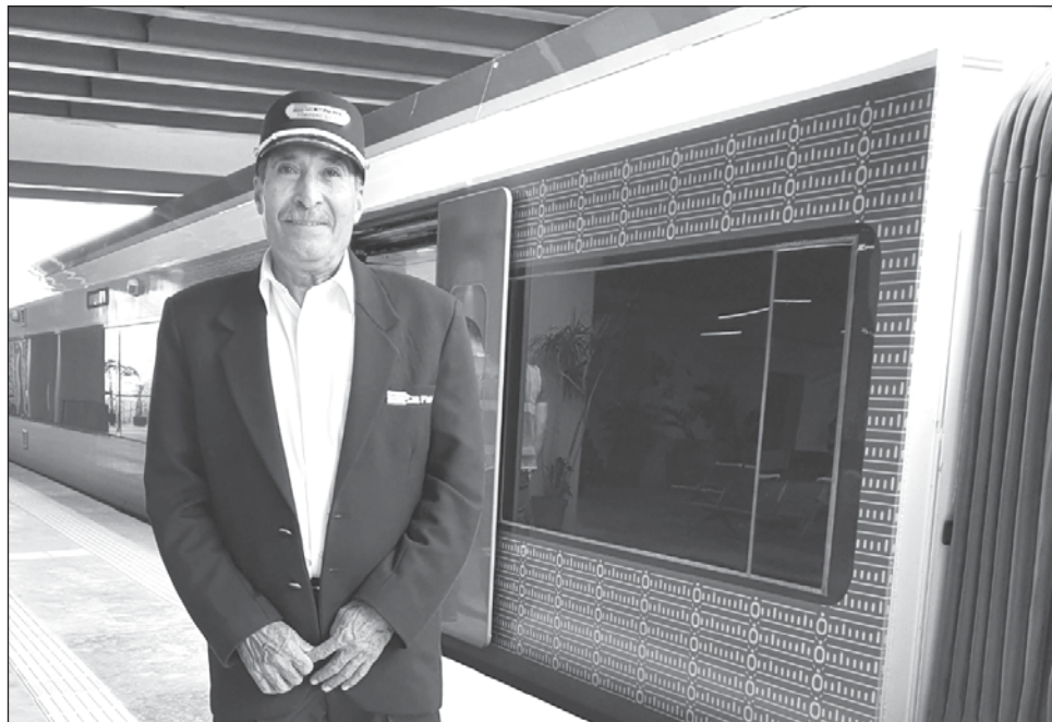
▲ Los recorridos son: de la estación Cancún Aeropuerto hacia Playa del Carmen a las 9, 12 y 15 horas y de Playa del Carmen a Cancún a las 10:30, 13:30 y 16:30 horas.

La empresa ICA reportó que la interconexión entre los tramos 4 y 5 está lista. Es un ramal de 2.1 kilómetros (km) construido a vía doble donde fue necesaria la colocación de 12 aparatos de vía que dan servicio tanto a los