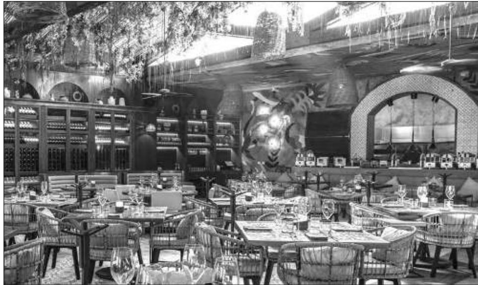
▲ Grupo Anderson's cuenta con 40 restaurantes en México y en conjunto con Estados Unidos y el Caribe tienen 60, de los cuales 20 se encuentran en Quintana Roo, el destino con la mayor participación de la cadena.

Entre heladas que afectan la agricultura, la inflación y el alza a la gasolina, los costos de frutas y verduras son muy altos este invierno, dijo, y puso como ejemplo los espárragos, cuyo