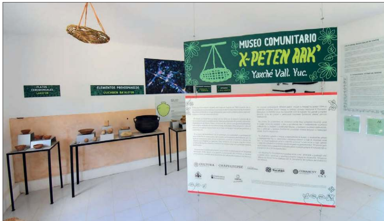
▲ El recinto, ubicado al oriente de Yucatán, es también un punto de encuentro para contar historias y leyendas del pueblo, presentar espectáculos de interés y realizar concursos de cuento, entre otras manifestaciones.

"Hay muchas piezas prehispánicas y coloniales; hay jícaras, hay batidor, también batea; hay una máquina de coser antigua, lámparas, machetes, coas, recipientes y las medicinas tradicionales", detalló Victoriano sobre los elementos en exhibición,