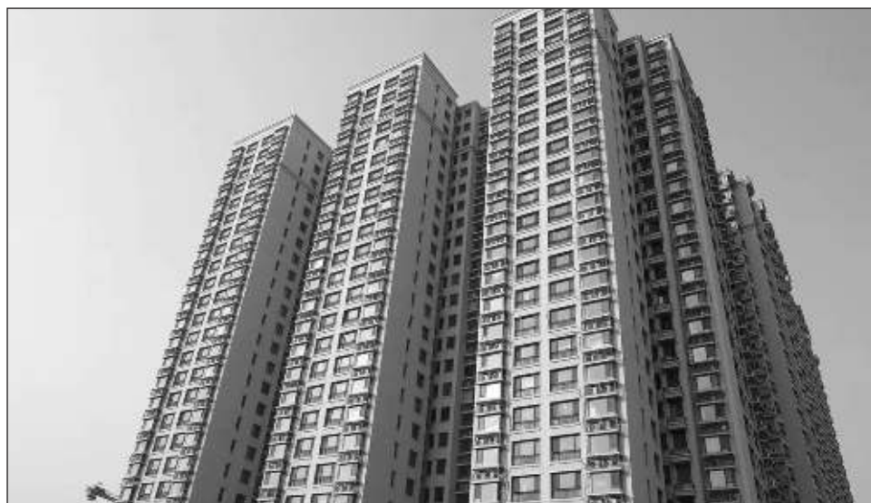
▲ Evergrande, con sede en Foshan, era el mayor promotor inmobiliario de China, con cerca de 70 mil empleados a finales de 2022, pero acumuló deudas por valor de más de 300 mil millones de dólares.

Está, sin embargo, por ver cómo una decisión tomada en la región semiautónoma china de Hong Kong puede aplicarse en la China continental donde las leyes son diferentes. Teniendo en cuenta "la obvia ausencia de