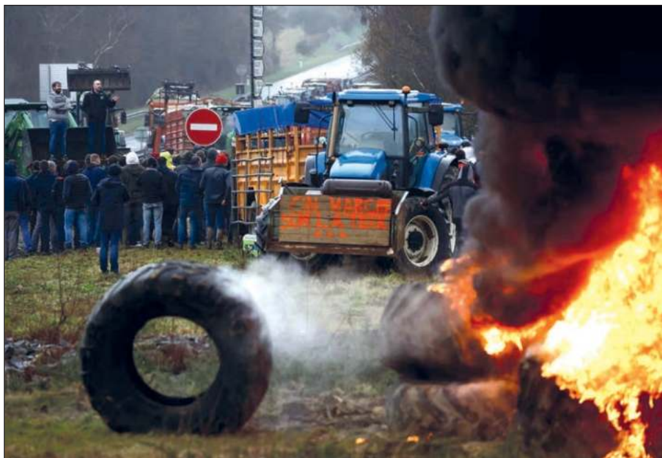
▲ Las autoridades, que hasta ahora evitaron frenar las protestas, movilizaron 15 mil policías y gendarmes para evitar el bloqueo de los aeropuertos parisinos.

Las autoridades, que hasta ahora evitaron frenar las protestas, movilizaron