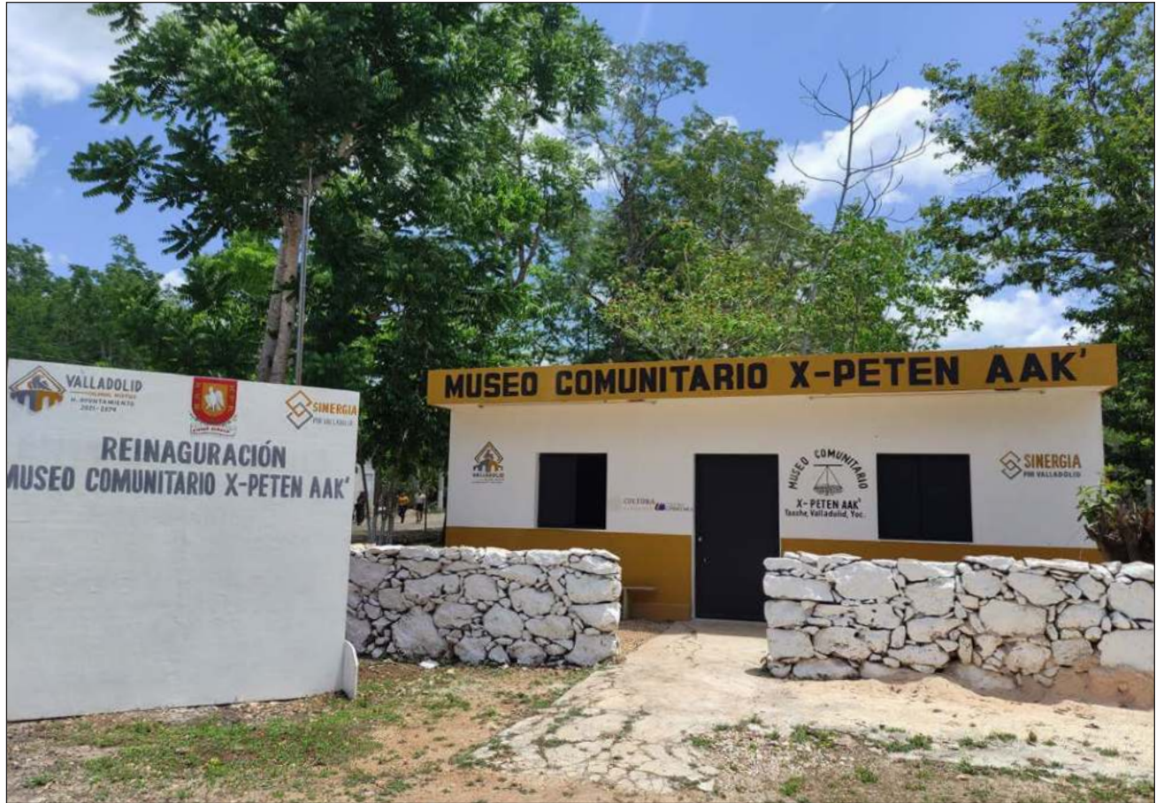
▲ Tuláakal ba'ax yane', yáax tsikbalta'ab tumen kaaj.