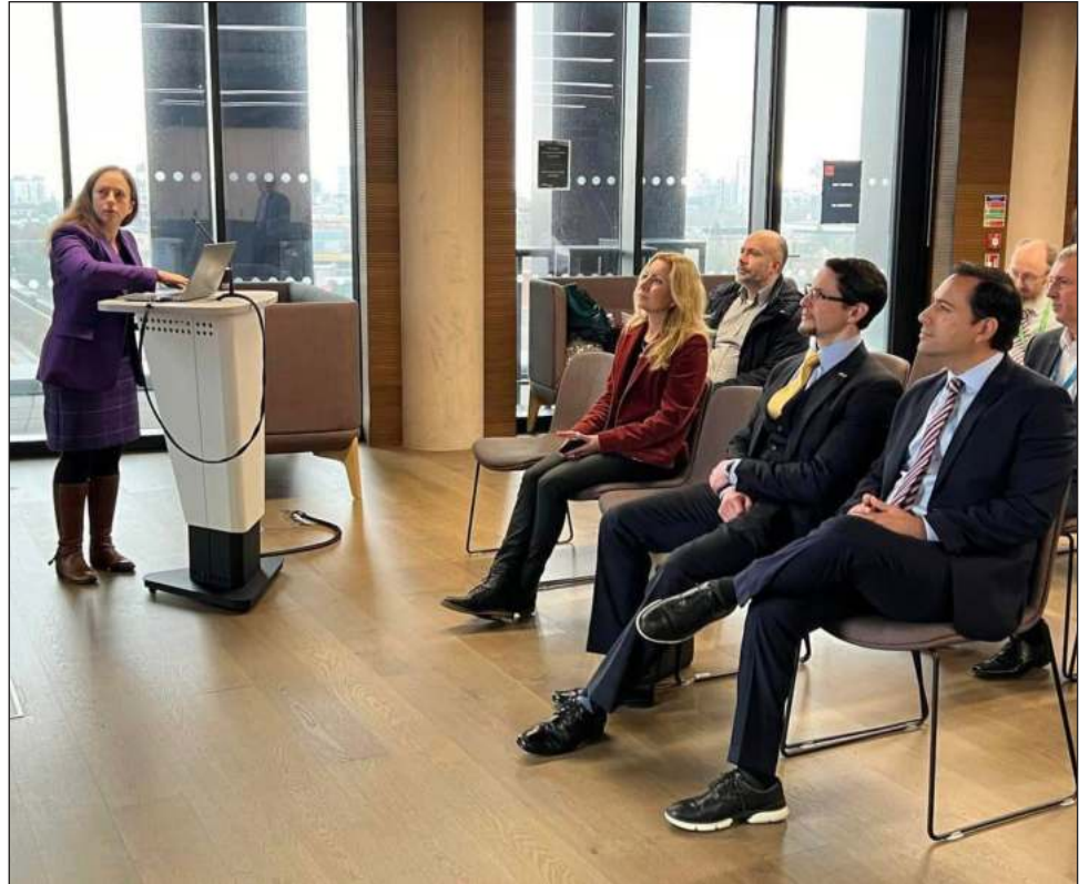
▲ En gira de trabajo, el gobernador Mauricio Vila Dosal conoció la Escuela de Ciencias de la Computación e Informática de la Universidad de Cardiff, en Gales.

Vila Dosal aseguró que a través de estas acciones busca seguir fortaleciendo la educación superior en Yucatán.