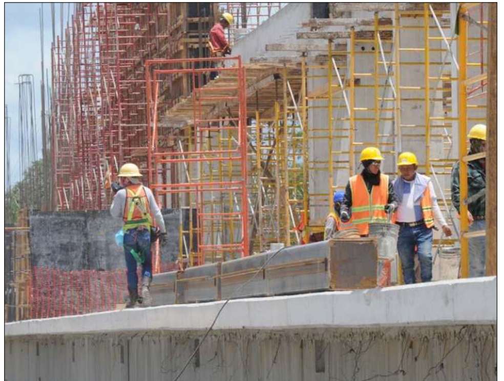
▲ Respecto al caso de las actividades secundarias, dedicadas a la transformación de la materia prima, Quintana Roo se posiciona en el primer lugar con 242 por ciento y Yucatán y Campeche en sexto y octavo con 11.7 y 7.4 por ciento.

El Inegi explica que para la integración del ITAEE se