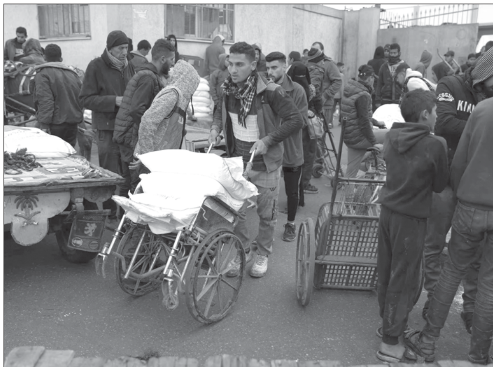
▲ Los países esperan que se aclaren las denuncias de que trabajadores de la UNRWA colaboran con Hamas y participaron en los ataques del 7 de octubre contra civiles israelíes.

Por su parte, el secretario general de la ONU, Antonio Guterres, ha pedido a la comunidad internacional que no suspenda su apoyo a la agencia, ya que "los presuntos actos