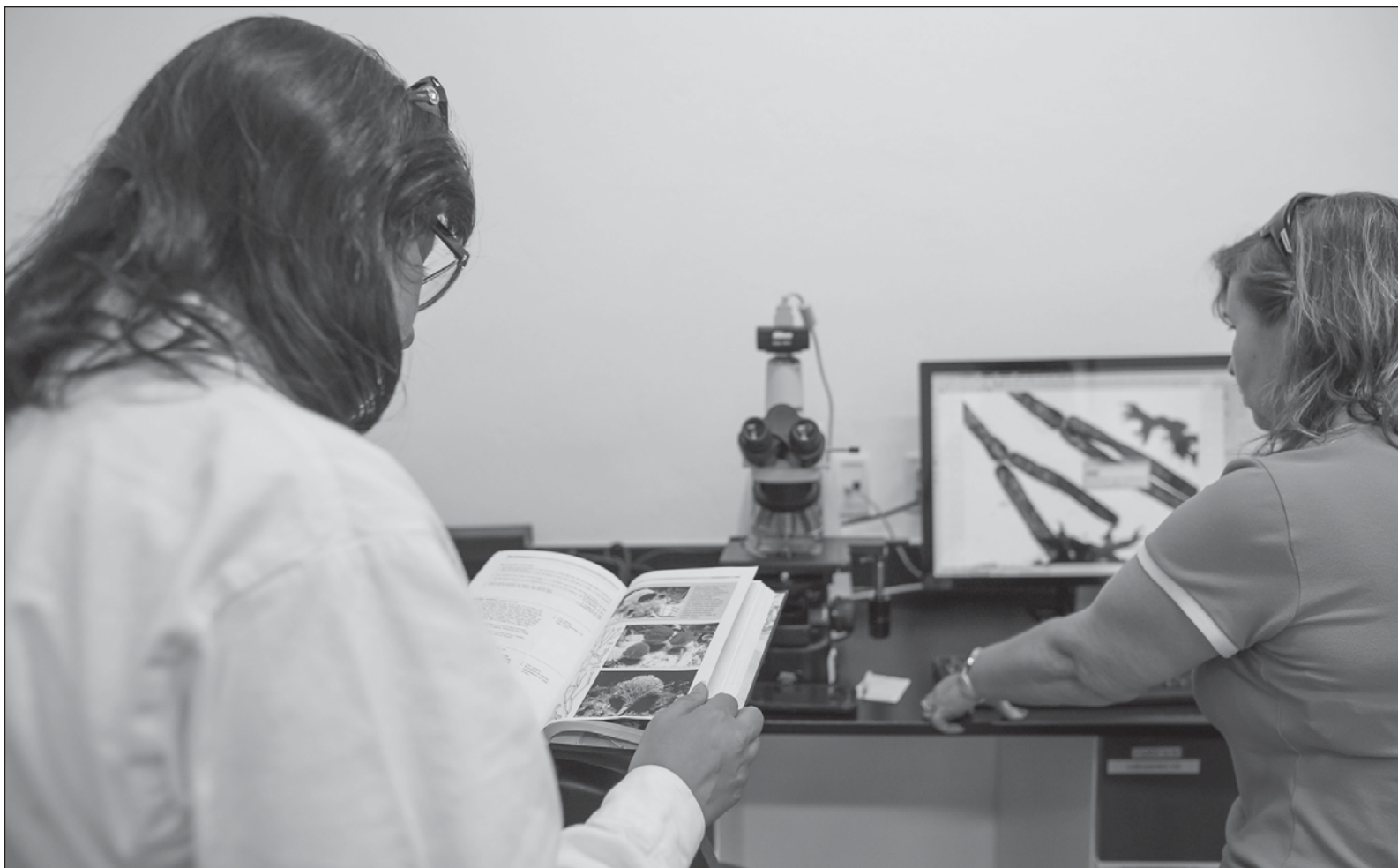
▲ "La presión para publicar varios artículos en un año provoca que los académicos descuiden otras actividades igual de relevantes (...) en otras palabras, el sistema que se centra en publicaciones científicas, artículos o capítulos de libros, también explica la creación de vacas sagradas ".