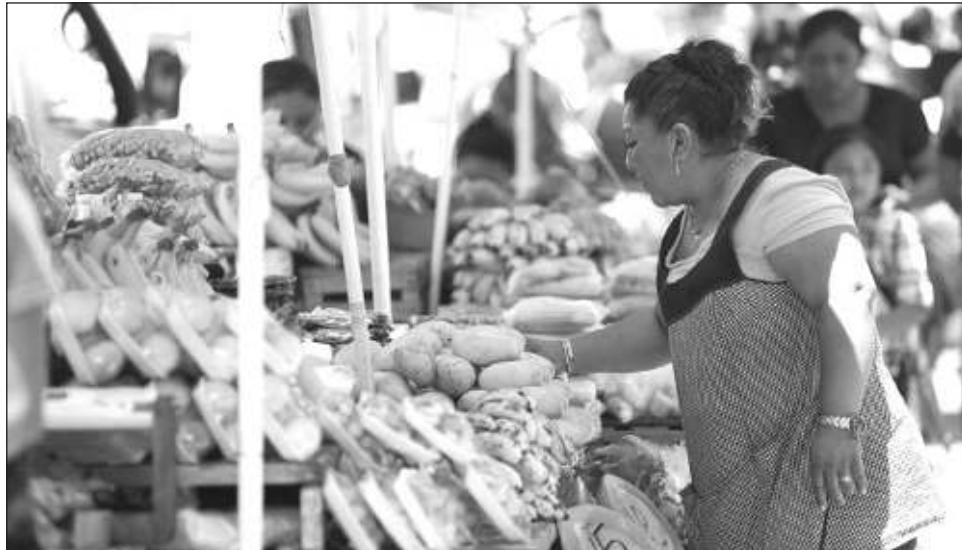
▲ Los interesados en estudiar la maestría deben realizar un pre proyecto sobre un tema de estudio político o social que quieran desarrollar, preferentemente peninsular.

“El tema a desarrollar, preferentemente peninsular, pero no exclusivamente, incluimos temas de estudios de Chiapas, de Tabasco, de