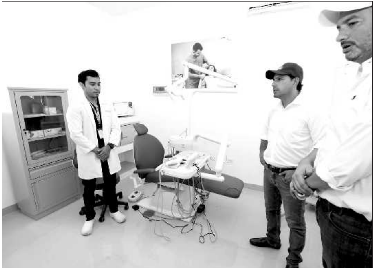
▲ El Centro de Salud de Nohbec contará con servicios como ultrasonido gratuito, examen de laboratorio, atención dental y psicológica, así como con un médico que estará disponible 24 horas, seis días de la semana.

En la comisaría de Nohbec, y junto al titular de la Secretaría de Salud de Yucatán (SSY), Mauricio Sauri Vivas, Vila Dosal cortó el listón inaugural y supervisó los trabajos de remodelación y rehabilitación efectuados en el Centro de Salud de esta localidad ubicada al sur del estado y al dirigir su mensaje, se dijo contento de poder visitar y agradecer a los pobladores de todas las comunidades, incluidas las más alejadas, por su confianza y trabajo en equipo para lograr la transformación histórica de la entidad.