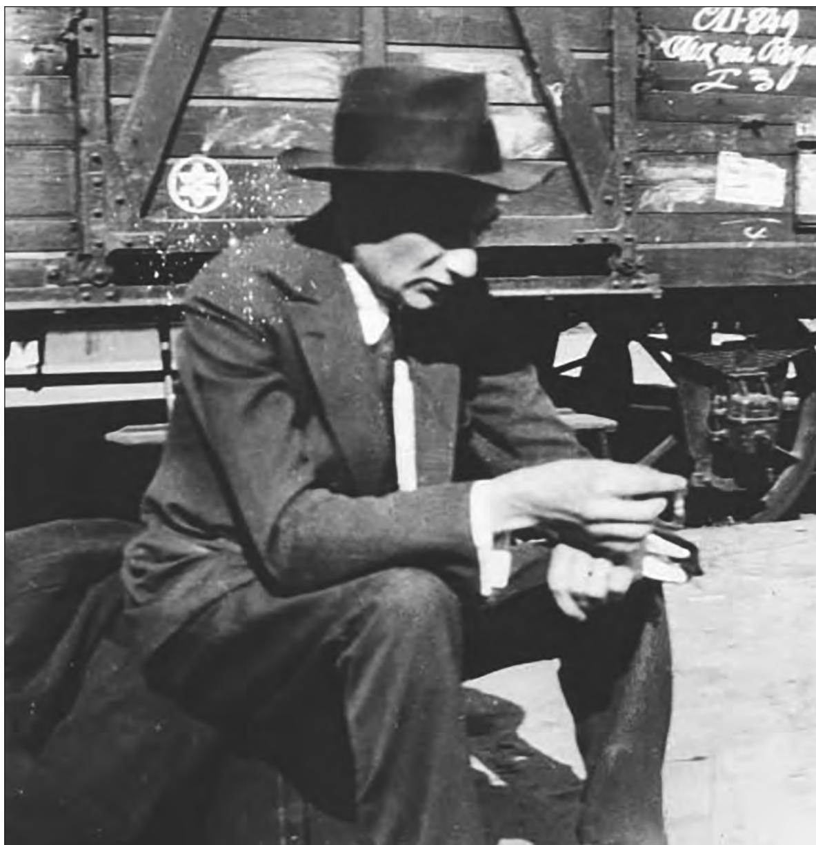
▲ La nueva edición de La Marcha Radetzky aparece en el siglo XXI justo cuando nos encontramos en una crisis que recuerda en algo la que sufriera la Europa de Roth.

AUNQUE EL FUTURO sea mucho más oscuro que el de aquel continente, en nuestras tierras de constante saqueo bien vale la pena escuchar con nostalgia La Marcha Radetzky asomados a las ventanas de un narrador genial como lo hicieron las generaciones de una familia Trotta que transcurre desde la Gran Guerra en su novela de 1932, hasta la ascensión del nazismo en otra novela inva-