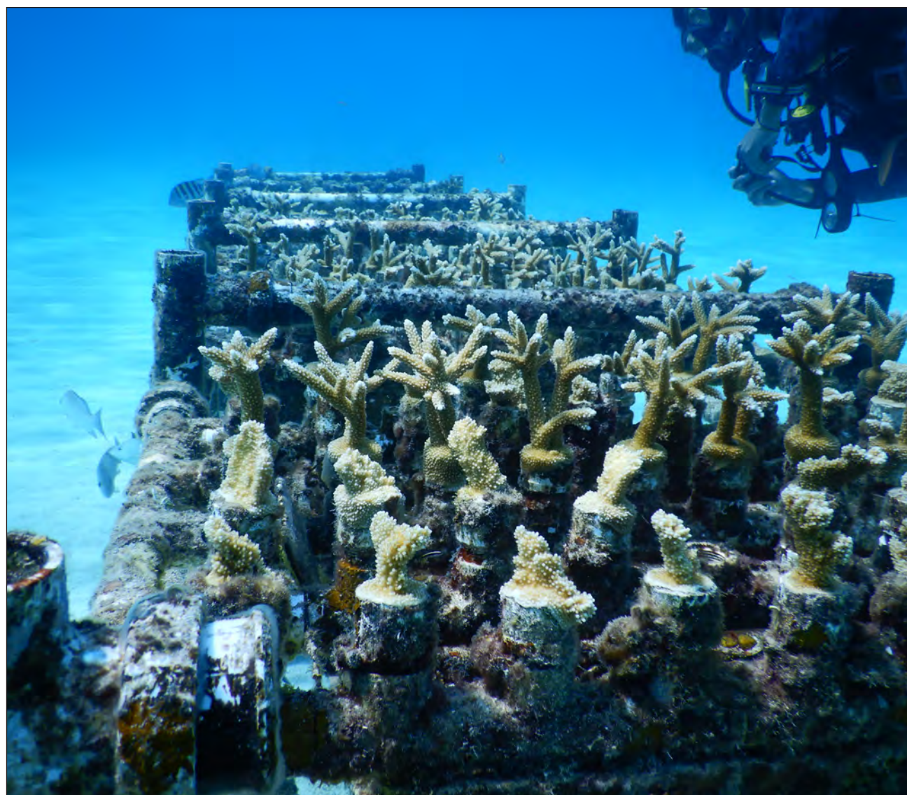
▲ Los expertos están considerando tres especies para el proyecto Rescate de coral : el pilar y dos tipos de coral cerebro.