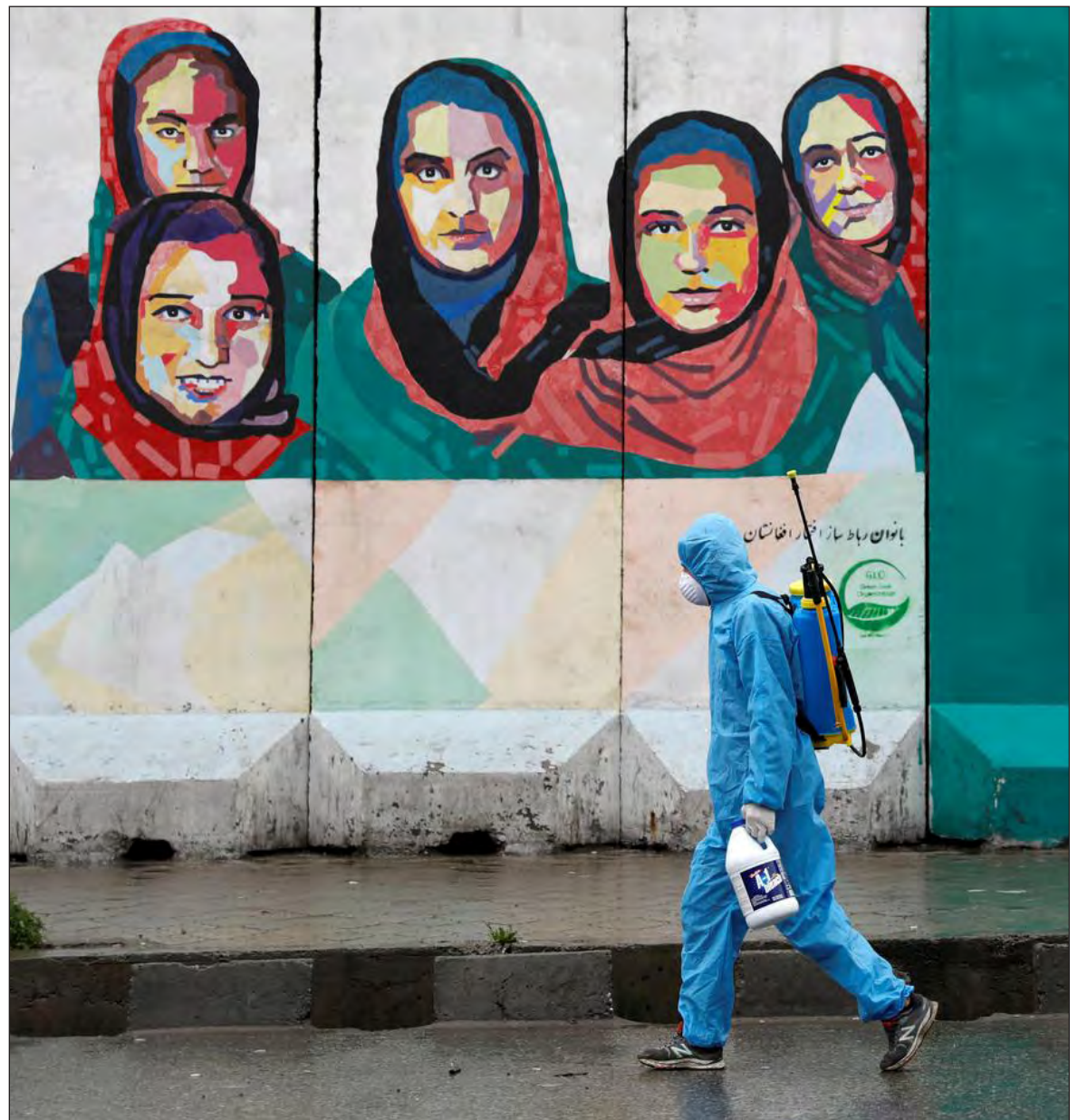
▲ Today we face a major pandemic that has taken hundreds of thousands of lives and cost us billions of dollars in economic losses.

OLIVER WENDELL HOLMES once noted that “the main part of intellectual education is not the