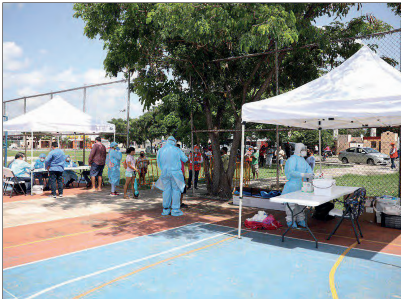
▲ Los módulos se instalan en áreas públicas. Ahí, personal médico realiza el exudado faríngeo y envía las muestras al laboratorio donde se examinarán.

6.-Luego, el personal médico realiza el exudado faríngeo con un hisopo esterilizado y se coloca al