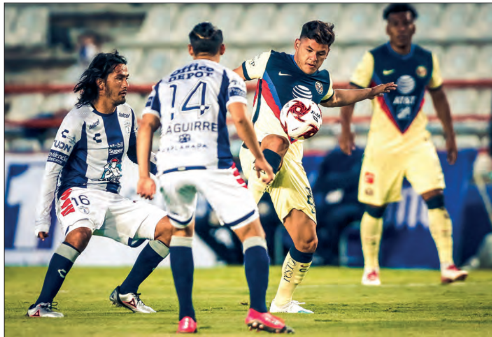
▲ Las Águilas se estrenaron con una victoria en Pachuca.

Pese a estas circunstancias, el torneo comenzó el pasado viernes y tras los primeros encuentros rea-