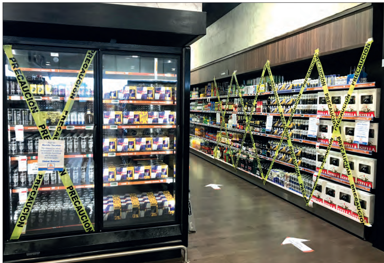
▲ En este primer semestre se han presentado 2 mil 180 casos de intoxicación aguda por alcohol, la abrumadora mayoría de ellos fueron hombres.

En este segundo periodo, junto con la ley seca