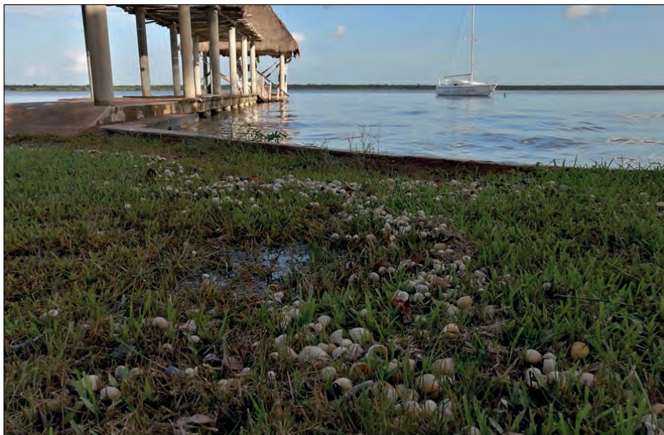
▲ En los últimos días, han aparecido muchos caracoles muertos en las orillas del cuerpo de agua.

“Estuvimos de acuerdo en que aquí no se puede usar zapatos de agua porque al usarlos perdemos sensibilidad y no sentimos el sedimento, ni a los caracoles y su concha es muy frágil, podemos romperla; además de ello no se puede