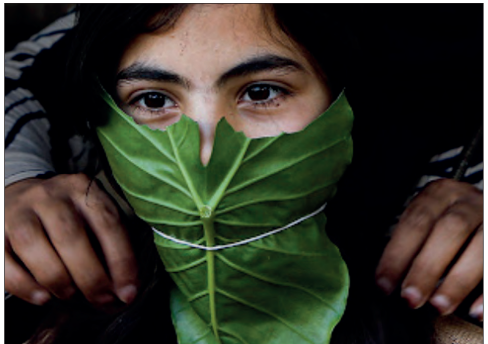
▲ Al determinarse una tipología de pacientes, es posible identificar el nivel de atención que cada uno requerirá.

El estudio, aún sin la aprobación de expertos, arroja que los pacientes del primer nivel tienen una probabilidad del 1.5 por ciento de necesitar soporte respiratorio, como oxígeno o un ventilador; mientras que el 4.4 por ciento de los pacientes del segundo grupo necesitarán soporte