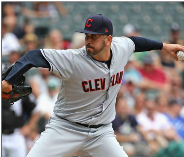
▲ Oliver Pérez está en su tercera temporada con los Indios de Cleveland.

“Yo pienso que si tú le preguntas eso a cualquier jugador mayor, ¿pensaste que ibas a jugar tanto tiempo?” No hay manera”, bromeó el pitcher surgido de los Leones de Yucatán. “Cuando cancelaron el ‘Spring Training’, no me sentí muy bien porque de verdad estaba bien cerca de hacer el equipo, faltaban