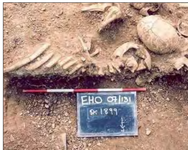
▲ El equipo de investigadores encontró viruela en 11 yacimientos de enterramientos de la era vikinga en Dinamarca, Noruega, Rusia y el Reino Unido.

El equipo de investigadores encontró viruela, causada por el virus variola, en 11 yacimientos de