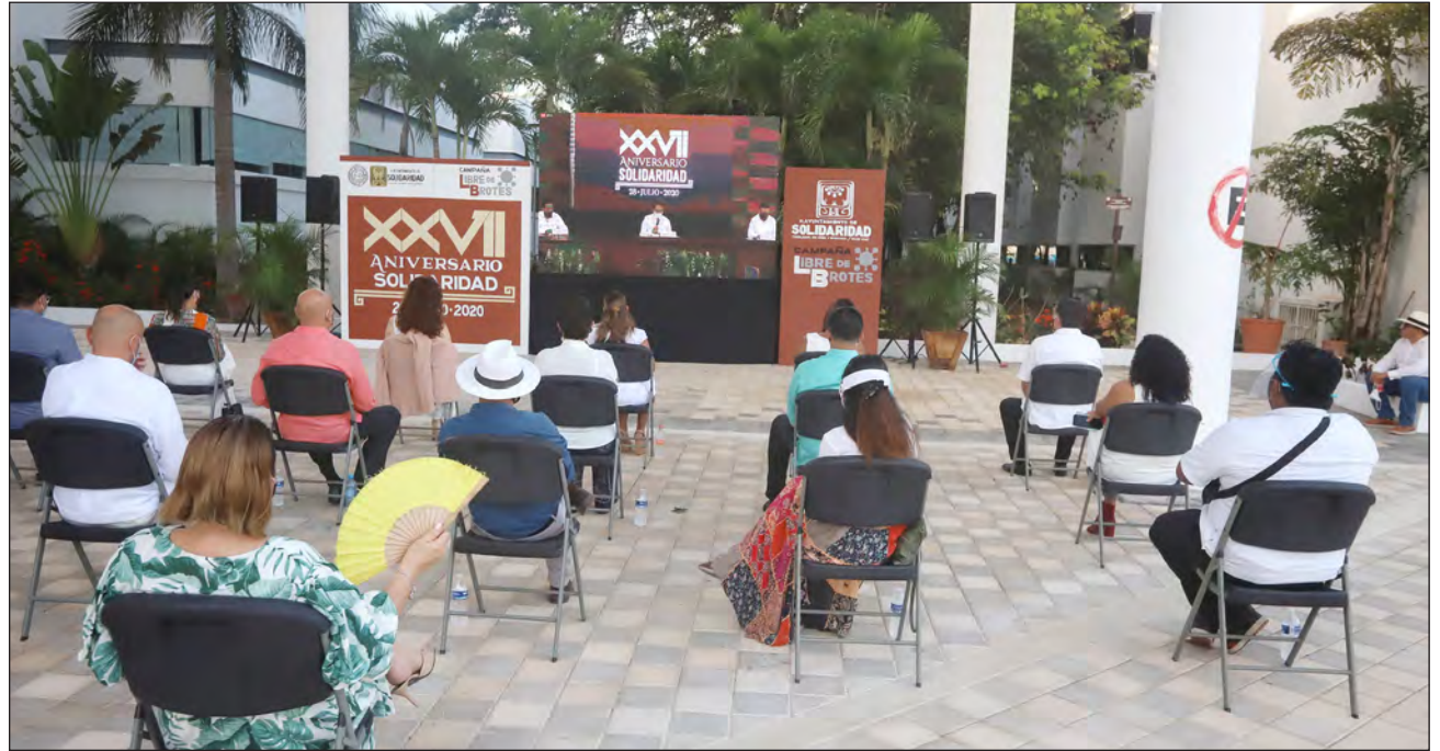
▲ La sala Leona Vicario del nuevo palacio municipal fue adecuada para cumplir con los estándares de sana distancia.

Recordó que en 1988 se fundó la primera colonia