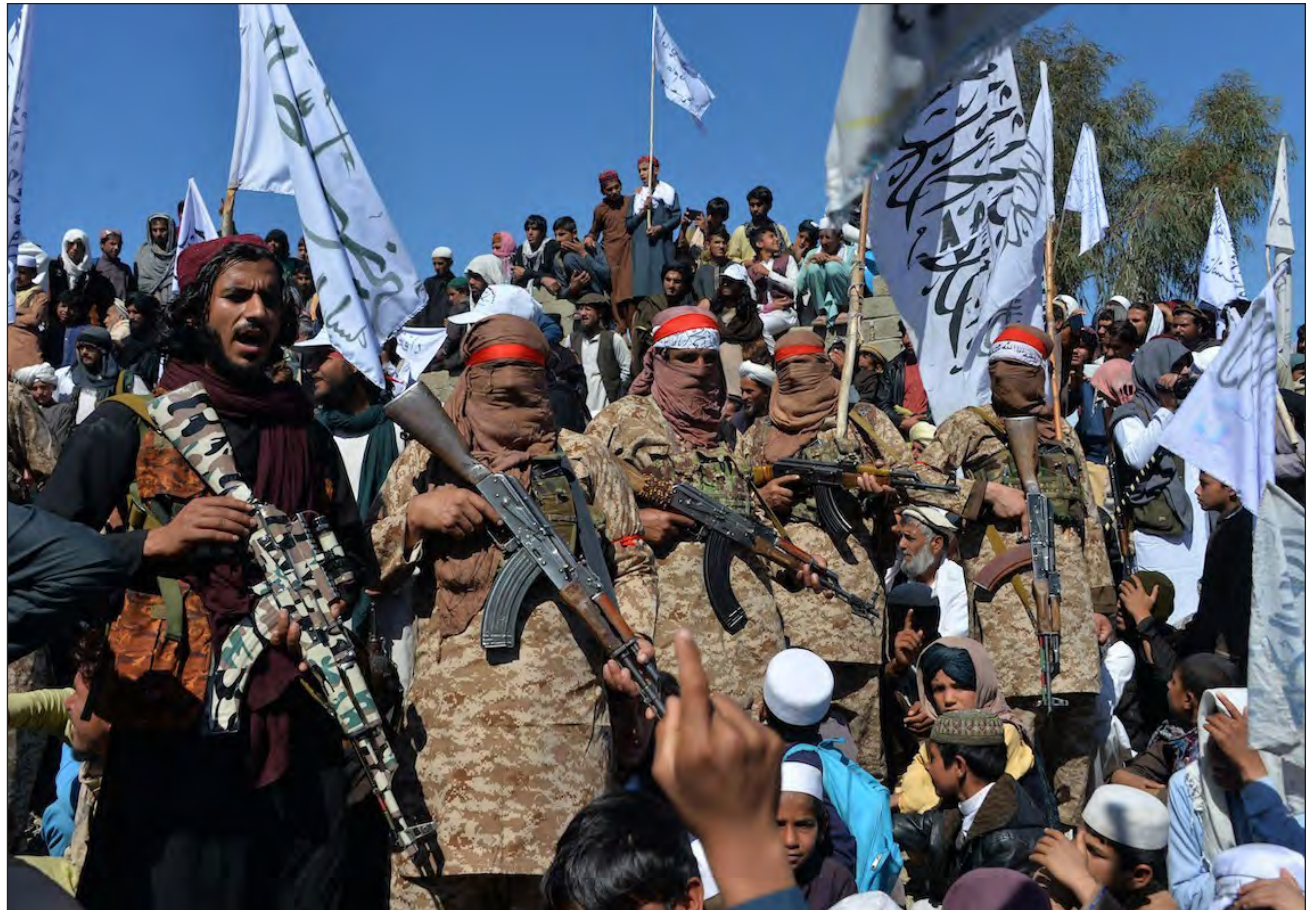
▲ El grupo musulmán cominó a sus miembros a detener todas las operaciones ofensivas contra las fuerzas enemigas.

Asimismo, resaltó que, si bien se trata de "un paso sig-