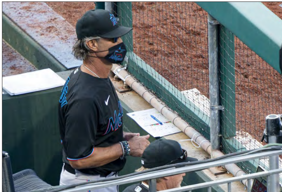
▲ Don Mattingly, mánager de los Marlins, durante el juego del sábado en Filadelfia.

Se suponía que los Filis recibirían lunes y martes a los Yanquis, y los visitarían miércoles y jueves. En vez de ello, los peloteros de Nueva York se dirigieron a Baltimore para comenzar hoy una serie frente a los Orioles. Por los Mulos, que tenían programada una práctica anoche en