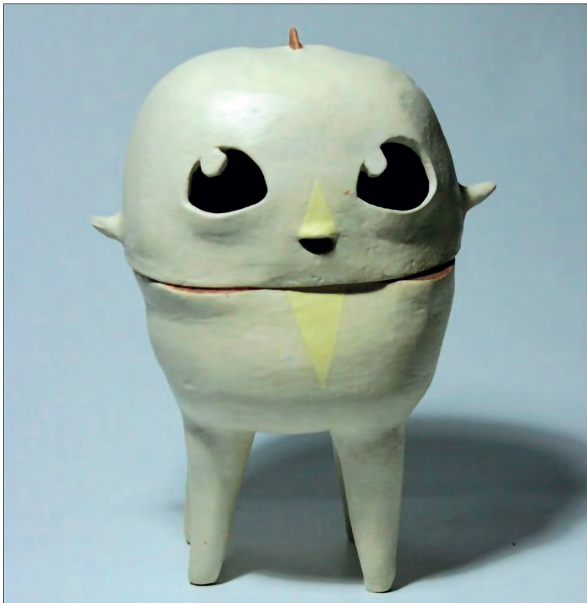
▲ En Aluxes para un tiempo súper flat vol.3 , la construcción del alux, en esta interface, asume un lenguaje minimalista desplazándolo a la escultura, al mundo del diseño.

Siguiendo esta lógica, el anime, cuyo significado es animado o vivo, plantea en la estática y la horizontalidad otra contraposición a la imagen volumétrica esencial en la representación del alux, sin embargo, el ensayo procesual al que somete el artista dos iconos tan disímiles, propone una resemantización de los aluxes como valor de la cultura maya, en cuya conversión lo (re)significa y, en un estrato menor, también lo hace con el anime. El resultado es un corpus pop artístico, pese a las posibles incoherencias internas que provoque el accionar que conjunta y, al mismo tiempo, (des)armoniza, ambos cons-