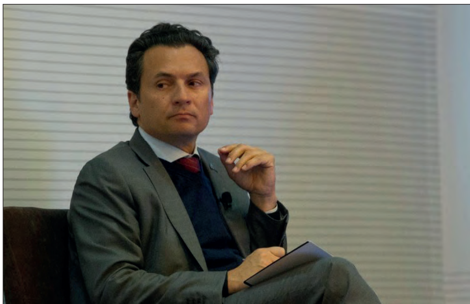
▲ El ex director de Pemex, Emilio Lozoya Austin, ya comparece ante la justicia mexicana por presuntos actos de corrupción.

La FGR señaló que el exdirector general de Pe-