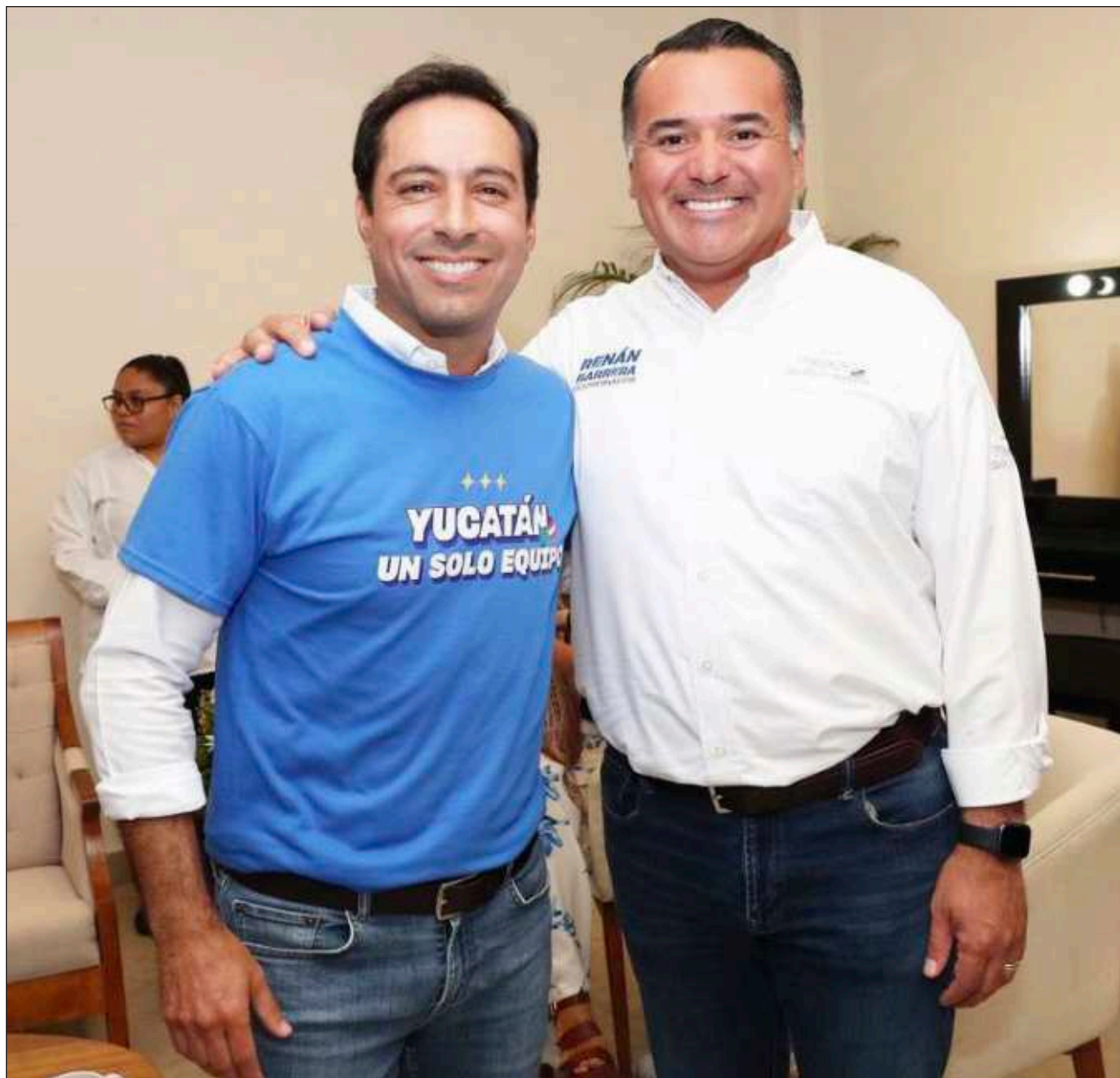
▲ Mauricio Vila representará a México en su calidad de presidente de la Conferencia Nacional de Gobernadores en el Foro sobre Cooperación, Crecimiento y Energía para el Desarrollo, que se realizará en Arabia Saudita.

El gobernador se encuentra en labores de promoción económica del estado de Yucatán, y representará a México en el Foro en Arabia Saudita.