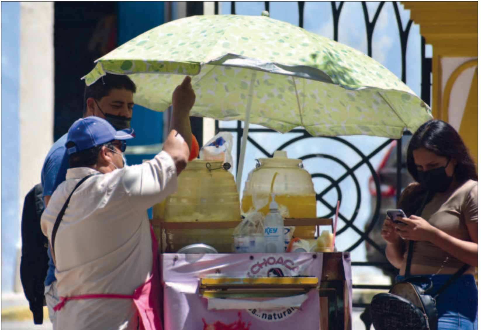
▲ De la Población Económicamente Activa nacional, 59.8 millones de personas estuvieron ocupadas en marzo de este año.