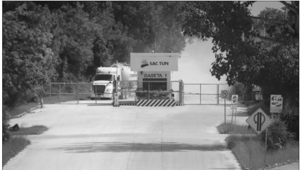
▲ Actualmente Sactun sigue clausurada por la Procuraduría de Protección al Medio Ambiente y en sus alrededores hay vigilancia policiaca.

La cementera mexicana respondió mediante un comunicado en su sitio web en el cual señala que existe una relación contractual por más de 20 años con Sa-