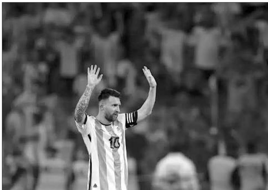
▲ Lionel Messi festeja uno de sus goles con la selección argentina en un amistoso ante Curazao, en Santiago del Estero.

Pese a que el técnico Lionel Scaloni presentó una formación mixta, en la que resaltaron los regresos del volante Giovanni Lo Celso y el delantero Nicolás González -ambos marginados del