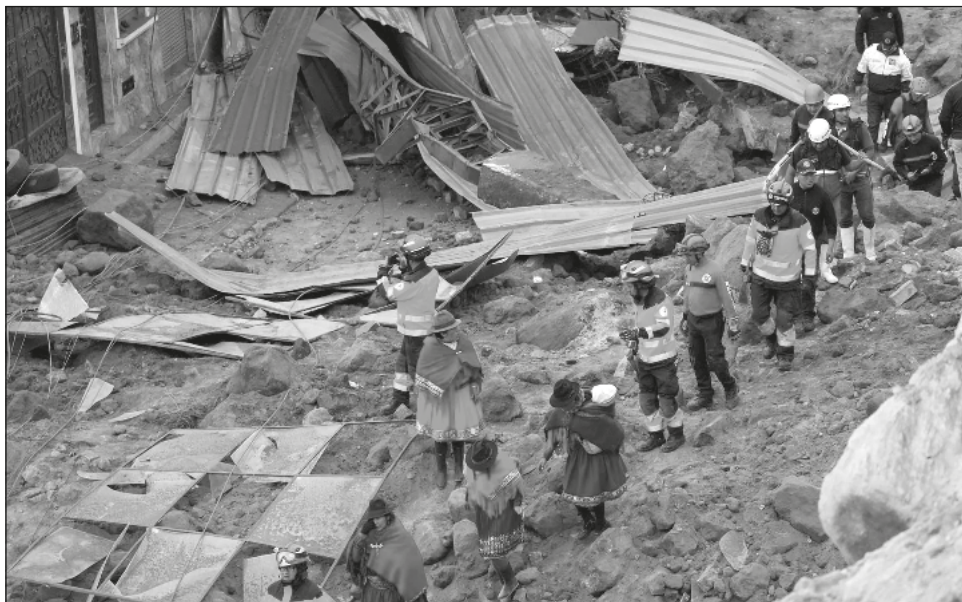
▲ Aunque los efectivos de bomberos, ejército, Cruz Roja, policía y otros organismos lucían agotados, se apoyaban entre sí con frases de aliento para retirar rocas y escombros.

Debido a la presión de familiares y sobrevivientes, ingresó al sector del desastre maquinaria pesada que empezó a trabajar de inmediato a pesar de la oposición inicial de los expertos, que señalaban que se debían esperar al menos 72 horas. A los rescatistas se sumaron espontáneamente decenas de indígenas de zonas cercanas para ayudar a remover la tierra y los escombros.