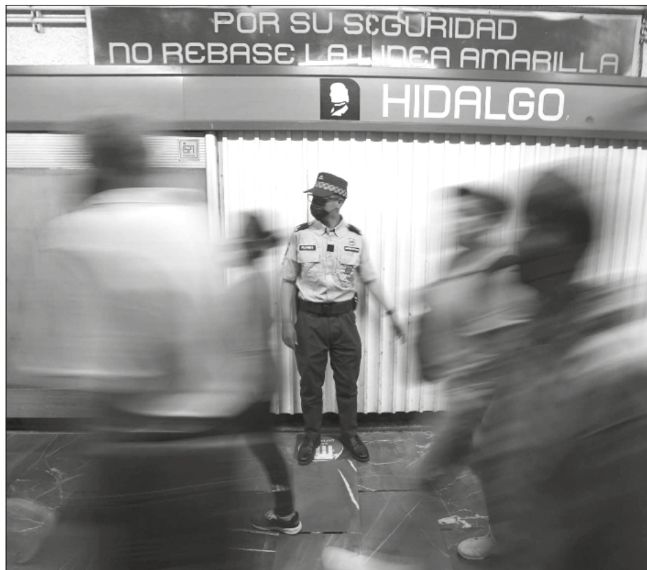
▲ La jefa de Gobierno precisó que reforzará la presencia de la Policía Bancaria e Industrial en funciones de vigilancia, debido a que no hay nuevos casos de robo de cableado.

De esta manera, precisó, ya reducirá el número de efectivos y se reforzará la presencia de la Policía Bancaria e Industrial en las funciones de vigilancia en las instalaciones del Metro.