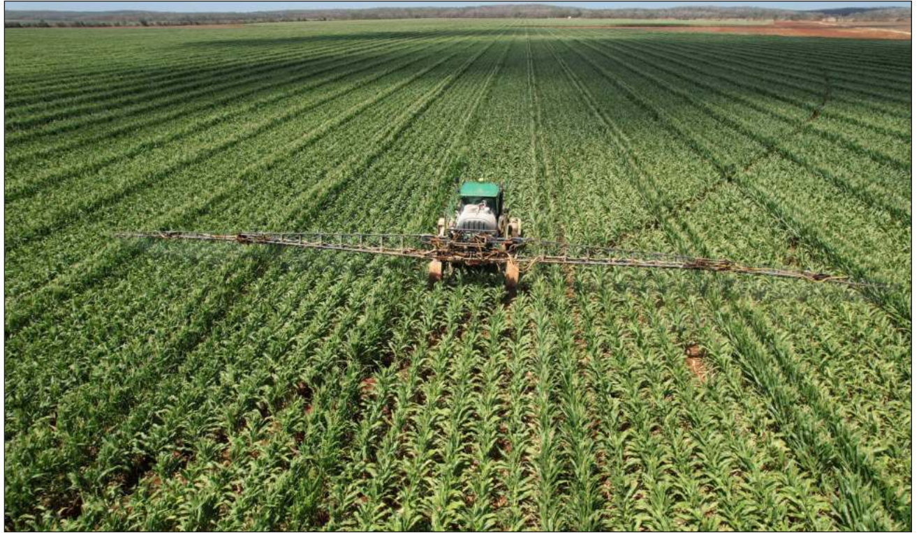
▲ Ku tukulta'ale' leti'e' le ba'ax ku máan u fúumigaroo'.

Le beetike', ba'ax táan u tukulta'ale', leti' u beeta'al jump'éeel a'almaj'taan ti'al u kaláanta'al u yik'elo'ob kaab, tumen juntúul ba'alche'