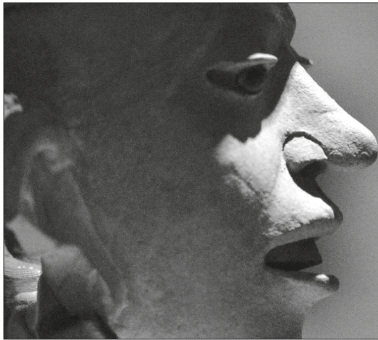
▲ "Es inútil describirla, ya que no existen palabras para hacerlo. Un color imposible, que hasta el hallazgo del objeto nunca se había visto; una textura inédita, que acaricia y abraza a la vez".

Por teléfono, el hombre no tuvo palabras para describirme lo que había encontrado. Es una máscara, se limitaba a decir. Una máscara grande, como de un gigante. De qué material es, de qué color, le preguntaba. Es una máscara, una máscara, respondía. Viajé inmediatamente a la zona, y le pedí que nos viéramos lo antes