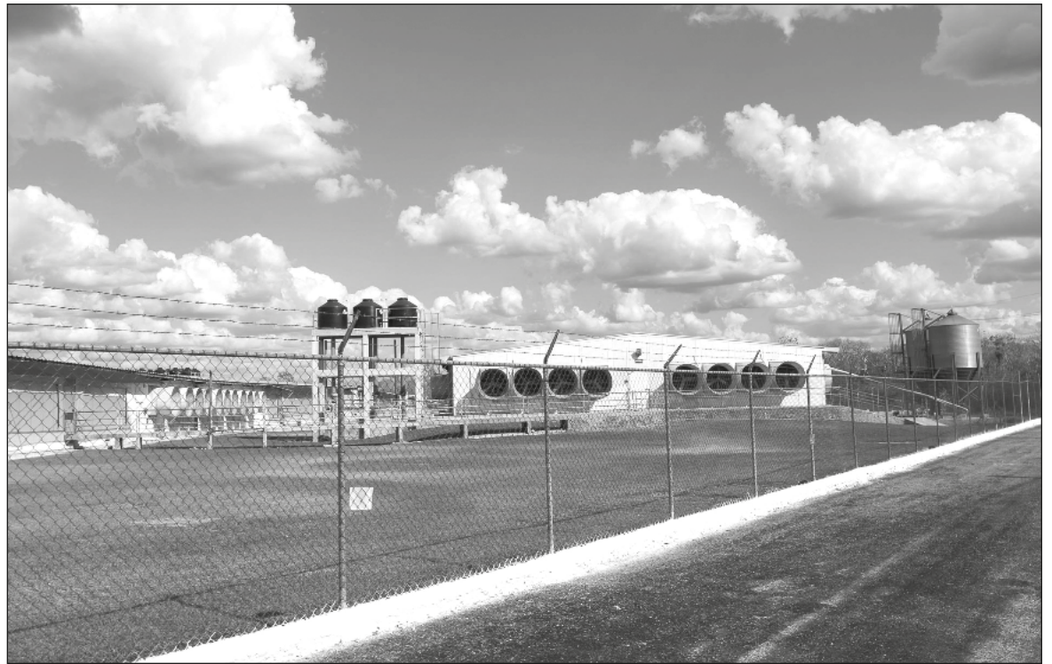
▲ “La apuesta de Yucatán por hacer de la porcicultura uno de los pilares de su desarrollo agropecuario no es de ayer: lleva décadas haciendo esfuerzos por convertirse en un referente en la producción de cerdos”.

Quisiera comenzar por dejar claro que, al menos esta vez, el gran timonel ha mostrado una prudencia encomiable, y en lugar de simplemente empeñarse en suspender la actividad, ha propuesto ordenarla, y sujetarla a revisiones científicas escrupulosas. La Secretaría de Medio Ambiente y Recursos Naturales deberá encargarse de la tarea de formular una propuesta que permita determinar dónde y cómo se podrán establecer granjas porcícolas en la región. Todo esto está muy bien, pero no puedo evitar la sensación de que el asunto se encara como