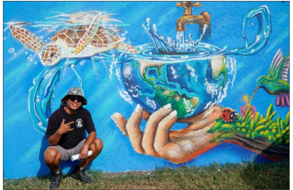
▲ El pasado 25 y 26 de marzo, Aguakan realizó un Festival de Arte Urbano donde más de 10 artistas plasmaron su arte utilizando como lienzo los muros de la Copa de Aguakan.