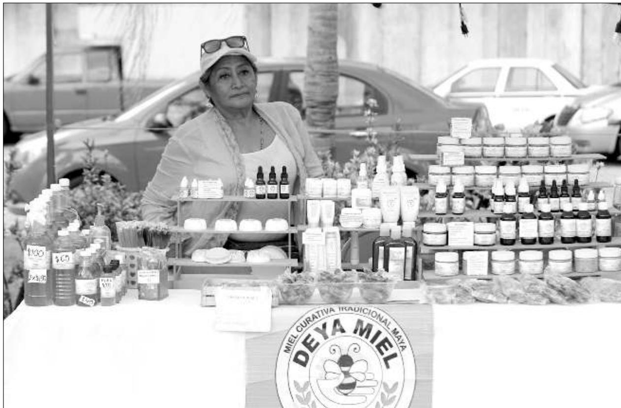
▲ “Ahorita actualmente en la economía las mujeres están muy activas, dijera Shakira súper facturando, están con todo”, señaló la organizadora del bazar Mujeres Emprendedoras de Cancún.

Los servicios de la clínica médica serán: médico general, enfermería, nutrición y optometría; mientras que por parte de los servicios PREVENIMSS se tomará talla, peso, presión arterial, examen de glucosa y vacunas contra la influenza.