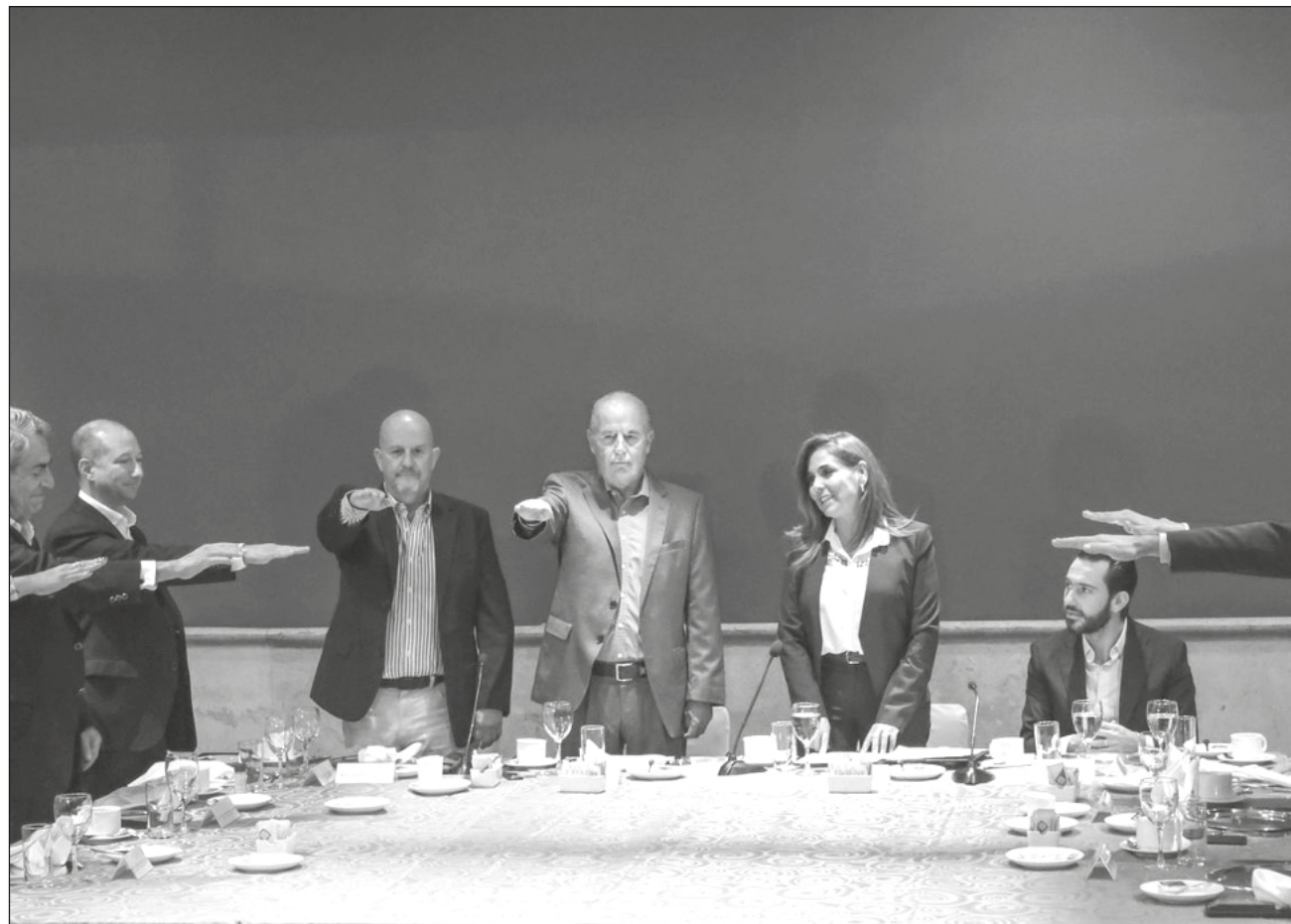
▲ Durante la presentación del Consejo Hotelero del Caribe Mexicano, como parte de sus actividades en el Tianguis Turístico 2023, la gobernadora Mara Lezama resaltó la importancia de trabajar juntos en la promoción del destino.

Durante la presentación, la mandataria resaltó la importancia de trabajar juntos en la promoción del destino, y llevar al Caribe Mexicano a buen puerto, de la mano de obras de infraestructura que junto con el Tren Maya y el rescate arqueológico permitirán seguir ampliando la oferta turística, inversiones y la presencia en el mundo.