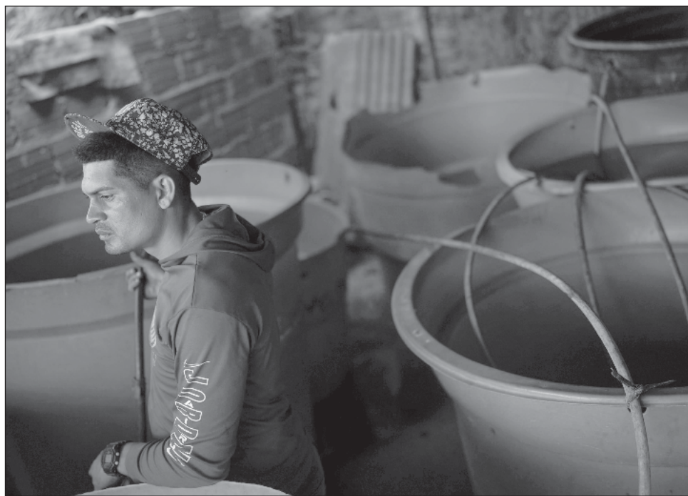
▲ Según Cedice Libertad, 76% de venezolanos denunció en febrero el incumplimiento de esquemas de racionamiento en sus comunidades, lo que obligó a algunos a comprar agua.