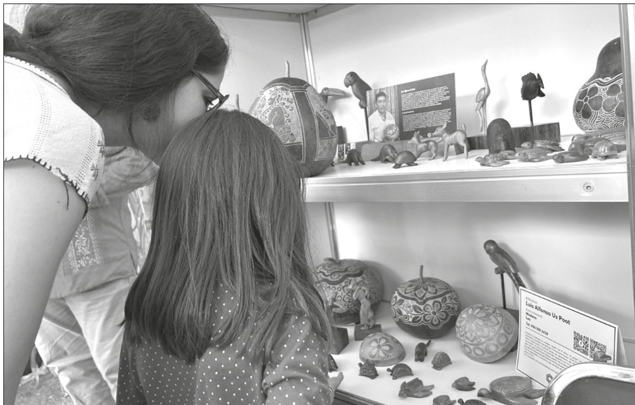
▲ La delegación campechana está compuesta de 50 personas, entre empresarios del sector turístico, cámaras y asociaciones de la industria y de los municipios de Campeche, Carmen , Candelaria, Palizada y Calakmul.

Como parte de las actividades de promoción y difusión de los atractivos y servicios turísticos, la delegación campechana está presente en la feria con una participación de 50 perso-