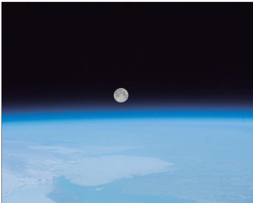
▲ Las cuentas de vidrio brillantes y multicolores se localizaban en muestras traídas del satélite por China en 2020, el cual forma parte de la misión Chang'e 5 .

Estas perlas de impacto están por todas partes, como resultado del enfriamiento del material derretido expulsado por las rocas espaciales entrantes. El agua podría extraerse calentando las cuentas, posiblemente mediante futuras misiones robóticas. Se necesitan más estudios para determinar si esto sería factible y, de ser así, si el agua podría beberse.