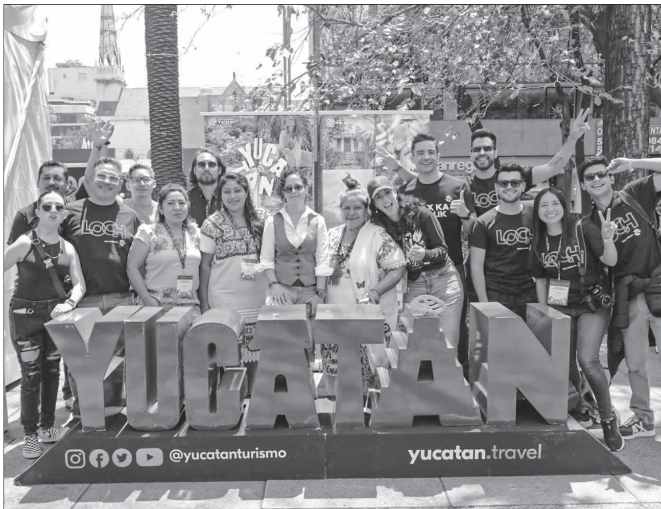
▲ Yucatán, a decir de la Sefotur, es uno de los grandes representantes de la marca México.