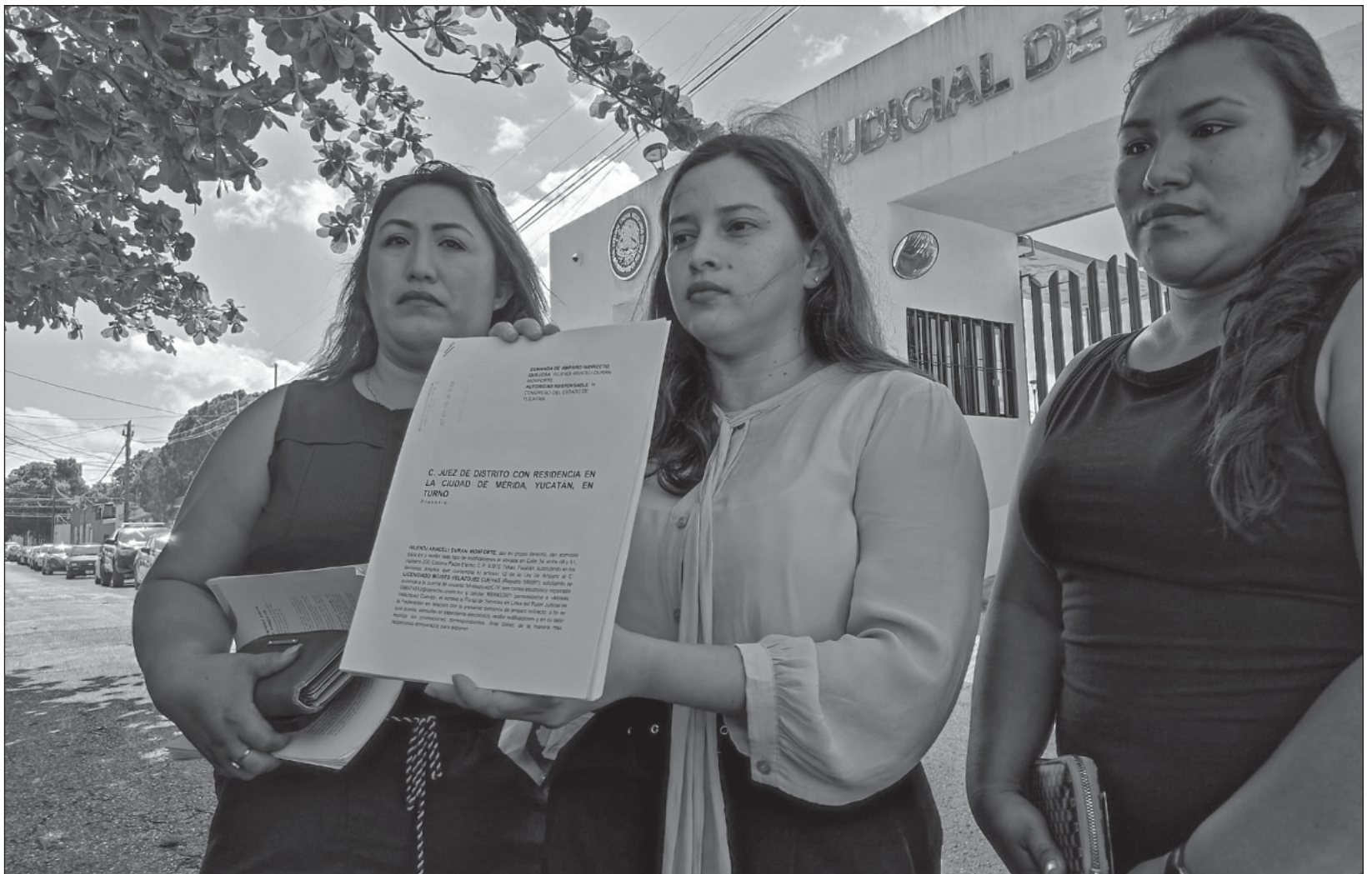
▲ Integrantes de Iniciativa Sinaloa y Border Hub interpusieron también una queja ante la Comisión de Derechos Humanos de Yucatán Codhey.

“Propusimos esta ley, que es la misma, la homóloga, pero pues no tuvimos respuesta, a pesar de que estuvo ahora la sesión ordinaria que es donde generalmente se hacen este tipo de trabajos de las leyes”, agregó.