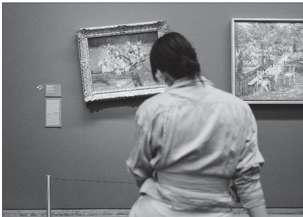
▲ Los cuadros en el Museo Leopold cuelgan en diagonal en ángulos de entre 1.5 y 7 grados y científicos explican qué cambios causarían un calentamiento de ese mismo nivel.

“Nos gustaría hacer nuestra contribución para sensibilizar a nuestros visitantes sobre el urgente problema de la crisis del clima”, explica el director del Museo Leopold, Hans-Peter Wipplinger.