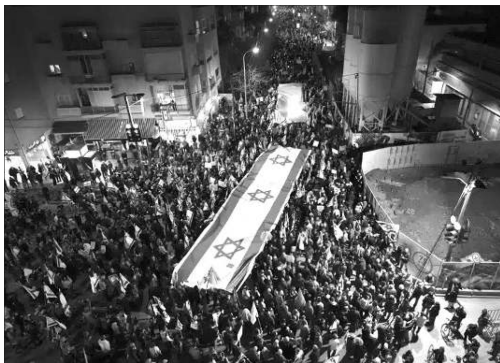
▲ La sociedad israelí estaba alimentando un monstruo político que ahora se vuelca en contra de los fundamentos mismos de esa peculiar democracia segregacionista.

Cabe esperar que la crítica circunstancia actual lleve a los sectores mayoritarios de Israel a cobrar conciencia de la vertiente criminal que marca al Estado israelí, que se produzca en el ánimo nacional un vuelco hacia la aceptación de la única solución histórica posible: la conformación de un Estado palestino en los territorios ilegalmente ocupados por Tel Aviv en 1967 -Gaza, Cisjordania y la porción oriental de Jerusalén- y el fin de una ocupación que ha envilecido y militarizado al país ocupante. Sólo de esa forma será posible prescindir de las formaciones ultraderechistas, fundamentalistas, autoritarias y antidemocráticas que se han hecho con el gobierno de Israel durante demasiado tiempo.