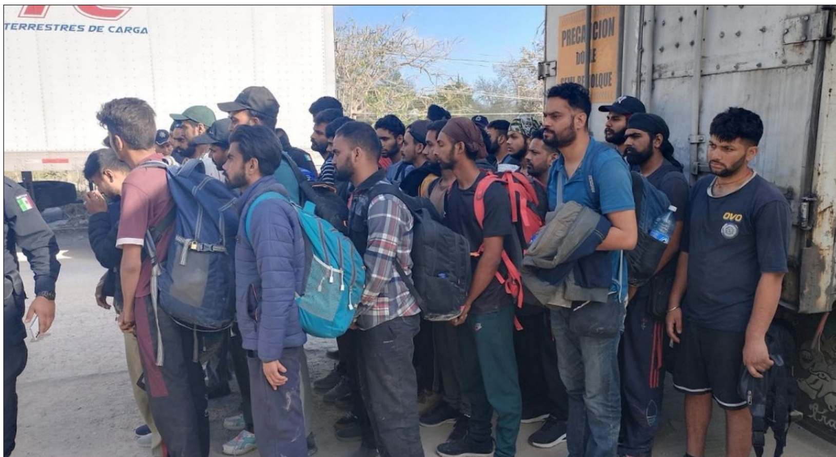
▲ Los detenidos fueron asegurados por el Instituto Nacional de Migración, órgano administrativo que determinará su estancia en Yucatán.