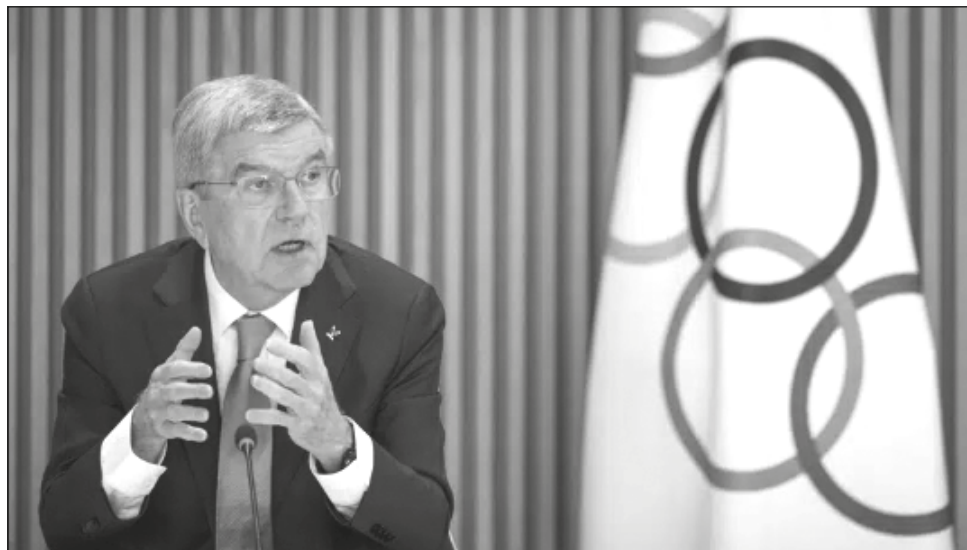
▲ El presidente del COI, Thomas Bach, durante la apertura de la junta directiva del Comité Olímpico Internacional en Lausana, Suiza.

El Ministerio de Defensa ruso ha dicho que más de 20 medallistas de los Olímpicos de Tokio tenían un rango militar en 2021. De las 71 preseas que se llevaron en Japón, 45 fueron de deportistas afiliados al Club Central de Deportes del Ejército.