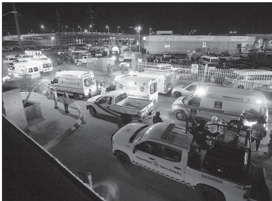
▲ En el siniestro 29 personas resultaron heridas, 17 de ellas están en terapia intensiva y su estado de salud es muy grave, por lo que fueron trasladadas a cinco hospitales.

Dijo que la SRE ha solicitado a la Secretaría de Gobernación y al INM “la información necesaria para compartirla con los países hermanos mencionados” y agregó que “es una gran tristeza lo ocurrido. Dejo cualquier consideración de