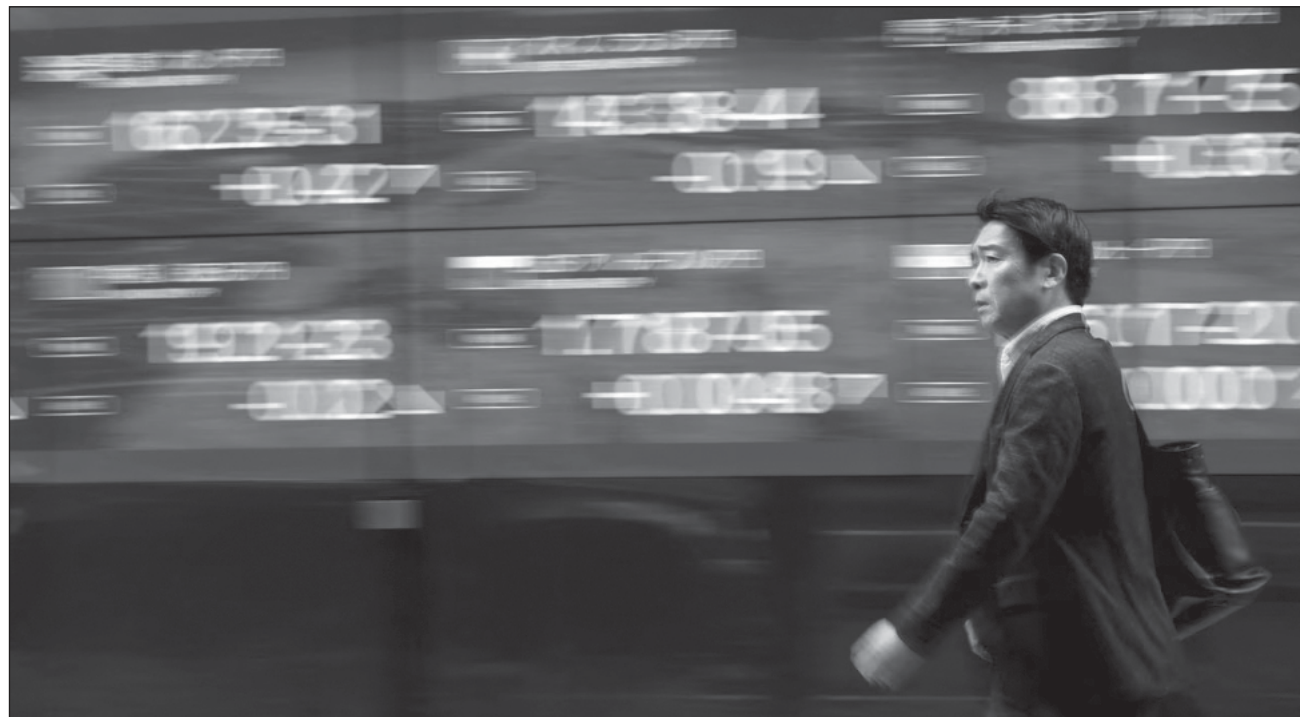
▲ Antes de la apertura de la Bolsa de Nueva York, los inversores aplaudieron el anuncio hecho este martes, haciendo saltar la acción más de 9 por ciento; cada dependencia se administrará por sí sola, a excepción de Taobao Tmall Commerce.

La única excepción será Taobao Tmall Commerce Group —operador de una de las principales plataformas de compra en línea de China—, que permanecerá totalmente propiedad del grupo Alibaba. La reestructuración no afectará a la cotización de Alibaba en Nueva York y Hong Kong, precisó el grupo.