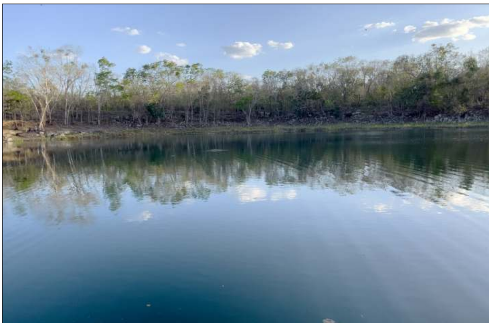
▲ El esfuerzo por el cuidado del agua tiene que venir desde diversos sectores.

Si la sociedad, continuó, cambia sus usos y costumbres, entonces será interesante para las autoridades y empresas cambiar la oferta para adaptarse a la población; enfatizó que es necesario impulsar modelos de economía solidaria para atacar esta problemática.