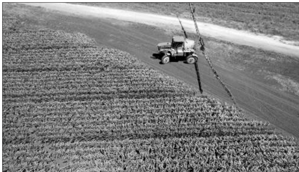
▲ Uno de los apicultores afectados señaló que sospechan nuevamente de las fumigaciones realizadas en las más de 50 de hectáreas del rancho.

Por ello la propuesta es trabajar en una ley de protección para las abejas, pues