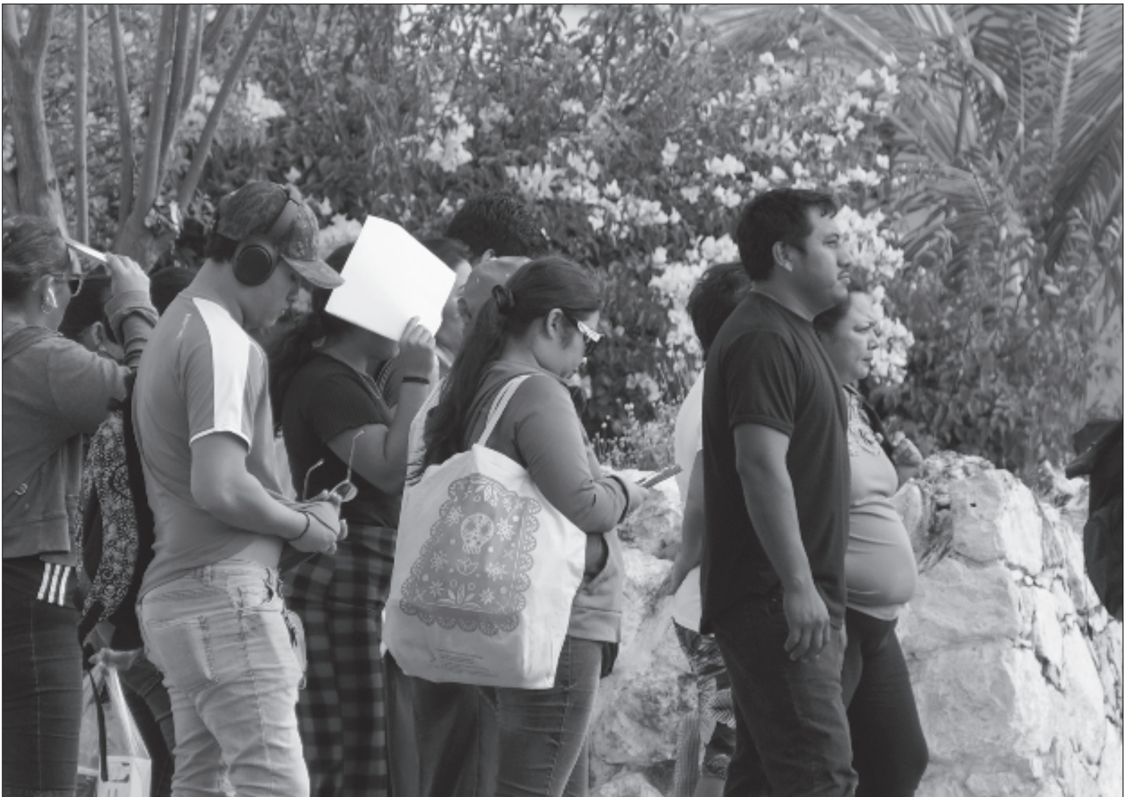
▲ "La tesis de que la pobreza tiene su origen en la holgazanería de los individuos no puede sostenerse desde ninguna perspectiva económica ni sociológica seria y rigurosa; este discurso oculta una especie de ardid semántico en que se confunde la individualidad con el individualismo".