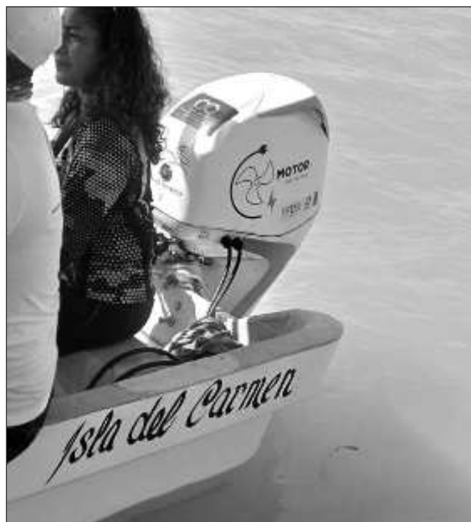
▲ Un refugio pesquero y un motor eléctrico fuera de borda marcan el derrotero para una estrategia novedosa y amigable para el aprovechamiento de especies marinas y el ecoturismo.

En Tabasco, Yucatán y Quintana Roo, las pesquerías se encuentran más o menos reguladas, aunque las zonas protegidas son más bien la excepción. El parque nacional Arrecife Alacranes es el área