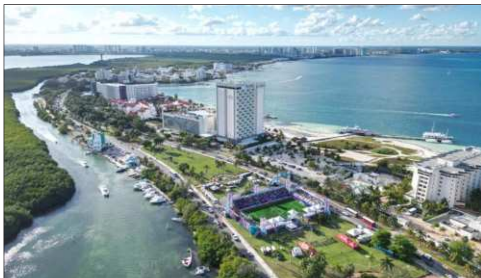
▲ De acuerdo con el Idefin, hay varios proyectos de energía fotovoltaica en diferentes partes del estado, y uno de energía eólica para Cozumel en enero.

"Estamos cerrando el año bien, tenemos algunos proyectos de energía bastante avanzados y algunos proyectos inmobiliarios que ya se iniciaron y para