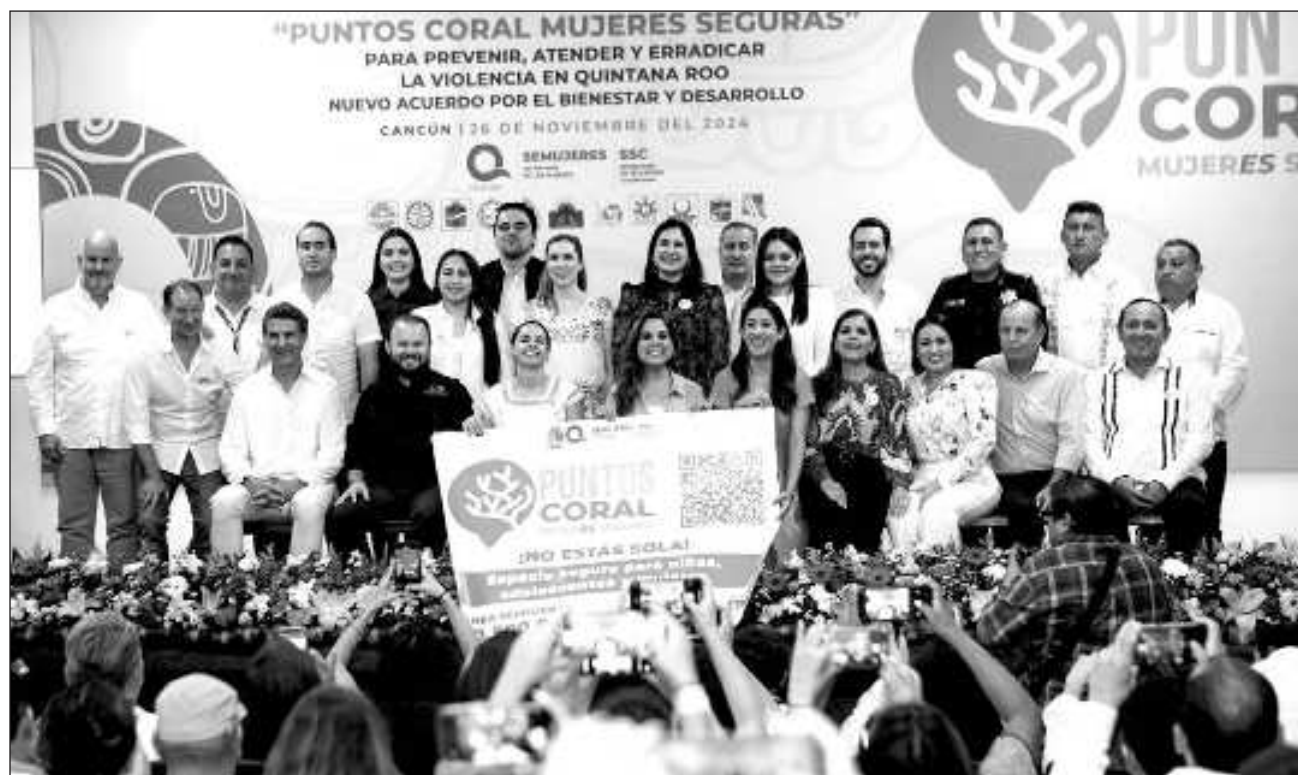
▲ Durante el lanzamiento, en el auditorio de la Universidad Tecnológica de Cancún, la gobernadora Mara Lezama afirmó enfática que poner fin a las violencias contra las mujeres, niñas y adolescentes sí se puede lograr.

Por su parte el Consejo Hotelero del Caribe Mexicano, que representa a más de mil 200 hoteles a través de sus asociaciones y el Consejo Coordinador Empresarial del Caribe, con tres mil ocho empresas agremiadas, contribuirá con generar espacios para la formación del personal de los establecimientos comerciales, difundirá materiales e información sobre la prevención de las violencias, colocará distintivos de la estrategia y fomentará la participación del sector para sumar más establecimientos.