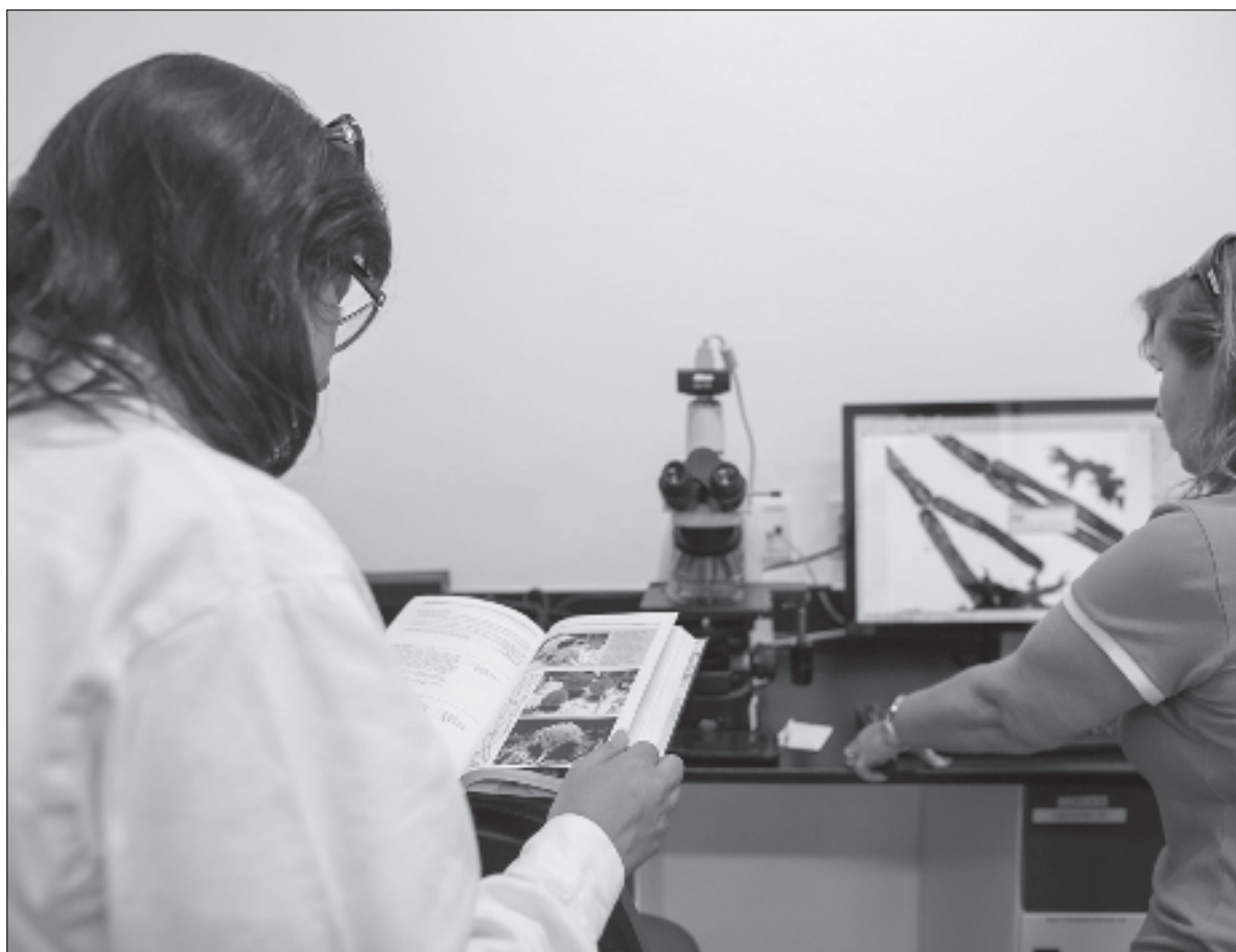
▲ “Kuhn muestra que lo que se considera científico depende fuertemente del momento histórico en el que una ciencia nace y florece. Aún más, que las formas de la científicidad dependen de los hábitos científicos”.

SIENDO JUSTOS, KANT ya había dicho que la experiencia es “ciega” si no echa mano de los conceptos que sirven para ordenar el mundo.