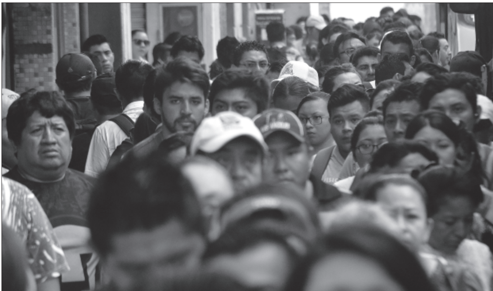
▲ "Llamamos 'democracia' a la 'representación'. Algo que la historia se encarga de demostrar un día sí y otro también es que eso es falso. No hay garantía de saber cómo piensa y qué acciones tomará el representante (...) Hoy es difícil encontrar una política pública que emane de la gente".