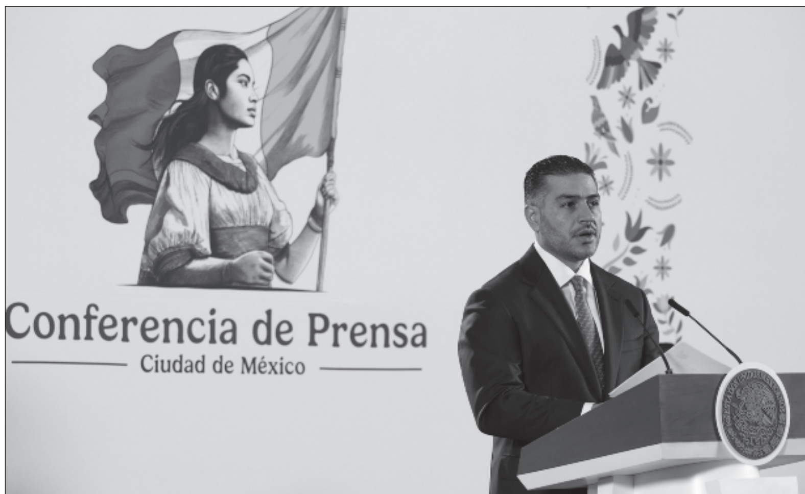
▲ "El secretario de Seguridad y Protección Ciudadana a nivel nacional, Omar García Harfuch, tiene todos los apoyos y respaldos, además de facultades legales y atribuciones que le otorgaron para alcanzar resultados concretos que se sientan y aprecien en todo en país".