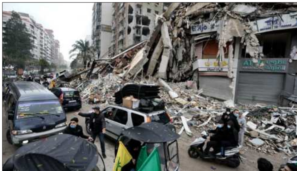
▲ El primer ministro libanés, Najib Mikati, dijo que el ejército "reforzará su despliegue" en el sur del país, como parte de la aplicación de este acuerdo fraguado durante semanas por EU y Francia.

En los suburbios del sur de la capital, bombardeados hasta la madrugada del miér-