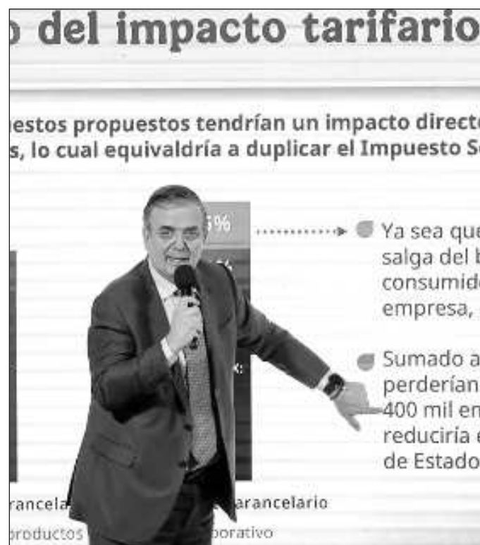
▲ Lo que ha hecho Ebrard en estos últimos días es demostrar que es un gran jugador para el equipo, y que de la Secretaría de Economía saldrán propuestas de alto impacto en apoyo a Claudia Sheinbaum.

Ebrard, al igual que muchos otros, sabe que tanto Estados Unidos como Canadá necesitan de México para que la re-