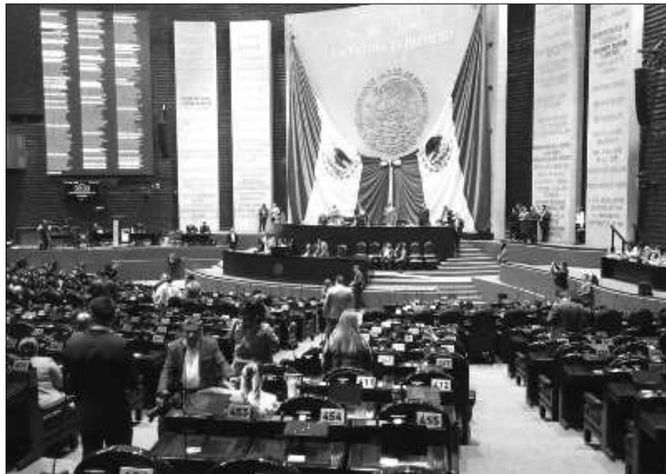
▲ La reforma a 14 artículos de la Carta Magna fue aprobada con 25 votos en pro y 11 en contra y turnada a la mesa directiva del Senado.

La oposición se manifestó en contra de la reforma, bajo el argumento de que se trata de un retroceso, al eliminar “los contrapesos democráticos”, pero legisladores de Morena lo refutaron. El vicedirector del grupo guinda, Ignacio Mier, resaltó que con esta reforma “nunca más organismos que estén al servicio de intereses particulares, facciosos, a costa del presupuesto del pueblo de México, y en favor muchas veces de intereses extranjeros”.