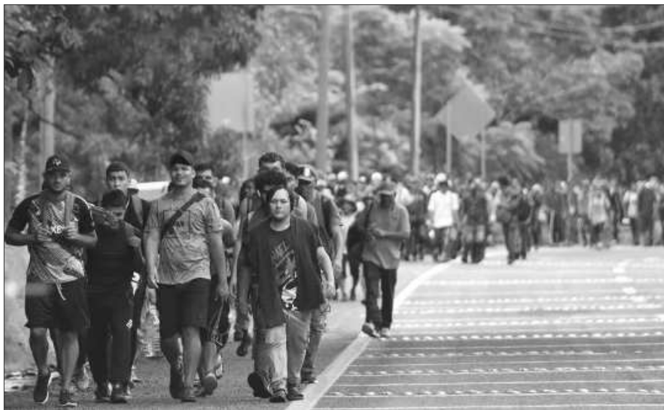
▲ "Abordamos la estrategia mexicana sobre el fenómeno de la migración y compartí que no están llegando caravanas a la frontera norte porque son atendidas en México", detalló la presidenta Sheinbaum sobre su llamada telefónica con Donald Trump.

Horas antes, la Presidenta mencionó que tuvo una "excelente conversa-