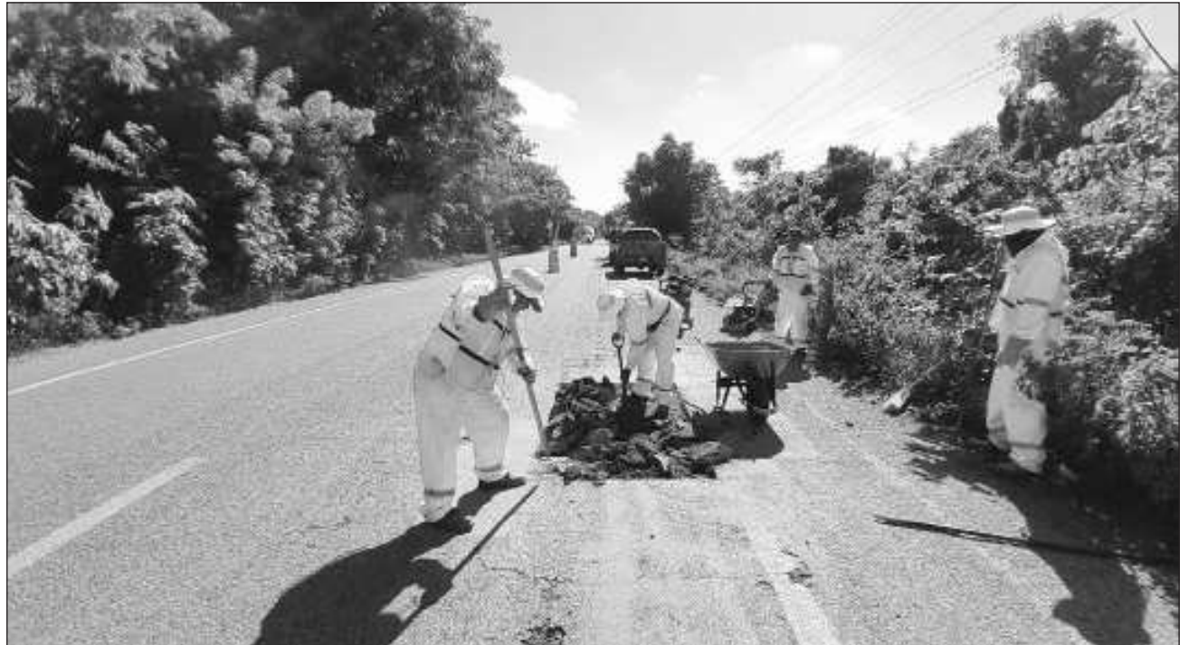
▲ Actualmente Sedena realiza trabajos de repavimentación en varios puntos de la carretera federal 307, especialmente en aquellos afectados por el paso de camiones de alto tonelaje durante la construcción del Tren Maya.

Actualmente Sedena realiza trabajos de repavimentación en varios puntos de la carretera federal 307, especialmente en aquellos afectados por el paso de camiones de alto tonelaje durante la construcción del Tren Maya; dichos trabajos cuentan con el acompañamiento del gobierno del estado.