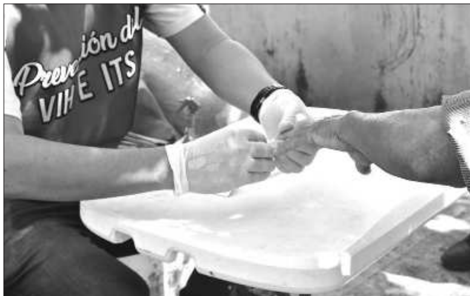
▲ En las actividades informativas y de prevención intervendrá personal de salud y sociedad.

Las actividades consisten en pláticas informativas, distribución de preservativos, lubricantes, entrega de material de promoción, difusión de la estrategia de prevención, pruebas rápidas gratis de detección de VIH, Sífilis y Hepatitis C, así como la búsqueda intencionada de usuarios para el PrEP, capacitación al personal de salud y sociedad civil.