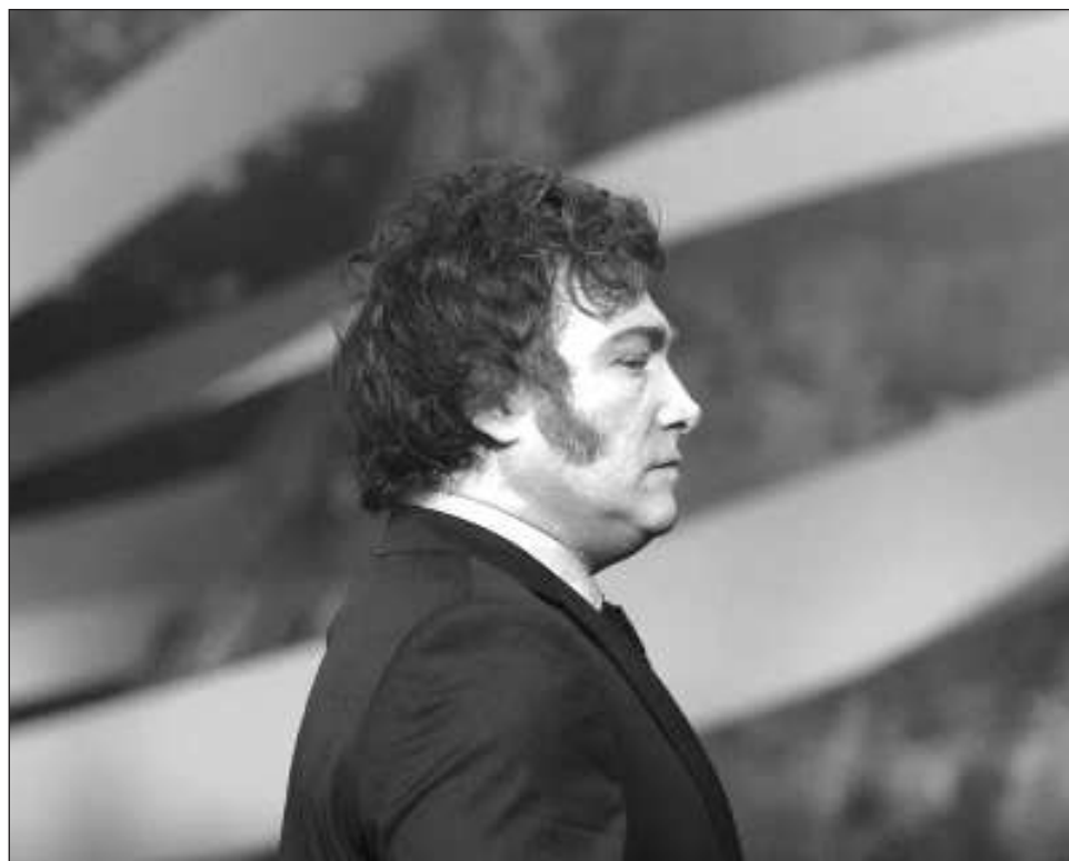
▲ Está programado que durante la cumbre de la semana próxima, Argentina tomará el relevo de la Presidencia del bloque, que hasta ahora ocupaba el país de Uruguay.

El viaje de Milei a Montevideo tendrá lugar también poco después del triunfo del candidato del progresista Frente Amplio, Yamandú Orsi, en las