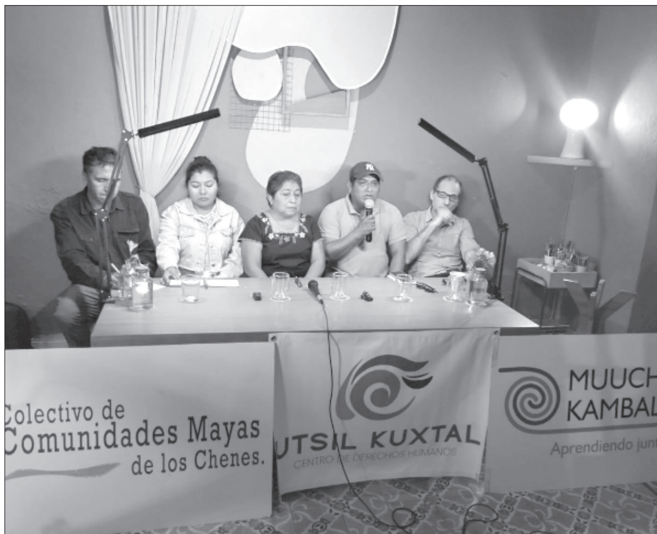
▲ La muerte de abejas que denuncian las comunidades mayas de la península es una situación de más de una década, compartida entre miembros de varias localidades tanto en Hopelchén como en Tizimín, Yucatán.

La resolución, emitida por la jueza de Distrito