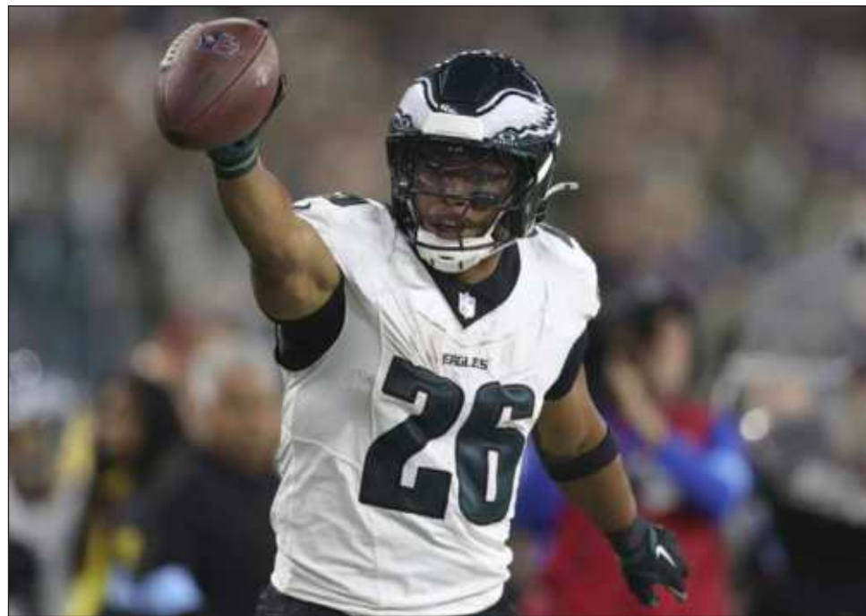
▲ Saquon Barkley celebra en la segunda mitad de un partido ante los Carneros de Los Ángeles..

Los "Eagles" están montados en una racha de siete victorias gracias al espectáculo de Barkley y a una defensiva que actualmente es la mejor en yardas permitidas, tercera contra el pase y