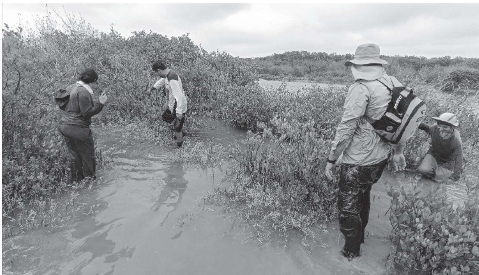
▲ Práctica en la Reserva de la Biosfera Ría Celestún para comprender la gestión de la conservación biológica in situ .

*Profesor de la ENES-Mérida de la UNAM. Los docentes mencionados en este artículo son profesores de la Licenciatura en Ecología y trabajan en diferentes dependencias del Campus Yucatán de la UNAM.