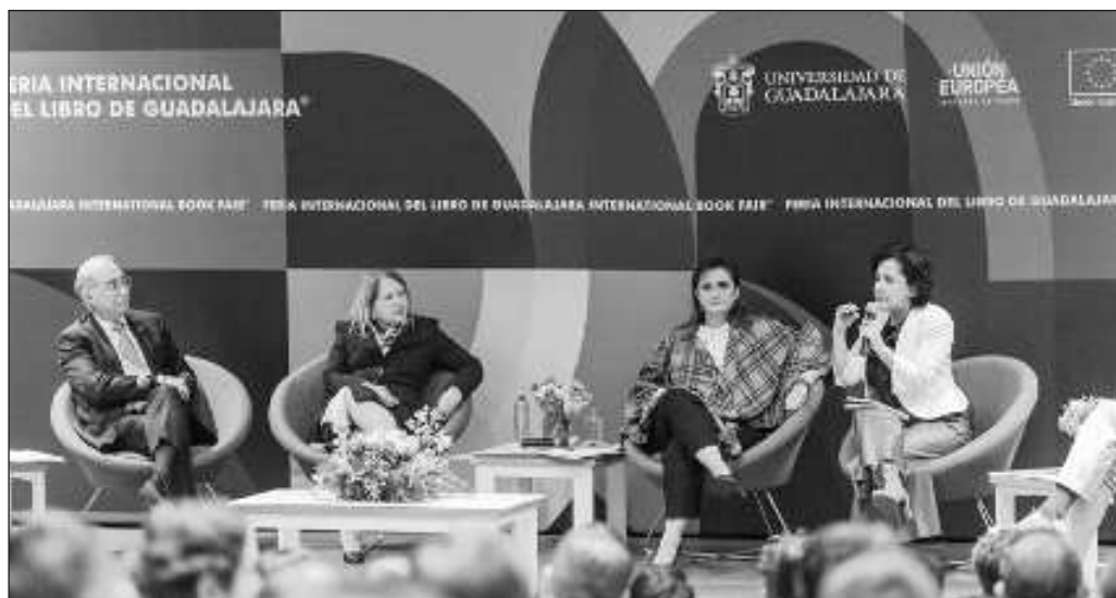
▲ La elección de ministros de la SCJN no es algo ajeno a la historia de México.

Y aún queda pendiente de mencionar si las candidaturas a jueces, magistrados y ministros estarán a cargo de los partidos, porque entonces esto implicará campañas electorales y mayor gasto en ese rubro, aparte de que también el Instituto Nacional Electoral podría imponerles criterios de representación, lo que inmediatamente hace de menos la trayectoria en impartición de justicia.