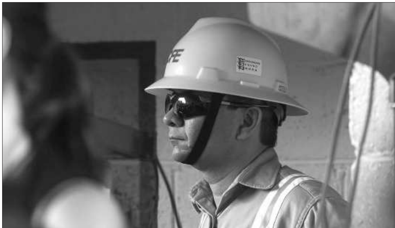
▲ Las cuchillas que suministran la energía eléctrica a la localidad de Nuevo Campechito se ubican en la comunidad de la Barra de San Pedro, en Tabasco, y al presentarse una falla, los habitantes de esta no permiten el ingreso del personal de CFE.