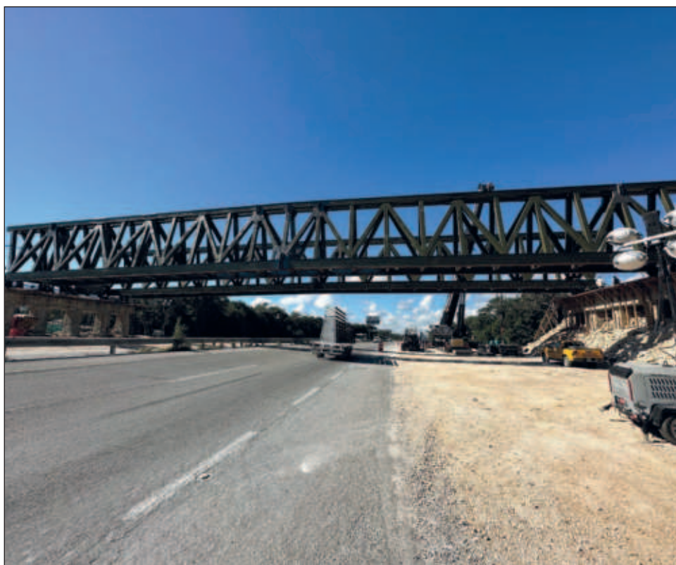
▲ La estructura conectará la zona arqueológica de Tulum y el Tren Maya.

Para esta obra ninguna autoridad anunció algún cierre provisional de la vialidad, aunque la movilidad y colocación del soporte y vigas del puente sí limitó el tráfico para la zona.