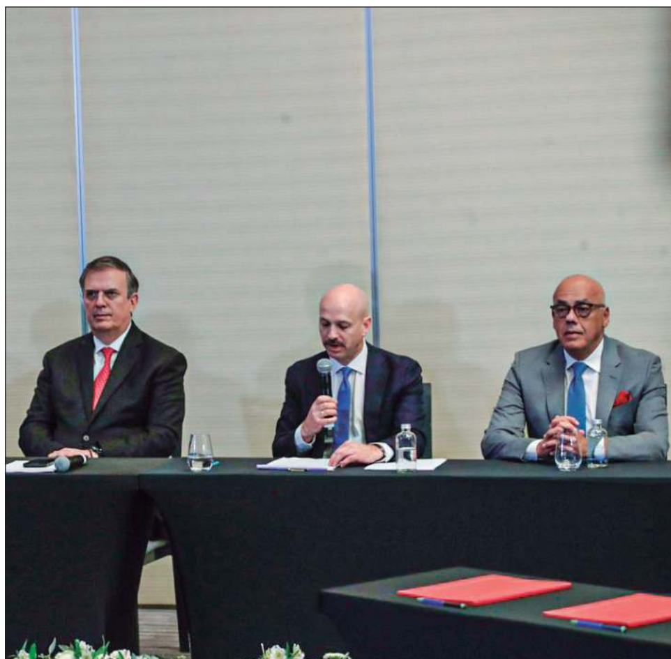
▲ En la ceremonia, encabezada por el canciller mexicano Marcelo Ebrard, se acordó la puesta en marcha de un "acuerdo parcial en materia social".

El representante del gobierno venezolano en las pláticas, Jorge Rodríguez, presidente de la Asamblea Nacional de aquel país, había anunciado en su cuenta de Twitter que con este acuerdo se "crea un mecanismo práctico, dirigido a abordar las necesidades sociales, vitales y atender problemas de servicios públicos, con base en la recuperación de recursos legítimos, propiedad del Estado venezolano, que hoy se encuentran bloqueados en el sistema financiero internacional".