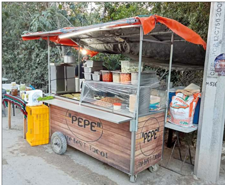
▲ Las solicitudes de permisos volverán a bajar una vez que termine la temporada alta, es por ello que la cifra es inestable, reveló la dirección municipal de Comercio.

Comentó que hay casos donde los permisos son por días, semanas o meses, pero es nada más por el periodo de temporada alta. La mayoría de esos permisos son de puestos semifijos que venden comida como tacos, hot dogs, hamburguesas, antojitos y otros platillos.