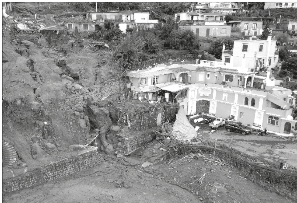
▲ Este sábado, las lluvias excepcionales produjeron un gigantesco alud en la ciudad de Casamicciola, el cual hizo colapsar edificios y arrastró vehículos al mar.

“El lodo y el agua tienden a llenar todos los espacios”, comentó el portavoz del Departamento de Bomberos italiano, Luca Cari, a la televisora esta-