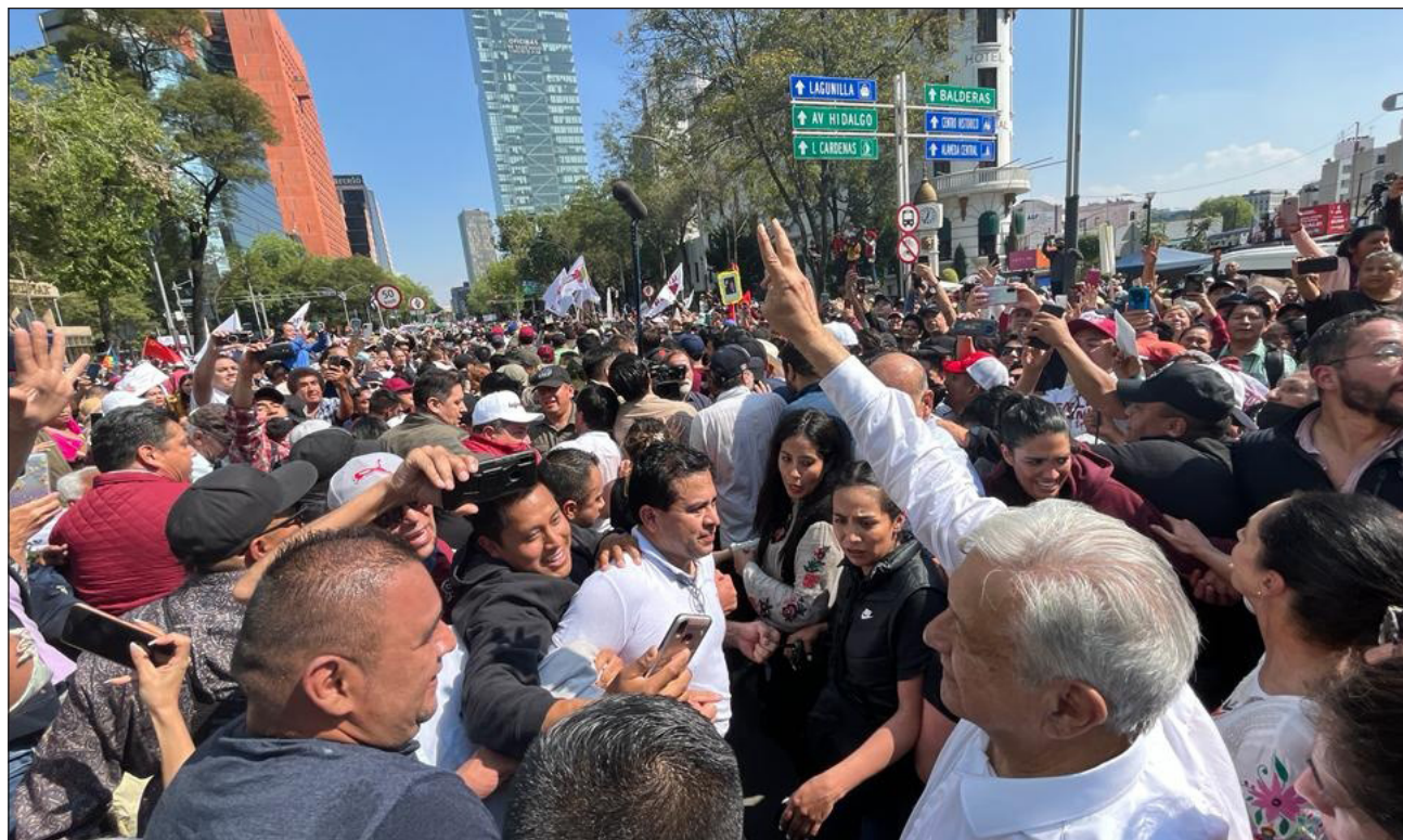
▲ Al enfilarse al cruce con Eje Central, la mancha humana se compactó aún más. Mientras el Zócalo ya se encontraba repleto y a pleno sol; para seguir el mensaje se dispuso una pantalla en el cruce de Avenida Juárez con Paseo de la Reforma.

A pesar de la anchura de la calle, el andar se volvió