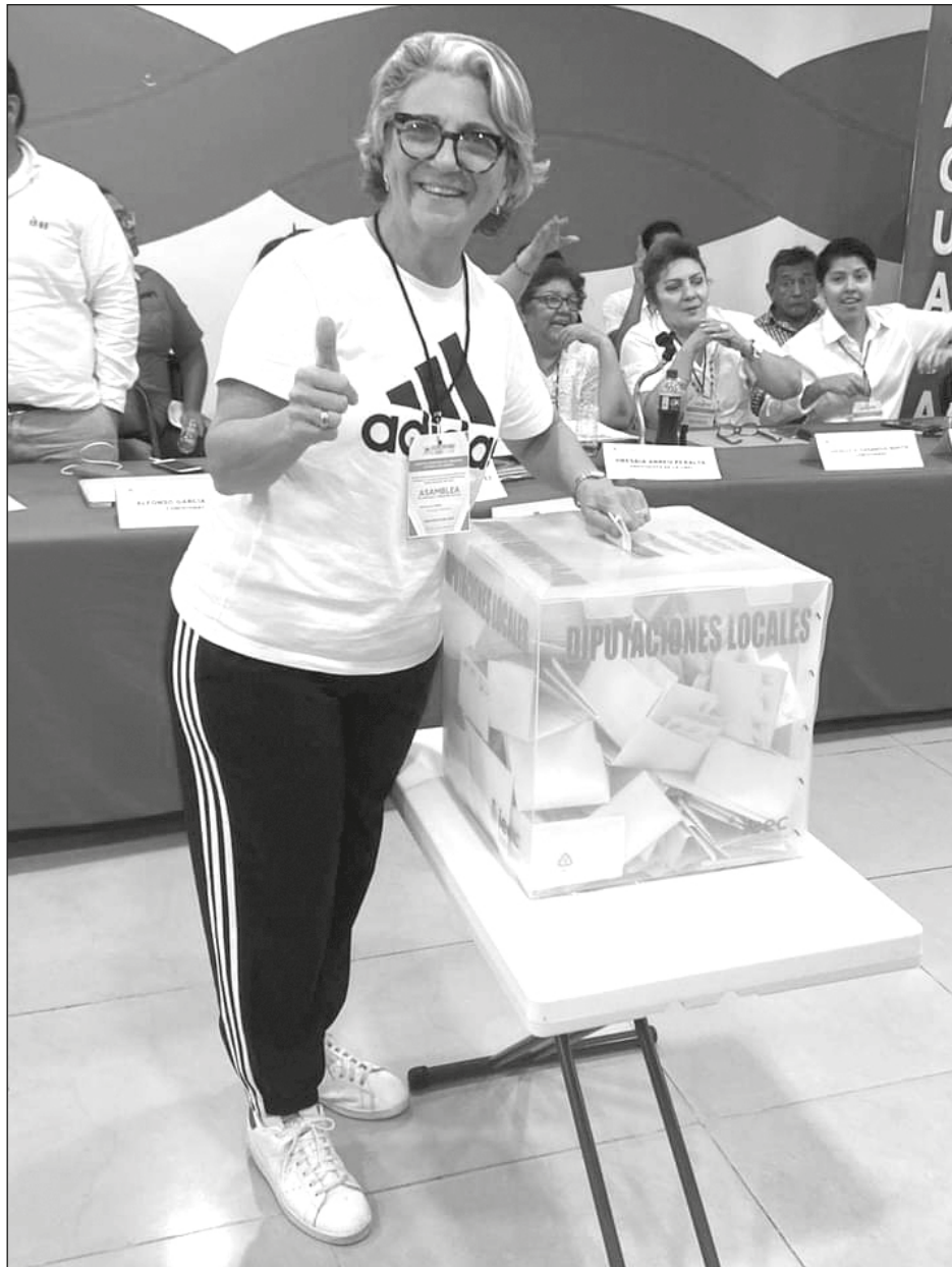
▲ A la elección interna del PRI carmelita se presentaron 158 de los 265 consejeros políticos con derecho a voto, tanto municipales como estatales y nacionales.