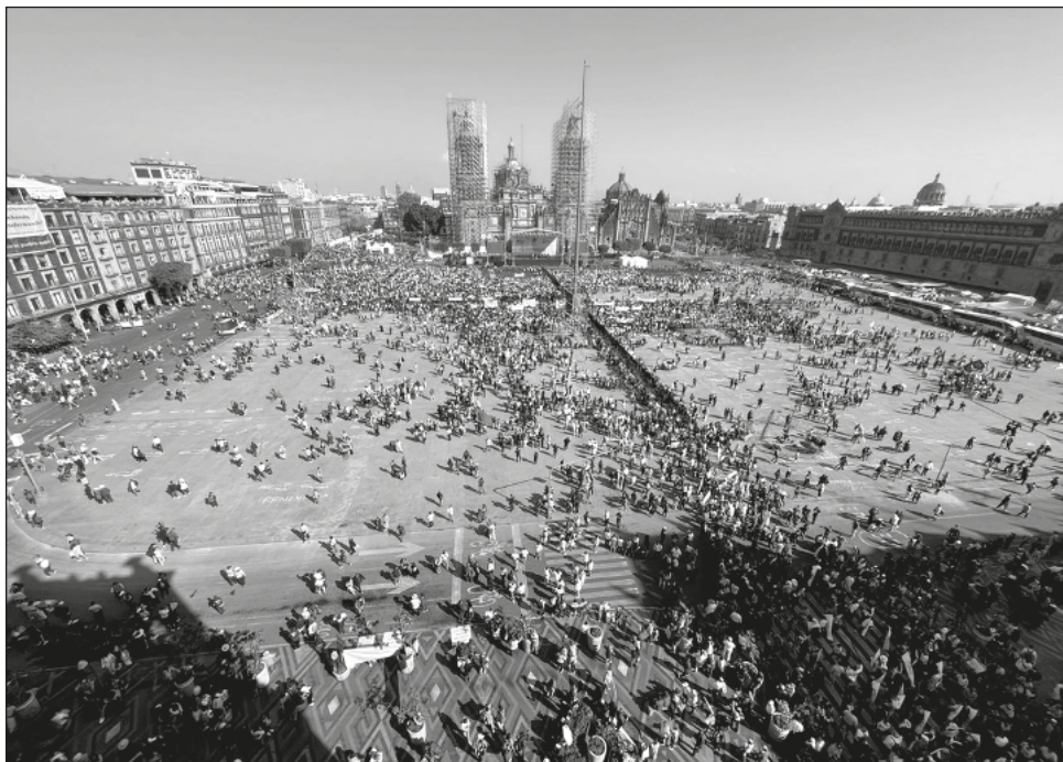
▲ Contingente a favor de AMLO llega frente a Palacio Nacional.

Alrededor de cuatro autobuses y algunas cuerdas tratan de marcar los límites entre quienes festejan el cuatro año de gobierno de López Obrador y los maestros inconformes.