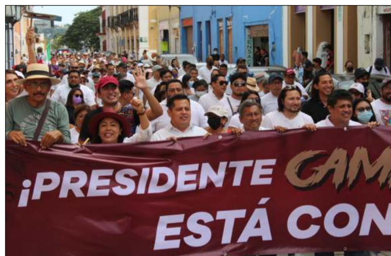
▲ Cientos de miles de personas acompañaron al presidente Andrés Manuel López Obrador del Ángel de la Independencia al Zócalo capitalino para celebrar cuatro años de transformación, mientras que sus simpatizantes replicaron la marcha en otras entidades .