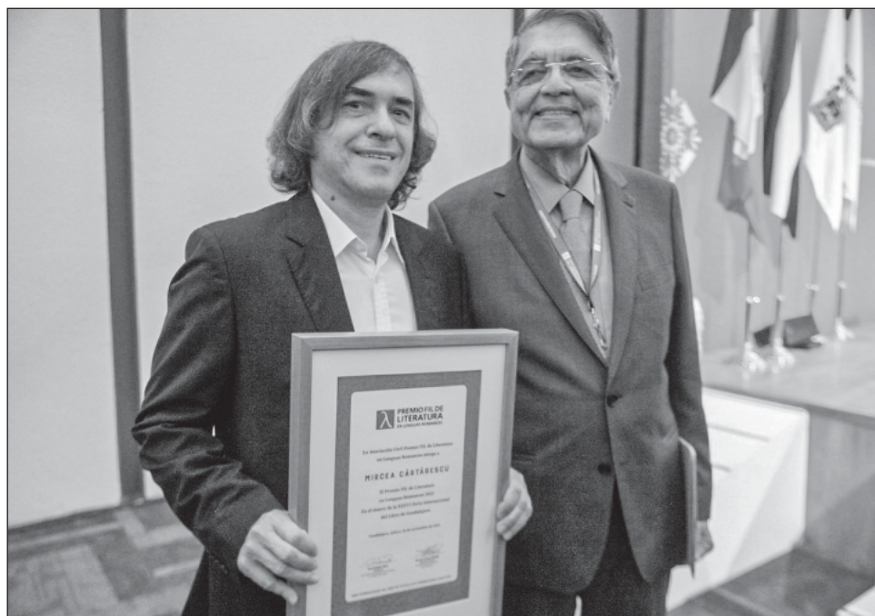
▲ Mircea Cartarescu, quien recibió el premio a las Lenguas Romances, y el escritor nicaragüense Sergio Ramírez llegaron este sábado a la FIL.