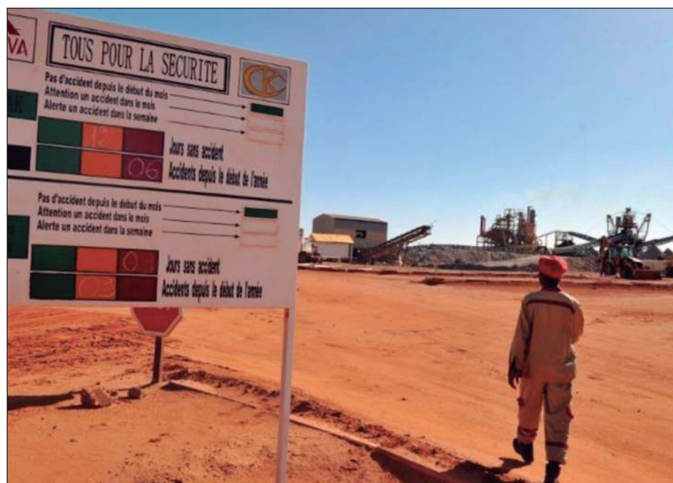
▲ Durante la década de 2010, la extracción de uranio disminuyó en Níger principalmente a raíz de la catástrofe de Fukushima; hoy, Rusia y China buscan este elemento.

Cita especialmente la “presión ecologista” tras la catástrofe de Fukushima o la explotación de “yacimientos