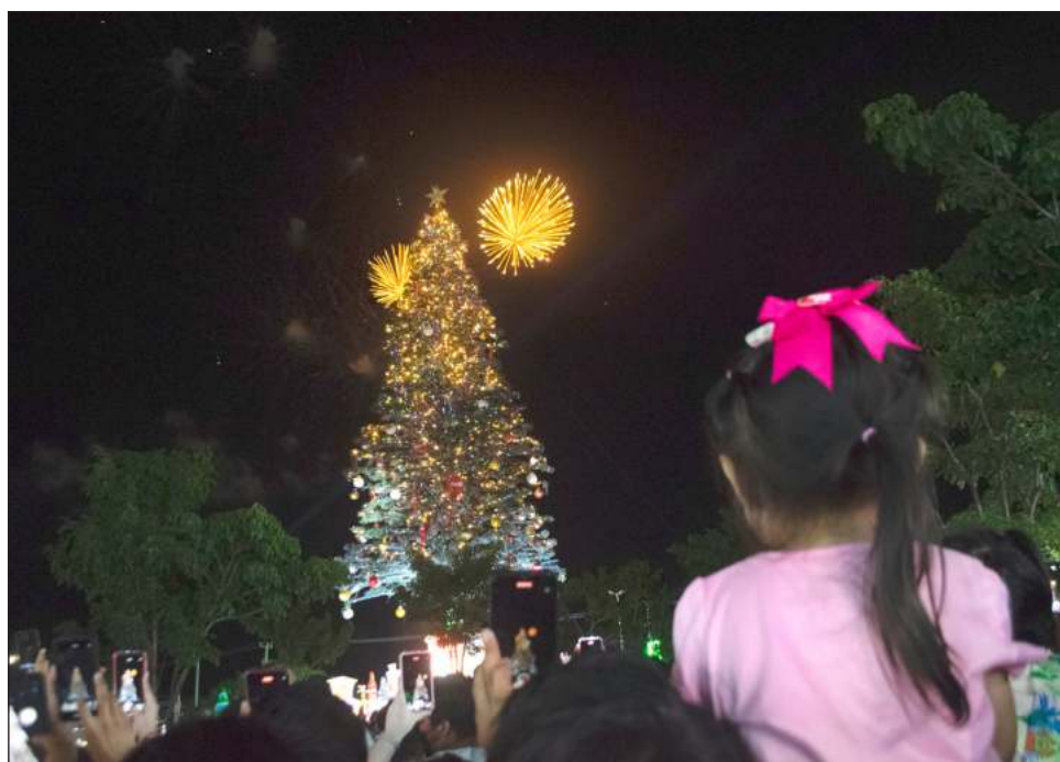
▲ Luego de dos años de interrupción, a causa de la pandemia, este sábado la empresa Bepensa volvió a encender su tradicional árbol de 45 metros de altura.

Semanalmente se presentará el espectáculo "La Gran Fiesta del Polo Norte", a las 18:30 y 20:30 horas, con excepción del 3 de diciembre.