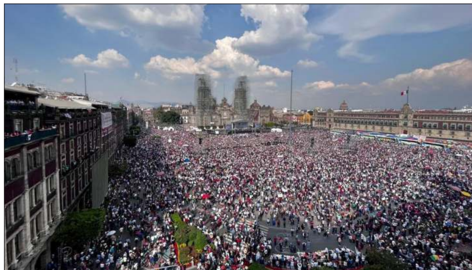
▲ Tras una larga jornada a pie, el presidente de la república, Andrés Manuel López Obrador, finalmente llegó al Zócalo de la Ciudad de México, donde inició su discurso.

De ahí que todos los días, agregó, sesiona el gabinete de seguridad, que él mismo encabeza, para recibir el reporte de la situación en el país y tomar decisiones en la materia. El ejercicio, dijo, se replica por gobernadoras y gobernadores del país.