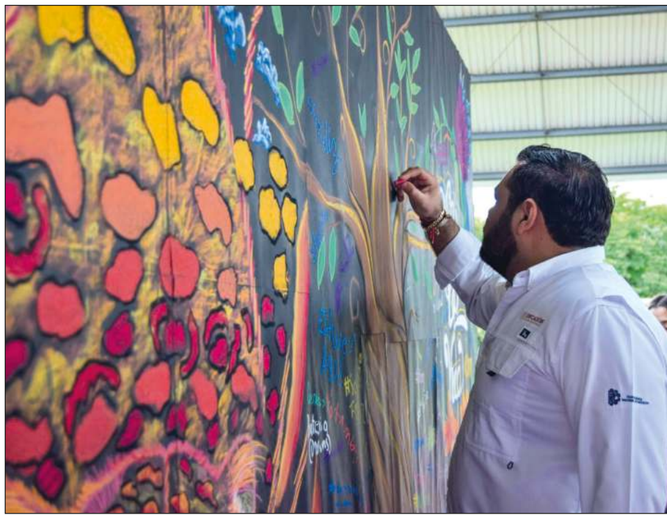
▲ El proceso de certificación para el Itescham inició el pasado mes de octubre. Ahora la institución buscará mejorar su infraestructura.

Estas certificaciones permitirán también la creación de una nueva carrera: "resulta incomprensible que en una zona pesquera no exista una carrera referente a pesquería,