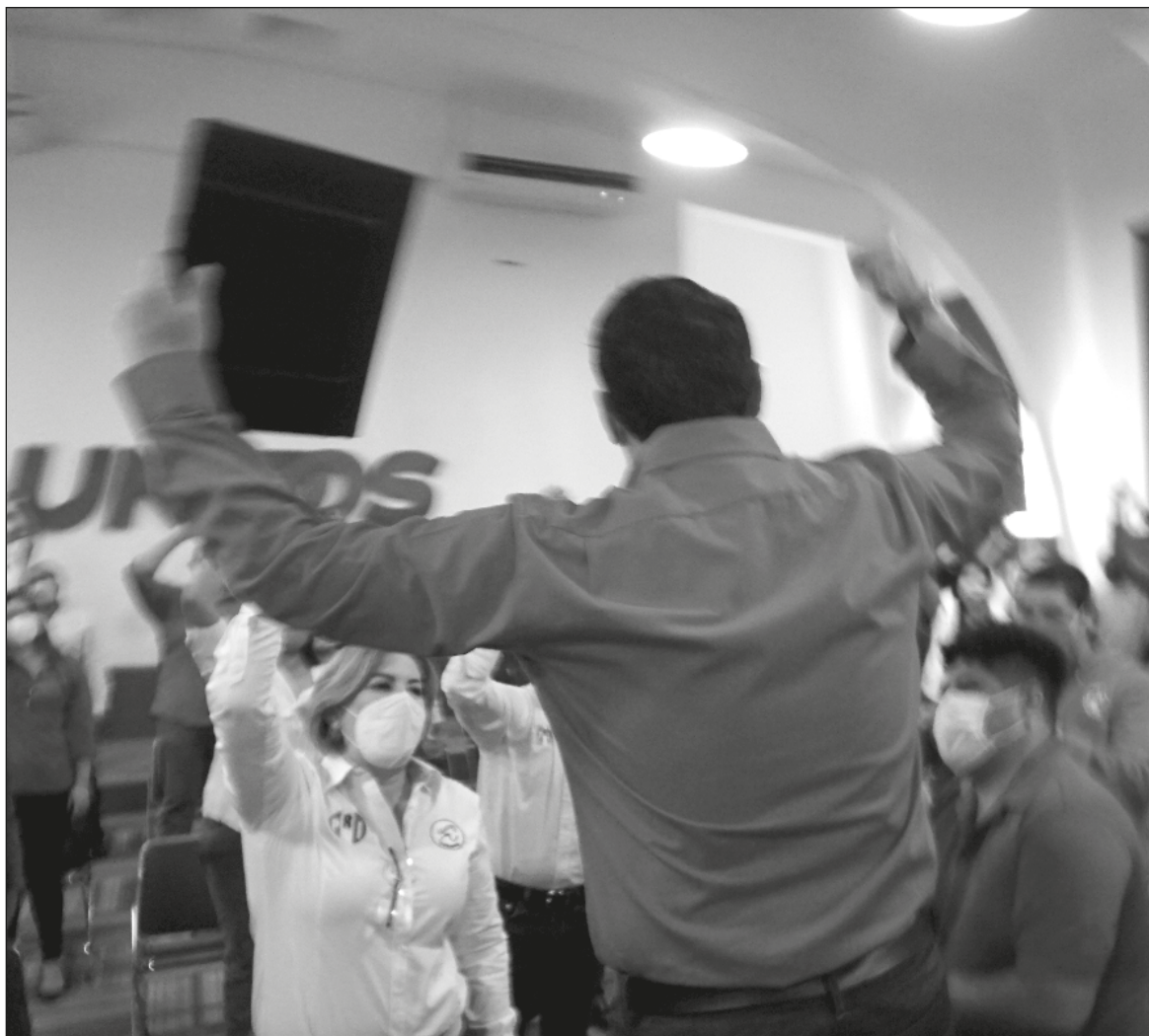
▲ "Hoy, el PRI en Yucatán es un partido satélite, sin oportunidades reales de triunfo por sí mismo y, por tanto, si decidiera competir por la gubernatura será presa de la trampa inescapable del mal candidato".

HOY, EL PARTIDO Revolucionario Institucional en Yucatán es un partido satélite, sin oportunidades reales de triunfo por sí mismo y, por tanto, si decidiera competir por la guber-