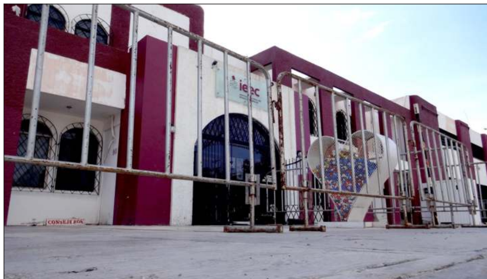
▲ Los diputados de oposición coincidieron en que Morena pretende controlar los organismos árbitros electorales en todo el país, como en su momento lo hizo el PRI.

Aunque la reforma electoral propuesta por el presidente Andrés Manuel López Obrador, y la iniciativa en lo local de Alejandro Gómez Cazarín, presidente de la Junta de Gobierno y Administración del Congreso de Campeche, sobre el recorte presupuestal a partidos políticos tampoco ha sido analizada, la propuesta de ley de egresos del gobierno estatal, presentada recientemente, contempla apenas poco