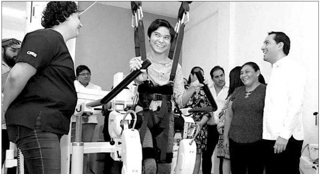
▲ Para que la entidad haga historia, se realizaron modificaciones en los cines del Centro de Convenciones Siglo XXI para convertir este espacio recreativo en un lugar accesible para todas y todos.

Para que la entidad haga historia, se realizaron modificaciones en los Cines Siglo XXI para convertir este espacio recreativo en un lugar accesible para todas y todos, por lo que se hizo la construcción de rampas en las 6 salas, se realizaron adecuaciones en los baños para usuarios de sillas de ruedas, la taquilla y mostrador de dulcería se hicieron con menor altura para la atención a personas en silla de ruedas o de talla baja, la construcción