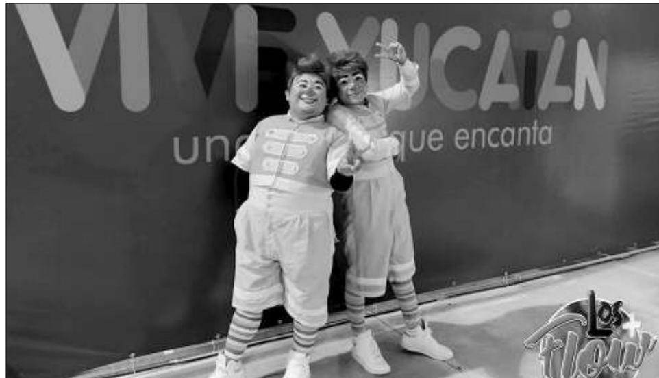
▲ Muñequito Flow y Tamborín exhortan a todos los nuevos talentos a no darse por vencidos: "No paren de reír... la perseverancia es una gran virtud".

En rueda de prensa, Muñequito Flow y Tamborín dieron a conocer que el 6, 7 y 8 de diciembre participarán en el Primer Campeo-