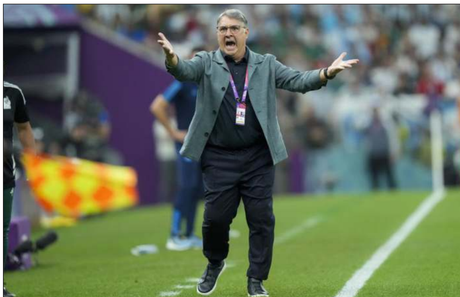
▲ Gerardo Martino fue muy cuestionado por su planteamiento táctico contra Argentina.

México ahora enfrentará a Arabia Saudí en la última fecha del Grupo C buscando un triunfo y que Polonia derrote a Argentina. Los tricolores también podrían pasar ganando por