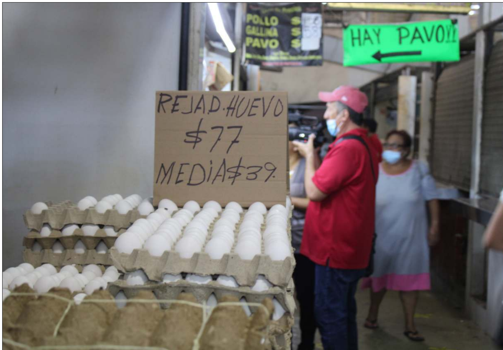
▲ El precio de la tortilla de maíz presentó una variación anual de 16.97% y es el tercer genérico con mayor incidencia anual; la harina de trigo tuvo un incremento anual de 35.37%, el huevo tuvo un incremento anual de 26.31%; la leche un incremento anual de 14%.

La agrupación especificó que los alimentos y bebidas no alcohólicas contribuyeron en 3.6 puntos a la inflación general de 8.14 por ciento. "Alimentos y bebidas no alcohólicas es la finalidad de consumo individual que más aporta a la inflación general desde mayo de 2021".