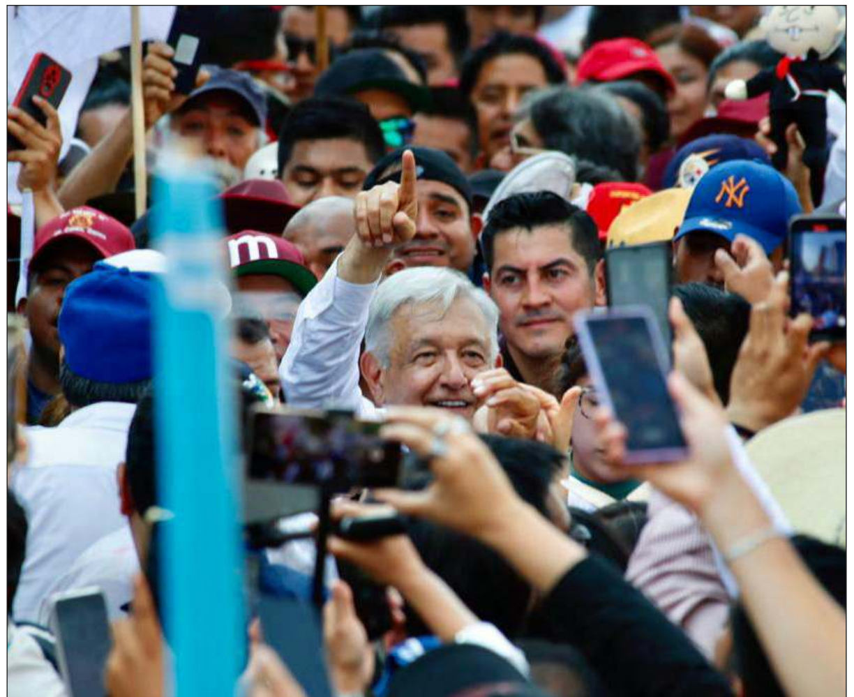
▲ Tu jo'olaj wakp'éeel ooras xiímbale', jala'ache' béeychaj u k'uchul tak tu k'iíwikil Ciudad de México. Báabnaj ichil u tajan