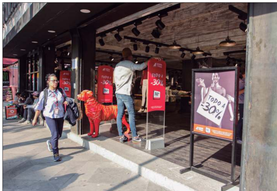
▲ El aguinaldo es un derecho laboral establecido en la Ley Federal del Trabajo. Para quienes trabajan en el sector privado el pago no podrá ser inferior a 15 días de salario, que debe pagarse a más tardar el 20 de diciembre de cada año.

lo ideal sería ahorrar entre 40 y 50 por ciento del aguinaldo e, incluso, invertirlo en instrumentos financieros, pero debido a que la mayoría de las familias "les es complicado hacerlo", 20 por ciento "ayudaría mucho".