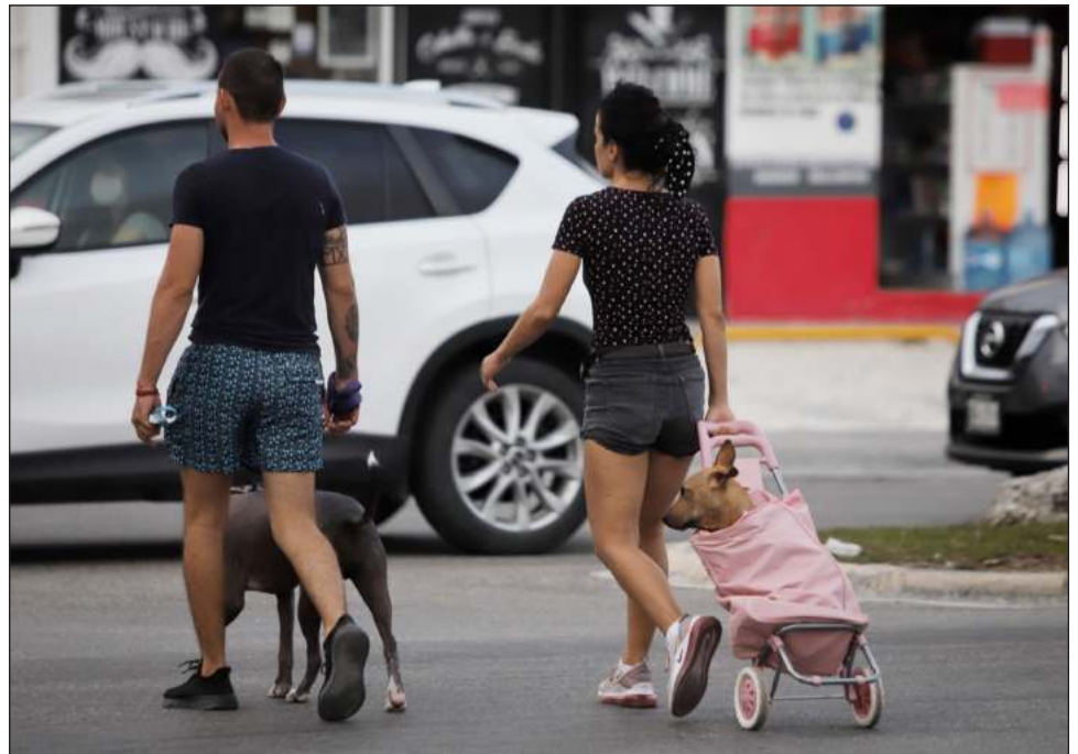
▲ Los viajeros deben hacer un pago especial para llevar en cabina a la mascota, la cual debe cumplir con requisitos básicos, como tener su cartilla de vacunación actualizada.

Y aunque de momento no hay un registro del porcentaje de viajeros que deciden llevar a sus mascotas, sí existe un límite que establece la regulación aeronáutica. “El máximo que