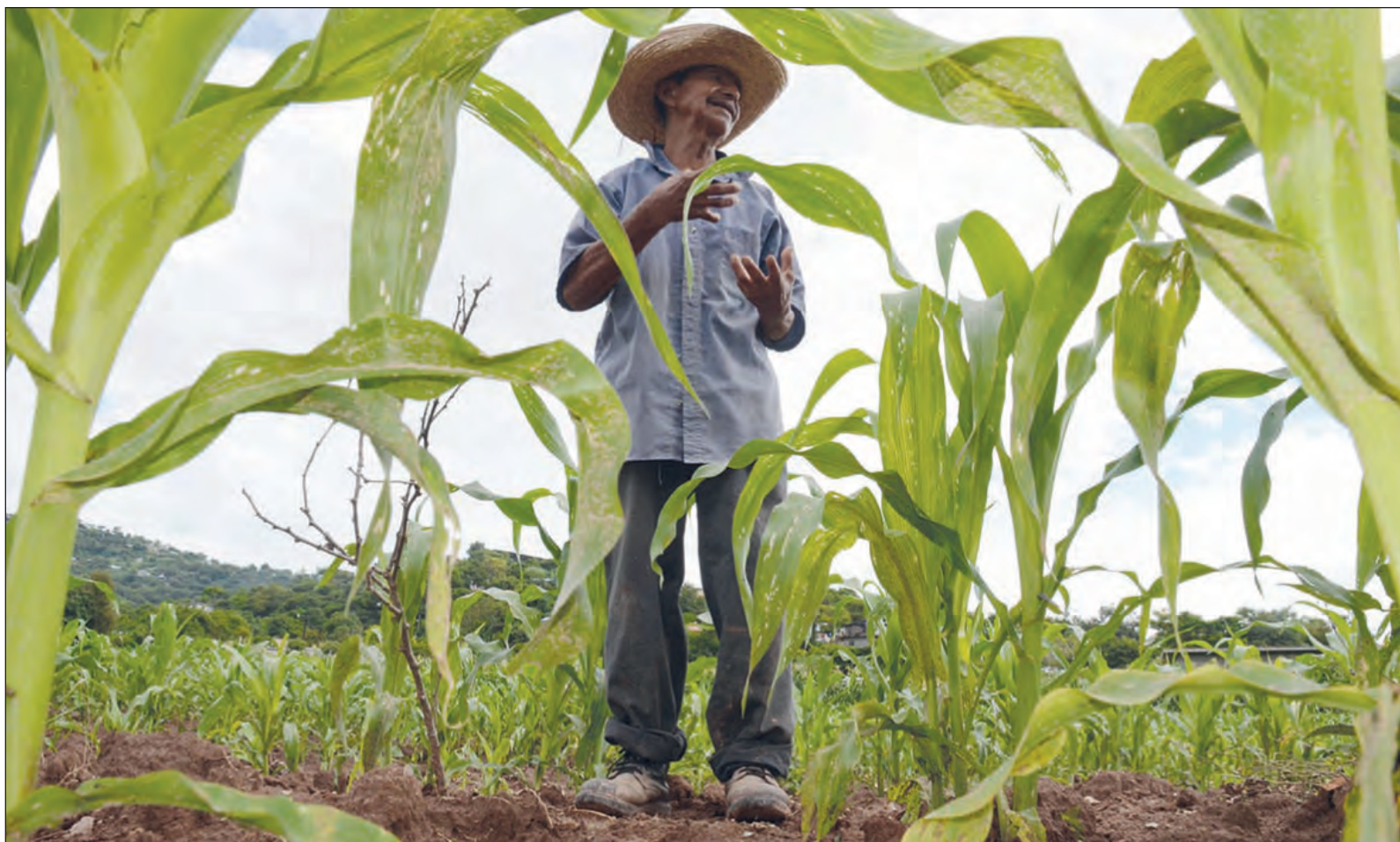
▲ La dependencia a los insumos químicos en la agricultura puede compararse con la dependencia a los combustibles fósiles como fuentes de energía, al grado que se ha considerado como una adicción.