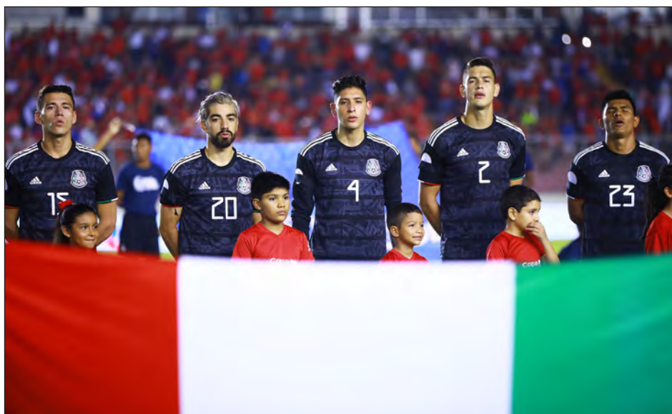
▲ La selección nacional avanzará directamente al octagonal en el que se definirán los boletos a la Copa del Mundo.

Al tener un gran total de equipos en la ronda final, la Concacaf aseguró dos encuentros lucrativos y de alto perfil entre Estados Unidos y México. El formato también da un margen para deslices, aunque no fue suficiente para evitar que Es-