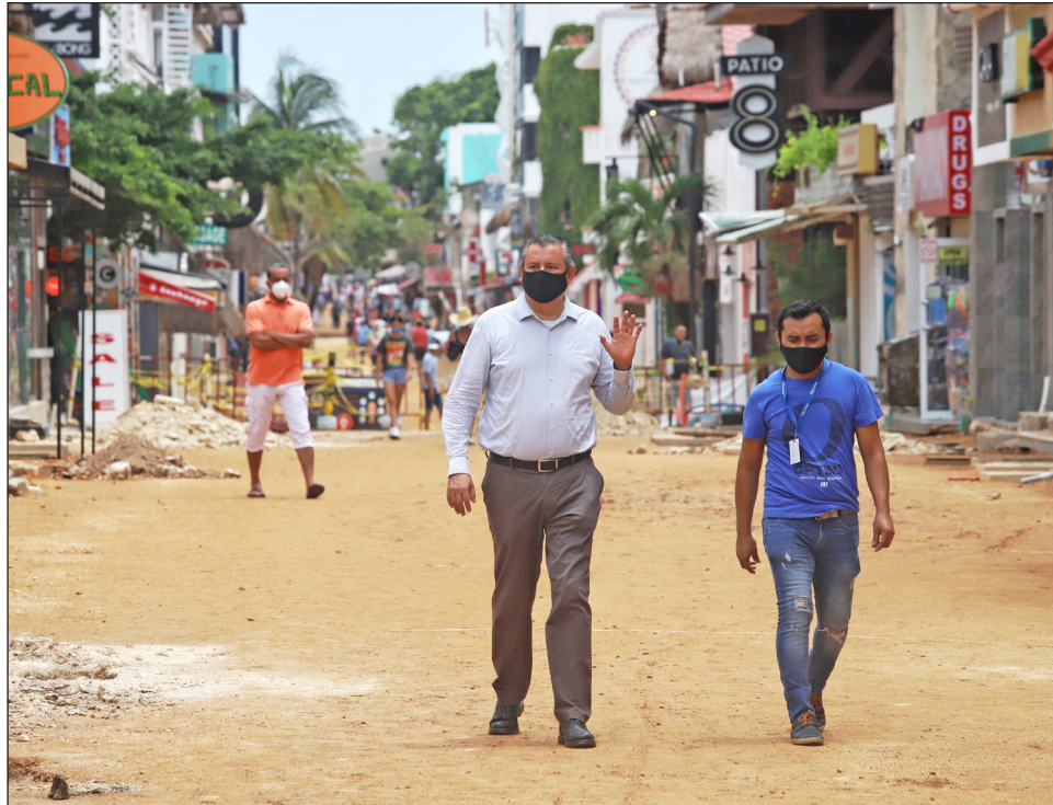
▲ En los próximos días, en diferentes puntos del estado, se habilitarán espacios con agua y jabón para que la población se lave las manos constantemente.

Sobre el estado de salud del gobernador Carlos Joaquín González, aseguró que "seguirá unos días más en reposo, aislado en su casa", por recomendación médica y para evitar contagios,