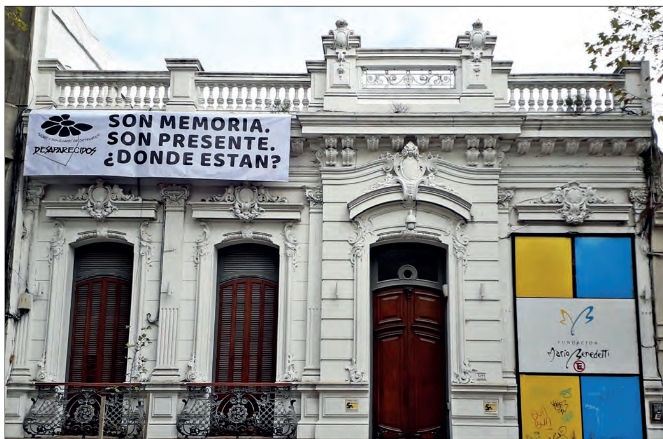
▲ La Fundación Mario Benedetti fue creada por el autor con dos ejes fundamentales: preservar, conservar y promocionar su obra, y continuar con la lucha por los derechos humanos.

El suicidio es otro tema presente en su obra, por eso la vigencia de Mario Benedetti es impresionante, también lo vanguardista, porque en cierta manera se adelantó en su tiempo al visualizar esos problemas que en esa época se metían bajo la alfombra.