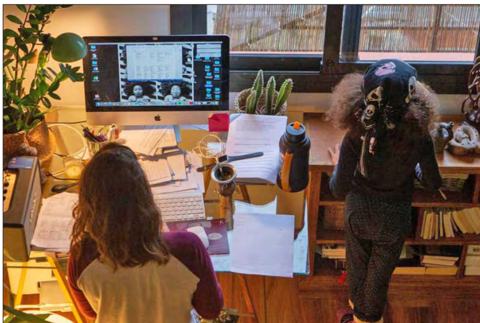
▲ El teletrabajo no es nuevo, pero con la pandemia se ha convertido en un recurso para la mayoría de los empleadores.