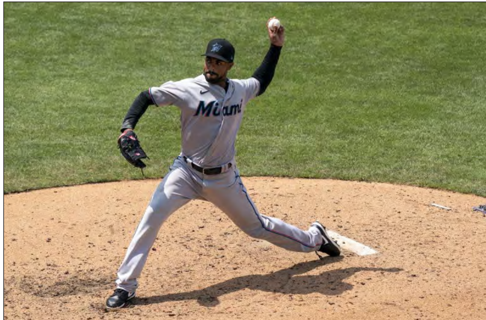
▲ Los Marlins, que se llevaron dos de tres juegos en Filadelfia, lidian con un brote de coronavirus.

El primer encuentro en casa de los Marlins contra los Orioles fue suspendido, así como el duelo entre los Yanquis y los Filis. Los Bombarderos del Bronx habrían estado en el mismo vestuario que los Marlins usaron