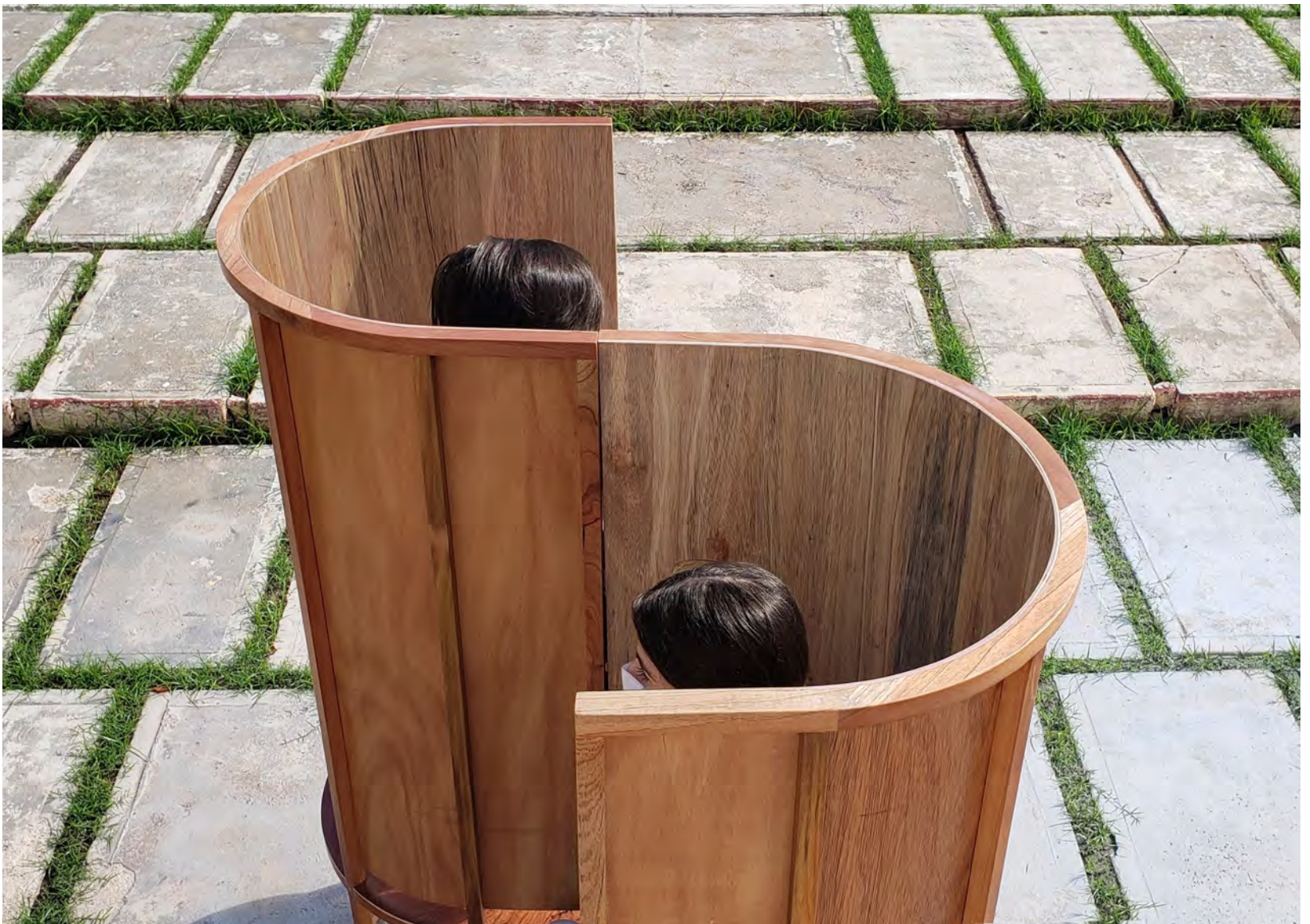
▲ El prototipo de silla Susana es de madera de encino, elegida por su resistencia y ligereza.

El COVID nos cambió la vida, debemos readaptarnos así como los elementos de nuestro entorno, por lo que tal vez en breve, y mientras aprendemos a convivir con la pandemia, podamos verlas en los parques reemplazando a las anteriores.