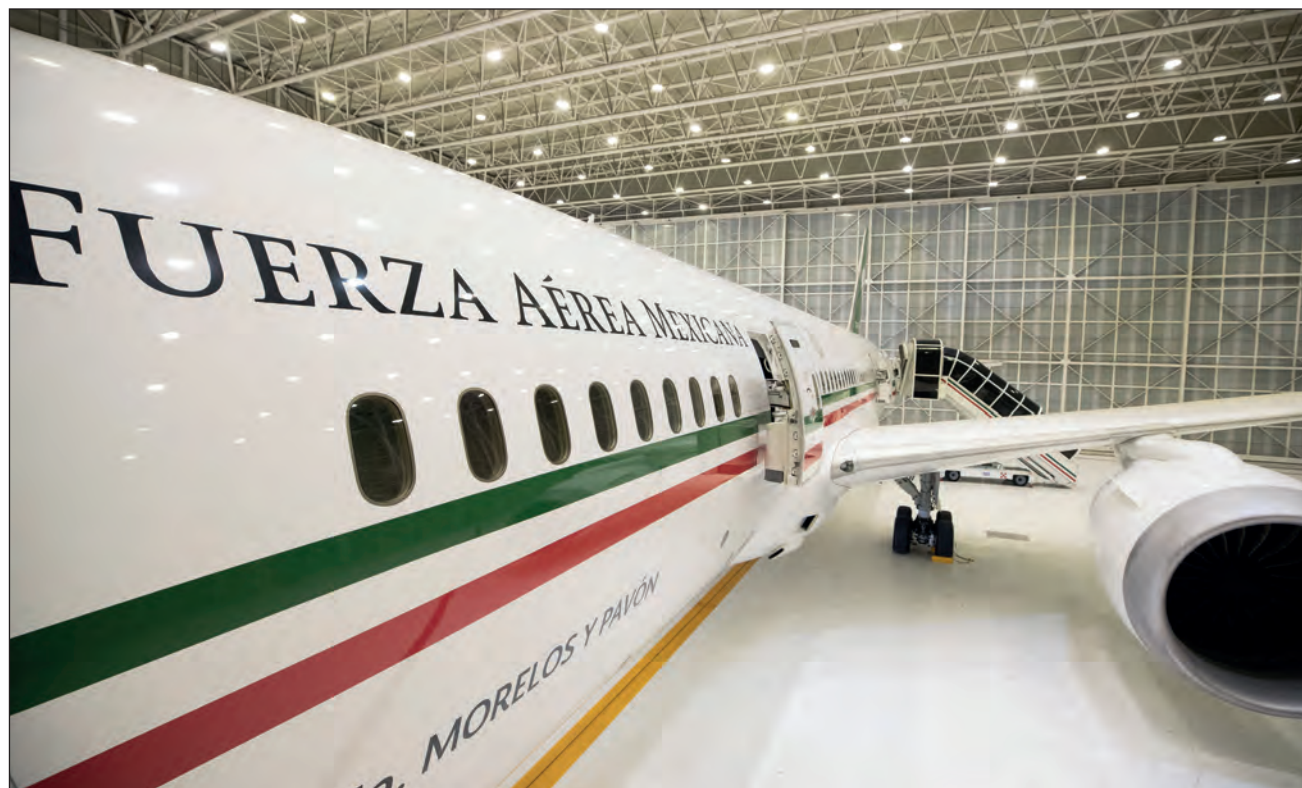
▲ El Presidente pidió a los mexicanos que ayuden con la compra de cachitos y recordó que parte de lo recaudado se destinará para compra de equipo médico.

"Por eso decidimos hacer esta conferencia porque falta poco para el 15 de septiembre", cuando se realizará el sorteo, por lo que pidió ayuda para la compra de boletos.