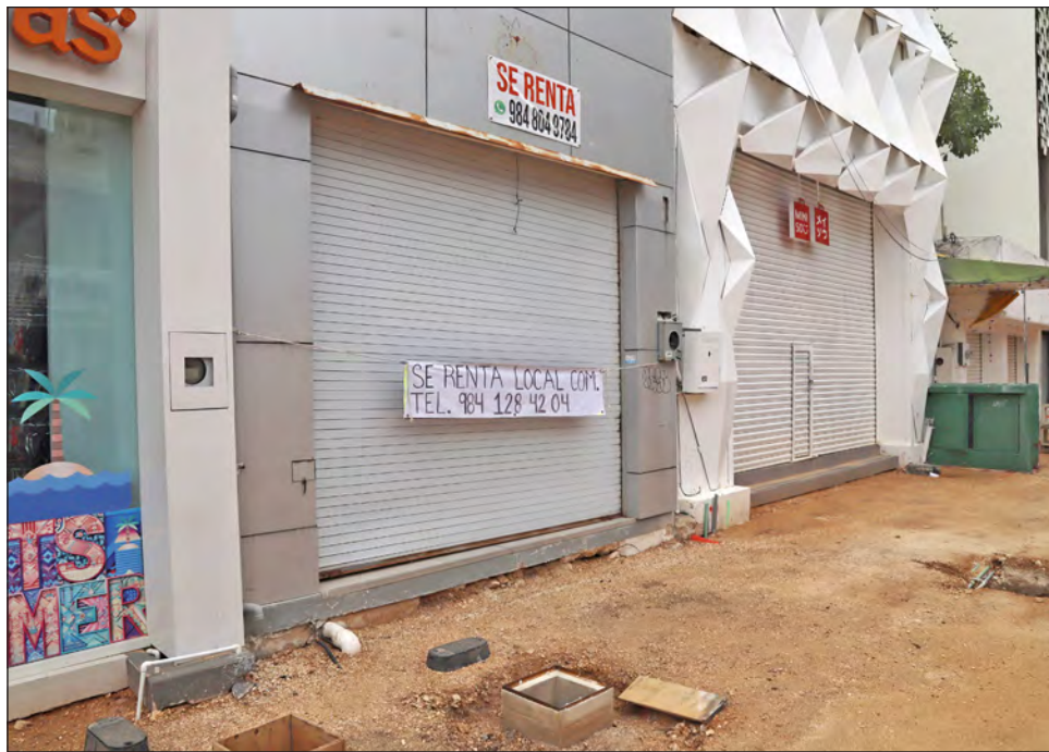
▲ Las cámaras empresariales del estado coincidieron en la importancia de diversificar la economía para enfrentar los temas de seguridad y darle una mejor calidad de vida a la gente.

que apuntaba a que para este año habría una diversificación, pero no avanzó por el cambio de administración federal.