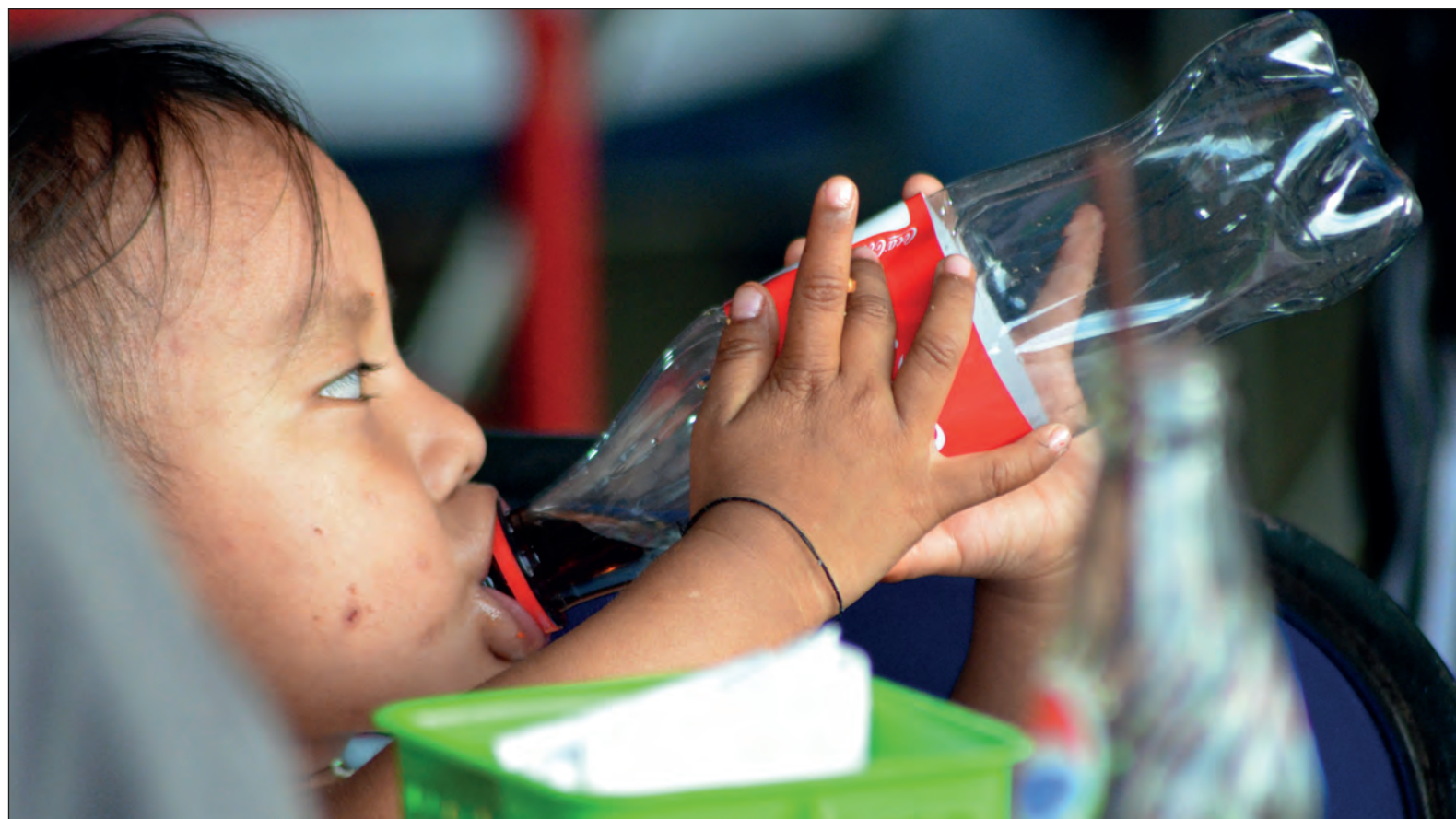
▲ En pleno Siglo XXI existen miles de comunidades donde muchas mamás no tienen, no pueden o no quieren amamantar a sus hijos y lo hacen con un biberón lleno de gaseosa.