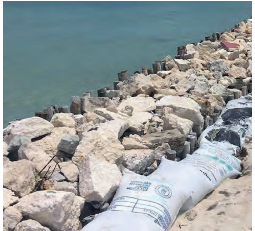
▲ Los espolones, conocidos también como espigones, son estructuras colocadas transversalmente a la línea de costa, que han sido usadas históricamente para proteger y recuperar zonas de costa.