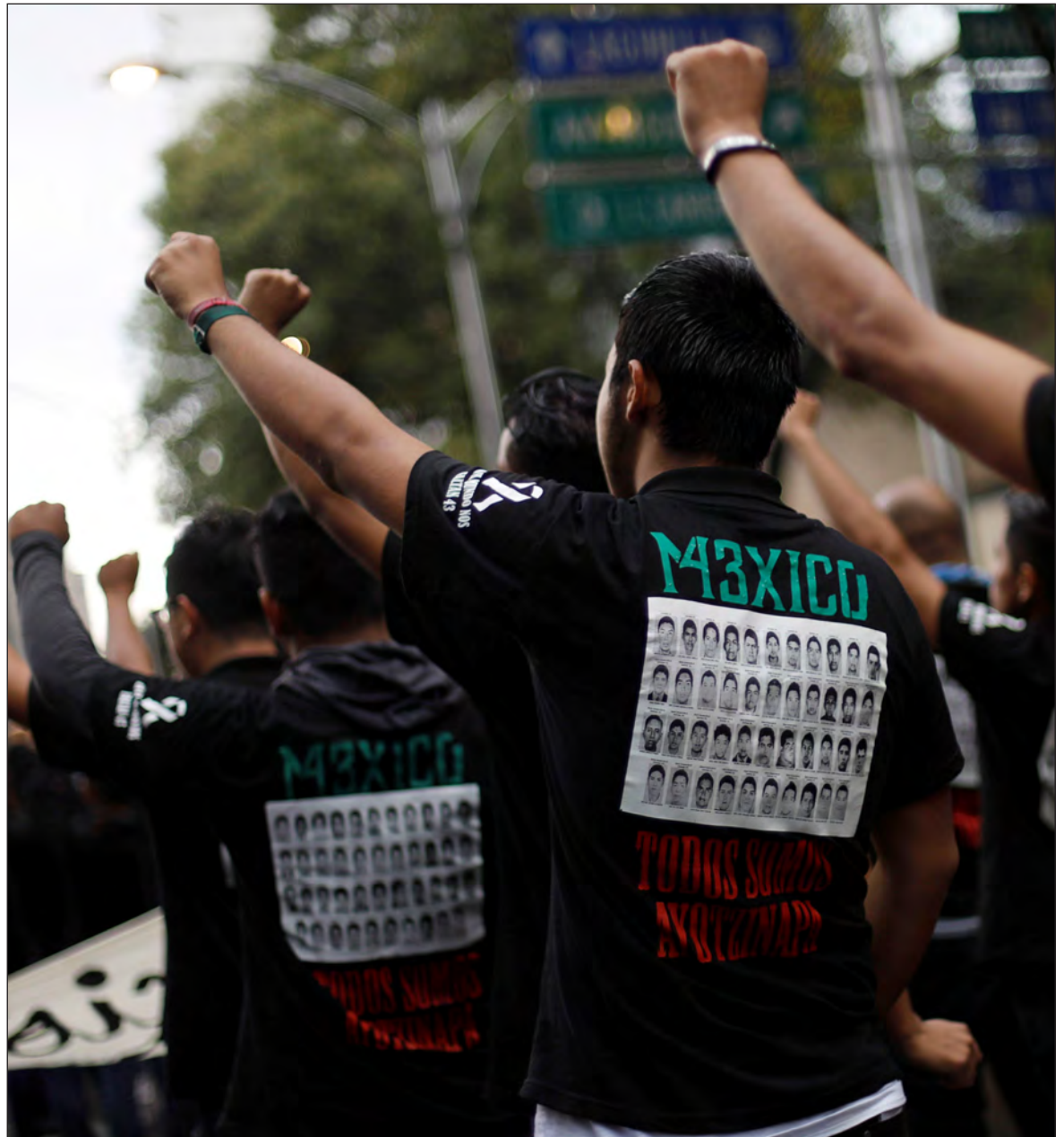
▲ Si pudiéramos cuantificar el silencio o apoyo de muchos de esos “intelectuales” a los gobiernos anteriores tendríamos cantidades exuberantes de desvergüenza, pues apoyaron la guerra que ensangrentó al país y callaron sobre la desaparición de los 43 estudiantes de Ayotzinapa.

El documento puede servir también para encubrir con el juego de la libertad de expresión y la “crítica al poder” las revelaciones que pronto comenzarán a salir a la luz mediante las declaraciones que hará Emilio Lozoya, en las cuales muchos nombres de los antiguos gobiernos se verán implicados, al igual que en el caso de los 43 estudiantes desaparecidos de Ayotzinapa, la bomba pronto detonará alcanzando a muchos de esos “intelectuales” vinculados de una u otra forma, ya sea por su silencio, por su participación en la construcción y difusión de las “verdades históricas” o literalmente por recibir dinero del erario público. Se sabe