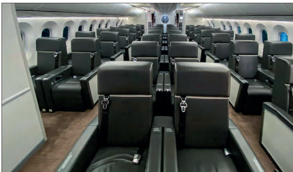
▲ “Es monumental, faraónico y, desde luego, este lujo es un insulto al pueblo de México”, comentó López Obrador del avión presidencial.