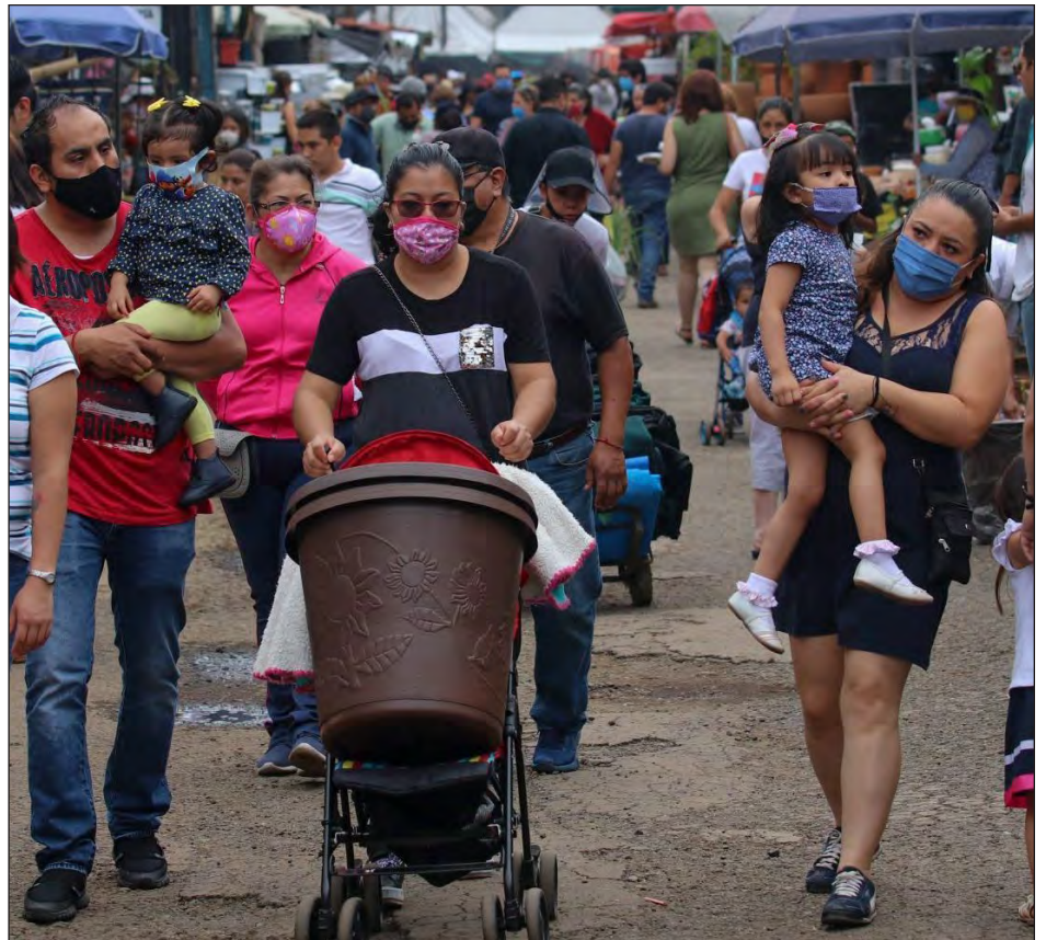
▲ Este viernes no hubo actualización del semáforo epidemiológico nacional, y pese al color rojo, en todo el país, algunas calles lucen abarrotadas.