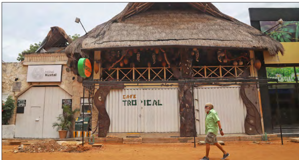
▲ El corazón turístico de Solidaridad, que el año pasado reportó el mayor arribo de sargazo de su historia, se encuentra en remodelación: el Ayuntamiento invirtió 117 mdp en el cambio de imagen de la Quinta Avenida.

El destino, que reportó el año pasado el mayor arribo