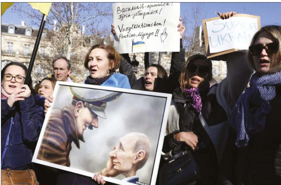
▲ When Putin decided to invade and embark on his quest for conquest, he appears to have greatly miscalculated his victim.

BUT IT IS apparent that Putin's miscalculations may lead to a public embarrassment for both he and Russia. One would hope that this possibility will not lead Putin into taking action that could be catastrophic for all of us.