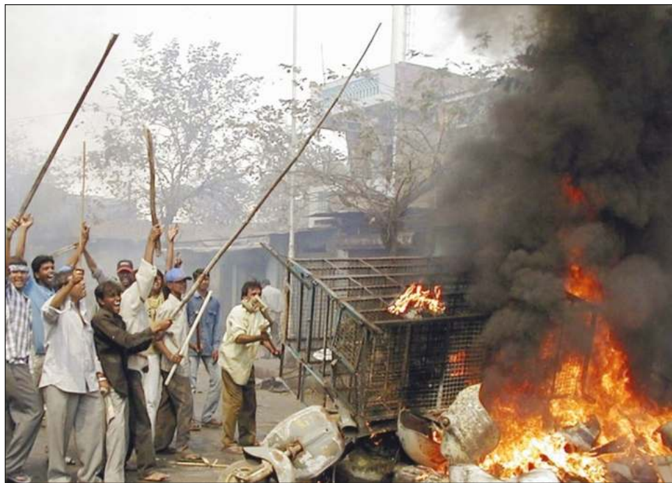
▲ Aunque la India es un país secular, son frecuentes las tensiones entre la mayoría hindú y la minoría musulmana.

La muerte de 59 peregrinos hindúes al incendiarse el tren en el que viajaban el 27 de febrero de 2002 en el pueblo de Godhra en Gujarat desencadenó una matanza indiscriminada contra musulmanes, a los que culparon del incidente, que se prolongó durante varios días.