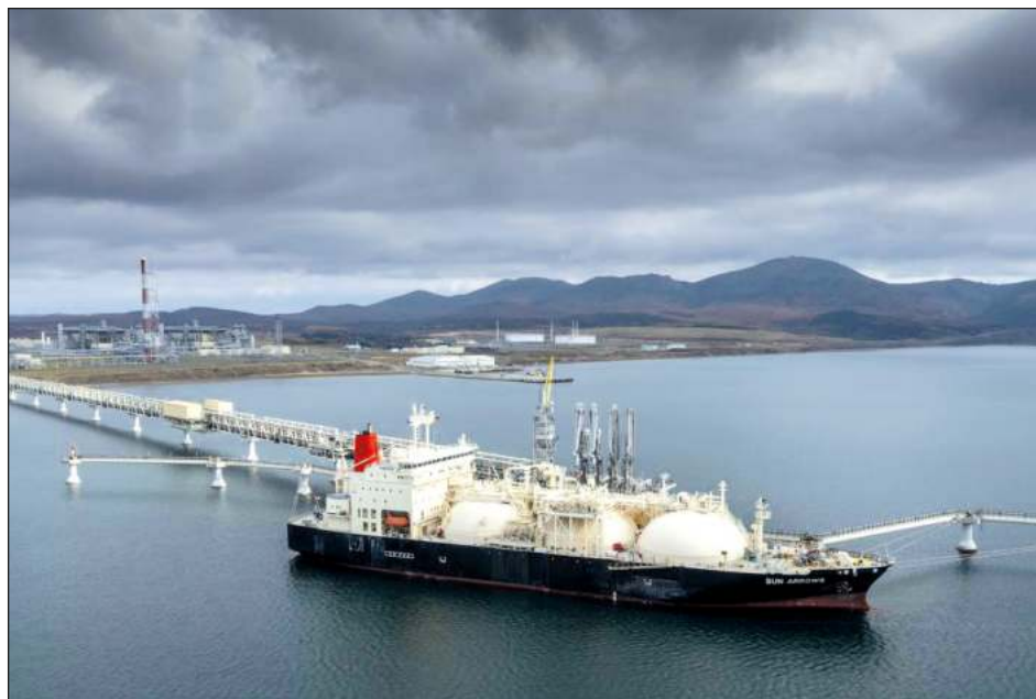
▲ Expertos y académicos opinan que excluir la industria medular de la economía rusa esencialmente limita la eficacia de las sanciones, y podrían incluso endurecer la postura de Vladimir Putin.

Los políticos en Estados Unidos y Europa "decidieron exceptuar al único sector que podría realmente ser decisivo. Yo no creo que Rusia no se da cuenta. Esto posiblemente les está diciendo que Occidente realmente no tiene ganas de