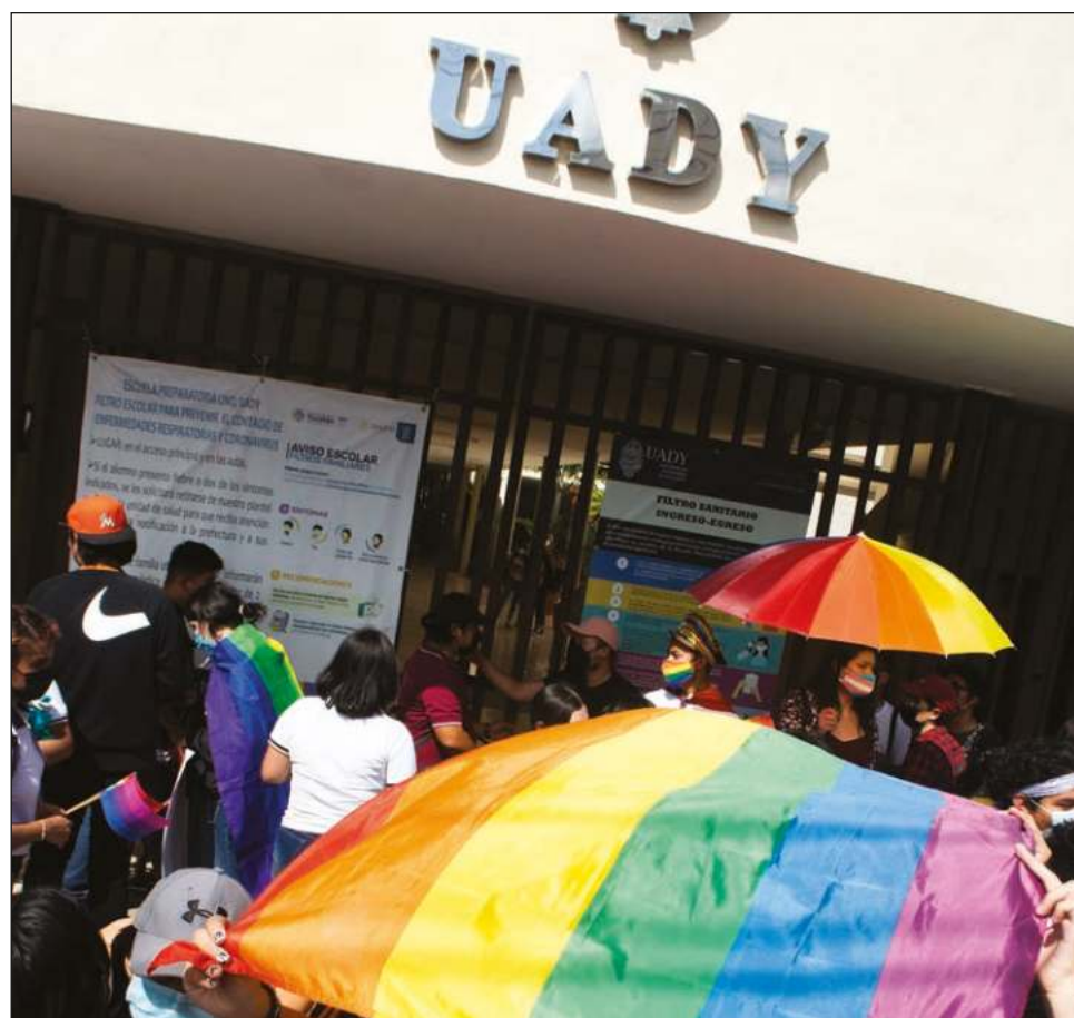
▲ Estudiantes de la Preparatoria 1 exigieron una disculpa pública por parte de la casa de estudios, tras lo acontecido el pasado 16 de febrero, durante las celebraciones del Día del Amor y la Amistad.

capacite al personal de la universidad en temas de diversidad sexogenérica, inclusión y derechos humanos, así como