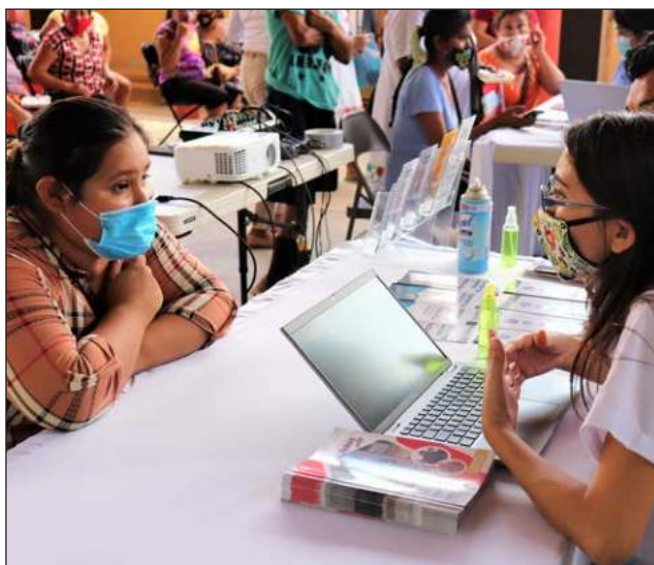
▲ Suma de Talentos es un programa inclusivo que ha dispuesto la empresa productora de carne de cerdo.