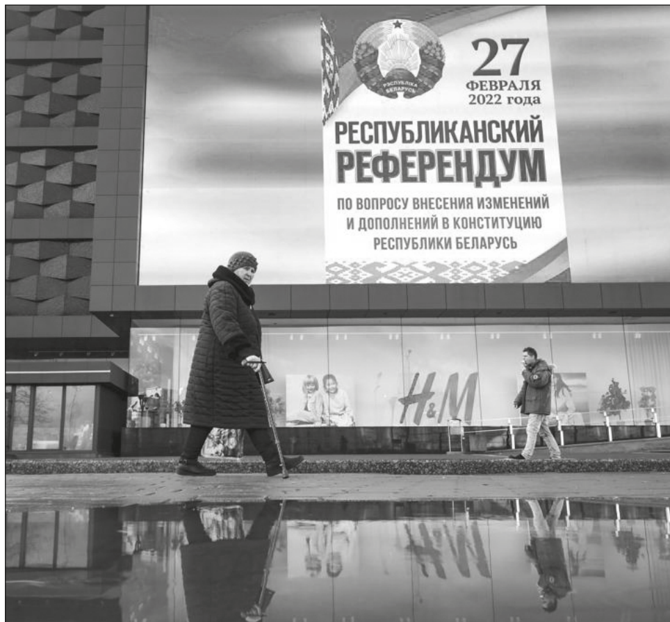
▲ De aprobarse la reforma constitucional, Alexander Lukashenko permanecería en la presidencia de Bielorrusia hasta 2035.

“Las fuerzas rusas están lanzando misiles contra Ucrania desde su territorio. Desde su territorio, están matando a nuestros niños, destruyendo nuestras viviendas y tratando de destruir todo lo que hemos logrado durante décadas”, añadió.