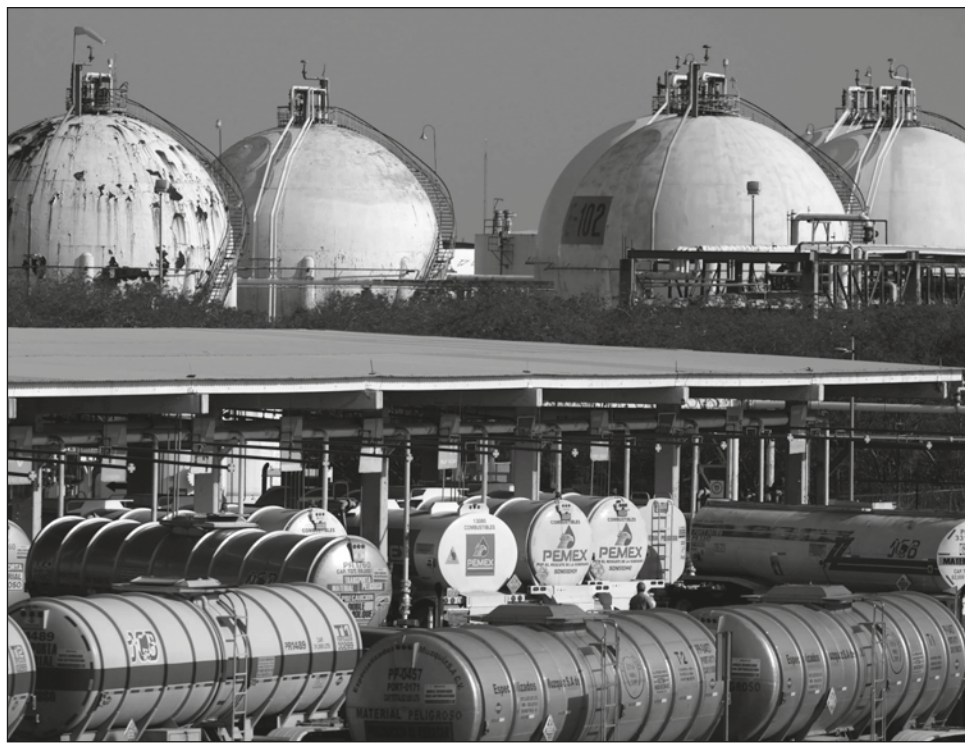
▲ Según los empresarios, Pemex ha hecho por pagar a sus proveedores, pero ahora tiene la oportunidad de establecer un plan de pagos.

Señaló que el conflicto armado en Ucrania ha impulsado un aumento en los precios internacionales del petróleo, lo cual impactará de manera favorable en las finanzas de Pemex.