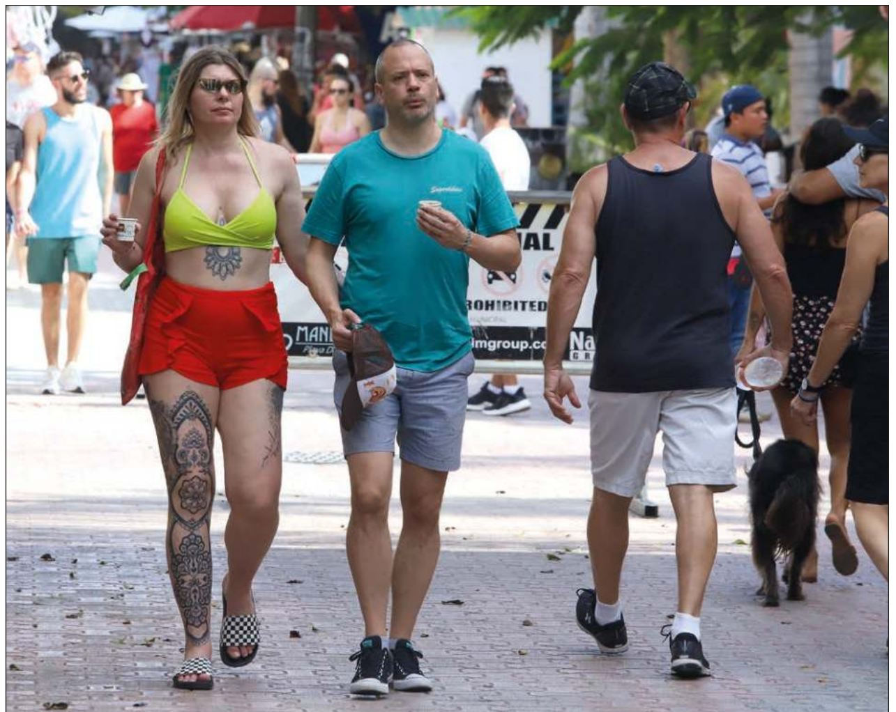
▲ En 2021, el turismo dejó una derrama de 10 mil millones de dólares, según datos de Sedetur.

El secretario indicó que el turismo en 2021 dejó una derrama de 10 mil millones de dólares.