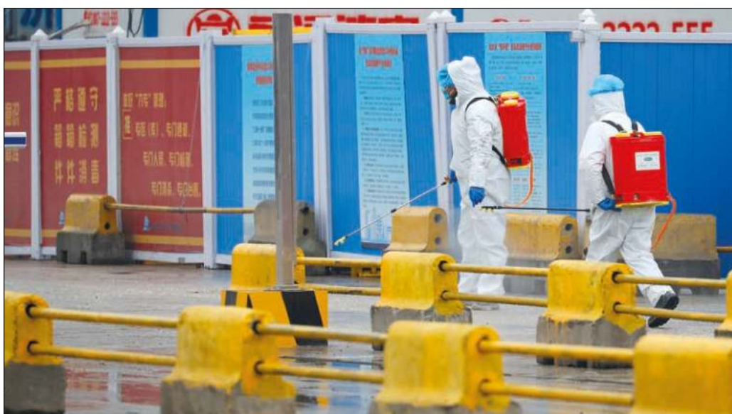
▲ Una de las principales características de la emergencia sanitaria es precisamente la necesidad impuesta de aprender sobre la marcha.