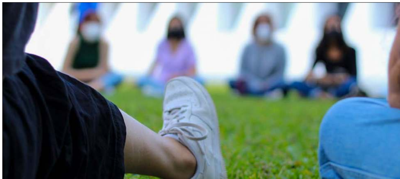
▲ El número de emergencias recibe muchas más llamadas que las denuncias que llegan a realizar las mujeres ante el órgano de la Fiscalía destinado a atenderlas.

La funcionaria destacó que la mayoría de las llamadas son realizadas los fines de semana, pero éstas son acumuladas y reciben en promedio 20 denuncias los días posteriores al fin de semana; es decir, lunes y martes, cuando las mujeres violentadas obtienen valor y hacen la llamada para denunciar un hecho que sucedió recientemente.