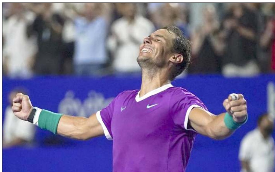
▲ Rafael Nadal, el rey de Acapulco.

El balance para el Abierto Mexicano es muy positivo, afirmó su director, Raúl Zurutuza. “Se ha hecho un esfuerzo enorme