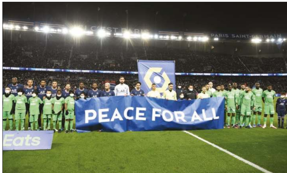
▲ Mensaje a favor de la paz antes del duelo PSG-St. Etienne en la Liga de Francia.

Al cumplirse el cuarto día de la invasión rusa a Ucrania, la Federación Internacional de Judo suspendió provisionalmente al presidente ruso Vladimir Putin como presi-