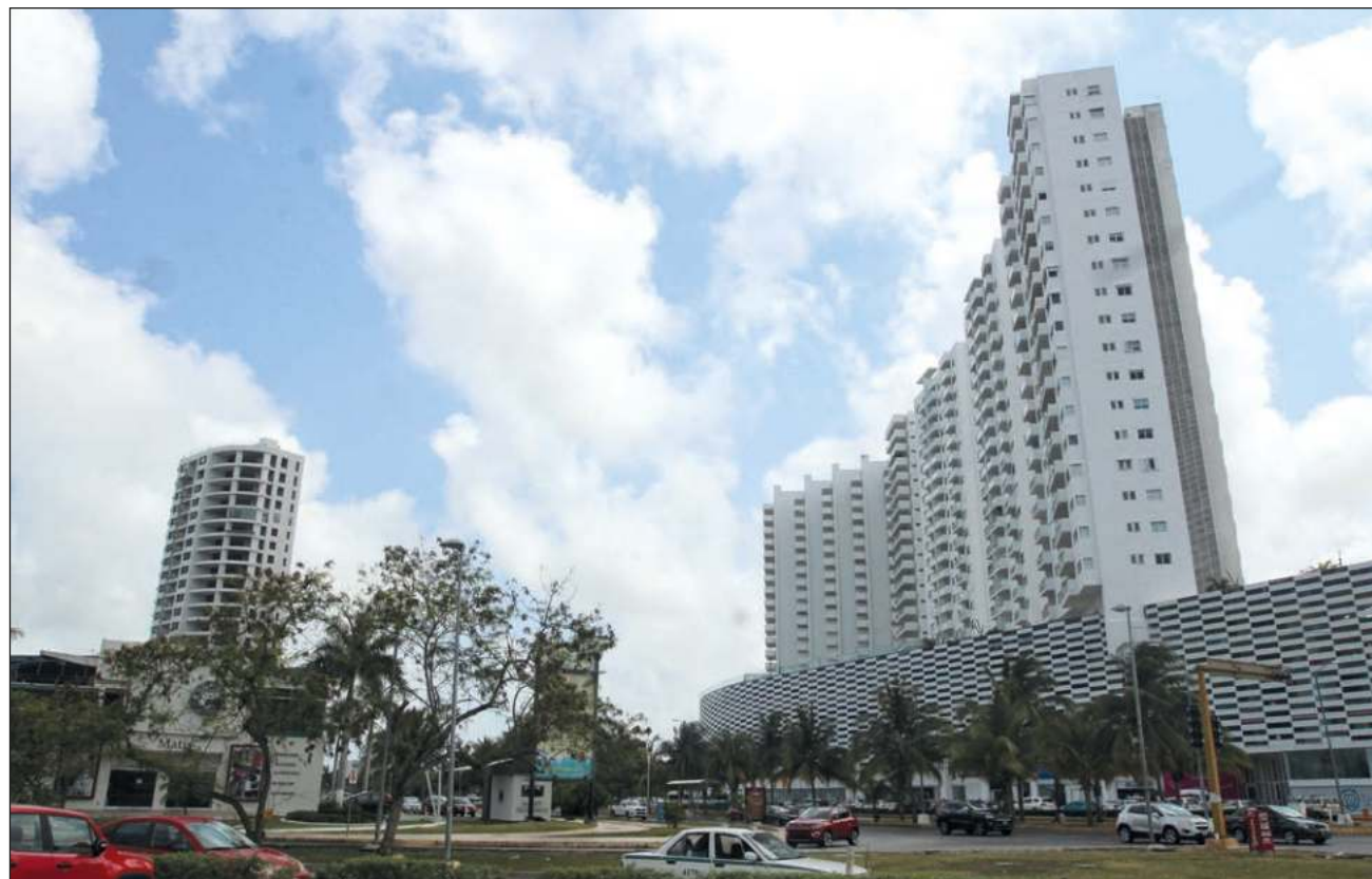
▲ La Haus anunció en enero pasado el cierre de la primera venta de un departamento con bitcoin; la propiedad es un departamento en Palais Tulum, desarrollo de la constructora Rivieralty, al 80% de su construcción, localizado en una de las zonas con mayor plusvalía de Tulum.

“Nuestro objetivo es facilitar la compra de vivienda con tecnología y datos, permitiendo a los usuarios realizar