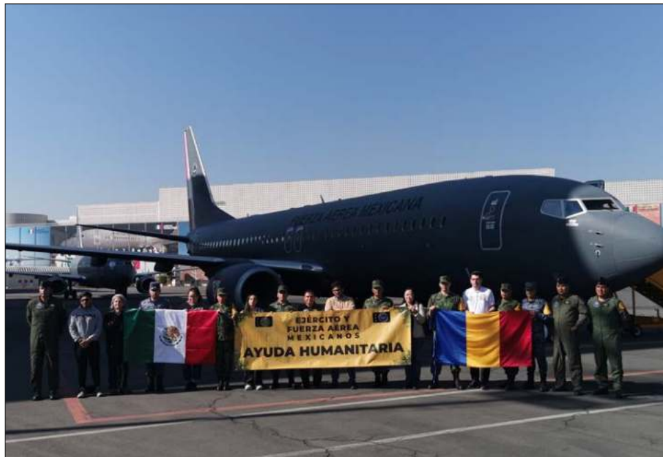
▲ En Rumania hay 22 personas de origen mexicano, incluyendo dos bebés de brazos, preparados para regresar al país, tras haber abandonado Ucrania.

Se trata de quienes respondieron de inmediato a la convocatoria que hizo la embajada desde el 14 de febrero para salir de Ucrania.