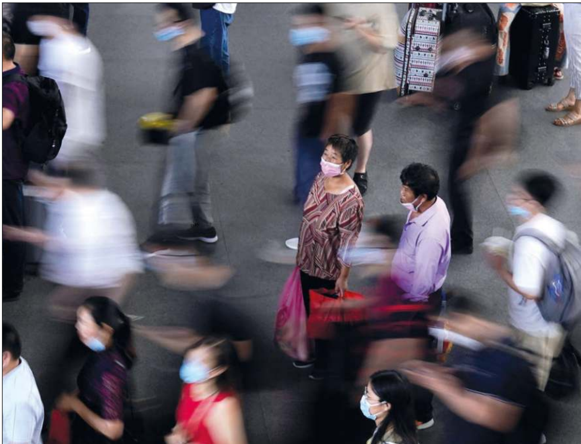
▲ Tu k'iinil 27 ti' febrero ti' u ja'abil 2020 leti'e' ka jts'a'ab k'ajóoltbil yanchaj u yáax máakil tsa'ay ti' Covid-19 tu noj lu'umil México. Juntúul máak ts'o'ok u chan xuultal, máax yanchaj u yoksa'al Instituto Nacional de Enfermedades