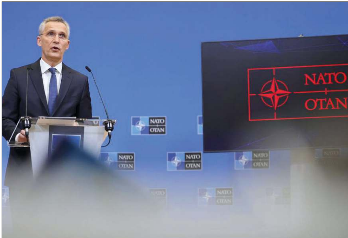
▲ Hay otras guerras, olvidadas por los medios occidentales y sus agoreros en las redes.

El problema es que la Unión Europea, constituida con la premisa de acabar con las guerras que han devastado al suelo europeo desde que se tenga memoria, cedió el lugar a los objetivos de la OTAN (Organización del Tratado del Atlántico Norte). Hablamos de una organización militar comandada por los Estados Unidos, que no ha cesado de expandirse hacia las fronteras de Rusia desde que Mijail Gorbachev, ilusamente creyera en las mentiras en Ronald Reagan y los gobiernos occidentales, de que la OTAN, no se expandiría hacia el Este.