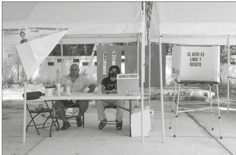
▲ INE supera las 50 mil visitas a personas sorteadas para funcionarios de casilla, lo que representa el 39.45% del total de ciudadanos insaculados.