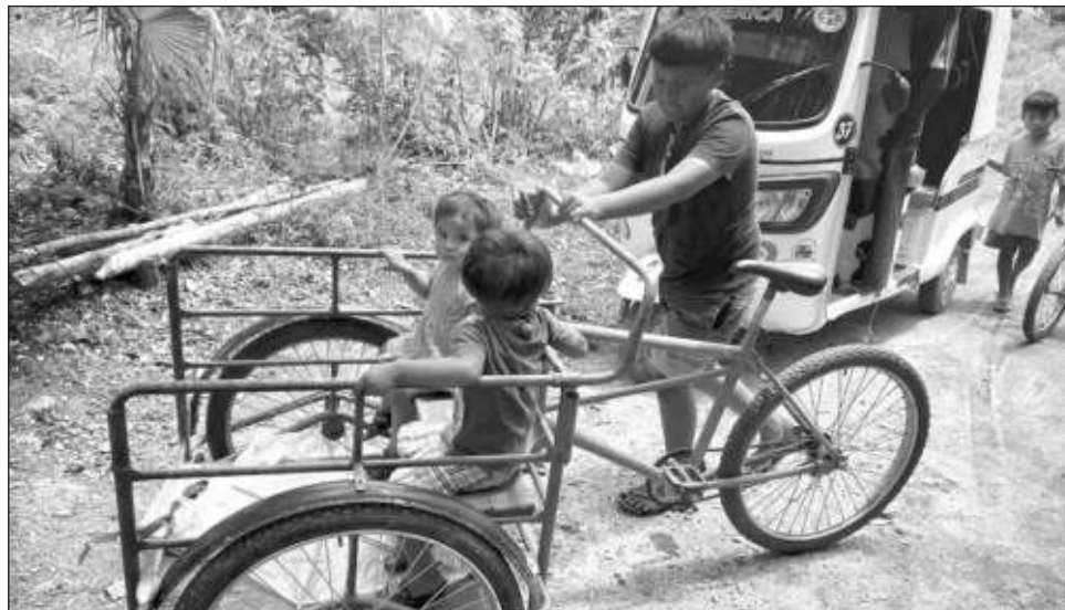
▲ Preservar la cultura significa también el fomento de la lengua, pero el gobierno no había estado enfocado en eso, indicó el encargado de Asuntos Indígenas de la Secretaría del Bienestar e Inclusión de Campeche.

Reconoció que el estado cuenta con una gama de 330 comunidades indígenas y en apenas 50 de estas hay escuelas bilingües cultura-