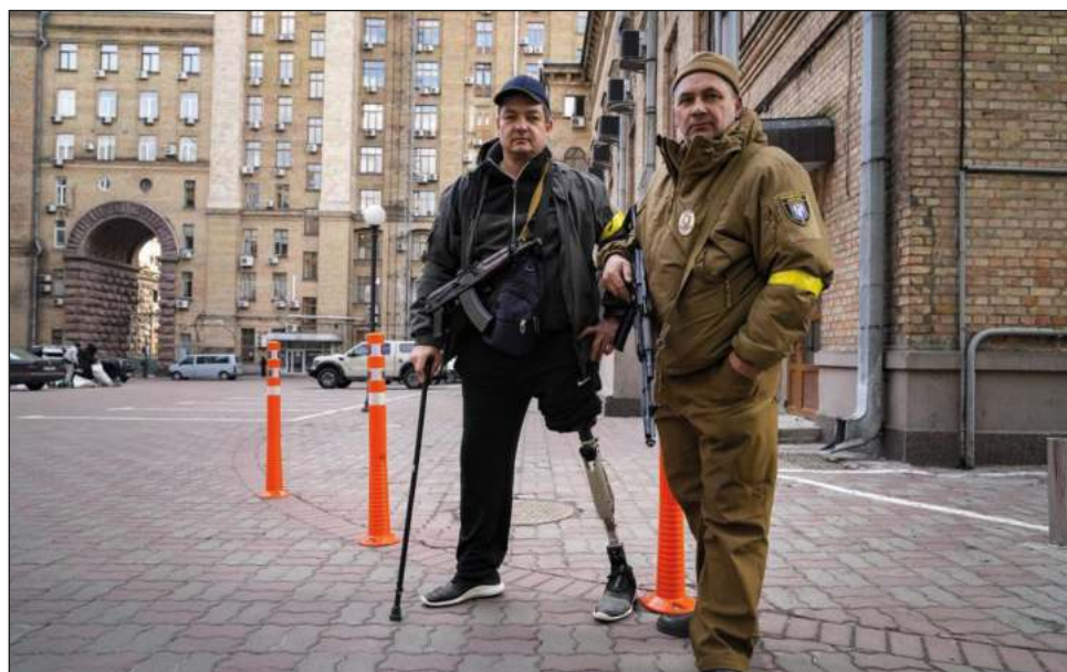
▲ El ayuntamiento de Kiev anunció un estricto toque de queda el sábado hasta el lunes. No están abiertas ni tiendas ni gasolineras; en teoría, nadie puede salir de casa o serían tomados como enemigos.

Un hombre explica que salió para comprar pan, pero que no encontró. “Que no le volvamos a ver en la calle”, dice un policía que patrulla un poco más lejos.