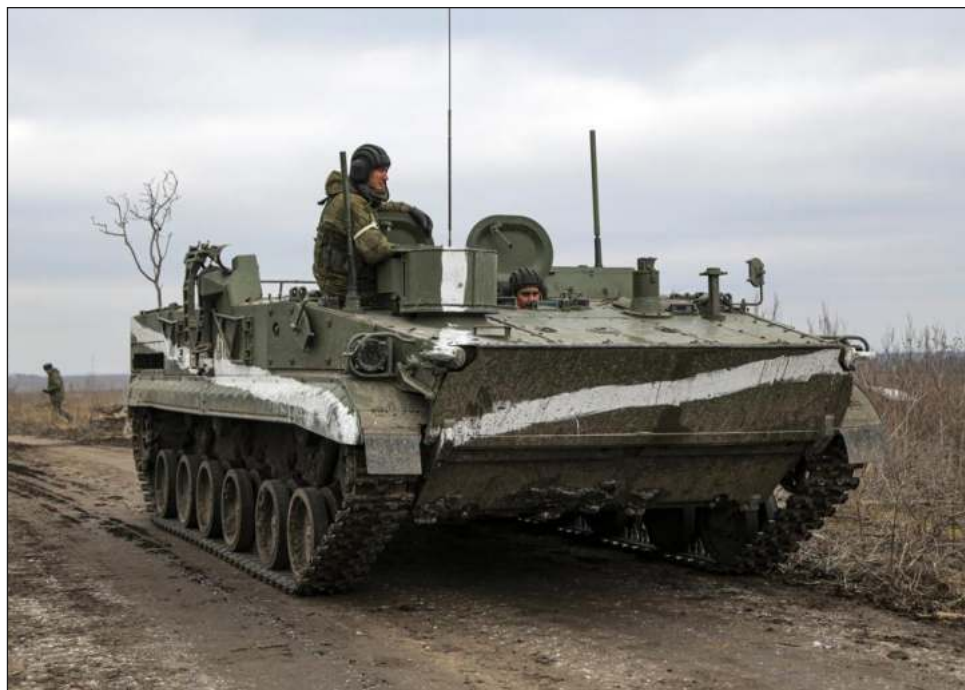
▲ Hasta el domingo, las tropas rusas habían permanecido a las afueras de Járkiv, una ciudad de 1.4 millones de habitantes ubicada a 20 kilómetros al sur de la frontera con Rusia.

El despacho del presidente ucraniano Volodymyr Zelenskyy informó