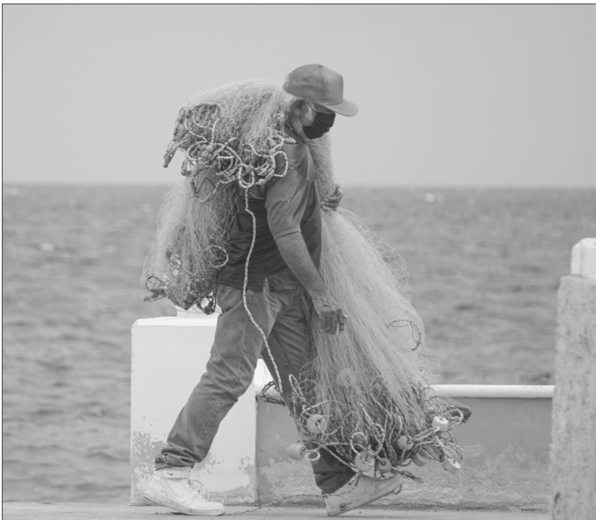
▲ Para el estado de Yucatán la pesca representa una actividad económica y social importante.

ES ASÍ QUE LOS análisis desde el concepto de los capitales, nos ayuda a conocer las condiciones de vulnerabilidad de una localidad, así como identificar las acciones que se proponen para disminuir las situaciones que hacen vulnerables a las y los pobladores y trabajadores de las zonas costeras, sin embargo, estas acciones deberían ser incluyentes, plurales y con reconocimiento de las necesidades de las personas que habitan estas comunidades para así comenzar a forjar procesos de gobernanza. Síguenos en: http://orga.enesmerida.unam.mx/ ; https://www.facebook.com/ORGACovid19/ ; https://www.instagram.com/orgacovid19 y https://twitter.com/ORG_COVID19/ .