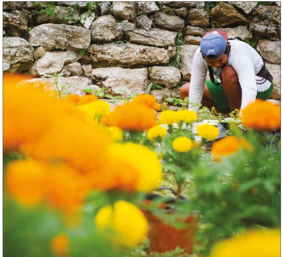
▲ Cuidar un jardín es como meditar, nos propone Byung-Chul Han en su libro, donde relata en forma de ensayo y de diario, la experiencia con su jardín que florece en invierno en la ciudad de Berlín.