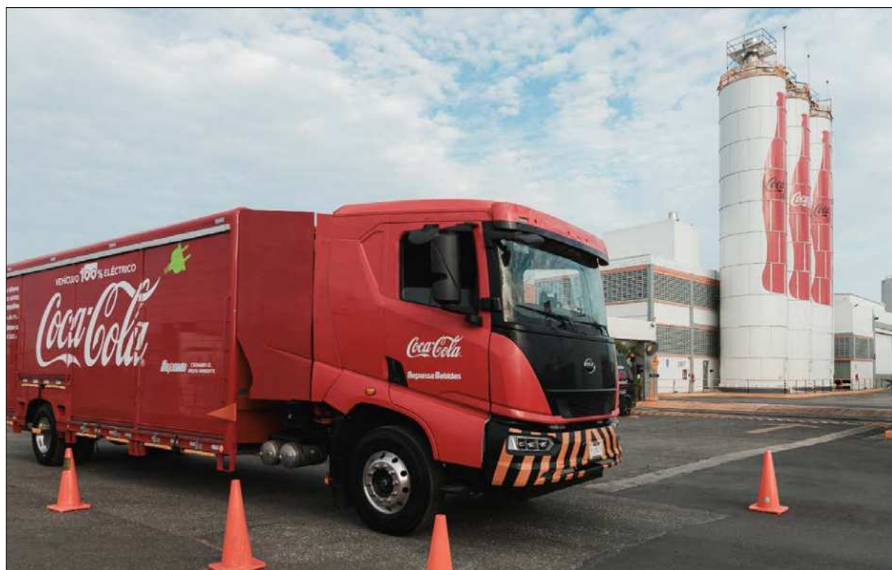
▲ La compañía ha incorporado en su flota de distribución en la Península de Yucatán unidades eléctricas que forman parte de un proyecto regional diseñado para fortalecer la eficiencia logística, reducir emisiones y avanzar en un desarrollo sostenible.

Bepensa es un grupo empresarial mexicano, conformado por más de 40 compañías agrupadas en cinco unidades de negocios: Bepensa Bebidas, Bepensa Motriz, Bepensa Industrial, Bepensa Capital y Bepensa Spirits. Juntas, brindan empleo y bienestar a más de 14,000 personas en México, República Dominicana y Estados Unidos. Sus decenas de marcas, muchas de ellas líderes globales en sus categorías, buscan satisfacer las necesidades de sus más de 350 mil clientes registrados y millones de consumidores en esos tres países.