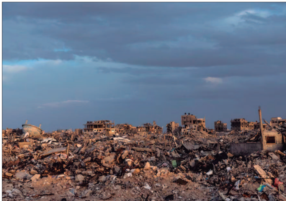
▲ "Donald Trump se coronó Emperador y nuevo gobernante de la Franja de Gaza, rodeado por sus cinco lacayos".

En el marco del Foro Económico de Davos, el 22 de enero de 2026 el presidente Donald Trump convocó a la firma del lanzamiento de la Junta de la Paz y ahí anunció eufórico: El Estatuto ha entrado en vigor y la Junta de Paz ya es una organización internacional oficial. Está funcionando maravillosamente, casi todos los