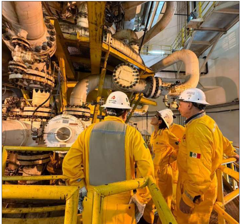
▲ El recorrido se realizó en medio de las acciones puestas en marcha por la CFE para monitorear la evolución de las bajas temperaturas, que podrían poner en riesgo el suministro de gas natural.

Cabe destacar que la zona cuenta con la infraestructura para detonar su potencial en la producción de gas natural, apoyados en el Centro de Procesos y Transporte de Gas Atasta.