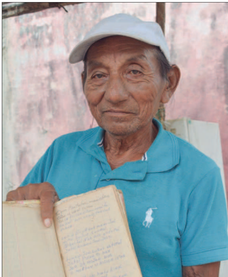
▲ "Los maestros cantores son varones longevos que se dedican a orar por las almas de las personas, en acción de gracias o solicitando el favor de algún santo o deidad utilizando un sistema transmitido de generación en generación".

En sus crónicas sobre la llamada Guerra de Castas de 1847, el historiador Nelson Reed señala el importante papel del k'aayom en los pueblos mayas antes y durante la Guerra: "El macehual oraba de modo muy parecido al de los demás católicos (...) en su adoración lo dirigía el maestro cantor, lego indígena que se había aprendido de memoria, mecánicamente, un montón de oraciones necesarias en español y latín y era capaz de recitarlas durante más de una hora sin repasárselas... Y