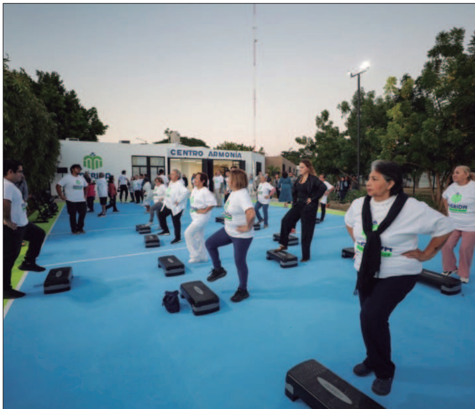
▲ La obra beneficiará directamente a 500 personas adultas mayores que asisten al Centro en el fraccionamiento del Parque, así como a habitantes de colonias aledañas.

La munícipe reiteró que el bienestar de las personas adultas mayores es una prioridad para el Ayuntamiento de Mérida, reconociendo el legado de quienes durante años cuidaron a sus familias y construyeron la ciudad que hoy disfrutan las nuevas generaciones, en una Mérida que se desarrolla con un estilo propio y que “cuida a quienes nos cuidaron”, afirmó.