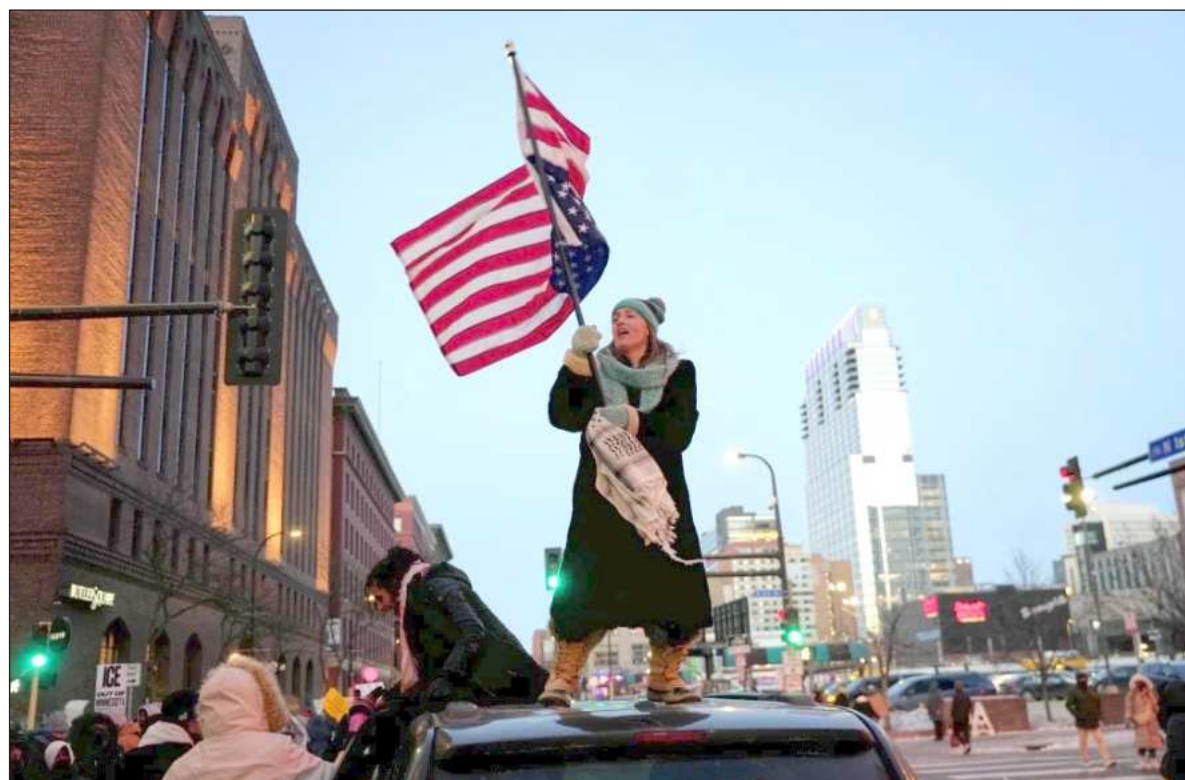
▲ “¿Se ciñen estos manifestantes a regímenes ya caducos de verdad o apuestan todos ellos por un futuro que, a falta de otro vocablo, bien podríamos denominar como la pos-posverdad?”.

ALGUNA VEZ EL escritor noruego Karl Ove Knausgaard aseguró que, en un mundo dominado por la ficción, poco valor podría tener la ficción literaria. Josefina Ludmer, la teórica argentina, adujo que, en un contexto que fusionaba la realidad y la ficción en algo que llamaba aptamente la realidadficción, el valor de una obra radicaba en su capacidad de producir presente. Inquietudes de este tipo impulsaron y legitimaron en las últimas décadas el creciente predominio de distintas formas de la no ficción –desde el ensayo hasta el reportaje creativo, desde la crónica hasta la autoficción– a las que unía un aducido acceso singular y poderoso a los hechos todavía conocidos como reales. ¿Pueden los escritores de no ficción salir indemnes del petulante ataque que lanza la cabeza del imperio contra el triángulo que