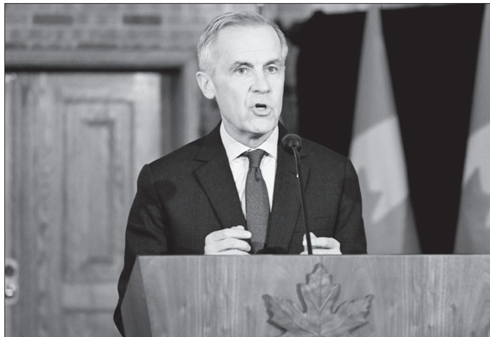
▲ El premier canadiense sostuvo una llamada con Trump en la que compartió "lo que estamos haciendo: 12 nuevos acuerdos, cuatro continentes, en seis meses".

"Para ser absolutamente claro, y así se lo dije al presidente, lo que dije en Davos lo dije en serio", comentó Carney a los periodistas al llegar a una reunión de gabinete en Ottawa, la capital.