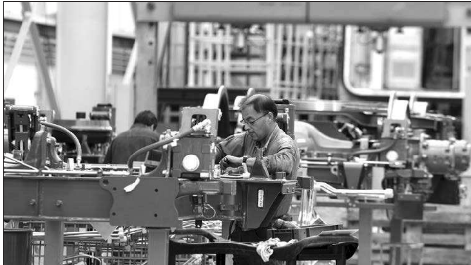
▲ El índice del IMCO colocó a la región Noreste en la primera posición, con una competitividad alta, mientras que la Maya quedó en penúltimo lugar con 34.1%.

Evalúa, a través de 40 variables agrupadas en 4 subíndices a seis regiones: Noroeste: Baja California, Baja California Sur, Chihuahua, Durango, Sinaloa, Sonora y Zacatecas; Noreste: Coahuila, Nuevo León, San Luis Potosí y Tamaulipas; Bajío: Aguascalientes, Colima, Guanajuato, Jalisco, Michoacán, Nayarit y Que-