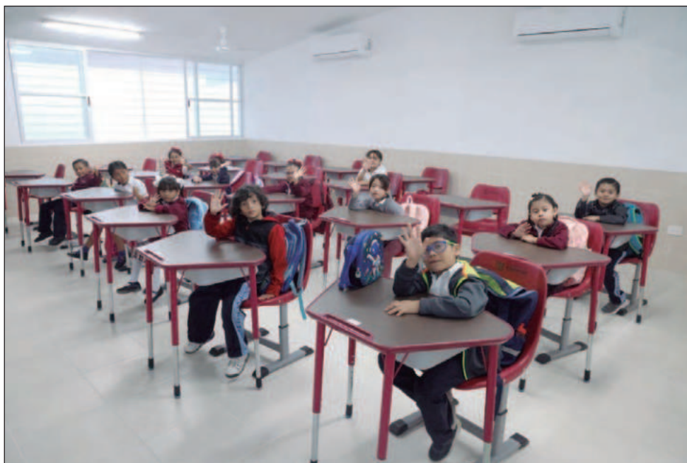
▲ La Secretaría de Educación agradeció la comprensión y colaboración de toda la comunidad educativa y exhortó a seguir atentos a los comunicados oficiales.

“Cuidar la salud y el bienestar de toda la comunidad educativa es responsabilidad de todos”, resaltó en su boletín.