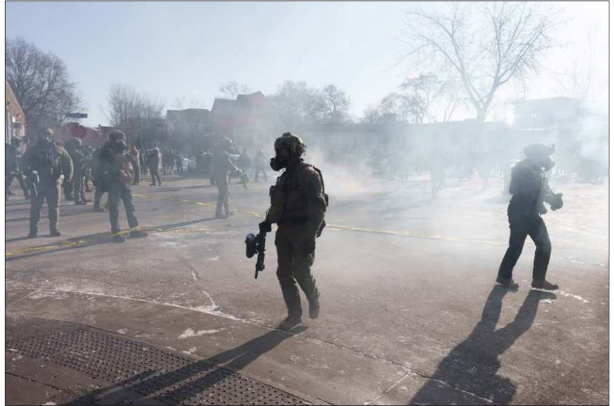
▲ "Para la Casa Blanca, México es hoy un punto de apoyo o un enemigo declarado, no hay matices".

ESTA VISIÓN SE materializa en la agencia ICE (Servicio de Inmigración y Control de Aduanas). Creada hace 23 años (en 2003) como fuerza post-9/11, hoy cuenta con un presupuesto que supera los 9 mil millones de dólares anuales. Lo que nació como una herramienta de seguridad se