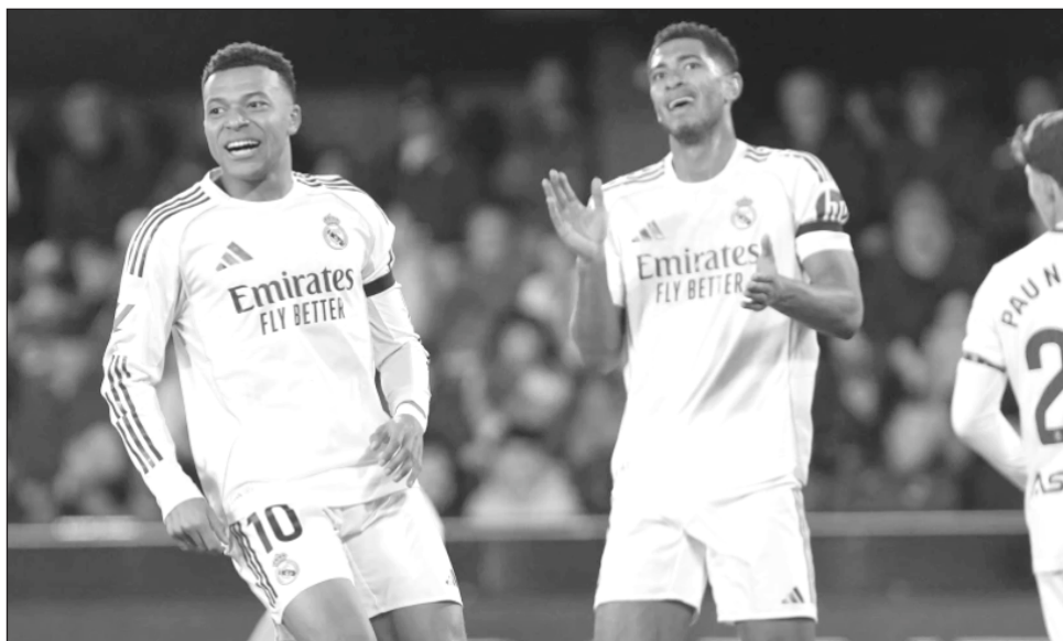
▲ El Real Madrid de Mbappé (izquierda) y Bellingham va por su boleto a octavos de final.

El PSG recibirá a Newcastle (14 horas). El gigante