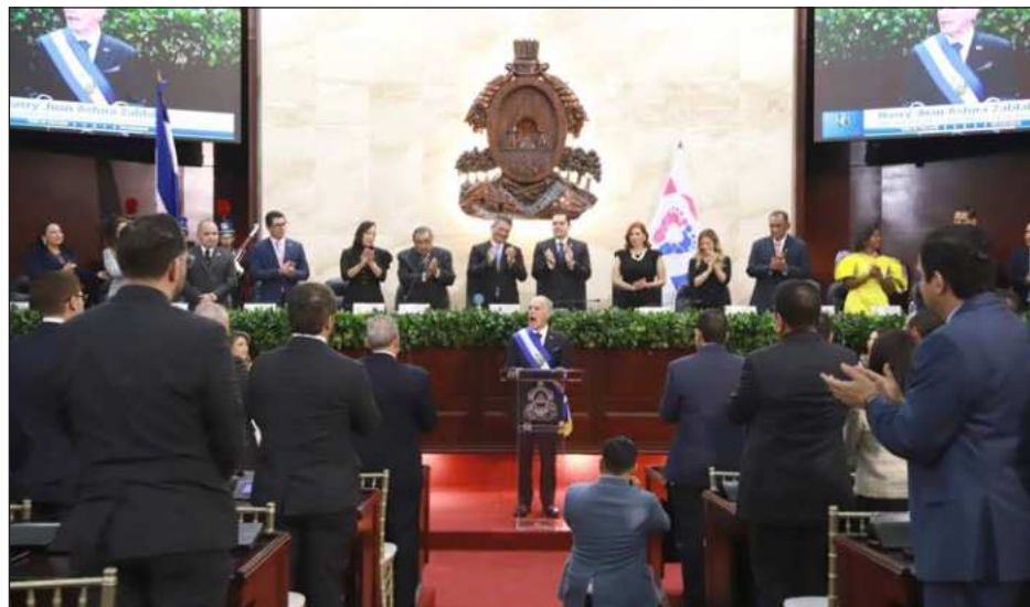
▲ Asfura, de 67 años, asume el poder con una agenda ligada al presidente estadounidense y con marcados retos para impulsar la economía de Honduras, uno de los países más empobrecidos.

Gobernará el país centroamericano hasta enero de 2030 bajo la promesa de combatir la pobreza, que afecta a seis de cada 10 hondureños, la corrupción,