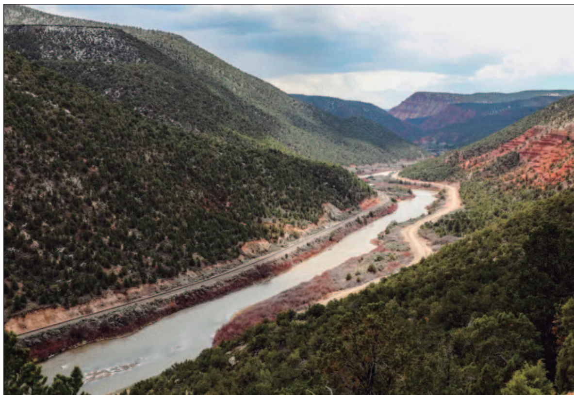
▲ “Habría que pensar en una política hídrica más glocal , que reconociendo el carácter global de los ciclos del agua y su relación con el clima, promoviera la restauración y manejo de las cuencas a nivel local”.