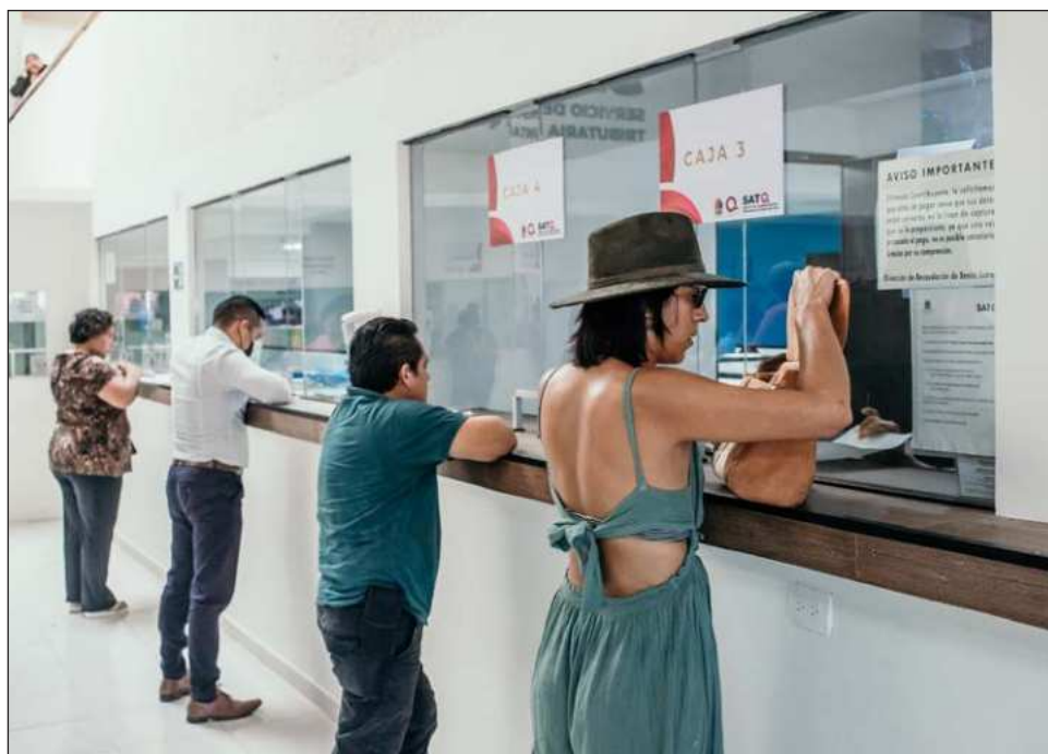
▲ Arranque de año trae una intensa carga administrativa para contribuyentes.

Sobre el ánimo general entre contribuyentes al inicio del año, reconoció que existe cierta tensión derivada de los incrementos fiscales y de la presión por cumplir con todos los requisitos en tiempo y forma. Sin embargo, enfatizó que el cumplimiento oportuno evita sanciones y multas posteriores.