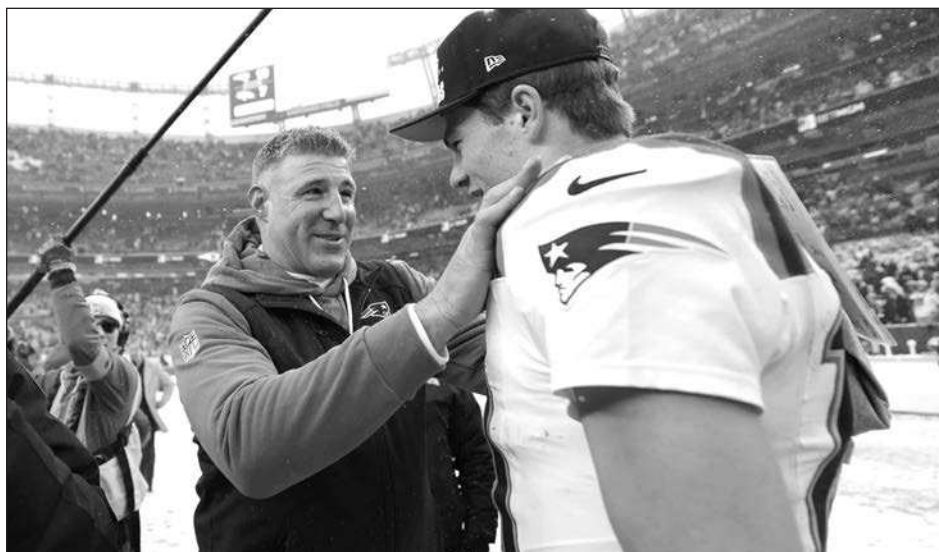
▲ Mike Vrabel y Drake Maye, entrenador y quarterback de los Patriots, tras la final de la Conferencia Americana. Vrabel ya fue campeón del Súper Tazón como jugador de Nueva Inglaterra.

El siguiente paso es un viaje a Santa Clara, Cali-