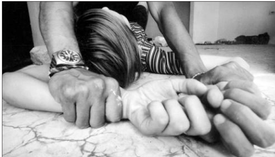
▲ Trinidad y Tobago y Granada ocupan los primeros dos lugares en abuso a niñas.

También subraya que los adolescentes migrantes —sobre todo, niñas sin acompañante adulto— tienen un alto riesgo de padecer agresión sexual y trata de personas