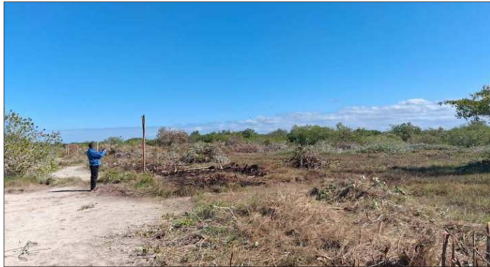
▲ Las actividades detectadas se realizaron sin contar con las autorizaciones ambientales emitidas por la Semarnat, y sin aplicar los criterios y especificaciones establecidos por la autoridad ambiental.

La acción se derivó de una denuncia presentada por la Comisaría Ejidal de Chelem, en la que se reportaron afectaciones a un área de manglar. En atención a esta denuncia, el pasado 20 de enero, personal de la Profepa realizó una visita