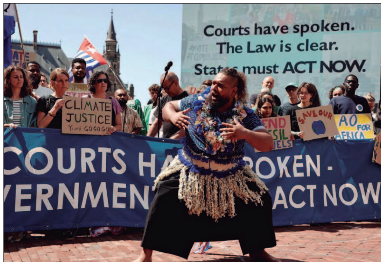
▲ De acuerdo con la organización Greenpeace, los habitantes de Bonaire no reciben el mismo nivel de protección climática que la población del territorio europeo de Países Bajos, a pesar de que la isla es especialmente vulnerable a la subida del nivel del mar, el calor extremo, las lluvias intensas y el deterioro acelerado de los arrecifes de coral.

"Sería una victoria histórica si el tribunal obliga al Estado a adoptar medidas concretas que protejan a las personas frente al clima extremo y otras consecuencias de la crisis climática", señaló la directora de Greenpeace