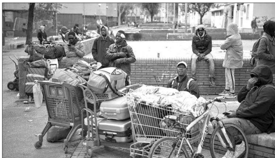
▲ España decidió “no mirar para otro lado”, dijo ministra española de Migración, Elma Saiz. El objetivo del gobierno es “dignificar y reconocer a las personas que ya están en nuestro país”, afirmó.

Los permisos se aplicarán a las personas que llegaron a España antes del 31 de diciembre de 2025 y que puedan demostrar que han vivido en el país durante al