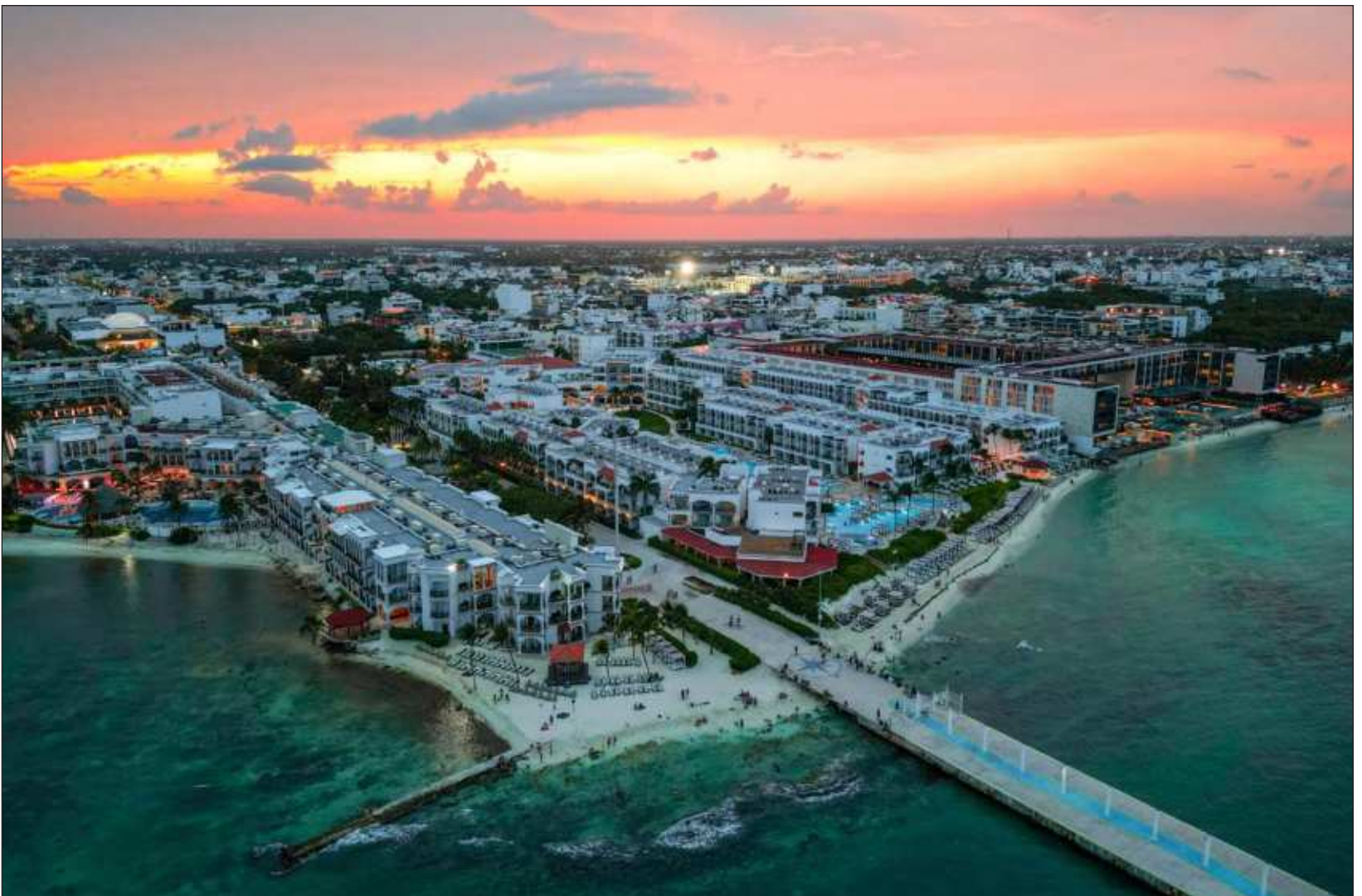
▲ Entre las recomendaciones que detectó el IMCO para que las ciudades mejoren su competitividad está la seguridad, donde destaca que las ciudades más seguras son Mérida, Saltillo y La Laguna, mientras que las menos seguras son Tijuana, Cancún y Cuernavaca.

Otro aspecto fue la innovación ya que las urbes pueden ser semilleros para la creatividad y la generación de ideas que impulsen desarrollo y crecimiento personal y social.