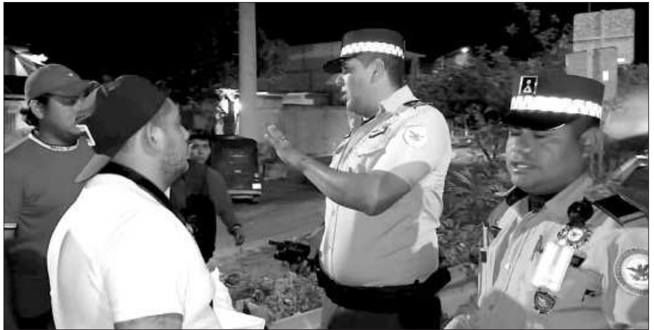
▲ Los aspirantes a la Comisaría Municipal piden a las autoridades estatales y municipales que se repitan las votaciones; argumentan que los hechos violentos se registraron durante el conteo, mismo que no concluyeron, desconociendo lo plasmado en "sábanas electoras".

En las inmediaciones del Hospital General IMSS-Bienestar, familiares de los lesionados durante este proceso, quienes pidieron