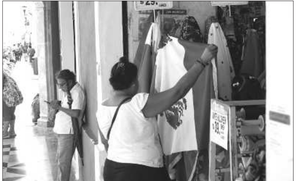
▲ La LXV Legislatura del Estado tiene en claro el objetivo del presupuesto estatal, el cuál aseguró que “va encaminado a cumplir con los derechos de los ciudadanos, así como con el objetivo de mejorar las condiciones de vida del pueblo”: Jiménez Gutiérrez.

De igual manera, Solís Peniche mencionó que es responsabilidad de las cámaras empresariales estar al pendiente de estas acciones,