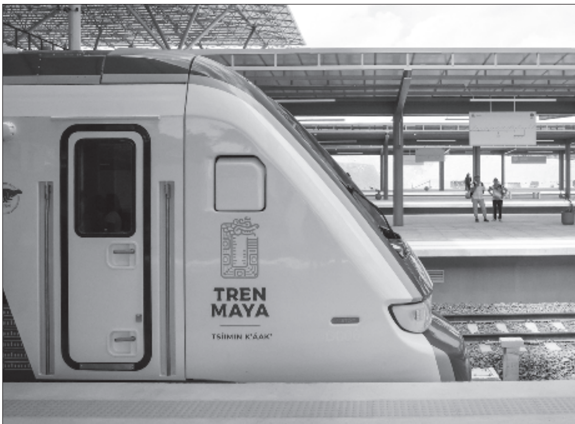
▲ "La construcción del Tren Maya topó con más de 10 mil estructuras inmuebles, relativamente íntegros, más de un millón 400 mil fragmentos de cerámica, alrededor de mil piezas completas de vasijas, platos y metates, objetos que nos dan información de la historia maya, de México".