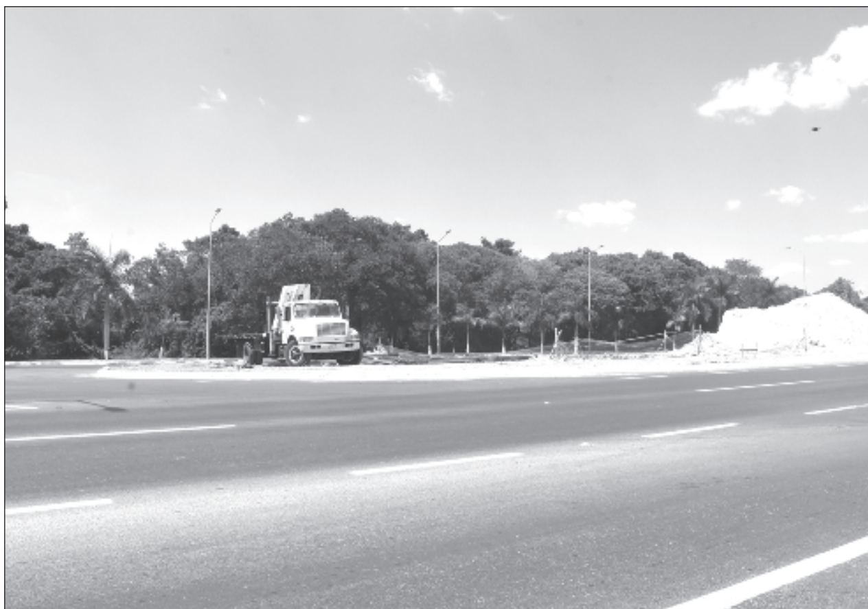
▲ De acuerdo con la Secretaría de Infraestructura se tienen proyecciones de lineamientos en Champotón, Escárcega y Carmen, así como la ampliación de carreteras como la 180, donde hay tramos que son de dos carriles.

Destacó también, como ya había señalado a La Jornada Maya a finales del año pasado, que para la reparación y atención a la carretera 186 Escárcega-Xpujil ya se había presupuestado la intervención y rondaba los 2 mil millones de pesos, situación que quedó en el cajón de propuestas debido a la reserva de recursos por la Secretaría de Hacienda.