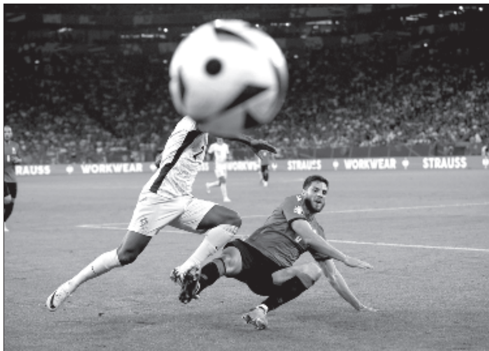
▲ La selección georgiana necesitaba del triunfo para instalarse en la fase de eliminación directa de la Euro, y consiguió su primer gol apenas a los 93 segundos.

La selección georgiana necesitaba del triunfo para instalarse en la fase de eliminación directa de la Euro, y consiguió su primer gol apenas a los 93 segundos.