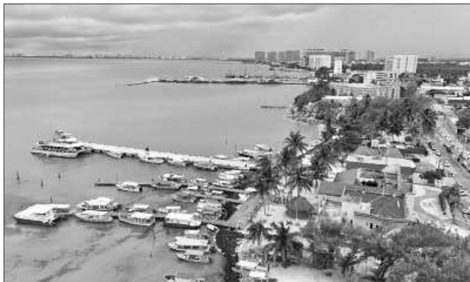
▲ El Travel Mart se llevará a cabo en el hotel Iberostar Selection de Cancún, del 23 al 25 de octubre, comprometidos con acelerar la acción en la lucha contra el cambio climático.

"La retribución será para los arrecifes, para la reforestación de los arrecifes. Se calcula todo lo generado y la retribución es para que se puedan reforestar los