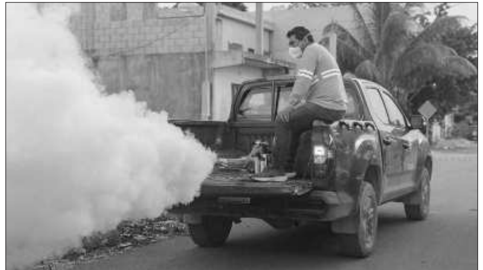
▲ La dirección de Salud ya atendió a las comunidades de Macario Gómez, Punta Allen y La Antorcha, la colonia 2 de Octubre y Chemuyil, entre otros puntos.

“Debemos eliminar charcos, eliminar contenedores de agua que podrían ser criaderos de vector. Hemos encontrado mucha basura y eso debemos evitar. En Punta Allen se atendió por completo, se otorgó abate, pastillas de cloro, se