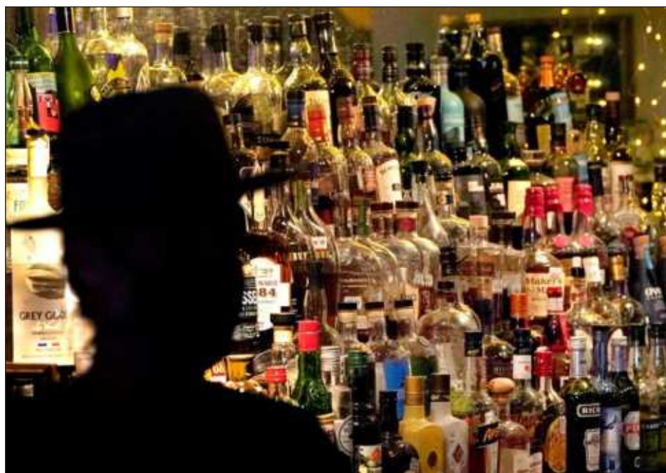
▲ De acuerdo con la OMS, del total de muertes atribuibles al alcohol en 2019, 474 mil se debieron a enfermedades cardiovasculares y 401 mil a distintos tipos de cáncer.

Los encuestados que declararon consumir alcohol reportaron un consumo de 27 gramos diarios, en promedio, lo que equivale a dos vasos de vino. Un 38 por ciento de los bebedores declararon que en el último mes consumieron alcohol en grandes cantidades en una o dos ocasiones.