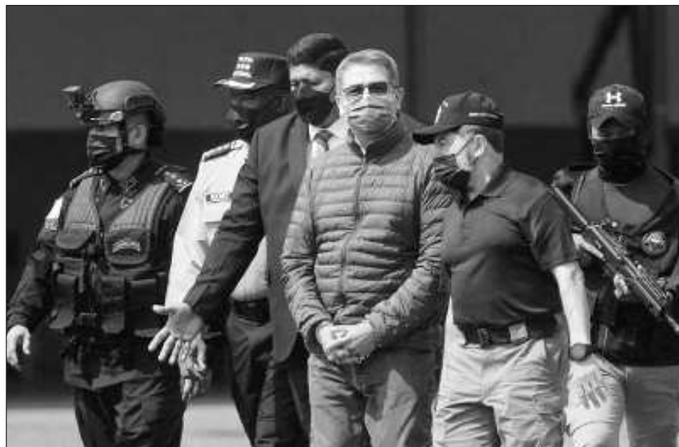
▲ Juan Orlando Hernández fue detenido en su casa de Tegucigalpa, tres meses después de dejar el cargo en 2022, y fue extraditado a Estados Unidos en abril de ese año.

El ex mandatario enfrentaba una sentencia obligatoria mínima de 40 años y hasta cadena perpetua tras ser declarado culpable de conspirar para importar cocaína a Estados