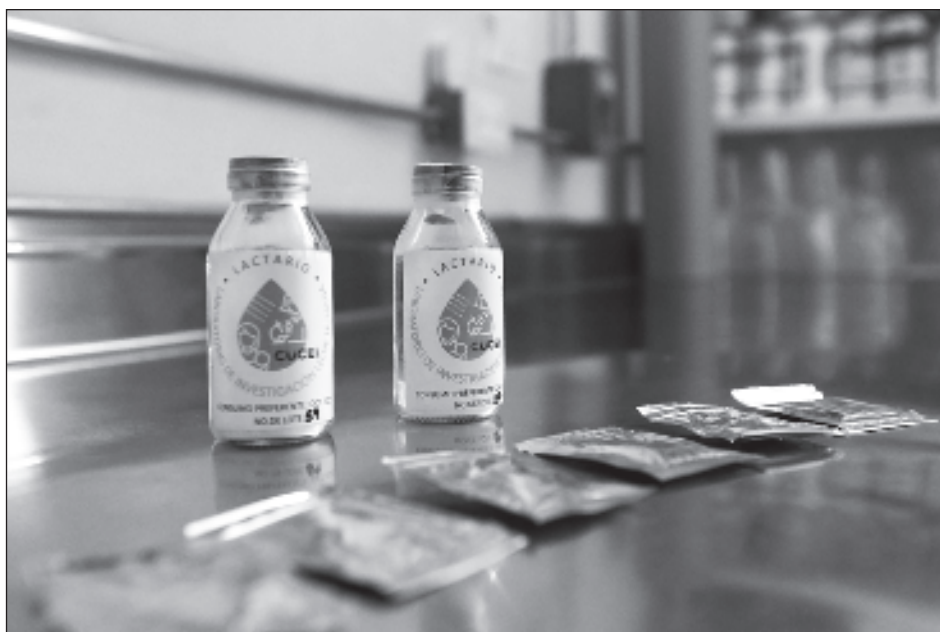
▲ Una vez que la leche es almacenada puede conservarse a temperatura ambiente por dos años sin perder nutrientes.