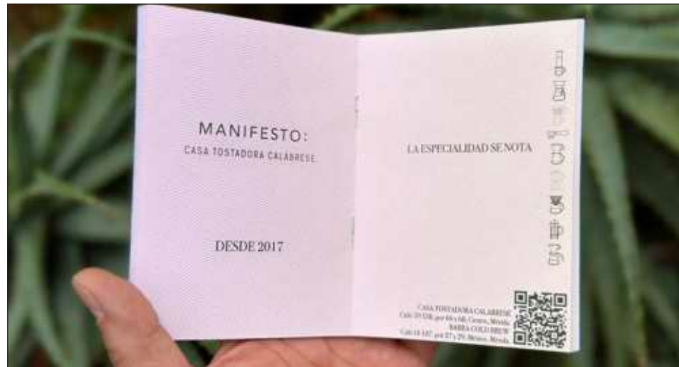
▲ Alrededor de 18 barras de Yucatán participan en el proyecto; el Pasaporte del Café de Especialidad tiene un costo de 150 pesos y una vigencia de un año.

Aunque Historias de Malta comenzó como un libro sobre