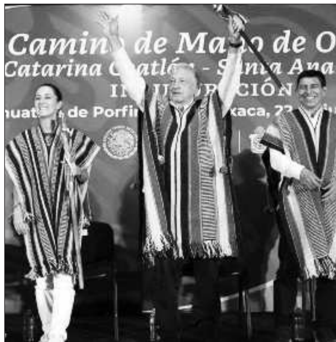
▲ El recorrido anunciado es de los pocos registrados en el cual los presidentes saliente y entrante comparten.

Claudia Sheinbaum ya ha dado muestras de que conoce lo que sucede en los tres estados peninsulares, particularmente