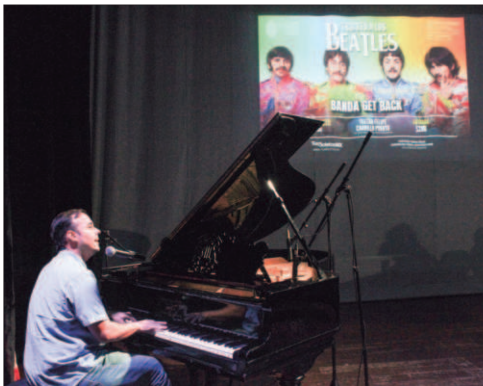
▲ El regreso de Get Back al Teatro Universitario Felipe Carrillo Puerto inaugura un nuevo enfoque en el área de Vinculación y Cultura de la UADY.

Este concierto se hará en un formato íntimo, con la luz baja para generar una atmósfera cálida. Se hará un recorrido por los inicios de la banda, con canciones como Love Me Do , She Loves You o I Wanna Hold Your Hand . Posteriormente, viene la parte de la psicodelia, con canciones de Sgt. Pepper's , Revolver y el álbum Blanco . La tercera parte concluye con los álbumes Abbey Road y Let It Be .