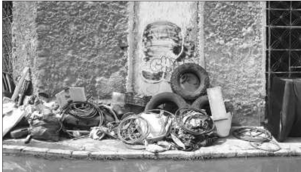
▲ El ayuntamiento recordó que la campaña de descacharrización es exclusivamente para recoger objetos inservibles que acumulan agua y pueden convertirse en criaderos de mosquitos.

Durante un sondeo realizado por La Jornada Maya , di-