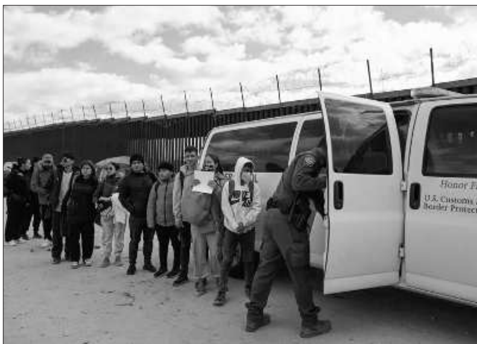
▲ De acuerdo con el comunicado emitido por el Departamento de Seguridad Interior estadounidense, "el promedio de interceptaciones en siete días de la patrulla fronteriza ha disminuido más del 40 por ciento a menos de 2 mil 400".

Tras las medidas de restricción de asilo, han expulsado a más de 24 mil personas