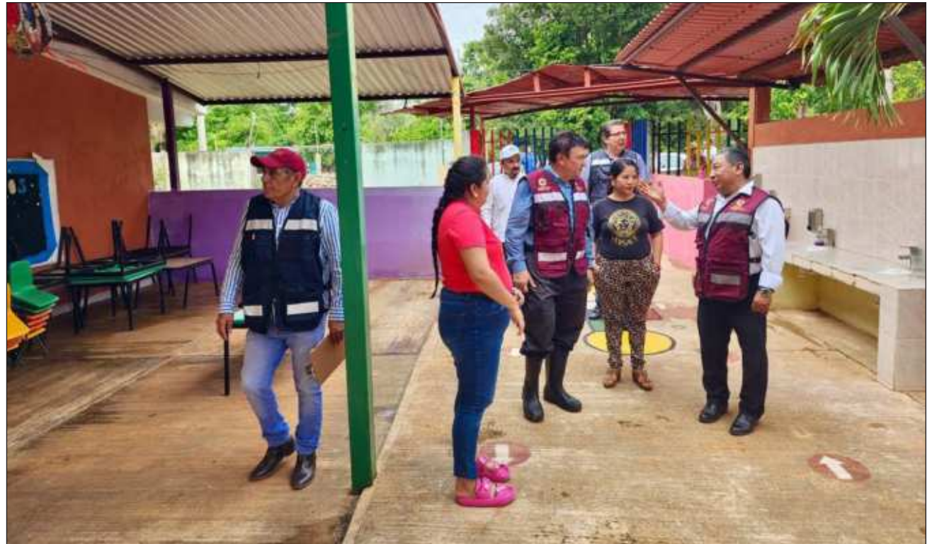
▲ Tras un recorrido al interior de la primaria, el personal de la Secretaría de Educación del estado realizó un levantamiento de las afectaciones a la infraestructura debido a las lluvias, así como los daños al material educativo.

Acompañado de docentes, directivos y padres de familia, el titular de la Seduc indicó que esta escuela recibirá mobiliario educativo y material escolar, así como la inversión necesaria para la reparación de la infraestructura y el sistema eléctrico para que las y los estudian-