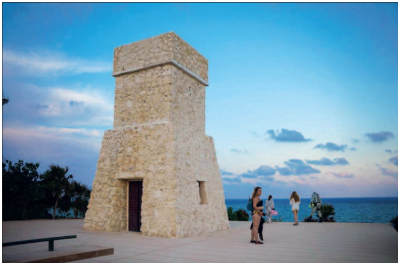
▲ Desde el pasado 17 de febrero de 2023 la Conanp comenzó a cobrar 58 pesos -ahora 61 pesos- al público para entrar al recinto, por el uso, gozo o disfrute de de las ANP del país, tanto terrestres, marinas o insulares.

Entrevistada en el marco del arribo del primer vuelo de Copa Airlines al Aeropuerto Internacional de