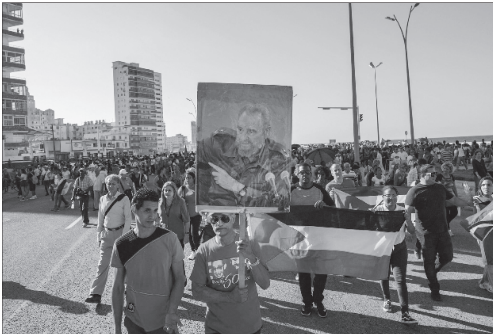
▲ “El apoyo a Palestina es indispensable para ejercer presión contra Israel, para despertar a otras naciones y otros sectores de la población mundial que aún no se suman a las movilizaciones, protestas y acampadas que han dado un aire de dignidad a estos tiempos tan funestos”.