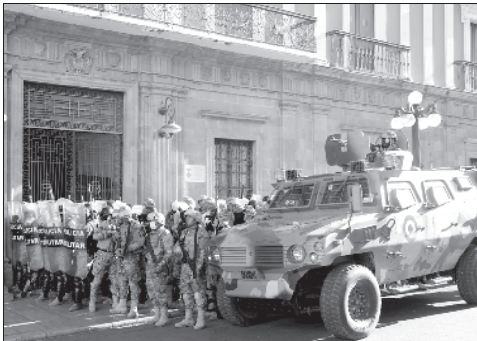
▲ Tras el relevo en el mando militar, los uniformados y los vehículos desplegados frente a la sede gubernamental se retiraron. También lo hizo Zúñiga, quien fue después detenido.

Tras el relevo en el mando militar, los uniformados y los vehículos militares desplegados en la plaza frente a la sede gubernamental se retiraron del lugar. También lo hizo el comandante Zúñiga, quien fue después detenido tras varias horas de tensión en el país.