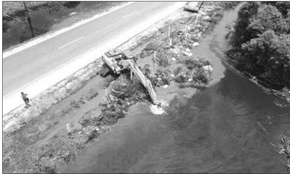
▲ Para llevar a cabo esta operación se utilizan dos máquinas excavadoras, con lo que se ha logrado contrarrestar la inundación en Seybaplaya.

Las intensas lluvias registradas los pasados días del mes en curso generaron un exceso de agua que llenó y comprometió a su máxima capacidad los drenes naturales, provocando el desborde y la inundación de viviendas, parcelas y parte de la autopista Campeche - Champotón, dando como re-