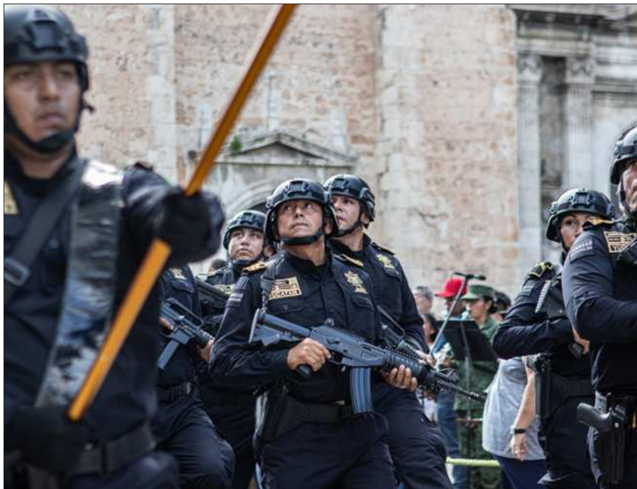
▲ Como el estado más seguro del país, Yucatán tiene 6 mil 663 policías estatales mientras que Quintana Roo, la entidad más insegura en la península, apenas registra 658 elementos, y Campeche tiene mil 513.

Para este recorrido es probable la participación del gobernador de Yucatán, Mauricio Vila Dosal, y el gobernador electo, Huacho Díaz Mena.