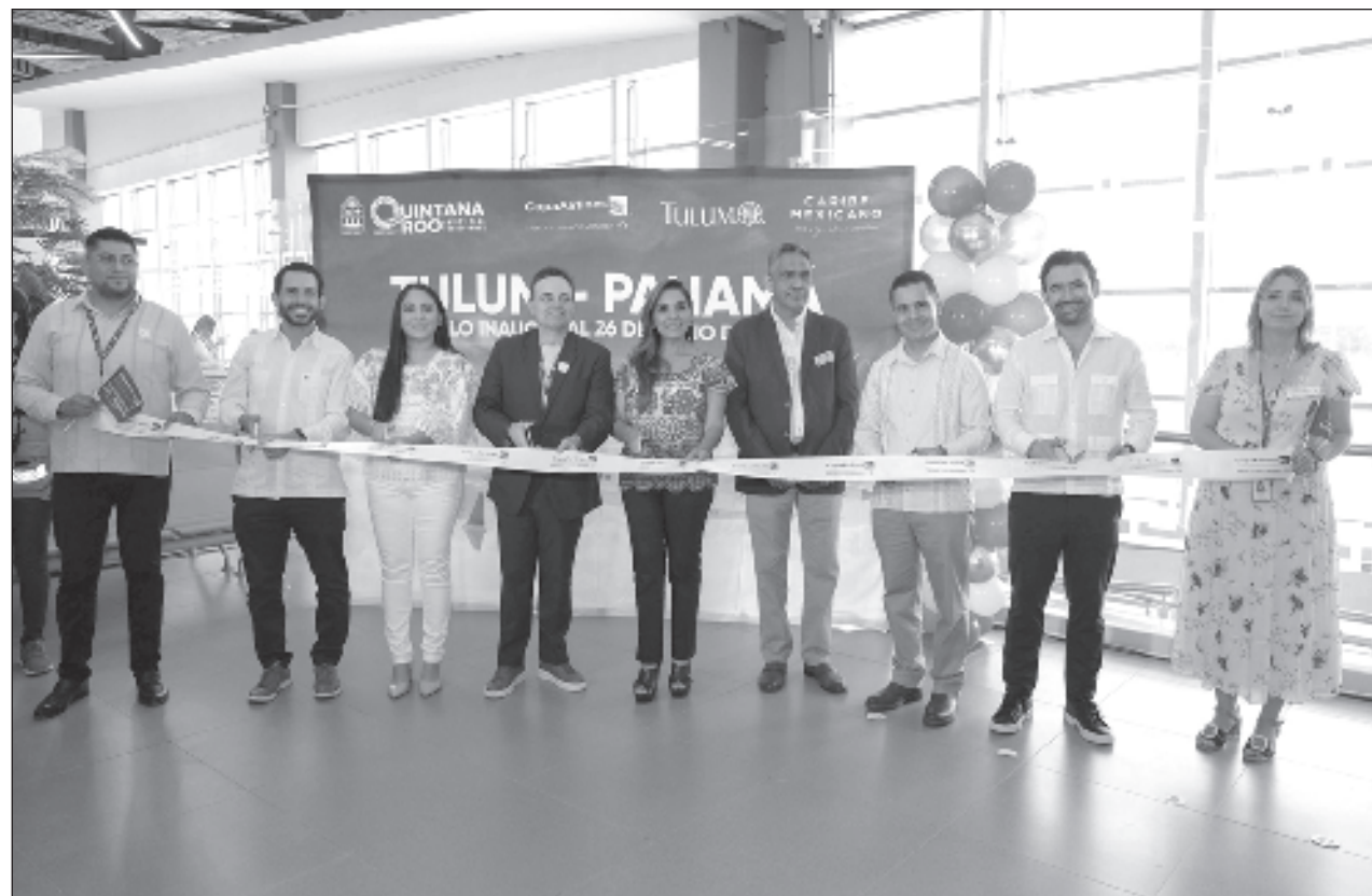
▲ La gobernadora Mara Lezama encabezó la recepción del vuelo en el Aeropuerto Internacional de Tulum, que a seis meses de operación, ya ha superado la cifra de medio millón de pasajeros, rompiendo todos los récords pronosticados.

Actualmente, el Aeropuerto Internacional de Tulum está conectado con nueve rutas a los Estados Unidos, seis nacionales, dos con Canadá y desde hoy, con Panamá. Se espera que en diciembre lo haga con Frankfurt, Alemania. Las aerolíneas que operan en esta terminal aérea son: American Airlines, Delta Airlines, United Airlines, Air Canada, Jet Blue y Copa Airlines. En diciembre se unirá Lufthansa/Discovery. Los vuelos nacionales son operados por Aeroméxico, Volaris, Mexicana y Viva Aerobus.