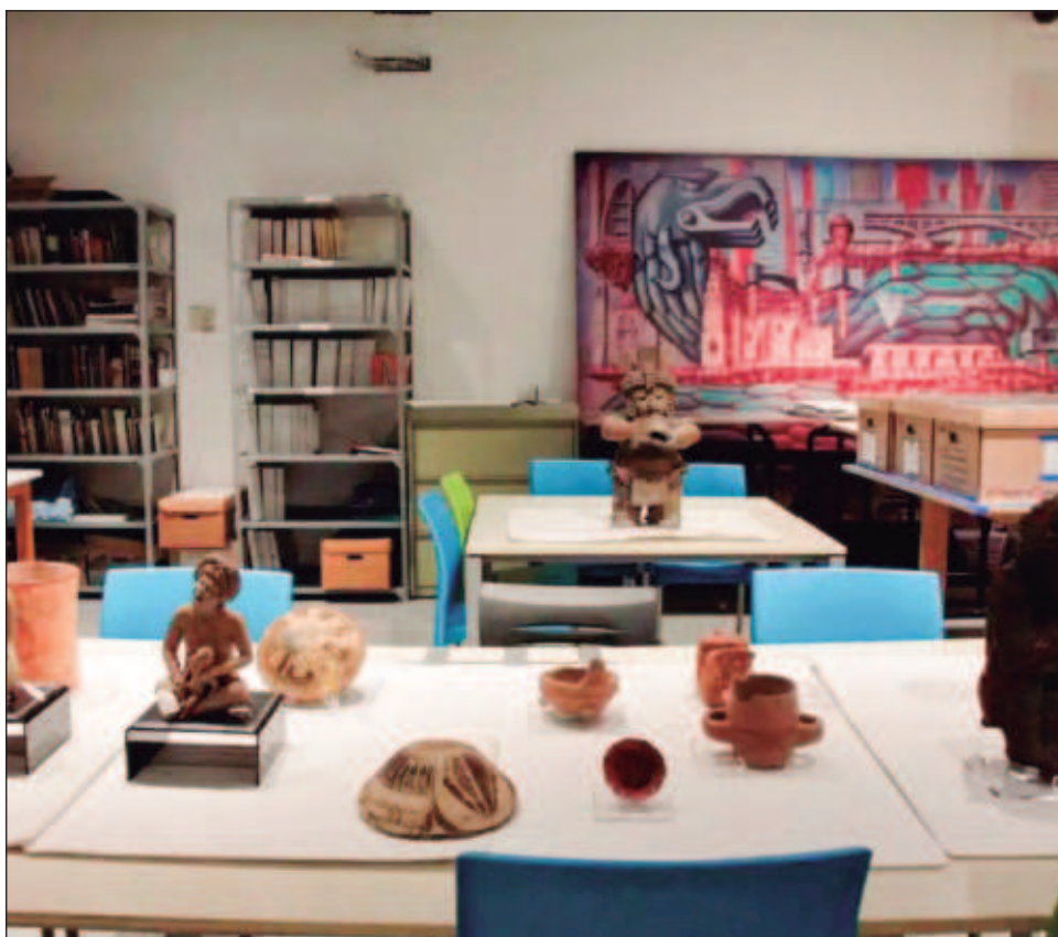
▲ Los trabajos de catalogación de la institución han permitido reconocer vestigios de otras culturas no mesoamericanas, provenientes de sitios de Perú y Chile.