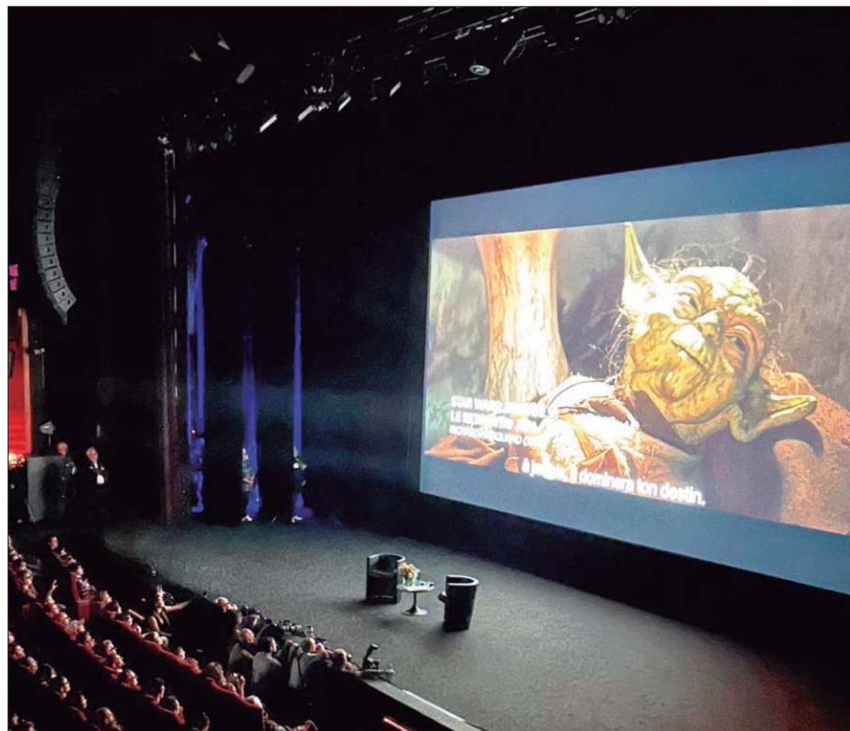
▲ "Mientras se hace la introducción de su entrevista honorífica en el Festival de Cannes, uno puede ver a George Lucas -con un poco de suerte de espectador- oculto tras bambalinas, en la segunda cortina del telón.

Él no pierde tampoco el tiempo y va directo al punto cuando la entrevista arranca. Star Wars es una saga que comenzó siendo para niños de 10