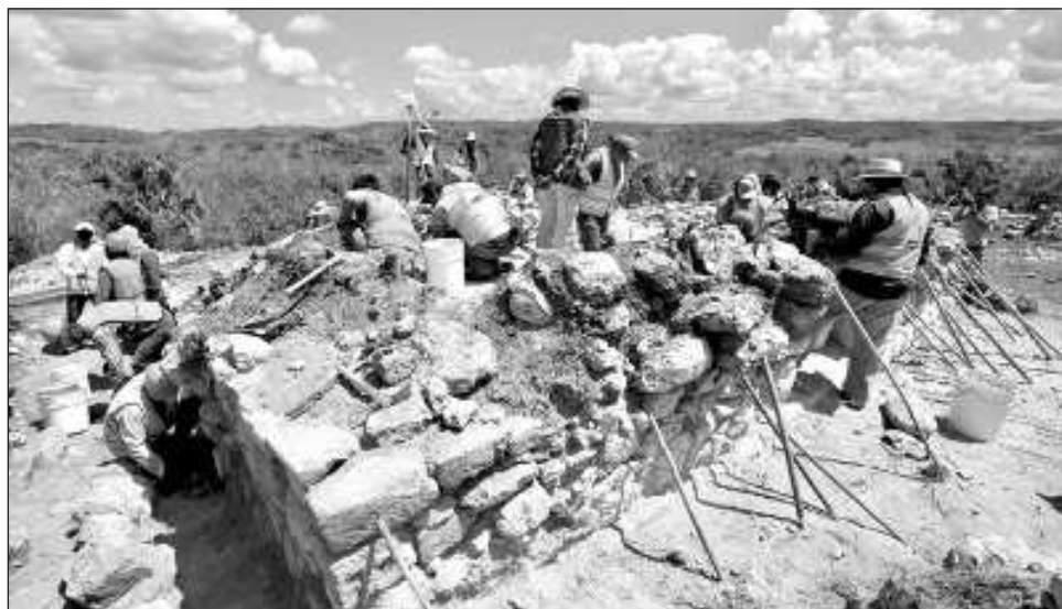
▲ La gobernadora Mara Lezama expuso al presidente Andrés Manuel López Obrador los avances del salvamento arqueológico en el frente 1 del tramo 7.

“Tenemos dos caminos: uno hacia el interior de Quintana Roo, hacia el centro de la península, y otro hacia la costa. El antiguo camino que conducía del muelle de Vigía Chico, construido en la época de Porfirio Díaz hacia Chan Santa Cruz (Felipe Carrillo Puerto), ese lo vamos a hacer artesanal, como estamos haciendo los caminos de Oaxaca, para no afectar”, indicó.