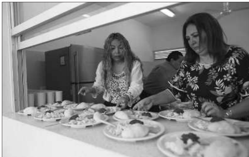
▲ El objetivo de la aprobación es proteger a las niñas, niños y adolescentes y, en este caso, buscan evitar la vulneración a la falta de alimentos.

Para la entidad yucateca, detalló, será necesario modificar leyes secundarias, pues con la implementación