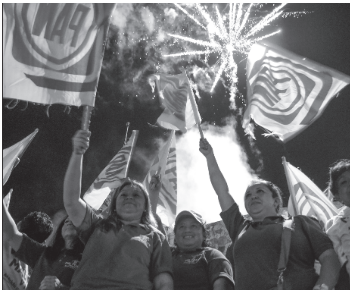
▲ "En Yucatán el PAN y Va Por México tienen candidatos y narrativas que claramente dependen de un humor social positivo y con prospectiva positiva sobre el futuro que traerá el modelo de desarrollo colectivo vigente".

ESTO ES MUY importante para pensar en Yucatán hacia 2024. Algo está pasando en el humor social yucateco, por lo menos en ciertos grupos altamente movilizados y en temas de las agendas