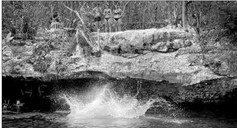
▲ Activistas señalaron que Sactun politizó su presencia en tribunales internacionales, pese al grave deterioro contra el medio ambiente que ha provocado y el despojo contra las comunidades.