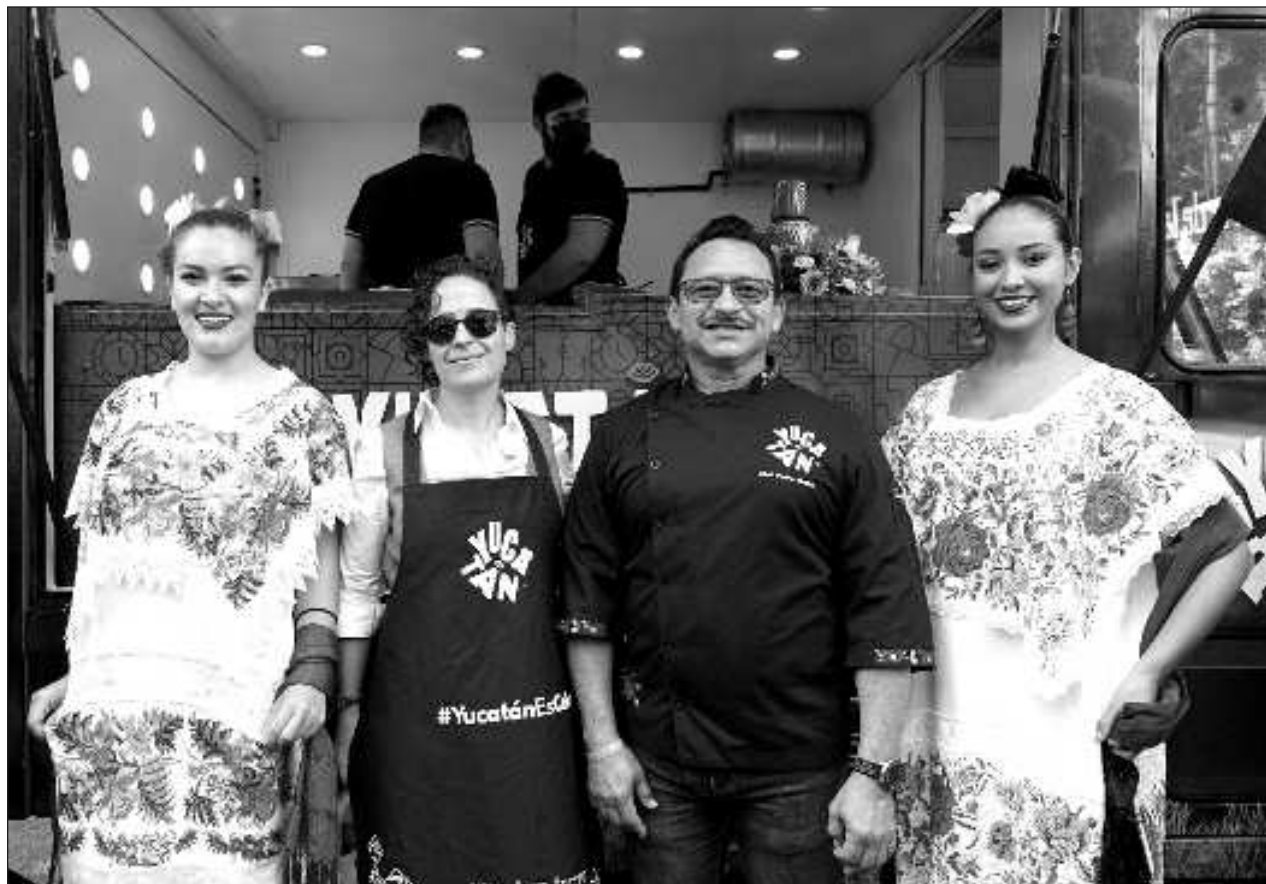
▲ El Yucatruck repartirá 12 mil tacos de cochinita de manera gratuita en seis puntos de la CDMX.

“Ya no es sólo los Pueblos Mágicos, las playas y demás, sino también es el Tren Maya que debe entrar en funciones este año con una oferta inigualable, pues además de los hoteles Tren Maya, habrá diversificación de productos artesanales, regionales y de calidad para los visitantes”, finalizó el funcionario estatal.