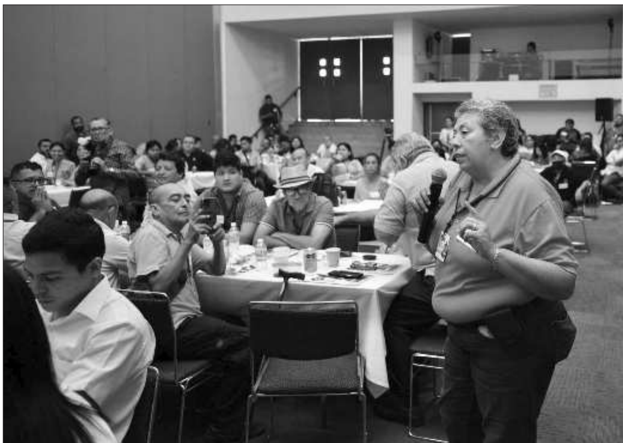
▲ Con la participación de 105 comunicadores entre periodistas y alumnos afines a la licenciatura se llevó a cabo este viernes el Foro Estatal de Periodismo 2023 en el congreso del estado de Campeche.