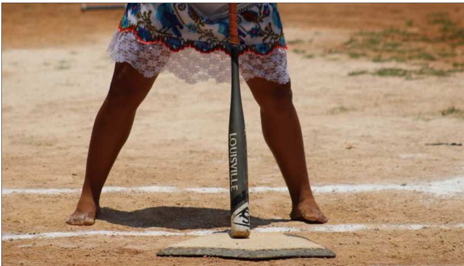
▲ "Además de todos los etcéteras que tiene la mujer al servicio de los demás, podemos elegir un espacio de ocio gozoso, como en su caso, el softbol".