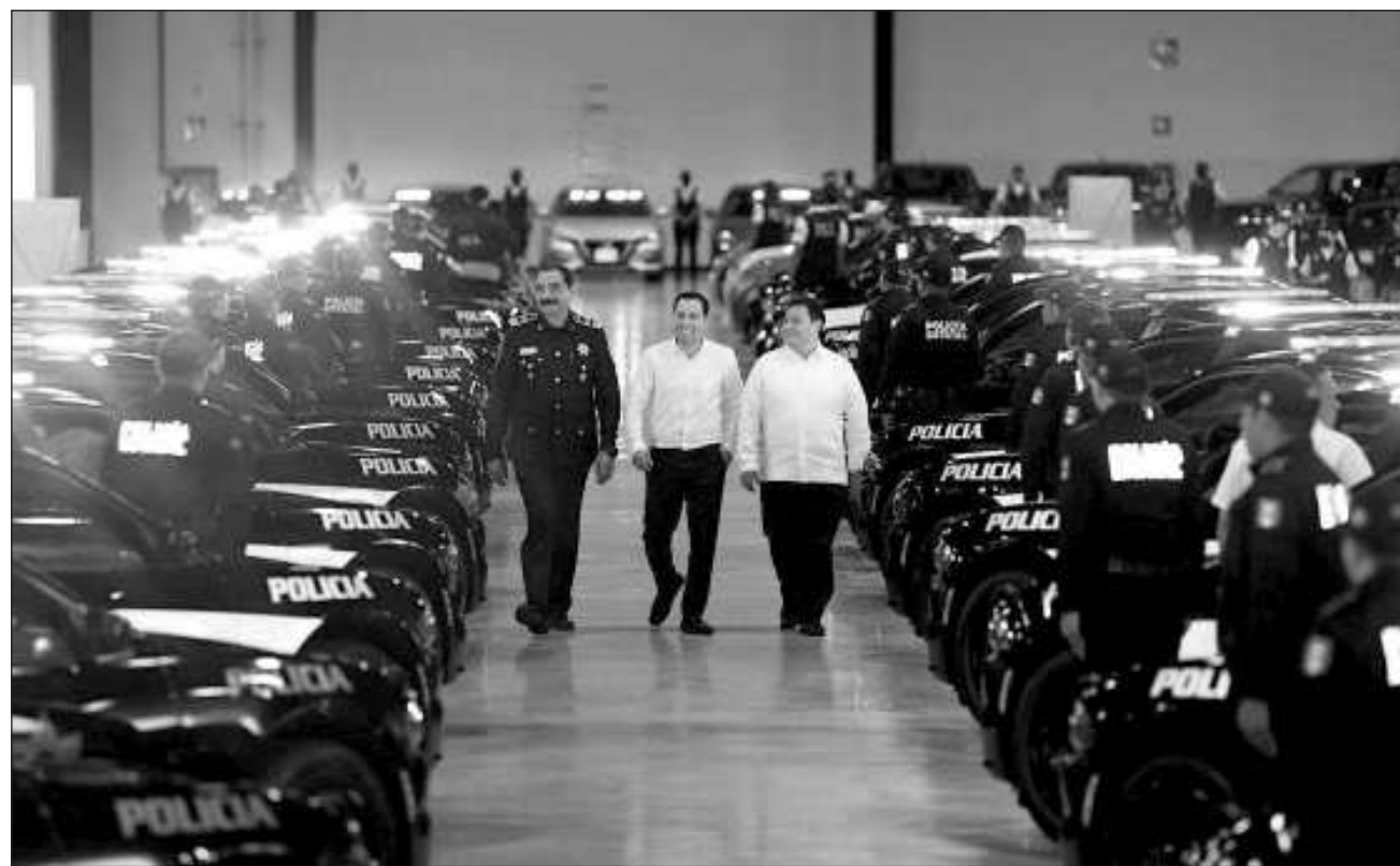
▲ Para mantener los índices de seguridad y paz que prevalecen en la entidad, garantizando el suficiente presupuesto, se establece la irreductibilidad del presupuesto para la dependencia del Poder Ejecutivo encargada de la Seguridad Pública.

La protección de los derechos de las mujeres es uno de los ejes primarios en la agenda del gobernador, por lo que se envió al Congreso local una iniciativa para ex-