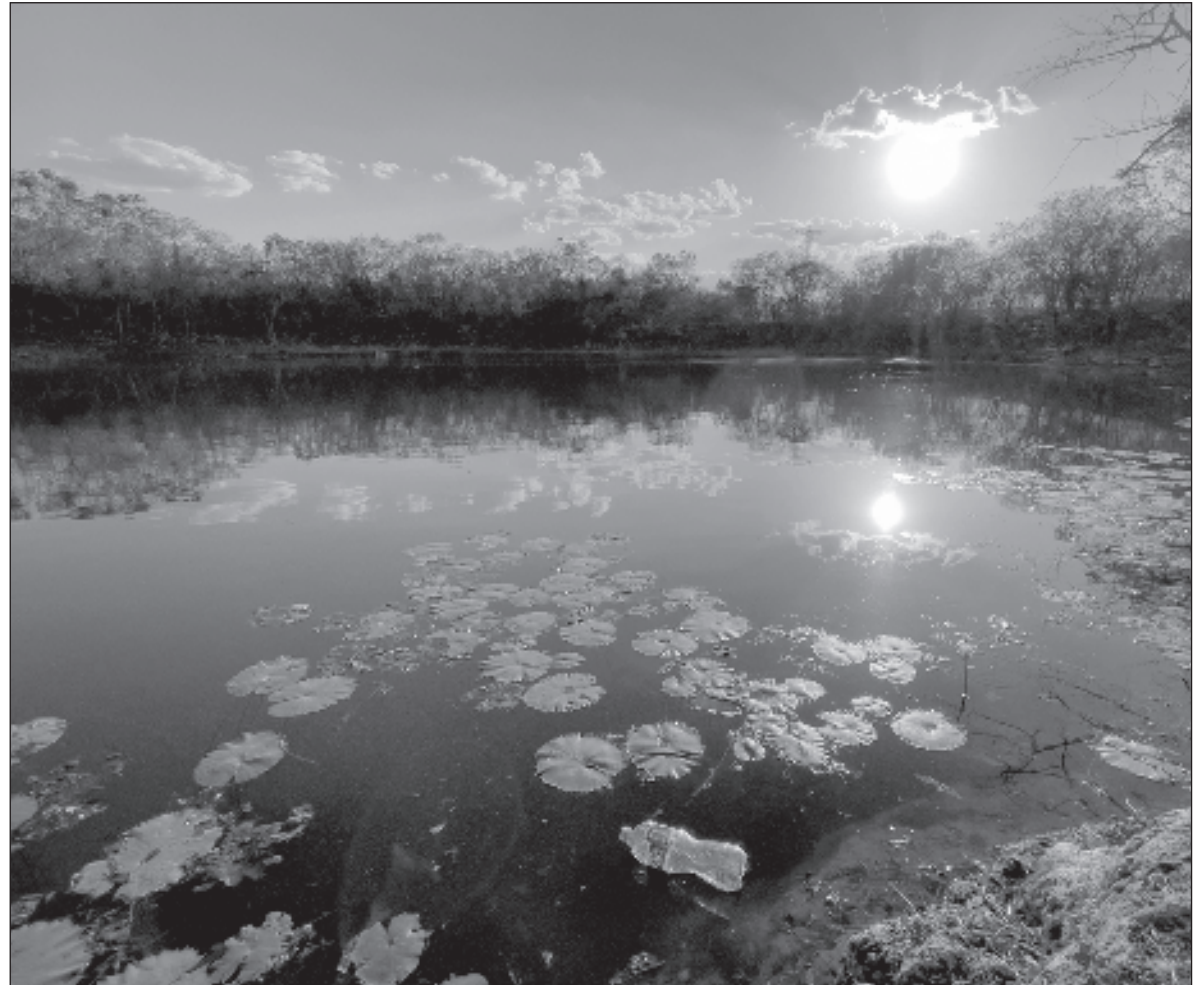
▲ “Aunque sabemos desde hace algunos años con certeza que buena parte de estos fenómenos son resultado del cambio climático muy pocas veces nos detenemos a buscar conexiones”.

ES UN DOCUMENTO generado de forma participativa, de 65 páginas, con un diagnóstico que revela problemas importantes sobre la contaminación, el manejo de residuos, la calidad del agua, el ordenamiento ecológico y el aprovechamiento de energías limpias en el Estado. Tiene un árbol de problemas con las principales causas y efectos que se transforma en