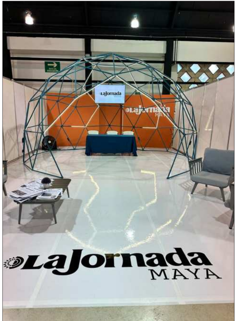
▲ "Cuando la cúpula se abre a la diversidad, también tiene que abrirse a la conversación y al encuentro (...) pasaron muchas personas a compartirnos su palabra".

No hubo día que me sintiera menos fatigado que el anterior, pero dentro de cada esfuerzo titánico se puede seguir andando cuando tenemos la capacidad de construir felicidad de manera cotidiana. Esta la descubrí en la mirada de todas las personas que participaron con nosotrxs, a la gran mayoría les conozco de hace algún tiempo y pensaba que era una gran oportunidad para abrir un espacio a muchas voces, y este coro llegaba usualmente con nervios al espacio, a menos de que fueran viejxs lobxs de mar, y se iban con sonrisas de oreja a oreja, no solo por la satisfacción de haber logrado su tarea, sino también de, como me compartieron en muchos mensajes después, el agradecimiento de sentirse escuchadxs y de haber abierto puertas para nuevos encuentros.