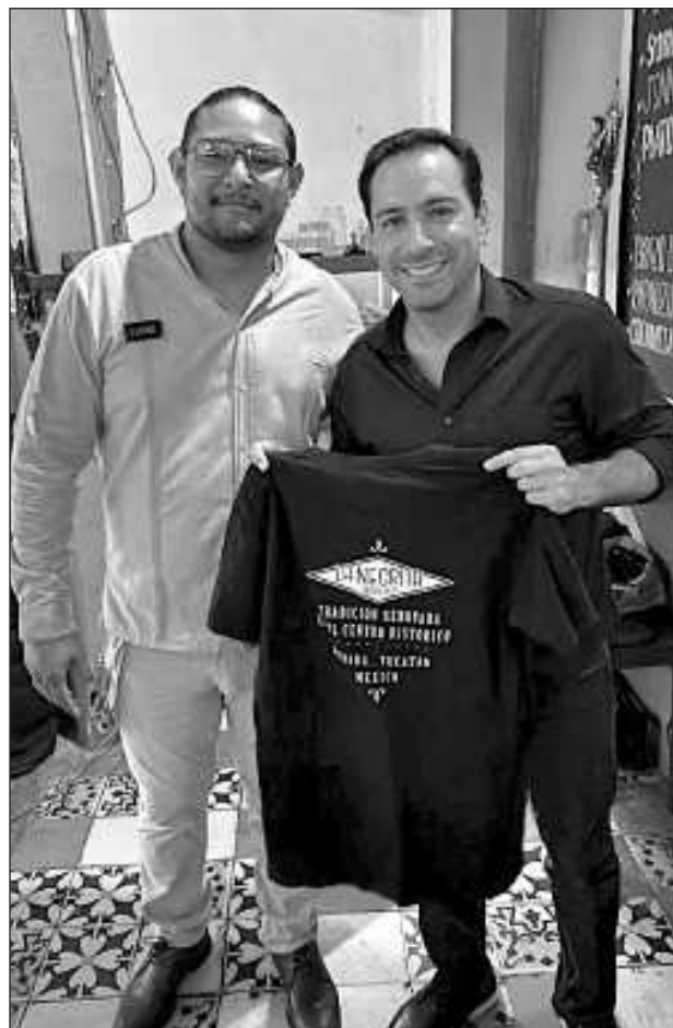
▲ “No es común que un mandatario en funciones acuda a este tipo de lugares, que pueden representar una exposición innecesaria al escrutinio de la gente; sin embargo, (...), Vila encabeza la lista de funcionarios mejor calificados a nivel nacional”.