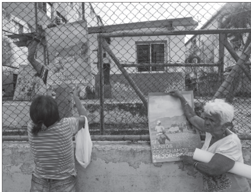
▲ De los ocho millones de cubanos mayores de 16 años convocados a votar, hasta las 14 horas locales había sufragado 60.14% de los electores, indicó el Consejo en Twitter.

Rachel Vega, una estudiante de arquitectura de 19 años, dice que votó para "dar