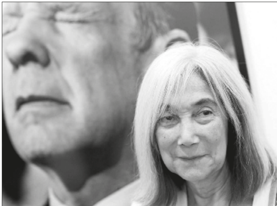
▲ La autora de La divisa punzó murió en Buenos Aires, Argentina, debido a problemas de salud que habían dificultado su movilidad en los últimos meses.

Pese a que en 1967, Borges se casó con otra mujer, Elsa Astete, María Kodama siguió viendo al escritor argentino