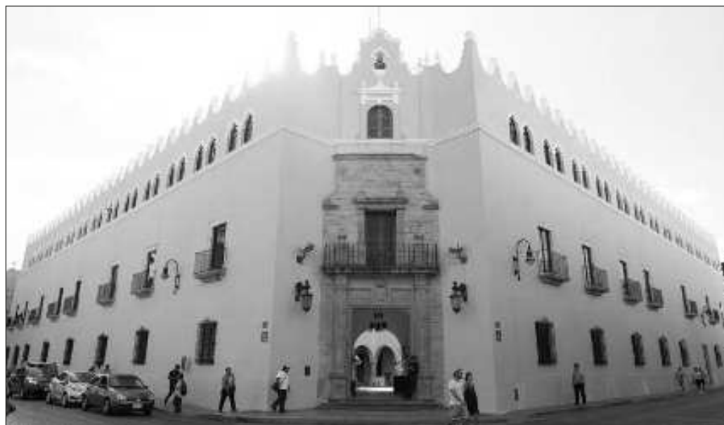
▲ El Congreso de Yucatán posee las facultades para legislar sobre la Universidad.

¿El temor es a una nueva ley orgánica? Seamos francos: la elaboración de una normativa no podría hacerse sin la participación de la UADY. No debería existir miedo a la fiscalización, toda vez que ésta es una obligación conforme a la normativa vigente en materia de Transparencia, y a que la UADY es una institución que recibe recursos públicos. Al contrario, si se trata de que órganos públicos encargados de impartir educación superior rindan cuentas de los recursos que reciben, la iniciativa se queda corta: hará falta incorporar a la Universidad Pedagógica, a la Politécnica, a la Metropolitana. Como ciudadanos y contribuyentes, esperamos información de una aplicación eficiente de nuestros impuestos.