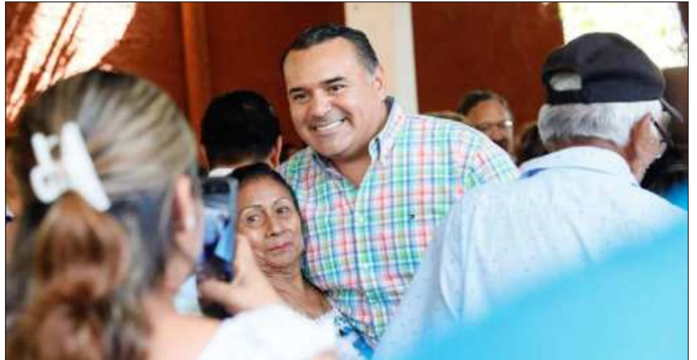
▲ Durante una visita al municipio de Kanasín, Renán Barrera destacó: “no hay nada más satisfactorio para la ciudadanía que ver que sus autoridades unan en esfuerzos”.

Bojórquez Ramírez agradeció a los asistentes el interés por conocer los últimos avances en el municipio, además que presentó las acciones coordinadas entre ambos municipios para garantizar el crecimiento ordenado que genere prosperidad.