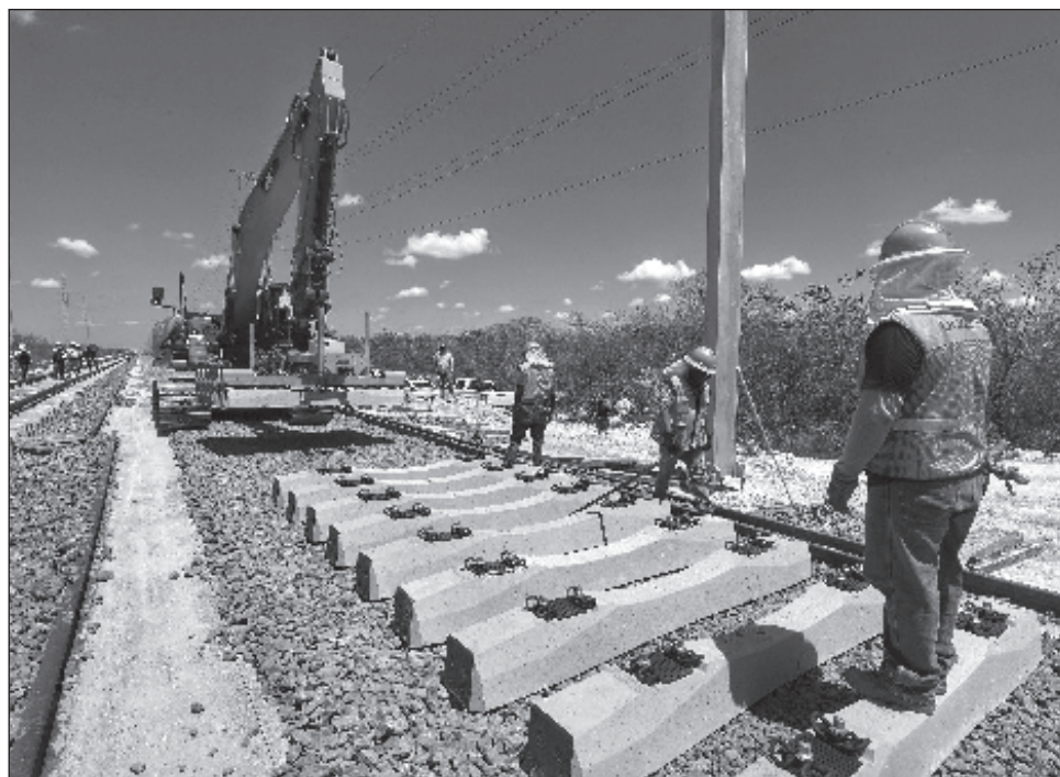
▲ La Jornada visitó las obras de la construcción de la estación de Teya, a la salida de Mérida, y que será “la segunda más importante”, sólo por detrás de la de Cancún.

“Es una obra de clase mundial, es un tren, no todos los días alguien se atreve a construir una obra de este tipo y, lo más importante, es el desarrollo que ya se está dando.