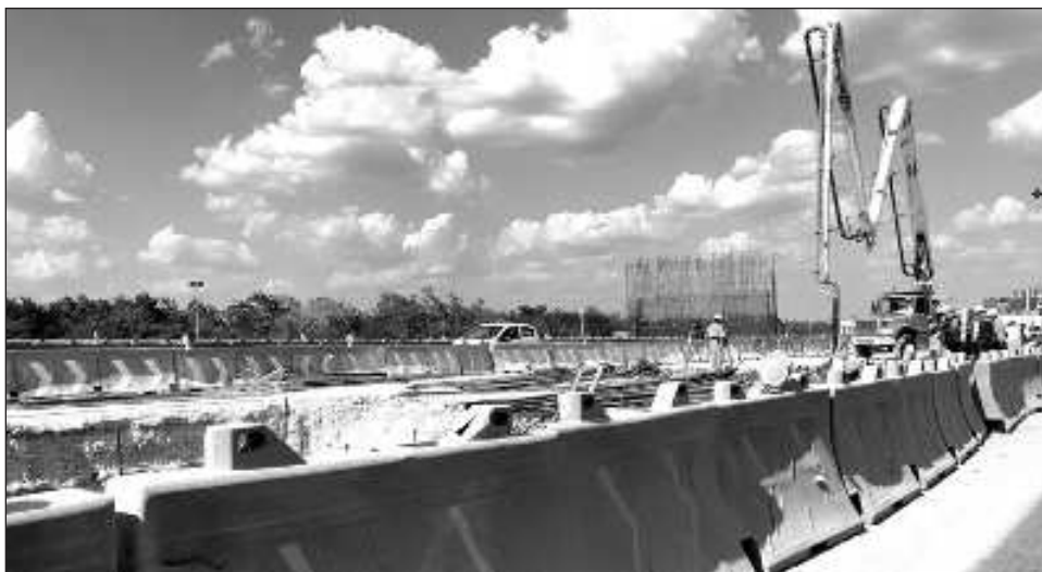
▲ El Centro de la Secretaría de Comunicaciones y Transportes en Yucatán hace un exhorto a los usuarios para respetar los límites de velocidad y el señalamiento preventivo.

El Centro SCT Yucatán hace un exhorto a los usuarios para respetar los límites de velocidad y el señalamiento preventivo.