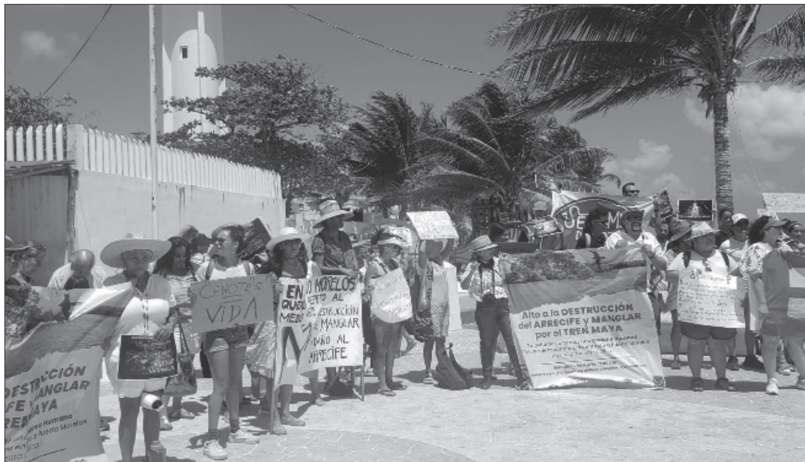
▲ Los ambientalistas llevaron a cabo una cadena humana para protestar contra la destrucción de vida marina ocasionada por el barco Melody, que actualmente permanece en altamar, y el impacto al manglar debido a la circulación de volquetes que trasladan la piedra hasta la Ruta de los Cenotes.