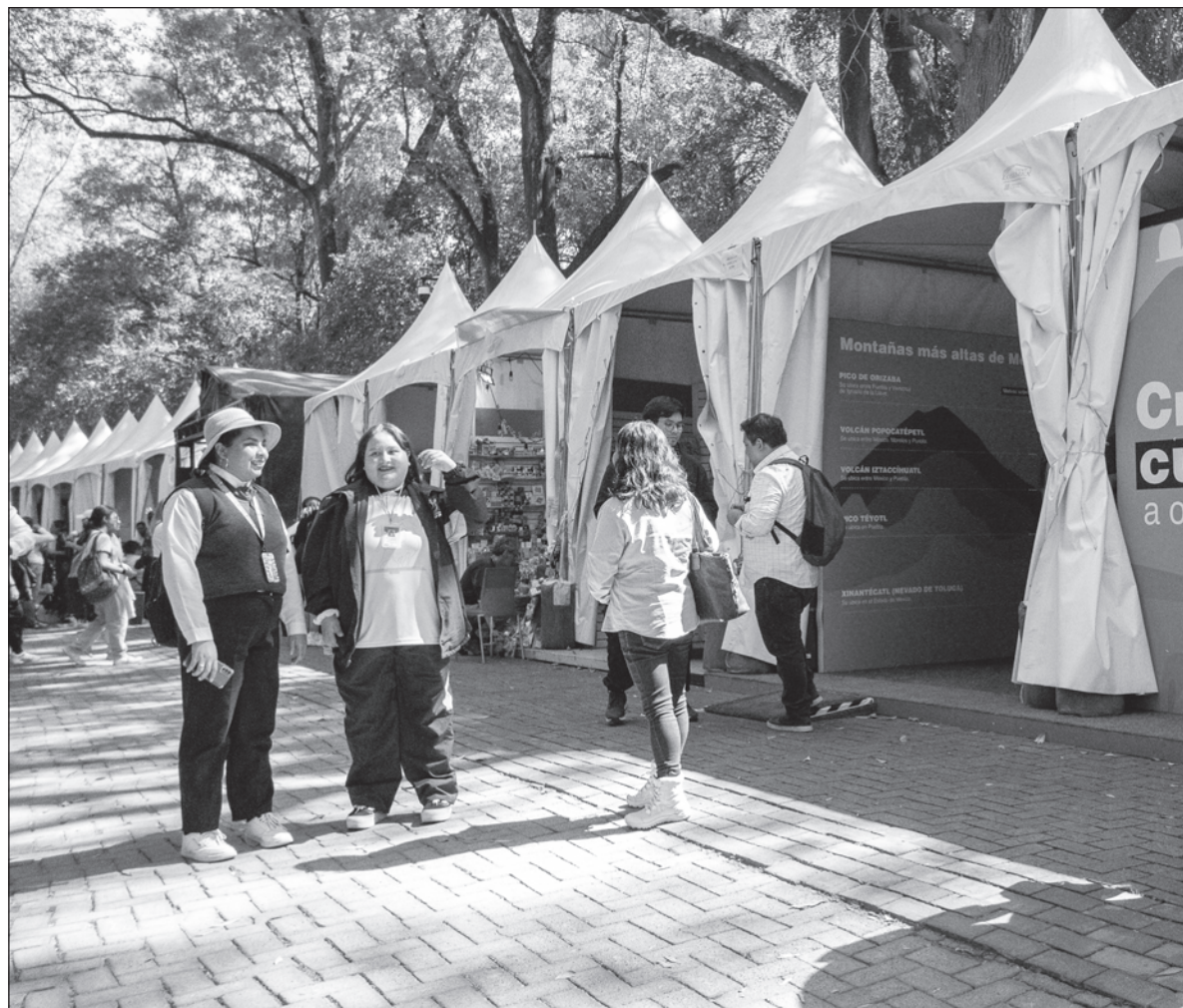
▲ "La feria fue organizada por el Fondo de Cultura Económica y el Gobierno de la Ciudad de México, y ocurrió en el espacio 'La Milla', ubicado en el Bosque de Chapultepec, en la Ciudad de México, del 8 al 18 de noviembre".

Sin embargo, a pesar de la participación de alrededor de 75 casas editoriales que presentaron cerca de 90 publicaciones, la realización de aproximadamente 130 espectáculos artísticos en cuatro foros del sitio y la impartición de poco más de 650 talleres relacionados con el libro, la lectura y el