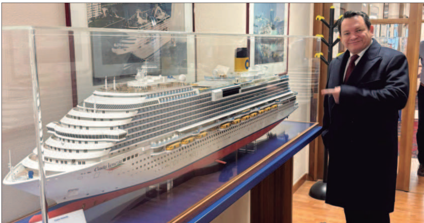
▲ El gobernador Joaquín Díaz Mena estuvo en la ciudad italiana de Monfalcone, a 30 minutos de Trieste, reconocida por albergar uno de los principales astilleros de Fincantieri, responsable de edificar los cruceros más grandes del mundo, lo que ha posicionado a la región como un motor económico.

Al posicionarse como un punto clave en el mapa naval global, Yucatán no solo atraerá inversiones, sino que se consolidará como un estado innovador, competitivo y preparado para los retos del futuro. La visión está trazada, y el potencial es innegable: el astillero podría marcar el inicio de una nueva era de prosperidad para el estado.