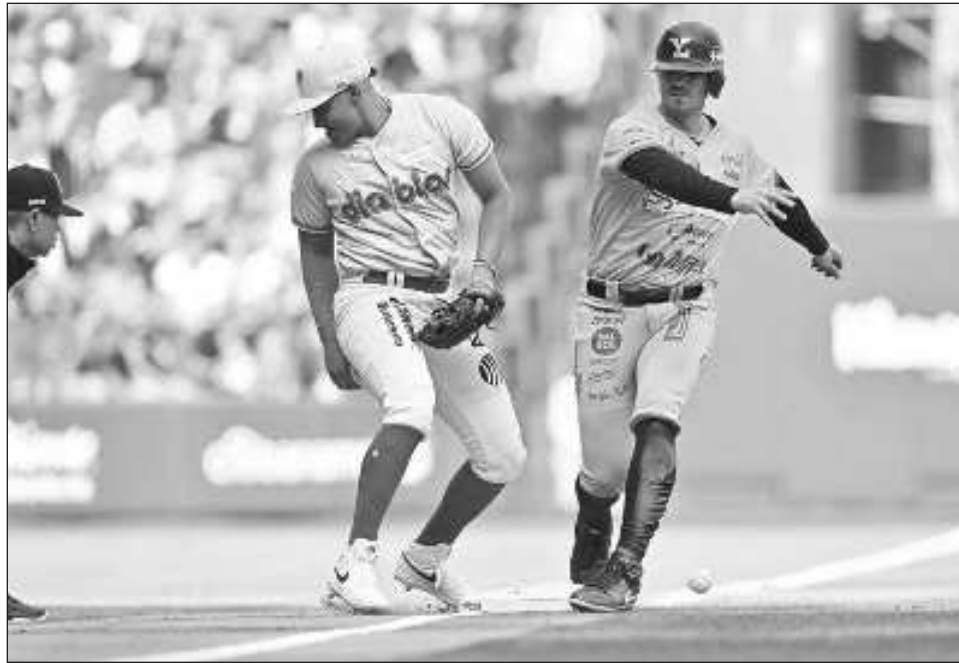
▲ Melenudos y Diablos chocarán en el partido inaugural de la próxima campaña.

Los selváticos jugarán un total de 48 partidos como