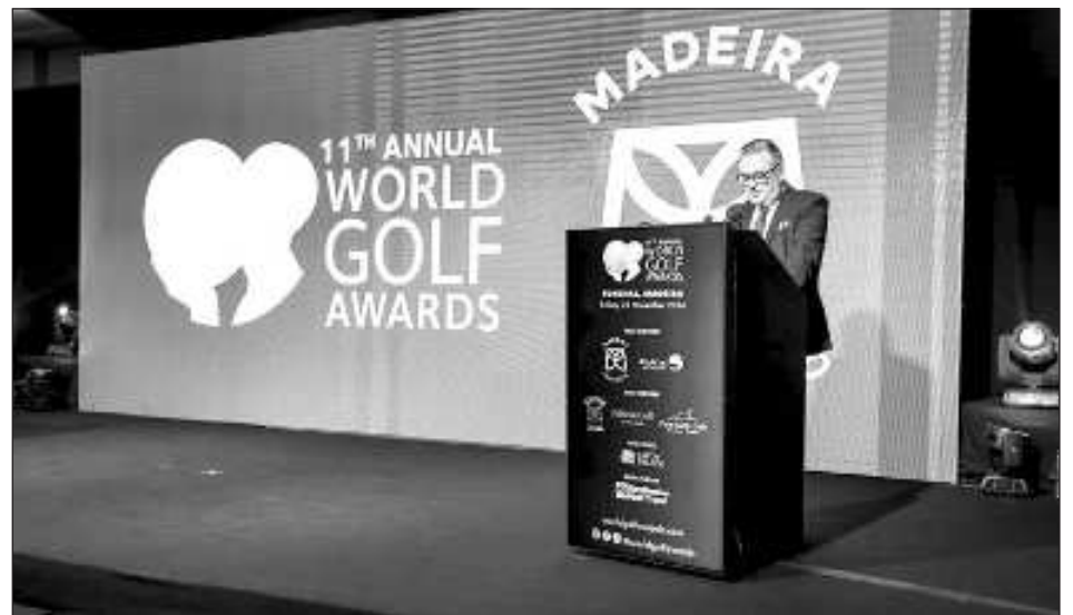
▲ El campo de golf PGA Riviera Maya fue reconocido en la ciudad de Madeira, Portugal, como el mejor de México durante los World Golf Awards 2024.