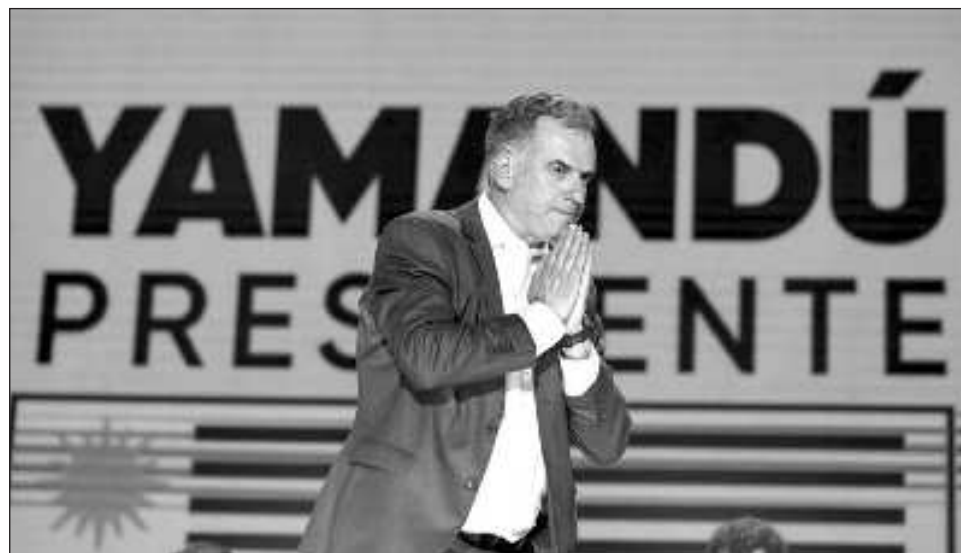
▲ "Entendamos que hay parte de nuestro pueblo que hoy está con otro sentimiento. Esa gente también tendrá que ayudar a construir un país mejor. A ellos también los necesitamos", dijo Orsi en su discurso.

Con 99.94 por ciento de los votos escrutados, Orsi