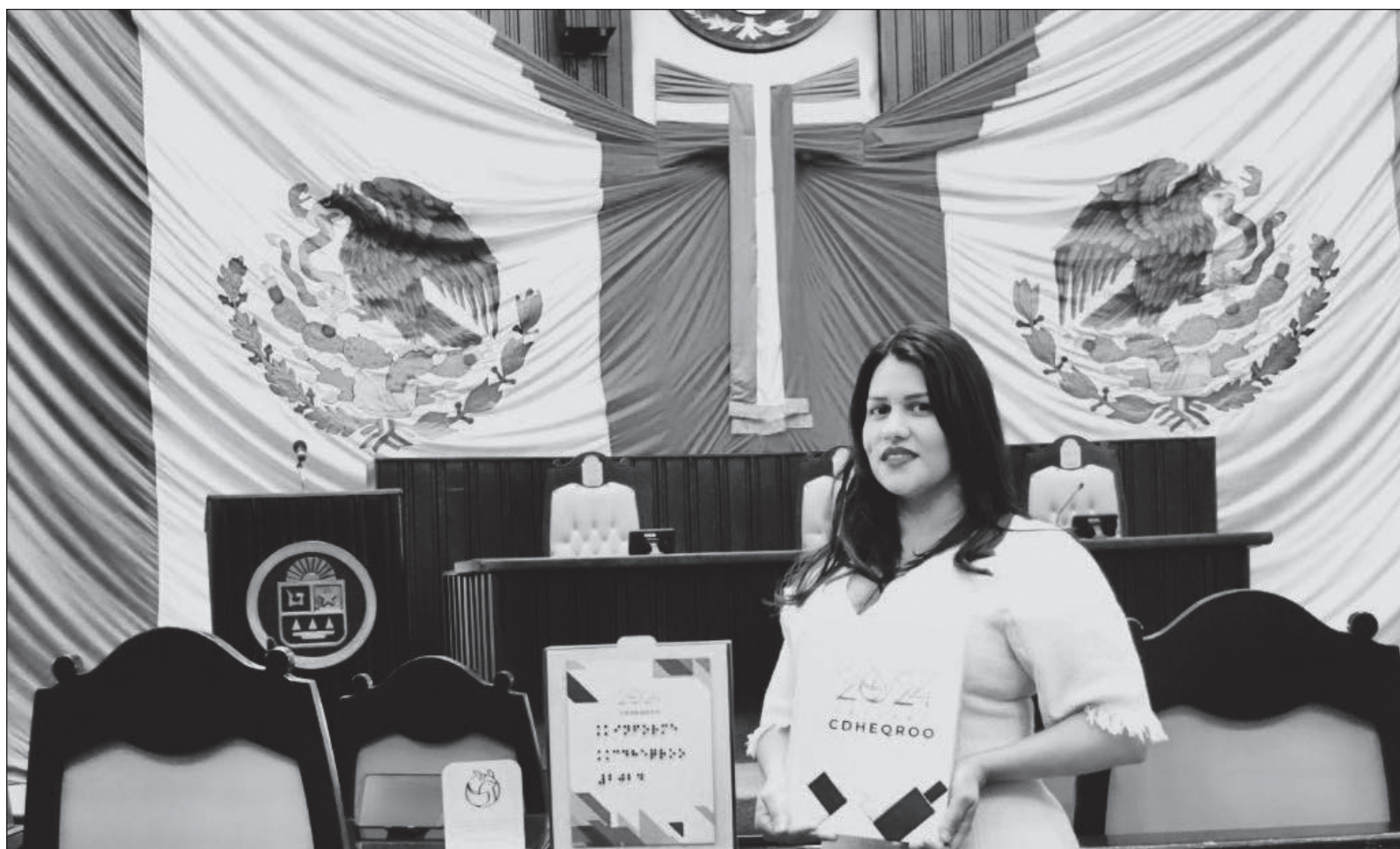
▲ "No solamente la forma interna de trabajo necesita mejorar y transparentarse, también requiere cambios estructurales (...) un castigo real a las personas que violentan los derechos humanos son indispensables. En resumen, no hay nada significativo para celebrar".