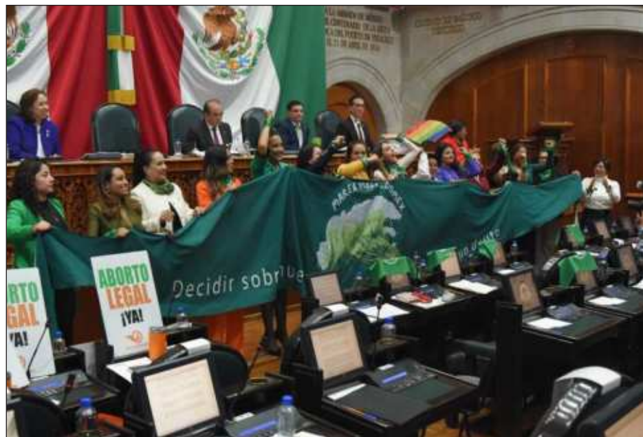
▲ Después de las 12 semanas de gestación sí habrá sanciones penales, salvo excepciones como violación o la implantación no consentida de óvulo fecundado.

Además del Estado de México, en la Ciudad de México (primera entidad en aprobar su despenalización en 2007), Oaxaca, Hidalgo, Veracruz, Coahuila, Baja California, Colima, Guerrero, Baja California Sur, Quintana Roo, Aguascalientes, San Luis Potosí, Michoacán, Puebla, Jalisco y Zacatecas se protege la Interrupción Legal del Embarazo hasta las 12 semanas, mientras que en Sinaloa el margen se extiende hasta las 13 semanas.