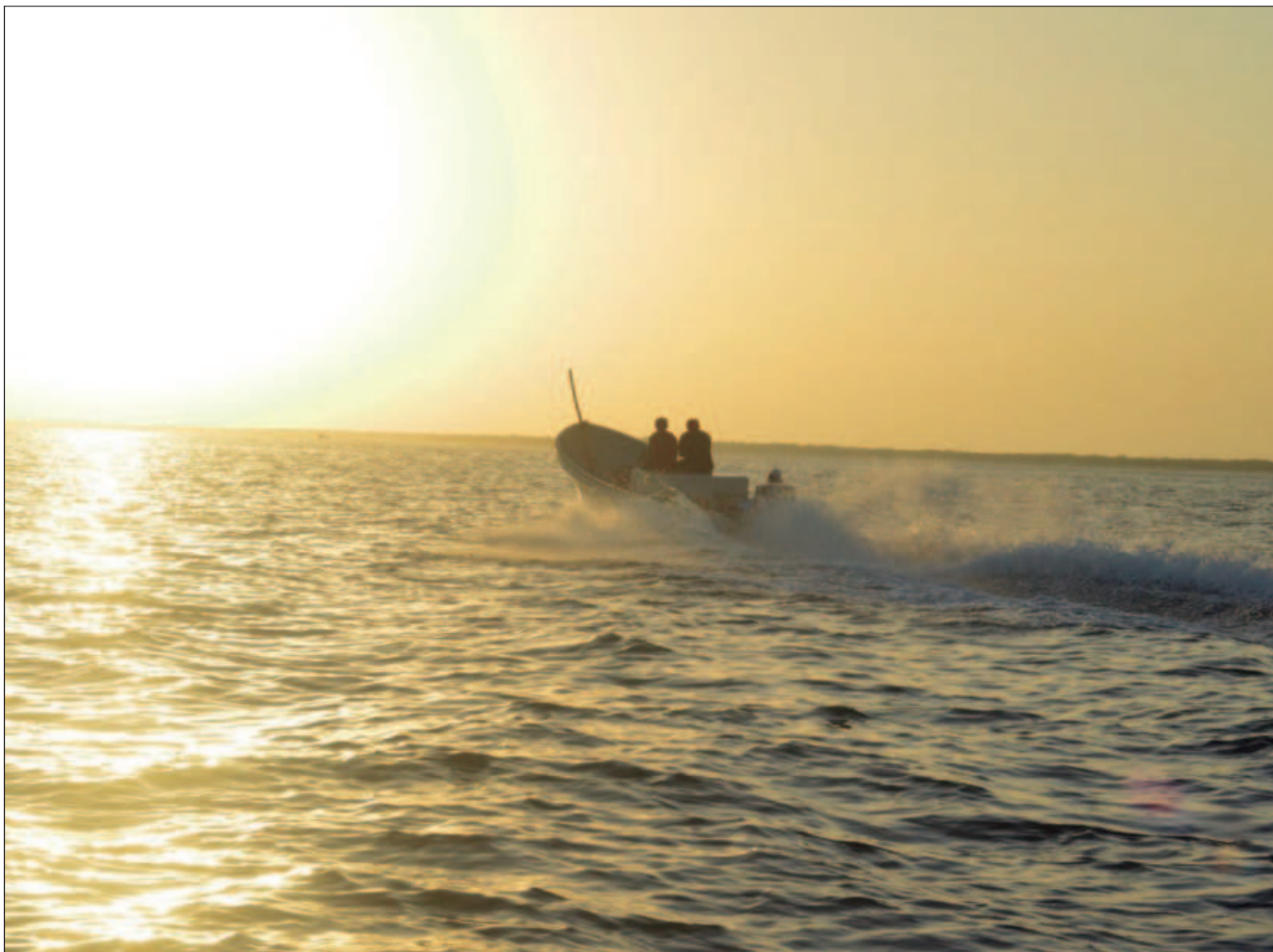
▲ "Hasta 80 por ciento de la biodiversidad de nuestro planeta vive en los océanos, con aún miles de especies desconocidas".

*Caballero de la Legión de Honor daldana@cinvestav.mx