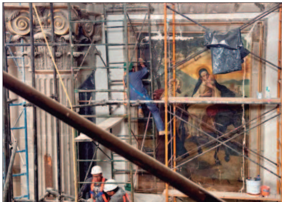
▲ Cinco días después del sismo del 19 de septiembre de 2017, 40 por ciento de la cúpula colapsó. El derrumbe dañó cinco de los ocho vitrales; muros y arcos registraron grietas y fisuras.

El templo ubicado en la colonia Guerrero, a 700 metros de Tlatelolco, preside la plaza del mismo nombre y tiene gran importancia debido a sus características arquitectónicas, a los bienes