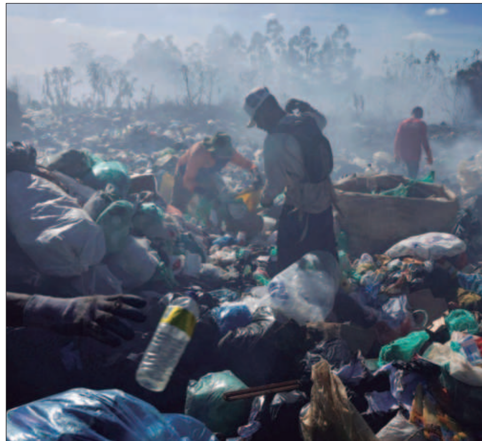
▲ La contaminación por plásticos está tan extendida que se ha detectado hasta en las nubes, en las fosas oceánicas más profundas y en prácticamente todas las partes del cuerpo humano.

Las delegaciones en Busan cuentan con una semana para ponerse de acuerdo en cuestiones delicadas como el tope de la producción de plás-