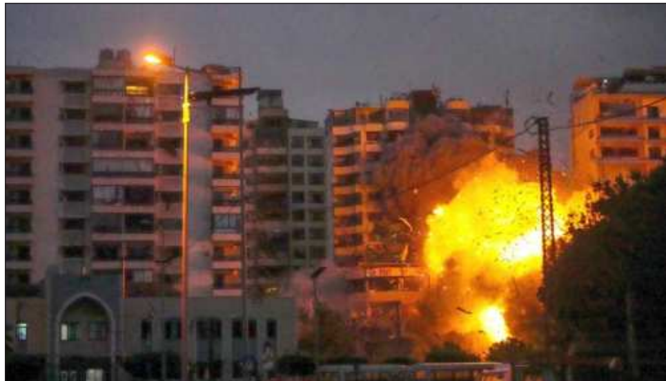
▲ Dmitri Peskov enfatizó que en la Franja de Gaza se está produciendo una terrible crisis humanitaria, mientras que en Líbano también es de emergencia.

Anteriormente, las Fuerzas de Defensa de Israel (FDI) dijeron haber atacado 12 centros de mando del movimiento chií libanés Hezbolá cerca de Dahiyeh, un suburbio