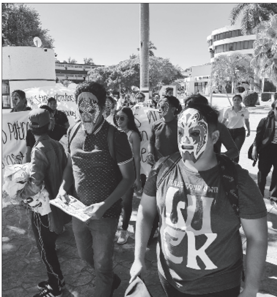
▲ Los manifestantes enmascarados dijeron que en la convocatoria para el Consejo Universitario sólo pudieron registrarse allegados del rector.

Cerca de 50 jóvenes ingresaron al Campus 1 para exigir la renuncia del directivo