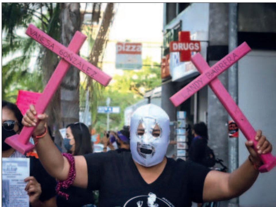
▲ Además de la reforma constitucional, se establece la obligatoriedad para las Fiscalías de que tengan una Fiscalía Especializada para atender feminicidios.

De igual forma se imprimió un timbre postal respectivo de la campaña.