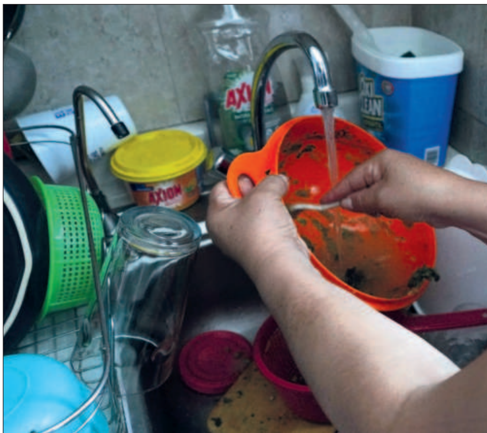
▲ Campeche y Quintana Roo forman parte del grupo de nueve entidades con un menor porcentaje no remunerado de estas actividades, todas están entre 11.3 y 21.9% del PIB.

Los cuidados y apoyo contribuyeron con 24.5 por ciento del valor económico total, las actividades de limpieza y mantenimiento a la vivienda participaron con 23.8; las de alimentación con 21.9; las compras y administración del hogar con 13 por ciento; la ayuda a otros hogares y trabajo voluntario con 8.8, y limpieza y cuidado de la ropa y calzado, con 7.9 por ciento.