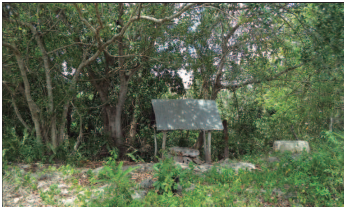
▲ "Un ejemplo notable es la rejollada ubicada en el poblado de Uspibil". En la imagen, Oratorio de las Cruces de San Lucas y San Román. Uspibil, Chemax, Yucatán, 2015

Coordinadora editorial de la columna: María del Carmen Castillo Cisneros, antropóloga social Centro INAH Yucatán