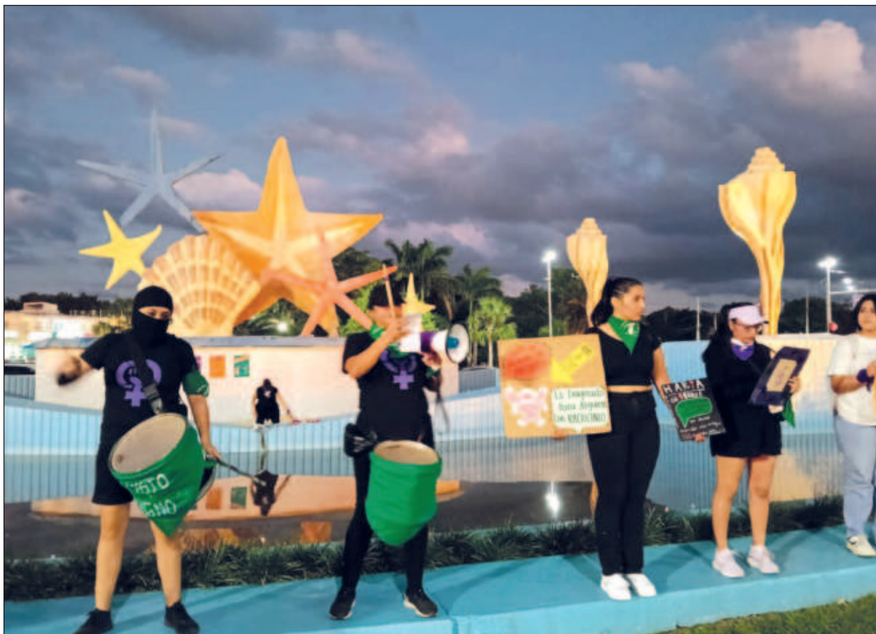
▲ Las manifestantes caminaron del Ceviche a la plaza de la Reforma y alzaron la voz contra la violencia.

La violencia hacia la mujer, dijo, está tan interiorizada que se manifiesta en acciones y dichos que se consideraban normales en sociedad y que con el paso del tiempo ha quedado de manifiesto que son machismos perpetuados. Pero celebró que cada vez más jóvenes participen en estas actividades.