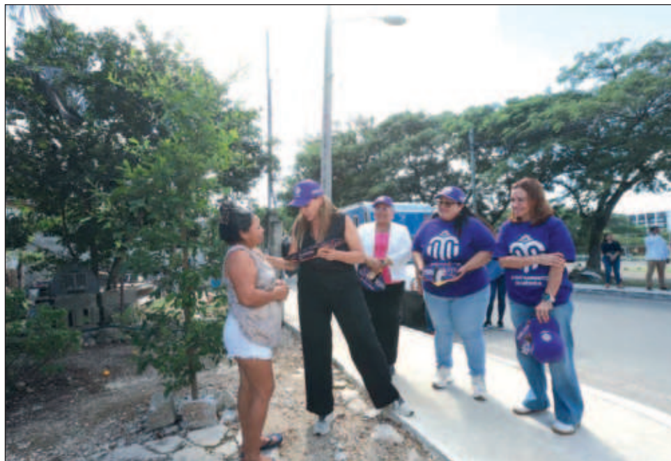
▲ Brigadas del ayuntamiento informaron a jóvenes, niñas y madres de familias acerca de los servicios que ofrece el Instituto Municipal de la Mujer.

Desde temprano, 50 brigadas municipales integradas con personal de las 31 unidades administrativas del ayuntamiento, visitaron las 47 comisarías de Mérida