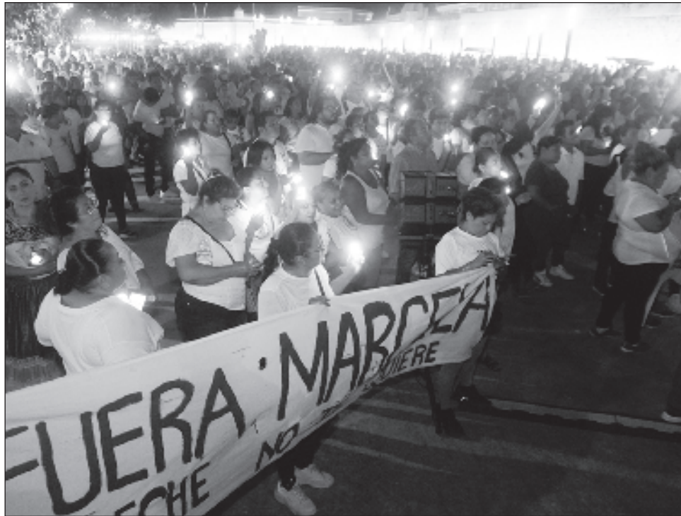
▲ Reclaman los despidos realizados contra policías del paro de labores.

Además, otro detonante han sido los ataques mediáticos a la alcaldía de Cam-