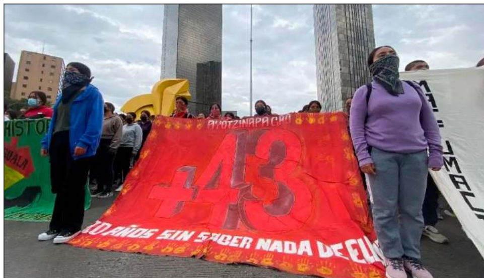
▲ El presidente puntualizó que aunque los militares “no participaron en la detención desaparición de los jóvenes sí pueden resultar responsables por el delito de omisión, al no haber actuado para evitar los actos de violencia contra los jóvenes”.

Interrogado en la mañana de este miércoles sobre la carta e informe que, dijo, hizo llegar el martes a las familias de los 43 normalistas víctimas de desaparición forzada hace una década en Iguala, Guerrero—del que La Jornada da cuenta hoy en su edición impresa—, el jefe del Ejecutivo deslindó