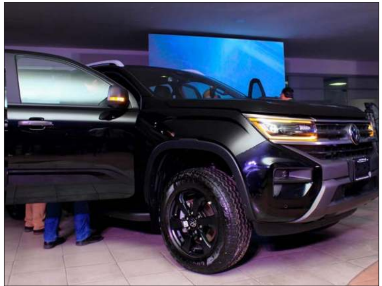
▲ La develación del Nuevo Amarok se realizó en las instalaciones de la concesionaria Volkswagen Comerciales Sureste, ubicada en la Av. Itzáes, y contó con la asistencia de más de 50 invitados.

El Nuevo Amarok, bajo el lema "Conquista la grandeza", llega a Mérida con un diseño exterior audaz y renovado que refleja el compromiso de Bepensa con la innovación. Su parrilla frontal ancha, ópticas de última generación y moderna tecnología a bordo lo posicionan como un vehículo preparado para enfrentar cualquier desafío, sin importar las condiciones climáticas o del terreno. En el interior, Amarok incorpora una nueva pantalla táctil de hasta 30.5 cm, asientos delanteros eléctricos de hasta 10 posiciones y un volante multifunción, todo diseñado para ofrecer la máxima comodidad y