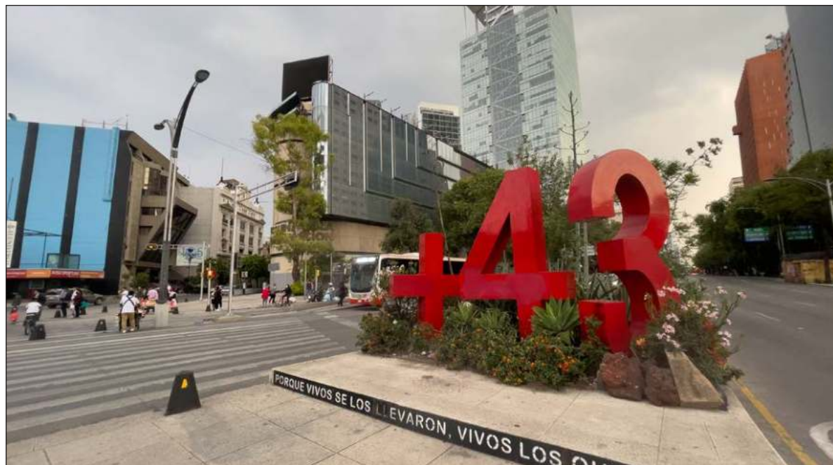
▲ “En la punta del jardín seguía ardiendo una tenue llama que, a pesar de los diez años de búsqueda de sus tesoros, las personas más dignas de todas seguían sembrando con la esperanza de un futuro justo”.

En un rincón del verdor habitaban dos seres que lidiaban con su cotidianidad trabajando a marchas forzadas. La primera era una esforzada polinizadora que batallaba palmo a palmo ante el gris impenetrable, viajando largas distancias para encontrar a las escasas flores que aún brindaban su polen. Ella dibujaba todo su camino de vuelta a casa con tantito polen, pensaba que era inútil porque tendría que trabajar el doble si dejaba la comida en el camino,