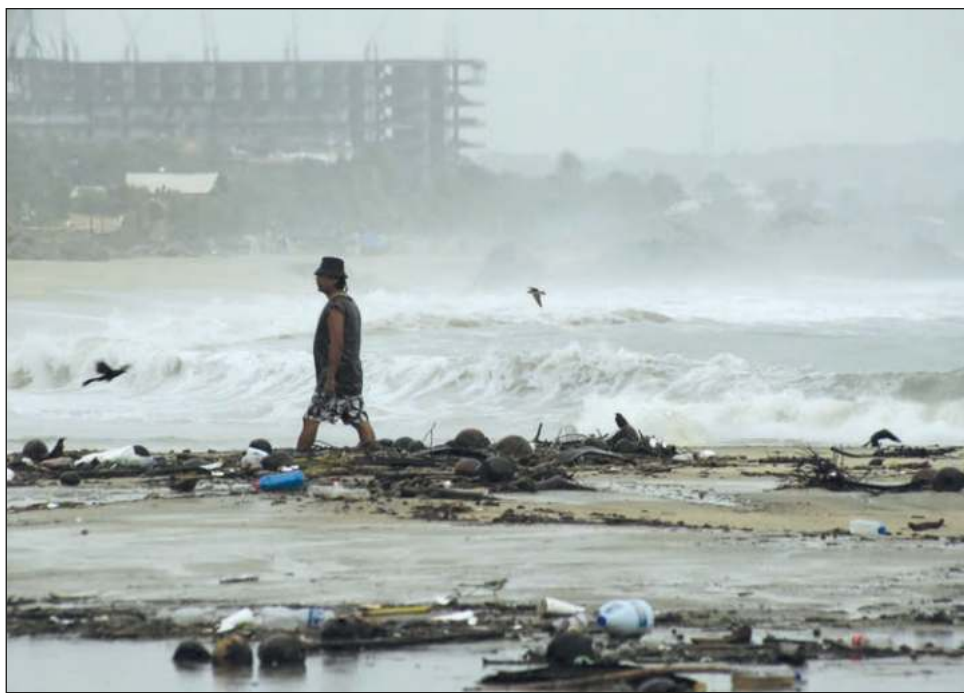
▲ Según la trayectoria prevista, John tocaría tierra en Zihuatanejo este jueves.

Según la trayectoria prevista, impactaría otra vez en Guerrero, pero ahora cerca de las playas turísticas de Zihuatanejo la tarde del jueves.