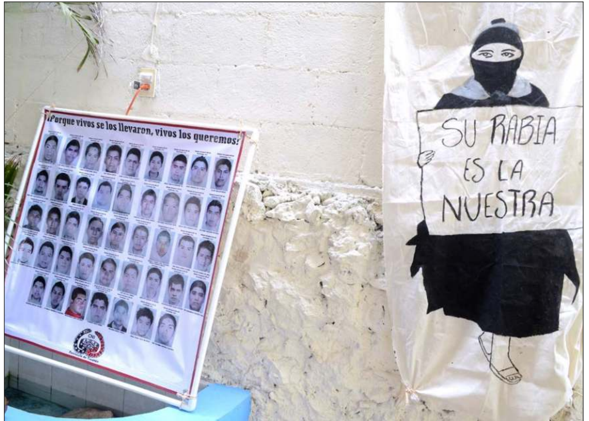
▲ “Ayotzinapa, los 43 normalistas y su desaparición forzada ha desnudado a todo el sistema político mexicano, a los tres niveles de gobierno, al Estado y todo el sistema de la llamada ‘justicia’”.

El sexenio agoniza y con él el sueño de conocer la verdad, ese grito incansable que desde el primer día ha reconocido al causante que nunca faltó: ¡Fue el Estado! Siempre se supo, hoy se