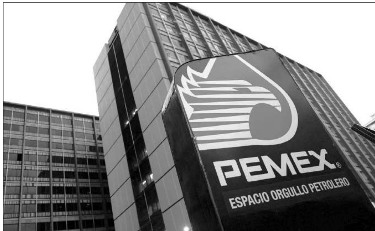
▲ “Las refinerías están generando pérdidas y tenemos la incertidumbre de Dos Bocas (Refinería Olmeca) porque necesita invertir y no está totalmente terminada”, subrayó la analista de Moody's, Roxana Muñoz.

“Las refinerías están generando pérdidas y tenemos la incertidumbre de Dos Bocas (Refinería Olmeca) porque necesita invertir y no está totalmente terminada y no vemos que esté aportando efectivo a la compañía”, comentó