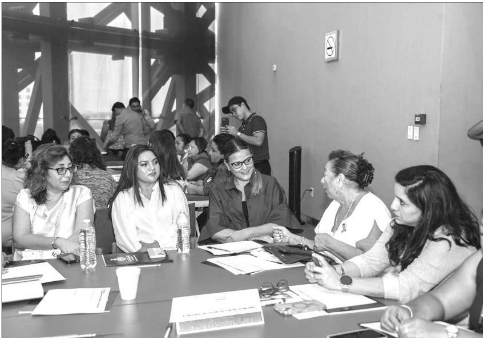
▲ El ayuntamiento de Mérida conformó nueve mesas de trabajo sobre temas como atención a la violencia contra las mujeres, autonomía y empoderamiento, prevención de las violencias contra niñas, niños y adolescentes, salud, política de cuidados, mujeres mayas, cultura de paz, así como sobre masculinidades.

Es así que ambas funcionarias reiteraron que desde el ayuntamiento de Mérida se mantiene el firme compromiso de brindar mejores oportunidades para las mujeres, promover el acceso a sus derechos y garantizar una vida libre de violencia.