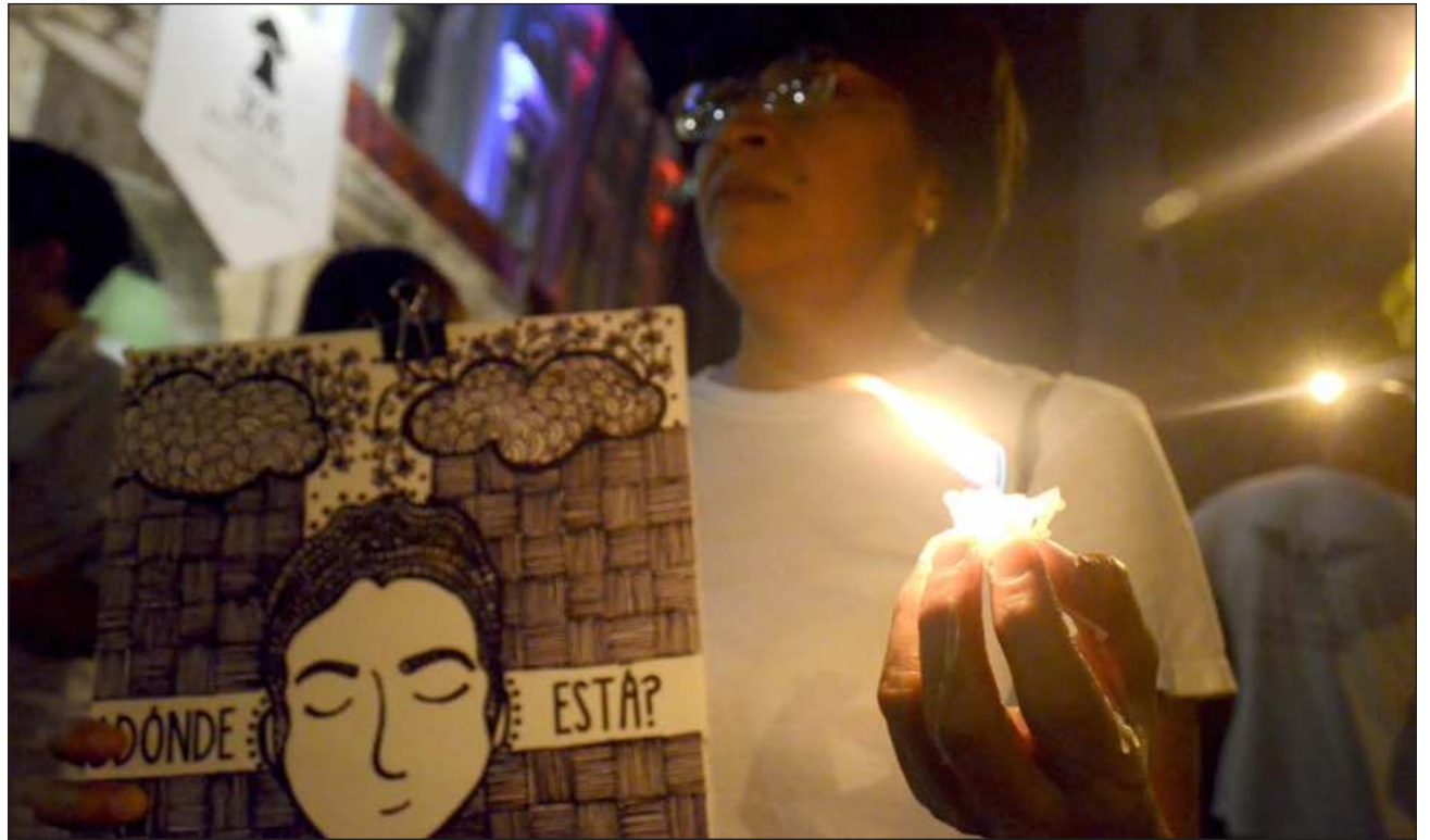
▲ El gobierno de Estados Unidos emitió una alerta dirigida a sus ciudadanos en la que advirtió sobre la posibilidad de que las movilizaciones con motivo del décimo aniversario de la desaparición de los 43 se tornen violentas.