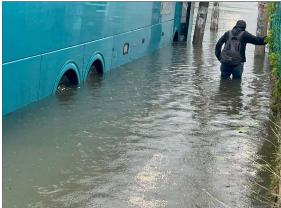
▲ El transporte público fue suspendido durante la duración de alerta roja.

La malla derribada por los vientos fue colocada sobre el paso a desnivel para evitar que materiales de la obra cayeran hasta la vialidad, lo que pudiera afectar a alguno de los vehículos que diariamente transitan por la zona, por lo que trabajadores de Servicios Públicos