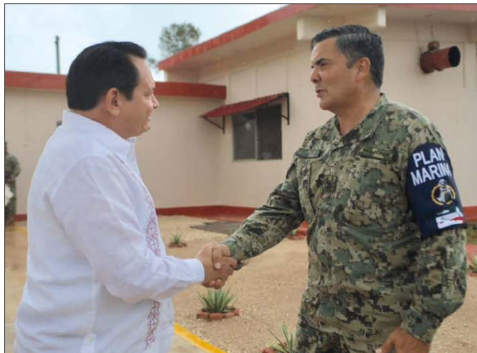
▲ Discuten coordinación sobre modernización del Puerto de Altura.

El gobernador electo expresó su agradecimiento al vicealmirante José Ramón López por su recibimiento y la disposición a cerrar filas con el próximo gobierno. “Le agradezco esta reunión, particularmente la voluntad para sumar esfuerzos a partir del 1 de octubre, para salvaguardar nuestros puertos y mares”, señaló.