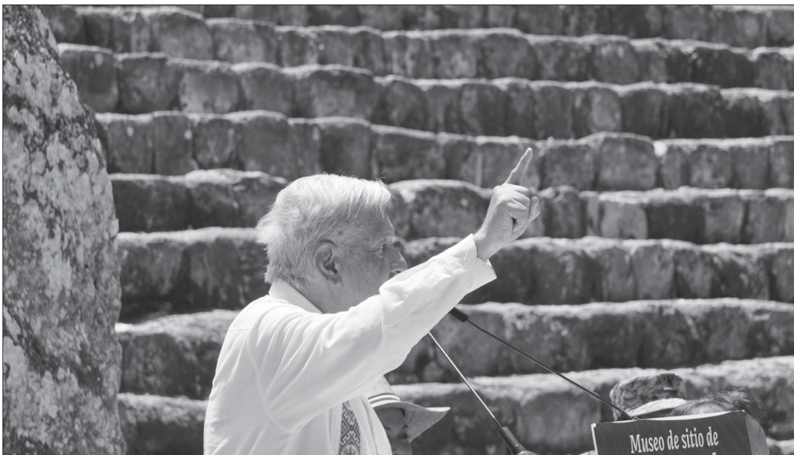
▲ Muchos opositores “se sumaron al credo obradorista y en automático ‘sus pecados les fueron perdonados’, sin importar la gravedad de sus faltas”.