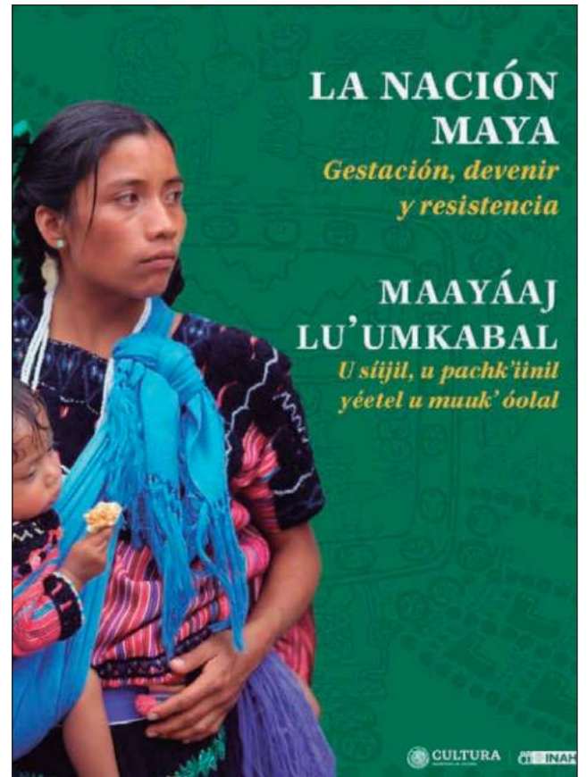
▲ Las investigaciones recorren la historia de la cultura maya, no sólo en la península, sino en toda la región que también alcanza a Guatemala, Belice, Honduras y El Salvador.

El libro estará disponible de forma limitada en los cinco estados que recorre el Tren Maya: Chiapas, Tabasco, Campeche, Quintana Roo y Yucatán, y en las próximas semanas estará disponible su versión en línea.