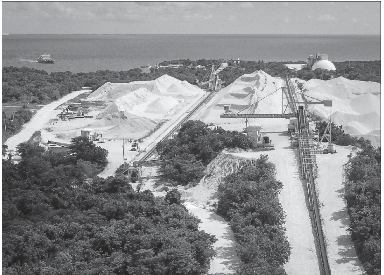
▲ El presidente Andrés Manuel López Obrador aclaró que el decreto publicado el pasado lunes por la noche “no es expropiación, es una declaratoria de área natural protegida” de 53 mil hectáreas que se extiende entre Playa y Tulum.

El mandatario reprochó que “imaginense que se lleven grava del paraíso, porque es de las zonas más bellas de México y del mundo, el mar Caribe, y que se utilice de banco de material para que se lleven la grava para construir carreteras en Estados Unidos. ¿Qué, no