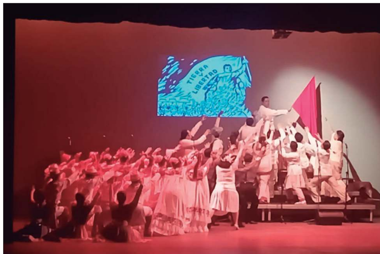
▲ La representación contó con una lectura dramatizada de la obra de Fernando Muñoz Castillo, a quien se le rindió homenaje en su primer aniversario luctuoso. El montaje se celebró en el marco de conmemoración de Felipe Carrillo Puerto.

La obra también retrató las tensiones internas y las separaciones de diversas facciones que integraron la Revolución Mexicana, dentro de la cual Carrillo Puerto estuvo