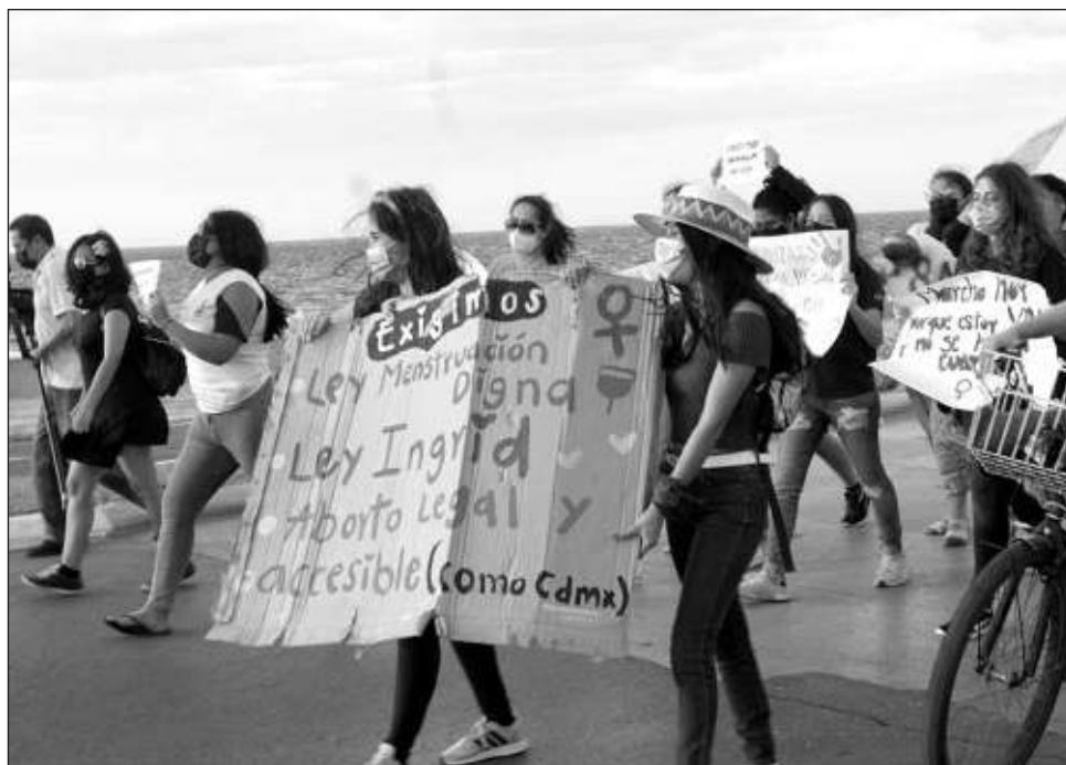
▲ "Manifestamos nuestra preocupación por la garantía del derecho humano al acceso al aborto legal y seguro", expresaron las diferentes organizaciones.

En el marco al Día de Acción Global por el Acceso al Aborto Legal y Seguro este 28 de septiembre, la Red de Mujeres y Hombres con Perspectiva de Género, hicieron un llamado al Gobierno de