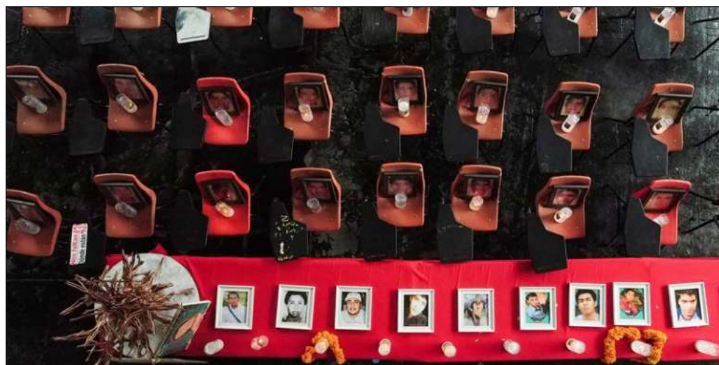
▲ La fuerza del Estado debe destinarse precisamente a brindar la única respuesta que dejará satisfecha a la nación: qué ocurrió con los jóvenes y quiénes resultaron beneficiados con su desaparición forzada.

Para llegar a la resolución de este crimen ya no vale dar largas, ni mucho menos afirmar "ya me cansé", o querer dar punto final con una "verdad histórica". La fuerza del Estado debe destinarse precisamente a brindar la única respuesta que dejará satisfecha a la nación: qué ocurrió con los jóvenes y quiénes resultaron beneficiados con su desaparición forzada. Ayotzinapa es un punto de inflexión en la historia de México, y los 43 normalistas merecen ser encontrados y que se sepa su historia.