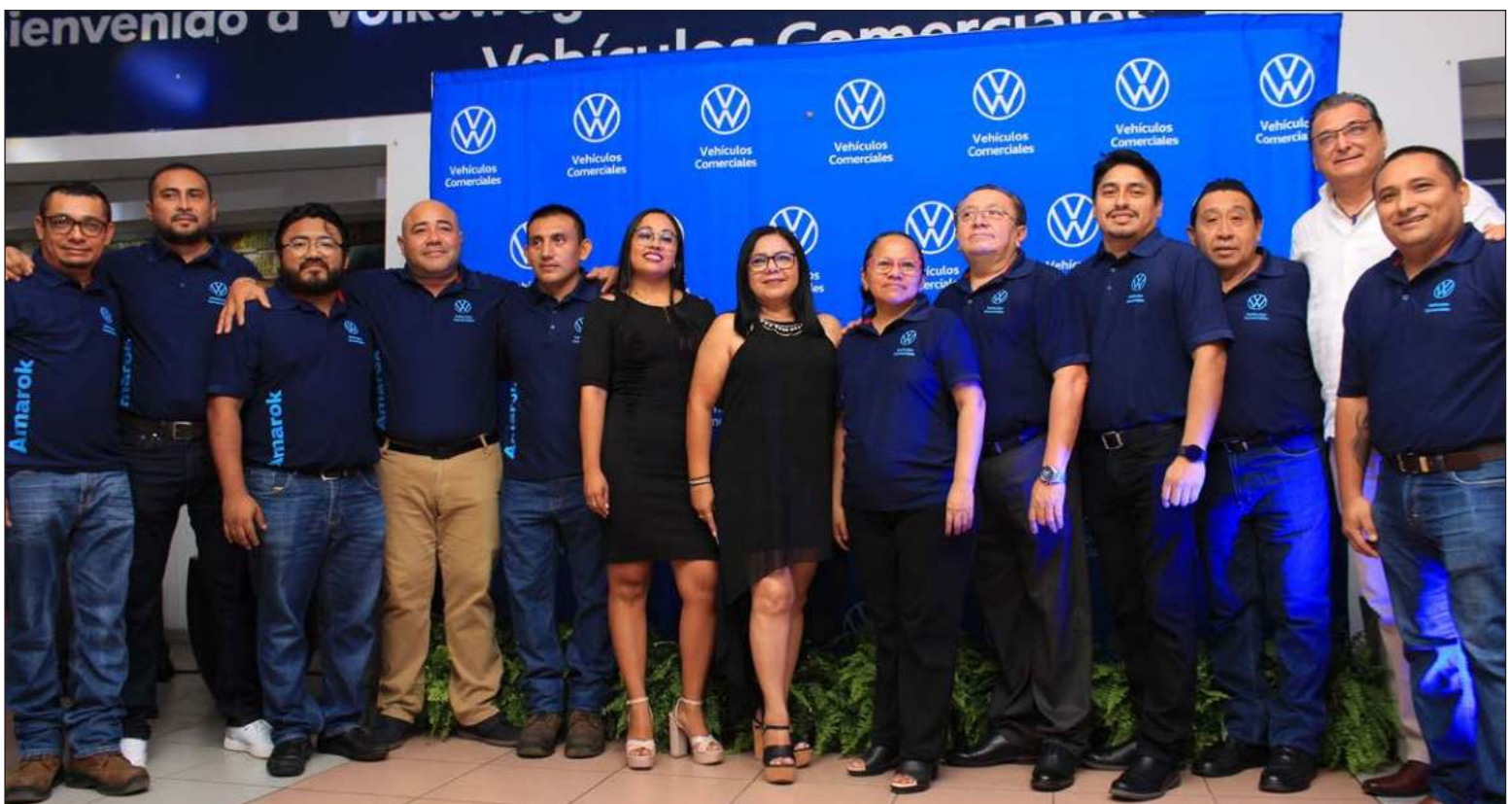
▲ Volkswagen Comerciales Sureste, como parte de Bepensa, no solo representa una marca de vehículos, sino una estrategia de negocios enfocada en la excelencia operativa, el servicio al cliente y la sostenibilidad, y ofrece una gama completa de vehículos diseñados para diversos sectores.

clientes pueden elegir entre versiones de combustible diésel o gasolina, con transmisiones automáticas de hasta 10 velocidades y una capacidad de carga útil de 1,009 kg, lo que lo convierte en una opción versátil para cualquier tipo de usuario.