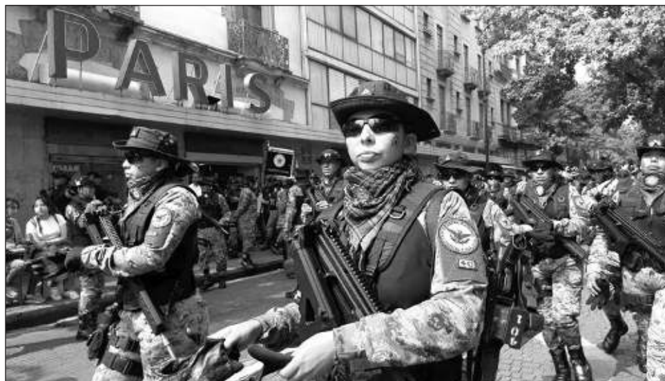
▲ El senador Marko Cortés, dirigente nacional del PAN y buena parte de su bancada, echaron en cara los morenistas que ahora que gobiernan defiendan el mando militar y no civil en la GN.

El debate fue ríspido la mayor parte del tiempo, el