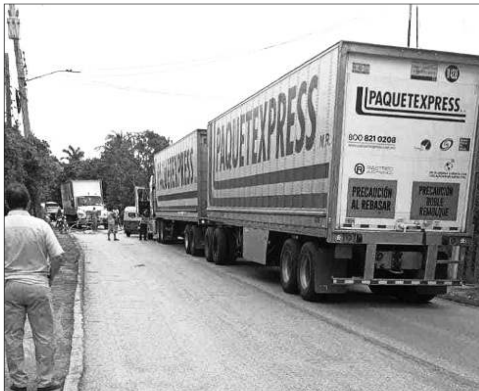
▲ El retiro de la unidad siniestrada provocó un cierre parcial en carretera del Golfo generando, por espacio de dos horas, largas filas de autos y camiones de carga.

Junto con la falla en el suministro, se vio interrumpida el servicio de telefonía celular y de internet, causando el malestar de la población de estas localidades.