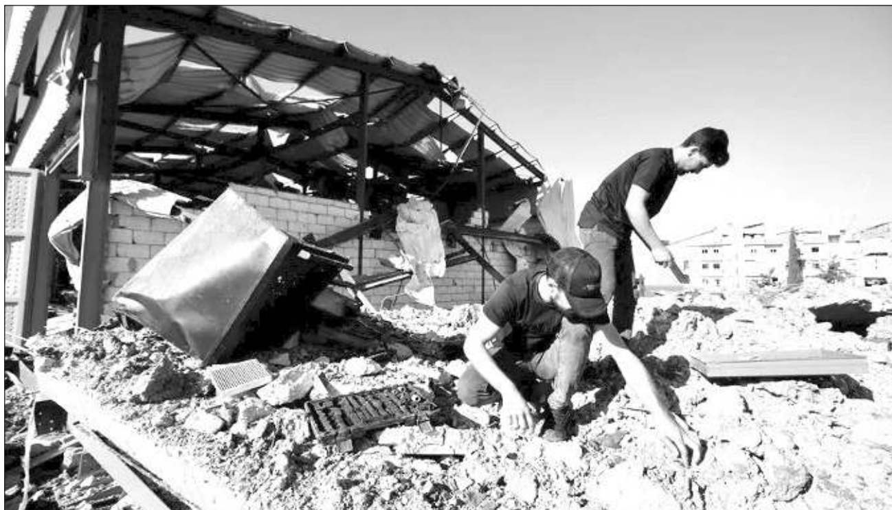
▲ Israel comenzó a bombardear intensamente el lunes los bastiones meridionales y orientales del grupo chií libanés Hezbolá. La serie de ataques ha dejado un número de víctimas sin precedentes desde la guerra civil libanesa.

“Sabemos que cuando hay un gran número de desplazados siempre hay propagación de enfermedades”