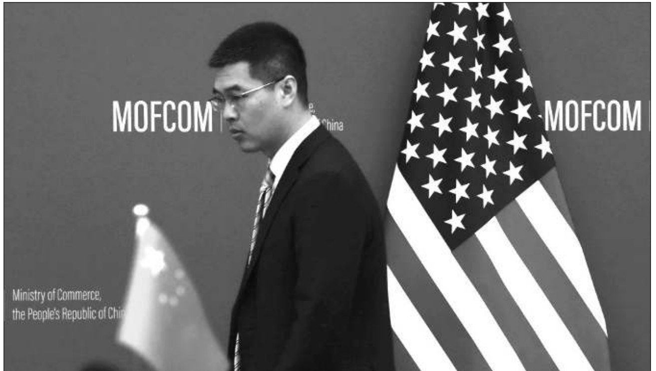
▲ El Ministerio de Comercio de China señaló que la medida de Estados Unidos son "sanciones unilaterales típicas" que alterarán los órdenes y las reglas comerciales globales y afectarán la estabilidad de cadenas industriales y de suministro en el mundo.

En su comunicado, el Ministerio de Comercio de China se opuso firmemente a que Estados Unidos incluyera varias empresas chinas en su lista de control de exportaciones. La medida prohíbe a dichas empresas comerciar con empresas estadounidenses sin obtener una licencia especial que es casi imposible de obtener.