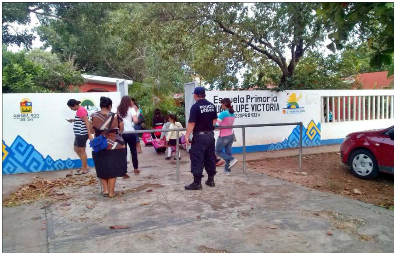
▲ El gobierno de Mara Lezama Espinosa ha destinado una inversión histórica para entregar 246 mil 397 útiles escolares, así como 224 mil 524 uniformes y mochilas, en apoyo a la economía familiar.

No está permitido condicionar un servicio o trámite educativo a cambio del pago de una cuota