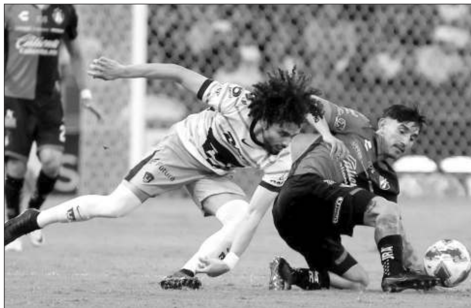
▲ Los Pumas tropezaron 2-1 ante Atlas y perdieron el invicto. El equipo de Jalisco suma tres victorias.

Luego de varios ajustes del brasileño Renato Paiva desde el banquillo, el Toluca recuperó la confianza en el complemento y la ventaja en el marcador. Todo ello