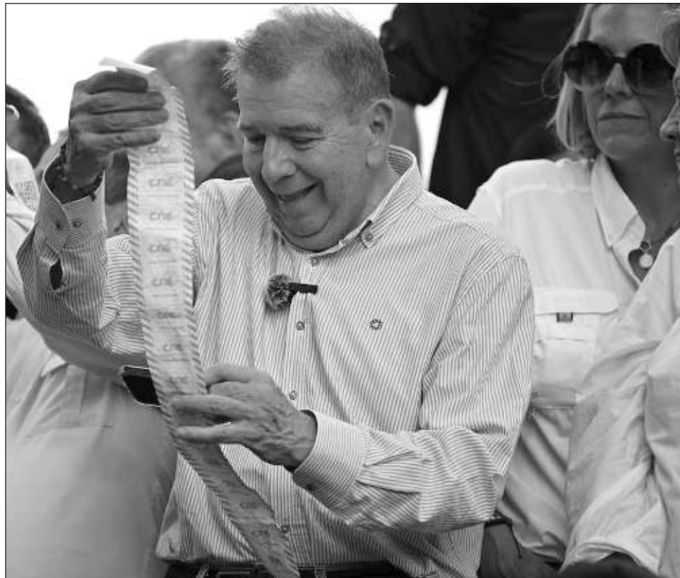
▲ La oposición denunció fraude y asegura que su González Urrutia ganó con 67% de los sufragios, según las copias de actas que divulgó en la web. El chavismo asegura que son “forjadas”.

Ante un recurso introducido por Maduro, el Tribunal Supremo de Justicia (TSJ) convalidó el jueves los resultados y acusó de “desacato” a González Urrutia