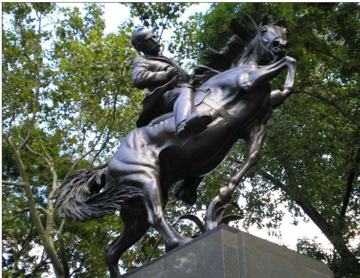
▲ “En esa necesaria unidad entre oprimidos, donde la concepción y el contacto con la clase obrera que desarrolló y vivió Martí resalta al delinear el proyecto de emancipación que defendería y que hoy marca parte de la realidad cubana”.

En el ensayo Mella inicia exponiendo las razones por las que