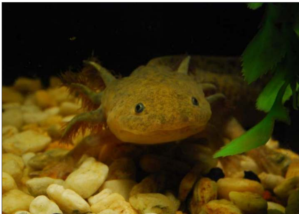
▲ “Las especies mexicanas son una excelente fuente para hacer investigación en términos de conservación, metamorfosis y regeneración”, destaca el experto.

Sobre la regeneración, el investigador recordó que el ajolote “es capaz de regenerar todas las extremidades”.