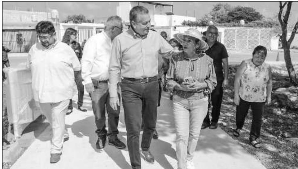
▲ Las vecinas agradecieron al ayuntamiento por la construcción y rehabilitación de los parques de la ciudad, sobre todo por realizar estas obras en conjunto con la sociedad.

"La mejor Mérida la hacemos todos los días trabajando en la infraestructura urbana, llevando los servicios públicos a todos los puntos de la ciudad y comisarías", afirmó el presidente municipal durante la supervisión del avance de uno de los parques que forman parte de las 19 obras ganadoras del concurso Diseña tu Ciudad , donde las y los ciudadanos eligieron los