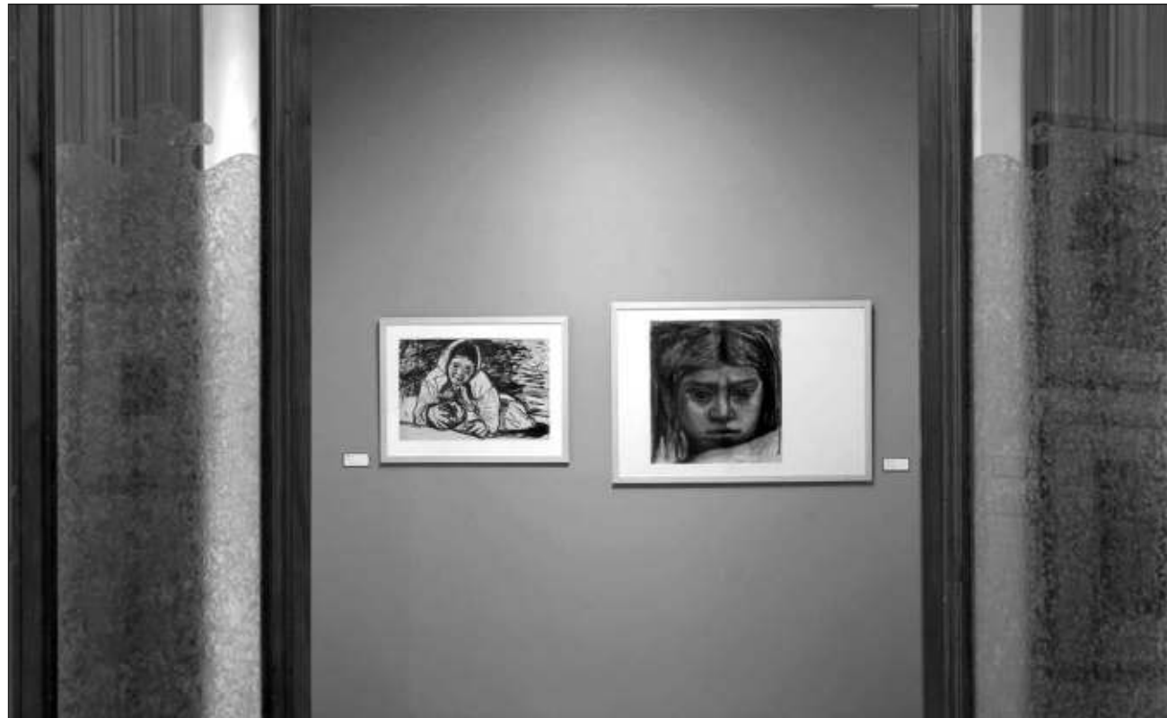
▲ La exposición Mexiac: Legado de libertad se puede visitar de martes a domingo de 10 a 18 horas en el Munal (Tacuba 8, colonia Centro) y en el Munae (Hidalgo 39, colonia Centro), hasta el 16 de febrero de 2025.

Durante la inauguración en el Munal, el director del museo, Héctor Palhares, no