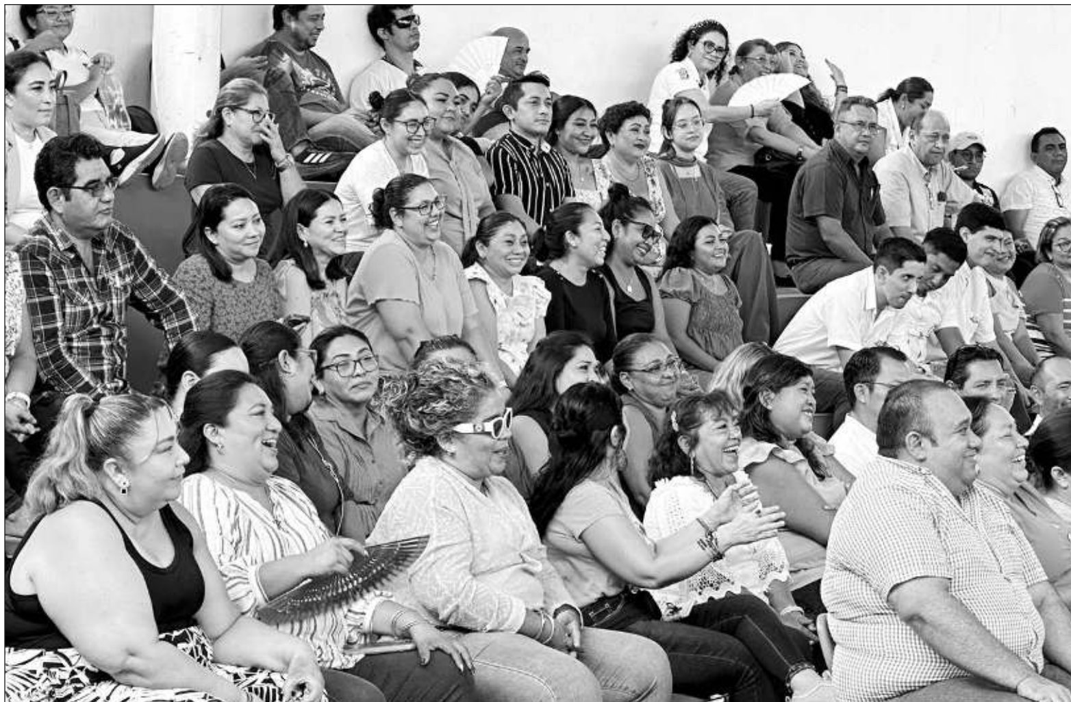
▲ “La semana pasada, tuve la oportunidad de compartir con 120 maestros de primaria de la zona 15 de Mérida y con los de la secundaria Cuahtémoc de Pustunich, comisaría de Ticul, reflexiones y cucharadas de preguntas, preocupaciones, empatía, porras y mucha esperanza”.