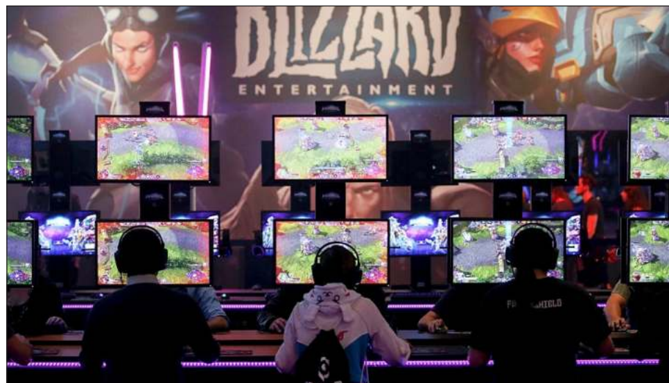
▲ "Es una forma de entretenimiento formal, hay torneos, hay estadios (...) antes se hacían videojuegos de las películas, ahora se hacen películas de los videojuegos", destaca el director de análisis de The CIU.

Según los reportes de Newzoo, en los últimos 11 años la única ocasión en que las ganancias que genera el mundo de los videojuegos