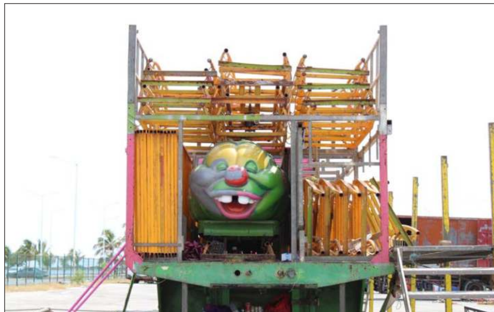
▲ El empresario que este año levantó la mano para administrar las ferias estaba cobrando a los pequeños comerciantes 105 mil pesos por el espacio de 30 metros lineales.

Al dialogar con él -por que no quiso decir su nom-