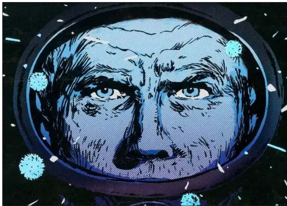
▲ El mensaje para clases trabajadoras que presenta la novela gráfica publicada en su primera versión en la revista Hora Cero Semanal entre 1957 y 1959, y su crítica al sistema político argentino, le valieron a Héctor Germán Oesterheld ser secuestrado por las fuerzas armadas el 27 de abril de 1977. Foto Facsímil

Además desaparecieron y asesinaron a sus cuatro hijas -dos de ellas embarazadas-