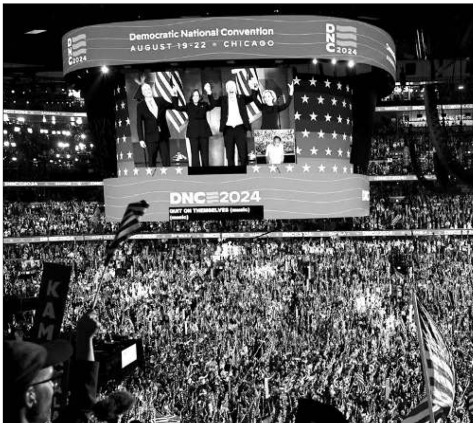
▲ La campaña de Harris parece haber animado tanto a los grandes como a los pequeños donantes, lo que supone un cambio de rumbo respecto al período de incertidumbre.

La campaña de Harris parece haber animado tanto a los grandes como a los pequeños donantes, lo que supone un cambio de rumbo respecto al período de incertidumbre que siguió a la desastrosa actuación de Biden en el debate de junio contra Trump.