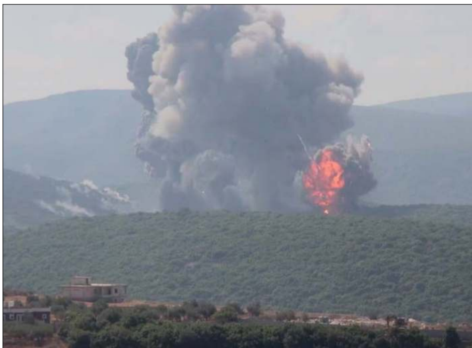
▲ Los acontecimientos se produjeron después de que Israel y el grupo militante libanés Hezbollah intercambiaran intensos disparos a primera hora del domingo.

Las tropas ucranianas lanzaron el 6 de agosto una gran ofensiva en esta región.