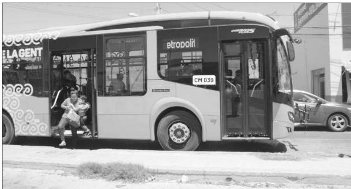
▲ "Información de calidad, foros adecuados de deliberación y debate, procedimientos y estrategias de negociación son insumos imprescindibles en el largo camino que va de los diagnósticos a la instrumentación y finalmente a la evaluación".

CUESTIONES TAN RELEVANTES como la salud, la educación, el transporte, la vivienda, el medio ambiente, la violencia de género,