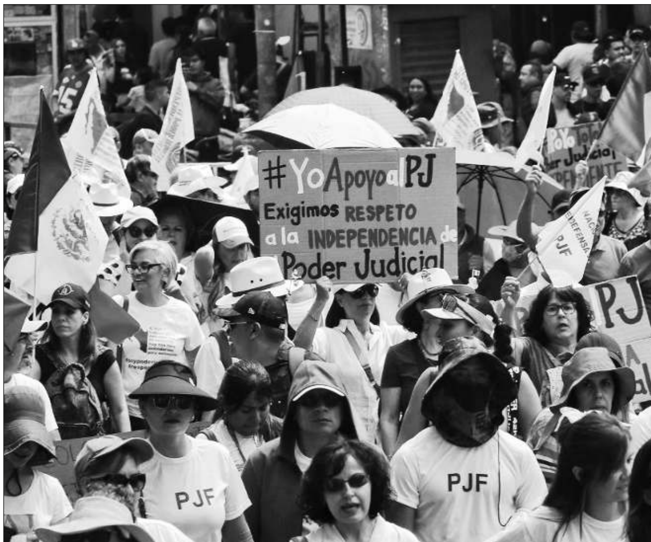
▲ Participantes en la marcha de este domingo en contra de la iniciativa de reforma al PJF se mostraron alerta ante la futura determinación, entre ellos José Ángel Gurría, ex secretario de Hacienda y de Relaciones Exteriores.

"En los próximos días, el Tribunal Electoral del Poder Judicial de la Federación tendrá en sus manos el futuro del Estado mexicano. Hagamos un llamado a los magistrados de la Sala Superior para que mantengan la democracia y las libertades en México", expresó.