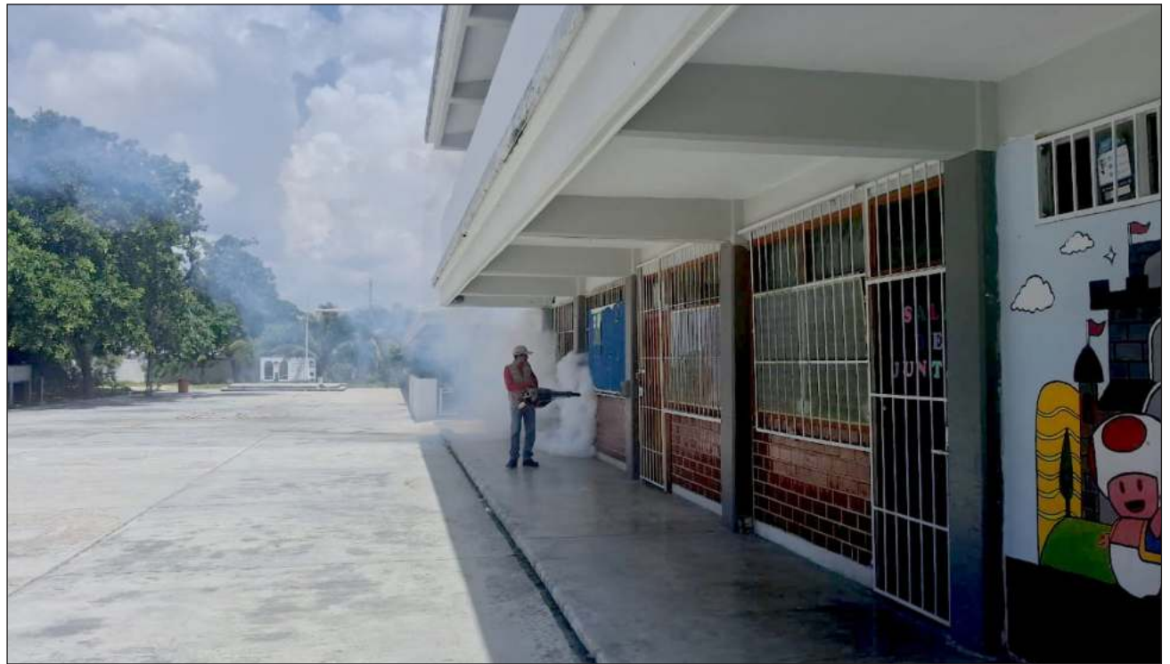
▲ El secretario de Salud señaló que las actividades preventivas a nivel estatal se movilizaron aproximadamente 400 trabajadores provistos con vehículos, máquinas pesadas ULV, máquinas térmicas, motomochilas y bombas aspersoras.

Refirió que las actividades contra el dengue, en espacios públicos y privados, incluyeron operativos de