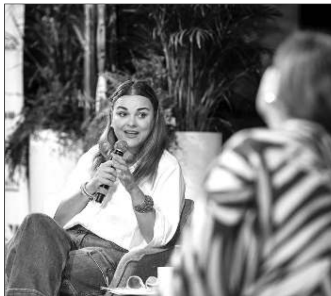
▲ Se les ha presentado como una novedad y hay grandes expectativas para que cumplan con el principal objetivo: una Mérida ordenada, moderna, verde.

Pero las credenciales tienen una particularidad cuando se trata de integrar cualquier equipo. Cuando se trata de un conjunto deportivo, casi siempre se presenta a los refuerzos indicando dónde jugaban antes y las estadísticas individuales de los nuevos jugadores, lo que siempre termina por generar grandes expectativas en la afición; ahora, al tratarse de un nivel de gobierno, es la ciudadanía la que espera novedades a su favor.