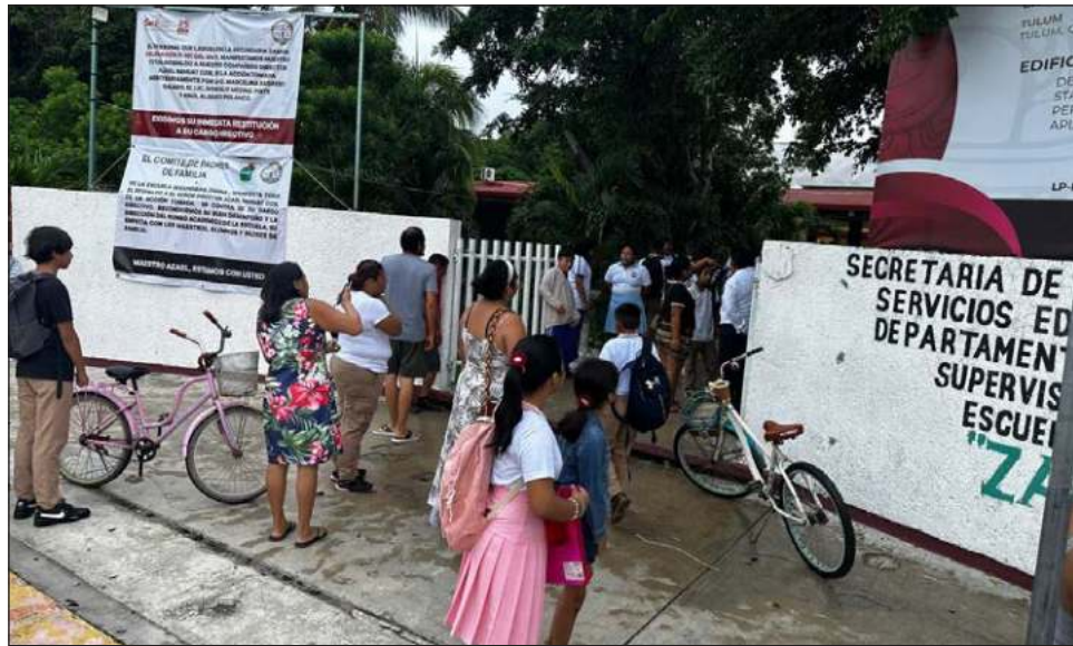
▲ La matrícula en el nivel básico del noveno municipio ya ha superado los 15 mil estudiantes, cifra que refleja la demanda educativa en este destino.

“La fecha límite para completar este trámite es el miércoles 28 de agosto, después de lo cual los padres de familia que no hayan