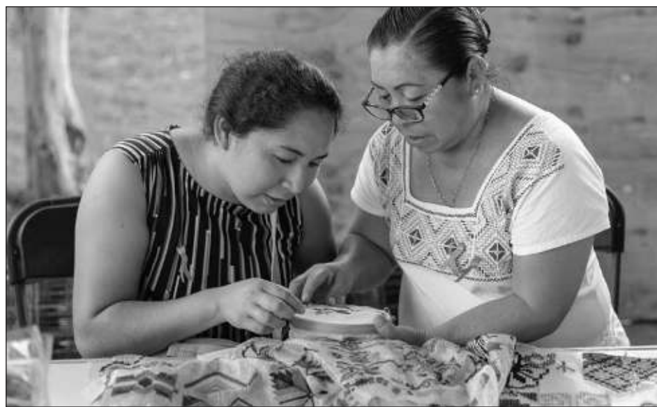
▲ Con la participación de más de 80 personas, el taller se llevó a cabo en la localidad de San Juan de Dios, que forma parte de la zona maya municipal.

A lo largo del curso, algunas personas presentaron piezas ya terminadas con los bordados aprendidos. En el taller de cinco horas por cada sesión a las parti-