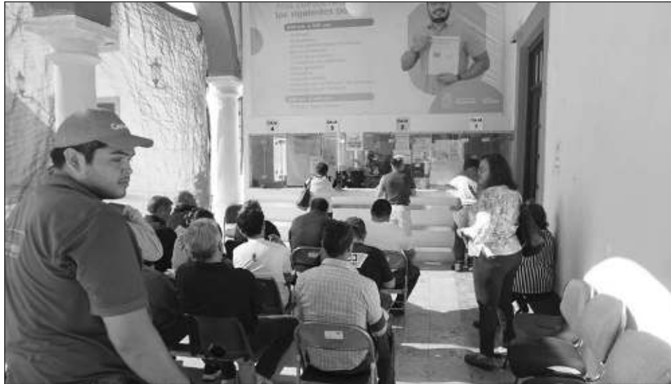
▲ La alcaldía de Campeche puso en marcha el programa Verano de Ahorros que abarca del 1 de julio al 30 de agosto, ofertando descuentos por recargos moratorios.

El funcionario recordó que, con el objetivo de apoyar a la ciudadanía a