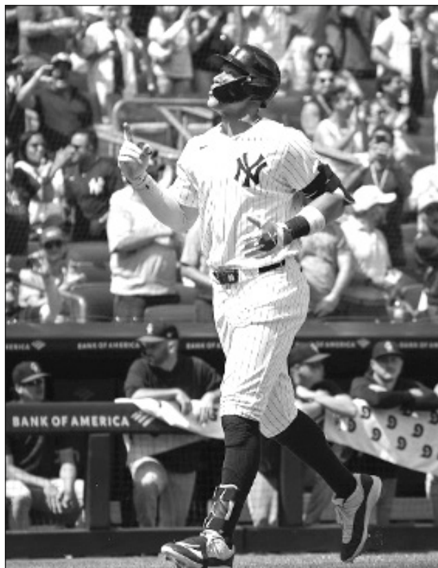
▲ Aaron Judge, tras batear su jonrón 50, ante las Rocas de Colorado, en el primer episodio en Yankee Stadium.

Después de irse sin cuádruple el sábado, Judge alcanzó los 50 cuando prendió un cambio de velocidad con cuenta de 0-2 de Austin Gomber (4-9) y colocó la pelota en el bulpén de Colorado, superando la barda del jardín izquierdo, con lo que puso en ventaja a los Mulos por 2-1. El estelar yanqui se unió a Babe Ruth, Mark McGwire, Sammy Sosa y Alex Rodríguez como los únicos jugadores con al menos tres campañas con 50 o más cuadrangulares. Ruth, McGwire y Sosa tienen cuatro, mientras que