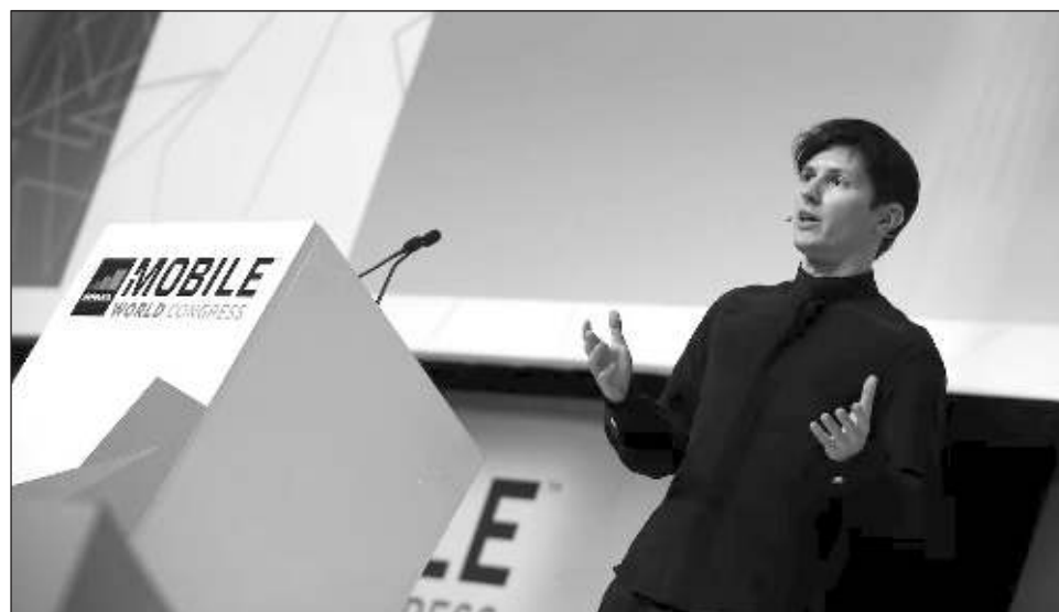
▲ Pavel Durov, ciudadano ruso y francés, fue detenido en el Aeropuerto Paris-Le Bourget el sábado en la tarde tras aterrizar desde Azerbaiyán, según las emisoras LCI y TF1.

La prensa francesa reportó que Durov, de 39 años, tenía una orden de arresto pendiente debido a acusaciones de que su plataforma ha sido usada para lavado de dinero, narcotráfico y otros delitos. Los reportes dijeron que la orden de arresto fue emitida por Francia a solicitud de una unidad especial del Ministerio del Interior a cargo de investigar crímenes contra menores, incluyendo explotación sexual on-line , como posesión y distribución de contenidos de abuso sexual infantil y de preparación de menores para ser abusados. No fue