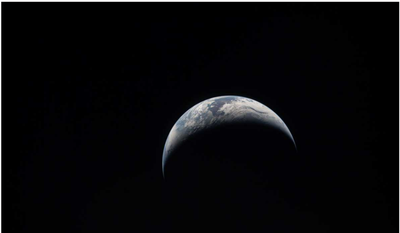
▲ “La iniciativa de ‘Un planeta, una salud’ no es ajena a las críticas. Entre otras, destaca la pregunta ¿cómo se va a financiar? También está el temor a una manipulación”.