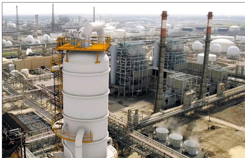
▲ Al menos en los tres o cuatro lustros venideros, los combustibles fósiles seguirán ocupando un lugar preponderante en el abasto energético y el transporte.

En suma, la adquisición de la totalidad de la refinería texana es una buena noticia por donde quiera que se le vea y cabe felicitarse por la decisión.