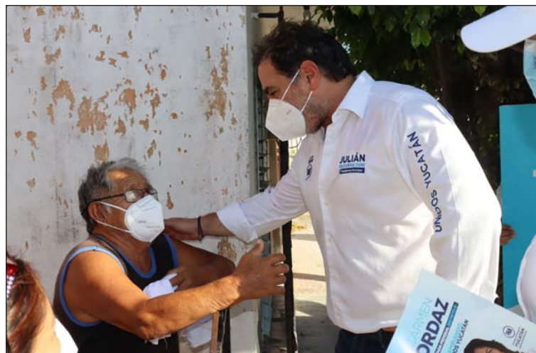
▲ El abanderado del Partido Acción Nacional por la presidencia municipal de Progreso respondió preguntas de la ciudadanía, durante debate.

En ese contexto y bajo un formato de máxima flexibilidad; es decir, que las y el candidato tuvieron un tiempo único de 9 minutos que pudieron agotar durante todo el debate con intervenciones de 1 minuto y medio a través de dos bloques; en el primero los aspirantes respondieron las pre-