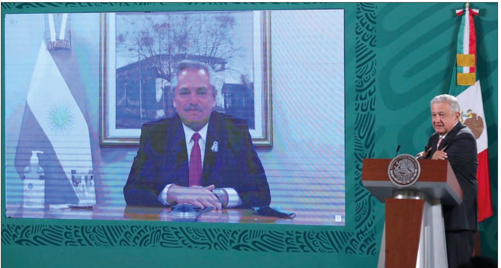
▲ Durante la conferencia mañanera, los presidentes de México y Argentina confirmaron su deseo de mantener la cooperación bilateral.

Por su parte, el presidente, López Obrador, expuso que en la primera semana de junio, "vamos a concluir la vacunación de 50 años en adelante, a todos los adultos mayores. Esto es muy importante porque si vacunamos a la población adulta se reduce hasta en 80 por ciento fallecimientos.