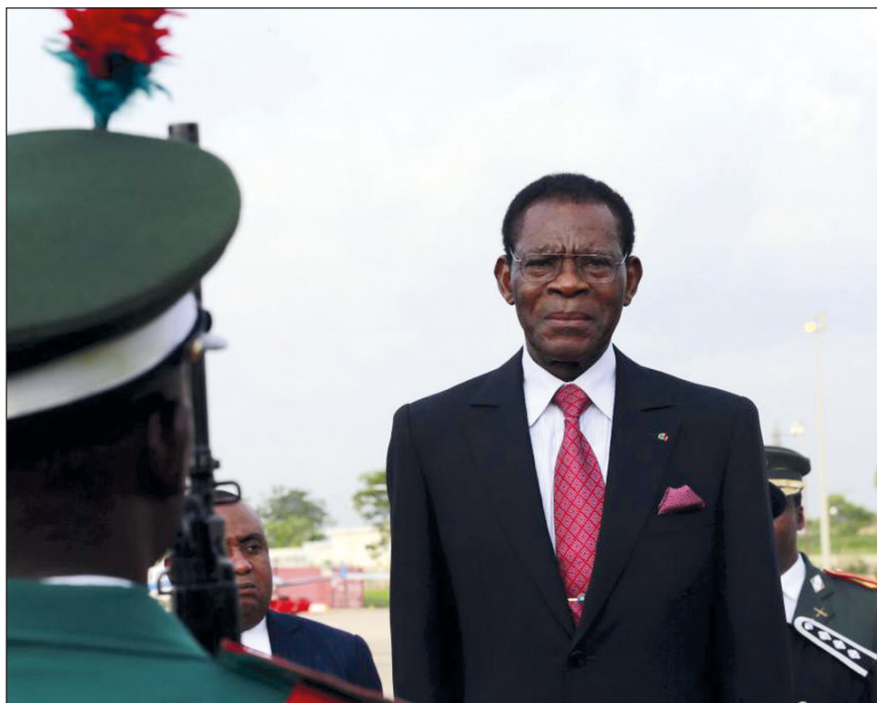
▲ El presidente más longevo del mundo se encuentra en Guinea Ecuatorial: Teodoro Obiang Nguema ha gobernado la nación africana por 42 años.

El Ejército asumió el poder y, saltándose el orden consti-