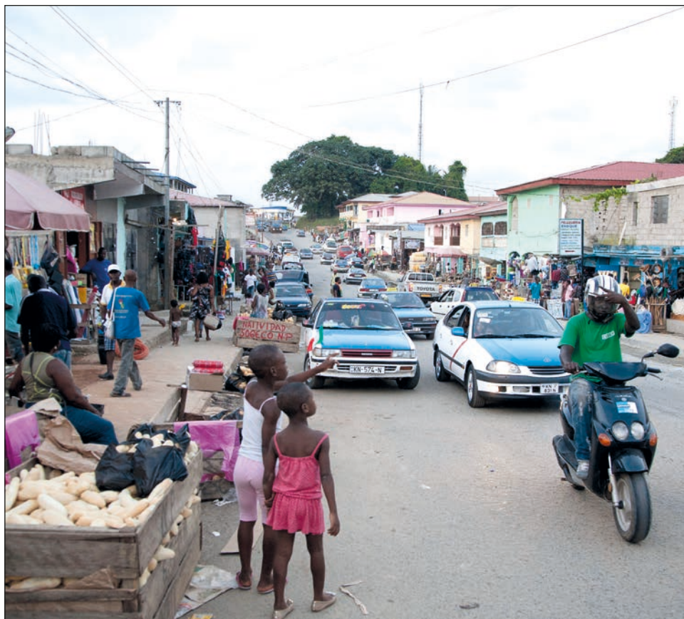
▲ Aunque la mayoría de los Estados en la zona se consideran democráticos, la representación popular en sus gobiernos es baja o nula.

Tampoco otro de los presidentes más veteranos de África ha designado por el momento un sucesor. Comandante del Frente Patriótico Ruandés (FPR) durante el final del genocidio de 1994, Paul Kagame gobierna Ruanda desde el 2000. Aunque ha asegurado que tiene intención de dejar el cargo en 2024, en las elecciones del 2012 también dijo que no buscaría un tercer mandato, para luego proceder a enmendar la Constitución mediante referéndum en 2015 y presentarse en las votaciones del 2017. Más joven que otros de los presidentes africanos -con 64 años-, tiene varios hijos jóvenes, por lo que por ahora no se ha especulado nacionalmente con un traspaso de padre a hijo.