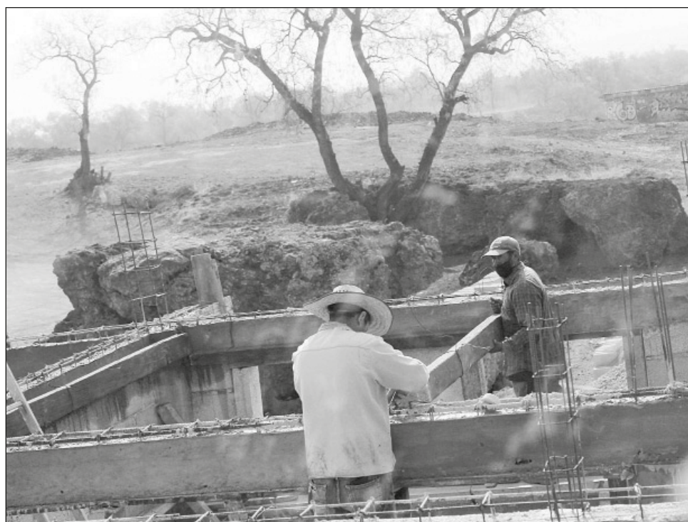
▲ Las obras se realizan en un predio de 7 ha en Oztoyahualco, en el ejido de Purificación.

En un comunicado, el organismo internacional dedicado a la conservación y protección del patrimonio cultura mun-