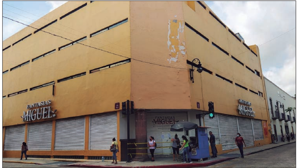
▲ Las labores de rescate en el local del centro duraron doce horas, según confirmó la Policía Municipal de Mérida.

Participaron paramédicos de la Cruz Roja y policías municipales.