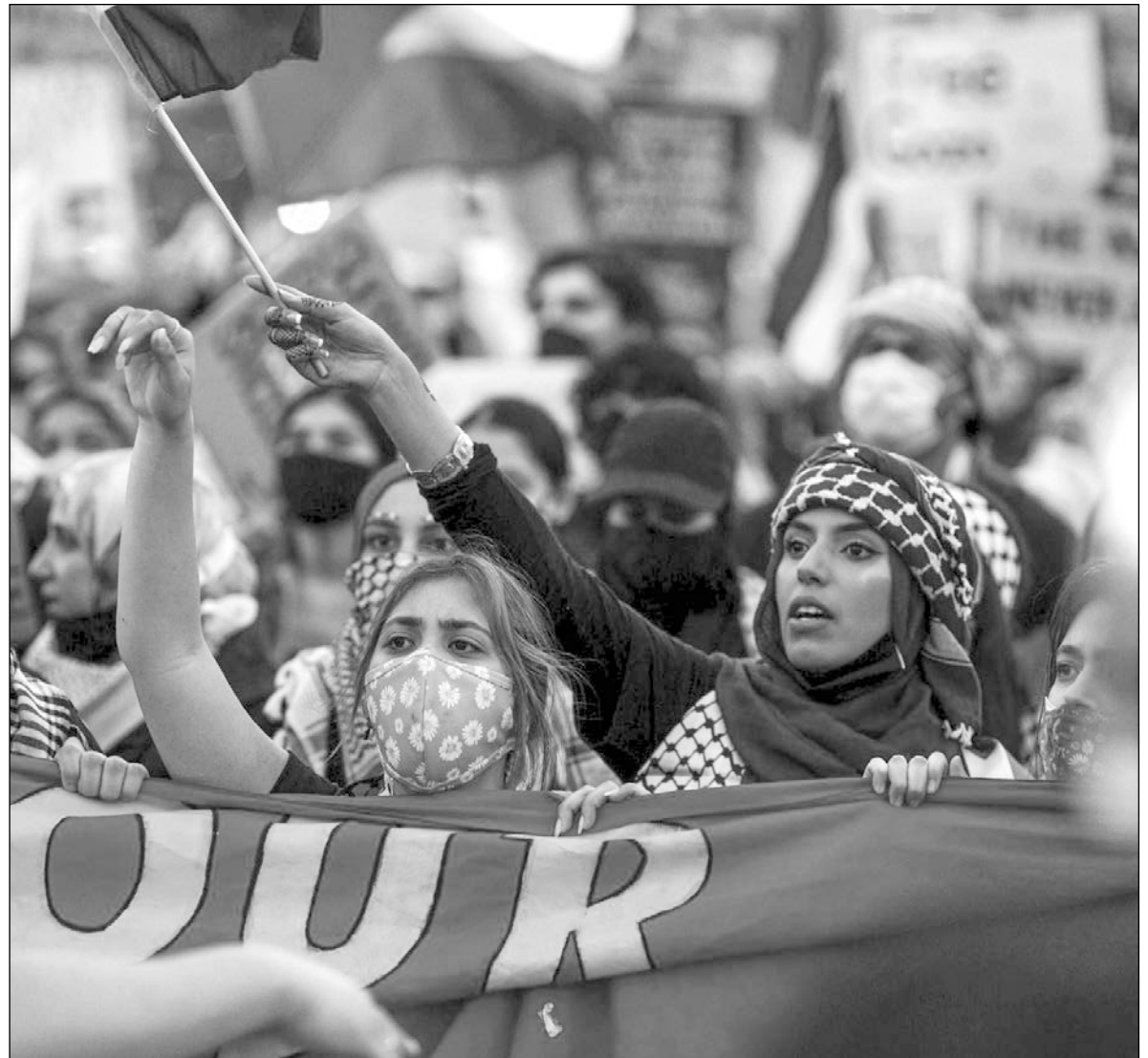
▲ Minorities do not represent the totality of a religion, nationality, or race. Rather, a vocal minority can hijack the dialogue and drown out the more moderate elements.

RATHER, MODERATES, BE they religious or not, must find ways to