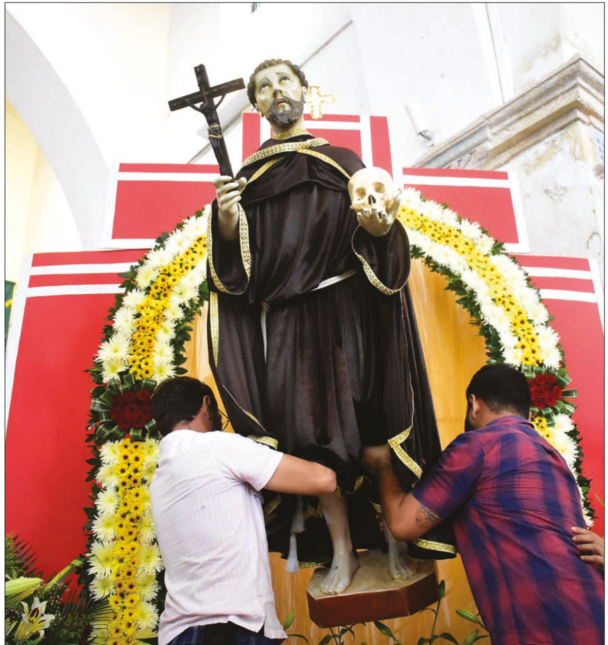
▲ Ermilo Abreu Gómez relata, con la fuerza y gracia de su singular estilo, pasajes de una experiencia virtuosa y compasiva.

Alceu Amoroso Lima, autor del prefacio de este libro, extiende los