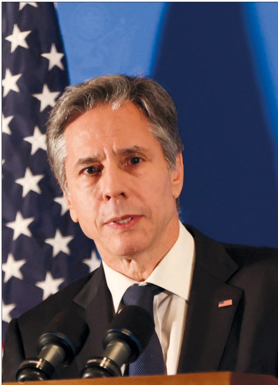
▲ Durante su visita a Jerusalén, Blinken prometió “movilizar apoyo internacional” para ayudar a reconstruir Gaza, fuertemente destruída por los bombardeos israelíes

Blinken, que habló tras reunirse con el primer ministro de Israel, Benjamin Netanyahu, dijo que Estados Unidos abordaría la “grave situación humanitaria” en el territorio costero, pero que también se aseguraría de que Hamas, el grupo que gobierna Gaza, no se beneficia de la ayuda a la reconstrucción.