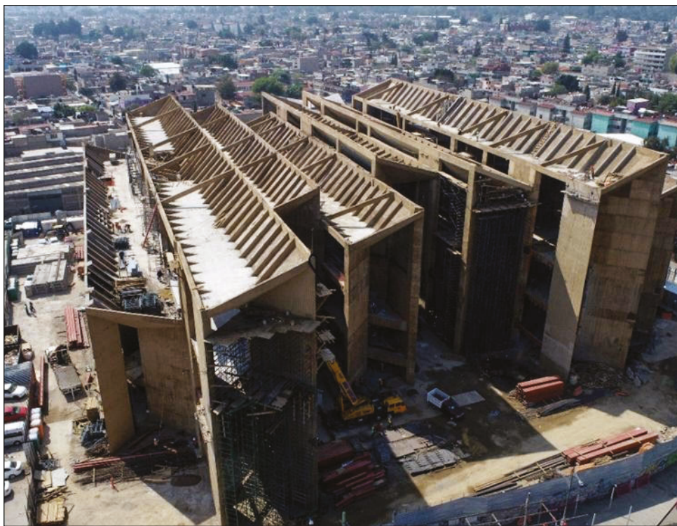
▲ El Museo Infantil y Juvenil Yancuic abrirá en septiembre, con una capacidad para recibir hasta 5 mil visitantes diarios de manera gratuita.

El vestíbulo, donde se encontraban colgadas las placas conmemorativas de las obras de teatro, se utilizará como un espacio más para actividades escénicas y como galería. Las placas se conservarán para posteriormente publicar una edición bibliográfica en las que se reúnan esos testimonios.