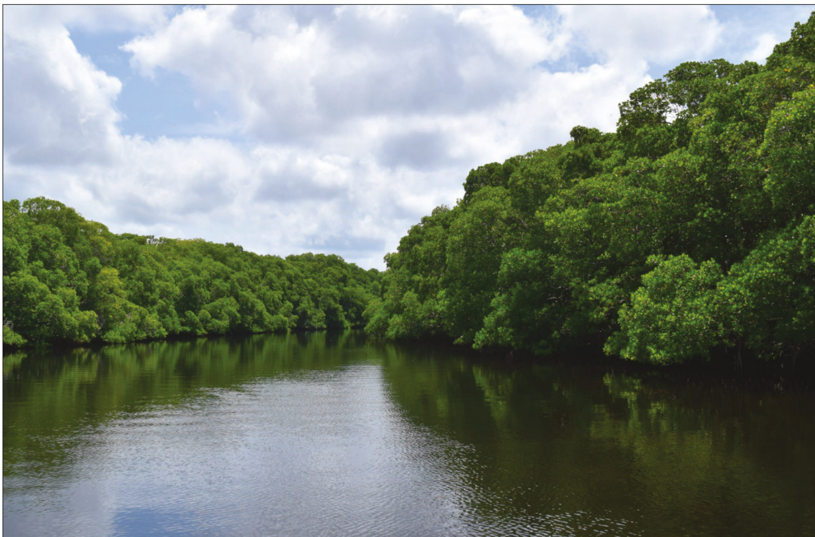
▲ Catemaco fue durante muchos años un lugar famoso por la tradición chamánica que abunda en la región, considerándolo la Meca de los brujos; sin embargo, lo maravilloso de ese lugar es la majestuosa laguna rodeada por la selva que alberga vida en abundancia.