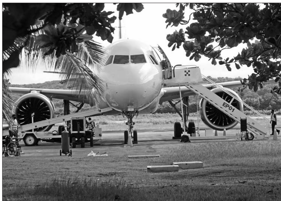
▲ La operación actual de aerolíneas no resultará afectada, pero no podrán incrementar rutas o frecuencias.

A la dependencia le tomó varias horas responder que independientemente del fallo de la FAA, “la AFAC reitera que está garantizada la seguridad y operación de los vuelos de aerolíneas nacionales hacia el vecino país”, la cuales “operan en la actualidad con altos niveles de seguridad y calidad en el servicio, equiparables a los estándares internacionales de cualquier línea que vuel-