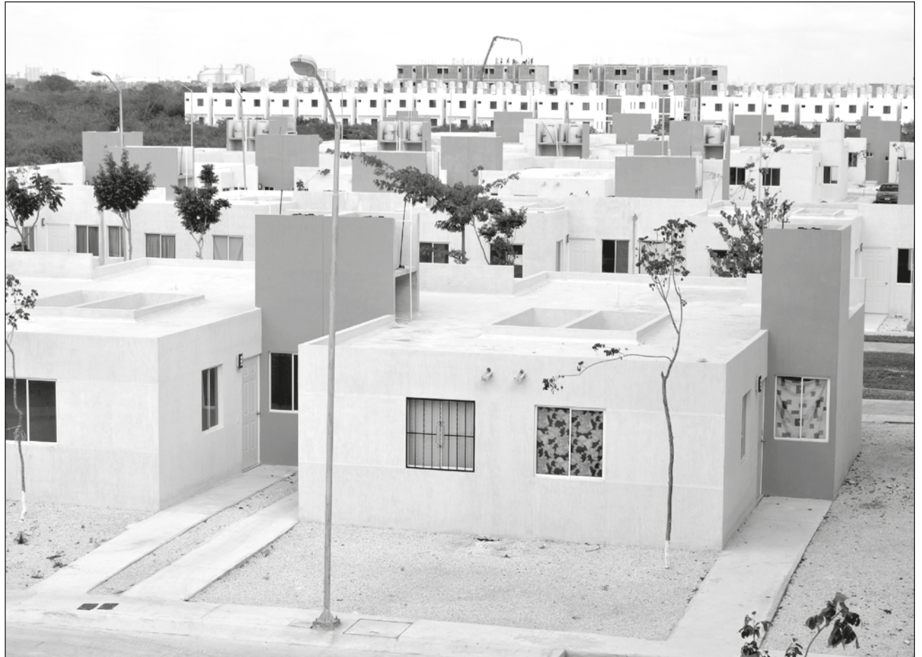
▲ Una casa que ocupa más del 70% del terreno, suprime el espacio para árboles.

La estructura de la ciudad, el diseño y morfología de los barrios, la poca concentración de vegetación y áreas verdes alrededor de los predios y el tipo de material de las casas, influyen en la concentración de calentamiento urbano que se genera en ciudades como Mérida.