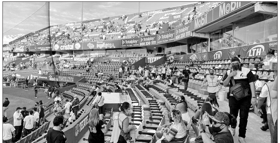
▲ Como lo hizo en los dos últimos juegos de pretemporada, la afición yucateca se hizo presente ayer en el parque Kukulcán para la jornada inaugural, en la que se enfrentaron Leones y Olmecas.

"Muy contento por debutar este año en @LigaMexBeis con @leonesdeyucatan, equipo que me acogió en mi llegada a México y me ayudó a crecer como beisbolista profesional", publicó Drake Twitter tras irse de 4-2, con cuadrangular, dos remolcadas y par