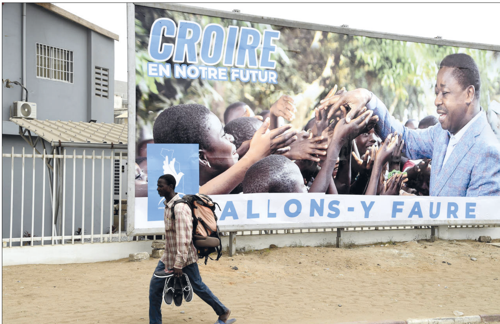
▲ Una de las razones por las que el poder se ha convertido en un insumo hereditario en África es la carencia de mecanismos oficiales que permitan la sucesión política ordenada en la mayoría de los países que conforman el continente.