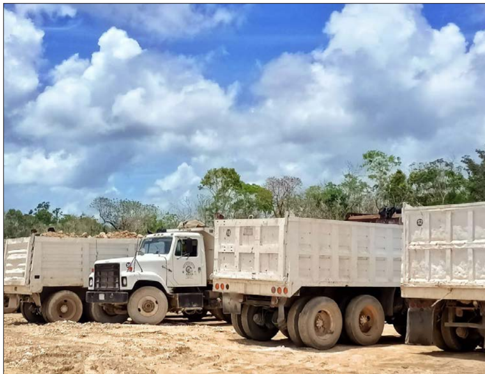
▲ Vigilancia sobre la piratería, tomar en cuenta a la gente local y respetar las tarifas, entre las solicitudes de los volqueteros.

Detalló que estos cuatro sindicatos cuentan entre 500 y 600 unidades concesionadas. Piden vigilancia sobre la operatividad de la piratería, tomar en cuenta a la gente local y respetar las tarifas.