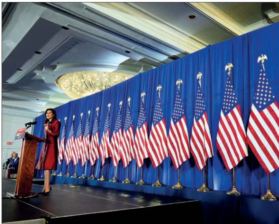
▲ “Seguiremos luchando por Estados Unidos y no descansaremos hasta que Estados Unidos gane”, señaló Haley a pesar de la presión para que abandone sus aspiraciones.

“Estoy agradecida de que hoy no sea el final de nuestra historia”, dijo Haley a sus partidarios el sábado. “Seguiremos luchando por Estados Unidos y no descansaremos hasta que Estados Unidos gane”.