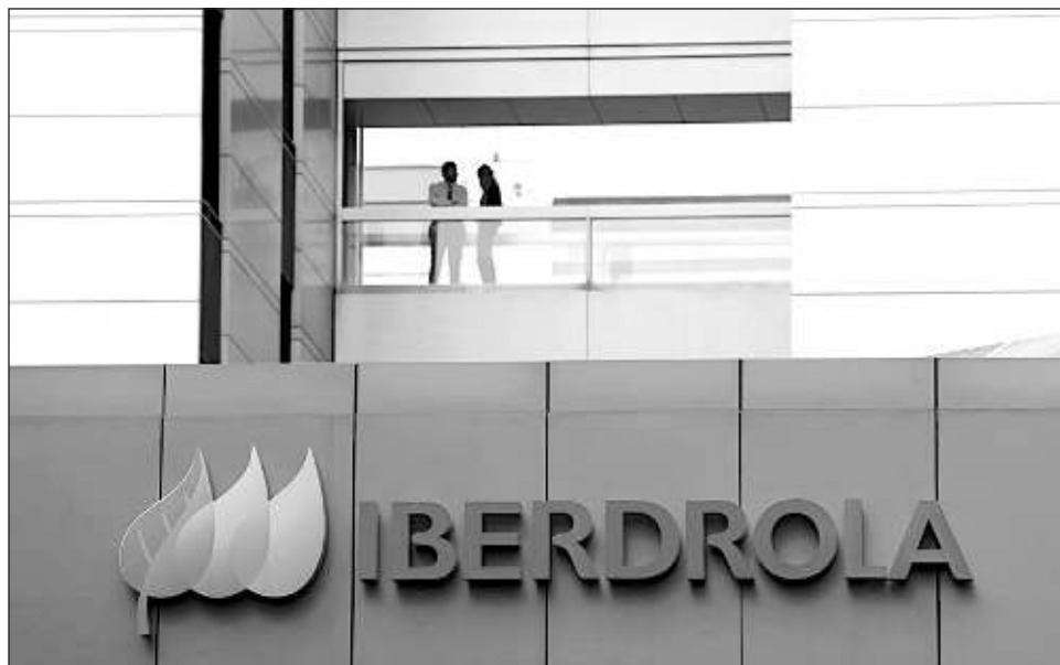
▲ La operación cuenta con el apoyo financiero del Fondo Nacional de Infraestructura de México (Fonadín) y otras entidades financieras públicas vinculadas al gobierno de México.

De acuerdo con la Secretaría de Hacienda, la transacción no presionará a las