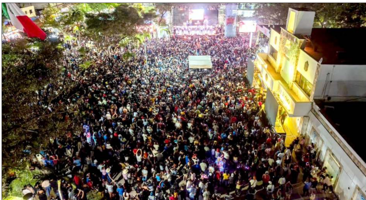
▲ El sábado, más de 7 mil personas bailaron con la música de la banda Tierra Sagrada.