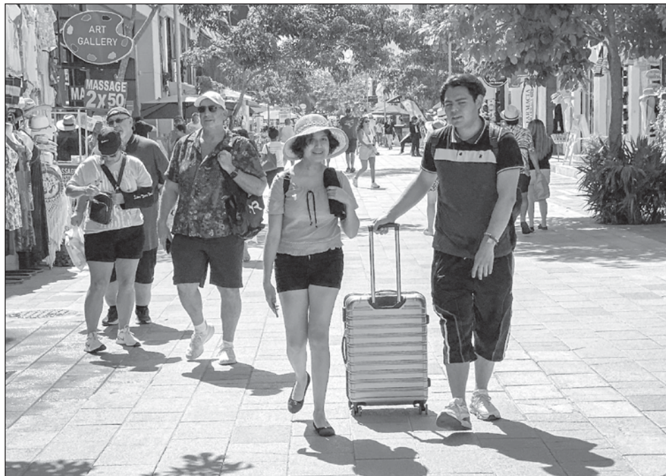
▲ Tras la pandemia y la ola de cancelaciones que hubo debido al virus, cada vez hay mayor confianza del turista, aunado a que muchas empresas ya ofrecen un seguro de viaje.

"Sigue cambiando esta forma de la reserva, que es reserva como muy inmediata, semanas antes, 15 días antes, tres días antes, pero las reservas de nuestros libros de hace un mes del sondeo que hicimos fue más o menos con 50 por ciento de los asociados y ya tenían valga la redundancia, 50 por ciento de reservas para Semana Santa, eso está muy