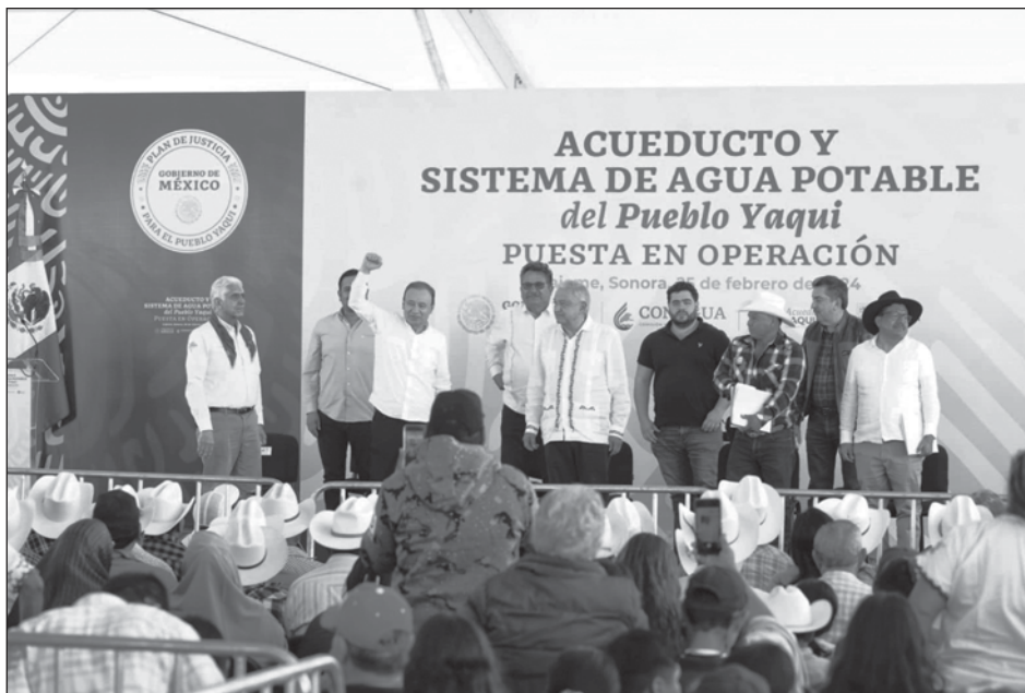
▲ El Plan de Justicia para el pueblo Yaqui dotará en marzo de agua potable a alrededor de 34 mil habitantes de 50 comunidades de esta nación.

“Voy a hablar con quien me sustituya para que no den ni un paso atrás, para que no se abandone lo que ya iniciamos en beneficio de los pueblos y comunidades yaquis y en beneficio de los pobres de México, de la gente humilde”, sostuvo unos 270 kilómetros de la capital, en la presa Álvaro Obregón, donde inicia el acueducto, cuyas obras de conexión a las comunidades yaquis aún están inconclusas.