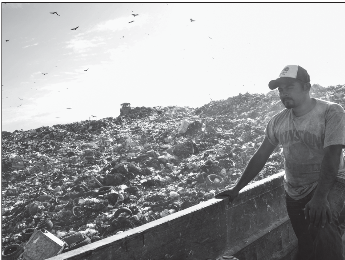
▲ "En Yucatán, el Observatorio de Gobernanza y Políticas Públicas (ORGA) está poniendo en marcha una iniciativa de participación pública inspirada en las conferencias de consenso".

DESDE 1987, EN su primera experiencia en Dinamarca, las conferencias de consenso se han convertido en un mecanismo usado en muchos países desarrollados, versando sobre políticas energéticas, contaminación del aire, agricultura sustentable, riesgos químicos para el ambiente, terapia génica, clonación, organismos genéticamente modificados,