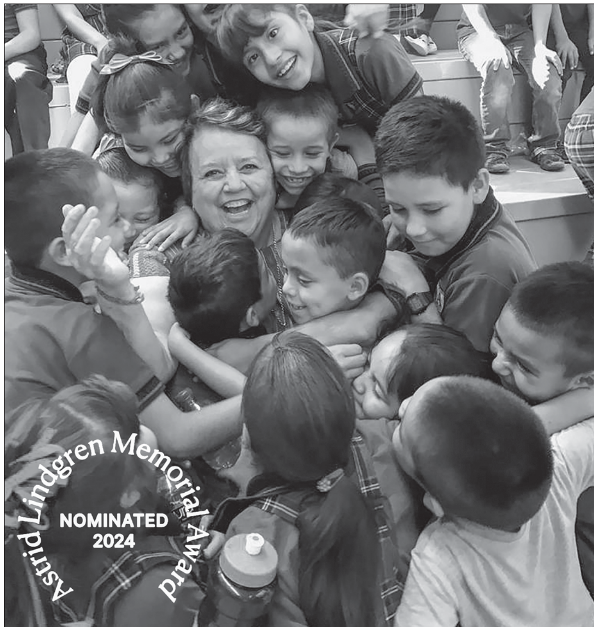
▲ “La nominación que alcancé es un premio en sí, lo otro, el plus. Me siento altamente honrada que las niñas yucatecas pueden ver a una de ellas diluir fronteras con su pasión, compasión y talento”.