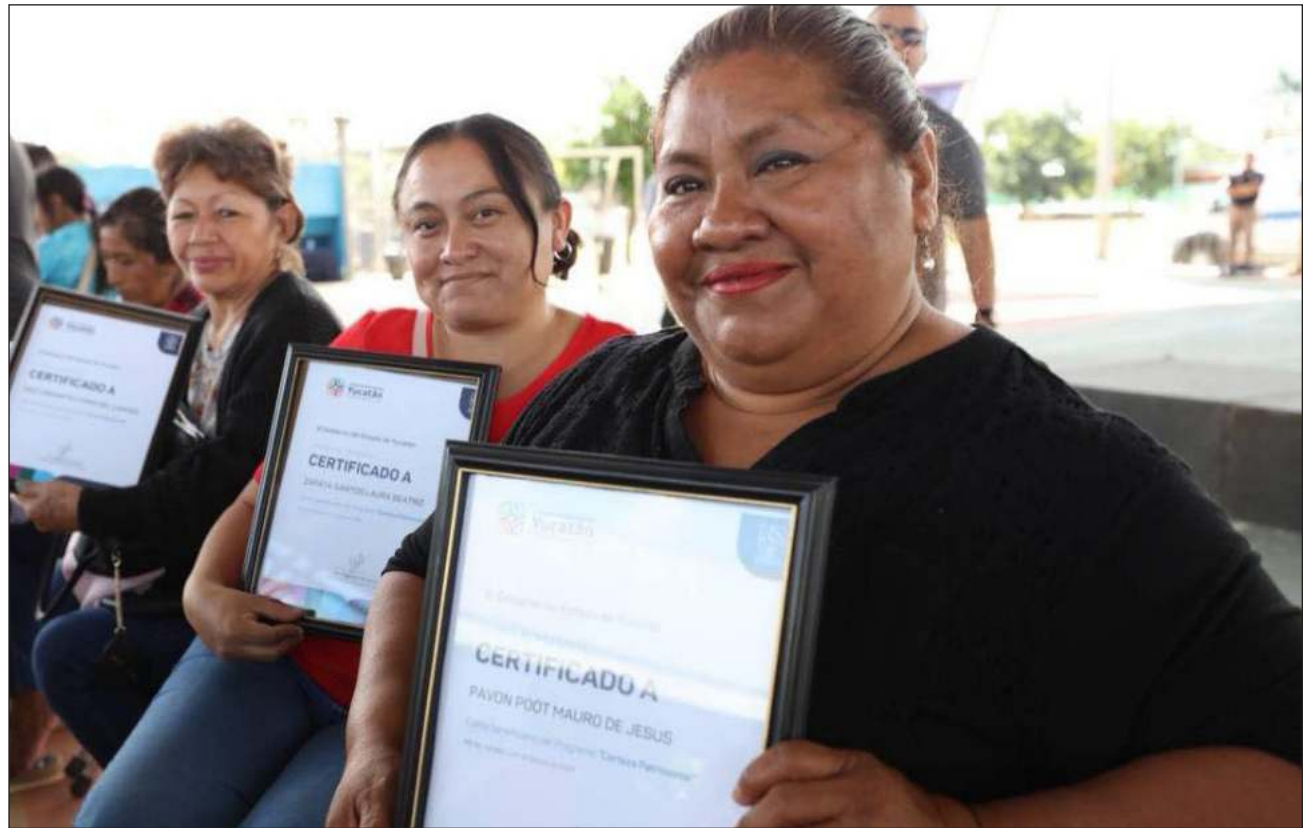
▲ El gobierno entregó los certificados del esquema Certeza Patrimonial a las familias que viven en los establecimientos Luzela, Roble Privada II y Asentamiento 330, de la colonia Roble Agrícola, y Emiliano 458, ubicado en la Emiliano Zapata Sur.