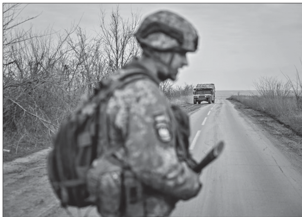
▲ "Decenas de miles de civiles" han sido asesinados en las zonas ocupadas de Ucrania, pero no habrá cifras exactas disponibles hasta que termine la guerra, declaró Zelensky.

Dijo que no divulgará las cifras de soldados heridos o capturados. Añadió que "decenas de miles de civiles" han sido asesinados en las zonas ocupadas de Ucrania, pero aclaró que no habrá cifras exactas disponibles