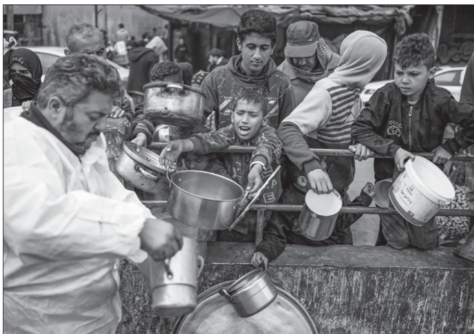
▲ Antes de que iniciaran los bombardeos de Israel contra los palestinos, entraban en la Franja unos 500 camiones con comida cada día, ahora este número raras veces supera los 200, a pesar de la necesidad acuciante de los habitantes de la Franja de Gaza.