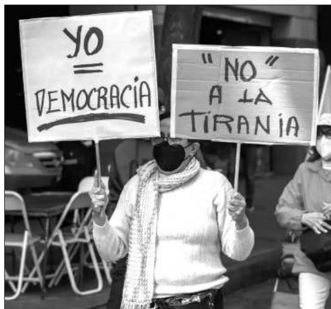
▲ Es incongruente que esta oposición, que defiende una concepción de democracia para los ilustrados, carezca en este momento de un proyecto realmente alternativo.

La manifestación de la "Marea rosa" el pasado 18 de febrero puede verse también como una señal de arranque de la campaña por parte de la oposición. Sin embargo, la capacidad de convocatoria no implica un voto a favor de Fuerza y Corazón por México . Ni siquiera puede decirse que se haya tratado de un acto electoral, pero sí uno en el que se expresó una posición conservadora en cuanto a lo que se entiende como democracia y derecho a la participación política.