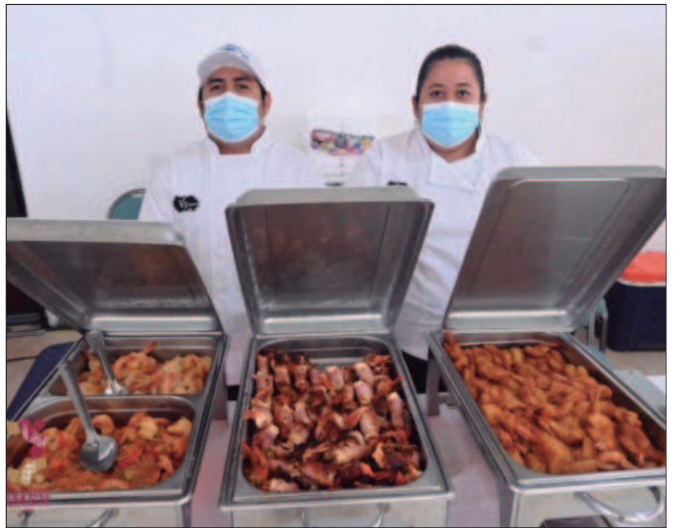
▲ Los expositores presentaron una diversidad de platillos, como camarones empanizados, al mojo de ajo, al arcoiris, al coco, al ajillo, en chilpachole, entre otros.

Por su parte, el presidente del CCE, Encarnación Cajún Úc, expuso que el crustáceo ha sido un ingrediente representativo de los platillos de la Isla, principalmente por su abundancia en la región.