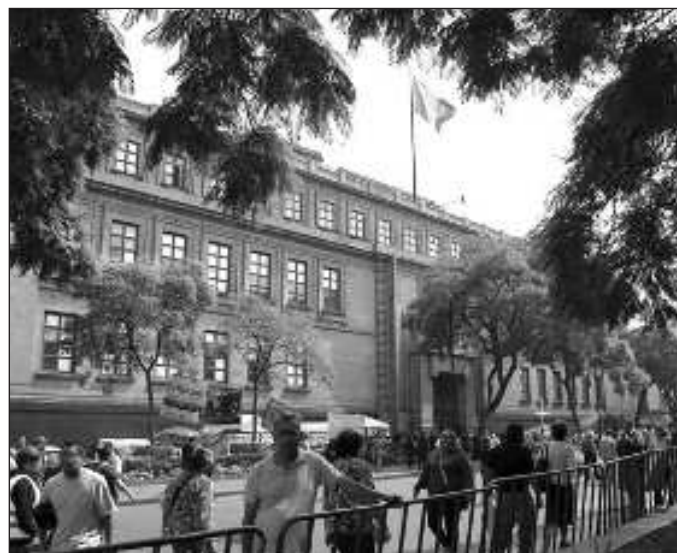
▲ Elegir democráticamente al Poder Judicial será un ejercicio sumamente demandante para la ciudadanía y por lo mismo es uno cuyos resultados deben ser lo más claros y beneficiosos.

Entonces, siendo realistas, es necesario escuchar al INE en lo que refiere a la necesidad de un presupuesto suficiente para llevar a cabo estos comicios,