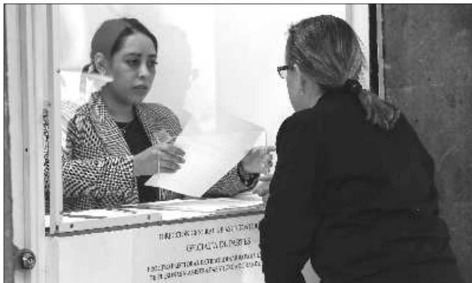
▲ El plazo para recibir registros venció este domingo a las 23:59 horas.

Durante un acto en el municipio de Álvaro Obregón, en Michoacán, para dar a conocer el programa Pensión Mujeres Bienestar , la mandataria detalló: “Me informó hace un rato el grupo que nombramos, de personas que van a ser parte de la comisión que va a seleccionar a quienes van a participar en la elección del Poder Judicial, que se han inscrito, solamente en la inscripción del Poder Ejecutivo, más de nueve mil jóvenes en todo el país que quieren ser jueces honestos; magistradas, ma-