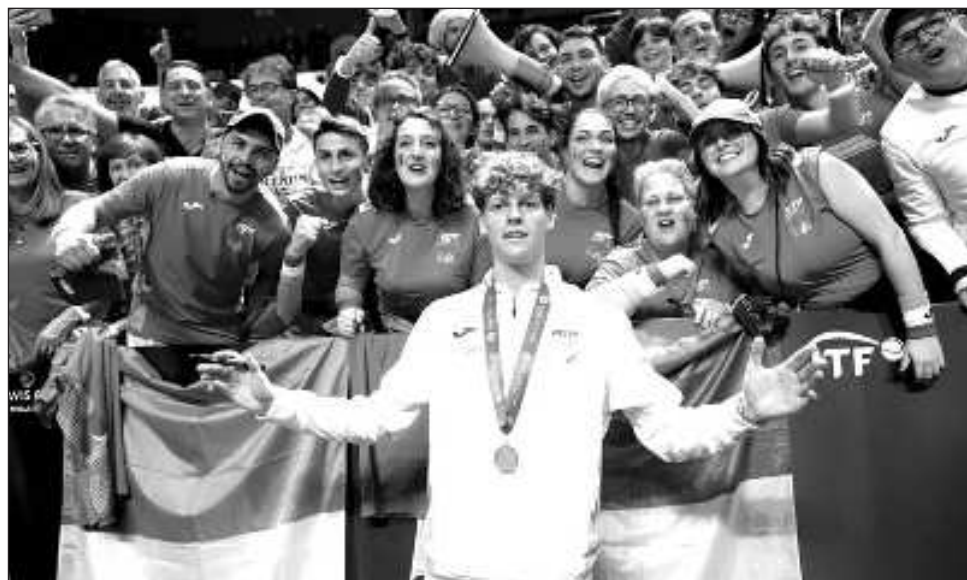
▲ Jannik Sinner, el número uno del mundo, con aficionados italianos en Málaga.

Los italianos, espoleados por un ruidoso contingente de aficionados que cantaban, tocaban tambores y retumbaron ruido con megáfonos entre la multitud de 9 mil 200, se convirtieron