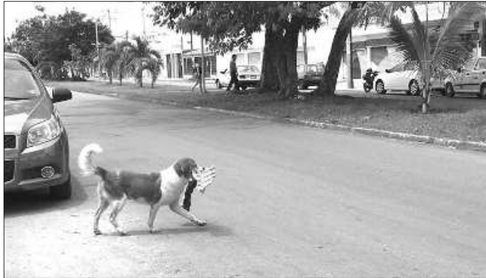
▲ Ofrecerán cena y subasta con causa pro animal en Puerto Morelos.