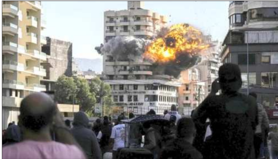
▲ Alrededor de 80% de las 44 mil 200 muertes verificadas en la franja sucedieron en edificios residenciales, según la agencia de la ONU para los refugiados en Palestina.

El ejército israelí emitió una nueva orden de evacuación forzosa para Jan Yunis (sur), porque las organizaciones terroristas están disparando nuevamente cohetes hacia el Estado de Israel desde su área, informó la cadena catari Al Jazeera.