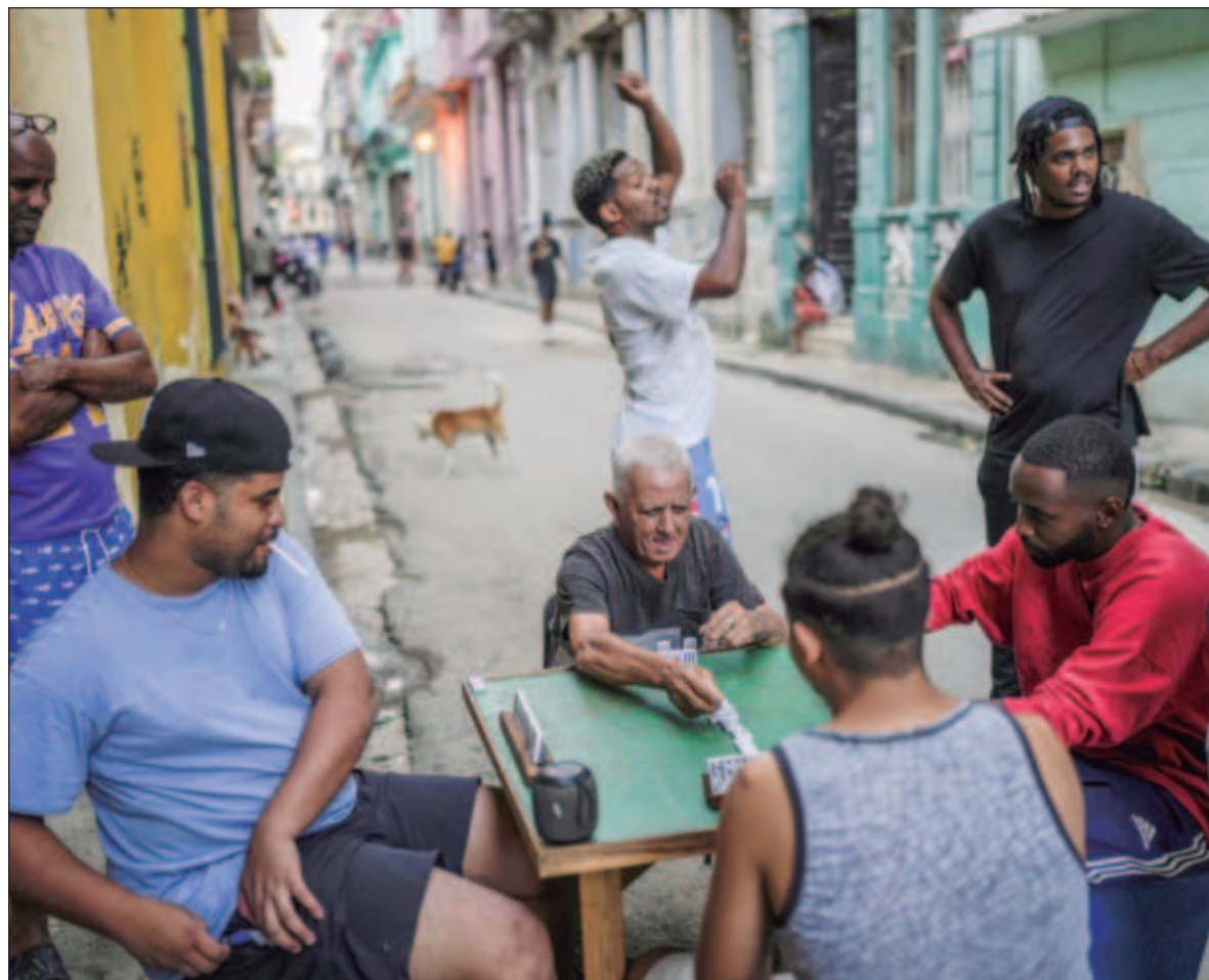
▲ “La Revolución cubana sigue en pie y se aproxima a la celebración de un nuevo aniversario victorioso en enero próximo. Sus aportes a la humanidad son indiscutibles, sin importar la continua campaña mediática contra ella”.

Hoy, el mundo está en una coyuntura muy peligrosa, la guerra entre Ucrania y Rusia va tomando tonos más dramáticos por los ata-