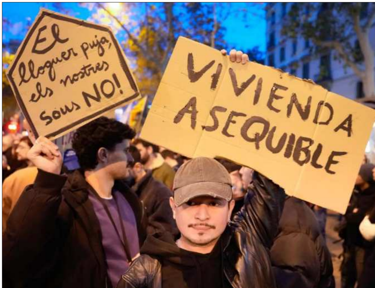
▲ En Barcelona, convocado por la plataforma Sindicato de Inquilinas y por otras organizaciones gremiales y sociales, se congregaron miles de personas con este reclamo, con la mirada puesta en que el movimiento se expanda a todo el territorio.

“No puede ser que los inversores lleguen a nuestras ciudades y jueguen con los pisos como en el Monopoly