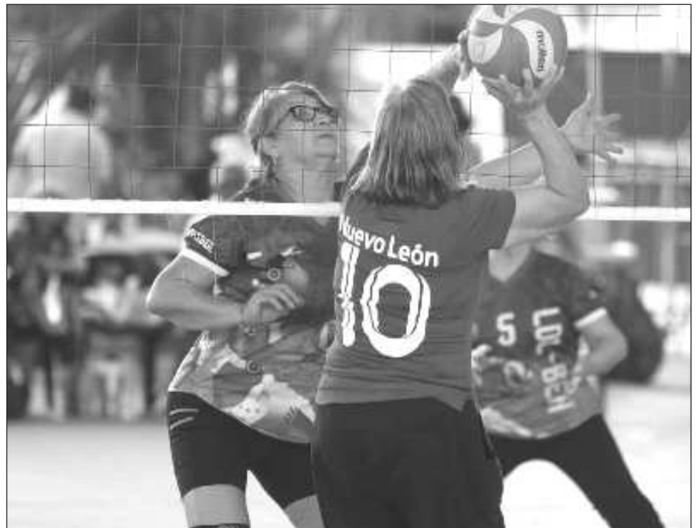
▲ El equipo Lol-Beh de Yucatán hizo el 2-3 en la categoría de 70 años y mayores.

Los estados participantes fueron Campeche, Ciudad de México, Chiapas, Coahuila, Estado de México, Guanajuato, Hidalgo, Nuevo León, Puebla, Quintana Roo, San Luis Potosí, Tabasco, Veracruz, Baja California, Oaxaca, Michoacán y Yucatán.