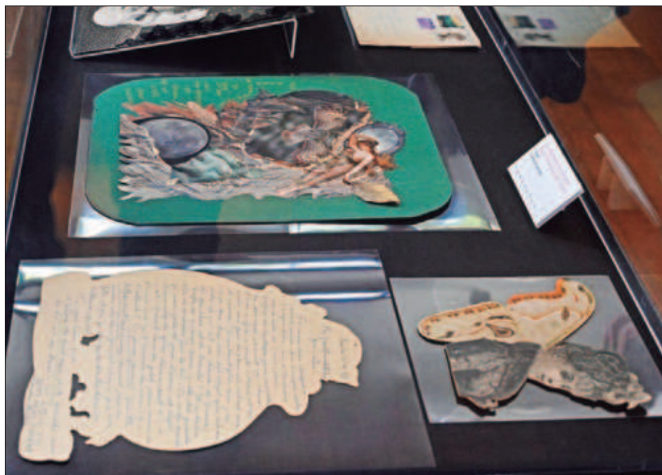
▲ La muestra Aube Breton: Una estancia surrealista se puede visitar de martes a domingo de 10 a 17:30 horas en el Museo Casa Estudio Diego Rivera, en la alcaldía Álvaro Obregón.

“Es un juego de contrastes, un universo onírico que invita a explorar lo que yace detrás de lo visible”, explicó Krebs, refiriéndose a los collages de Aube Elléouët, donde papeles gofrados, cromos, conchas y bolas de cristal se combinan con ligereza y humor particulares.