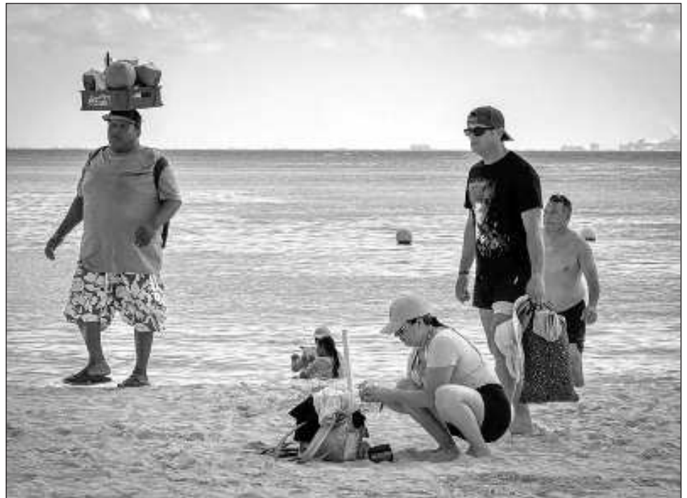
▲ En cuanto al movimiento total de turistas, el STARC apuntó que se espera en el país un total de 43 millones de turistas; en Q. Roo llegarán poco más de 10 millones.

Asimismo, dijo que Tulum se colocó ya como el décimo aeropuerto con más