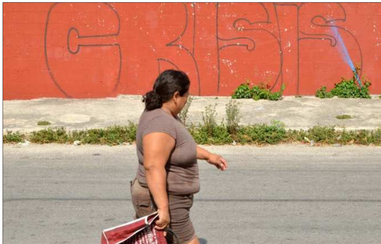
▲ Durante los primeros nueve meses del año en curso, Quintana Roo registró 554 violaciones contra mujeres.

La violencia contra las mujeres y las niñas sigue siendo una de las violaciones de los derechos humanos más extendidas y generalizadas del mundo. Se calcula que, a nivel global, casi una de cada tres mujeres han sido víctimas de violencia física y/o sexual al