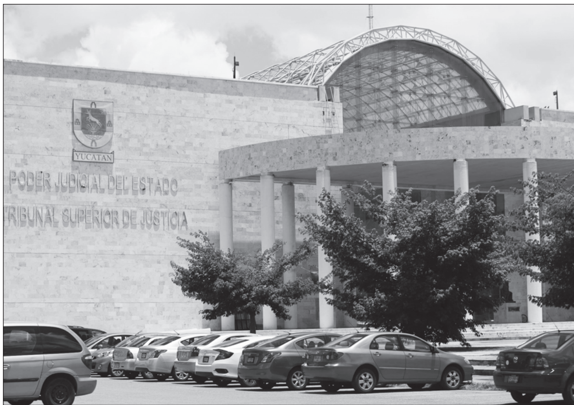
▲ "Es necesario fomentar la participación de la ciudadanía que funge como funcionaria de casilla, los antecedentes indican que el día de la jornada electoral no llegan todas las personas funcionarias".

3) RESULTADOS Y declaraciones de validez de las elecciones: inicia con la remisión de la documentación y expedientes electorales a los consejos distritales y concluye con los cómputos y declaraciones que realicen los consejos del Instituto, o las resoluciones que, en su caso, emita en última instancia el Tribunal Electoral.