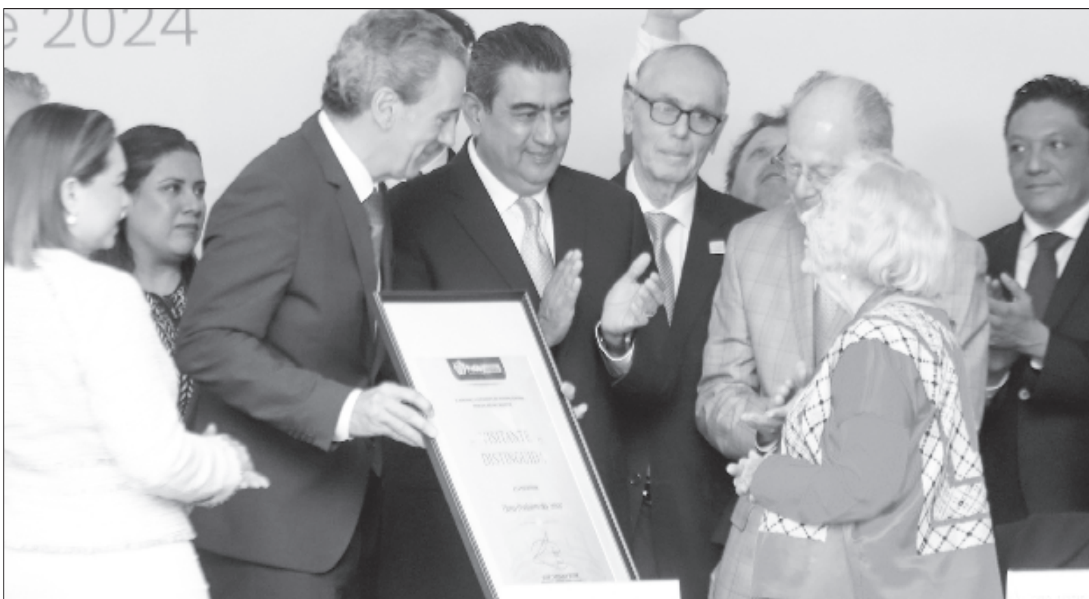
▲ “Al director del Instituto Nacional de Astrofísica Óptica y Electrónica, Guillermo Haro Barraza, le daría un sentimiento especial de agradecimiento y de alegría esta presea que ustedes me conceden, porque él, astrónomo, amó a Tonantzintla y a Puebla como a su vida”, señaló Elena.

Hoy, 20 de noviembre de 2024, resulta emocionante recordar el 114 aniversario de la Revolución Mexicana y encontrarnos en esta mañana en la Puebla de los Ángeles, en cuyo zócalo y bajo cuyos faroles los amigos de Guillermo Haro paseamos tantos viernes y sábados, así como nos abrían la puerta de la maravillosa capilla de Santa María Tonantzintla, cuyos ángeles han sabido cubrir con sus alas la cabeza de hombres y mujeres leales al conocimiento humano.