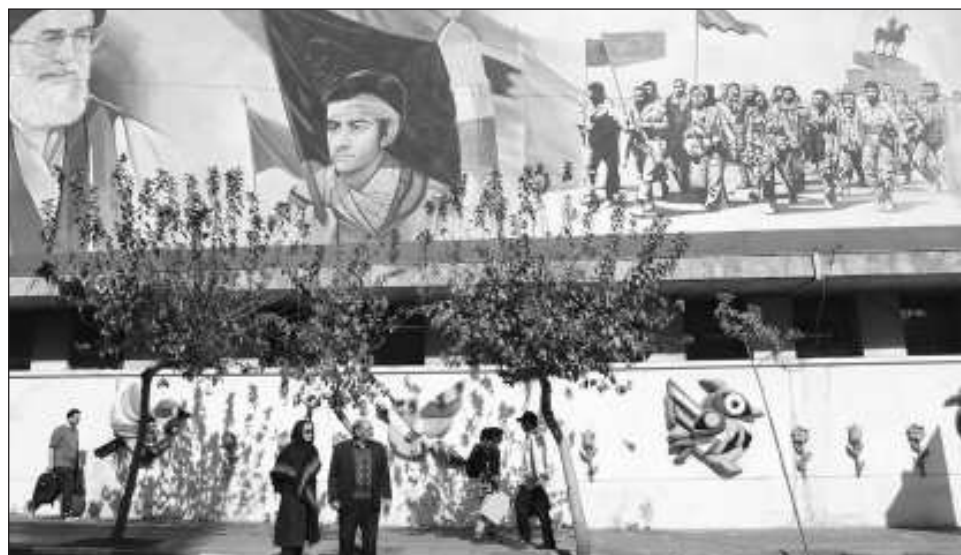
▲ Teherán anunció que pondrá en marcha una serie de "nuevas centrifugadoras avanzadas" para su programa nuclear. Varios países denuncian que están acumulando importantes cantidades de uranio.

Irán defiende su derecho a desarrollar la energía nuclear