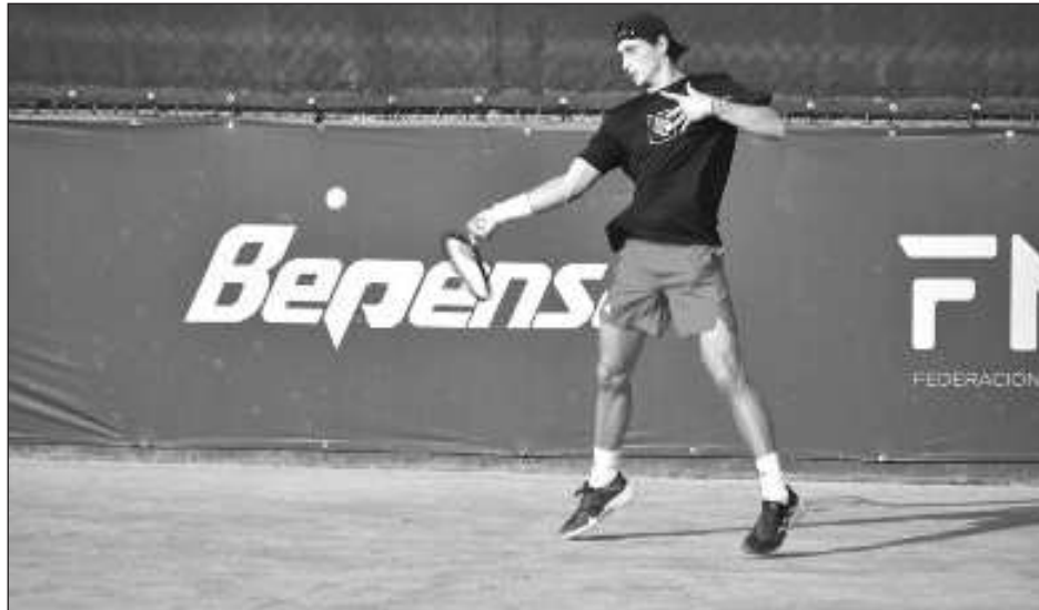
▲ Todo está listo para el comienzo de la 37a Copa Yucatán en el Club Campestre.

Se espera que el debut de Kostovic sea el martes.