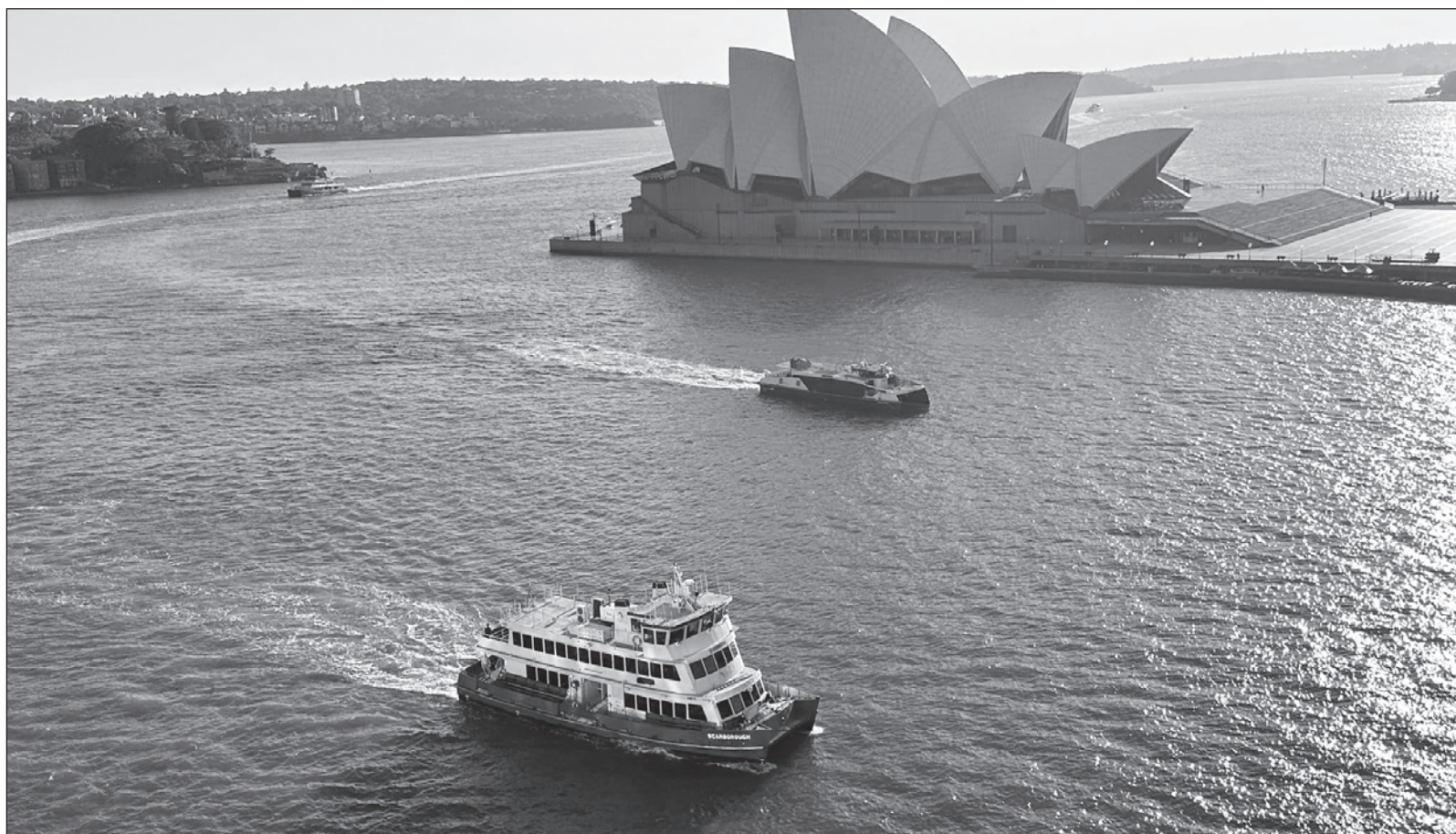
▲ "No es lo mismo un paseo en lancha, que días y noches transitando por una inmensidad sin fin, de olas, nubes, y atardeceres diferentes".