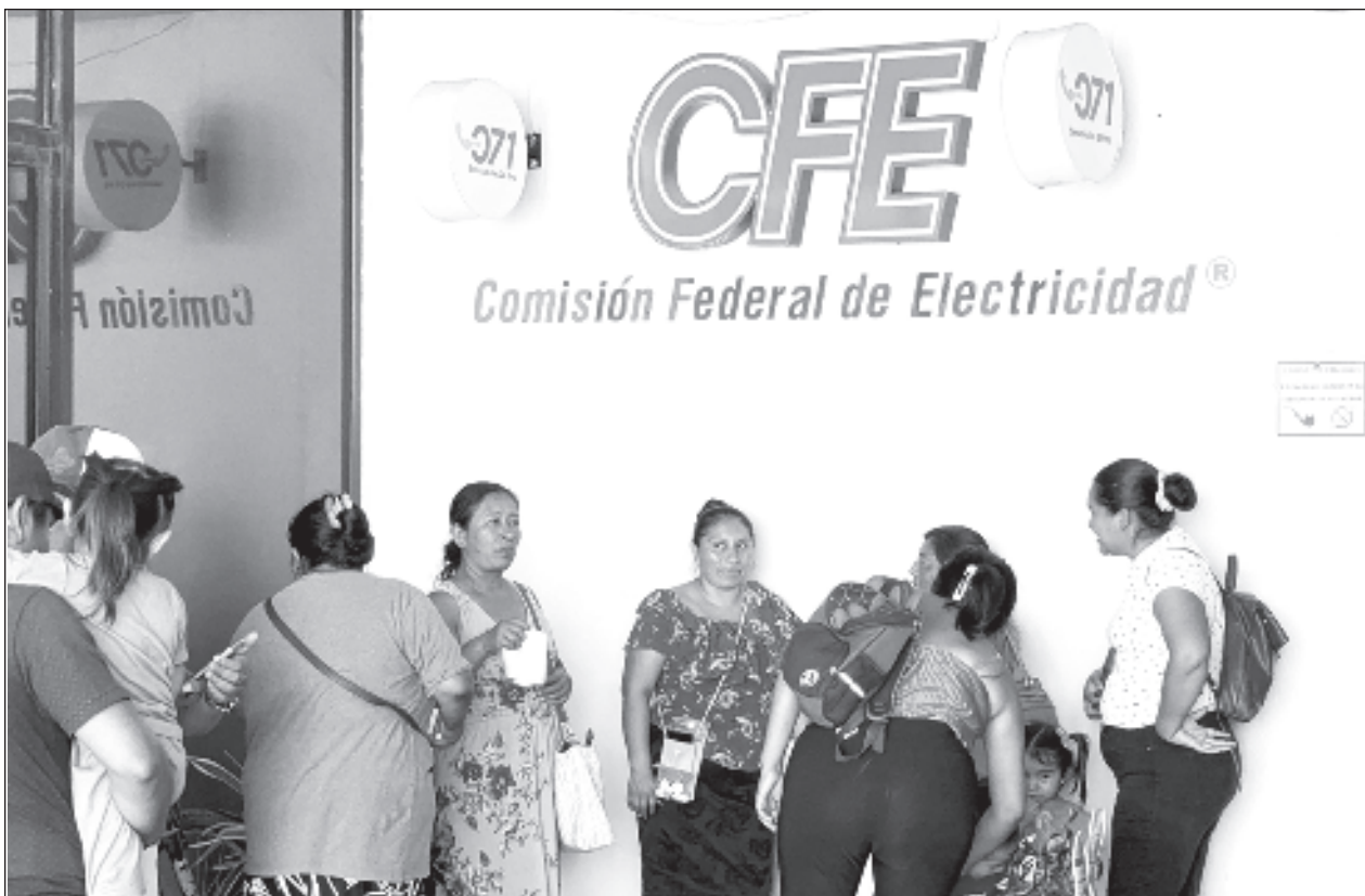
▲ A las y los afectados les llegó un recibo por 180 mil pesos hace seis meses y desde entonces se han ido acumulando los cobros por este monto, razón por la que ya se habían manifestado ante la falta de atención al tema.